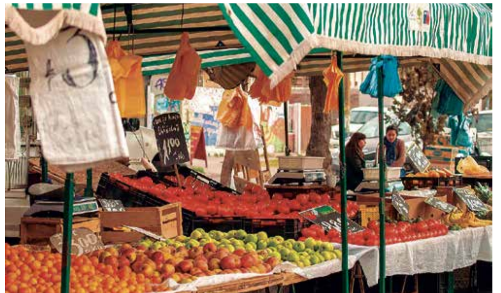
Puesto exterior de un mercado.

El alcalde ha recordado que estos mercados serán únicamente de productos de alimentación y que el del Port de Sagunt se ubicará dentro de la Plaza del Sol, con el objetivo de no ocupar las calles adyacentes "para garantizar la movilidad de las personas y evitar que los vehículos estacionados en estas calles tengan que moverse".