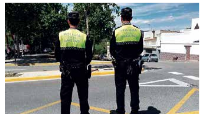
Dos agentes de la Policía Local de Sagunt.

El resultado de estas comparaciones con el consumo anterior y las pasadas Pascuas "ha sido una sorpresa, ya que el consumo en el sector de Almardà ha subido considerablemente, pudiendo estimar que alrededor de 100 viviendas han hecho consumo de agua cuando los días anteriores no tenían", ha destacado el concejal.