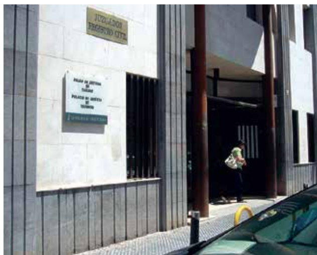
Dependencias de los juzgados de Sagunt.

La publicación en el DOGV del anuncio de exposición pública supone un nuevo paso en la puesta en marcha de los nuevos juzgados que sustituirán a las dependencias ubicadas en el Palacio de Justicia de la Avenida Doctor Palos del casco histórico, y en otras dependencias habilitadas por la