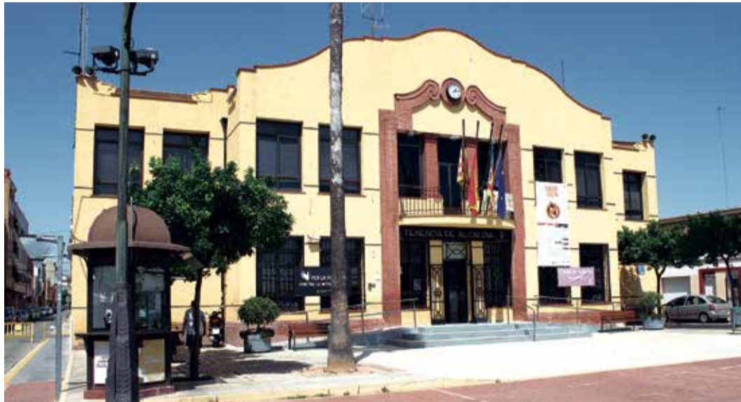
Tenencia de Alcaldía del Port de Sagunt / EPDA

Este plan incluye tres aspectos. Por un lado, ampliar el plan de empleo que ya tenía previsto el consistorio, y por otro, un incremento de los recursos económicos destinados al Departamento de Servicios Sociales: "Ya dijimos desde el principio que Servicios Sociales sería una prioridad para nosotros y que dotaríamos al departamento de