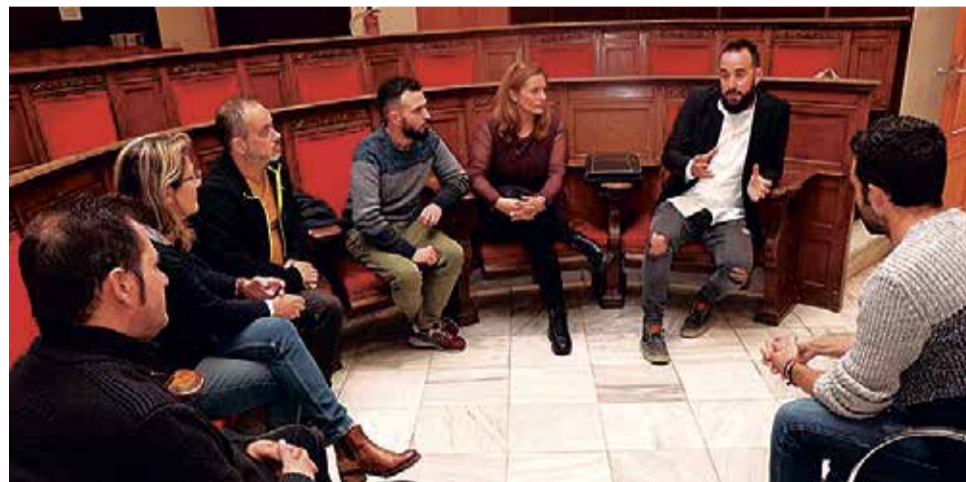
Reunión de los trabajadores con el alcalde de Sagunt tras la borrasca.

Moreno ha señalado que "desde el primer momento nos pusimos al lado de los tra-