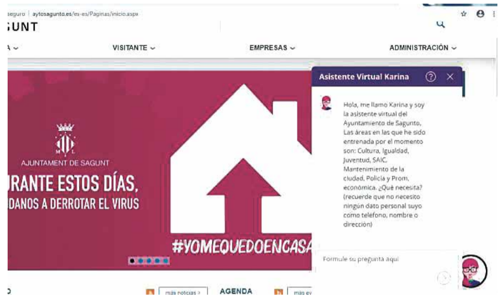
Web del Ayuntamiento de Sagunt con el asistente Karina.

Por el momento se trata de un proyecto piloto de Innovación y Transformación Digital desarrollado por el Servicio Municipal de Informática y Comunicaciones (SMIC) don-