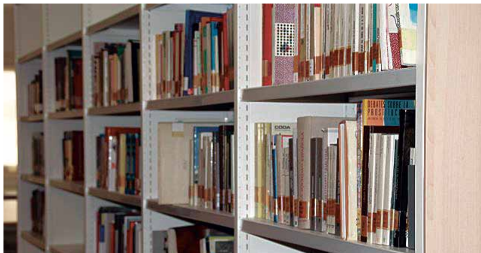
Biblioteca municipal de Canet d'En Berenguer.

El personal del ayuntamiento se encargará de realizar el préstamo y la devolución tomando siempre las