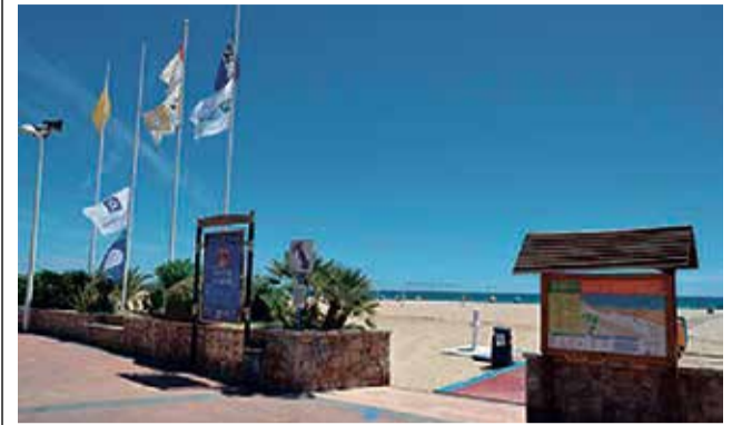
Playa del Port de Sagunt.