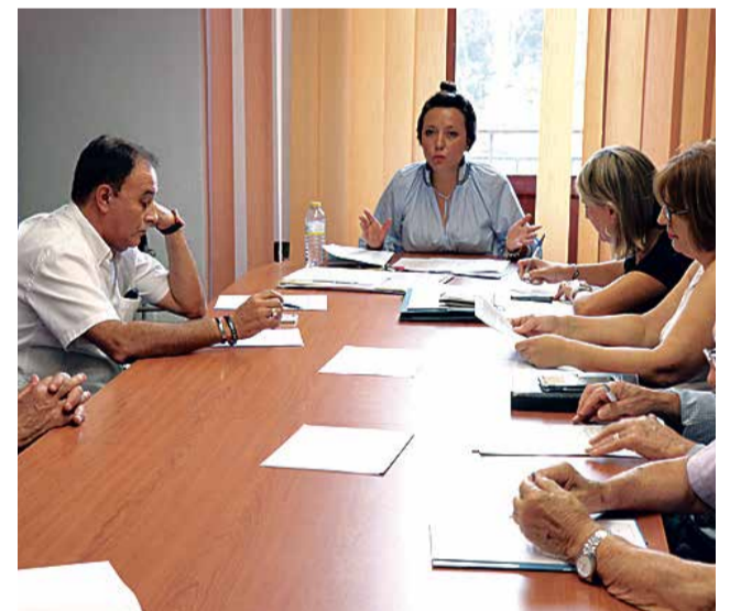
Foto de archivo de un Consejo Asesor de Comercio.