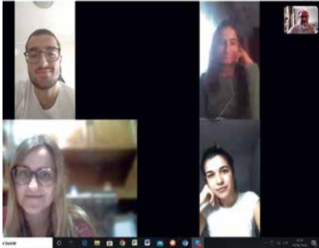
Reunió amb els festers i festeres.