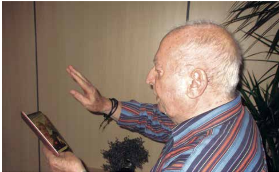
Un residente habla con su familia por videollamada.

Las telecomunicaciones son cada vez más importantes en nuestra sociedad. Una de las razones más importantes es que nos permiten estar a todos conectados, estemos