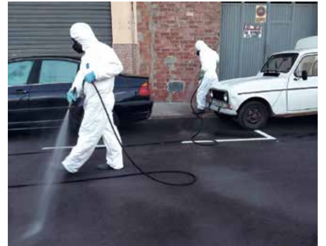
Treballs de desinfecció a Quartell.

L'Ajuntament de Quartell també disposa d'un servei d'ajuda domiciliària. Des que va entrar en vigor l'estat d'alarma, el consistori posà en marxa el servei per cobrir les necessitats bàsiques