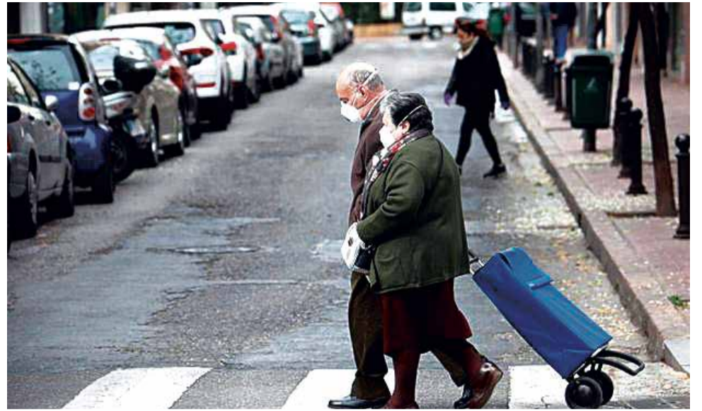
Dos personas mayores vuelven de hacer la compra.

Por ello, el Ayuntamiento de Sagunt puso en marcha un equipo de 15 funciona-