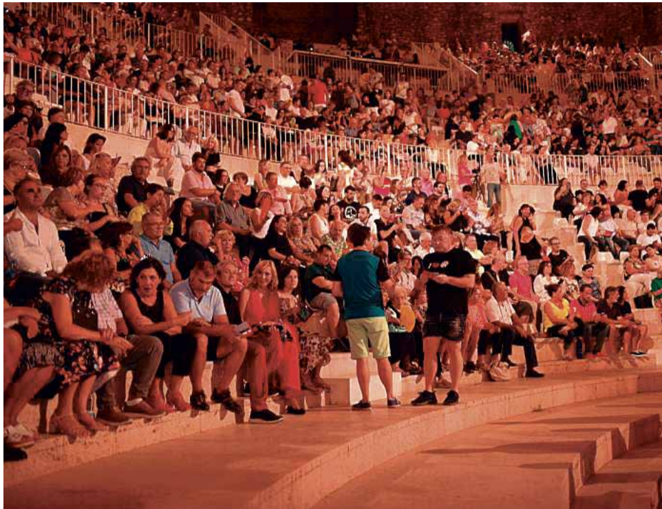
Asistentes al festival Sagunt a Escena de 2019.

"Si las autoridades permiten estos tipos de espectáculos, la idea es celebrar Sagunt a Escena con todas las medidas de seguridad pertinentes, como la separación entre espectadores", ha indicado el primer edil. El festival se celebraría a partir del 4 de agosto.