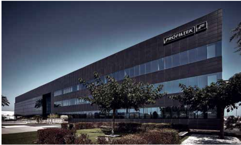
Sede de Profiltek en el polígono industrial de Quartell.

Respecto a las medidas de seguridad implementadas, los trabajadores de PROFILTEK vuelven a sus puestos con un tiempo de margen para que no coincidan los empleados en las