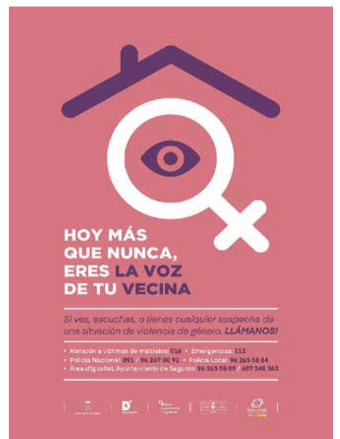
Cartel de la iniciativa.

Moreno explicó que "en la situación de confinamiento, una de las pocas situaciones en las que una mujer que sea víctima de malos tratos puede salir y hablar con alguien es en las farmacias".