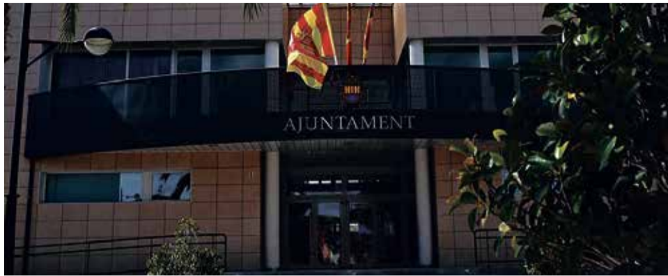
Ayuntamiento de Canet d'En Berenguer. / EPDA

Los servicios sociales “somos servicios esenciales, como así lo hace constar la ley 3/2019, de 18 de febrero, de la Generalitat, de Servicios Sociales Inclusivos de la Comunitat Valenciana, por lo que nuestra sede permanece abierta de lunes a viernes