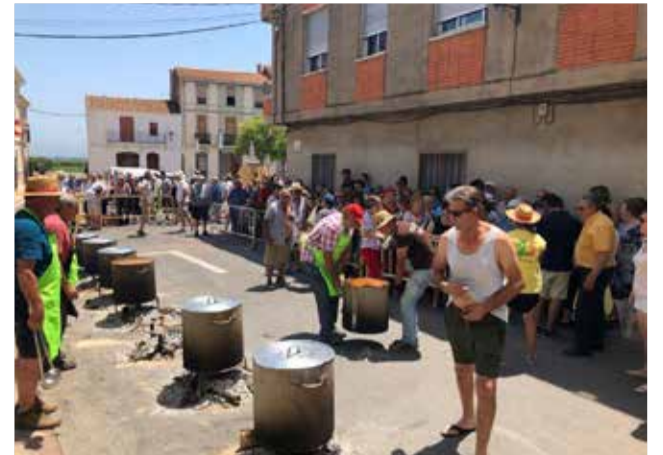
Calderes a Benavites.

sabilitat ens porten a assumir-ho com a necessari pel bé de tots". La decisió es va prendre el mateix dia que el Diari Oficial de la Generalitat Valenciana "reconeixia a les nostres Festes Patronals com a festa d'interés turístic local, un reconeixement merescut i un motiu més perquè agarrem en més gana que mai, la celebració de les Festes a l'any 2021". Des de l'Ajuntament de Bena-