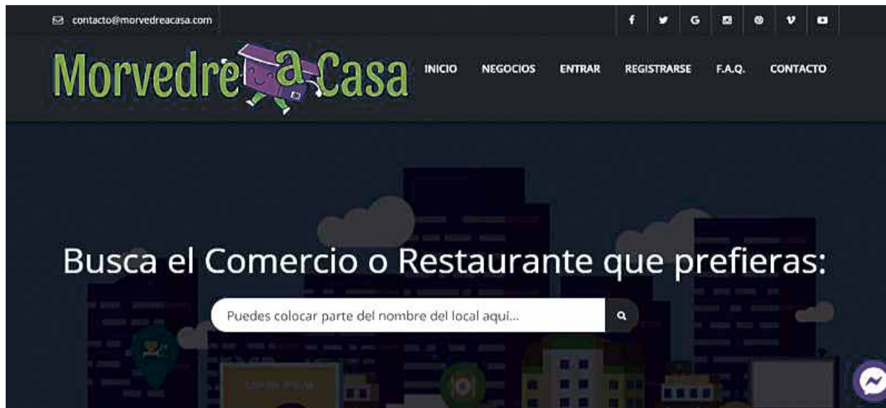
Plafatorma ‘Morvedre a casa’.

En el caso de las personas que quieran realizar sus compras, podrán acceder a la web y consultar el listado de comercios