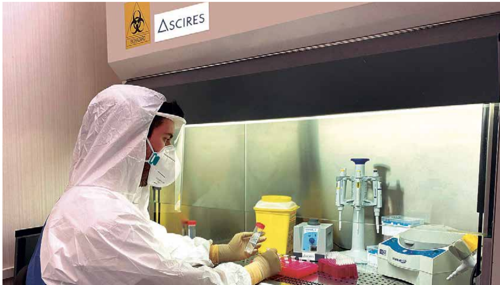
Laboratorio de bioseguridad nivel 2 de Ascires para Covid-19.

ESTA PRUEBA HA SIDO DESARROLLADA POR LOS LABORATORIOS ASCIRES, CON LA COLABORACIÓN DEL HOSPITAL CLÍNICO