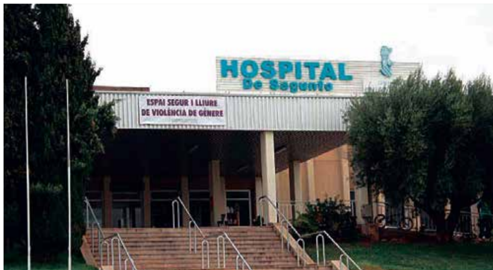
Hospital de Sagunt.

El Departamento de Sagunt no atiende únicamente a pacientes del Camp de Morvedre, sino también de toda la comarca del Alto Palancia, El Puig y Puçol de l'Horta Nord, así co-