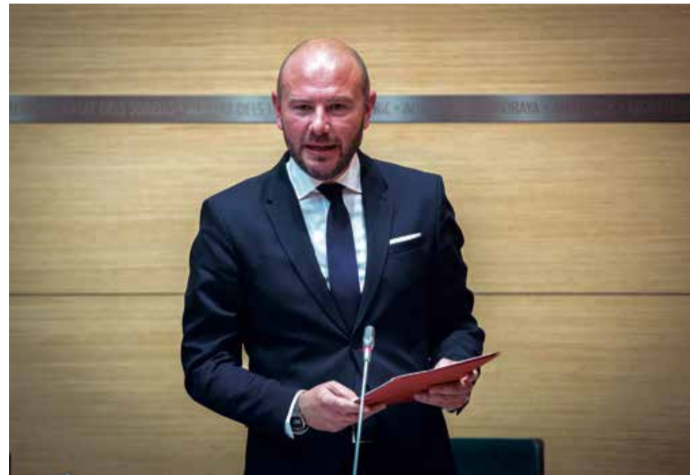
El presidente de la Diputació, Toni Gaspar.

En palabras del presidente de la Diputació de Valèn-