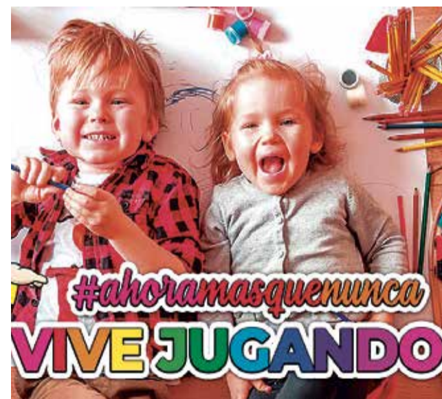
Consulta el catálogo en la web de Todojuguete / EPDA

El catálogo online de Todojuguete puede consultarse en la web www.todojuguete.es e incluye juegos de mesa y puzzles para los más pequeños, pero también una amplia oferta para los que no lo son tanto.