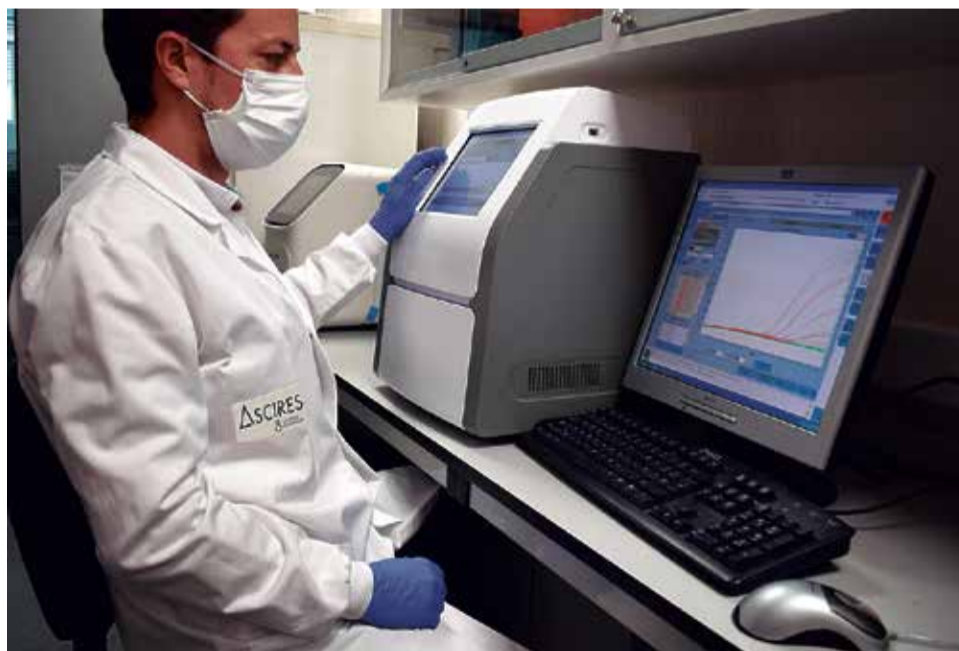
La bioinformática, clave para procesar los datos de la Covid-19.

La prueba ha sido desarrollada en apenas 3 semanas por un equipo de expertos de Ascires Sistemas Genómicos,