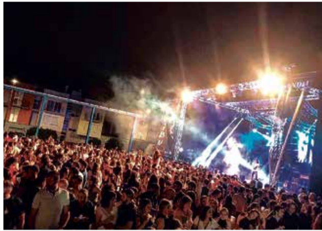
Una actuació durant les passades festes.

s'ha pres després de que l'Ajuntament mantinguera una na videoconferència en la Comissió de Festes, els Quintos i representants de les Pen-