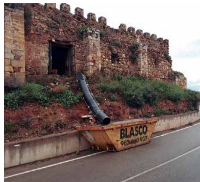
Trabajos en el castillo de Petrés.

La concejala de Cultura de Petrés ha querido agradecer a la escritora "su predisposición y su ilusión para llevar a cabo el acto que teníamos previsto" al tiempo que ha confiado en que se pueda realizar "muy pronto".