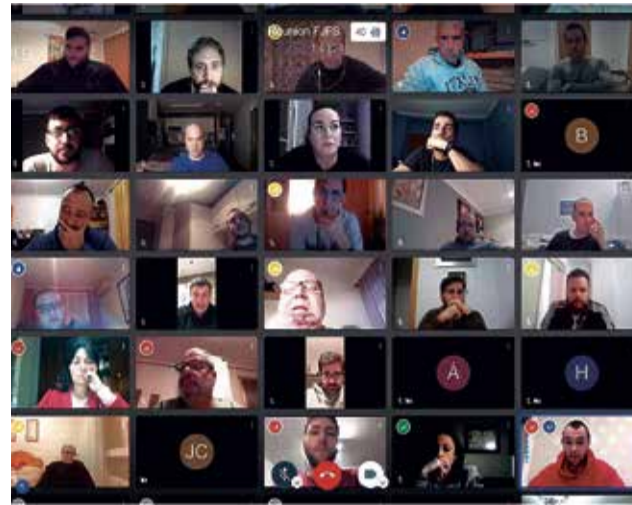
Reunión telemática de FJFS.

La propuesta busca que el periodo entre la elección y la Exaltación no sea tan dilatado como en la actualidad, lo que provoca la convivencia, durante 4 meses, de las falleras mayores entrantes y salientes.