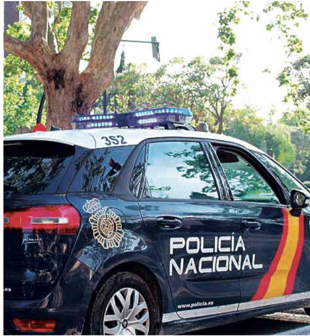
Una patrulla de la Policía Local.

Los policías averiguaron que una de ellas era la propietaria del domicilio y la otra era una amiga a la que había acogido en su casa al inicio del estado de alarma ya que no tenía vivienda y esperaba una ayuda. Debido a que la situación de estado de alarma