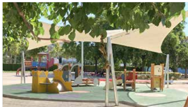
Nuevas dotaciones infantiles en Alaquàs.