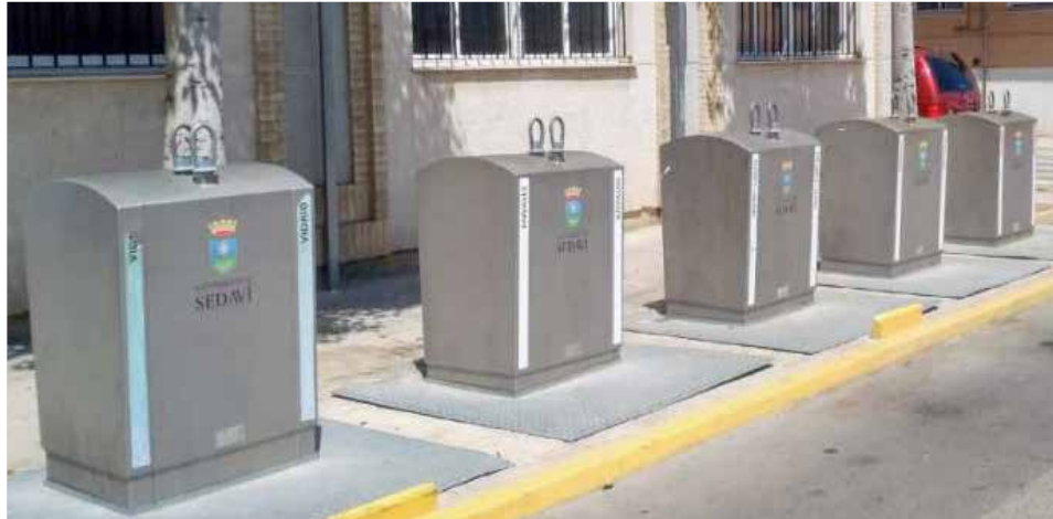
Contenedores en Sedaví.

A fin de cumplir los objetivos de la presente legislación, las administraciones locales tienen que adoptar las acciones necesarias para garantizar, como mínimo, hasta un 34% del peso global de los residuos urbanos generados en la localidad para la reutilización y el reciclaje de residuos domésticos antes de 2021.