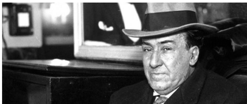
Antonio Machado dijo: "¿Dijiste media verdad?, dirán que mientes dos veces si dices la otra mitad".

has de aguantar. Sin embargo, estoy convencido de que trabajar lo mejor posible por los vecinos, merece cualquier esfuerzo. Seguiremos haciéndolo a pesar de los obstáculos. Orgulloso de la #PoliticaÚtil de Cs.