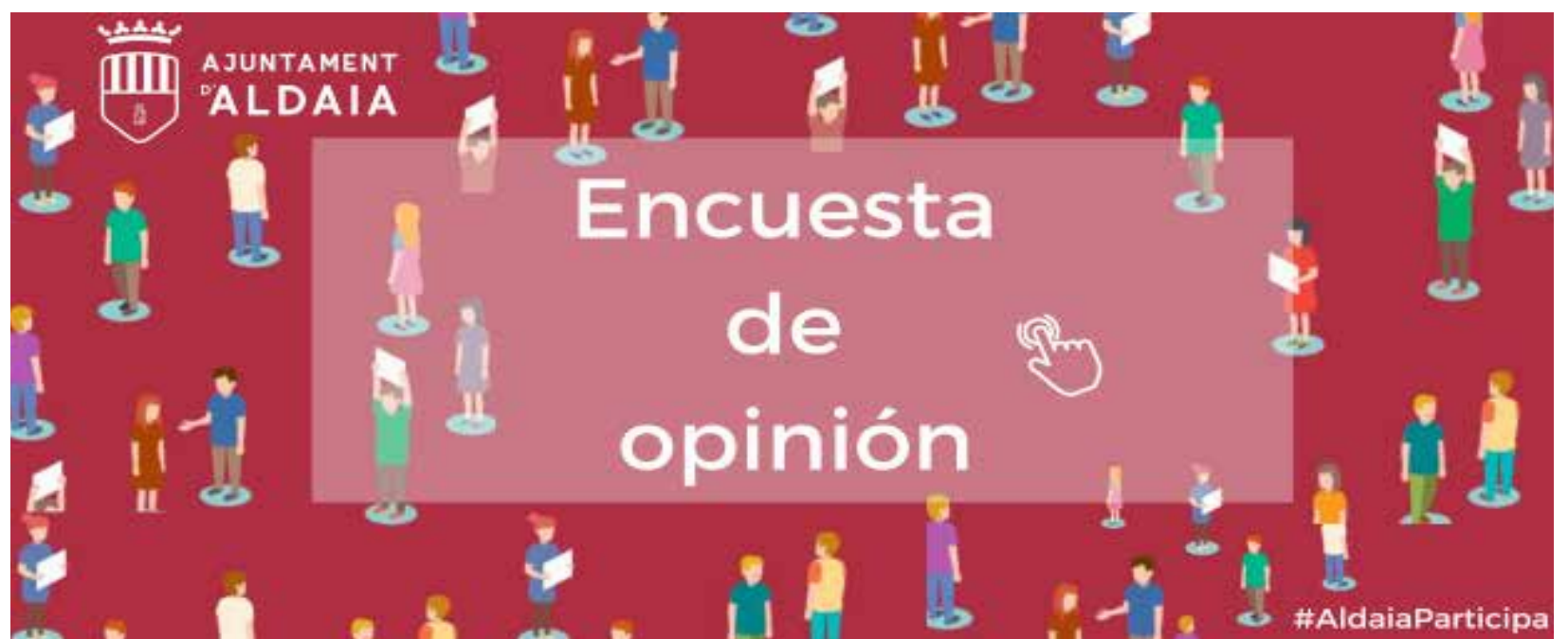
Encuesta programada por el Ayuntamiento.