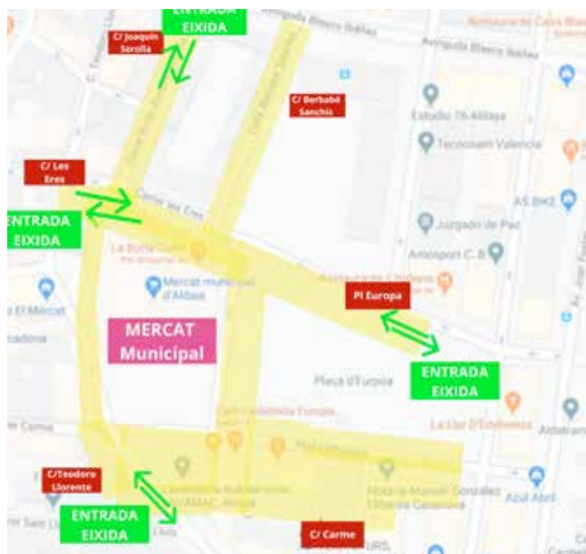
Mapa donde se ubica el ampliado mercado ambulante.

De esta manera, al espacio ya asignado tradicionalmente para el mercado de los miércoles se amplía la extensión en las calles Teodoro Llorente y Las Eras, y se suma el permiso de ocupación de las paradas alrededor de la plaza Europa, para garantizar la distancia entre comerciantes en todas las calles ocupadas. Unas calles que además limitarán las entradas y salidas a