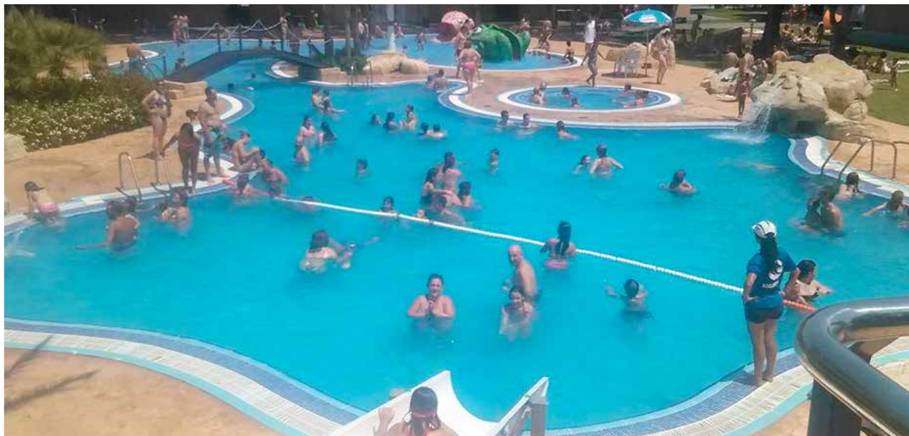
La piscina de Aldaia.

La piscina lúdica de Aldaia inaugura una nueva temporada estival que vendrá marcada por las restricciones a causa de la COVID-19. En este sentido, una de las principales novedades del 2020 en este recinto municipal será la limitación del aforo como medida de prevención ante el Coronavirus. Así, las entradas solo se podrán adquirir con cita previa a través del portal web municipal, con el objetivo de evitar aglomeraciones en