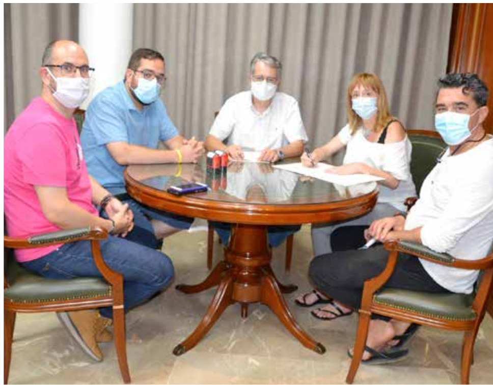
Un momento de la reunión.

Cabe recordar que esta localidad fue una de las primeras en anunciar la supresión de la tasa de las terrazas a bares y restaurantes durante este 2020, tras la entrada en la Fase 1, y que permitía a estos establecimientos trabajar con el 50% de su aforo, en el exterior de sus locales. Ahora, con la entrada en la nueva normalidad ya se encuentran a pleno rendimiento y con horarios de cierre más flexibles,