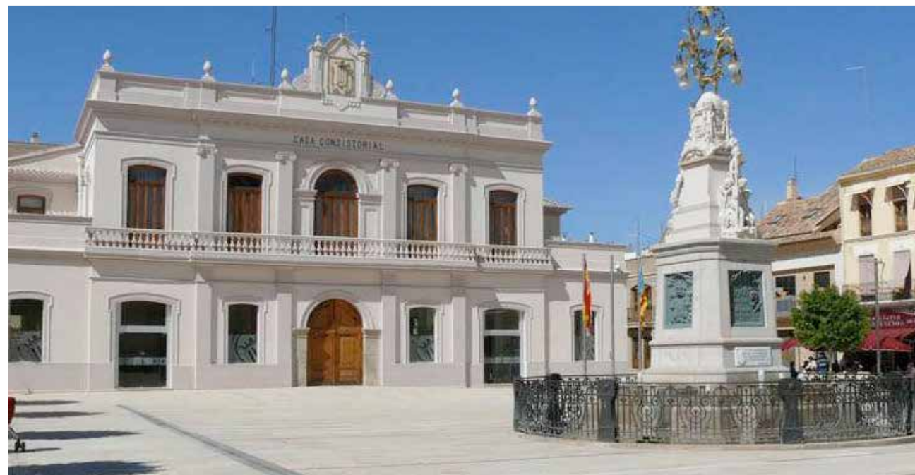
Fachada de l'Ajuntament.

L'Ajuntament d'Alfajar ha cerrado el ejercicio 2019 con un remanente de tesorería positivo de 138.803,19 euros. Por el