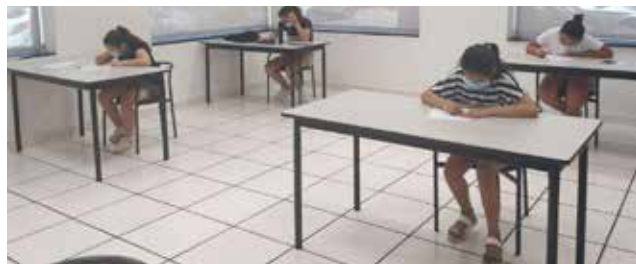
Alumnos durante el refuerzo.

Las sesiones estarán centralizadas en el aula multiusos del