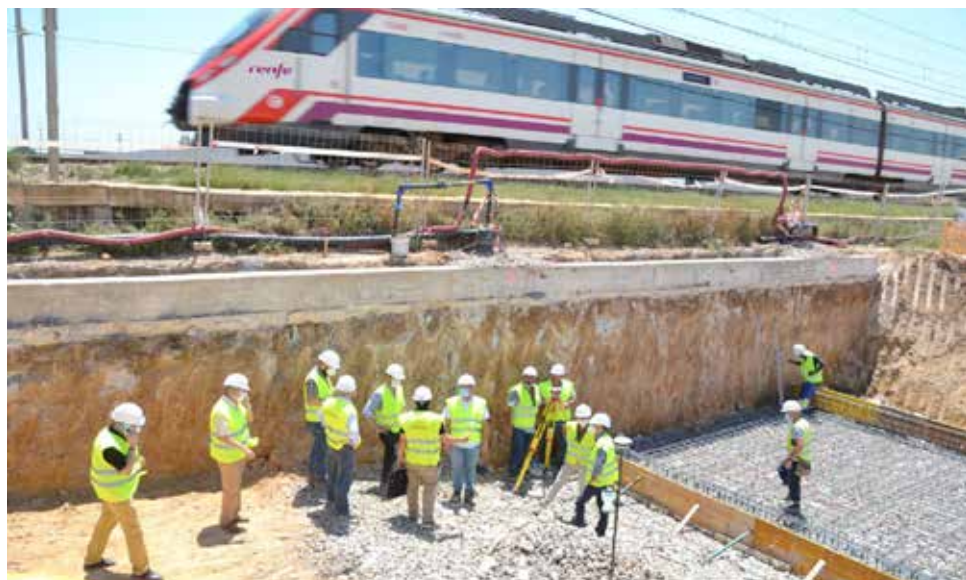
Visita a las obras de la estación de tren.

Sobre el terreno, el primer edil manifestó su satisfacción por impulsar un proyecto que supondrá «un revulsivo social, demográfico y económico histórico para el muni-