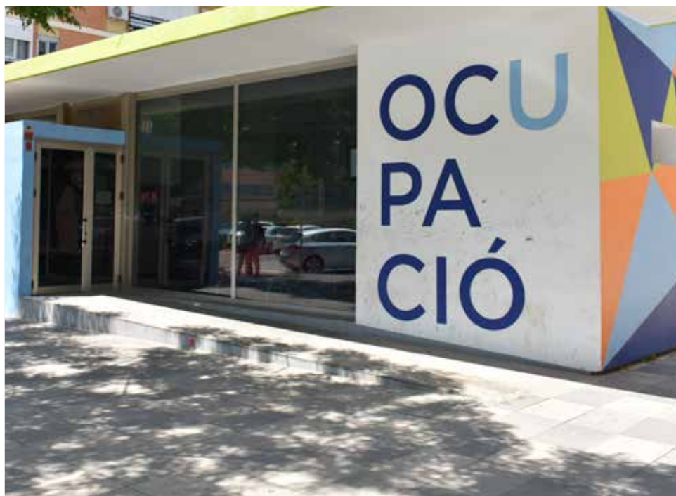
Departamento de Economía y Empleo del Ayuntamiento.

Los portavoces de los cuatro grupos municipales han coincidido en agradecer a todos los grupos su trabajo en el desarrollo de este plan. Indican que la intención en todo mo-