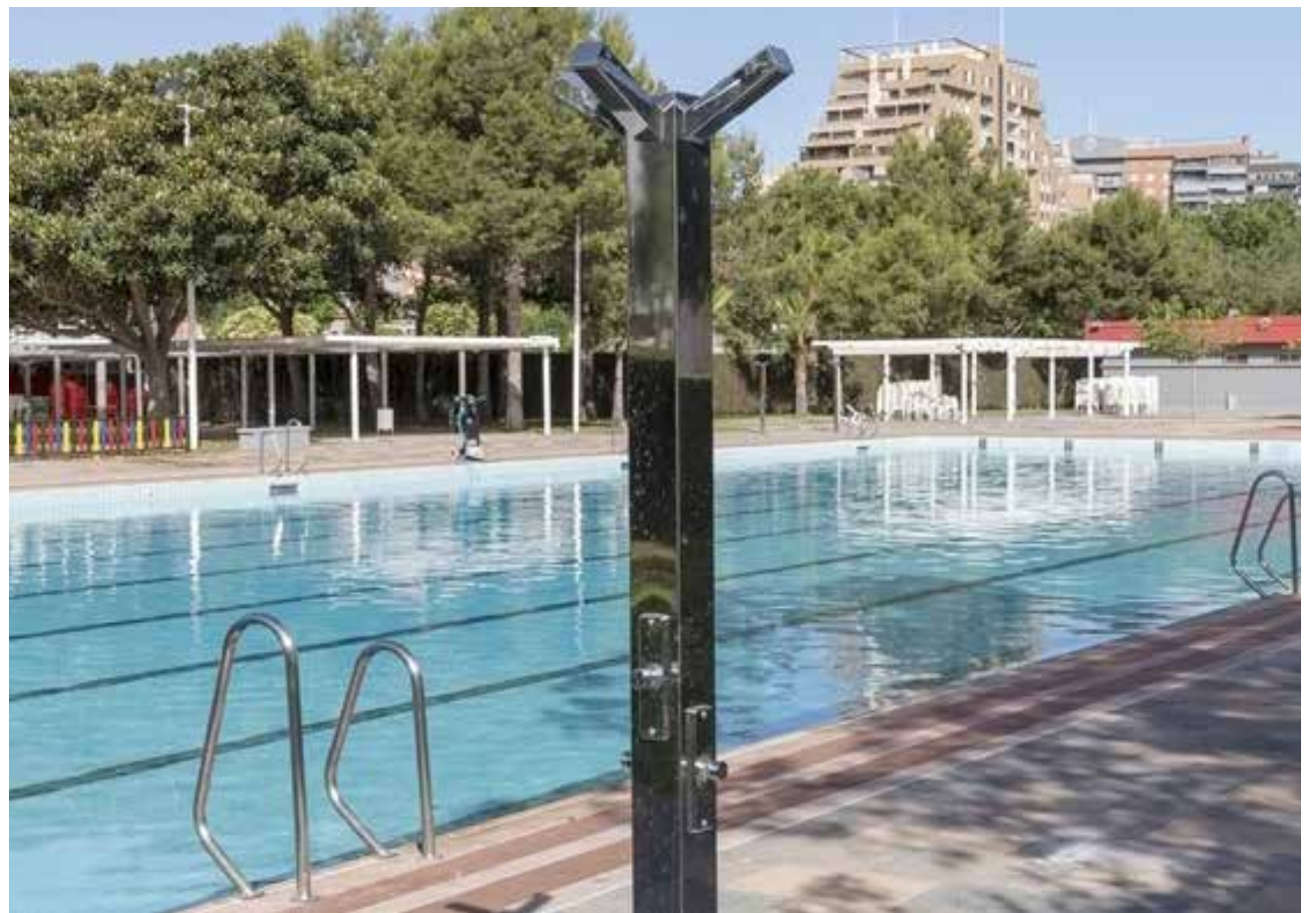
Piscina de Torrent arriba y la de Mislata, abajo.

un aforo máximo de 200 personas. Para poder acudir será necesario concertar cita previa a través de la plataforma digital https://esportspicassent.depsite.net/ o telefónicamente en el 96 123 14 23.