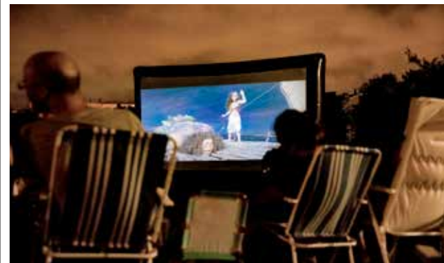
Cine de verano en una edición del 2019.