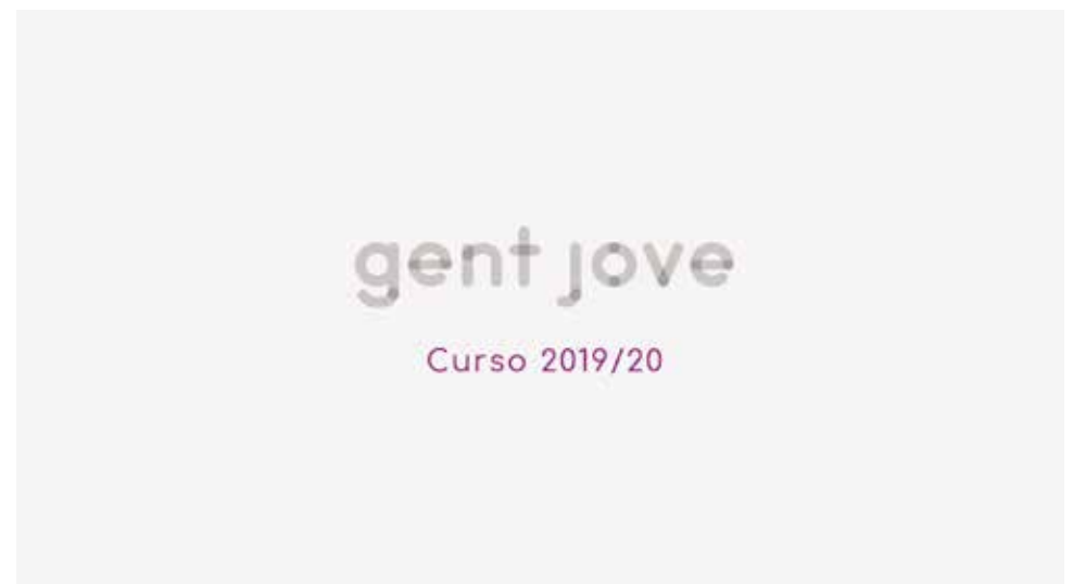
Un curs atípic el del 2019-2020.