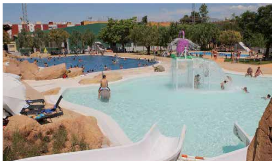
Piscinas de Picassent, arriba y de Quart de Poblet, abajo.