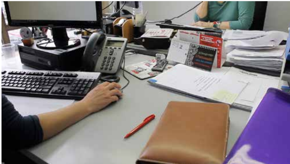
Dos personas trabajando.

Estas subvenciones se dirigen a aquellas personas autónomas que hayan suspendido la activi-