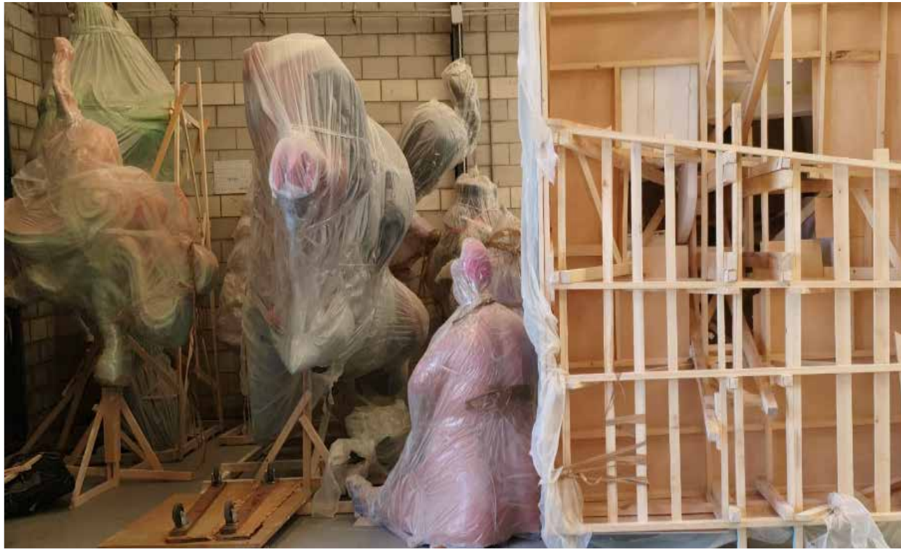
Monumentos falleros almacenados en la nave.