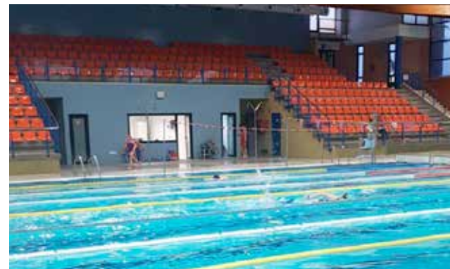
Piscina cubierta de Xirivella.