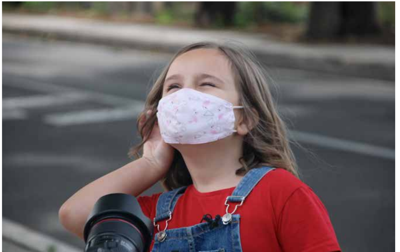
Ni una mascareta amaga el somriure d'una xiqueta d'Aldaia.

Així, amb este vídeo, s'intenta posar en valor el treball de tant persones que no han parat durant esta quarantena per tal de garantir el benestar de tots nosaltres, posant fins i tot en risc la seua pròpia salut, en ocasions.