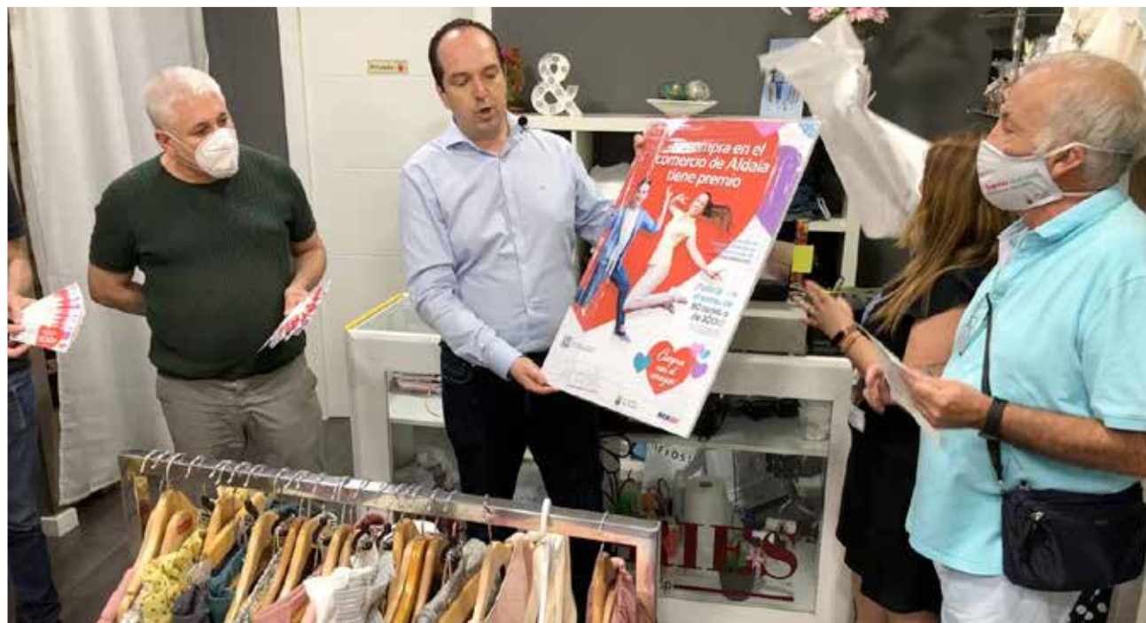
El alcalde de Aldaia durante la presentación de la campaña.

Por su parte, desde MRW animan a los comerciantes "a sumarse a esta campaña", ya que "es una oportunidad muy eficaz de dar a conocer sus productosW, y a la ciudadanía "a registrarse en la web www.compraldaia.com el nuevo portal marketplace donde podrán disfrutar de todas las novedades y oportunidades que les brindan los comercios de Aldaia, además de