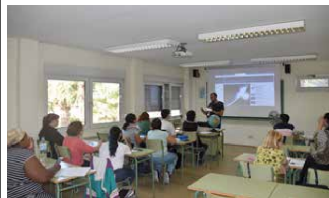
Imagen de la EPA. / EPDA