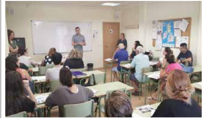
Actividades para adultos. / EPDA