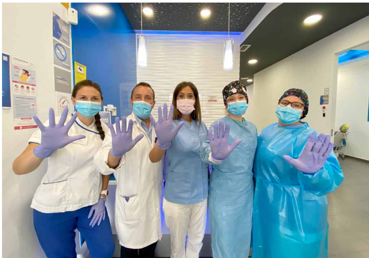
El equipo de Vitaldent Catarroja.

Son muchos los profesionales que dan vida a Vitaldent Catarroja, desde la recepcionista hasta el director de la clínica que se encargan de recibir y asesorar en el proceso administrativo al paciente, hasta los odontólogos, implantólogos e higienistas, encargados de velar por la salud de la sonrisa de los pacientes., han explicado desde Vitaldent Catarroja. a El Periódico de Aquí.