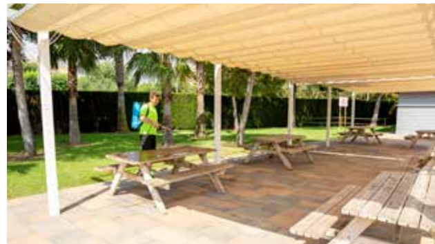
Trabajos de desinfección en la piscina.

Además, el mismo protocolo establece una serie de normas específicas por protección sanitaria que responden a las mismas determinadas en esta nueva