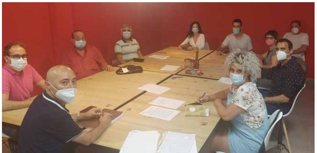
Un momento de la reunión.

En cuanto a las medidas de promoción económica e impulso comercial y empresarial, entre las que se encuentra la ayuda a autónomos, se han movilizado 904.600 euros. Este paquete incluye también actuaciones de promoción del empleo y de asesoramiento específico a personas jóvenes y emprendedoras del municipio, además de un plan de estímulo comercial y un plan de recuperación económica, concluyen.