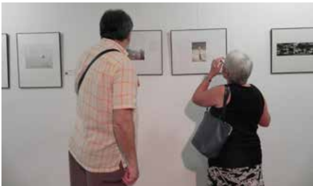
Momento de la inauguración.