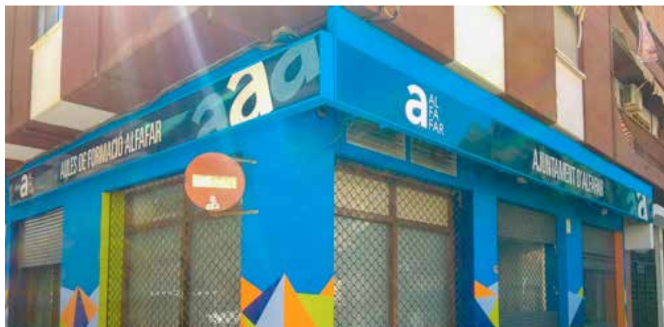
Bielsa durante uno de los encuentros.

L'Ajuntament d'Alfajar comenzó la actividad en las aulas de formación municipales tras obtener la homologación