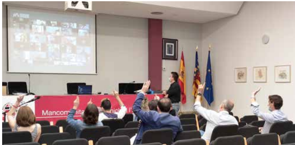
Último pleno de la Mancomunitat de l'Horta Sud.

El segundo bloque temático de la declaración resume algunas medidas enfocadas al fomento de la solidaridad entre corporaciones locales. En ese sentido, la Mancomunitat se compromete a crear la mesa de diálogo "Units per l'Horta Sud" que pretende