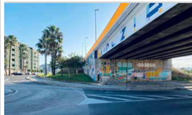
Carretera CV-50.