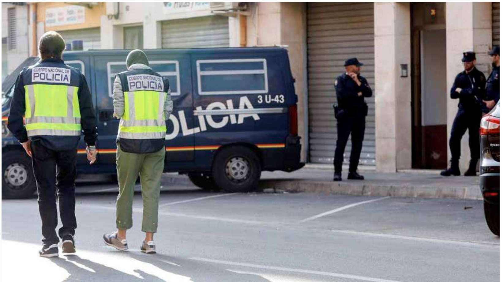
Imatge d'arxiu d'una operació policial.

Des que es va iniciar el conflicte a Síria en 2011, han viatjat a la zona en conflicte una gran quantitat de jihadistes, no sols combatents homes sinó també dones. Aquests grups terroristes han focalitzat part de la seua labor de captació, principalment a través de les xarxes socials, per a atraure a dones amb la finalitat de casar-se amb un muhàhidin o per a escometre la jihad violenta, i fins i tot arribar a integrar-se en les denominades "Brigades de Dones". A més, la Policia Nacional ha arrestat a huit dones des de 2014.