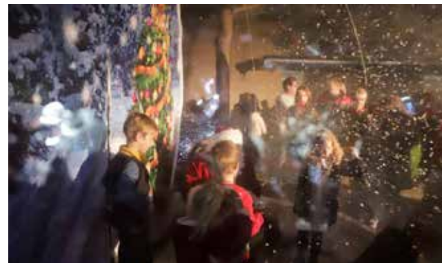
Acte nadal