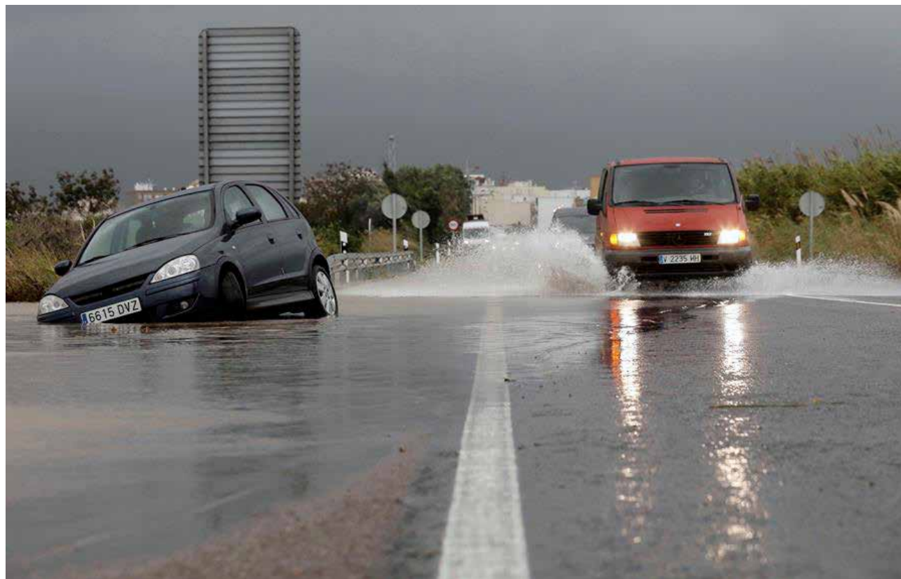
Imatge carretera N-332 unió Sueca i Cullera

D'una banda, segons va informar la Conselleria d'Educació, nou municipis de les comarques de la Ribera Alta i Baixa, van haver de suspendre totalment la seua activitat educativa en Infantil, Primària, Educació Especial, ESO, Batxillerat i FP: Alzira, on la suspensió afecta a 7.580 alumnes, Algemesí (5.238 alumnes), Carlet (2.842), Almussafes (1.580), Benifaió