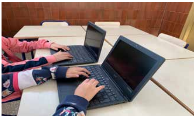
Ordinadors de l'alumnat.