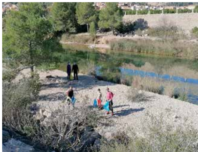
Campanya “Mans al Riu”

Unes vint persones van participar esta setmana en la campanya “Mans al Riu” impulsada per l'Ajuntament de Sumacàrcer en col·laboració amb la Fundació Limne. La jornada va tenir com a objectiu realitzar tasques de neteja a la zona del riu Xúquer que havia tingut una alta massificació de gent durant el passat estiu i en què havien quedat alguns desfets ocasionats pel pas humà. La jornada va ser intensa però molt vàlida ja que, gràcies a la implicació del grup humà que