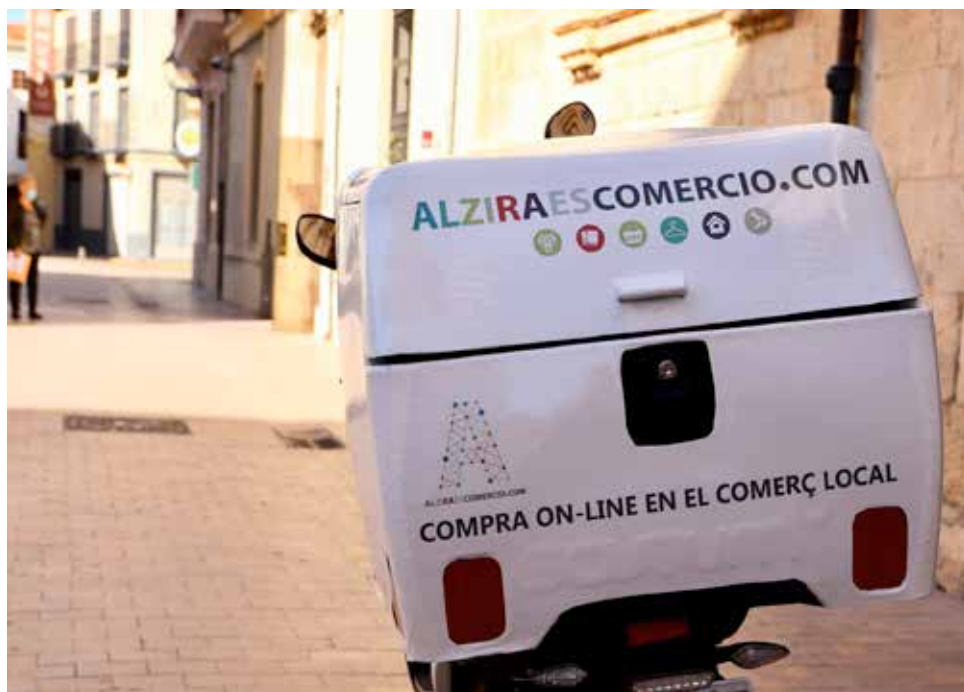
Motocicleta de reparto.

Los hábitos de consumo han cambiado, las formas de comprar han cambiado y los canales de venta también se han transformado, pero el pequeño comercio continúa siendo esencial para las economías locales y para mantener la vida en nuestras ciudades. Al mismo tiempo, el consumidor busca también ser un consumidor responsable y comprometido con su entorno, contribuir a la