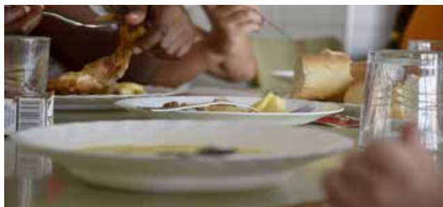
Ajudes alimentació infantil / AJUNTAMENT CARLET