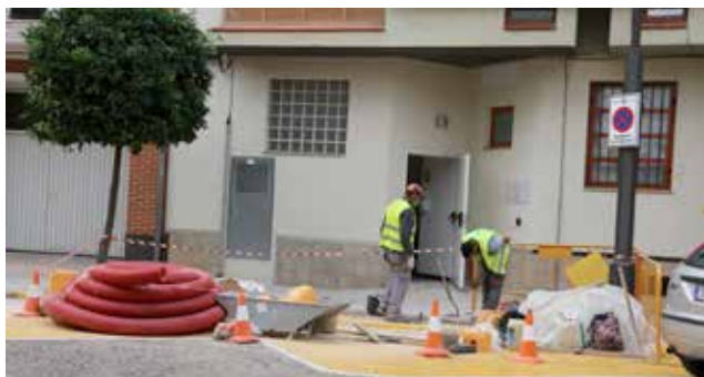
Obres estació recàrrega.

Cadascun dels punts, que serà de càrrega semi ràpida i totalment gratuïta per a