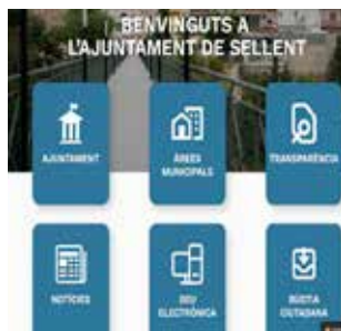
Pàgina web. / EPDA