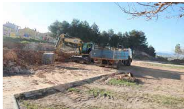
Obres al municipi.