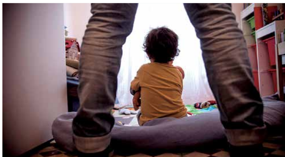
Un niño sentado en el suelo de una de las estancias de su domicilio.

Lo mismo afirma la psicóloga infantil Eugenia Infanzón, que trabaja el maltrato psicológico e infantil en su clínica de València, que afirma una posible repetición de los modelos relacionales en los hijos. Así, defiende que