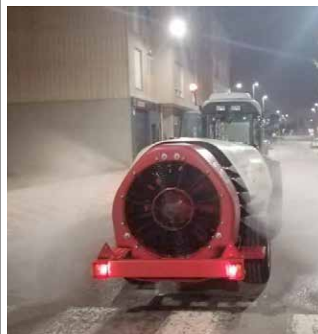
Turbo / AJUNTAMENT ALMUSSAFES