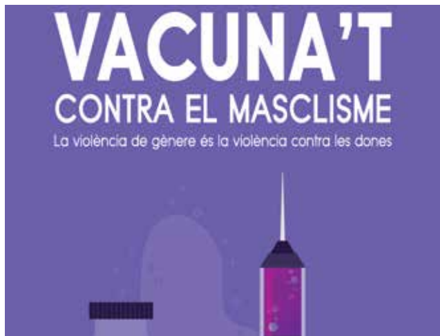
Cartell campanya 25N.

El virus de la violència masclista es combat amb una vacuna d'igualtat. «Vacuna't contra la violència masclista» és el lema escollit enguany per l'Ajuntament de Cullera per a conscienciar la societat de l'existència d'un tipus específic de violència cap a les dones pel simple fet de ser-ho. «El discurs retrògrad del neomasclisme que tracta d'amagar esta realitat que sofriuen milions de dones al món i també a casa nostra es combat amb una bona dosi d'educació, feminisme i igualtat», ha assenyalat