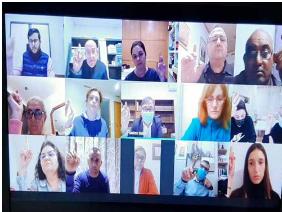
Captura del moment ple del municipi.

Així mateix, podran gaudir d'una bonificació del 15% de l'IBI les indústries amb una instal·lació solar que cobreixca un mínim de 10kw i les empreses de comerç i serveis, si la instal·lació cobreix un mínim de 5kw. Totes estes bonificacions es concediran per un període de 5 anys i no seran aplicables quan la instal·lació de sistemes d'aprofitament tèrmic o elèctric de l'energia solar siga obligatòria en compliment