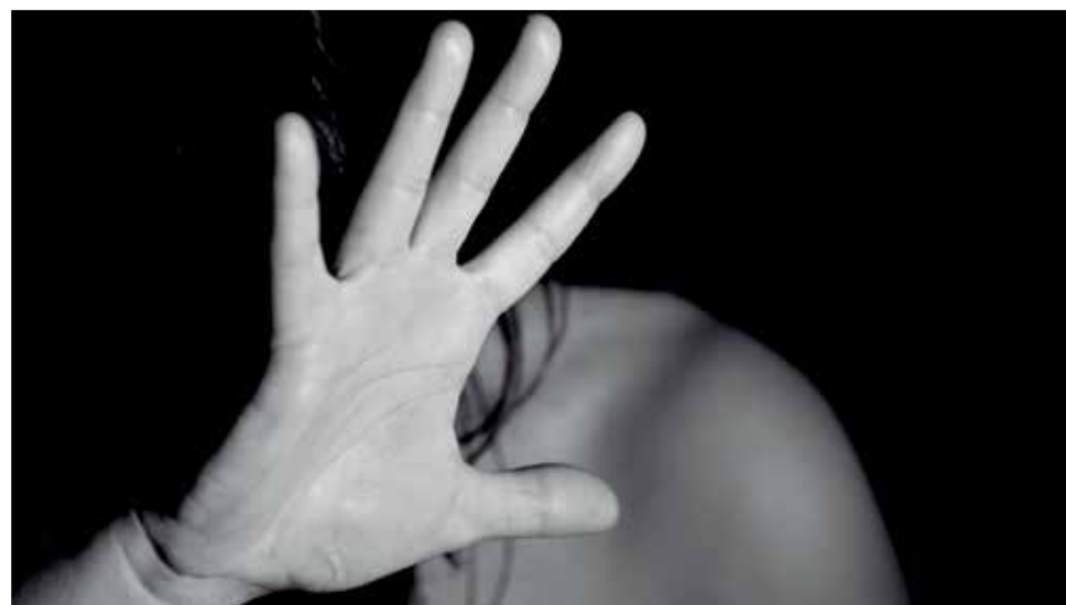
Una de las imágenes de Stop a las violencias machistas.

co se va reduciendo, hasta ser inexistente. “Muchas veces solo vienen a verme cuando ya ha llegado ese punto, y se dan cuenta porque le han roto los dientes o las costillas”, reconoce.