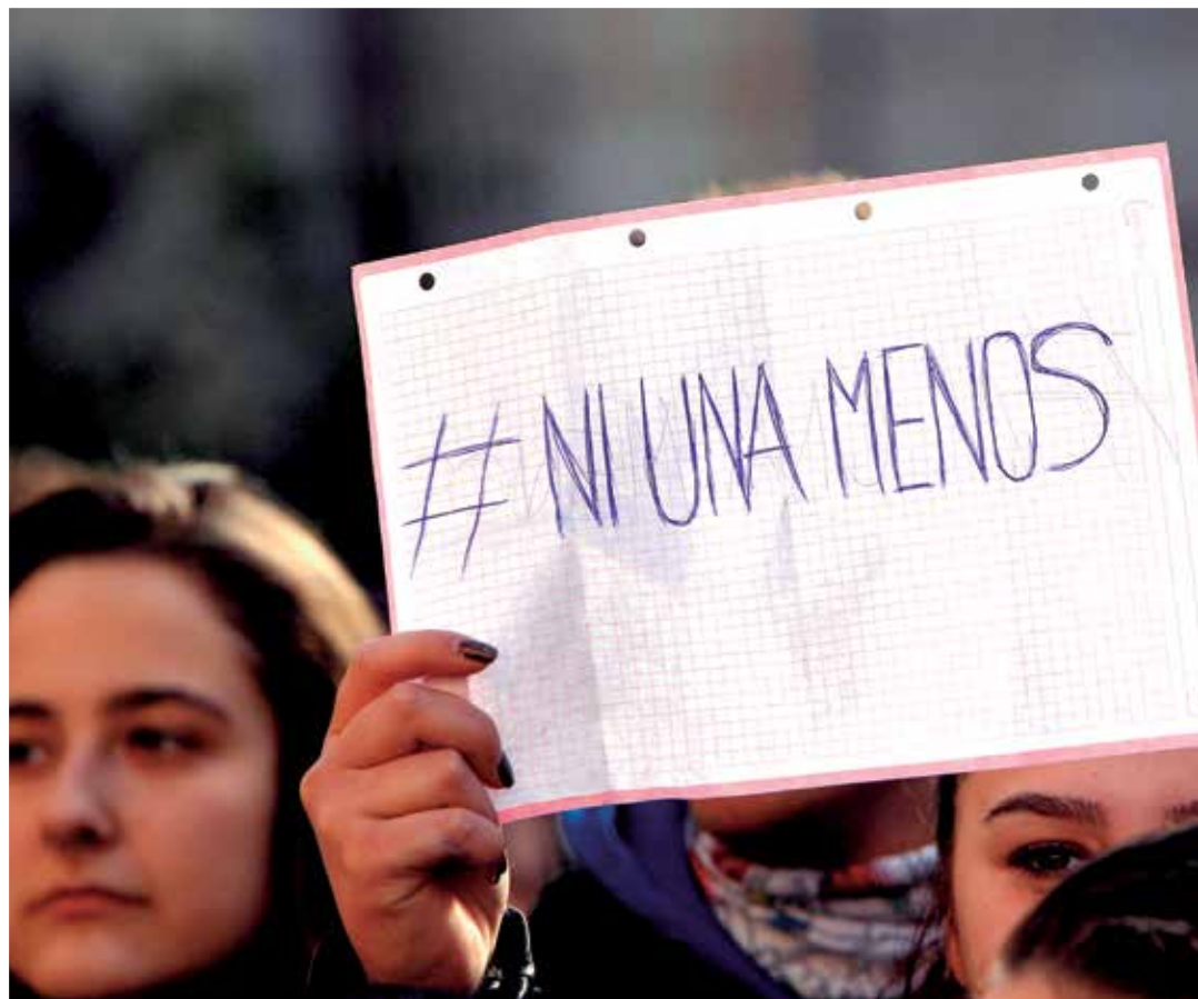
Varias jóvenes en una concentración en protesta por las agresiones sexuales.

Lo que sucede tras este estadio psicológico es lo que la doctora denomina “luna de miel”, ya que el maltratador acude a ella lamentando lo sucedido, y ante dicho arrepentimiento la mujer acaba perdonando. “El problema es que esta luna de miel se va reduciendo con el tiempo, y al final solo hay maltrato”, sentencia Vague. A partir de ese momento, la línea que separa el maltrato verbal del fisi-