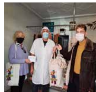
Comerç local.