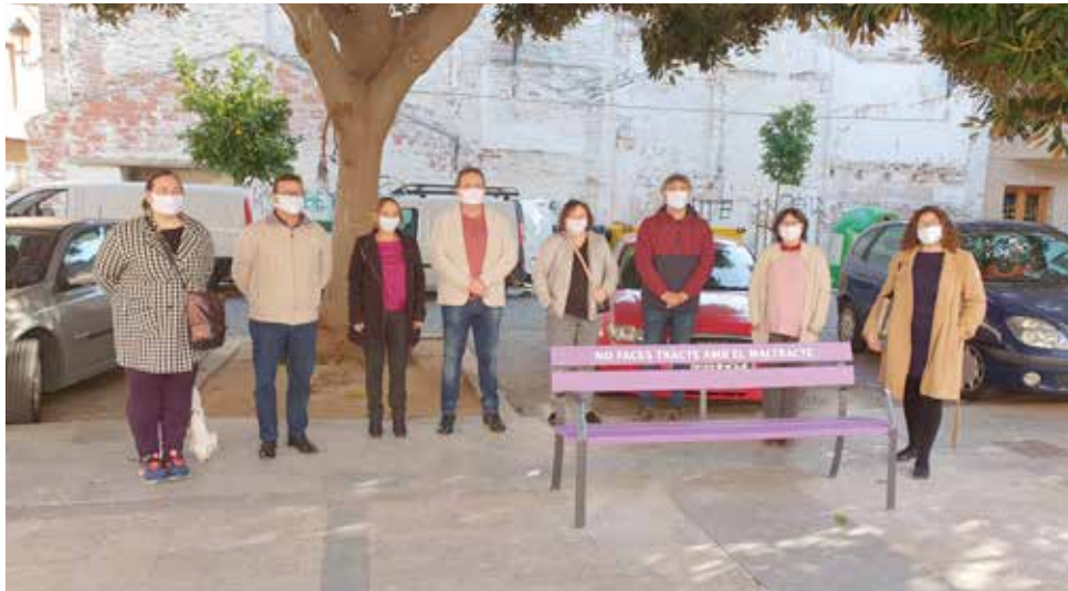
Equip del govern municipal.

Des de l'associació Pense Pensions Dignes s'han sumat també a este acte simbòlic, i la