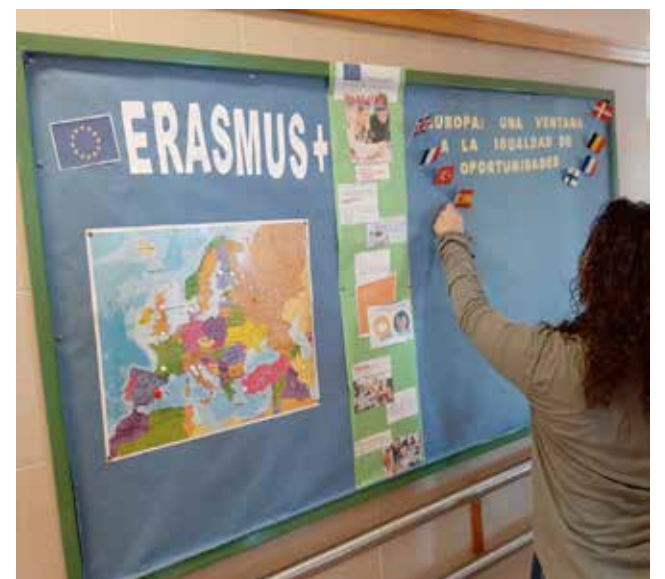
CEE Miquel Burguera

"Per tant avancem cap a la internacionalització educativa del CEE Miquel Burguera, ja que "La discapacitat no és limitant, la falta d'oportunitats si que és."