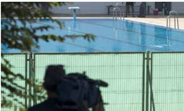
Foto arxiu piscina.