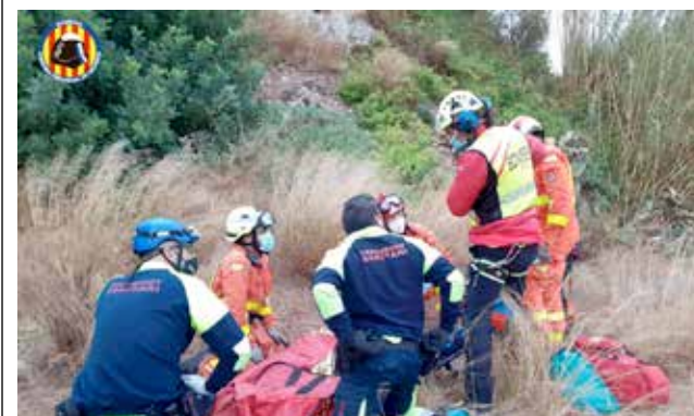
Moment rescat bombers.