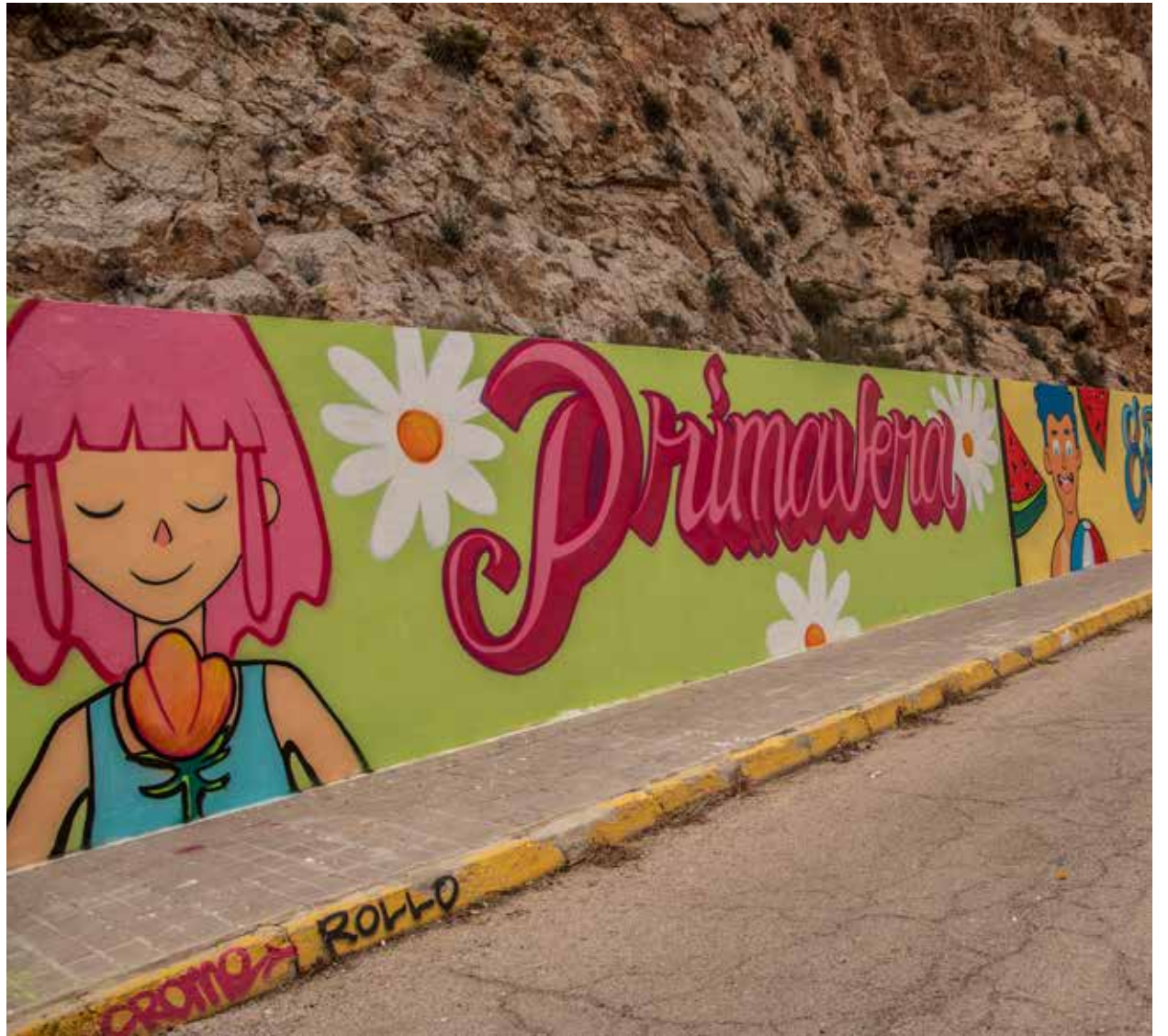
Carrer de Cullera / AJUNTAMENT CULLERA

Tal com detalla l'artista Cebolla «és un mural que repre-