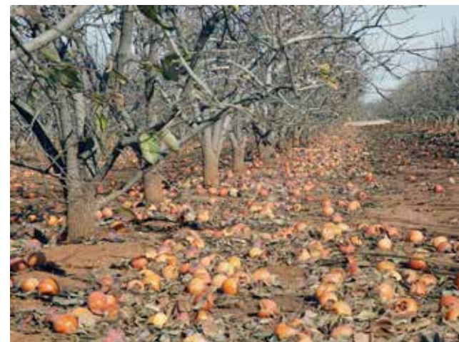
Una plantació de caquis amb el fruit en el sòl.

Els fets van ocórrer el passat 6 d'octubre, quan un home va presentar una denúncia a Alzira en la qual assegurava que li havien robat 40.000 quilos de caquis entre els dies 1 i 6 d'octubre de la plantació de la qual ell mateix era l'encarregat, informa la Policia Nacional. L'home va relatar als agents que havia quedat amb un