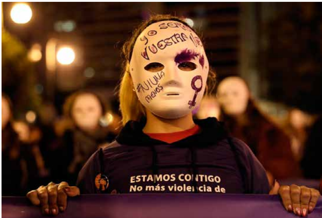
Manifestació feminista foto arxiu. / EFE

Esta feina ha sigut responsabilitat dels diferents professionals de l'àmbit públic que han participat en "Més segures, més iguals" des del principi, de manera que s'han constituït com un equip multidisciplinari que sap treballar coordinadament enfront de la violència masclista. En concret, així és el cas d'una quinzena de persones que provenen de la Policia Local,