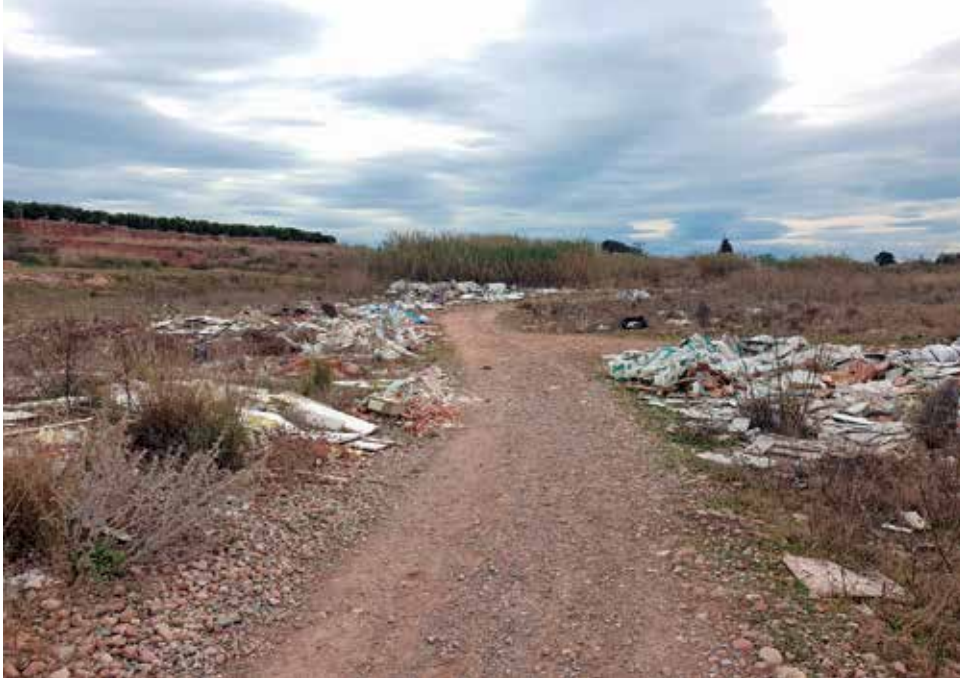
Abocaments incontrolats al Barranc del Carraixet.

La mesura també comporta l'eliminació dels enderroc