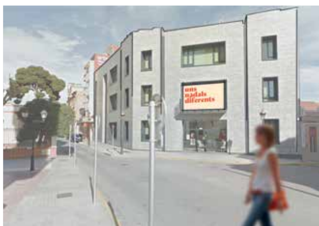
Boceto de la colocación de la pantalla.

"Nuestros comerciantes van a tener un papel protagonista en este medio. Podre-