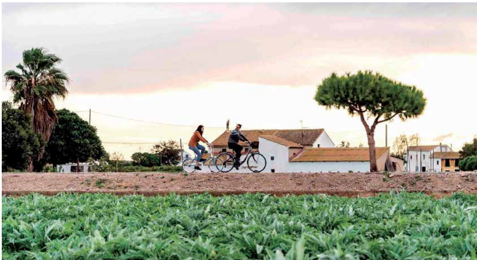
Dos persones passegen en bicicleta per un dels carrils de l'horta que envolta la ciutat de València.

“Sobre el terreny poden semblar distàncies curtes, però per a molta gent, muntada en una bici o un vehicle de mobilitat personal, suposa recorreguts irrealitzables si han de fer-los en la seua bici o VMP enmig del trànsit. Per això és tan important aquesta col·laboració entre la Generalitat Valenciana i l'Ajuntament de la ciutat de València per a articular aquests camins metropolitans: perquè derroca murs que semblaven insalvables i facilitarà canviar la manera de desplaçar-se i per tant de viure -a tantíssi-