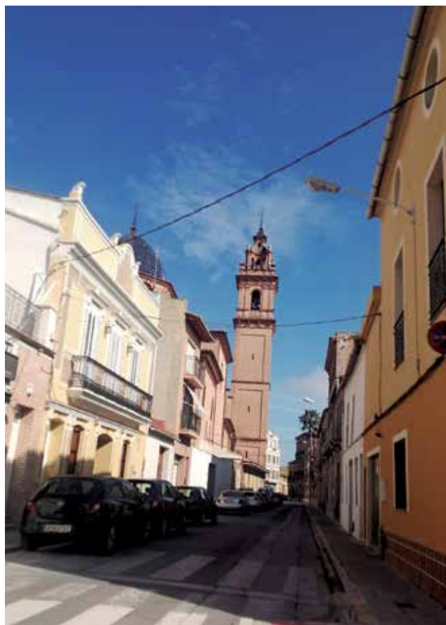
Un dels carrers principal de Foios.