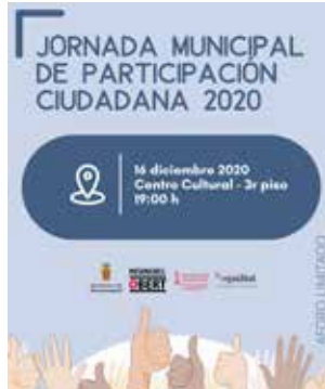
Cartel de la jornada.

Asimismo, el Ayuntamiento de Massamagrell informó