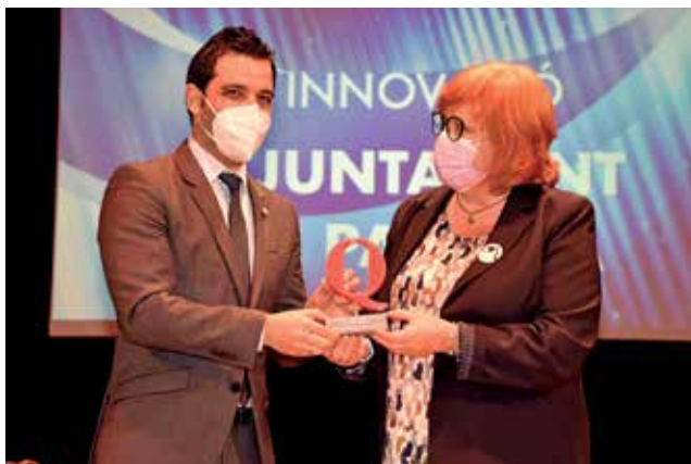
El alcalde de Paterna recibe el premio de Innovación.