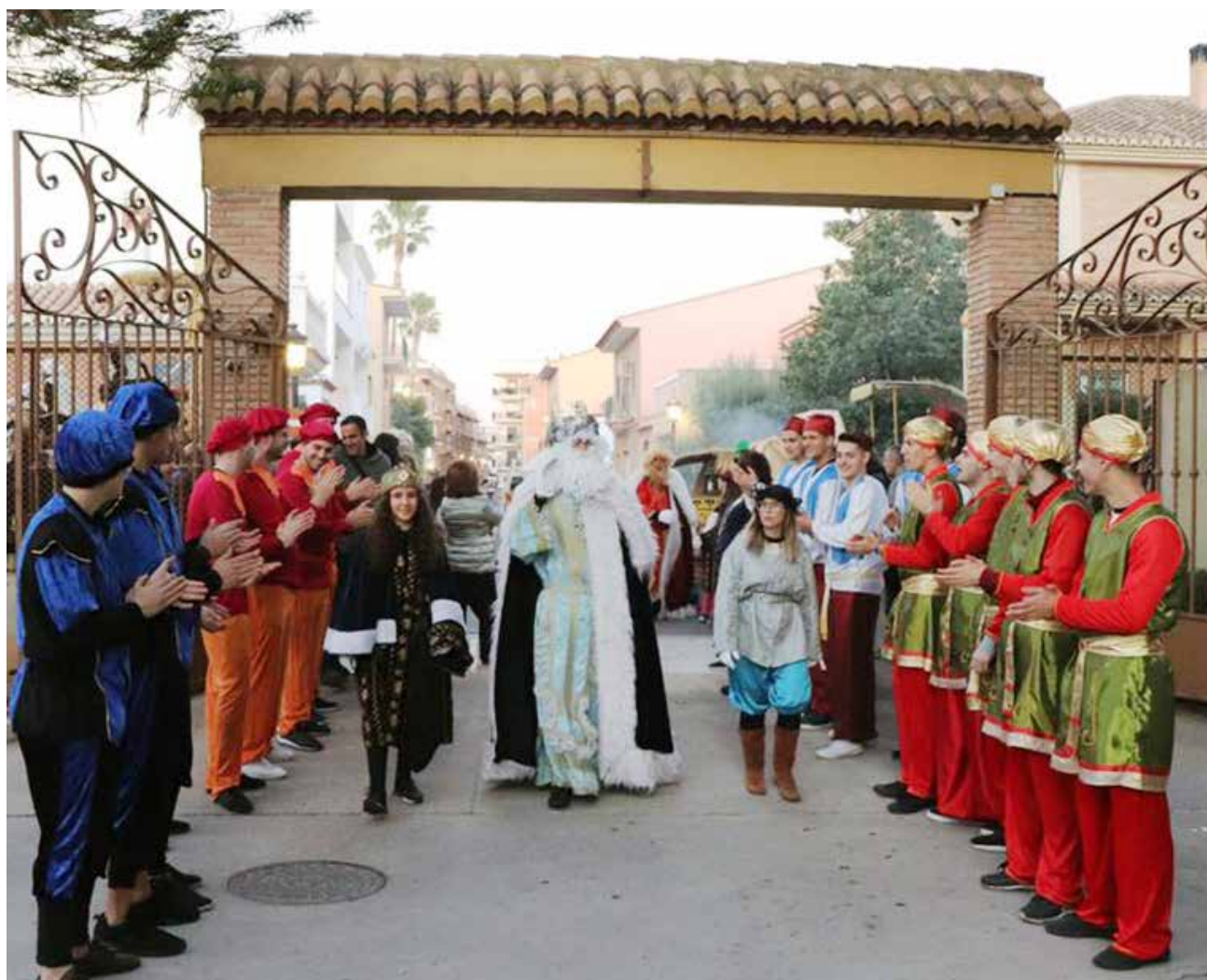
Recepción de los Reyes Magos en la localidad de Rafelbunyol en años anteriores.

Aproximadamente una treintena de niños y niñas participarán en los talleres, juegos y actividades de esta particular escuela de Navidad, puesta en marcha con la misma exitosa fórmula que la de verano en cuanto