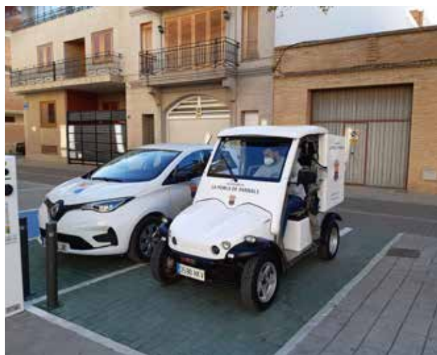
Vehicle elèctric recuperat en La Pobla.

Cebrián valorà com "molt positiva" esta recuperació, ja que "es tracta d'un mitjà