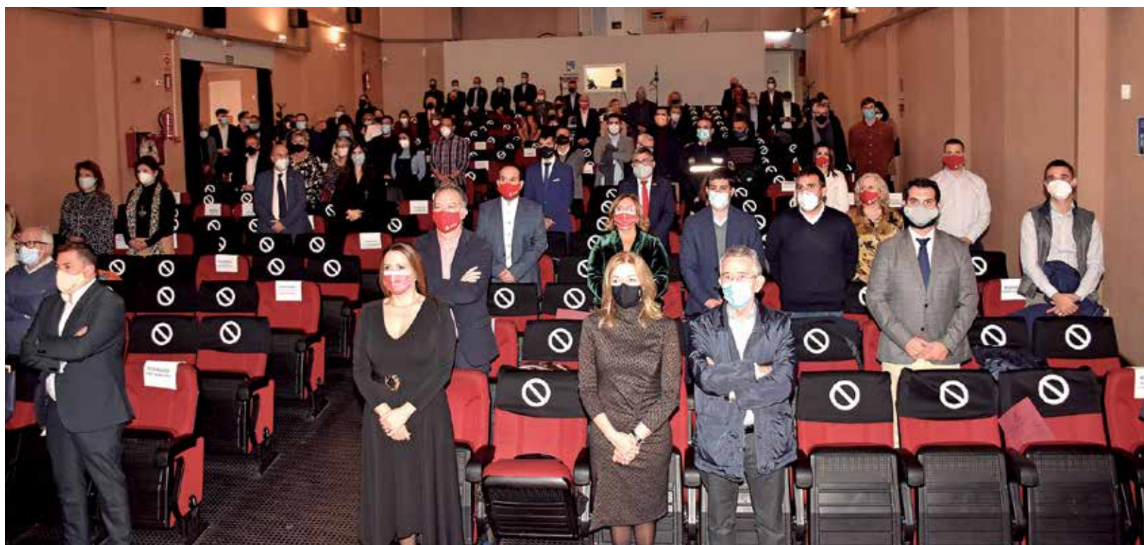
El público asistente a la séptima edición de los premios guarda un minuto de silencio por las víctimas de la pandemia.

LA GALA DE ENTREGA DE GALARDONES SE CELEBRÓ EN EL CENTRO CULTURAL BLASCO IBÁÑEZ DE MONCADA CON TODAS LAS MEDIDAS DE SEGURIDAD POR LA COVID-19 Y CON LA ASISTENCIA DE AUTORIDADES Y SOCIEDAD CIVIL