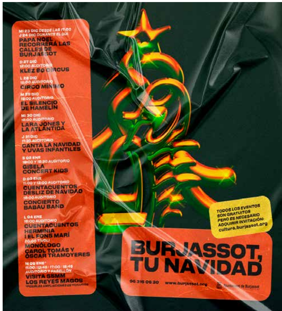
Cartel de los espectáculos programados para Navidad en Burjassot.

Para poder participar en todas ellas, con aforo limitado, cumpliendo las medidas de prevención frente a la Covid-19, deben solicitarse las invitaciones para cada uno de los espectáculos programados a través del enlace https://carpeta.burjassot.org/invitaciones/navidad/ a partir del lunes 14 de diciembre a las 9 horas. En el enlace se dispondrá de un desplegable en el que se podrán solicitar las invitaciones para cada uno de los actos, incluida la visita de los Reyes Magos.