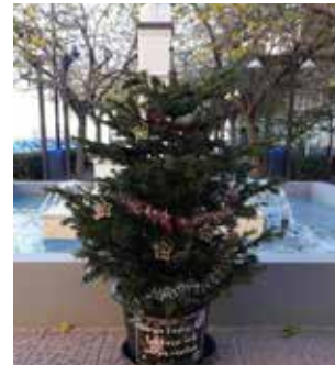
Decoració dels arbres.

Els xiquets també viuran un altre moment destacat durant