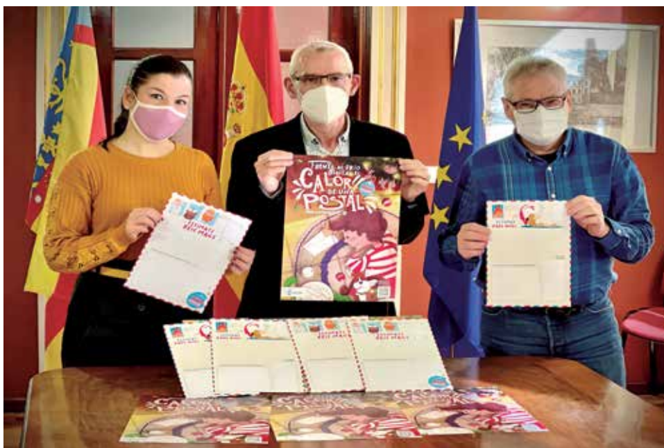
Presentación de la programación preparada para Navidad en Alboraya.

El comercio local es uno de los sectores que quiere