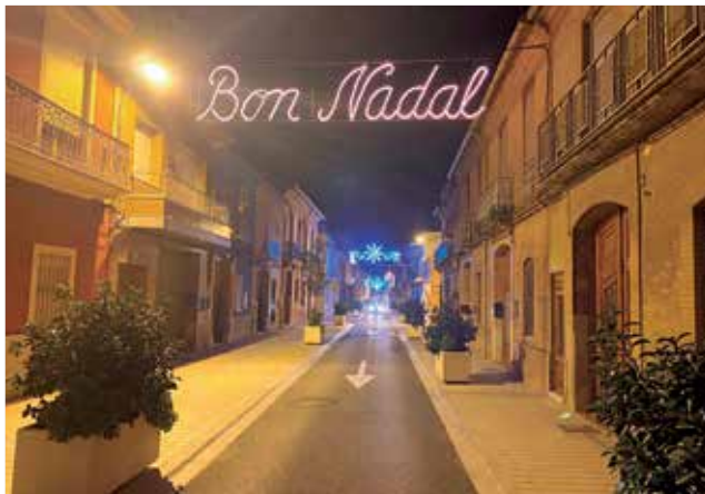
Iluminación de Navidad en Massalfassar.

Además, la Asociación de Comerciantes y Artesanos de Massalfassar, aporta otros 20 cheques por el mismo importe, uno por cada uno de los negocios que la forman, para utilizar en los comercios asociados. "Es una ini-