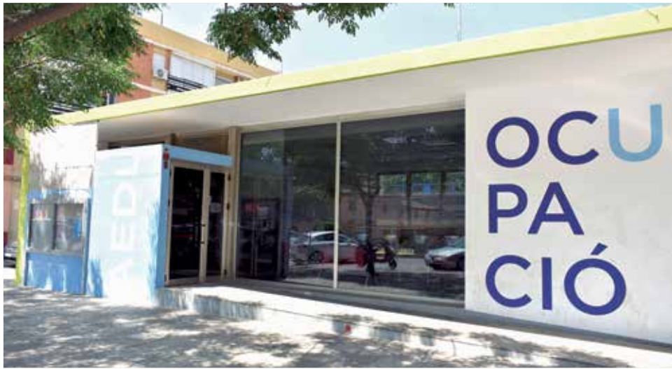
Centro de ocupació de Alfagar.

Un total de 9 comerciantes han participado en este curso, impartido por la consultora Área Formación, con una duración de 20 horas en las que han profundizado en las diferencias y utilidades del certificado y firma electrónicos, la normativa sobre comercio electrónico en España, así como las necesidades de sistemas de seguridad en la empresa. Esta formación es el resultado de la firma de