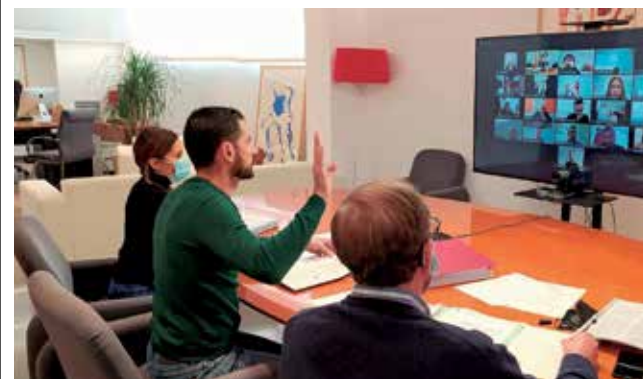
Pleno de Manises.