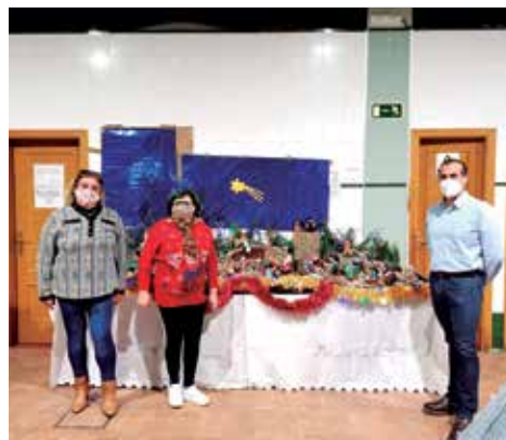
Uno dels betlems d'Albal.