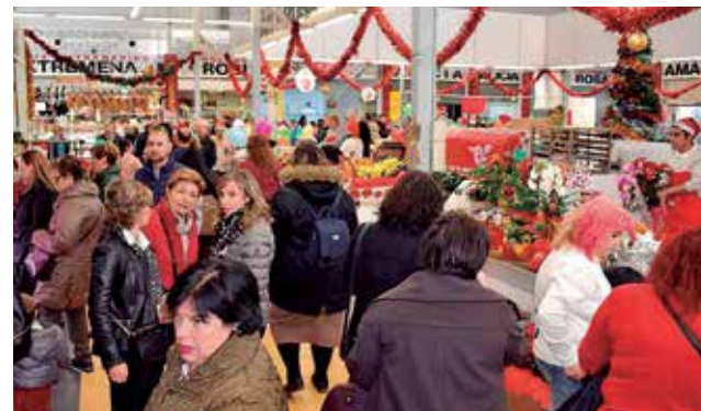
Mercado municipal de Benetússer.

Las solicitudes se podrán presentarse hasta el próximo 28 de diciembre a través de registro de entrada, adjuntando la documentación solicitada para garantizar la solvencia económica y profesional de la propuesta destinada a ofrecer nuevos productos o servicios en el mercado municipal de la localidad de Benetússer.