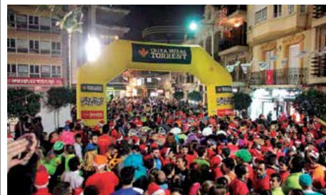
San Silvestre de Torrent.