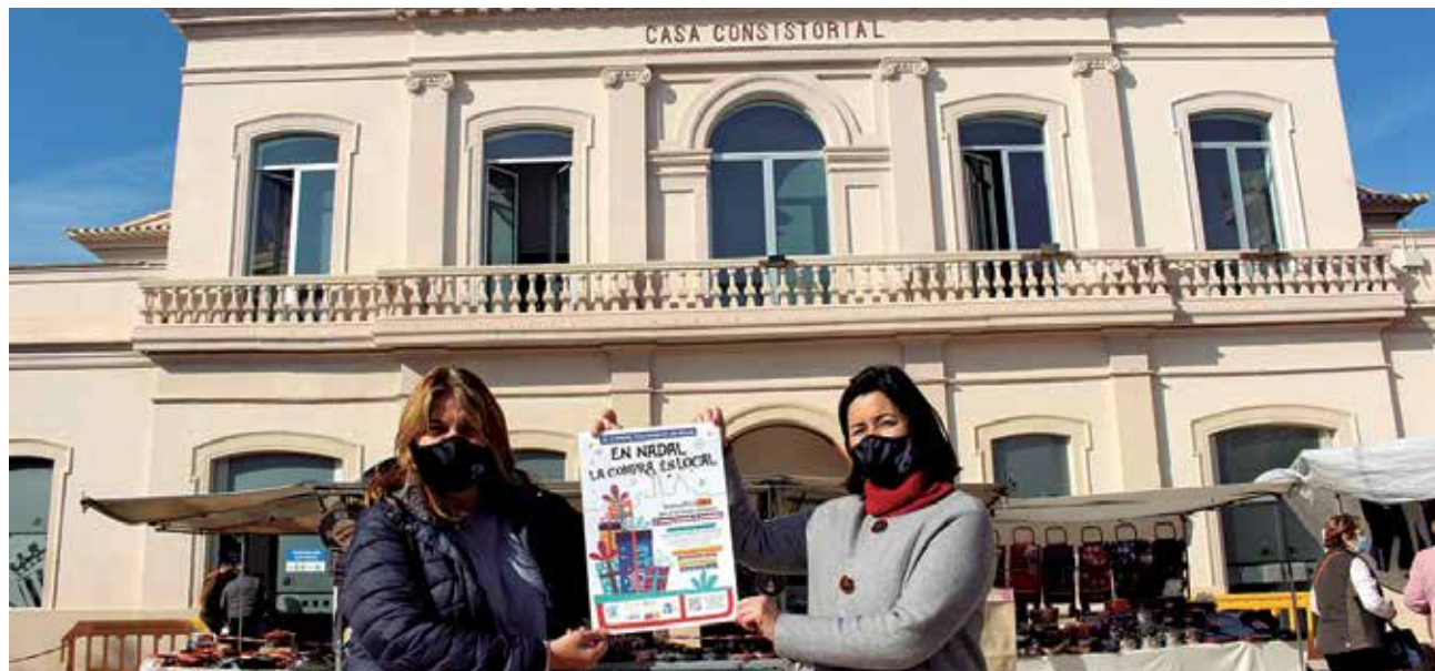
Presentación de la campaña de navidad.

Para hacer efectiva la participación de esta nueva campaña se han habilitado urnas oficiales en la Agencia de Desarrollo Local (Plaza Cortes Valencianas, s/n) y el Ayunta-