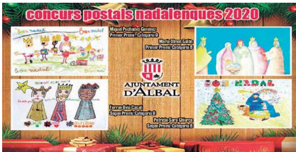
Concurso de postales navideñas d'Albal. / EPDA