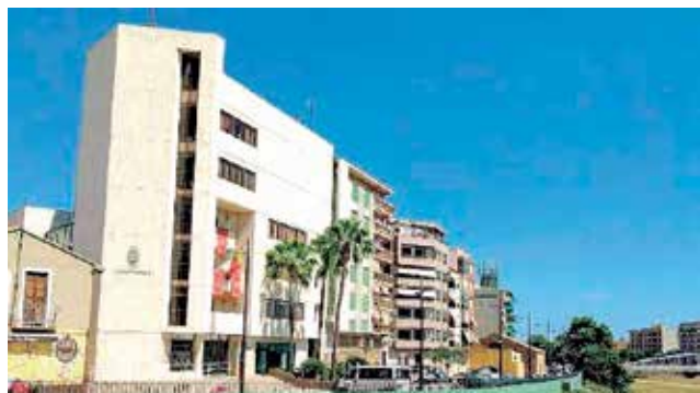
Ajuntament de Paiporta. / EPDA

La casa consistorial de Paiporta es passa a l'energia solar fotovoltaica. En els últims dies ha finalitzat la instal·lació de 30 panells solars al terrat, que serviran per a proporcionar 10 kilowatts d'electricitat a l'Ajuntament. Amb aquesta energia es cobrirà bona part de l'abastiment necessari per a les dependències on es troben els principals serveis municipals per a la ciutadania. L'acció, portada a terme per la Regidoria d'Urbanisme, Medi Ambient i Sostenibilitat, s'emmarca dins de l'impuls del govern per reduir la petjada energètica derivada de l'activitat municipal, dins del