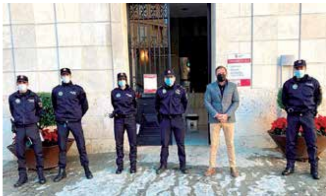
Nous integrants de la Policia Local de Silla.