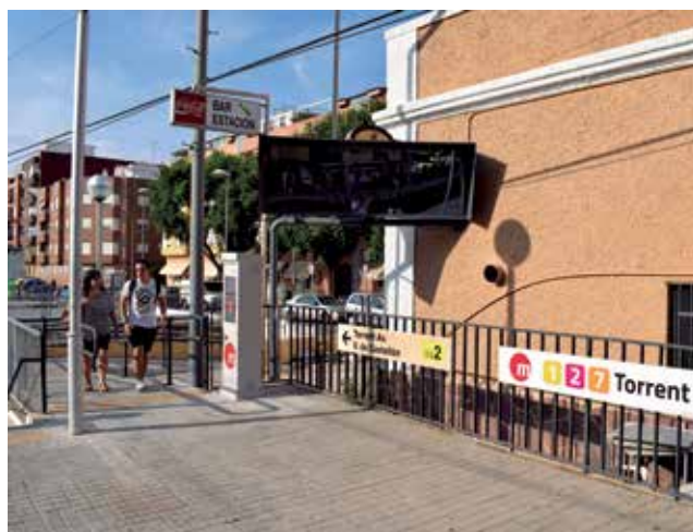
Estación de metrovalencia de Torrent.