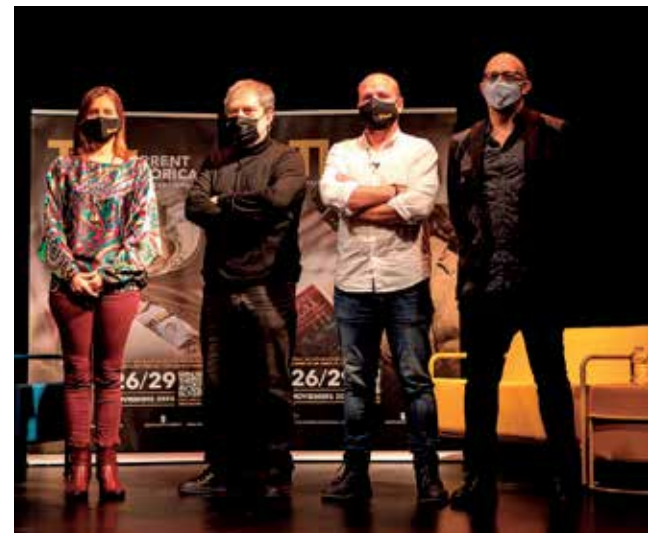
Participantes de la “Torrent Històrica”.