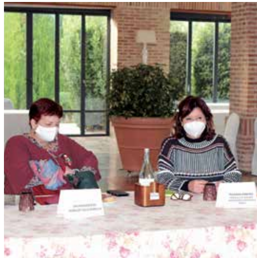
La concejala de Igualdad de Albalat (centro) y la alcaldesa de Bonrepòs (dcha).

"En el marco de la abogacía, que es un mundo generalmente patriarcal, en el aspecto laboral, continúan habiendo diferentes discriminaciones. Precisamente el Colegio de Abogados de Valencia, cuenta con una decena y con una vicedecana formada por mujeres. Esto es un dato muy positivo por dos motivos. Por una parte porque somos los pioneros en el nombramiento de este tipo, y por otro lado porque ellas tie-