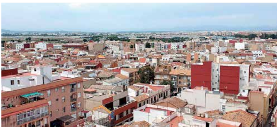
Barrio del Alter de Torrent.