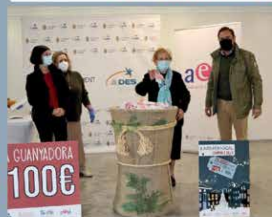
Sorteo de premios realizado por el Ayuntamiento de Silla.