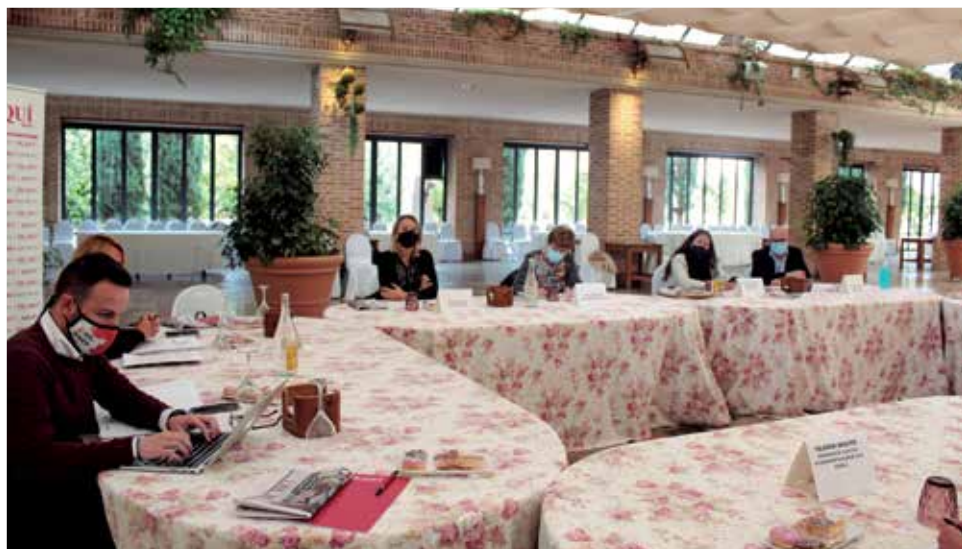
Mesa de diálogo organizada con motivo del 25N en El Huerto de Santa Maria.