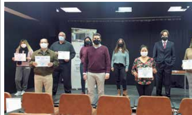
Participantes de formación de desempleados.