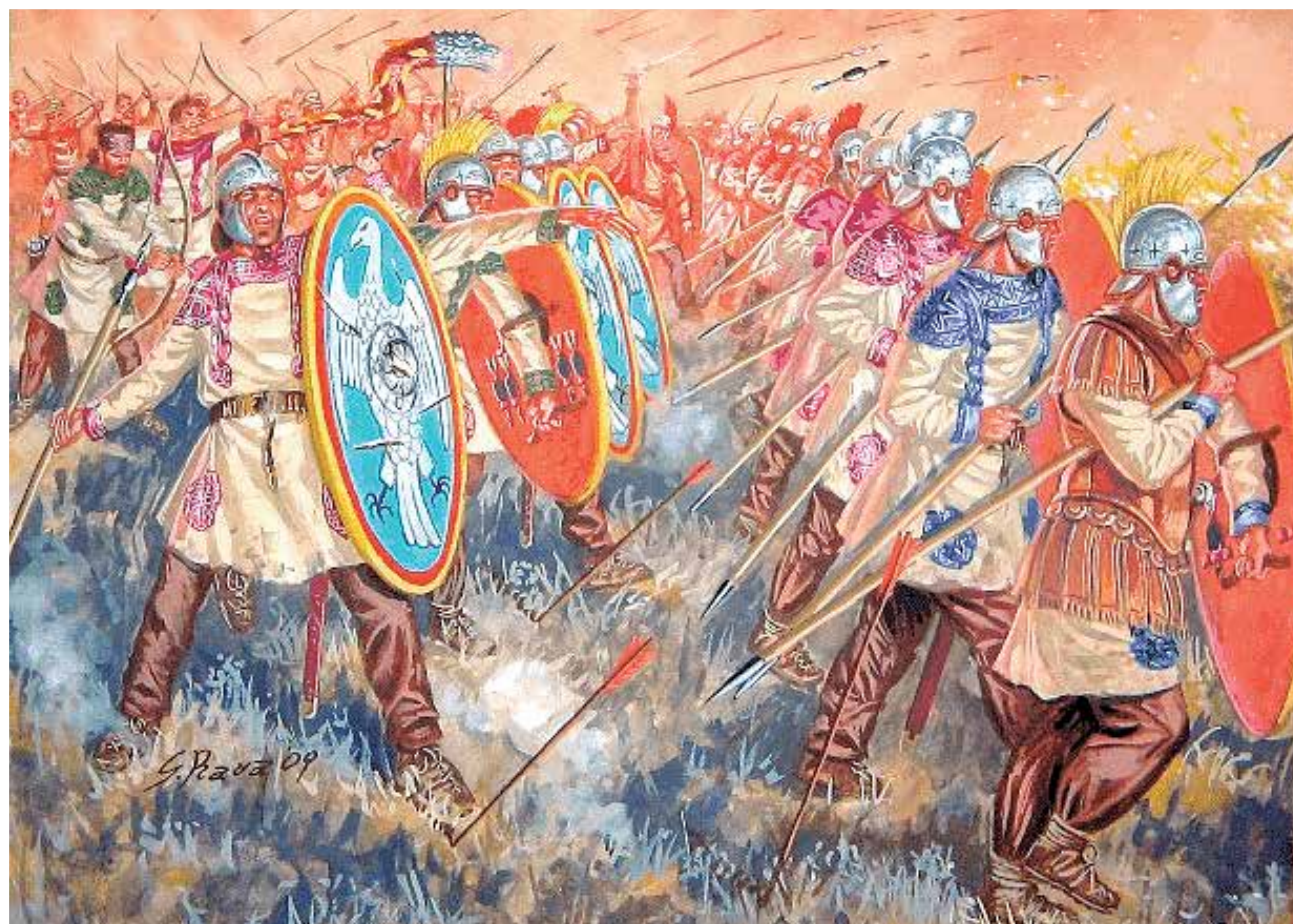
Batalla de Adriano a cutepolis infanteria cutea romana.

Es el principio del fin de la Hispania romana, cuya provincia tarracense mantendrá gobernadores imperiales hasta el 476 con la caída del último emperador romano occidental Rómulo Augusto o Rómulo "el pequeño agosto". Nombre que evoca al fundador de Roma y al primer emperador de Roma.