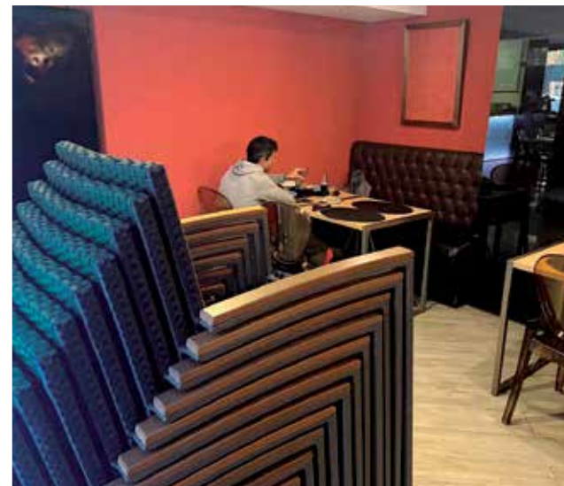
Xé que bo!, local ubicado en Valencia.

tes, porque los gastos son los mismos y se factura casi la mitad".