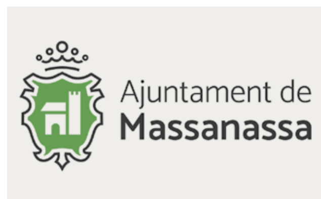
Escudo del municipio. / EPDA