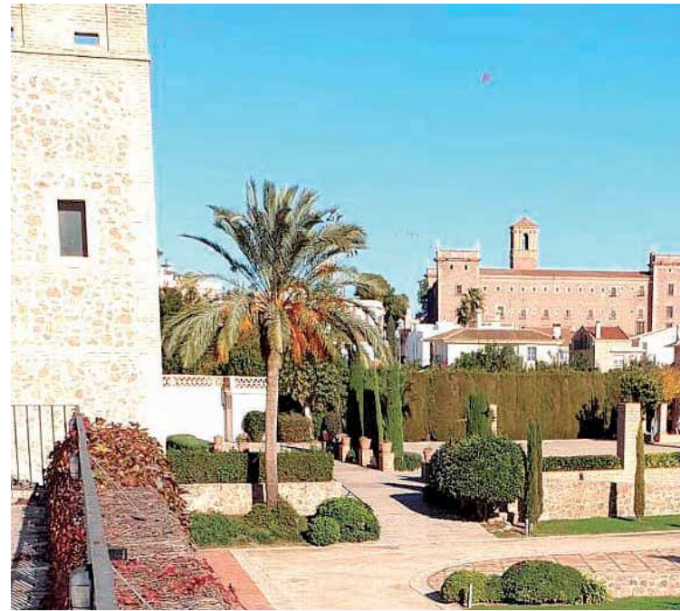
Jardines del restaurante El Huerto de Santa María del Puig.

cha cotidiana, cumpliendo de manera estricta todas las medidas de seguridad como el aforo reducido al 30%, distancia entre mesas, uso obligatorio de mascarillas y de gel hidroalcohólico. "Es muy injusto porque la culpa de todo no la tiene la hostelería. Tenemos una reducción de mesas, nos ha afectado mucho la prohibición de servir en barra y sin embargo, pagamos lo mismo. En nuestro caso la facturación se ha reducido en un 40% y estamos manteniendo una plantilla de diez personas porque nosotros somos un restaurante que subsistimos gracias a los clientes que cada día nos eligen que son trabajadores, camioneros, etc. Las ayudas por parte del Gobierno han sido totalmente insuficien-