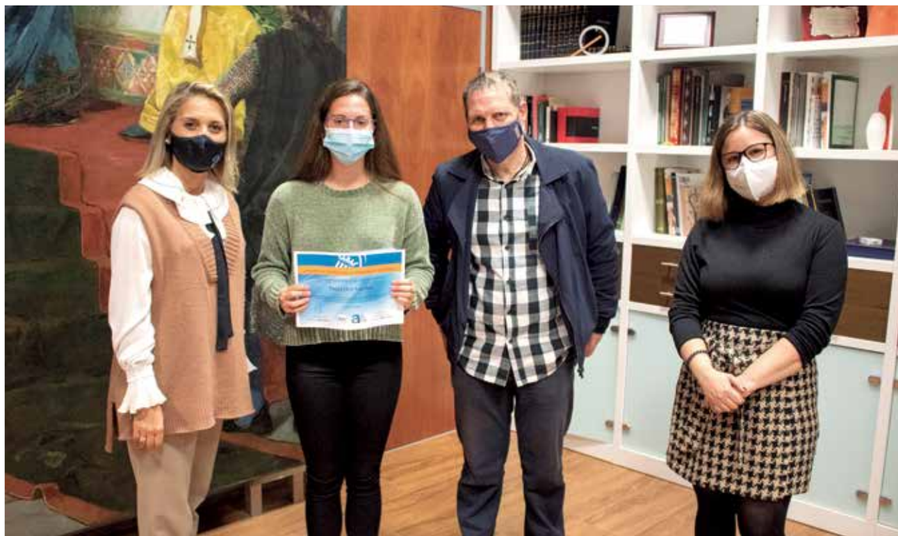
Entrega de premios por el rendimiento académico.