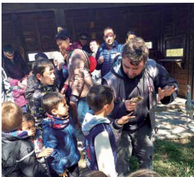
Participantes de “planeta Massanassa”.

El proyecto “Planeta Massanassa” es un programa anual estable de educación medioambiental, basado en la sensibilización y conocimiento del entorno natural. Las actividades programadas son diversas y siempre con una intención pedagógica y de transformación y mejora del entorno más próximo, con una variada programación de actividades: talleres, salidas, rutas en bici y voluntariado medioambiental.