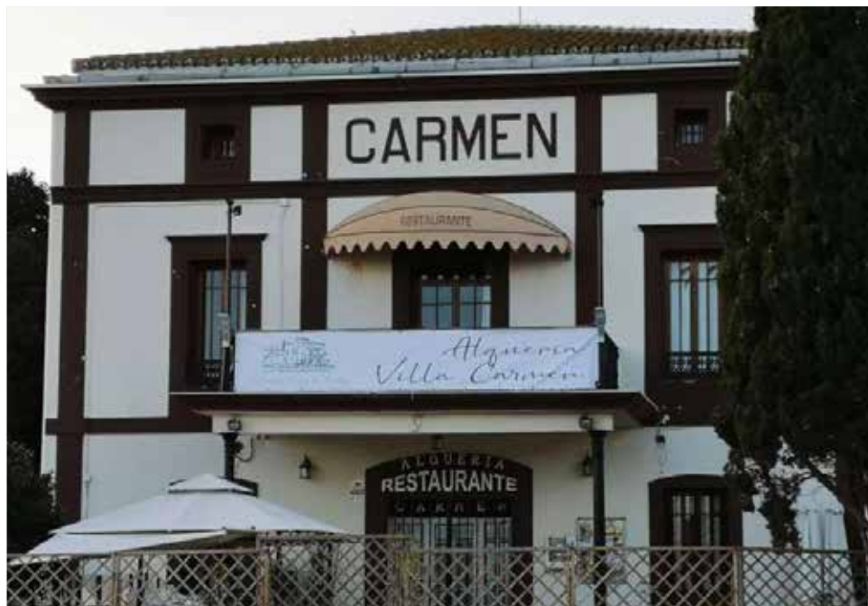
Fachada de Alquería Villa Carmen, ubicada en Catarroja.