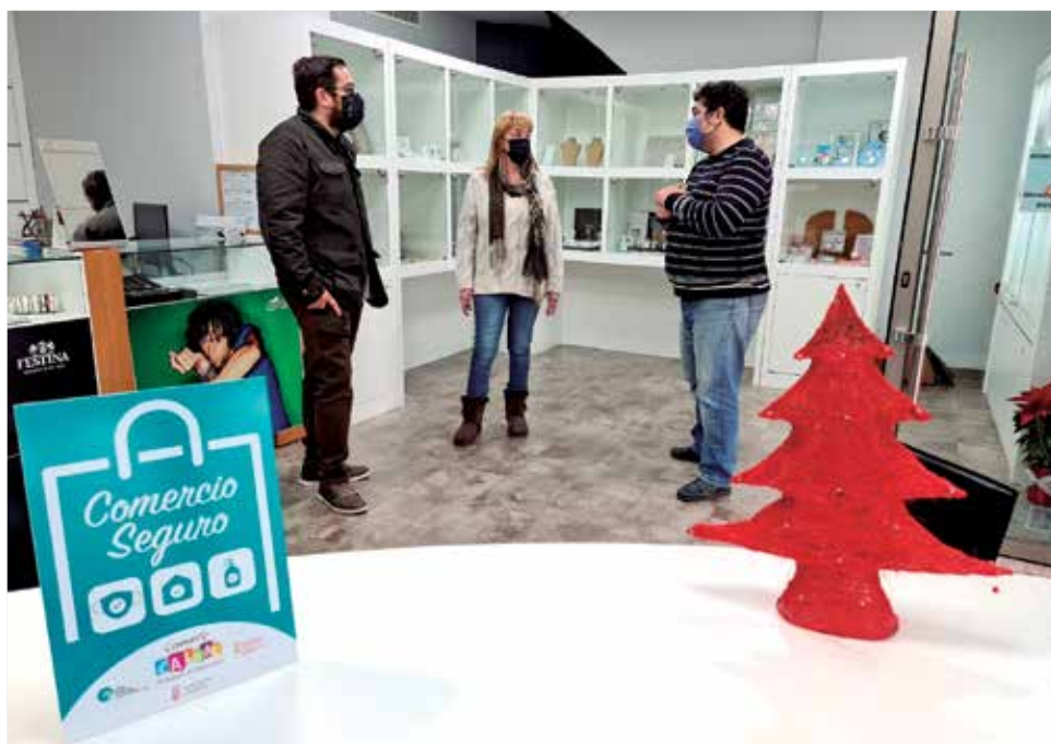
Comercio de albal dentro de la campaña "Comercio Seguro".

El municipi ha organitzat una programació antiovid, per este motiu, una de les decisions importants ha estat suspendre la cavalcada de Reis, tot assegurant que ses Majestats d'Orient passaran per Albal a entregar els regals a totes i tots els xiquets que ja tenen la bústia reial instal·lada a la porta de l'Ajuntament per entregar les seues cartes. El Pare Noel també ha confirmat la seua presència en la localitat de la comarca de l'Horta Sud, el 21 i 22 visitarà els centres escolars acompanyat del seu patge que replegaran els desitjos