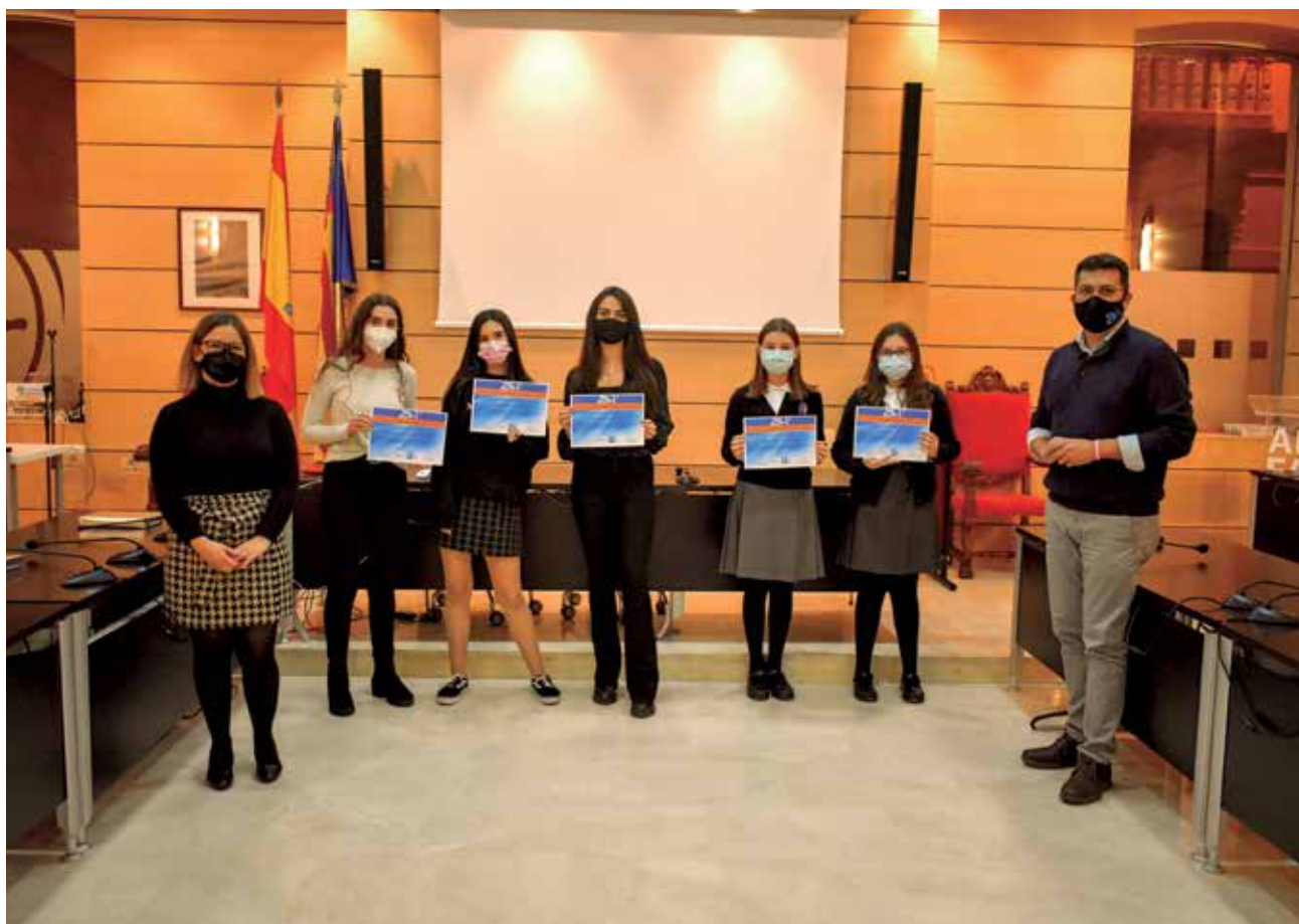
Entrega de premios por el rendimiento académico.

Además de dar la enhorabuena a los premiados, a través de este reconocimiento público, l'Ajuntament ha destacado y agradecido la profesionalidad y la labor del cuerpo docente, de las familias y de toda la comunidad educativa, que han posibilitado también la concesión de estos premios.