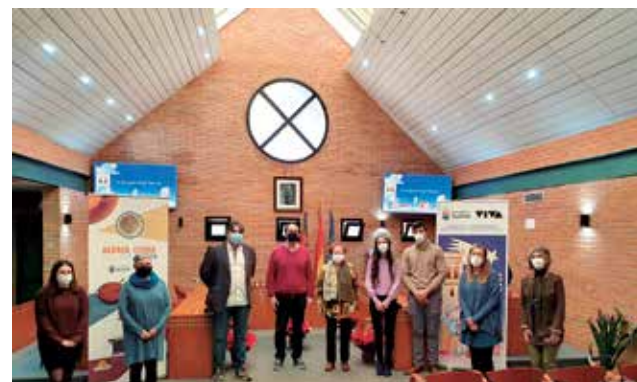
Presentación del nuevo villancico en Aldaia.