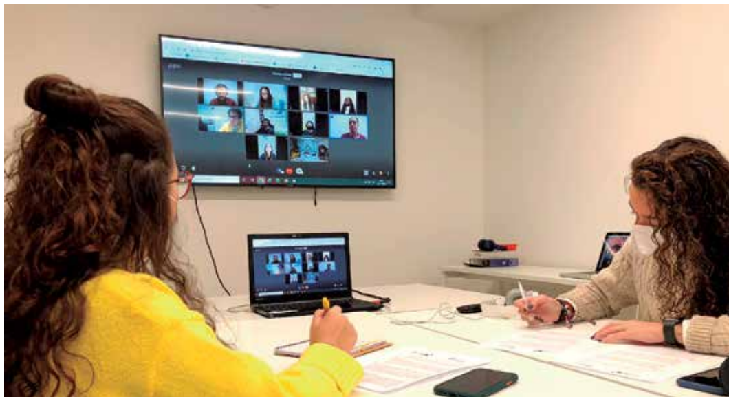
Reunió de AmplificaVeu a Aldaia.

En general, el projecte inclou les següents accions com entrevistes que van recollir qüestions, inquietuds i propostes de millora sobre temes com a estudis, treball, oci i cultura, salut, igualtat, solidaritat, mobilitat, transport, medi ambient i uns altres. A més es plantejava una observació crítica del municipi amb propostes que, segons la persona entrevistada, millorarien els temes que el preocupen. Al febrer es van realitzar entrevistes en els tres centres d'educació secundària de la lo-