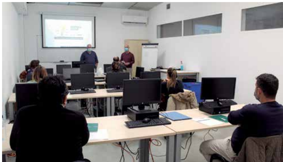
Participantes de Emprengoop de Quart de Poblet / EPDA

A lo largo de tres sesiones de cuatro horas de duración cada una, las personas empla-