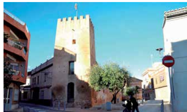
Torre de Albal.