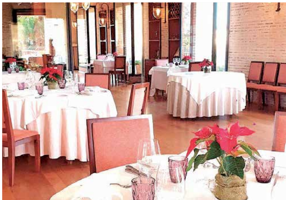
Uno de los salones de El Huerto de Santa María, ubicado en El Puig.

Lo más importante para los responsables de este negocio es la seguridad tanto de sus clientes como de sus trabajadores. "Acogeremos pequeñas cenas y comidas adaptándonos siempre a las medidas establecidas por Sanidad", asegura. "Para el día de Navidad -añade- tenemos confirmados unos 250 comensales. Se hará un control de temperatura a la entrada, la mascarilla es obligatoria, la separación de las mesas será del doble de lo establecido y con el número de comensales que marcan las autoridades. El camarero solo podrá tocar las mesas que le correspondan". La celebración de nochevieja está en el aire "dado que la gente tiene dudas al no poder celebrarse con fiesta posterior", explica el gerente.