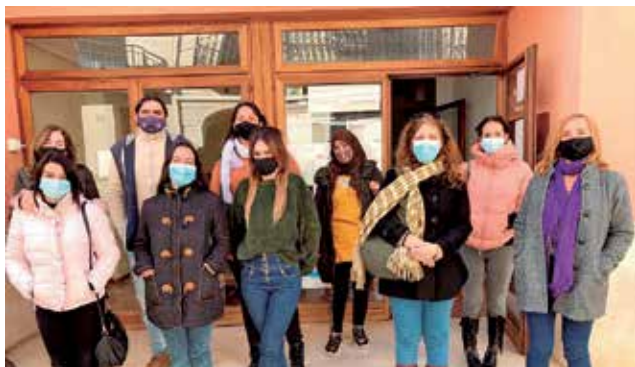
Participants de Et Formem "Alcàsser 3.2". / EPDA

En aquesta primera etapa del programa Et Formem, cursaran el Certificat de Professionalitat del Nivell 1 'Operacions d'enregistrament i tractament de dades i documents', dins de l'especialitat d'Administració i Gestió. Així mateix, aquesta formació anirà acompanyada de la realització de tasques pròpies de la certificació, com la digitalització del patrimoni documental de l'Ajuntament d'Alcàsser.