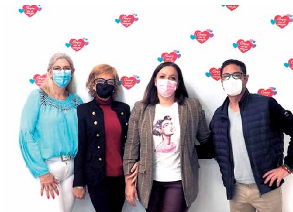
Representants de la plataforma de comerç.