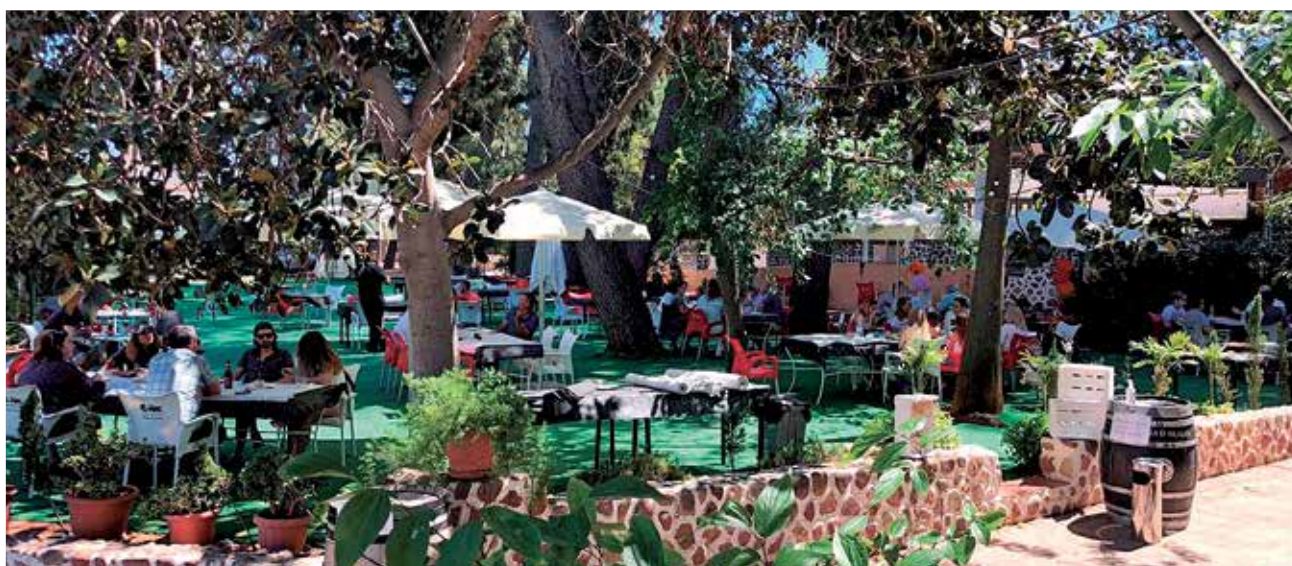
Los clientes conversan en la terraza del restaurante Els Pins de la localidad de Estivella.

ayudar en esta situación tan complicada”.