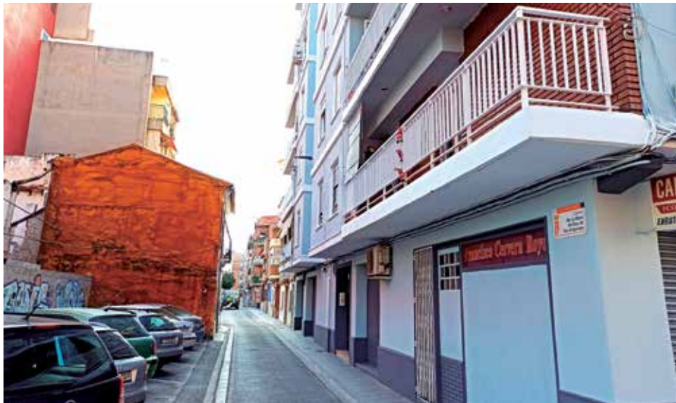
Calle Virgen de las Angustias.

En este apartado la actuación se focalizará en la renovación de la acera en la que confluyen la Calle Valencia y la Calle Músic Marià Puig Yago, donde se ha adquirido una parcela para urbanizarla y, posterior-