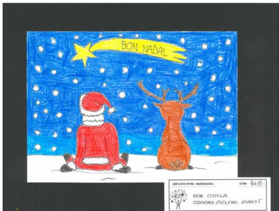
Postal ganadora del concurso de tarjetas de navidad 2020.

En este sentido, el Ayuntamiento, además de adornar las principales vías del municipio, también ha convocado un concurso de decoración navideña de balcones para particulares y escaparates para los locales comer-