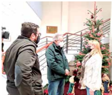
Alcalde d'Albal.

Tot i la crisi sanitària, l'esport també rodarà, tot i la suspensió de la multitudinària cursa de Sant Silvestre que tenia lloc el 31 de desembre. Per seguretat, l'acte queda confinat enguany. L'Escola Municipal de patinatge oferirà una exhibició el 22 de desembre, del 28 al 31 de desembre es desenvoluparà un Camps de Karate i el 29 hi haurà torneig de tenis i pàdel on es disputarà amb totes les normes de seguretat.