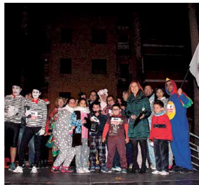
San Silvestre de Aldaia.

D'altra banda, la ciutat de la comarca de l'Horta Sud comptarà també amb una carrera competitiva de 7 quilòmetres que trancorrerà per tot el terme municipal. La prova tindrà premis en les dos categories, tant masculina com femenina, per als tres primers classificats de esta cursa especial.