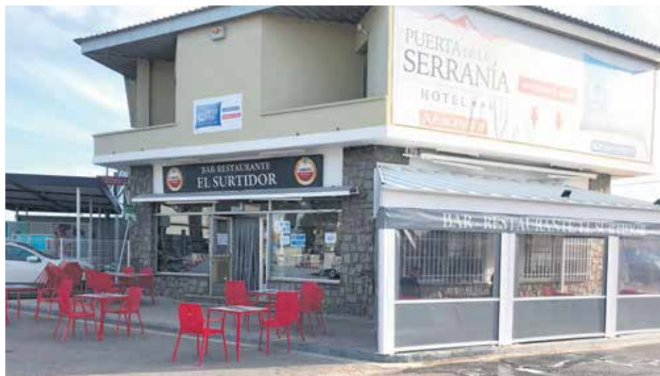
Bar Restaurante El Surtidor, ubicado en el municipio de Casinos.