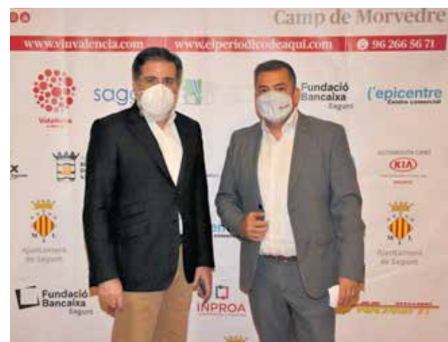
El diputado Alfredo Castelló, del PP.