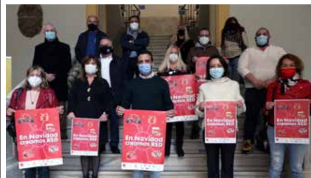
Presentación de la campaña.