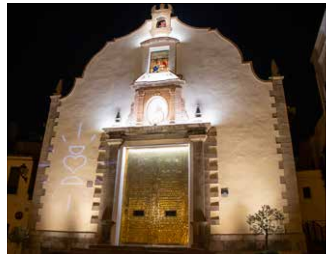
Il·luminació de la façana de l'Ermita de la Sang.