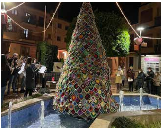
Arbol de Navidad en la Plaza del Hostal.

Al mismo tiempo, los más pequeños podrán disfru-