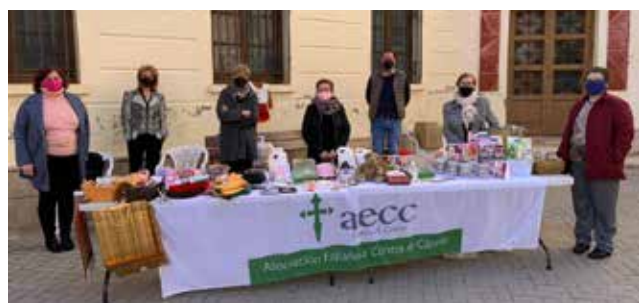
Un momento de la cuestación.