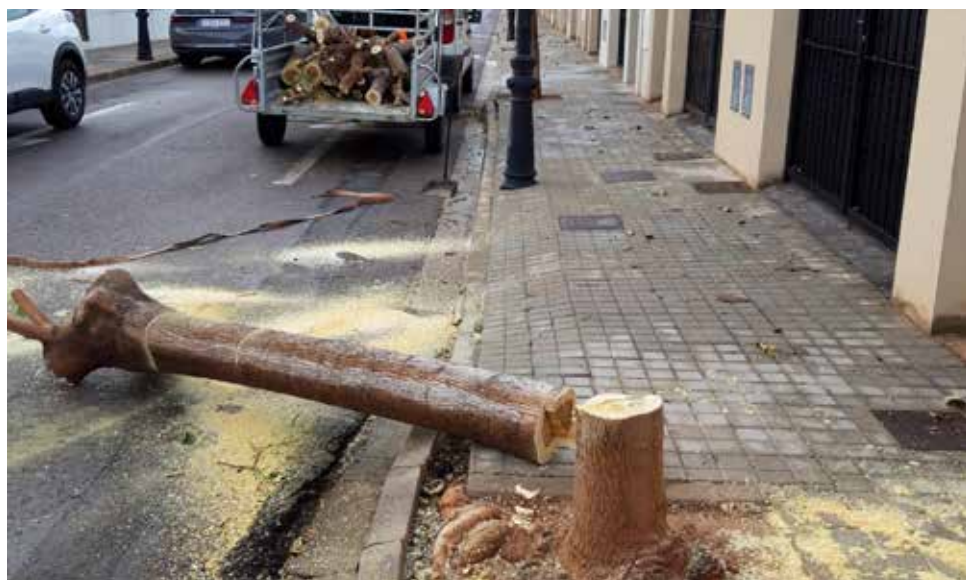
Tala de uno de los árboles.

En opinión de Salt, se trata "de una falta de imaginación, ya que se pueden trasplantar los árboles o abordar otras alternativas si realmente están causando