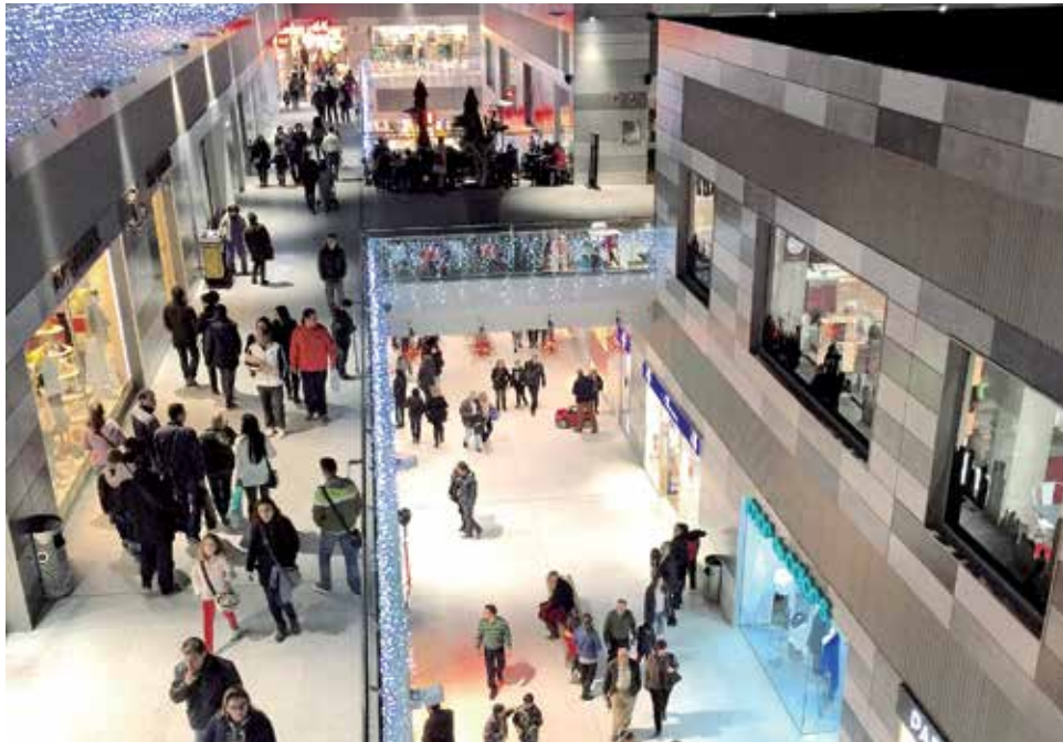
Navidad en el Centro Comercial L'Épicentre.

Por último, una de las inauguraciones más esperadas por los clientes del Norte de Valencia para los próximos meses, es la llegada de Lefties, una de las marcas más punteras del grupo Inditex.