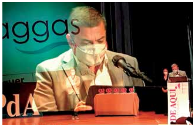
Un moment del parlament. / M. G.

I continuarem celebrant les coses bones de la vida. Precisament en estos moments tan complicats, és quan més destaquen les bones persones, institucions