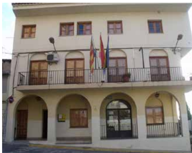
Ayuntamiento de Albalat dels Tarongers. / EPDA

El 31 de diciembre se despedirá el año 2020 con unas campanadas interactivas que por razones de seguridad debido al Covid-19, se podrán seguir mediante un vídeo