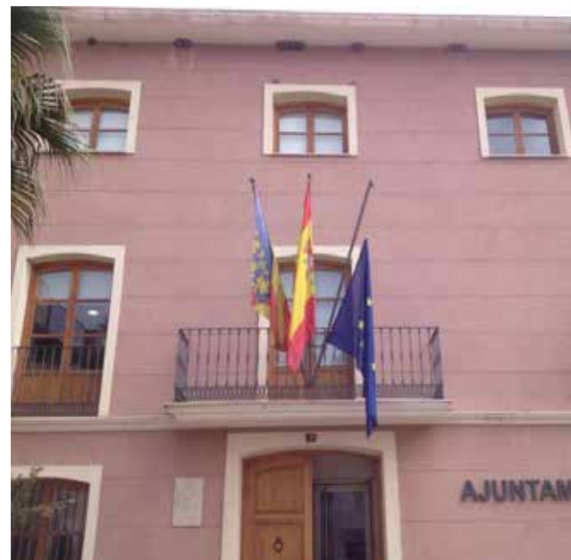
Ajuntament d'Algímia d'Alfara. / EPDA

Serà obligatori l'ús de mascareta, la distància social i els aforaments seran limitats i amb reserva prèvia a les oficines o mitjançant el Whats-App de l'Ajuntament.