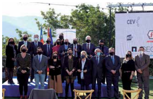
Foto de familia de los premiados.