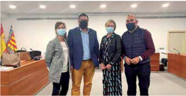
Los cuatro concejales del PP de Canet.