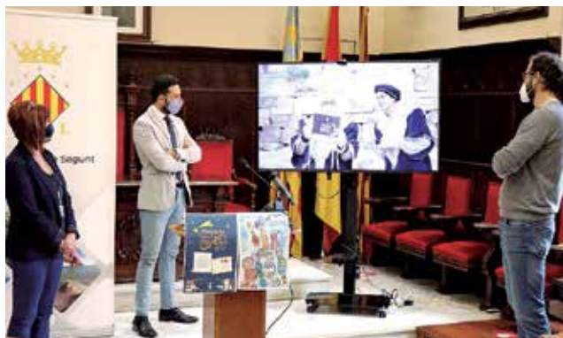
Presentación de la campaña.

Este año, debido a las restricciones, no se podrá celebrar una cabalgata como en años anteriores, por este motivo, las concejalías de Juventud e Infancia y de Cultura no han querido dejar a los niños y niñas de la ciudad sin actividades en un día tan señalado. Además, desde Alcaldía tam-