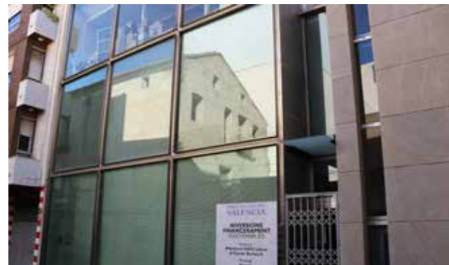
Futuro Casal Jove de Sagunt.