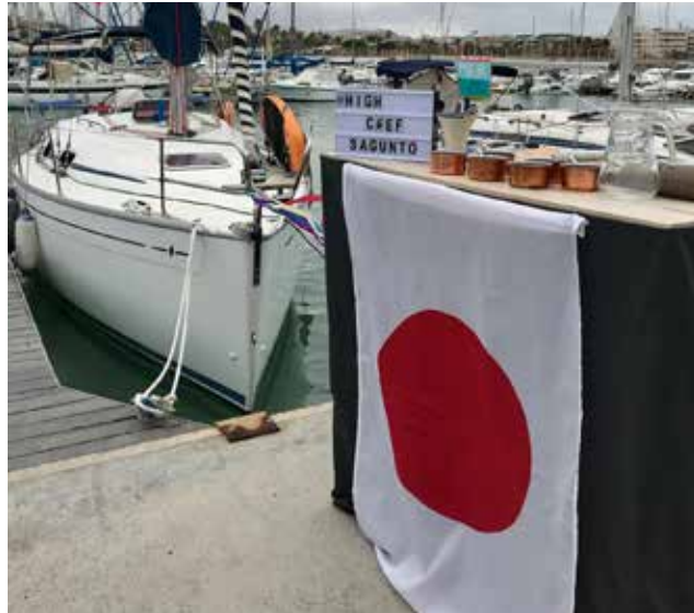
High Chef incorpora la alta cocina japonesa.

High Chef mira ahora a las fiestas navideñas, en las que tienen un servicio contratado y varios eventos donde quieren darse a conocer. La organizadora insiste en la necesidad de “darle un im-