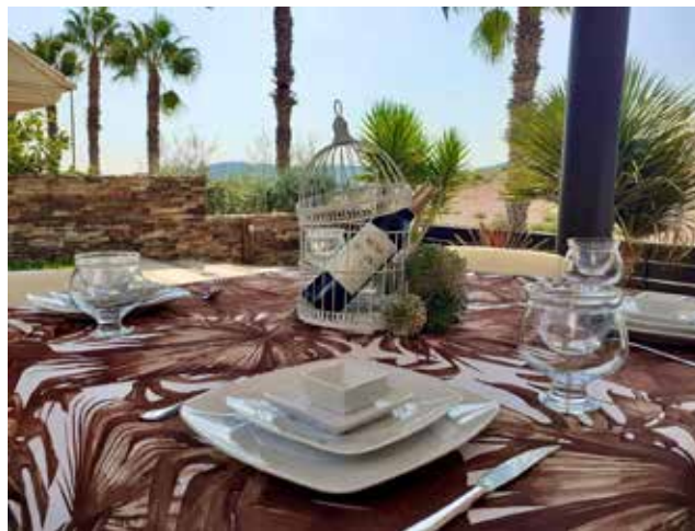
Una de las presentaciones de High Chef.

pulso de cara a la Navidad” a un negocio que está comenzando. “Esta siendo complicado, porque el inicio de todo proyecto lo es, y además ahora la limitación a grupos de diez hace que disminuya el nivel de trabajo y las fies-