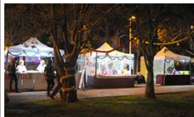
Mercado de Navidad en el Port en 2019.