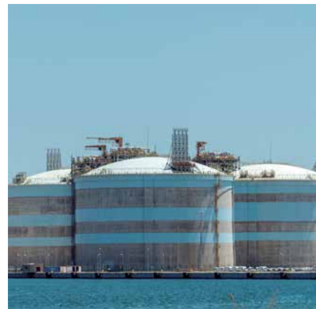
Instalaciones de Saggas en Sagunt.

Asimismo, en noviembre de 2020, la planta asumió un nuevo compromiso de reducción de su huella de carbono mediante la adhesión voluntaria al proyecto Oil and Gas Methane Partnership 2.0 (OGMP 2.0). Se trata de una iniciativa de la Coalición por el Clima y el Aire Limpio, liderada por el Programa de las Naciones Unidas para el Medio Ambiente (PNUMA), la Comisión Europea y el Fondo de Defensa Ambiental. Saggas es una de las 62 empresas de todo el mundo que se ha adherido a este proyecto que tiene por objetivo global redu-