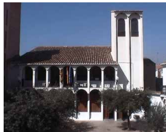
Ayuntamiento de Quartell. / EPDA

El Consistorio es consciente del impacto económico de la crisis sanitaria provocada por el Covid-19, por lo que a través de esta campaña de dinamización económica se pretende conseguir disminuir dicho impacto impulsando la actividad económica en el término muni-