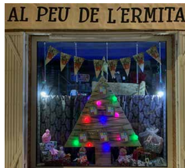
Escaparate decorado de un local de Benifairó

El 22 de diciembre el jurado desvelará el escaparate ganador.