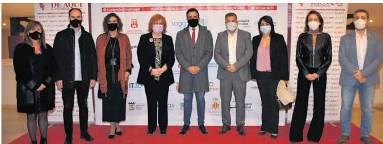
Representantes del PSOE provincial y comarcal.