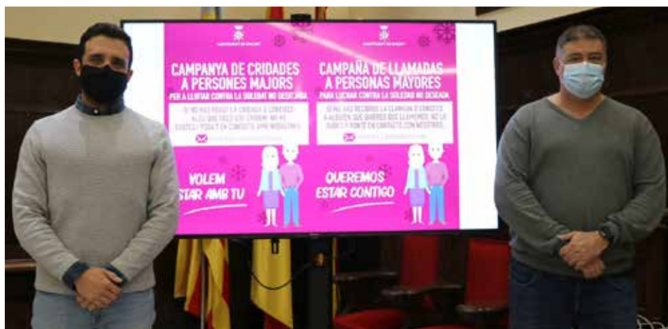
El alcalde de Sagunt y el concejal de Servicios Sociales presentaron la campaña.

Con motivo de la llegada de las navidades, que serán excepcionales y marcadas por la actual pandemia, el Ayuntamiento ha decidido retomar esta iniciativa y ha puesto en marcha un equipo de funcionarios/as y personal del Ayuntamiento que irán contactando telefónicamente con todas las personas mayores y les ofrecerán los ser-