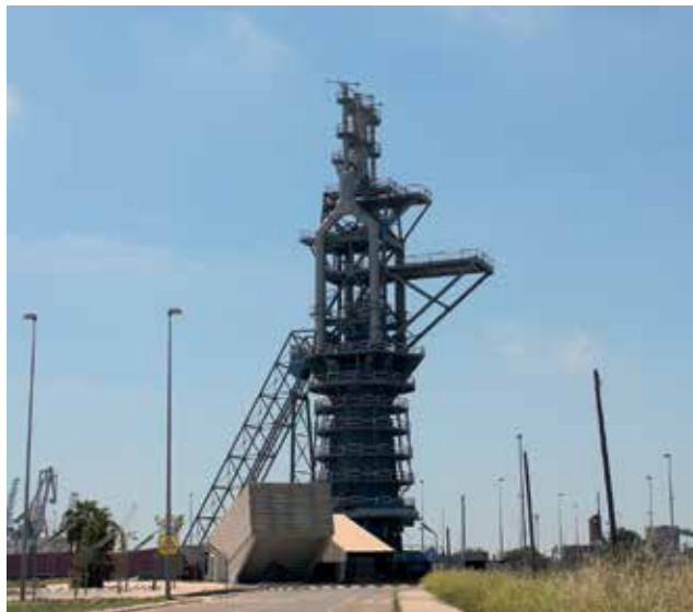
Horno Alto del Port de Sagunt y vista del Castillo.

La delegación de Turismo del Ayuntamiento de Sagunt pretender impulsar los iconos más reconocibles de la ciudad de Sagunt, como el teatro romano y el castillo, en el casco histórico, o el patrimonio industrial como el horno alto número 2 en el Port de Sagunt, pero también destacar otros aspectos menos conocidos por los visitantes, como pueden ser el Grau Vell o el barrio de la Judería.