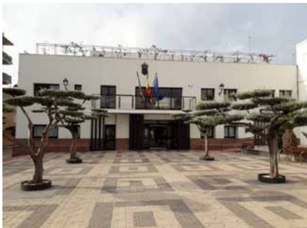
Ajuntament de Faura.