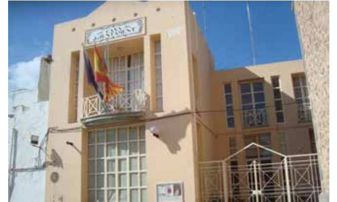
Ajuntament de Quart de les Valls.