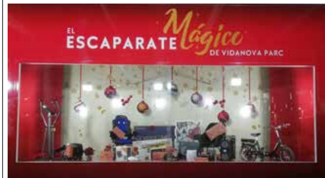
El Escaparate mágico de Vidanova Parc.