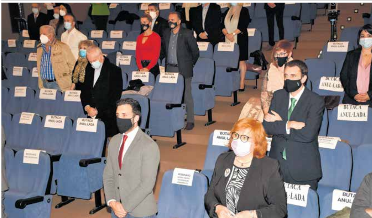
El público guardó un minuto de silencio por las personas fallecidas por la Covid19.