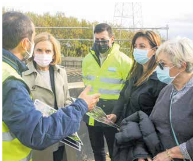
Visita de Verdevío y García a pie de obra.

judicataria de la obra, tiene una longitud de 4,7 kilómetros que discurren del sureste al norte del núcleo urbano de Bétera, conectando la carretera que viene de València con la CV-310 hacia Náquera y Serra, evitando el paso por la travesía actual dentro del mu-