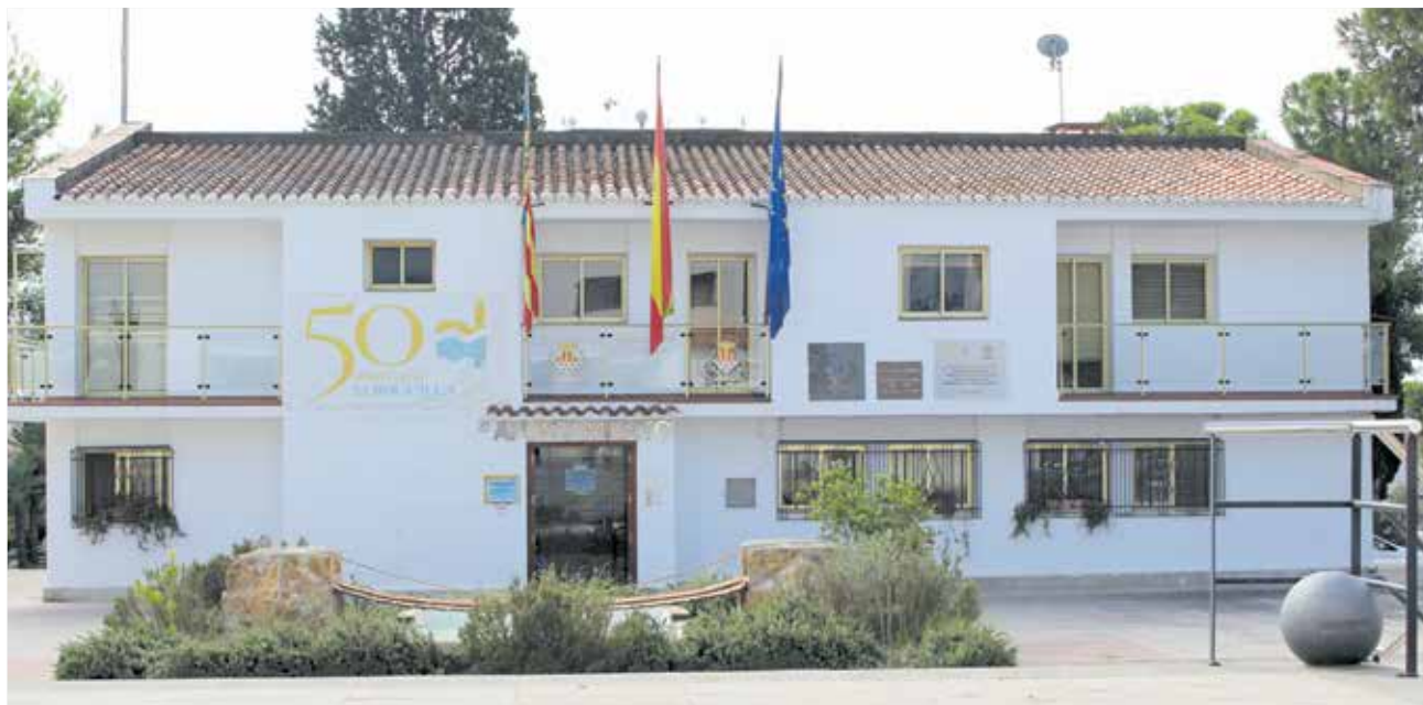
Ayuntamiento de Loriguilla.

eficiente y ágil ahora mismo, ya que la anterior no ha dado resultado" y declara que dar este paso será "muy positivo para el municipio de Loriguilla, puesto que el sector industrial genera mucha riqueza, beneficios y también mejora el bienestar general de la localidad, que revierten en la ciudadanía".