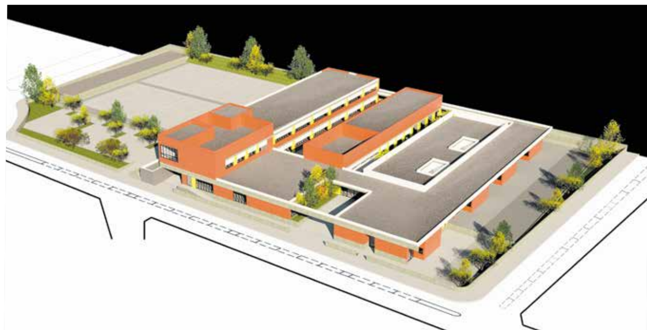
Maqueta del futuro colegio público de Infantil y Primaria, que se ubicará en Montesano.

Desde el Consistorio “estamos de enhorabuena por la salida hacia adelante de este proyecto tan importante para el pueblo de San Antonio de Benagéber y para todos sus vecinos. Proyecto en el cual ha trabajado exhaustivamente gran parte del Consistorio y a los cuales se agradece su trabajo desde estas líneas”.