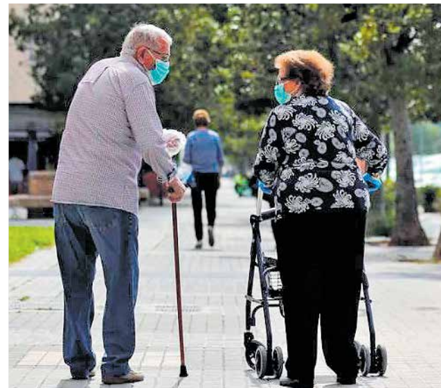
Dos personas mayores paseando con mascarilla.

van a pasar las fiestas navideñas en las residencias, lo cual les afecta desde el punto de vista psicológico.