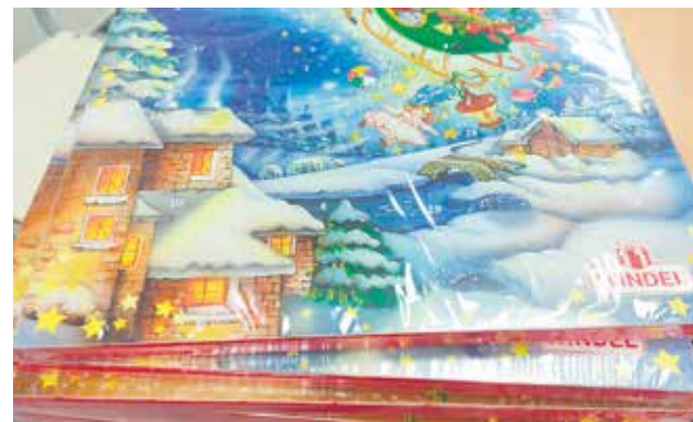
Calendarios de adviento que reparte el Consistorio.