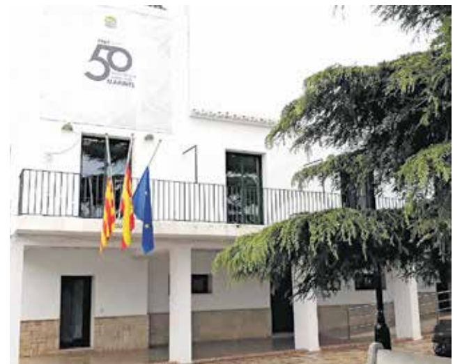
Ayuntamiento de Marines. / EPDA

Además, se ha programado un taller de mapeado el próximo 14 de enero a las 17:30h en el salón de Plenos del Ayuntamiento de Marines. Para poder participar es imprescindible la cita previa en el ayuntamiento o enviando un correo electrónico a informacion@marines.es