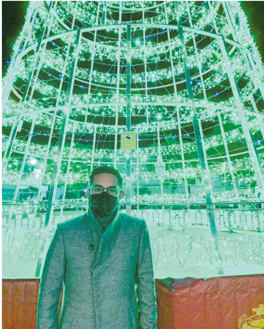
Troyano junto al gran árbol de Navidad instalado en el municipio

► Otra de las medidas que se ha llevado a cabo para fomentar el consumo en los comercios del municipio ha sido el sorteo de bonos para gastar en el