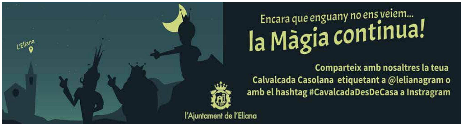
Cartell de la regidoria de Joventut.

Ves amb compte amb el que desitges, perquè els desitjos també es poden complir!