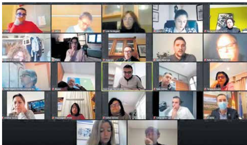
El pleno telemático del Ayuntamiento de Riba-roja celebrado hace unos días.

el tejido comercial de la localidad en un intento por favorecer una mayor formación y empleabilidad.