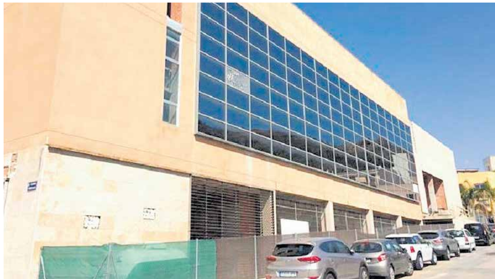
Edifici Accis de Nàquera.

L'any 2009, l'empresa encarregada de la construcció d'aquest edifici, CG Sòl i Habitat, S.L., va notificar a l'Ajuntament de Nàquera sobre la paralització temporal de l'obra i, deu anys més tard, al gener de 2019, l'administrador concursal de la mercantil Residencial Nàquera Golf, S.A. va sol·licitar iniciar el procediment per a declarar la resolució del conveni urbanístic i el seu protocol addicional, davant la impossibilitat de materialitzar