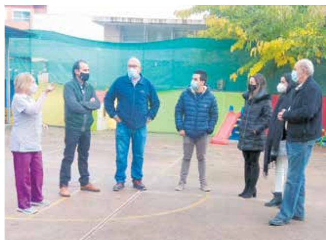
El edil de Educación con responsables de las obras.