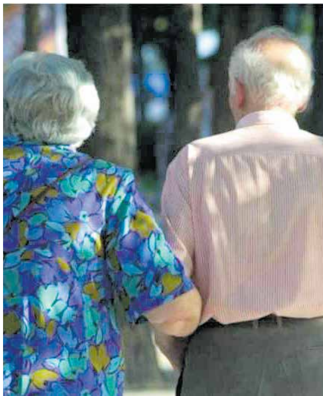
Una pareja de mayores cogidos del brazo.