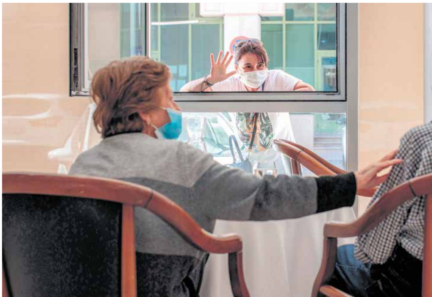
Imagen de la visita de un familiar a un mayor en una residencia, a través de una ventana habilitada para ello.

En este sentido, desde la residencia se aseguraba que dada la coyuntura actual "los mayores no pueden salir puntualmente para una comida familiar y luego volver a la residencia". Por ello, muchos