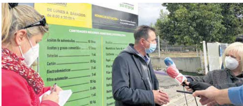
Raga en la presentación del proyecto de economía circular.

no va a parar a los jardines de las propias viviendas del consorcio, a los campos, la vuelta a la tierra, al arraigo, a los recursos naturales...”. Según ha explicado, el CVI recoge anualmente 20.000 toneladas de poda, de las cuales se obtiene en torno a 8.000