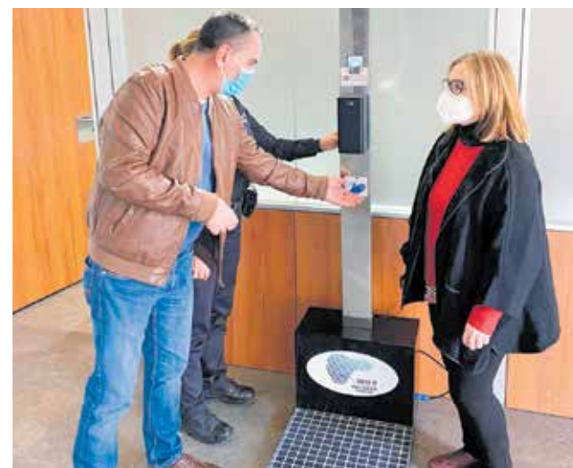
Tótem para el control aforo y desinfección.