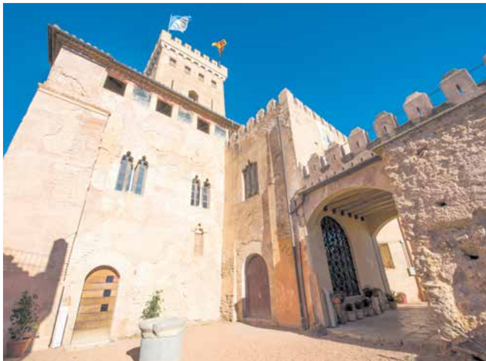
Castell de Benissanó.

Amb en el cas de Benissanó i el seu Castell del segle XV, la Generalitat Valenciana, mitjançant CREATURISME, reconeix la importància turística i cultural d'aquest monument (un dels millors conservats de la nostra Comunitat) que és visitat per nombrosos turistes al llarg