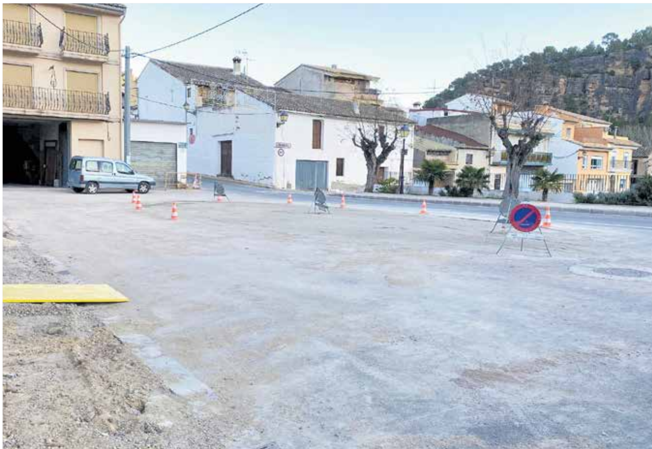
Zona de la entrada al municipio que se va a mejorar y hacer más accesible.