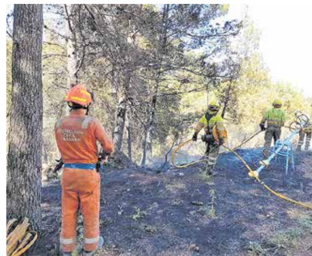
Efectius lluitant contra un incendi.