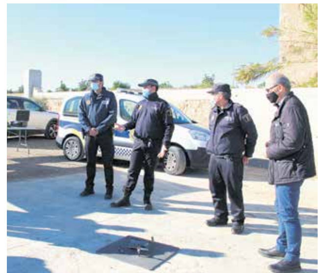
Acto de presentación del dron.