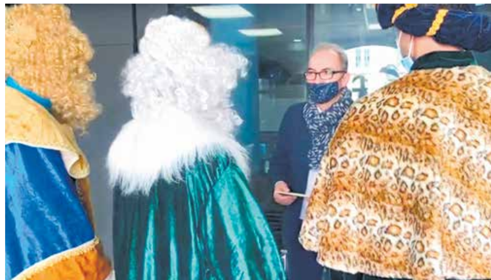
Los emisarios reales entregando una misiva al alcalde de Benaguasil.

dido los emisarios", ha manifestado el Alcalde, que ha agradecido el esfuerzo de Papa Noel y de Melchor, Gaspar y Baltasar, para adaptarse a la nueva realidad y poder estar en Benaguasil estas fiestas manteniendo la misma ilusión y el mismo espíritu navideño de todos los años.