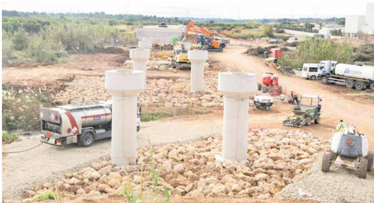
Estado de las obras de la variante de Bétera.

El tramo sobre el que actúa la empresa Bertolín, ad-