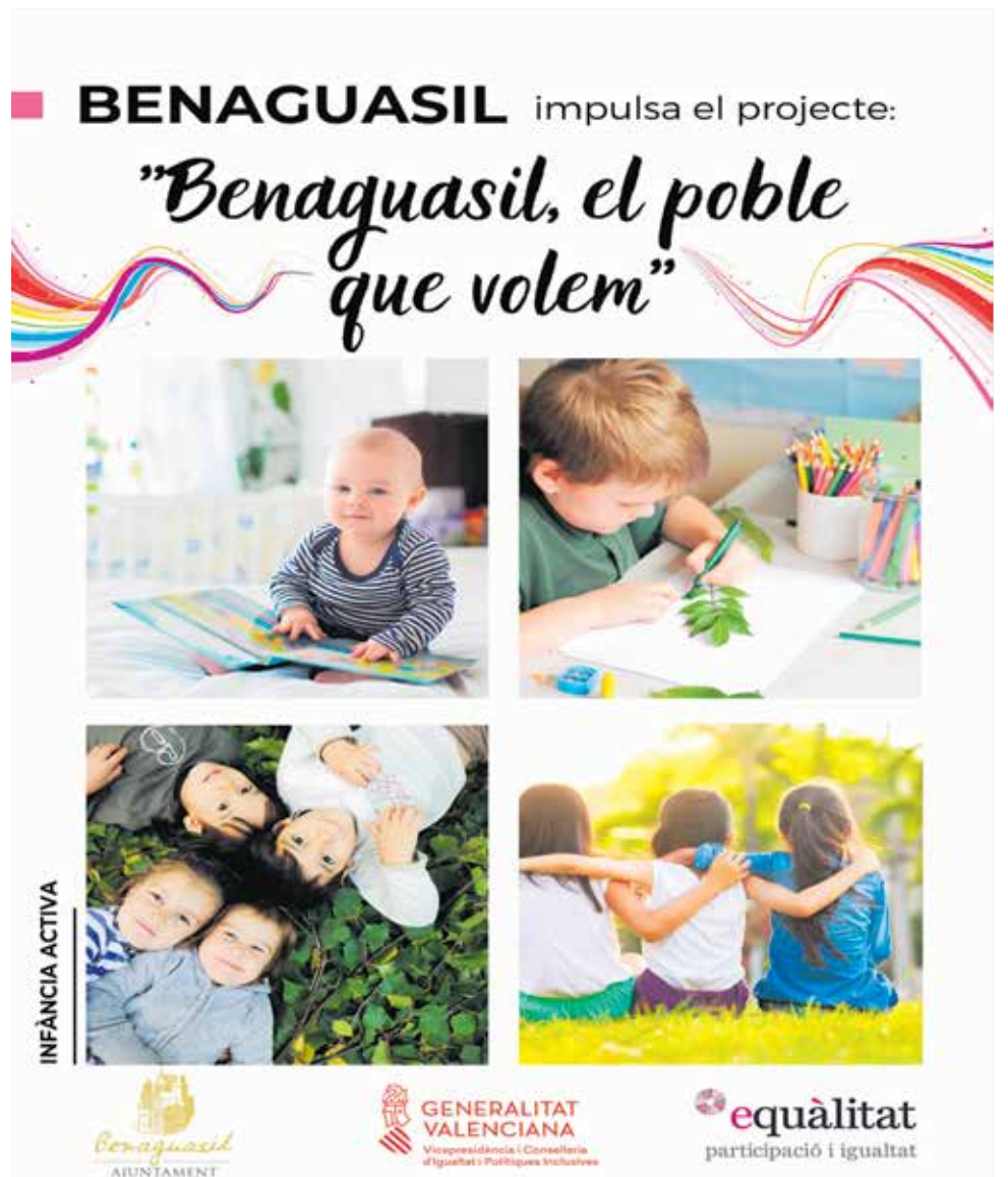
Cartel de la campaña de 'Benaguasil, el poble que volem'.

El actual gobierno local, con el soporte económico de la Conselleria d'Igualtat i Polítiques Inclusives; y técnico del equipo impulsor externo de EQUÀLITAT, participació i igualtat, implementará una serie de acciones con el objetivo de movilizar a la ciudadanía, en especial a las nuevas generaciones.