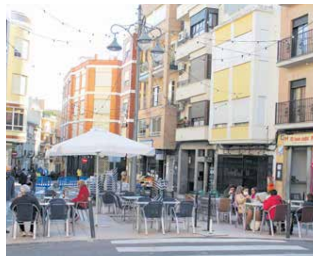
Terrazas de bares en Benaguasil.

Esta medida se suma a la suspensión de la tasa de mesas y sillas 2020, a la rebaja del 25% en la tasa del reciclaje aprobada por el Consorcio Valencia Interior, a los 70.000€ destinados a ayudas directas para el comercio local de Benaguasil, además de formación en materia de digitalización comercial y promoción del comercio local de Benaguasil.