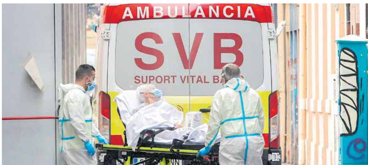
Varios momentos de diferentes situaciones cotidianas en las residencias de mayores.

yoigo MÁSMÓVIL pepephone llamaya* LEBARA