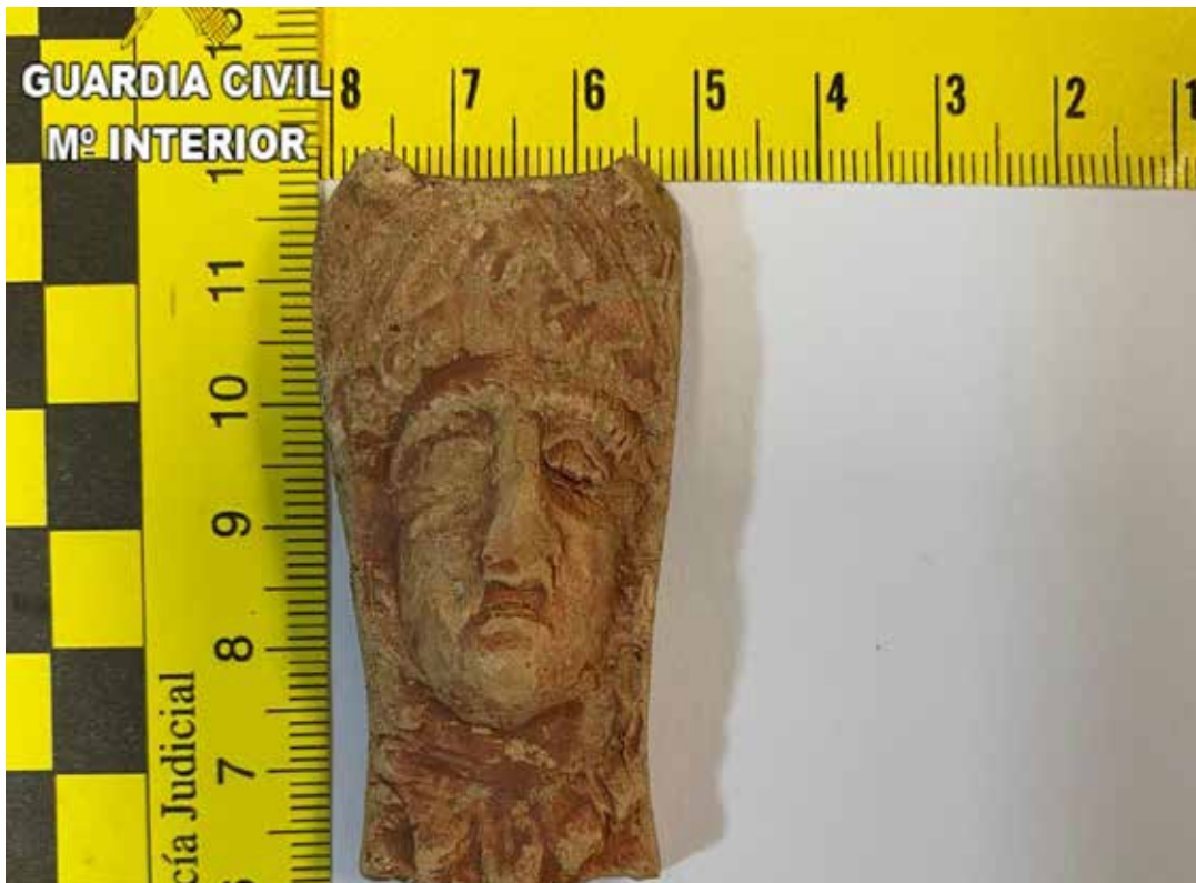
Detalle de la pieza de cerámica encontrada en el municipio.

Actualmente expertos en la materia del Museo de Prehistoria de Valencia, están realizando trabajos con la pieza para determinar la tipología,