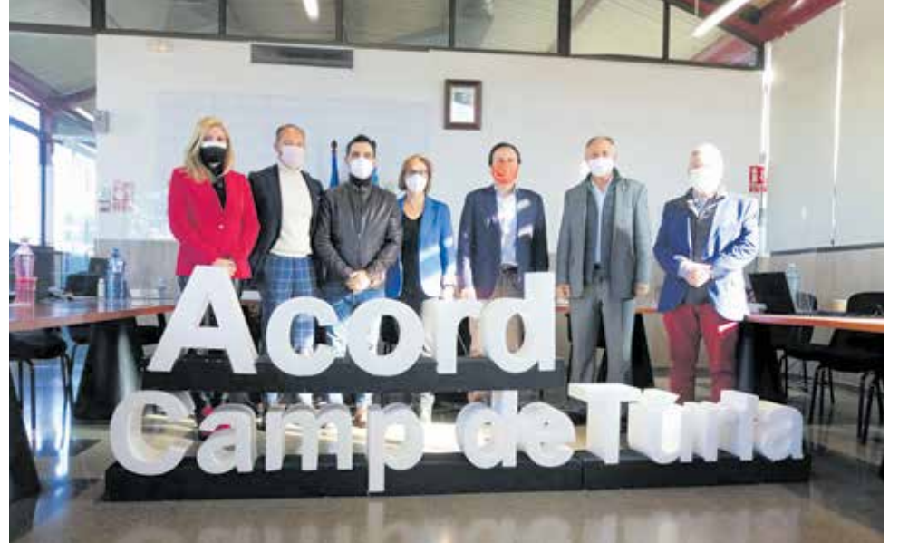
Participantes presenciales de la jornada on line celebrada en la Mancomunitat.