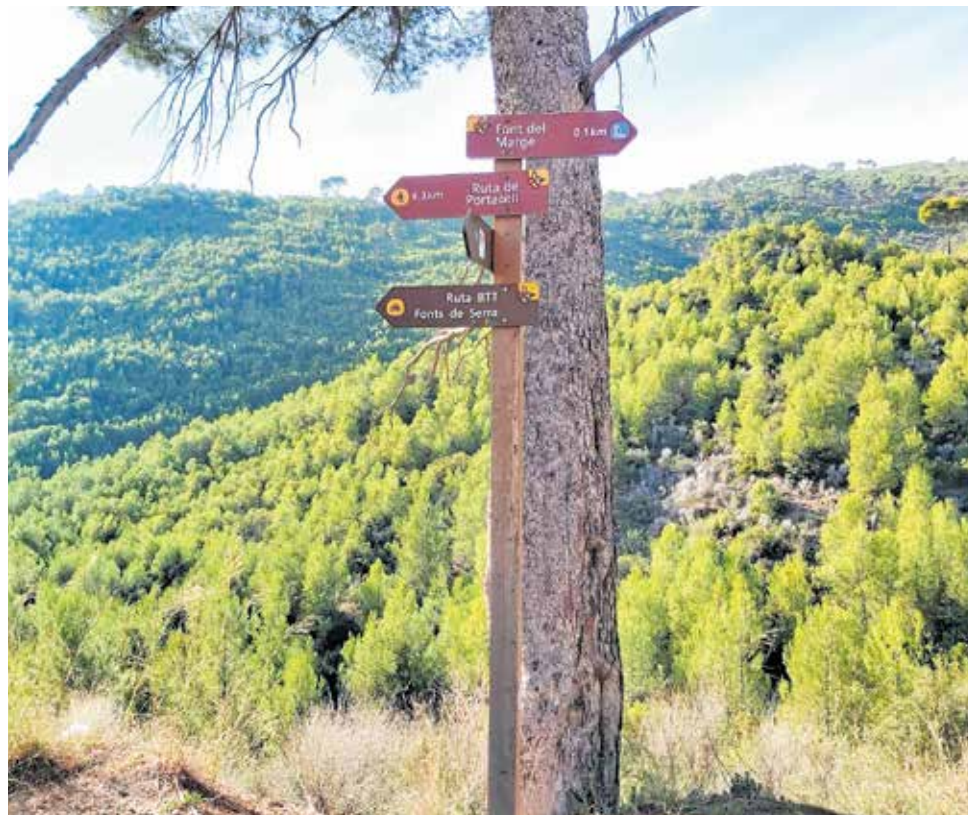
Senyalització de la ruta cicloturista.

En total, 45 senyals repartides en 18 nous postes a més