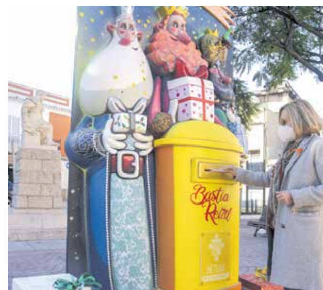
La alcaldesa junto a un buzón real.

A su vez, el Consistorio repartirá entre todos los comercios de proximidad y los edificios municipales cartas autorellenables para que los más pequeños las llenen de ilusión y pidan sus regalos. Además, Los Reyes Magos visitarán el municipio y recorrerán sus calles en una carroza cumpliendo las medidas sanitarias establecidas y esperando que todos los niños y niñas salgan a los balcones para recibirlos.