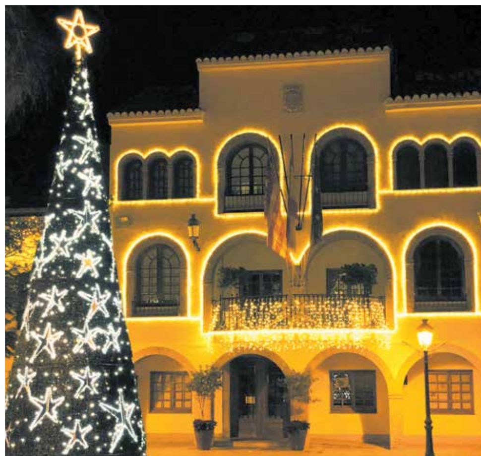
El Ayuntamiento de l'Eliana ya luce iluminado por Navidad.

La agenda navideña arrancó el pasado domingo con el concierto de la Unión Musical de l'Eliana y continuó con el espectáculo infantil 'Pala-brilandia' en la Biblioteca, y los conciertos de Navidad del centro profesional de música IALE y de la Escuela Coral. El plato fuerte llegará el sábado