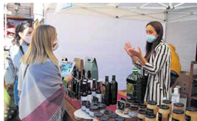
Un instante de la celebración de la Feria.