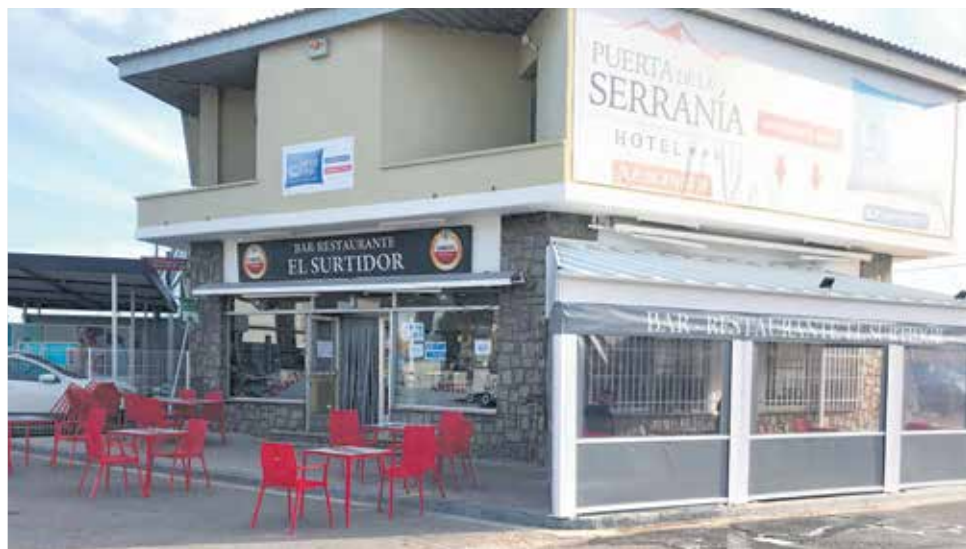
Bar Restaurante El Surtidor, ubicado en el municipio de Casinos.