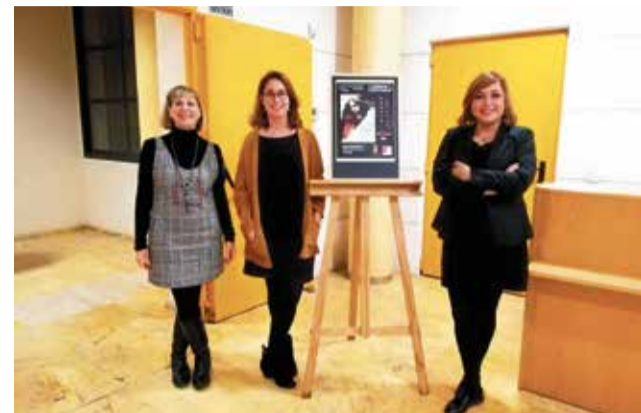
Presentación de la película y la charla.

La película No tengas miedo , que dirigió en el año 2011 Montxo Armendáriz, fue uno de los primeros filmes en tra-