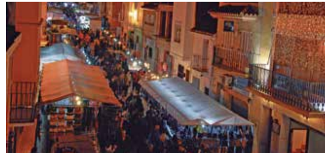
Públic de la Fira de Faura altres anys.