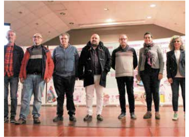
Acto del Consorcio en Estivella.

Previamente al acto, el Consorcio organizó una visita guiada a la planta de Algimia d'Alfara, a la que acudieron diversos alcaldes de la comarca.