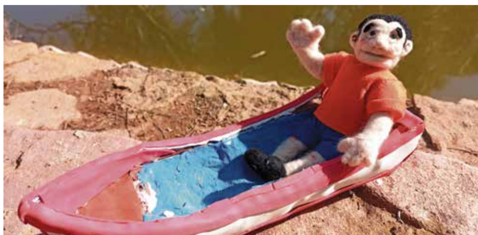
Uno de los personajes creados por Veus Produccions.

Pensar en Veus Produccions es pensar en stop motion . Esta técnica consiste animar figuras recreando su movimiento mediante fotogramas. En concreto, un segundo de vídeo en stopmotion equivale