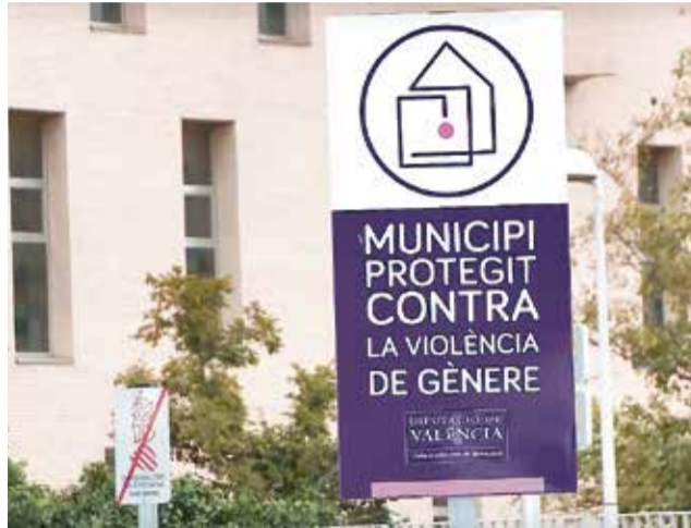
Cartelería de la Diputació de València.

Las responsables de Igualdad de algunos de estos municipios adheridos a esta iniciativa provincial nos cuentan las actividades que han llevado a cabo desde la creación de la red en noviembre de 2018, y que ha supuesto un punto de inflexión a la hora de gestionar este grave problema des-