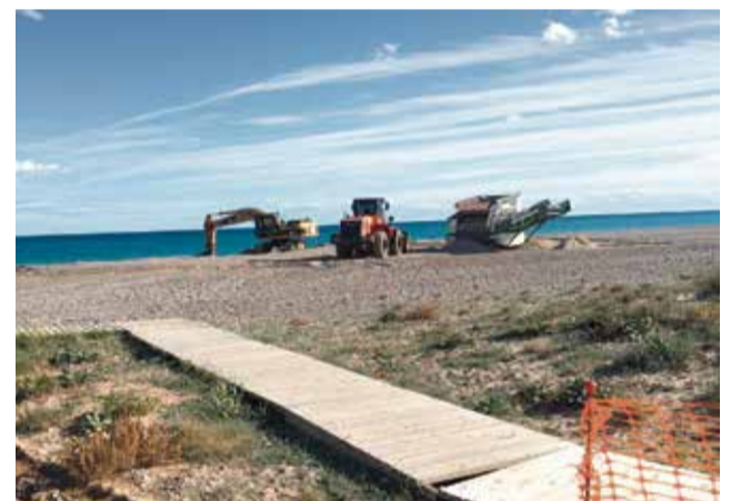
La playa de l'Almardà en los años 70 y 80 (izq.) y en la actualidad (dcha.)

del antes y el después son notables y no dejan lugar a dudas de la rápida transformación del paisaje a causa de la acción humana, que ha in-