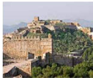
Castell de Sagunt.