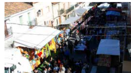
Betlem i fotografies a vista de pardal de les paradetes durant l'edició de la Fira de Faura d'anys anteriors.