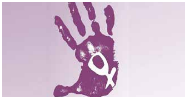
Símbolo contra la violencia de género. / EPDA

“La violencia contra la mujer se manifiesta como el símbolo más brutal de la desigualdad existente en nuestra sociedad, atenta contra los más elementales derechos de las personas y constituye una violación de los Derechos Humanos, que impide a nuestra sociedad continuar avanzando