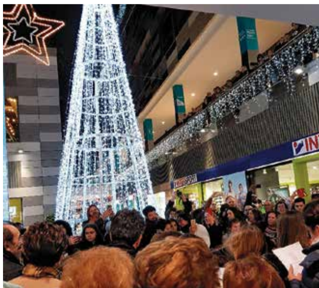
Navidad en el centro comercial l'Epicentre.

Estas Navidades el centro comercial se volverá a llenar de actividades, diversión, villancicos y mucha ilusión.