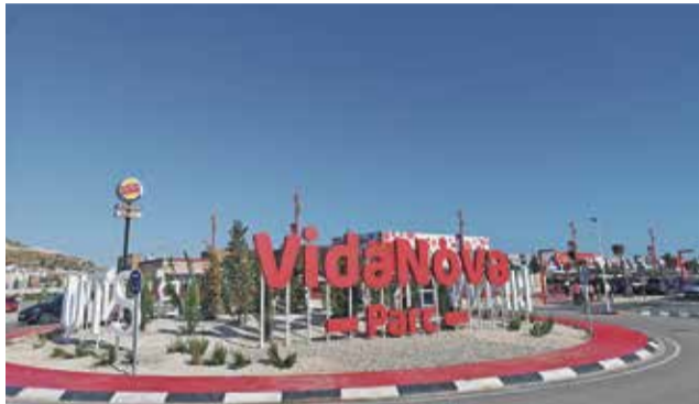
Rotonda de VidaNova Parc. / EPDA

VidaNova Parc cumplió recientemente un año de vida y se ha consolidado como un