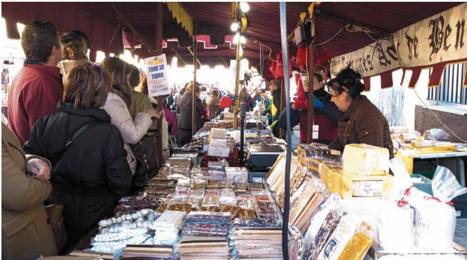
Una de les paradetes a una edició anterior de la Fira de Faura.

UN ANY MÉS, LA FIRA DE FAURA ENCETA EL MES DE DESEMBRE AMB LES MILLORS PARADETES ALS SEUS CARRERS