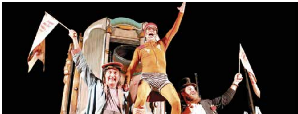
Festival Escena Kids.