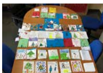
Postales participantes.