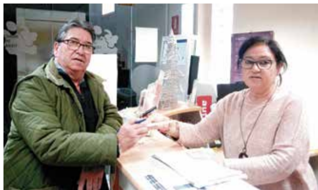
Un usuario recibe el vale descuento.