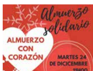
Cartel de la iniciativa.

El Ayuntamiento lanza una propuesta para que los mayores nos se queden solos