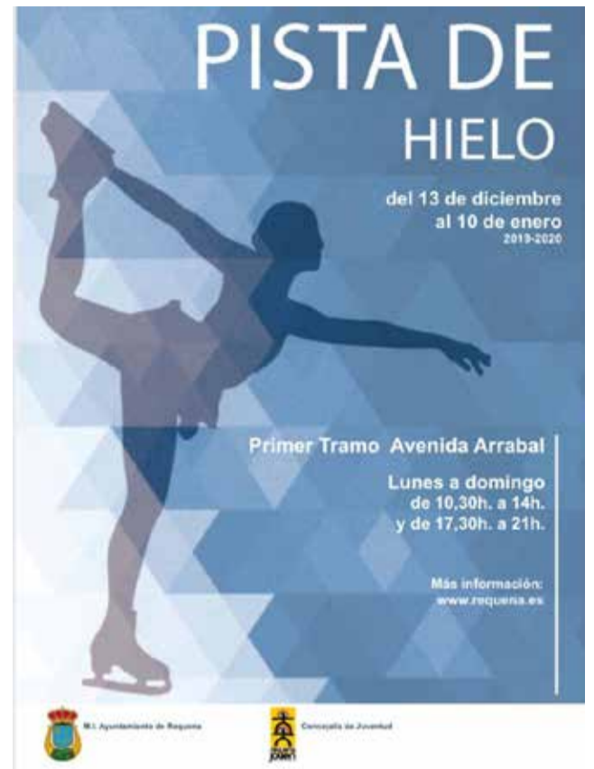
Cartel promocional de la pista de Requena.

La Plaza de El Portal acogió también la caseta, en que la Asociación de Comerciantes y Profesionales de los Servicios de Requena repartió chocolate a todas las personas que acudieron al evento.