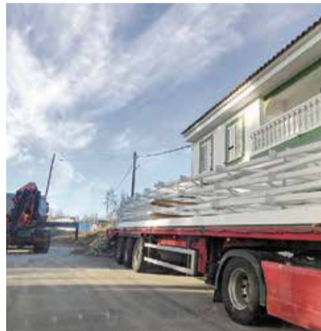
Materiales de la cubierta.