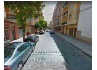
Avda. General Pereyra.