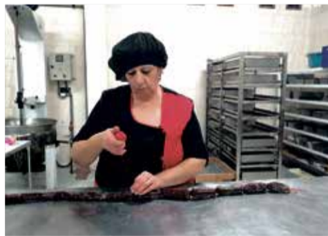
Botifarras de chocolate en Casinos.