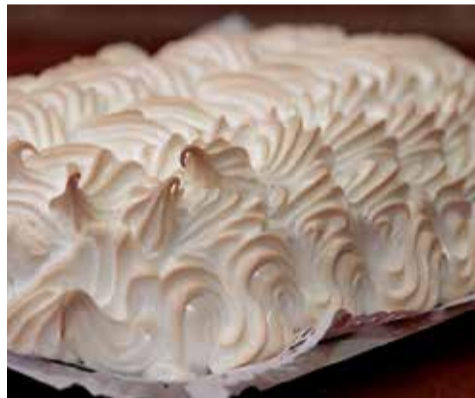
Pastel blanco de Puçol.