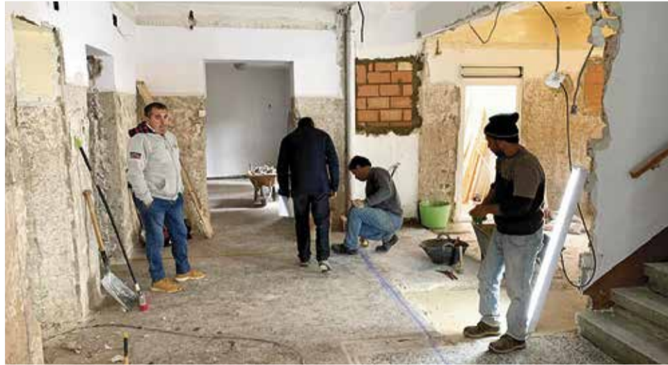
Obras realizadas en el consultorio médico.

Se trata de infraestructuras imprescindibles para combatir la despoblación y para ofrecer unos servicios de calidad a los vecinos que, en muchas ocasiones son personas de edad avanzada y que