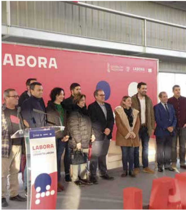
Autoridades en la inauguración del foro.