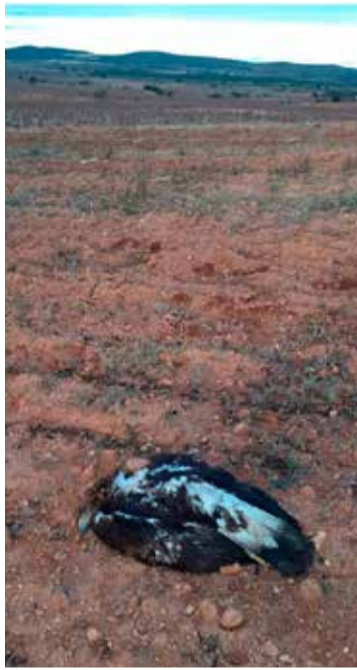
El águila real electrocutada.

Por estas razones, el Ayuntamiento de Camporrobles ha emitido un escrito tanto a la empresa propietaria del tendido, Iberdro-