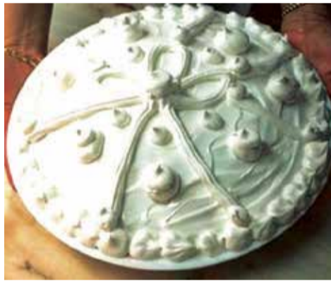
'Plat de Glòria' de Alcàsser. / EPDA