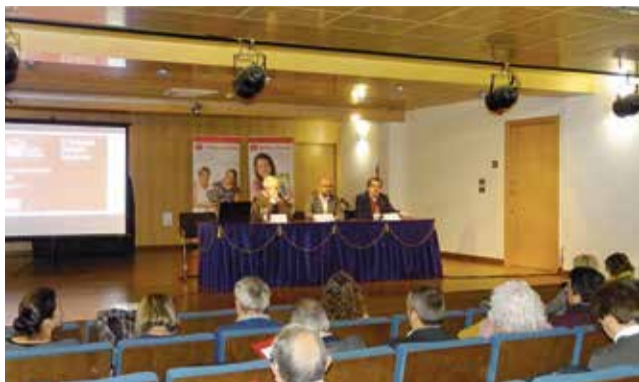
II Encuentro de ciudades lectoras.