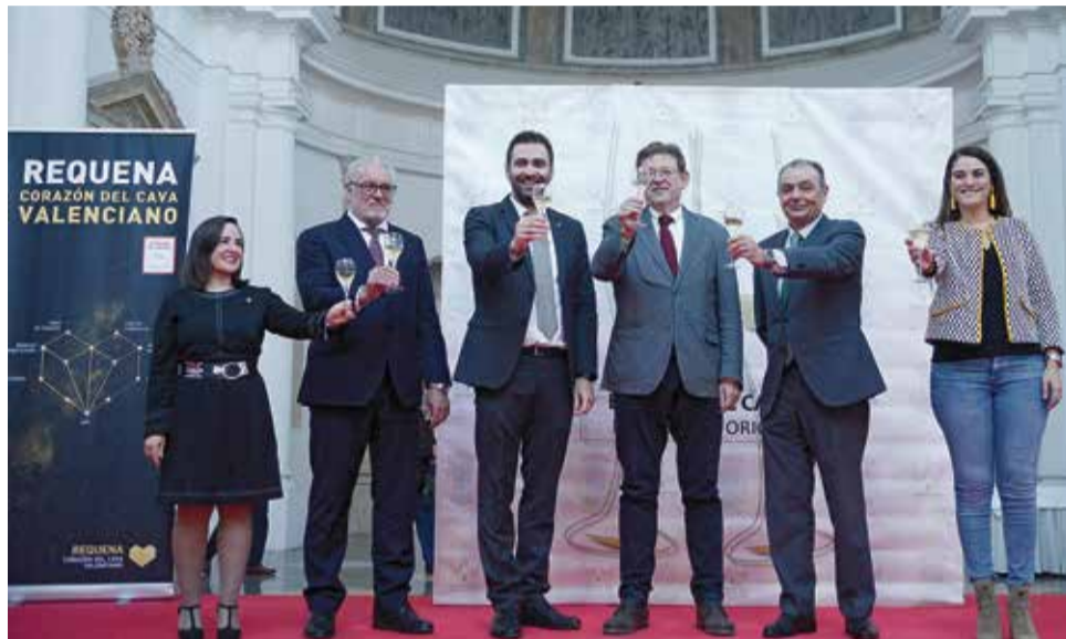
Brindis oficial de la quinta edición.