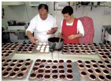
Pasteles 'jericanos'.

caladas con relleno de mazapán -o de boniato en el caso del Pastel Blanco de Navidad-. Un bocado exquisito que se elabora en esta localidad de l'Horta Nord desde hace más de 100 años.