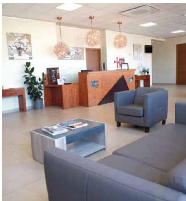
Dependencias de la Funeraria C. Carrascosa con espacios para todas las necesidades.