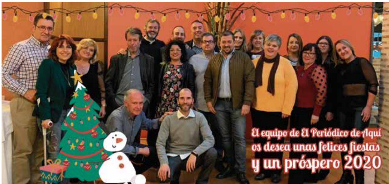
El equipo de El Periódico de Aquí os desea unas felices fiestas y un próspero 2020