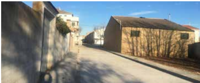
Tramo del vial arreglado.