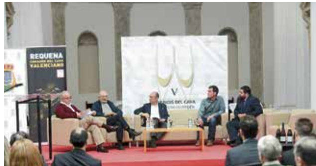
Mesa redonda en Coviñas.

Para cerrar la jornada con la fiesta del V Brindis del cava 'Requena es origen' se contó con la presencia del presidente de la Generalitat Valenciana, Ximo Puig i Ferrer, por quinto año consecutivo, quien destacó que "seguirán apoyando al sector como siempre lo ha hecho la Administración Autonómica". Por su parte, el presidente de la Asociación de Elaboradores del Cava, Emi-