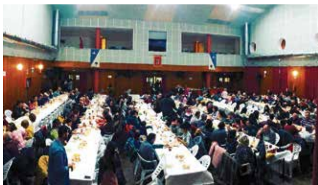
Cena solidaria contra el cáncer de Fuentesrobles.