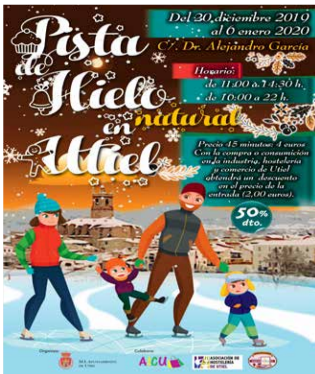
Cartel promocional de la pista de hielo.

La Concejalía de Desarrollo Económico del Ayuntamien-