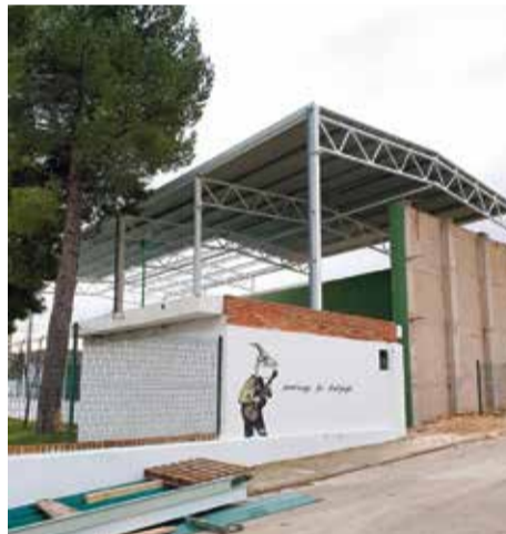
Cubierta instalada en el frontón.

no disponen de medios de transporte o de la posibilidad de utilizarlos para desplazarse a localidades más grandes como Requena, tal y como ha recordado el primer municipio de Chera.