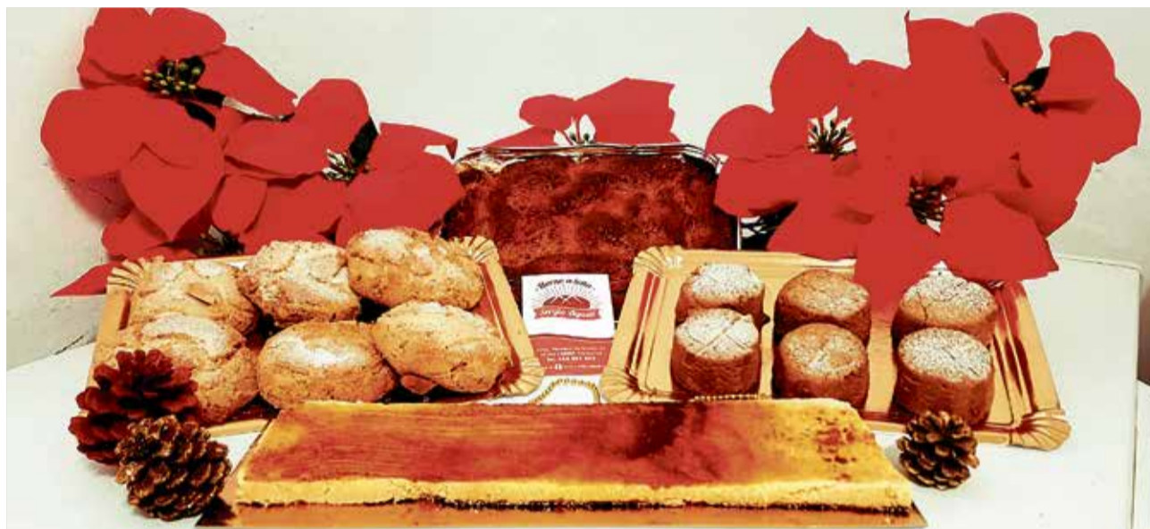
Dulces típicos de la localidad de Chera.

De Paterna a Puçol . Serán pocos los que podrán resistirse ante el conocido como Pastel Blanco . Es un dulce totalmente cubierto de merengue sobre capas delgadas de bizcocho inter-