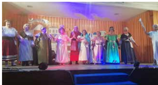
Saludo de la Asociación Amigos del Teatro.

Ya por la tarde, una vez descansados, la música acaparará todo el protagonismo con la Jam de Jazz que tendrá lu-