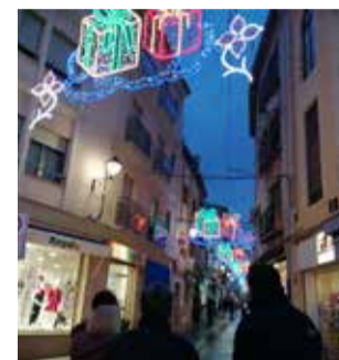
Iluminación navideña.

hielo natural, incluye la nueva iluminación y decoración navideña con tecnología led en el casco histórico y comercial de la localidad.