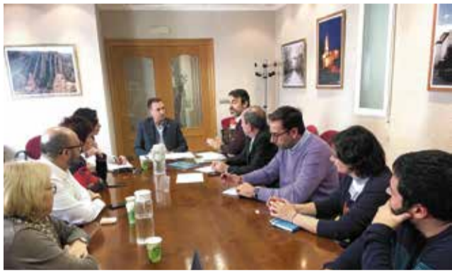
Reunión celebrada en Utiel.