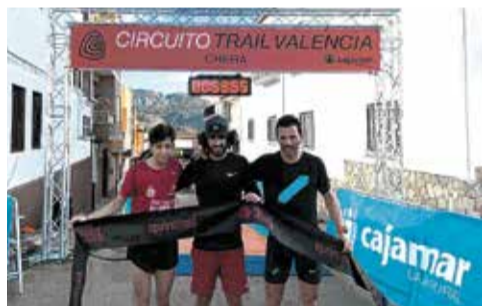
Primeros clasificados del Sprintrail .