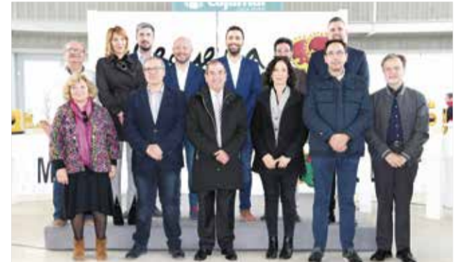
Representantes comarcales.