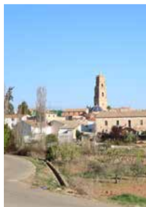
Caudete de las Fuentes.

El objetivo del Consistorio es mejorar la calidad del servicio que se ofrece a la ciudadanía, ya que durante el periodo de gestión externa la empresa concesionaria no ha mantenido las infraestructuras, llegando a un estado de gran envejecimiento en la red.