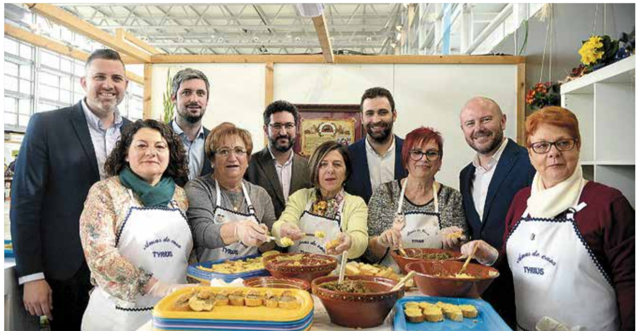
17.000 visitantes disfrutaron del embutido y los caldos de la zona así como de los platos elaborados por las Amas de Casa.