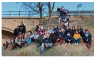
Participantes en la ruta.