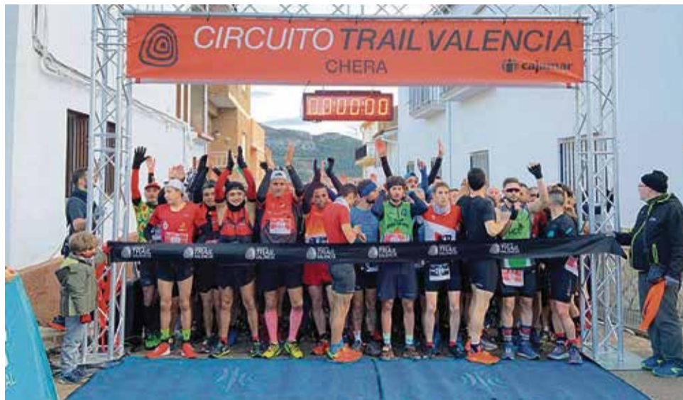
Salida de la prueba.