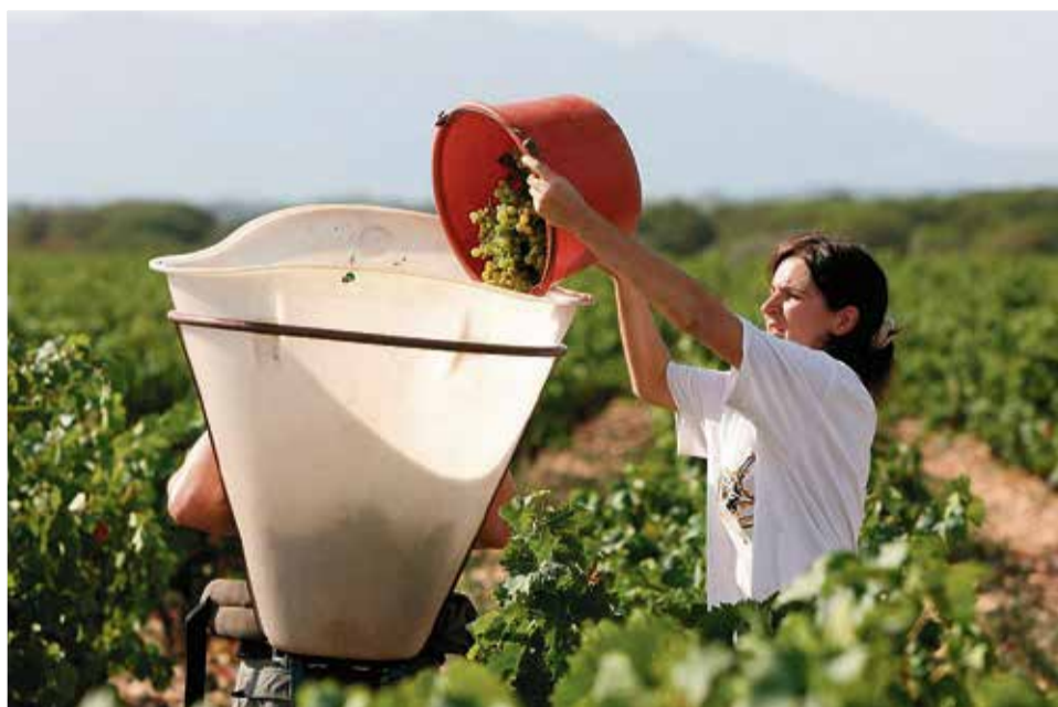
Agricultores recogiendo la uva de las viñas.

El vaivén jurídico de este proceso empezó en 2011 cuando el Partido Popular decidió incluir las tres DO en una única bajo el paraguas DO Valencia.