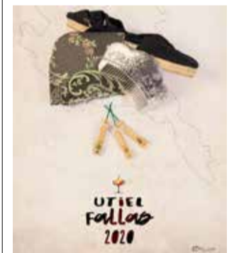
Cartel ganador.