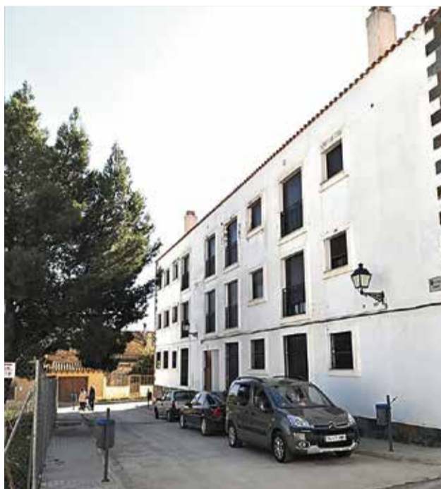
Calle Jardín.

La actuación estaba dentro de las obras de desarrollo del PAI de la calle Jardín para cuyas obras de urbanización solicitó aval al agente urbanizador, como garantía de la ejecución de las obras. Dado que el agente urbaniza-