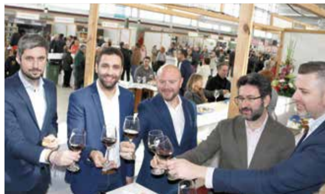
Brindis inaugural de la Muestra.