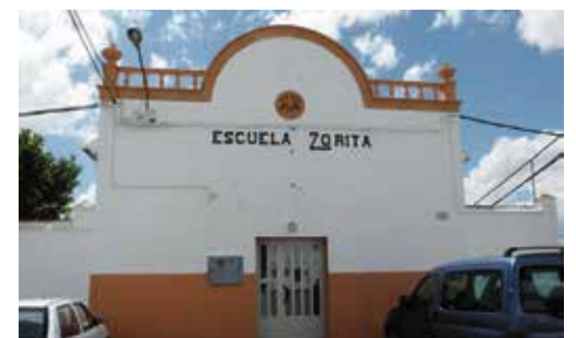
Las escuelas infantiles de la Glorieta y de Zorita.