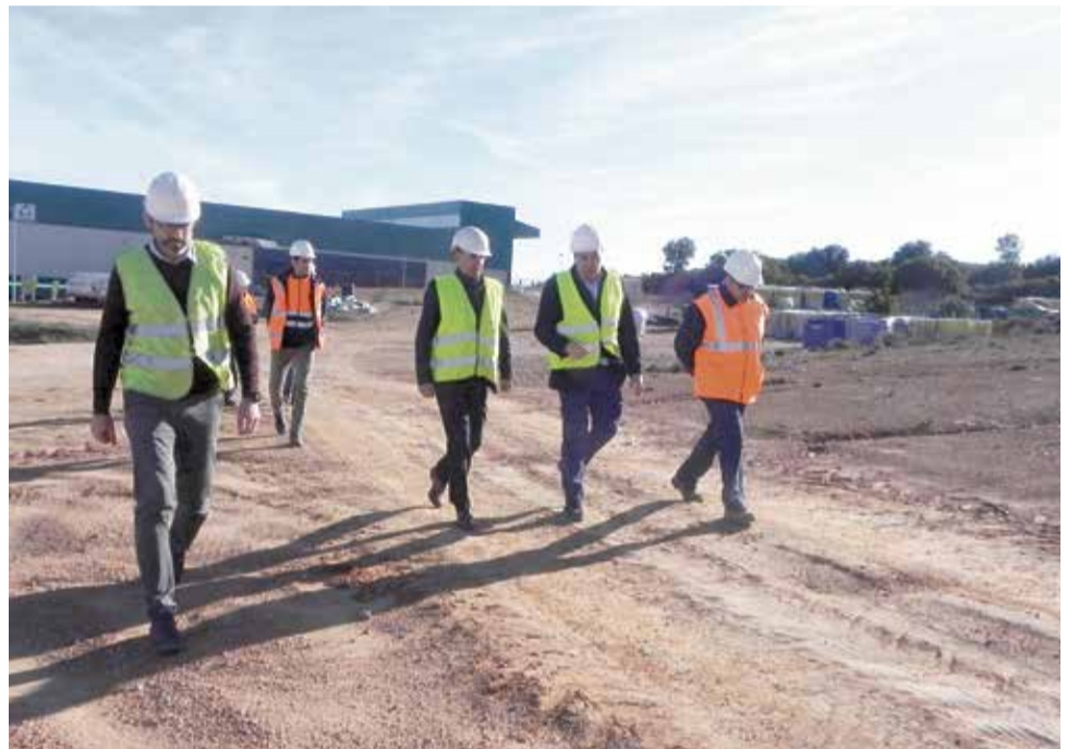
Visita del presidente del CVI a la planta de Caudete de las Fuentes.

El presidente ha visitado también el vaso de vertido donde se le ha explicado el proceso de extracción temprana del biogás gracias a un proyecto pionero que la empresa adjudicataria ha desarrollado. El proceso consiste en la captación y la extracción temprana de biogás durante