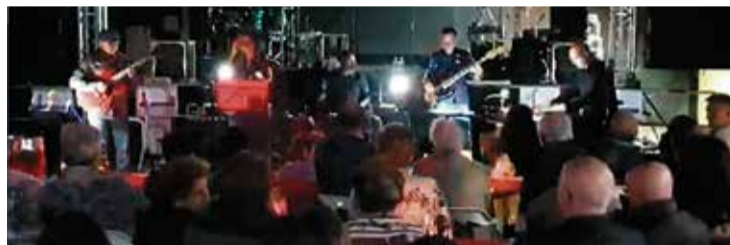
Maridaje Jazz Quintet.