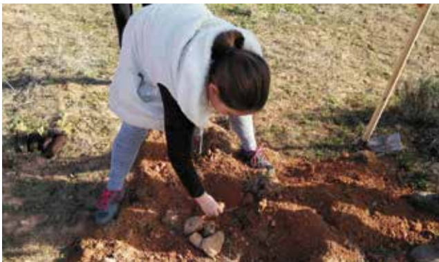
Una alumna planta uno de los 1.000 árboles.