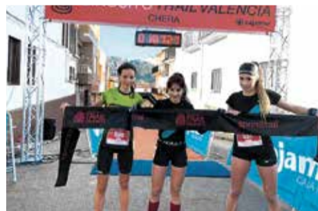
Primeras clasificadas del Sprintrail . / P.J. ES