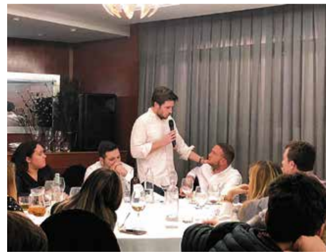
Caballero se dirige a los jóvenes populares.

año se viene realizando por parte del Partido Popular de Requena, para visitar Requena por parte de jóvenes de Nuevas Generaciones de la Comunidad Valenciana, los cuales tienen la oportunidad de disfrutar de nuestra muestra y de conocer los principales productos de nuestra gastronomía.