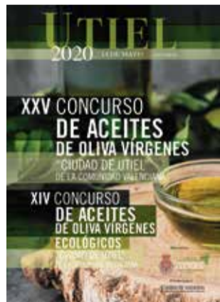
Cartel del concurso.

Las empresas aceiteras interesadas pueden participar con un máximo de 2 muestras y la