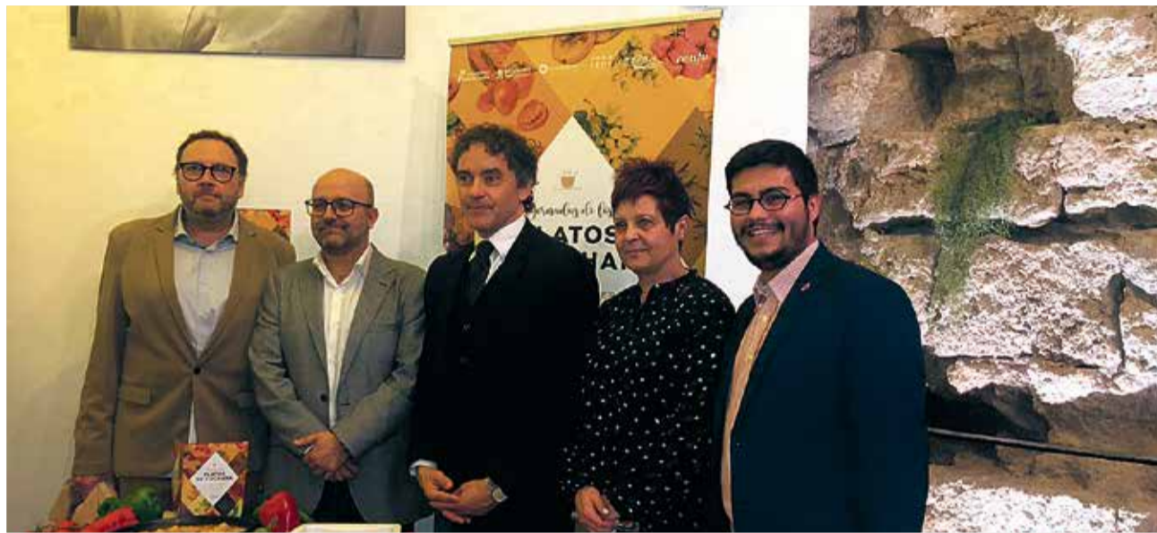
Representantes de Utiel y Colomer en la presentación de la campaña.

Una campaña de promoción gastronómica organizada por la Confederación Empresarial de Hostelería y Turismo de la Comunitat Valenciana (Conhostur) y que cuenta con la colaboración de Turisme Comunitat Valenciana. En