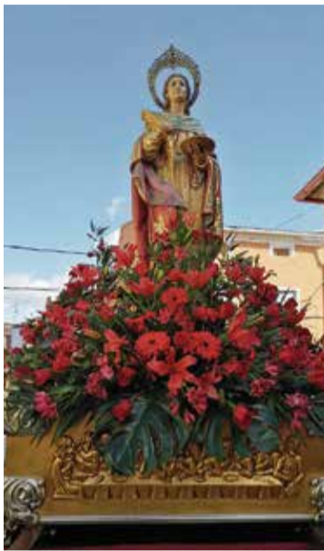
Santa Águeda.

El domingo día 2 arrancó con un Parque Infantil y continuó con el sorteo de reinas y presidentes para el 2020. Finalmente se celebró el concierto de guitarras a cargo de la Asociación de Guitarras y Música Moderna" de Utiel.