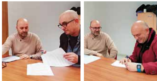
Firma de los convenios deportivos.

mociona la práctica deportiva y la cultura física de la población, especialmente en la etapa escolar, con el objetivo de seguir promoviendo hábitos de vida saludables.