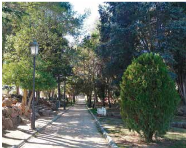
Acceso al Polideportivo.

Esta actuación traerá consigo un gasto de 4.000 euros que el ayuntamiento se ha visto en la obligación de asumir teniendo en cuenta la reincidencia de estos ac-