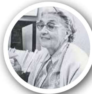
María Moliner.