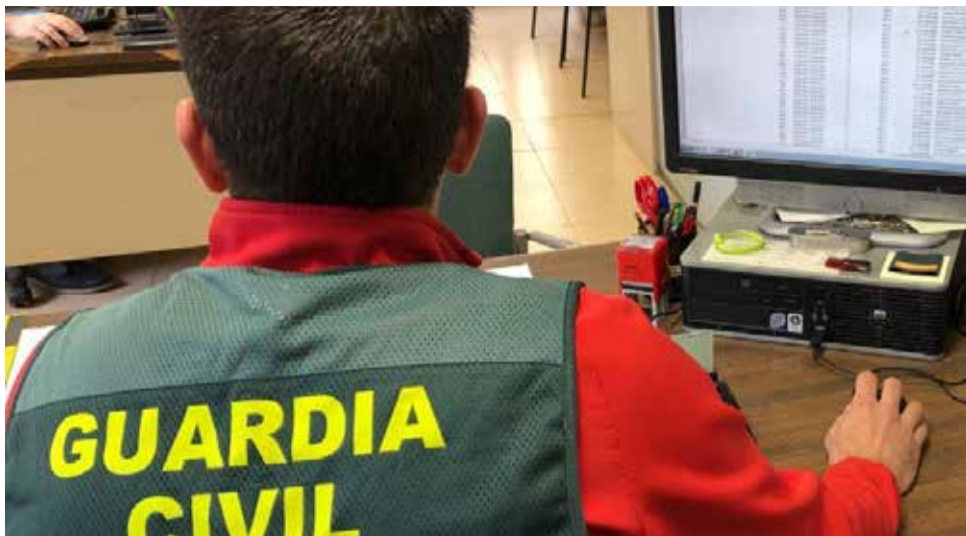
Un miembro de la Guardia Civil durante la investigación.

ENVIABAN CORREOS HACIÉNDOSE PASAR POR EMPRESAS COLABORADORAS