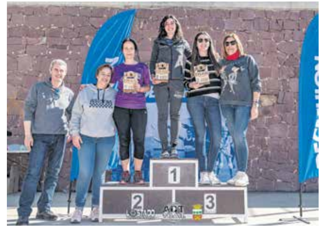
Pòdium local del Trail ADT 2020.