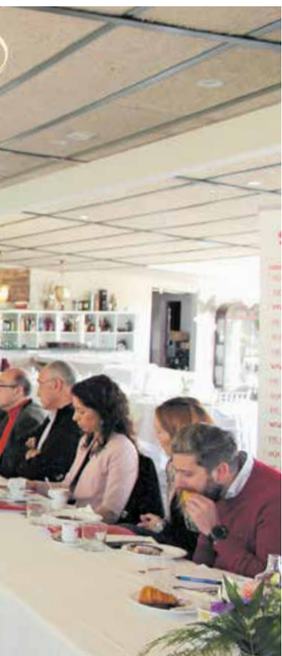
medio ambiente. / EPDA