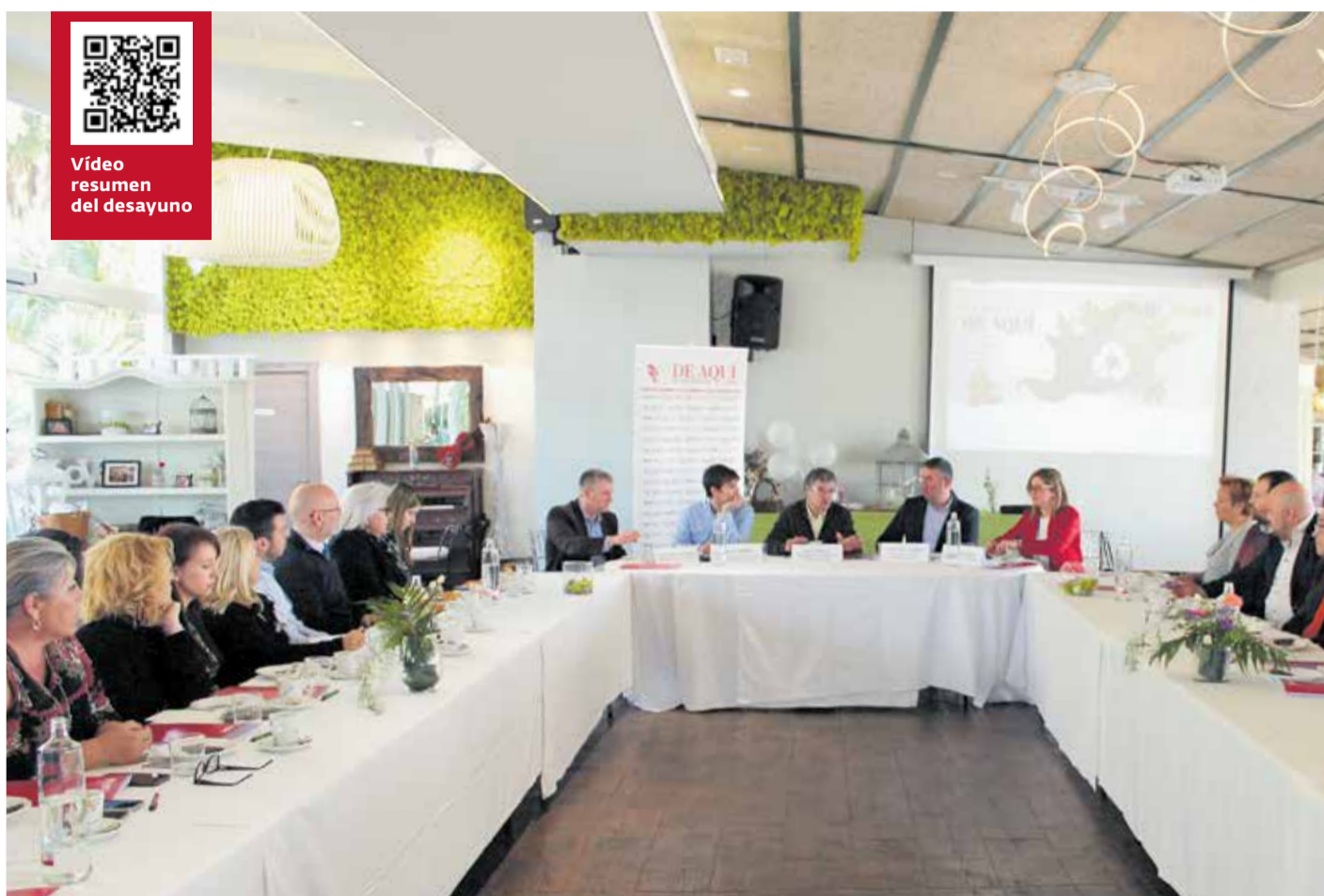
Sesión de los Desayunos de Aquí celebrada en el restaurante El Mirador de Sagunt sobre acciones responsables con el m