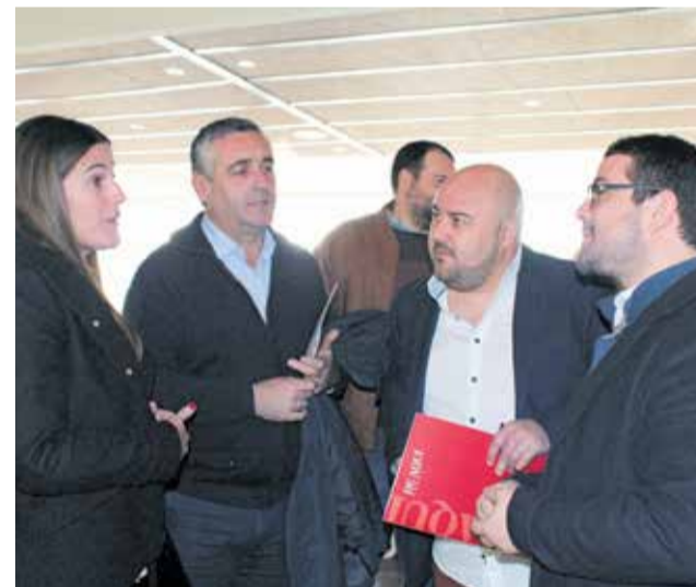
Alcaldes de Albalat, Benavites, Gilet y Algímia. / EPDA