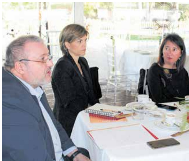
Algunos de los asistentes al evento.