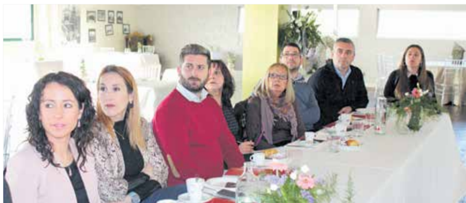
Alcaldes y representantes de organizaciones presentes en el Desayuno.

cha las aguas vertidas al río Turia para prevenir incendios. En tercer lugar, Hidraqua defiende pasar de un modelo lineal a un modelo circular, a través de la autosuficiencia energética, la valorización de los lodos para agricultura o energía y el reciclaje de material de excavación o el aceite doméstico para producir combustible. Finalmente, apuestan por la preservación de la biodiversidad.