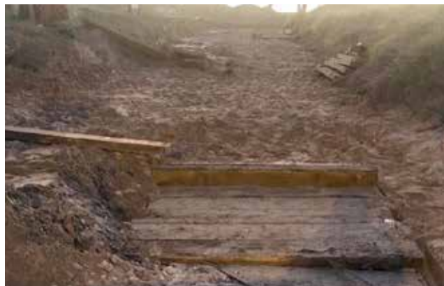
Playa de Canet .

El conflicto se produjo, según ha notificado en un escrito la Demarcación de Costas, por unos trabajos destinados "al drenaje de aguas pluviales. El 10 de febrero el agente mediambiental de la zona detectó que se estaban realizando obras e instalaciones fijas no autorizadas, consistentes en la colocación de una tubería perpendicular a la costa". Tras la oportuna paralización por parte del Ayuntamiento, "el 13 de febrero el agente, en visita por la zona, comprueba la ejecución de nuevas obras de drenaje, esta vez ya finalizadas, carentes de autorización, incumpliendo la orden de paralización anterior", según recoge el escrito del jefe