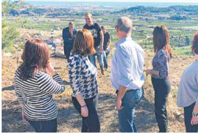
Autoridades en la montaña de la Rodana de Petrés.

La recuperación del espacio de la Rodana ha sido subvencionada casi en su totalidad por la Diputació, con un importe global de 48.398,79 euros, "en una actuación para mejorar el entorno y la imagen paisajística