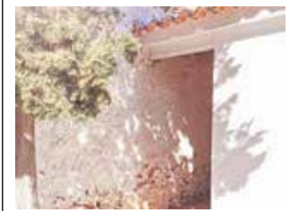
Cementeri de Quart.