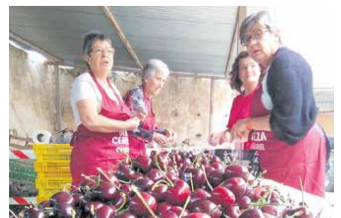
La feria se celebrará los días 6 y 7 de junio

Tanto el reglamento que regula el mercado de la Feria de la Cereza y que es de obligado cumplimiento, como la solicitud (impreso oficial para participar en el mercado), se podrán obtener a través de la web del http://www.caudiel.es/por-tada/feria-de-lacereza , o bien en el propio Ayuntamiento (oficina de registro) en horario de 9:00-14:00h, durante los días que permanezca abierto el plazo de inscripción.