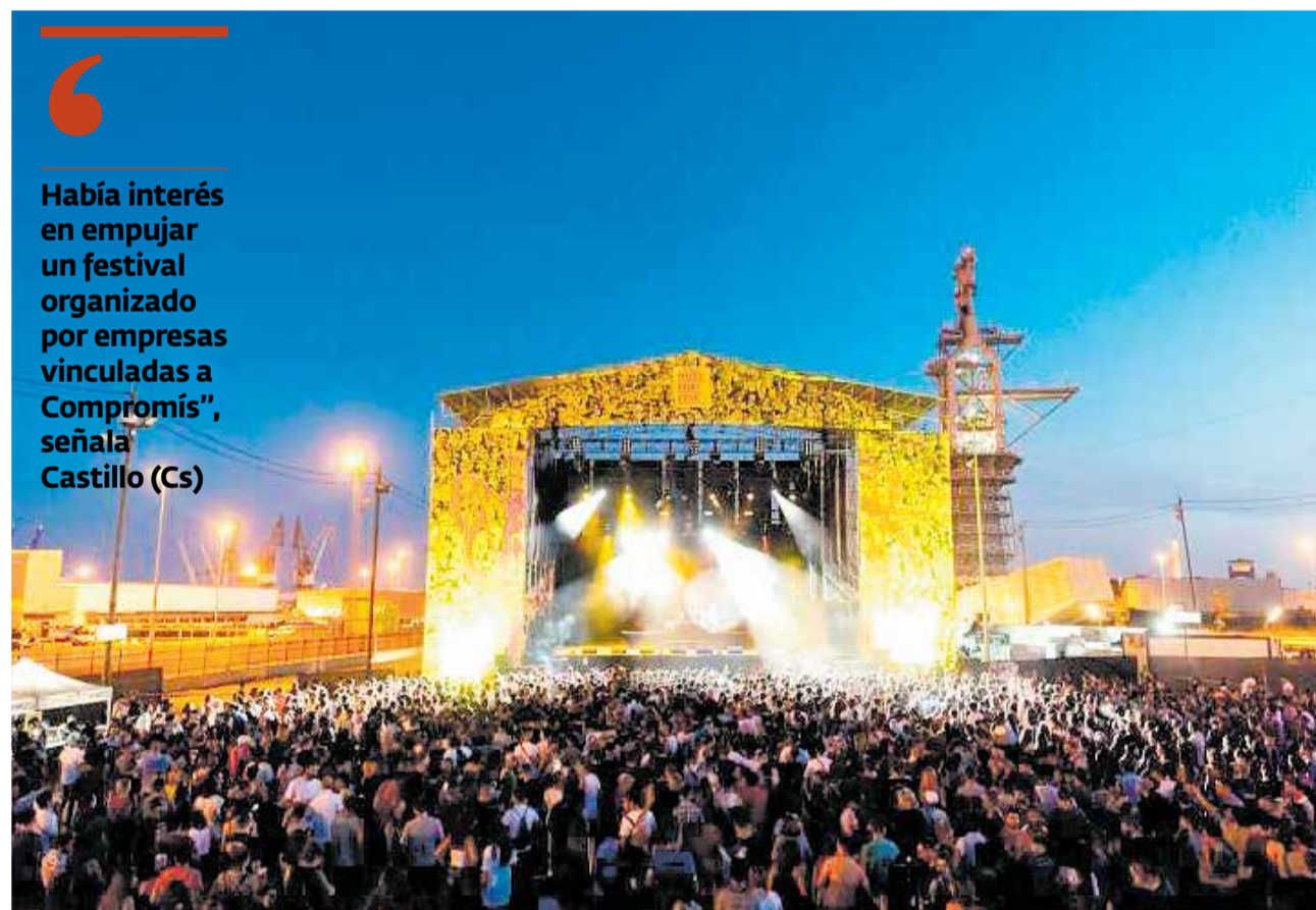
Una imagen del Music Festival Port en 2018.

El Periódico de Aquí ha intentado recabar la versión de Teresa García, impulsora de este festival en la capital del Camp de Morvedre.