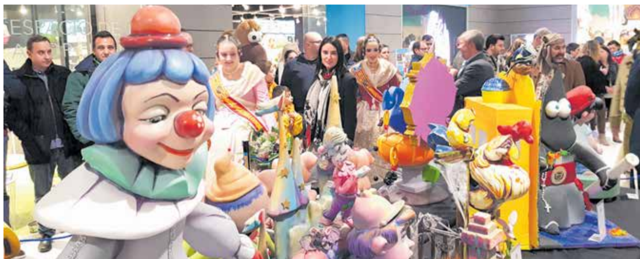
Exposición del Ninot en el Centro Comercial L'epicentre de Sagunt.

La inauguración se realizará el 27 de febrero en L'Epicentre a las 20:00, a este acto asistirá la fallera Mayor de la comarca, la corte de honor, la Federación Junta Fallera de Sagunto y