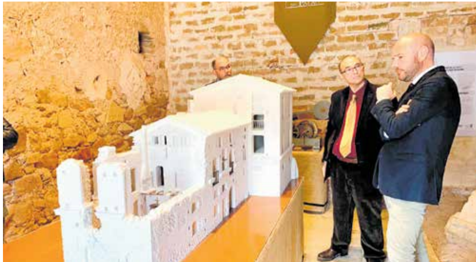
Toni Gaspar (dcha.) junto a Toni Sanfrancisco (izq.).

Tras firmar en el Libro de Honor del Ayuntamiento, el presidente de la Diputació visitó diversos espacios del municipio que han sido objeto de inversiones financiadas con recursos del ente provincial, como la peatonalización de la calle Major o la recientemente finalizada remodelación de la plaza Metge Gimeno. Asimismo, Toni Gaspar visitó el Palau Vives de Canyamàs y la Escuderia del Palau, el nuevo espacio museístico inaugurado por