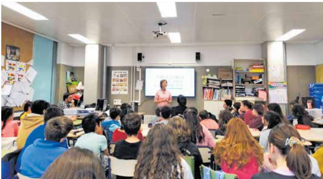
Una de las charlas en centros educativos organizada por Anor.