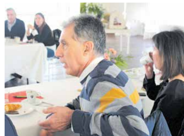
Debate posterior a las ponencias. / EPDA