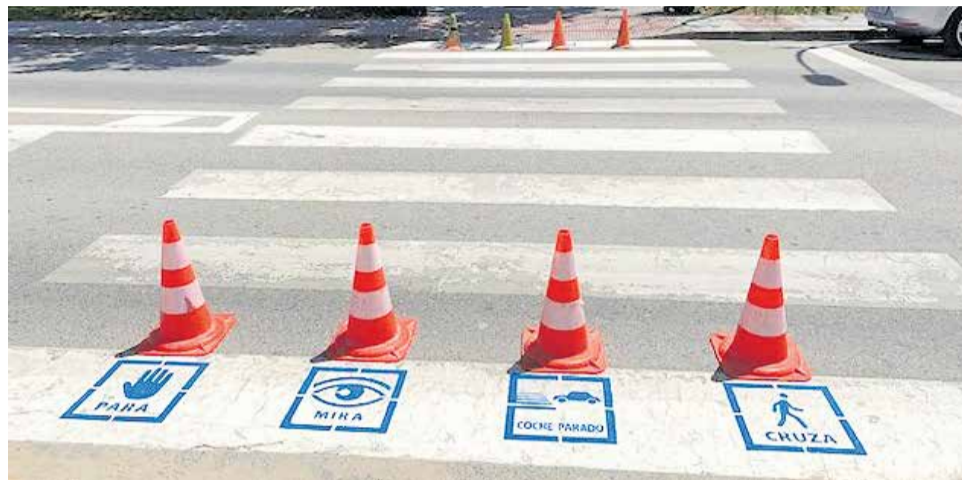
Ejemplo de pictogramas como los que se implantarán en la ciudad.

El Partido Popular, que ha celebrado la noticia, insitó en su momento al equipo de Gobierno a adaptar la ciudad al lenguaje visual