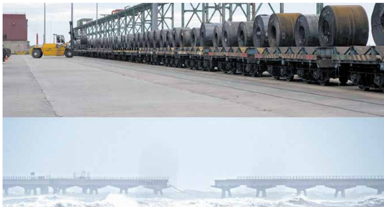
El puerto de Sagunt (arriba) y el estado actual del Pantalán tras el último derrumbe (abajo).

Según González, la única inversión de la APV en esta zona en los últimos años ha