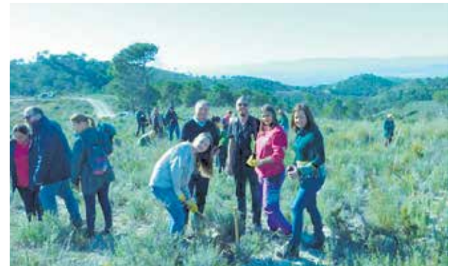
Momento de la jornada medioambiental.