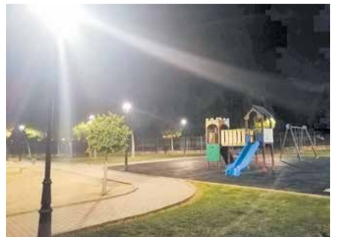
Parque con nueva iluminación.