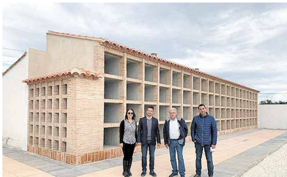
El alcalde, el concejal del área y los técnicos inspeccionan las obras.

Como ya se informó días atrás, además de la necesaria ampliación de los nichos y la reforma de los aseos, Hidrología Precios Desarrollo y Gestión S.L., empresa adjudicataria de las obras, también ha llevado a cabo trabajos de urbanización del terreno, con la pavimentación del suelo, y también de pintura de paredes.