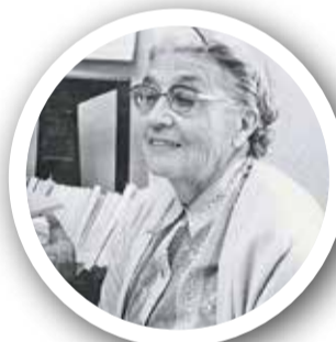
María Moliner.