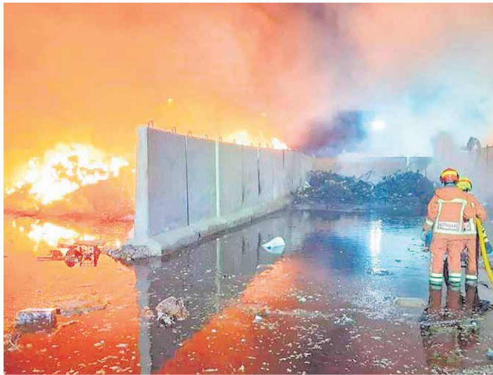
Imagen del incendio en pleno auge.

El fuego afectaba solamente a la campa de residuos voluminosos, en un extremo del recinto, sin provocar daños personales y con escasos daños materiales. De hecho, la planta de Lliria ha continuado en todo momento con su trabajo habitual de gestión de residuos domésticos mezclados y residuos de aparatos eléctricos y electrónicos. En tanto se vuelva a habilitar la campa como consecuencia del incidente, los residuos vo-