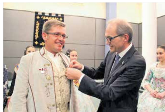
Diferents moments de la celebració de la Crida en Benaguasil.