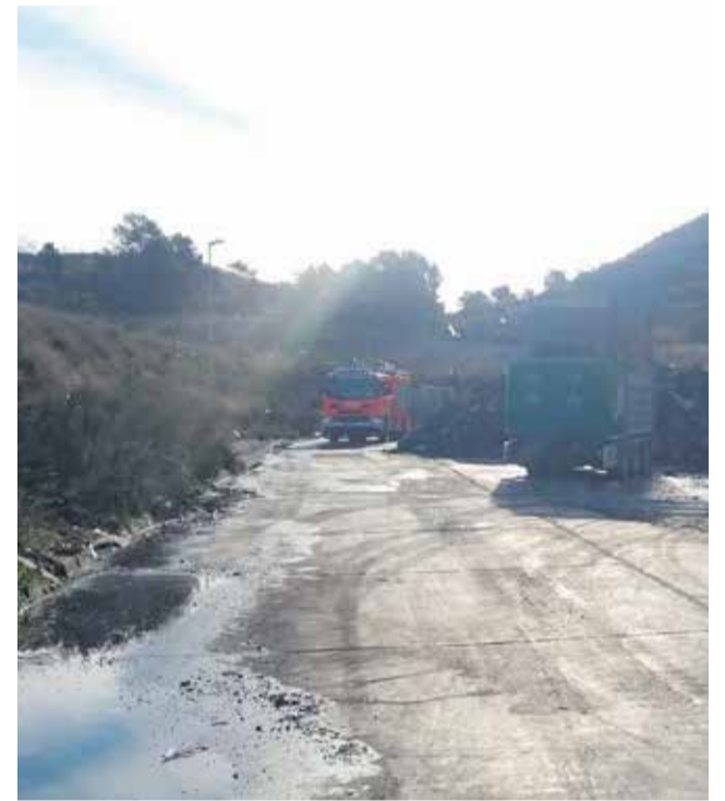
La zona tras la intervención de Los Bomberos.

El incendio quedó controlado en torno a las tres de la madrugada, y los bomberos estuvieron rociando los restos las primeras horas del