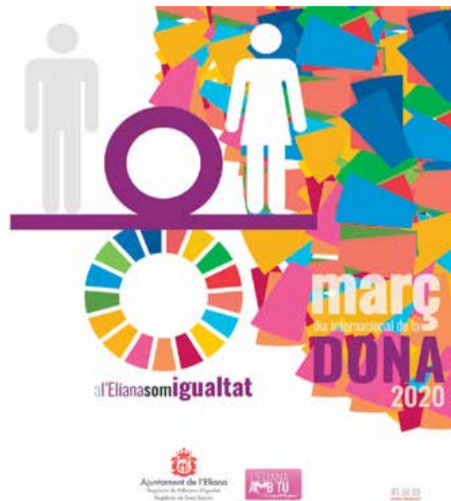
Cartel del Día Internacional de la Dona.

Y para finalizar la semana el domingo 8 de marzo, el