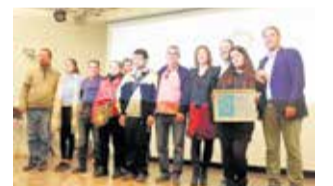
Instante del acto.