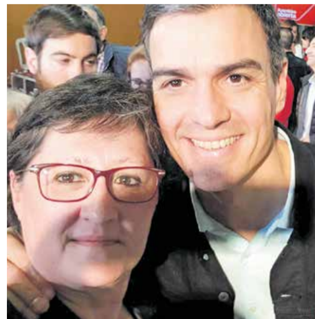
Regina en un acto de partido con Pedro Sánchez.

► Las categorías quieren adaptarse a las posibilidades de expresión artística que las personas tienen a su disposición (cartel, relato corto, audiovisual) y el reconocimiento al trabajo por la igualdad, queremos distinguir a aquellas entidades o personas que en su día a día y ámbito, colaboran por una Pobla más igualitaria. Este año se ha querido adjuntar a estos premios especialmente un reconocimiento al