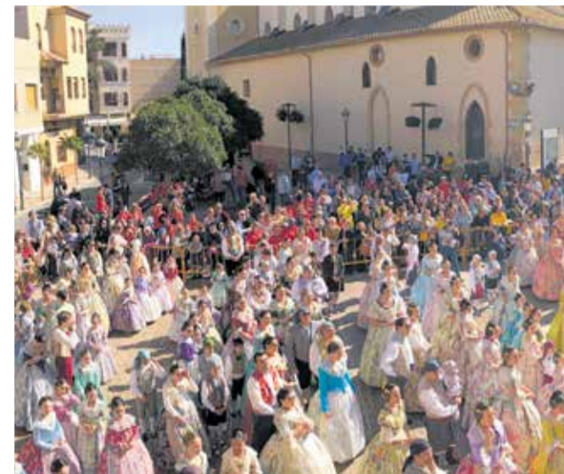
Dos instantes de la Crida celebrada hace unos días desde el balcón del Ayuntamiento de L'Eliana.

do por la Junta Local Fallera de l'Eliana en colaboración con la concejalía de Cultura Festiva, tiene como premio 200 euros y el diploma acreditativo.