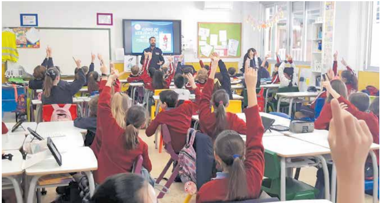
Una de las sesiones informativas que se llevan a cabo en los colegios.

Esta iniciativa, que viene llevándose a cabo en la localidad desde hace 6 años, incorporará