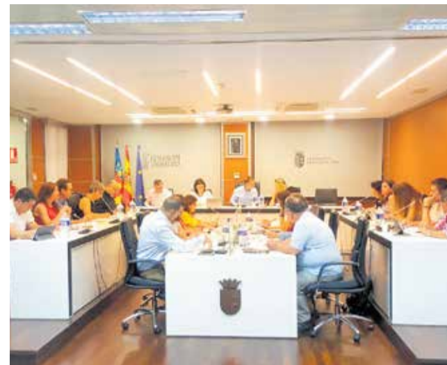
El Pleno del Ayuntamiento de Riba-Roja. / EPDA