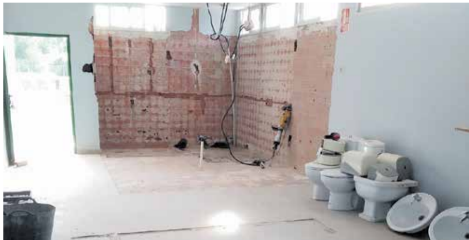
Las obras de acondicionamiento en los baños de la piscina de Olocau.

EL IMPORTE QUE EL CONSISTORIO DEDICA A ESTAS OBRAS ALCANZA LOS 30.000 EUROS