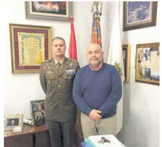
El alcalde con el Delegado de Defensa en la Comunitat.

En definitiva, todas estas actuaciones a estudiar, estarían siempre dentro de los protocolos establecidos en los Planes Territoriales de Emergencias y también en los Procedimientos de Actuación de la Comunitat Valenciana.