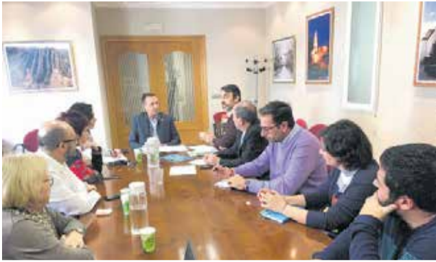
Reunión celebrada en Utiel.