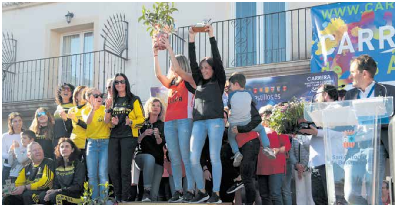
El equipo C.A. Edeta Femenino que se alza con el triunfo.

En segunda posición ha quedado el MSCTV y los terceros han sido los runners del Ajuntament de La Pobla de Vallbona.