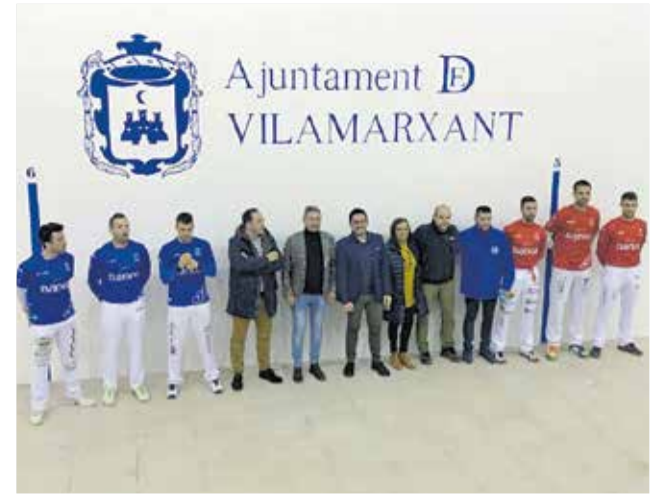
Foto de familia en el día de la reapertura del trinquet.

en el futuro. Mediante acciones como la que hemos llevado a cabo con los centros educativos de la localidad, de acercar la pilota a los más pequeños, queremos que toda la población sienta y se interese por la pilota para que este deporte que es una de nuestras señas de identidad valencianas tenga mucho futuro en Vilamarxant”.