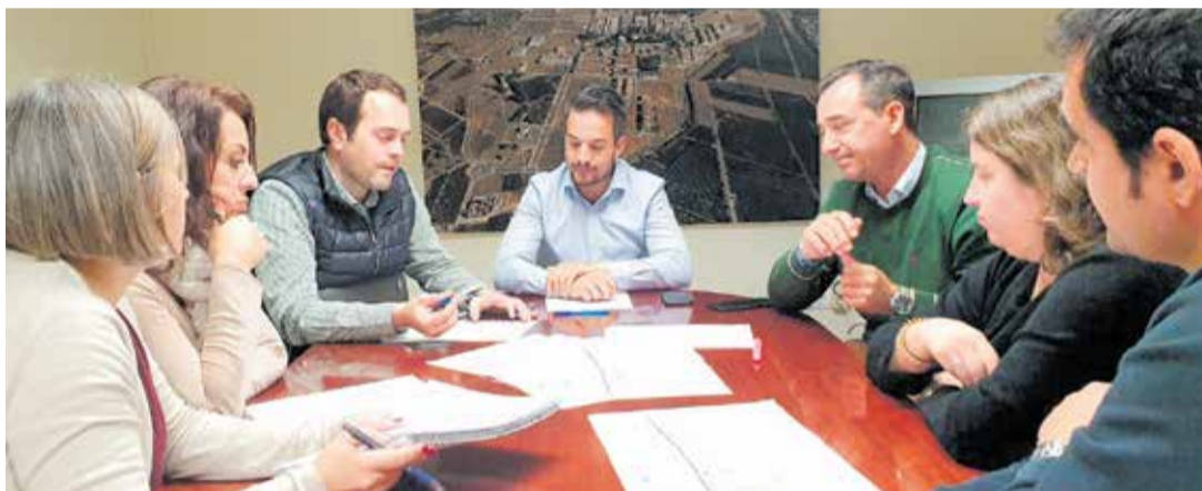
Instantes de la reunión de los alcaldes con los técnicos para reclamar mejoras.

ampliación del puente de Loriguilla, la ejecución de una rotonda a la altura de las vías del tren que alivie