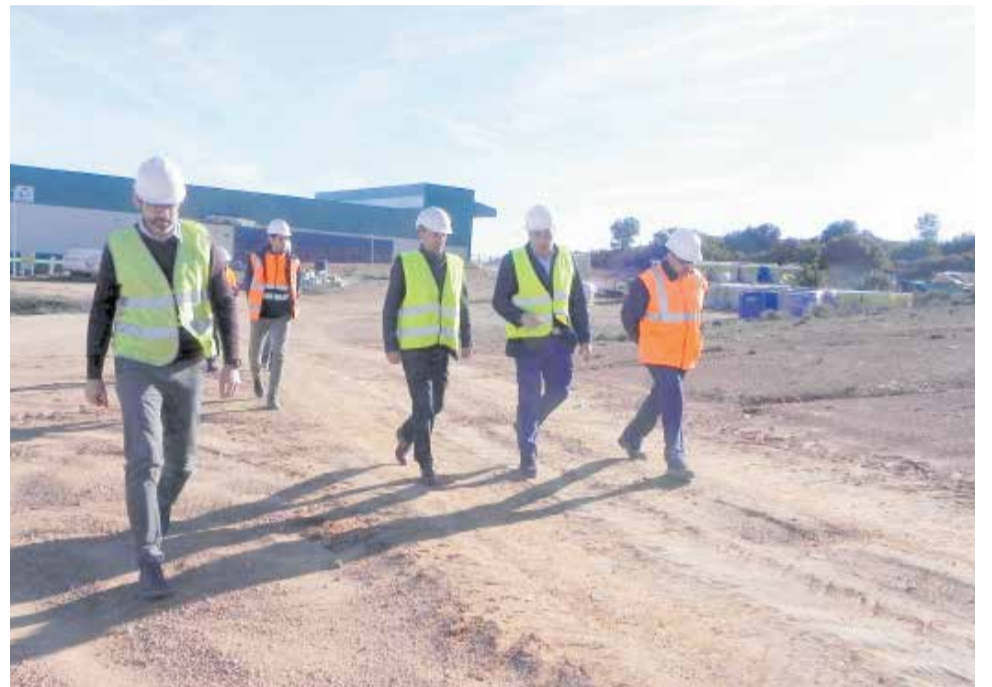
Visita del presidente del CVI a la planta de Caudete de las Fuentes.

El presidente ha visitado también el vaso de vertido donde se le ha explicado el proceso de extracción temprana del biogás gracias a un proyecto pionero que la empresa adjudicataria ha desarrollado. El proceso consiste en la captación y la extracción temprana de biogás durante