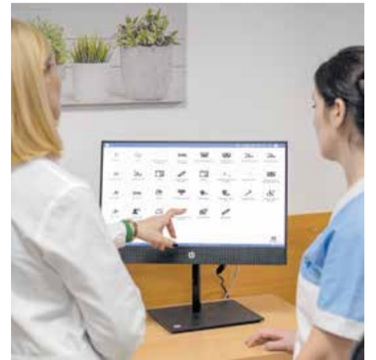
Trabajadores del Centro Residencial Savia València Campanar utilizando las nuevas tecnologías implementadas.

mática Resiplus, estando de esta forma planificadas las tareas de todos sus profesionales y controlando en todo momento la correcta realización de las mismas en cada uno de los tramos horarios establecidos.