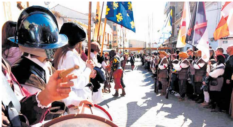
Instant de un dels actes que es varen celebrar a la Setmana del Castell.

Tal com ens indica Rafa Navarro, regidor de festes i patrimoni, els actes han sigut tot un èxit d'assistència, comptabilitzant prop de 900 visites guiades al Castell i un total de 4.300 visitants a la recreació històrica i al campament militar del segle XVI. En concret es