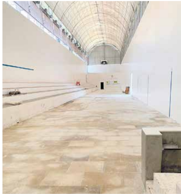
El trinquet municipal recién reformado.