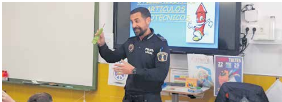
Un agente instruye a los alumnos.

como novedad este 2020 a los alumnos de 1º y 2º de la ESO del IES l'Eliana que recibirán por primera vez la formación adecuada a su edad.