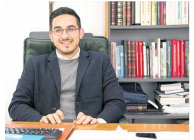
El alcalde de Vilamarxant, Héctor Troyano.