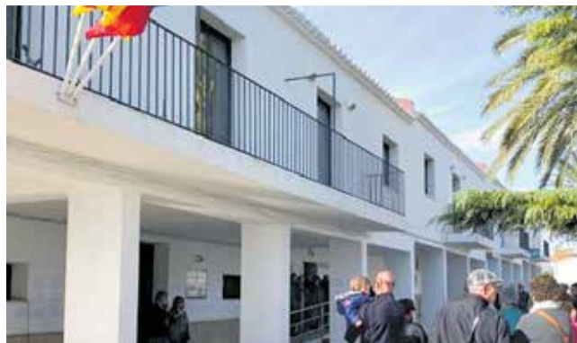
Ayuntamiento de Marines. / EPDA