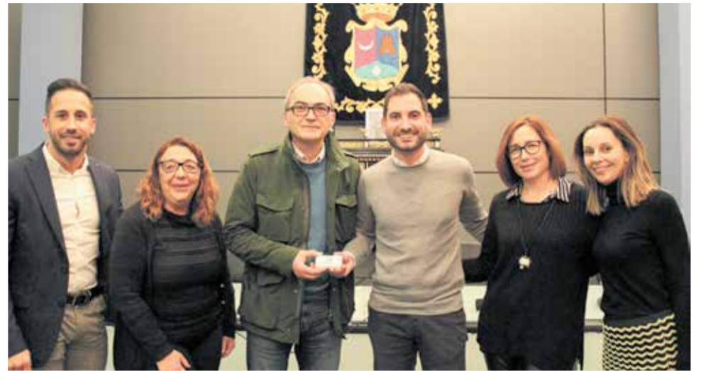
El equipo de gobierno del Ayuntamiento de Benaguasil.

realmente importa: la no subida de impuestos, en la contención del gasto público, en seguir poniendo a las personas en el centro de la acción política local y en definitiva en la mejora en la calidad de vida de los vecinos y vecinas de Benaguasil".