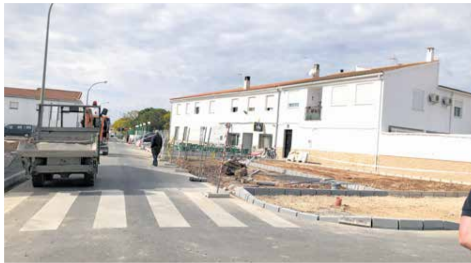
Las obras en las calles de Marines garantizarán la total accesibilidad.

Al mismo tiempo también se han mejorado los recorridos peatonales en la zona. El proyecto que supera los 115.000 euros está siendo ejecutado por Vicente Subiela S.L. y tiene un plazo de ejecución de tres meses. En di-