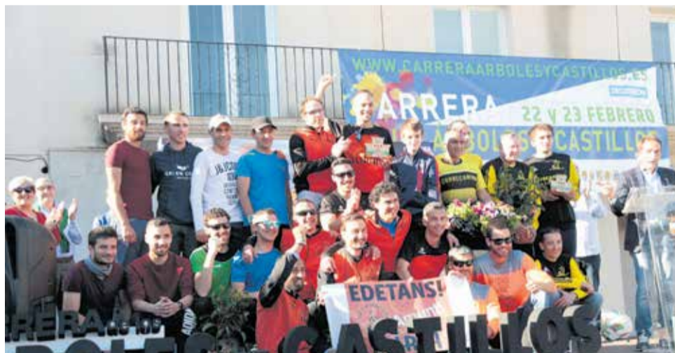
Foto de familia del C.A. Edeta Masculino.

El municipio de San Antonio de Benagéber acogía la paella y entrega de trofeos.