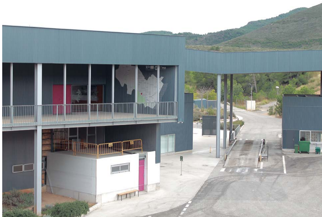
Planta de tratamiento de Algimia de Alfara.

Precisamente el convenio de colaboración de la Gene-