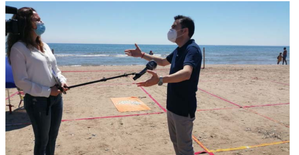
El alcalde de Canet explica la parcelación a una televisión.

rá reducido en un 50% aproximadamente respecto a su capacidad habitual. El ayuntamiento calcula que se podrá dar servicio a unas 6.000 personas en un año en que la prioridad es “velar por la salud y seguridad de nuestros ciudadanos”.