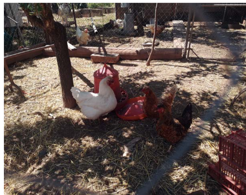
Gallinas en el huerto del convento de Santo Espiritu.