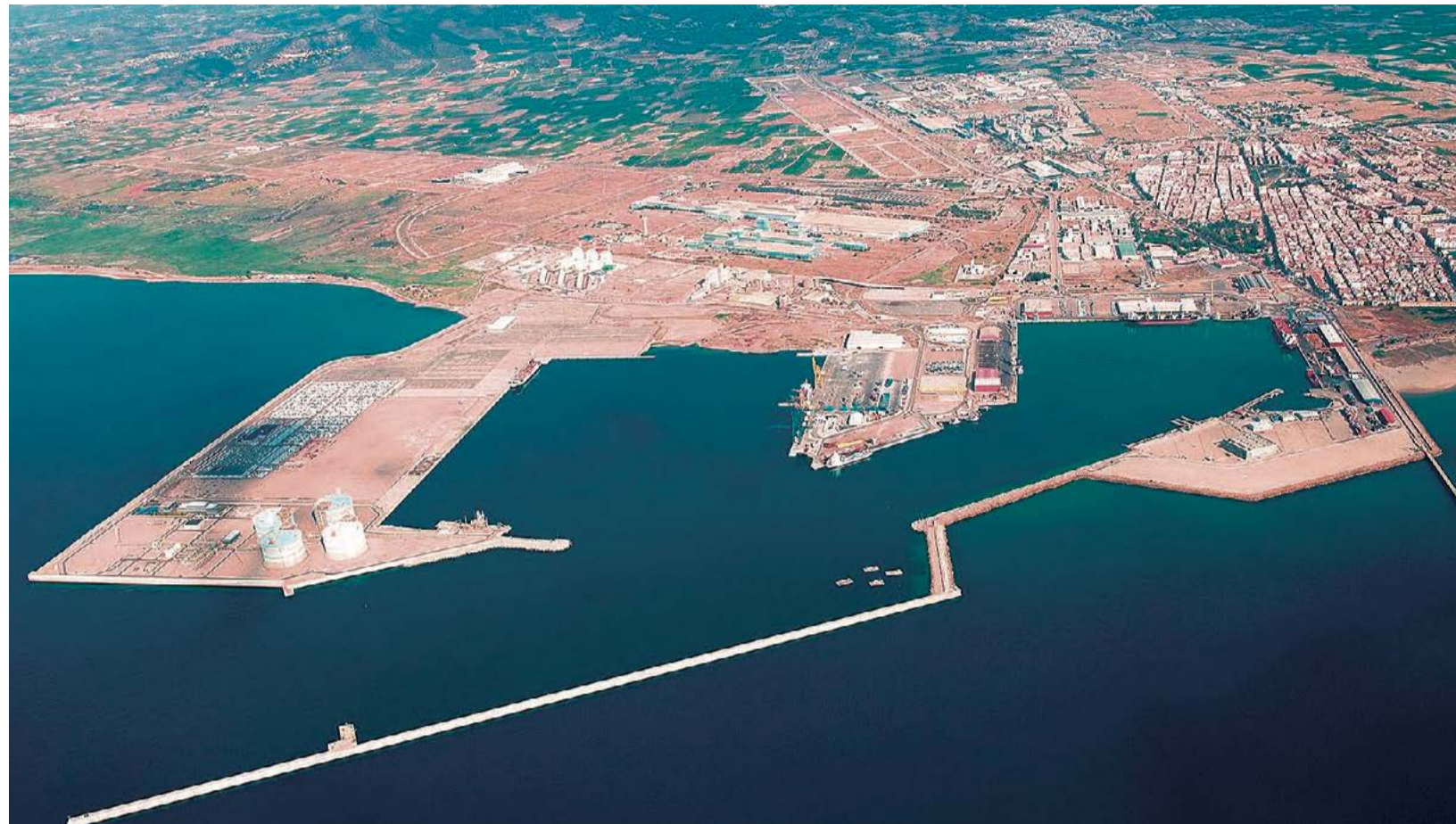
Vista del Puerto de Sagunt

LA APV CONFÍA EN QUE LA INFRAESTRUCTURA QUE SE INICIARÁ ESTE VERANO, REACTIVE LA ACTIVIDAD DE PARC SAGUNT