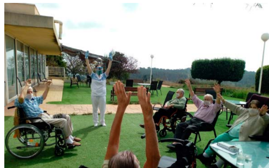
Unos residentes realizan ejercicios en el jardín..

Es una obviedad pero las residencias viven por y para cuidar de los mayores, con mayor ahínco en este escenario tan complejo provocado por la propagación del COVID-19. Una vez ingresan en un centro, el