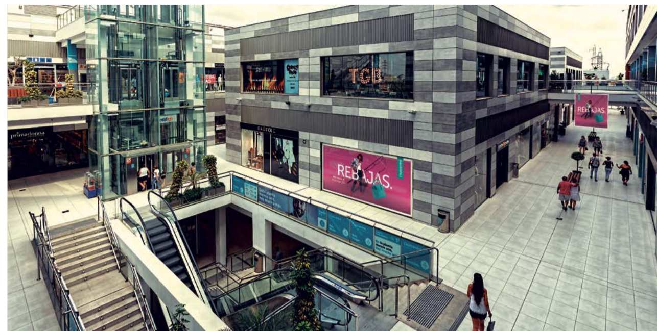
Imagen del centro comercial l'Epicentre.

También se ha colocado cartelera informativa en