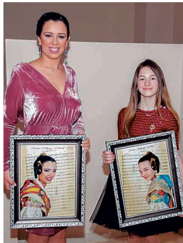
Las Falleras Mayores seguirán en 2021.

"Somos un sector fuerte y juntos conseguiremos superar esta crisis sanitaria y después resurgiremos para celebrar como sólo nosotros sabemos las Fallas 2021, concluyen.