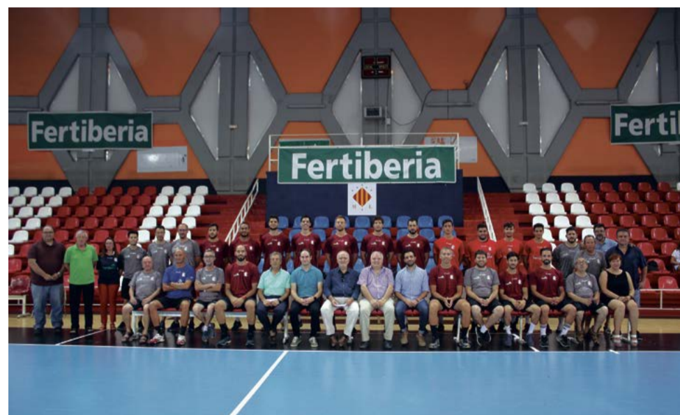
La plantilla del Balonmano Fertiberia Puerto de Sagunto.

Este año la negociación se ha visto retrasada por varias circunstancias. En primer lugar, la crisis generada por la COVID-19, que ha obligado a Fertiberia, al igual que al