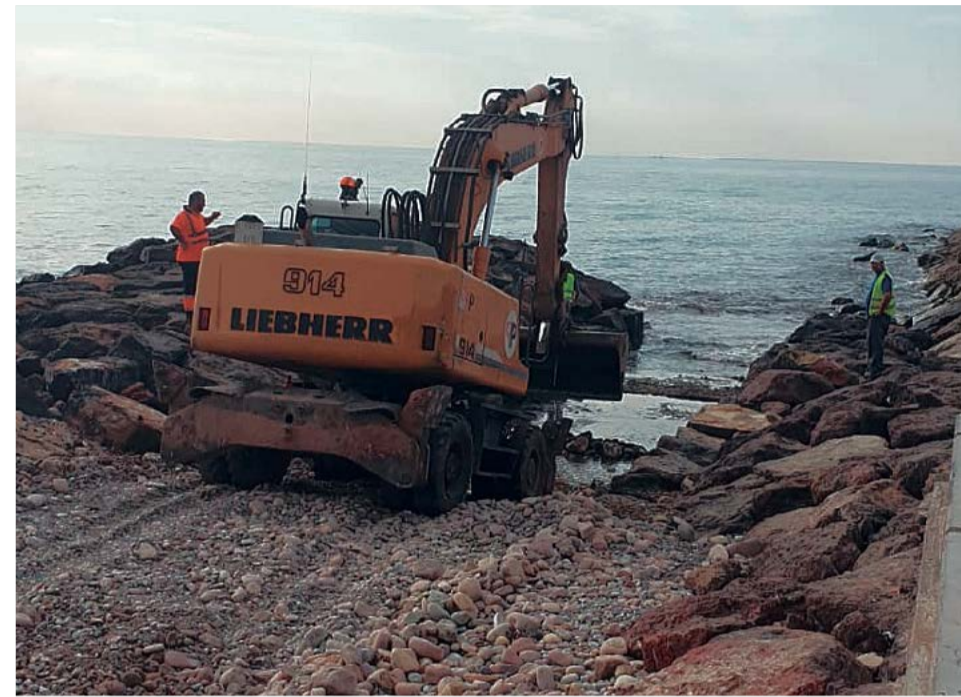
Los trabajos para retirar la grava ya se han iniciado.

Gil añade que, debido a los temporales de levante que transportan materiales como grava, «habrá que hacer ta-