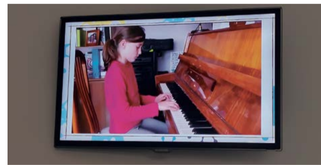
Las audiciones se retransmitieron por YouTube.

forma distinta de enseñanza, basada en el uso de las TIC, no está reñida con un aprendizaje de calidad".