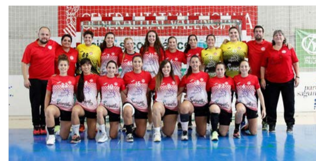
Un partido del Fertiberia y el equipo del BM Morvedre.

“La temporada que viene la ciudad puede tener dos clubes de balonmano en la élite, por mérito deportivo”, señalan desde el Fertiberia Balonmano Puerto Sagunto.