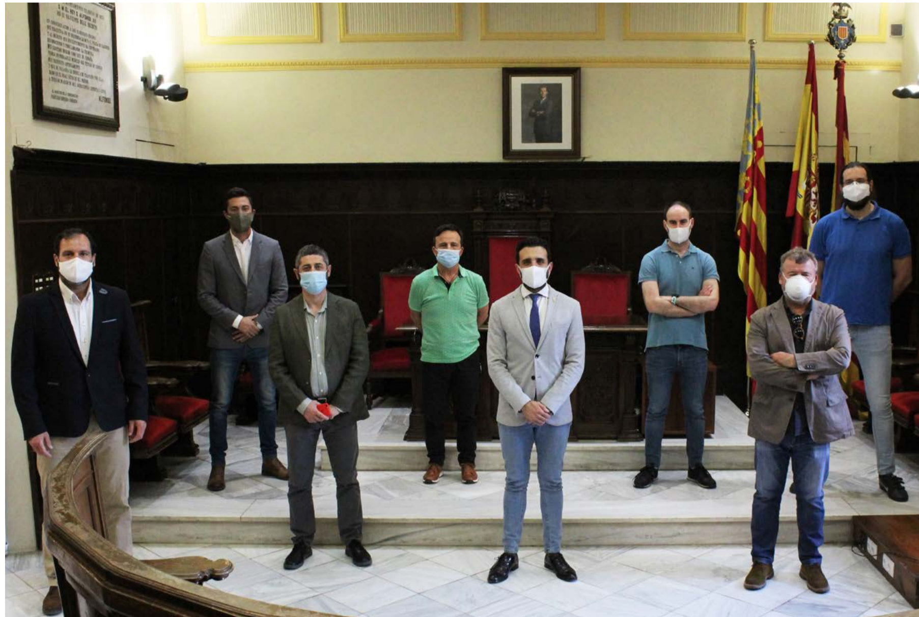
El alcalde junto a los portavoces de los grupos municipales en el Ayuntamiento de Sagunt.

En el apartado de Servicios Sociales, también se destinarán 425.000 euros a Prestaciones Económicas Individualizadas (PEIS) para subvencionar a familias necesitadas (400.000 €), al fomento de la Acción Social a través de la Integración (10.000 €) y a dotar de ali-