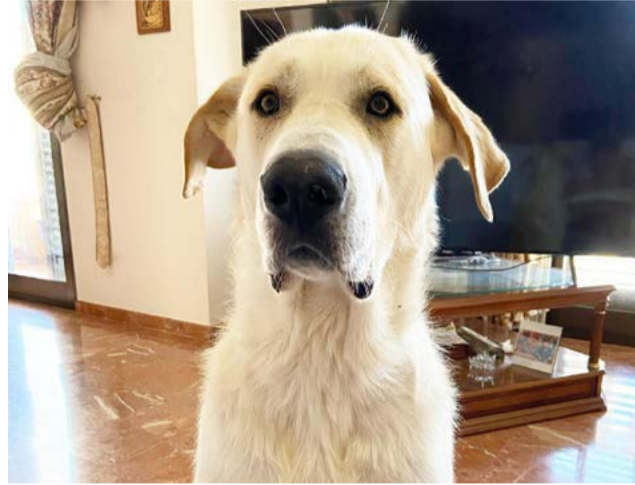
El perro que necesita una operación en la pata.