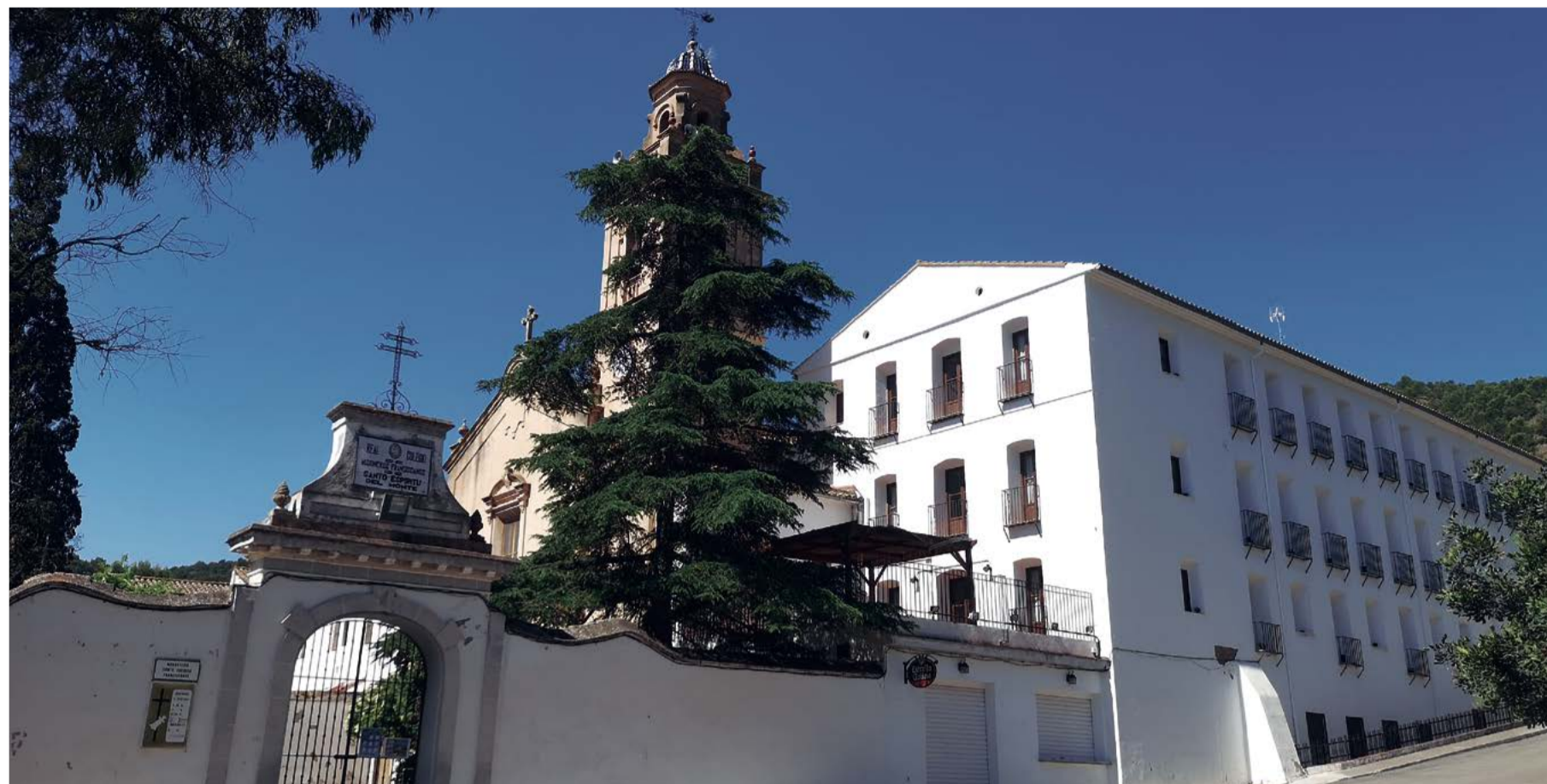
Exterior del Convento de Santo Espiritu

Además de las misas, el convento ha experimentado notoriedad en las redes sociales gracias al canal de Youtube de cocina tradicional del que hablamos en la página siguiente: "Es otra manera de abrirse a la gente y que nos conozcan. So-