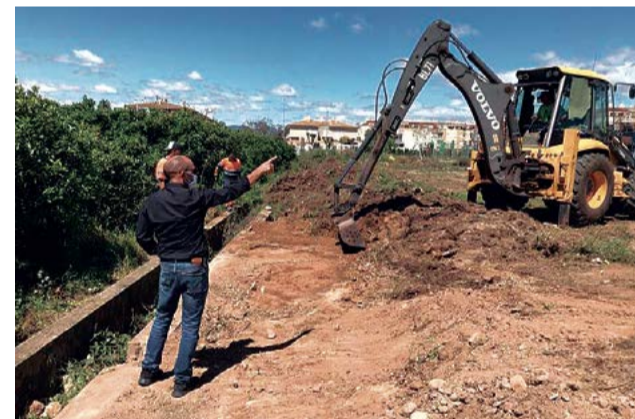
Les obres ja s'han iniciat. / EPDA