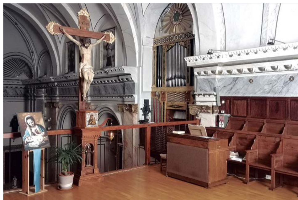
Coro desde donde se retransmitían las misas.