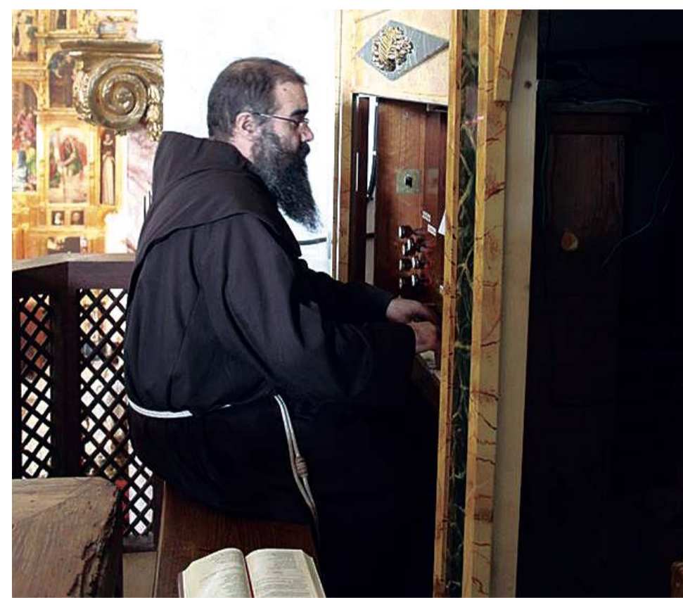
El fraile tocando el órgano del monasterio.