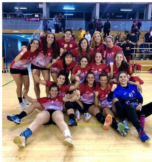
Las chicas del BM Morvedre

Desde el club no han ocultado su alegría por volver de