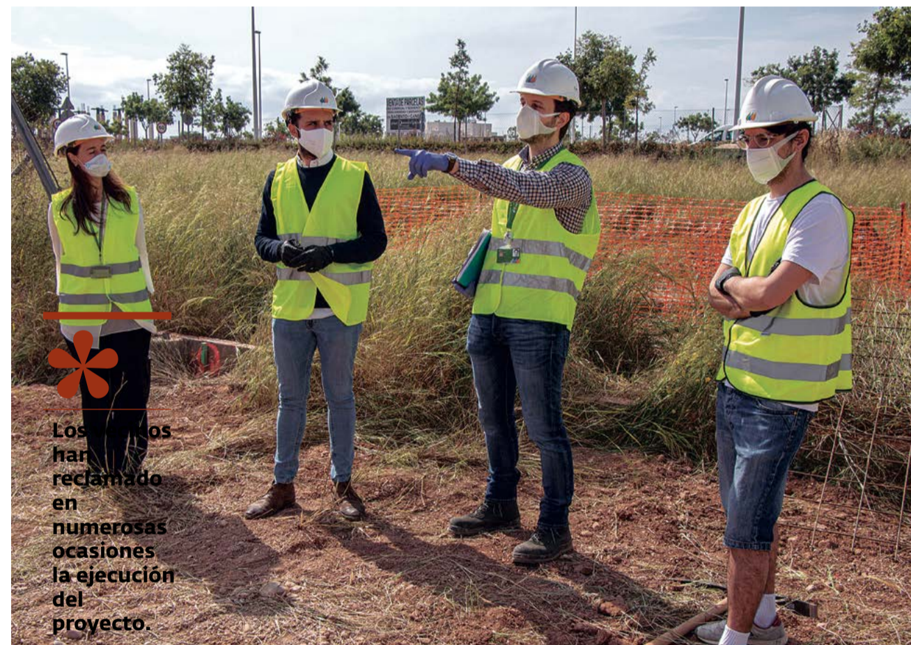
El alcalde, junto al presidente de la asociación de vecinos y la responsable de Iberdrola.

El Ayuntamiento de Sagunt recuperaría esta cantidad adelantada en el plazo de cuatro meses por parte del agente urbanizador y, en el caso de que éste no abonara el dinero en el plazo establecido, el Consistorio lo recuperaría de la garantía definitiva del agente urbanizador del MACROSECTOR-III Fusión. Pero, fue en junio de ese mismo año cuando, en Junta de Gobierno, el Equipo de Gobierno requirió al agente urbanizador ALSER que en un plazo de diez días abonara la cantidad que le faltaba por ejecutar con Iberdrola para el soterramiento de las líneas. Al no hacerlo de esta manera, el Ayuntamiento tuvo que recurrir al aval que el agente urbanizador tenía por el PAI Fusión.