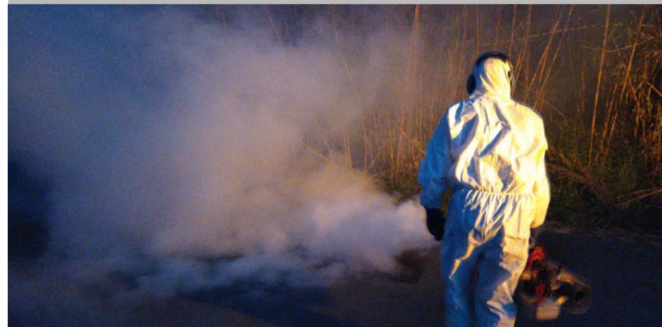
Un operario lleva a cabo una fumigación contra los mosquitos.