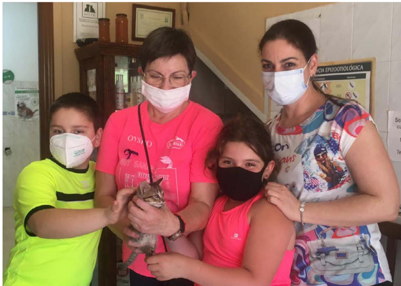
Una familia de Les Valls ha adoptado uno de los gatos de la patrulla.

de les Valls y las primeras jornadas para la población organizadas con el Ayuntamiento de Faura también se han tenido que suspender.