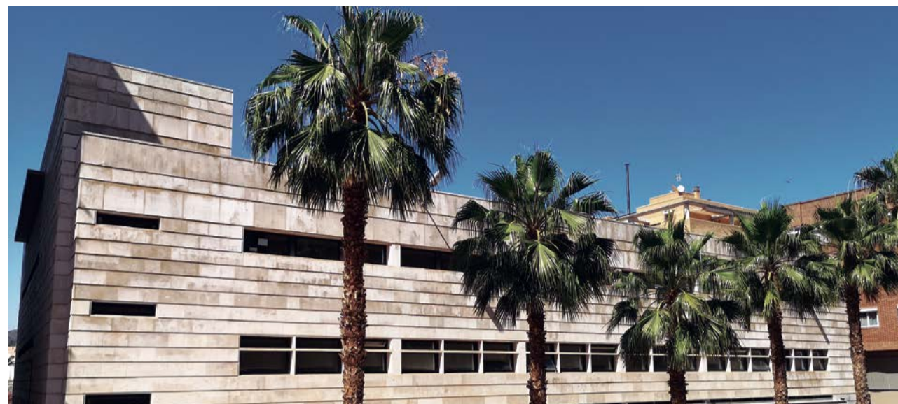
Centro de Salud de Sagunt.