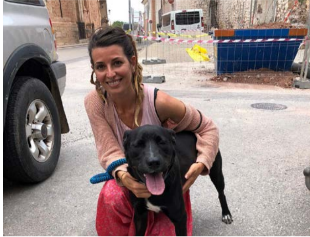
Uno de los perros adoptados

La pandemia también ha hecho que la patrulla animal haya tenido que paralizar las acciones de uno de los objetivos "que consideramos más importantes como son las jornadas educativas en los centros escolares", ya que sólo pudieron hacerlas en el CRA Quart