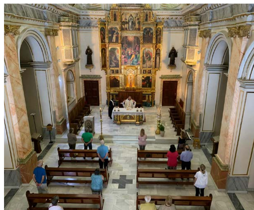
Las misas se han retomado con un aforo limitado de 30 personas.

bre todo que vean que la vida de un convento es bastante normal, a pesar de ser peculiar", matiza Hueso.