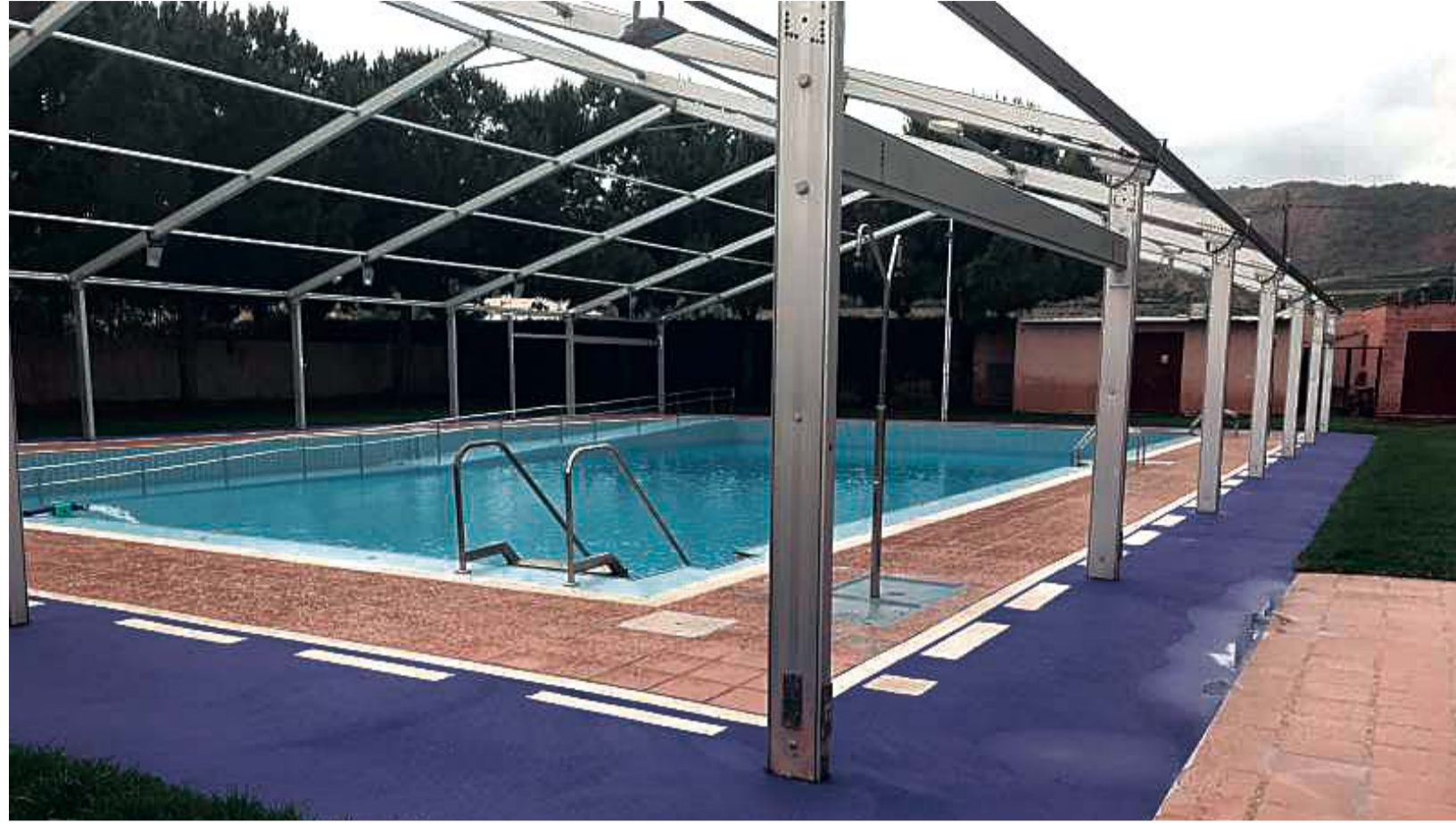
Piscina municipal de Benifairó de les Valls.

LOS ALCALDES ADOPTAN ESTA DECISIÓN DE MANERA CONJUNTA PARA PRIORIZAR LA SALUD EVITAR "PONER VIDAS EN PELIGRO"