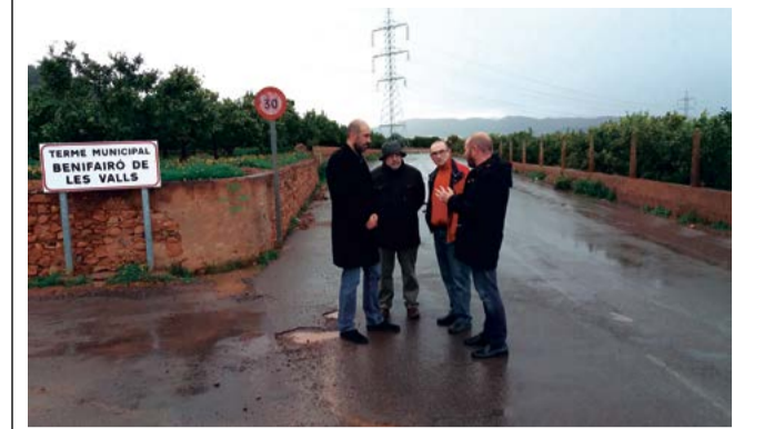
Visita a la zona en el año 2017.