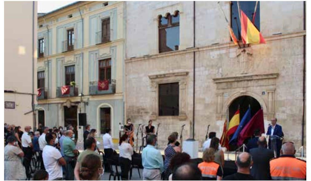
Presentació de la iniciativa a càrrec de l'alcalde d'Alzira.

El Fons Solidari "Som Alzira" facilita 50 euros al mes per xiquet/xiqueta de cada unitat familiar, gràcies a les aportacions de ciutadans, agrupacions, entitats i del mateix ajuntament. El cost del programa és de 68.000 euros. "El que volem és garantir els drets de xiquets i xiquetes en els aspectes nutricionals al llarg de l'estiu, quan no disfruten de la beca menjador. Enguany les cir-