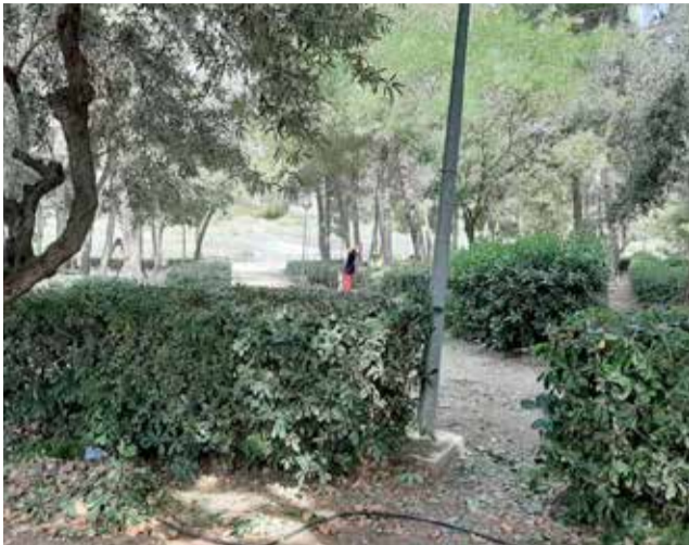
Una treballadora beneficiada per el plan.