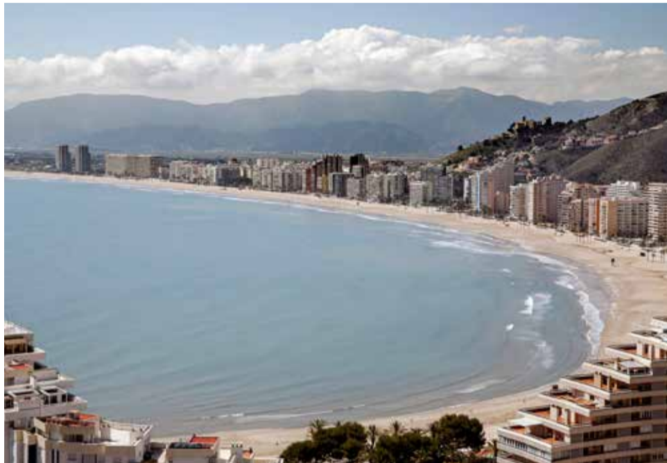
Espectacular vista de la playa de Cullera.

"El esfuerzo promocional de este año ha sido mayor", destaca la concejala de Turismo. "La campaña 'Un verano como los de antes'; ha transmitido el mensaje de que en Cullera se puede disfrutar de las pequeñas grandes cosas de la vida, como dar un paseo por la playa, tomarse algo en una te-