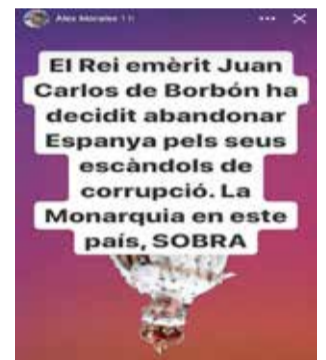
Compartido en RRSS.