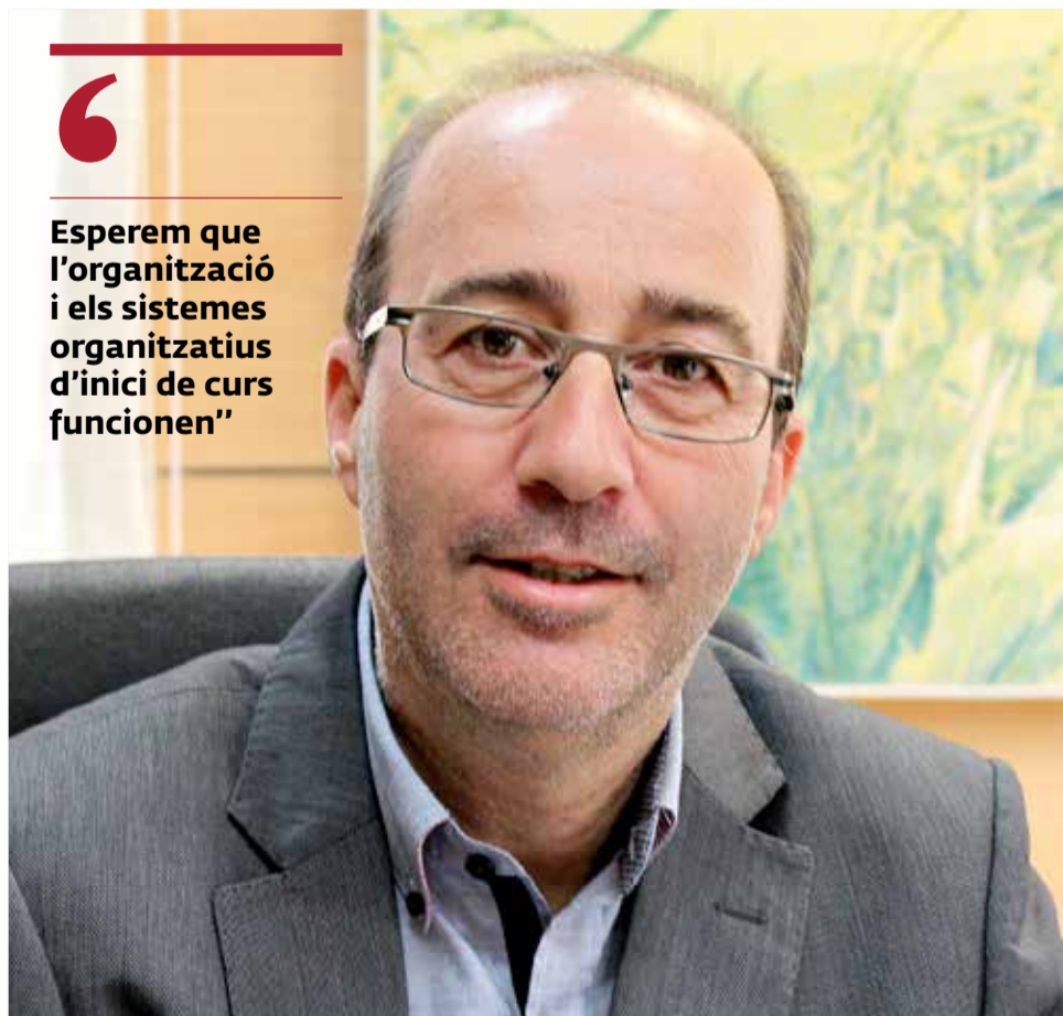
Diego Gómez, alcalde d'Alzira.

► Hem tingut reunions amb els directors i directores dels centres educatius públics i concertats de la localitat per coordinar aspectes de neteja i desinfecció dels centres. També en matèria de seguretat sanitària. Esperem que l'organització i els sistemes organitzatius d'inici de curs funcionen. Caldrà veure com es desenvolupa este inici de curs i oferir tota la nostra col·laboració per a no tindre cap problema. El futur i l'evolució de la resposta a la pandèmia va dependre molt de l'inici de curs en els nostres centres educatius.