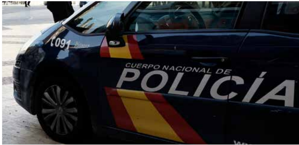
Un vehículo de la Policía Nacional.

El 23 de abril, el departamento de intervención del Ayuntamiento de Algemesí recibió un correo electrónico que solicitaba el ingreso de los pagos relativos al contrato del