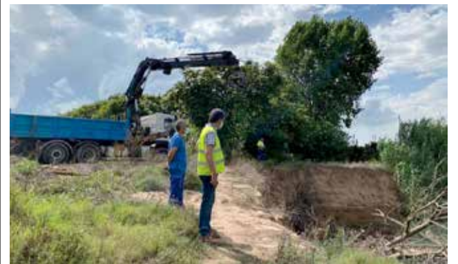
Varios trabajadores en Penyetes.