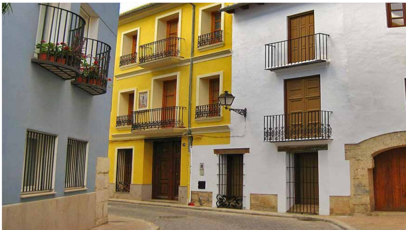
Una imatge de l'Ajuntament d'Alzira.