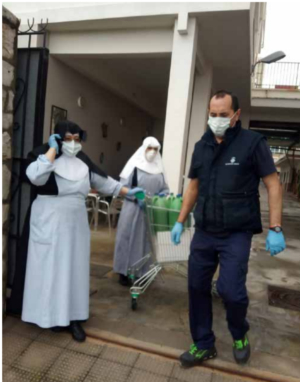
Sanitaris repartint per les residències d'Alziara.

"Ens estem tornant a preparar, i encara que volíem continuar amb la desescalada ens hem quedat així, a mitges, ja hem descartat la idea que tot el món isca al menjador", explica la psicòloga de Guadassuar. Les altres residències també han optat per restringir les visites durant un temps i fer un pas enrere. L'objectiu és no tornar a la solitud dels mesos de març, quan la finestra de cada habitació era l'únic a què tenien accés els majors, mentre el món sencer es trobava en alarma. I preservar les vides dels majors. Rentar-se les mans, distància social i l'ús de mascareta com a millor manera de protegir-nos i protegir a la resta de persones. No baixem mai la guàrdia.