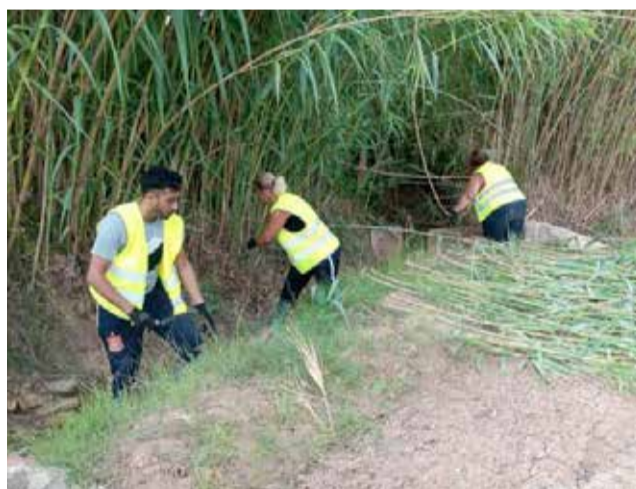
Varias personas desbrozando en Massalavés.

Se trata de un plan que refuerza las labores que se realizan habitualmente en la locali-