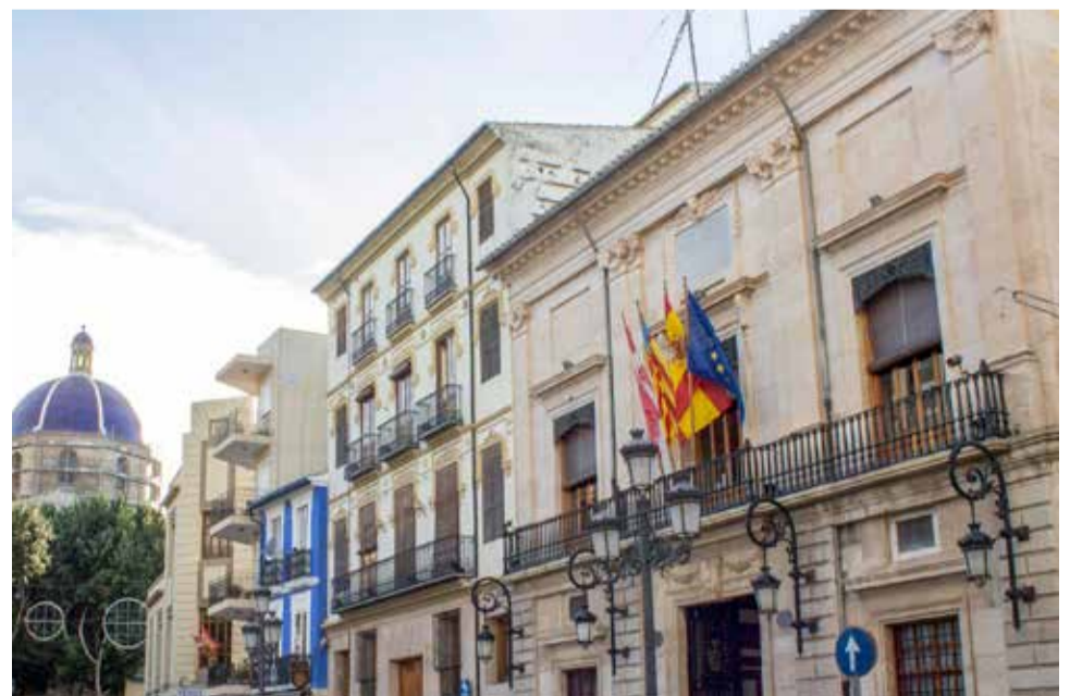
Voluntaris a Sueca.