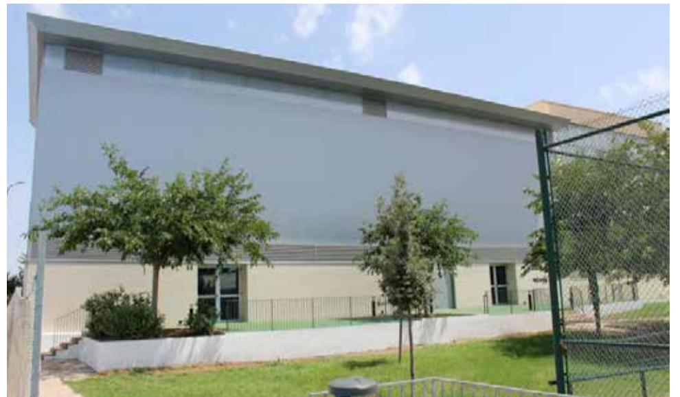
Frontón de Almussafes.

El proyecto para la renovación completa del Polideportivo Municipal de Almussafes, inaugurado hace 37 años, acaba de completarse con la finalización de las obras que han permitido cubrir y cerrar el segundo de los frontones con los que cuenta el recinto. De esta forma, a partir del próximo mes de septiembre las entidades deportivas de la población podrán hacer uso de unas instalaciones completamente modernizadas en cualquiera época del año, dado que ya no se verán sometidas a las inclemencias de la meteorología. En principio, servirá, principalmente, para los entrenamientos