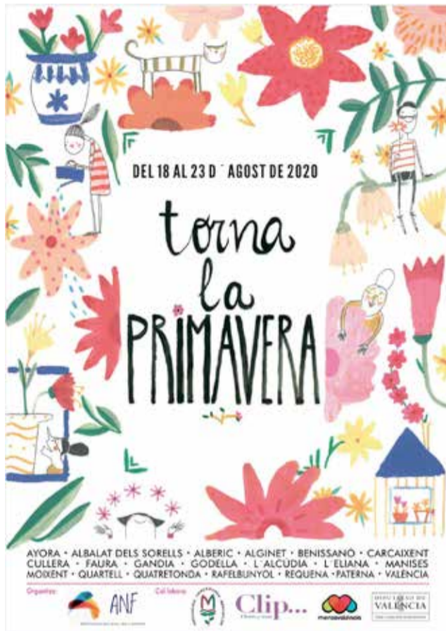
Cartell de la Diputació

Un total d'11 comarques valencianes, a més de la capital, participaran en este projecte d'ajuda al sector florista que constituirà una espècie d'homenatge a la primavera robada per la pandèmia. Des de Paterna, Manises, Rafelbunyol, Godella i Albalat dels Sorells, a L'Horta Nord i Sud, fins a Quatretonda, a la Vall d'Albaida, els muntatges florals engalanaran racons de Gandia, a La Safor;