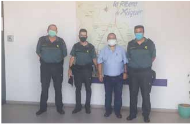
President MRA i representants.

En aquest encontre, celebrat a la seu de la Mancomunitat de la Ribera Alta, han participat els comandants en cap de les comandàncies de la Guàrdia Civil de Sueca i Xàtiva, que són les que actuen en els municipis de la Ribera Alta, i representants de la