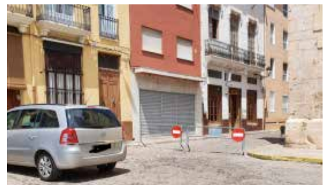
Entorn pacificat a Alberic.

"Suma't al Telegram de l'Ajuntament i coneix tota l'actualitat del teu poble. Pol-