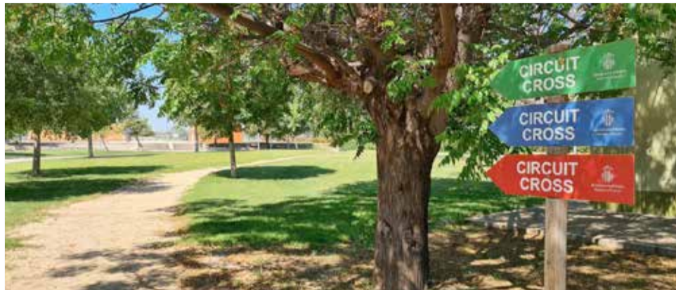
Ciutat esportiva d'Alzira.

Club Associació Ajuda al Futbol Base U.D. Alzira, el juvenil A i B, el cadet A, Infantil A, i el femení A i B, utilitzaran la Ciutat Esportiva Jorge Mar-