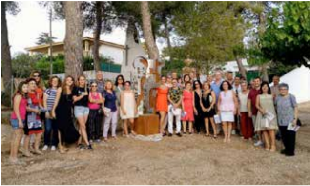
Espai d'Art 2019.