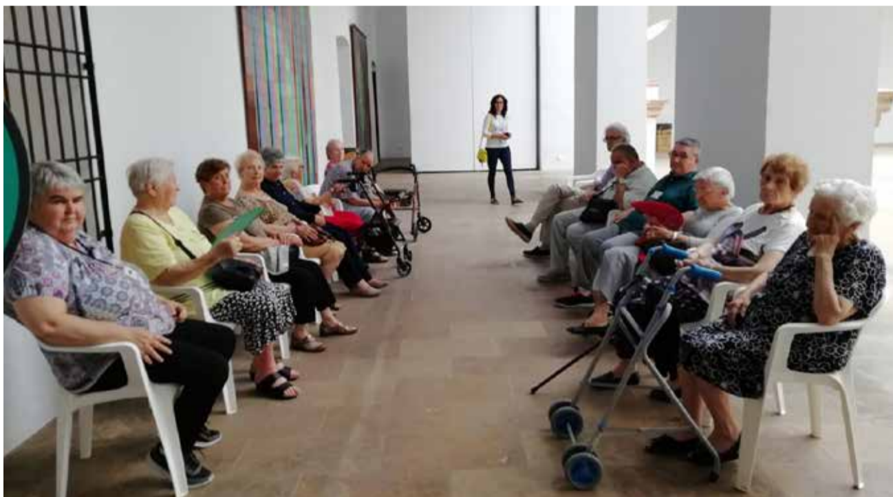
Residència Museu de la Festa de Guadassuar.

tingut casos, però tots han estat asimptomàtics: “Hem tingut la sort que ens han fet les proves, perquè sinó, no haguérem sabut que teníem un brot”.