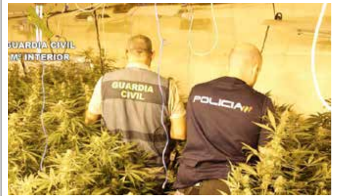
Un momento de la operación.