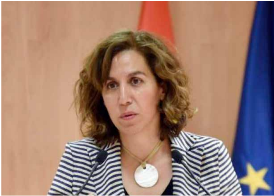
Irene Lozano, secretaria de Estado de Deportes.

Lozano se une a las deportistas ya retiradas Ruth Beitia, Theresa Zabell y Anabel Medina y a la periodista Mónica Marchante en el jurado de estos premios, que en su primera edición, correspondiente al año 2019 y entregado en febrero de este año, correspondió al árbitro recién retirado, Alberto Undiano, han continuado las mismas fuentes consultadas.