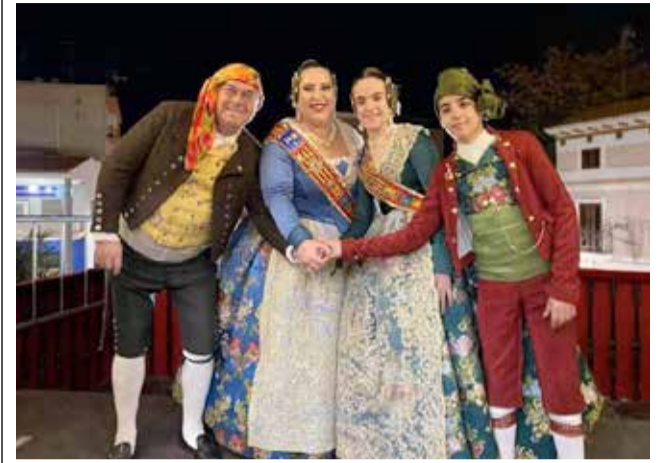
A preparar las fallas de 2021.