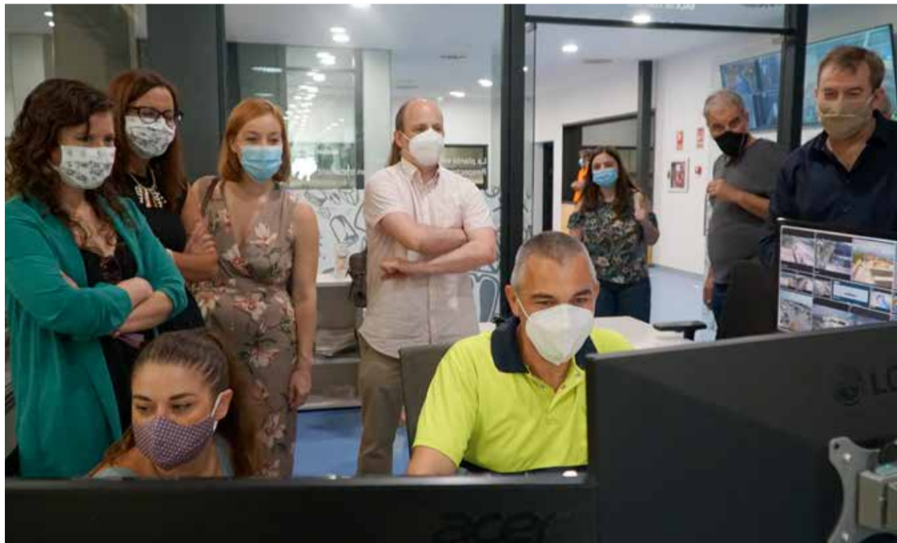
Representantes de las instituciones durante la visita reciente a la planta de Guadassuar.

da por el Complejo, y lo ha calificado como "la línea a seguir", la labor de instituciones como la propia Conselleria, la Diputación de Valencia, los Consorcios de Residuos y los Ayuntamientos implicados, "han permitido en estos pocos años mejorar la gestión de residuos en la Comunidad Valenciana hasta límites que no sospechábamos, y la Planta de tratamiento de residuos de guadassuar es el mejor ejemplo".