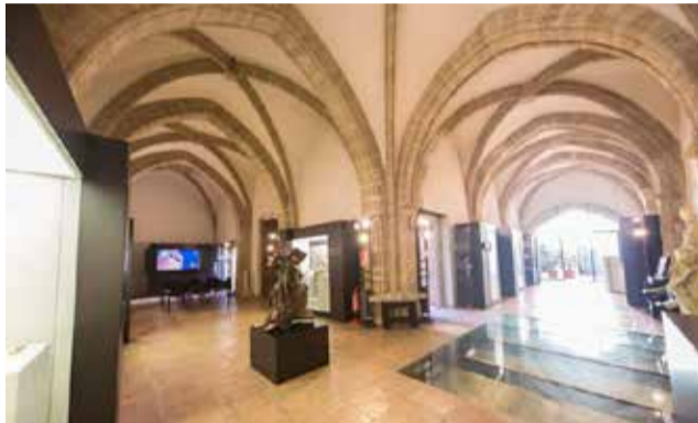
Reabren los monumentos en Cullera.

Para el mes de agosto están proyectados dos conciertos más. El día 8 una Gala Lírica de zar-