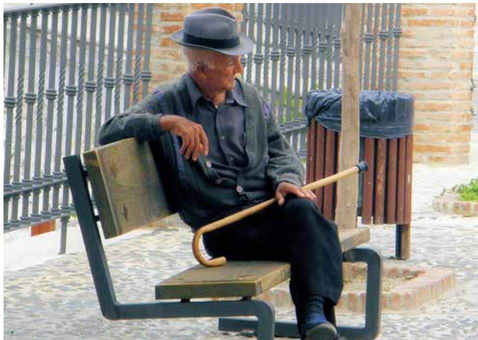
Un home prenent la fresca.

Malgrat a questa tranquil·litat actual, el centre ha tingut quatre positius