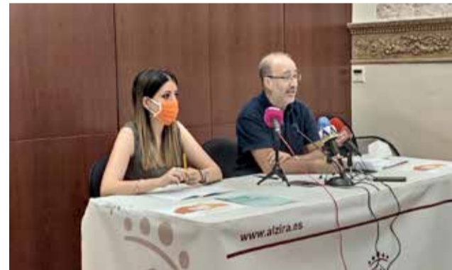
L'alcalde i la regidora.