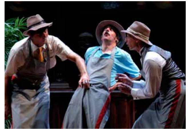
Componentes de "Vol Ras" en la MIM.

pañola, que sí han decidido mantener e impulsar propuestas culturales en sus municipios, para intentar impulsar la economía local y dar algún tipo de aliciente a sus vecinos y visitantes. Ejemplos como el festival Sagunt a Escena en el teatro romano de la capital del Camp de Morvedre, que se ha