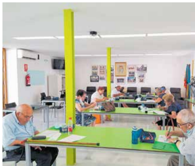
Usuarios en el Aula de Respiro de Marines.

Por otro lado, el Ayuntamiento de Marines, conocedor de la situación por la que están atravesando tanto el alumnado como las familias, ha decidido organizar