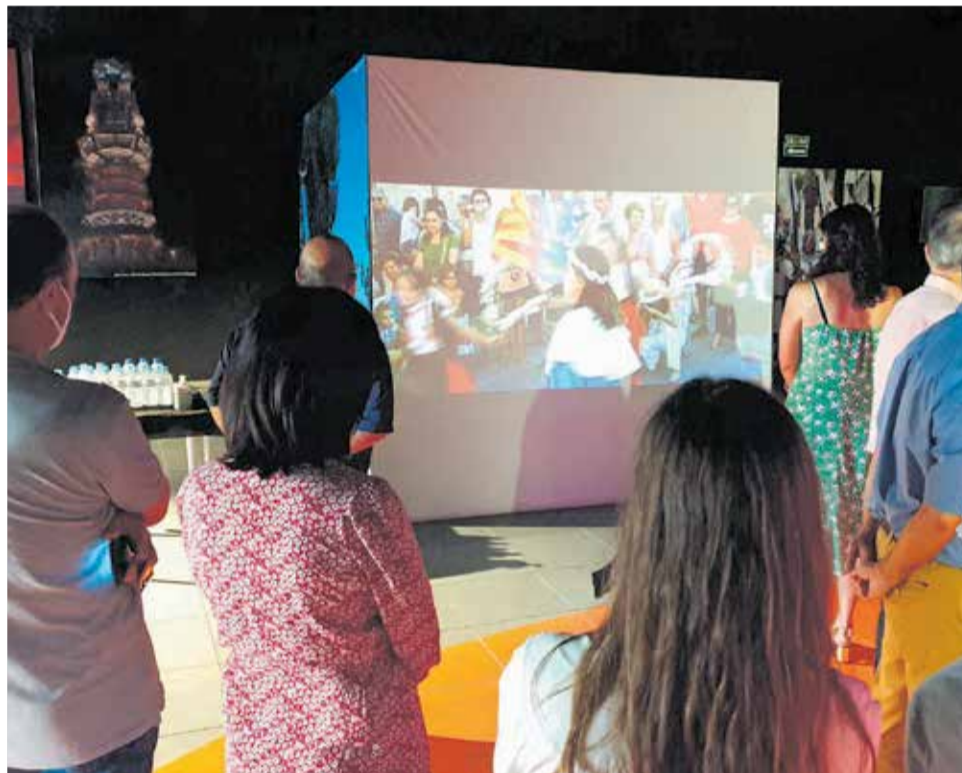
Instante de la presentación de la campaña de turismo en el CUB de la Marina.

El calendario incluye actividades al aire libre especializadas en el turismo activo, así como, experiencias cul-