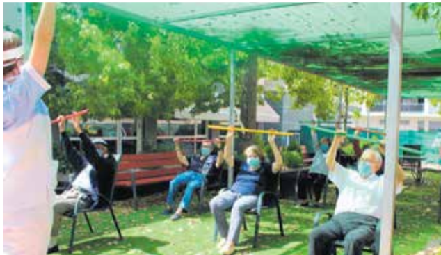
Ejercicios en la residencia de Picassent.

Sin embargo, como hemos podido constatar los profesionales que trabajamos en centros residenciales, también es cierto que estas me-