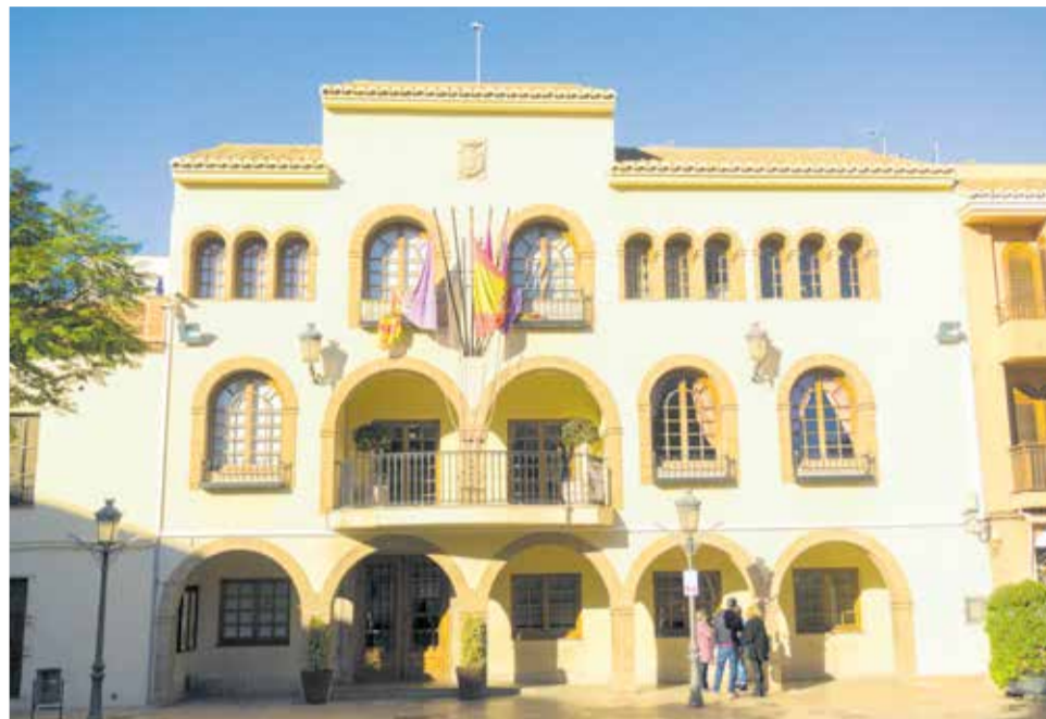
Edificio del Ayuntamiento de L'Eliana.

Esta acción forma parte del plan 'l'Eliana Impulsa', puesto en marcha el pasado mes de abril, en el que el consistorio ha invertido 1,2 millones de euros para la recuperación económica del comercio tras la crisis provocada por el Covid-19. La concejala de Políticas Económicas, Mar-