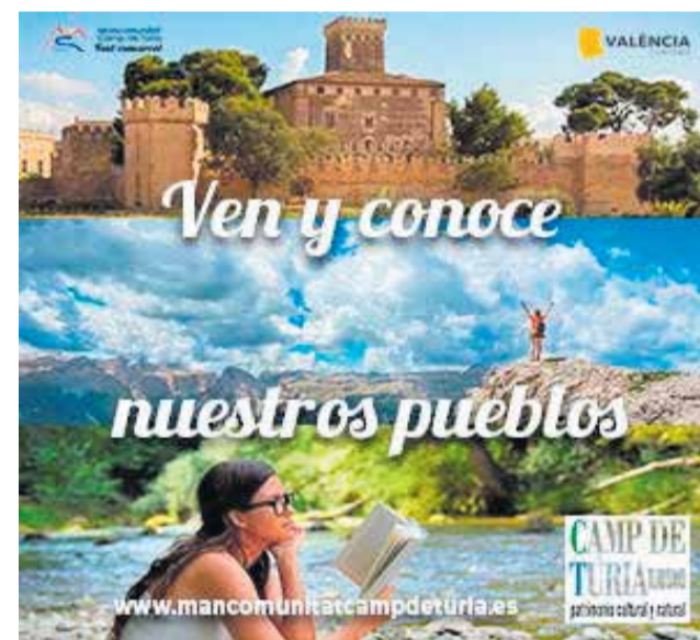
Imagen de la campaña de turismo.

Si quieres conocer todo lo que Camp de Túria puede enseñarte entra en www.mancomunitatcampdeturia.es e infórmate de todo. Un paraíso natural te está esperando.