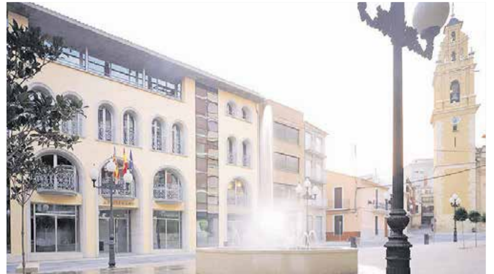
Ayuntamiento de Benaguasil