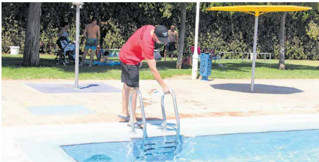
Un operario desinfecta la escalera de la piscina municipal.

Asimismo siguiendo la normativa se han clausurado espacios comunes como los vestuarios, duchas y servicio de taquillas y ampliado el hora-