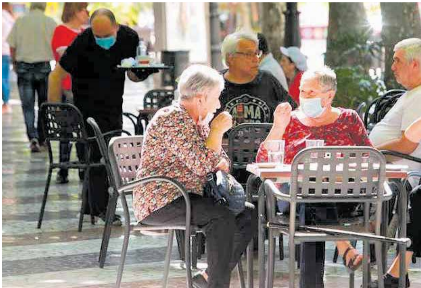
Imagen de la “nueva normalidad” que se puede ver a diario en cualquier terraza.

Nuestros miedos han estado en el origen de muchas de las emociones desagradables que hemos experimentado