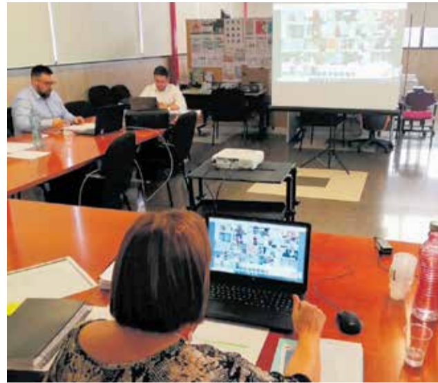
Instante del Pleno telemático de la Mancomunitat.

“La Mancomunitat es un ente supramunicipal que trabaja por todos y cada uno de los vecinos de la comarca. Por eso, intentamos cada día mejorar los servicios que se prestan desde la propia Mancomunitat