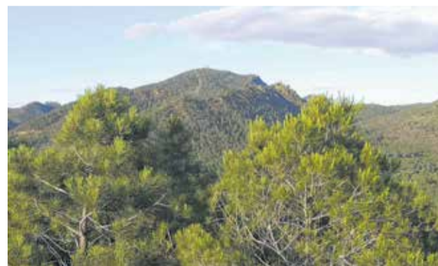
Muntanyes de Serra.