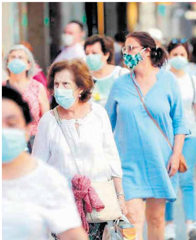
Las mascarillas ya son parte del atuendo diario.