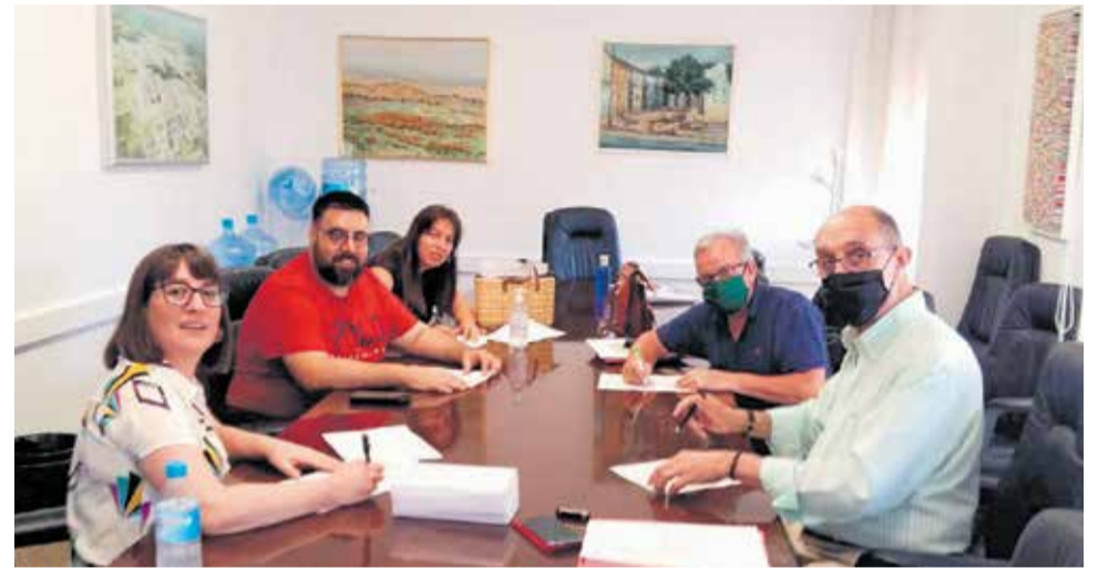
Portavoces firmando el acuerdo sobre los Presupuestos municipales.

A su vez, respecto a la plantilla del personal del Ayuntamiento, se ha dado luz verde a la mayor oferta pública de empleo de los últimos diez años. Además de seguir pensando en nuestros empleados municipales reforzando a aquellos departamentos con grandes volúmenes de trabajo y con una plantilla mal dimensionada, creando, así, la figura del técnico/a de subven-