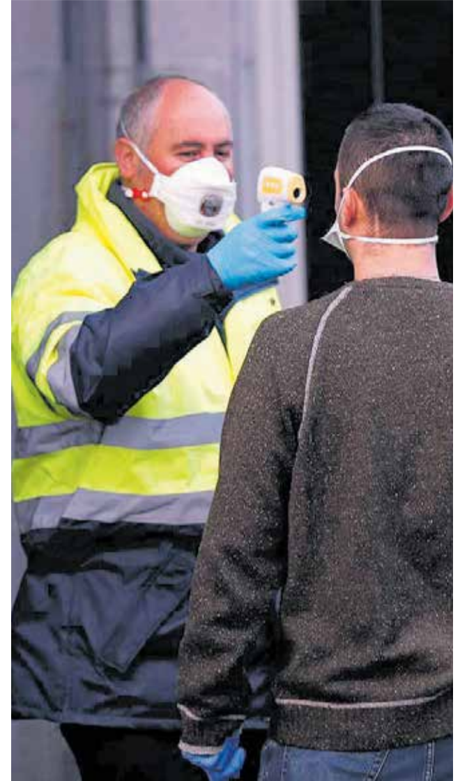
Varios momentos de diferentes situaciones cotidianas de la “nueva normalidad” / EFE.