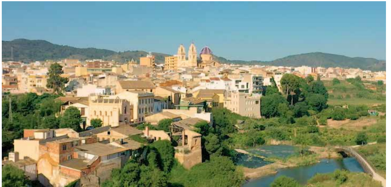
Panorámica del municipio de Riba-roja, en la comarca de Camp de Túria.

LA OFICINA DE TURISMO HA SIDO LA PRIMERA ENTIDAD EN ESPAÑA EN OBTENER EL SELLO SAFE CERTIFIED DEL ICTE, DISTINTIVO QUE CERTIFICA LAS MEDIDAS DE PREVENCIÓN NECESARIAS