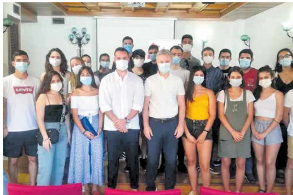
El alcalde en la bienvenida a los estudiantes becados.

Los beneficiarios realizarán las prácticas formativas distribuidas en los meses de julio y agosto en las áreas de Modernización, Comunicación, Personas Mayores, Urbanismo, Deportes, Promoción Lingüística, Biblioteca, Alcaldía, Formación de Personas Adultas y Medio Ambiente.