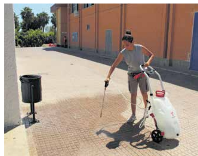
Tareas de desinfección en zonas de paso.