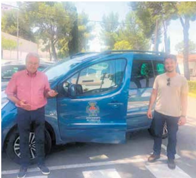
El vehículo ecológico destinado para Loriguilla.