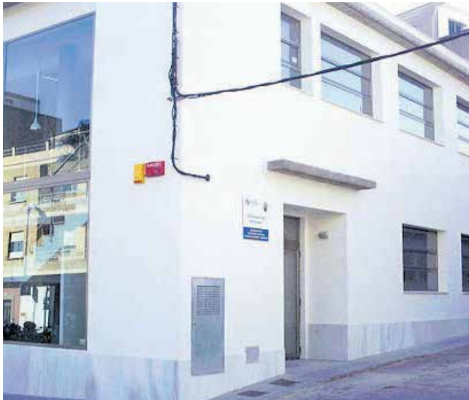
El Centre Auxiliar de Salut de Benissanó.

El regidor d'Hisenda de l'Ajuntament de Benissanó,