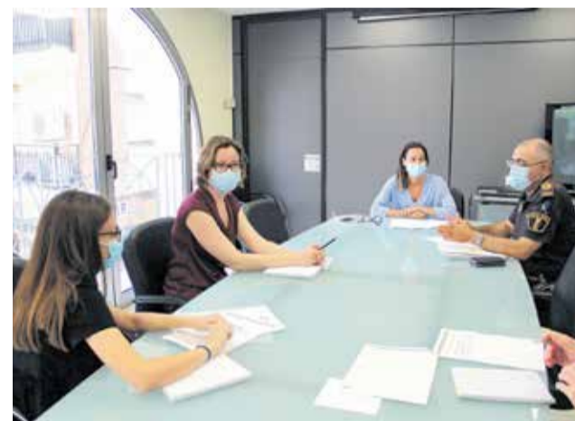
Reunión para abordar la redacción del plan.

La edil ha recordado que la redacción del PMUS responde a los compromisos en materia de movilidad sostenible adquiridos por el equipo de Gobierno, y ha explicado que “aunque los Ayuntamientos de menos de 20.000 habitantes no tienen obligación de tenerlo, desde el Consistorio hemos creído conveniente elaborarlo para conseguir una movilidad más eficiente del municipio al mejorar aspectos como la circulación, aparcamientos, accesibilidad y todo o relacionado con la movilidad”.