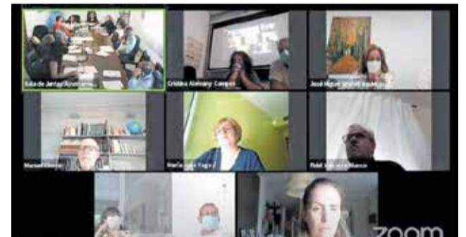
Instante del pleno para tratar los Presupuestos./ EPDA

Este Presupuesto también es una apuesta para la tercera edad desde el área de Derechos Sociales así como también con