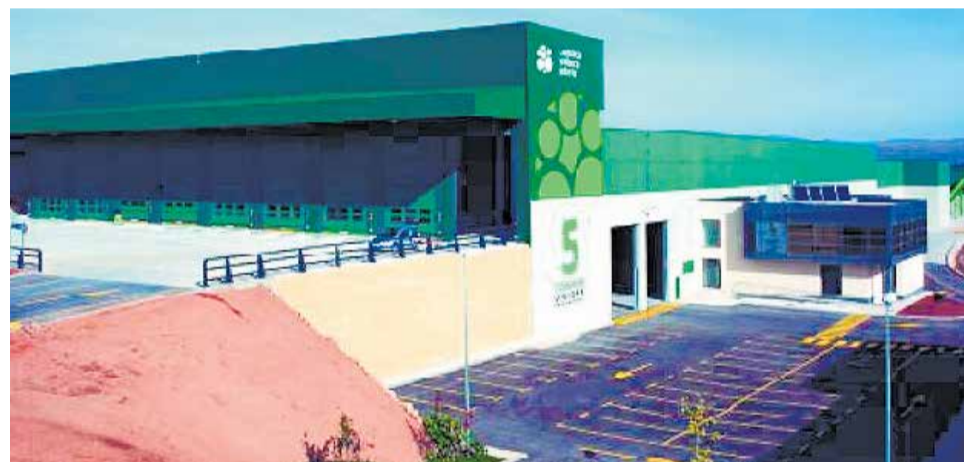
La Planta de Tratamiento de Residuos de Llíria del CVI.

este tipo de residuos se van a poder recoger más y mejor y, lo más importante, daremos el servicio que merece nuestra ciudadanía".