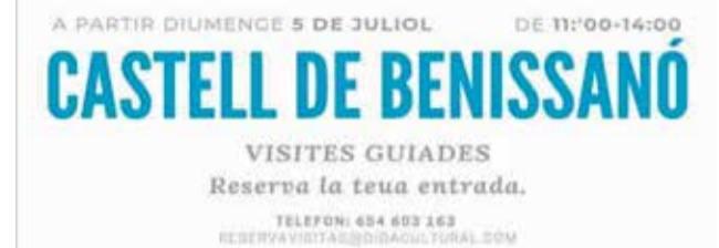
Cartell informatiu sobre l'apertura del Castell.