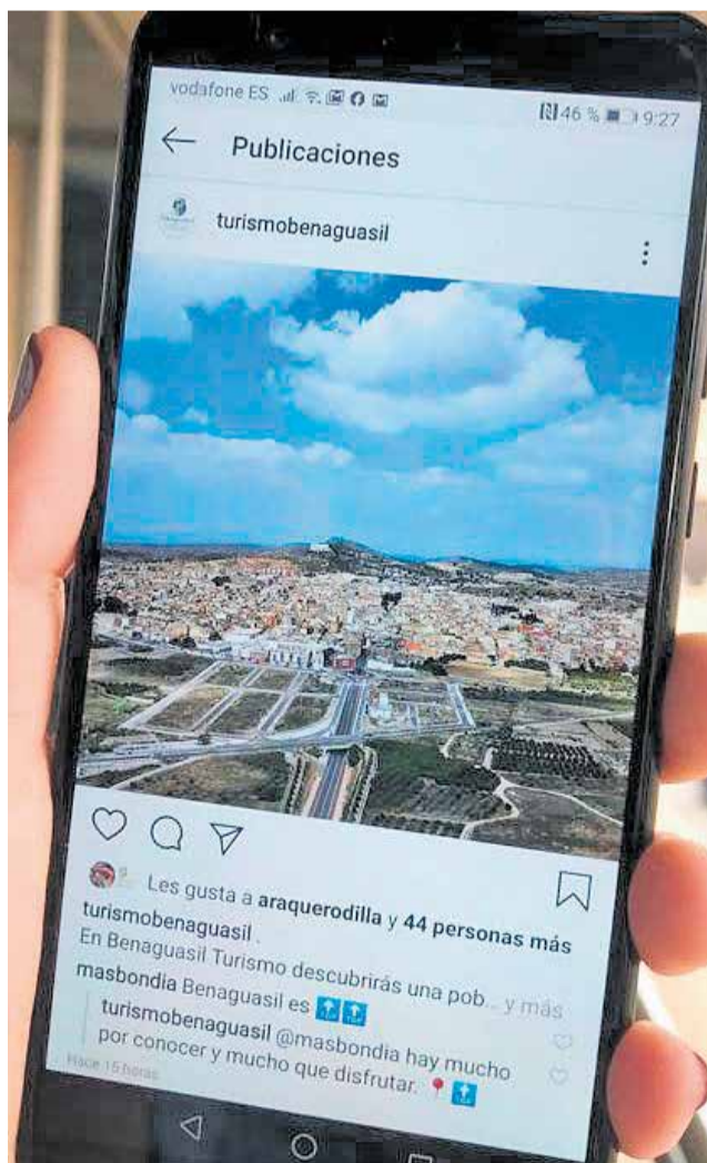
El Instagram Turismo Benaguasil./ EPDA