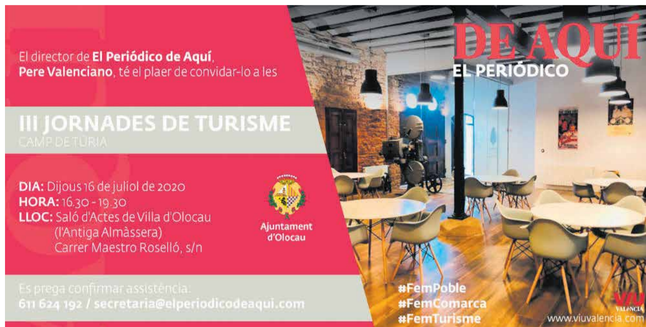
Invitación de las III Jornadas de Turismo en Camp de Túria.

Además, la Mancomunitat Camp de Túria estará presente para difundir en qué consiste la campaña que aglutina a todos los pueblos de la comarca, para que los turistas se animen a hacer turismo de interior en esta provincia de Valencia. En definitiva, todo un escaparate turístico.