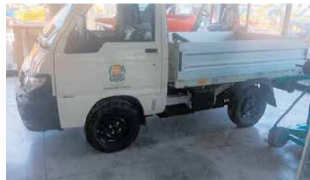
El vehículo respeta el medio ambiente. / EPDA.