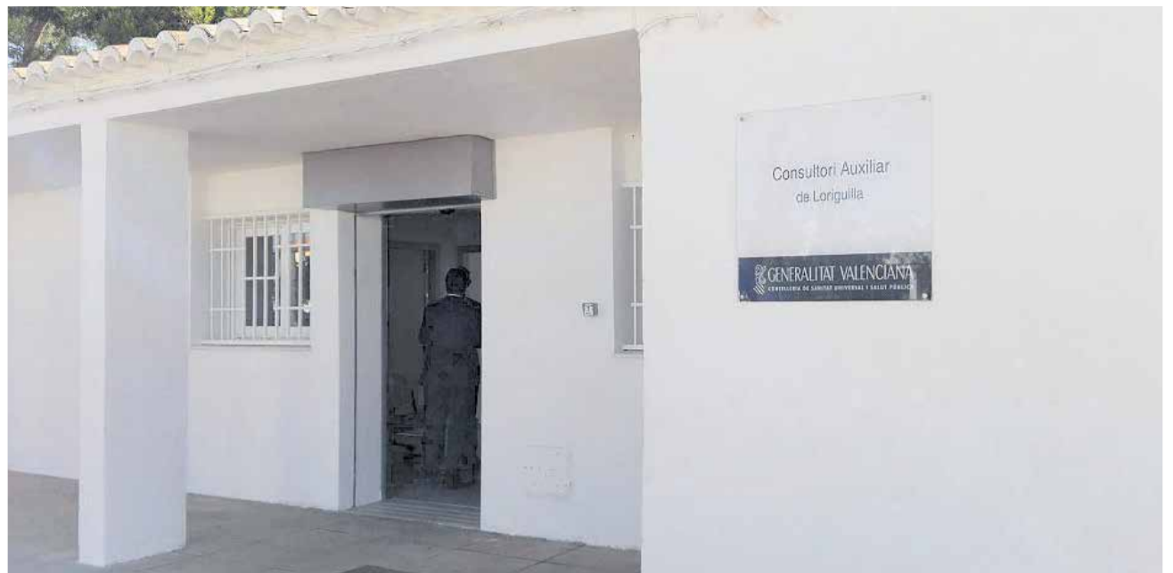
El Consultorio auxiliar de Loriguilla se cerró al estallar la pandemia y los vecinos esperan la reapertura.

En la carta, Alfaro emplaza a la consellera a "reconsiderar la decisión y a reabrir, de inmediato, el ambulatorio, adoptando las medidas necesarias para que Loriguilla tenga la misma asistencia sanitaria básica" que cualquier otro