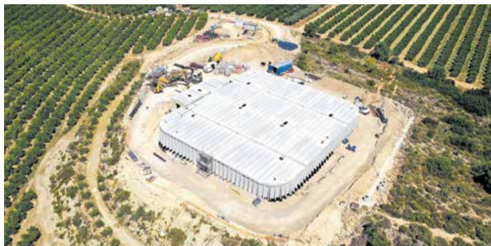
Vistes aèries del polígon de Carrases i del dipòsit en obres.