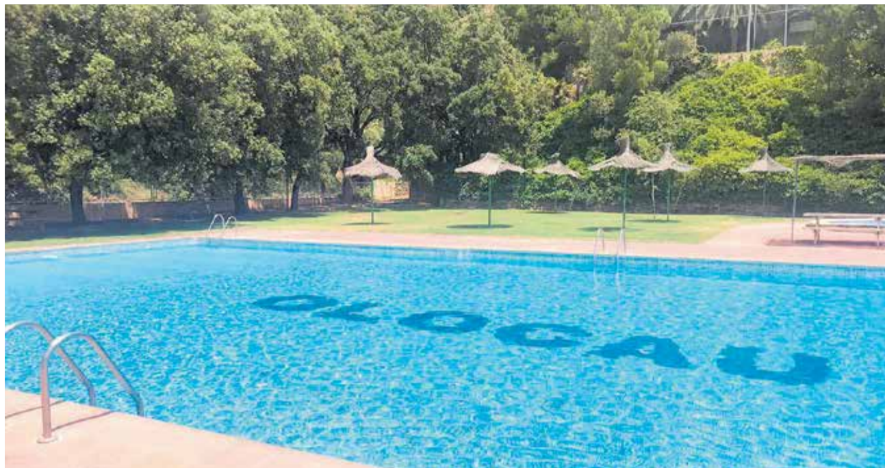
Piscina municipal de Olocau.

Las instalaciones cuentan además con la rehabilitación de los baños y accesos para poder dar un servicio completo y con excelentes garantías. Se han establecido dos turnos para poder cumplir con el aforo permi-