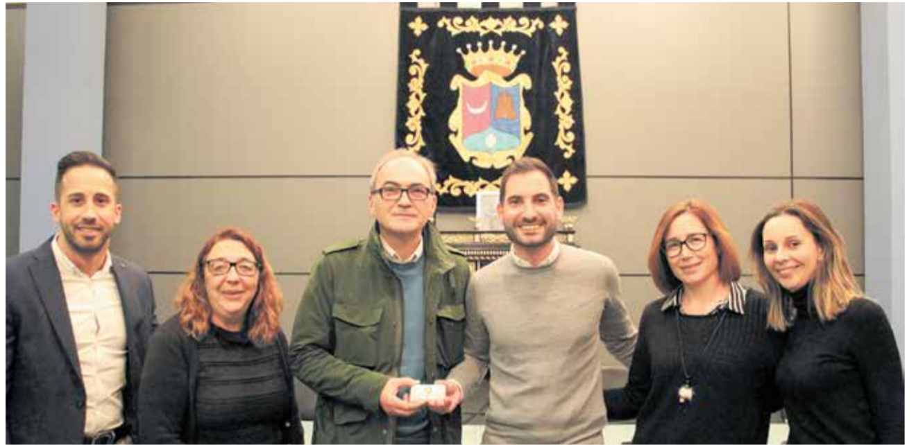
Los integrantes del equipo de gobierno del Ayuntamiento de Benaguasil.

Otro de los proyectos que se llevarán a cabo es la susti-