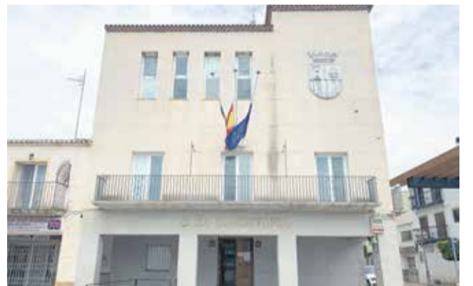
Ayuntamiento de San Antonio. / EPDA