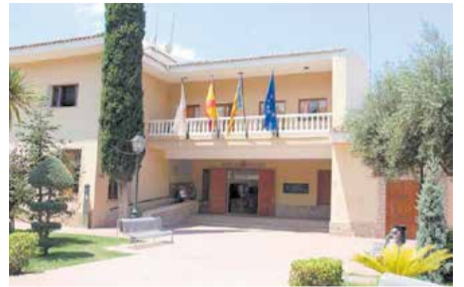
El Ayuntamiento de Náquera.

Pero no solamente los pequeños van a poder participar de esta agenda cultural. El jueves 16 de julio, se celebrará el acto "De Rondalles i ferments", una cata de cer-