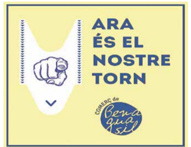
Cartel de promoción de la campaña de comercio.

los comercios que no han podido desarrollar su actividad con normalidad y por ello hemos lanzado estas ayudas que se enmarcan dentro del Plan Re-Acciona, puesto en marcha por el Ayuntamiento para dinamizar la economía local, ya que el comercio es uno de los principales pilares de la economía de Benaguasil", han señalado fuentes municipales. Se trata de ayudas urgentes para impulsar la actividad de las empresas preferentemente del sector comercial minorista y de prestación de servicios al consumidor final, para paliar la crisis por la que atraviesa este sector.