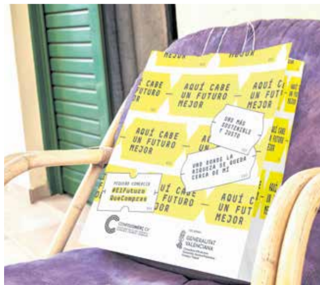
Bosses de promoció de Confecomercç.

Entre els objectius d'esta associació, considerada la més important de la Comunitat Valenciana en este àmbit, està el d'afavorir la participació dels seus associats per tal d'aconseguir accions en comú que potencien el sector del comerç de proximitat.