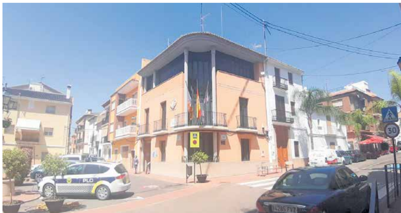
Fachada del Ayuntamiento del municipio de Olocau.

Una acción que se enmarca dentro del Objetivo de Desarrollo Sostenible (ODS) número 7. Más de 140.000 euros se emplearán en la Fase I del adoquinado y sustitución de la red de agua potable de las calles Mayor, Maestro Roselló, San Félix, San Roque y la plaza Cervantes. Este pro-