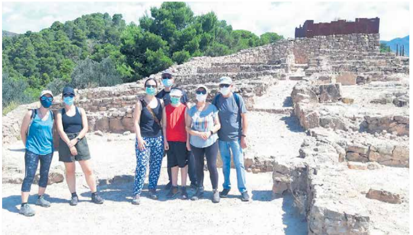
Olocau acoge a los visitantes que eligen conocer su pasado ibero, cumpliendo con las medidas sanitarias.

En este sentido y ante la situación de rebrotes, son muchas las personas que temen un nuevo confinamiento que no solamente tendría consecuencias económicas sino también psicológicas para muchos. Así lo explicaba