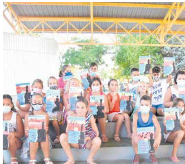
Participants en el taller Café con arte.