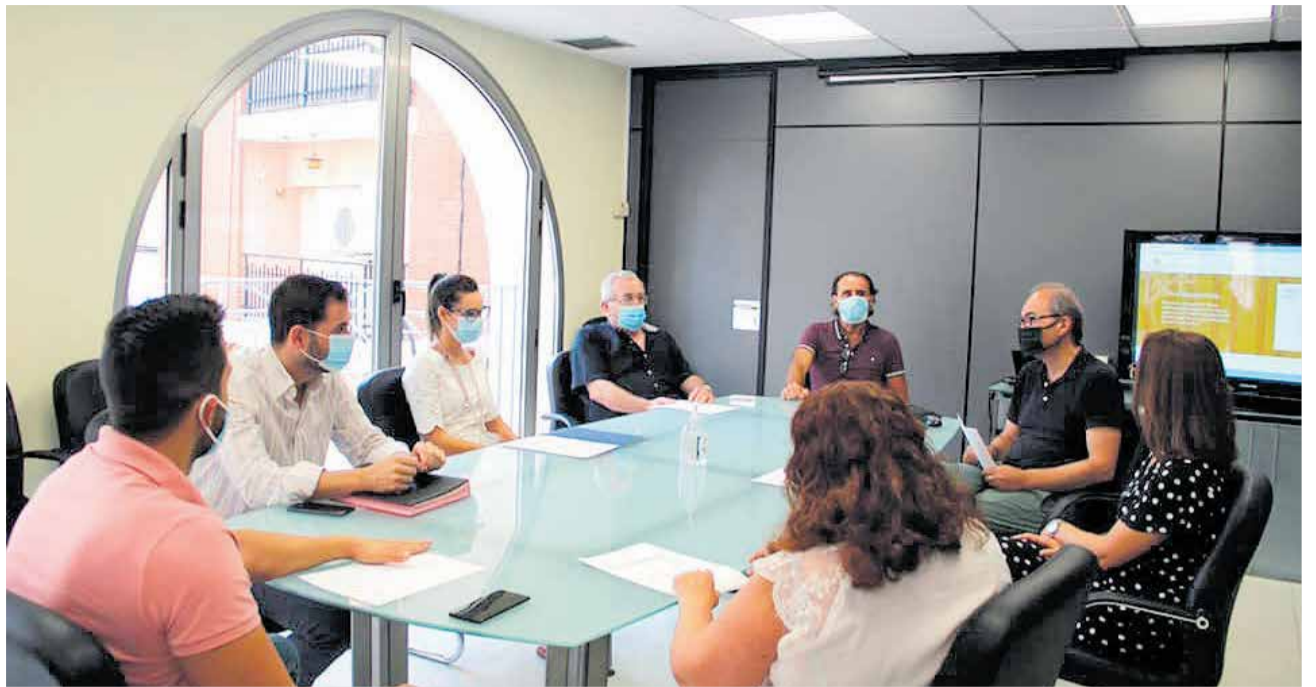
Los miembros de Equipo de Gobierno de Benaguasil en una de las reuniones de trabajo.

El objetivo de estas ayudas es apoyar a este tipo de negocios en los gastos corrientes habituales que han sido soportados, pese a la carencia o disminución de ingresos y, de esta manera contribuir a darles un impulso en su actividad económica. "Queremos aliviar la carga económica de