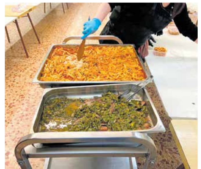
Se garantiza el menú a menores vulnerables.

El Ayuntamiento ha reparado a lo largo de este año 2020 un total de 8.000 kilos de comida y alimentos a más de 500 personas a través del Fondo de Ayudas Europea para familias desfavorecidas en el que el consistorio actúa en su calidad de organización asociada de reparto (OAR). Además, cabe destacar las donaciones diarias que Consum entrega cada día al Consistorio destinado a las familias más vulnerables. Por último, a lo largo de las últimas semanas el depar-