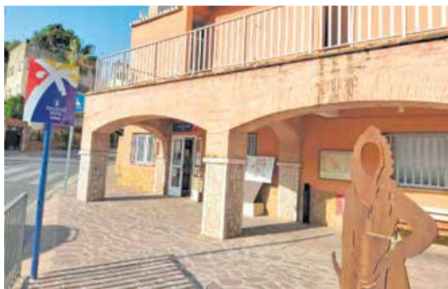
Oficina Tourist Info de Serra.