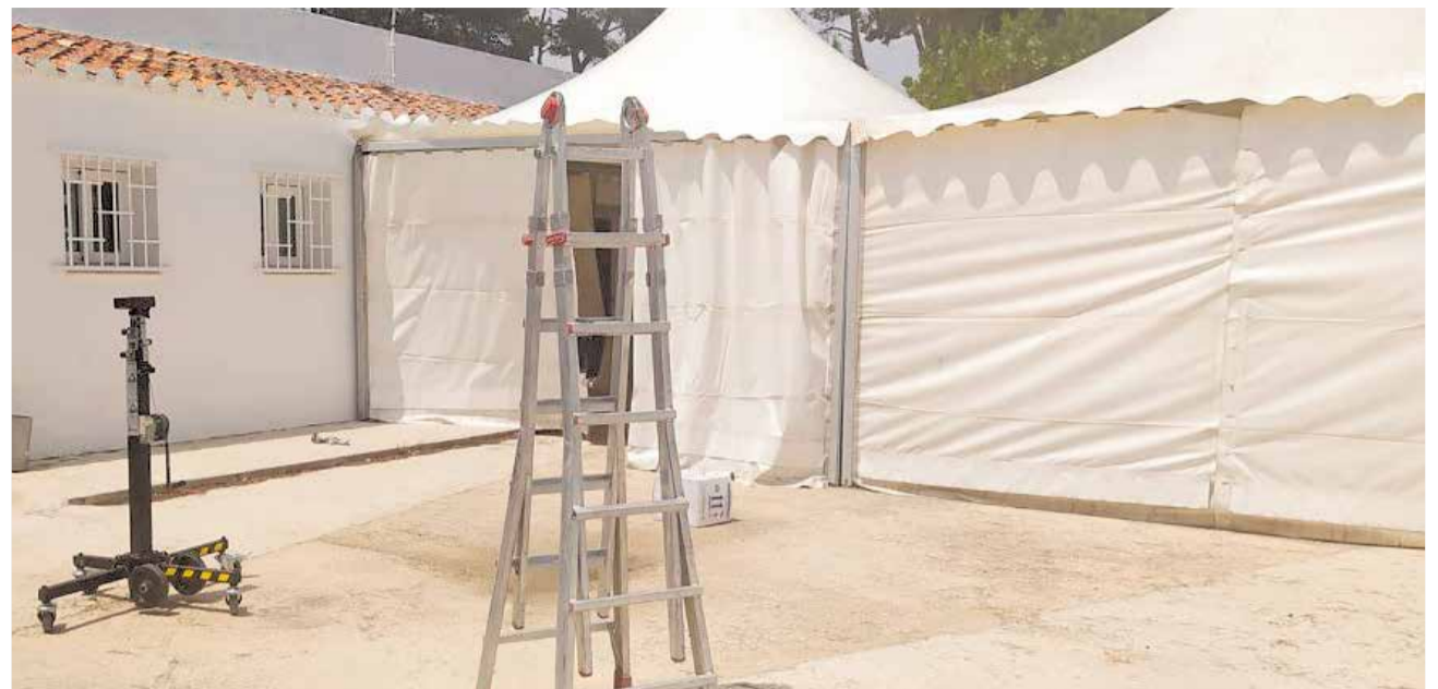
Colocación de carpas a las puertas del consultorio médico de Loriguilla.

Desde el Ayuntamiento también se informa de que todas aquellas personas que