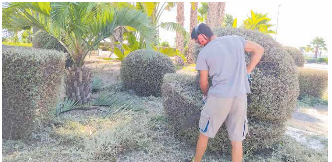
Un miembro de la brigada de jardinería realizando tareas de mantenimiento y poda.

Los perfiles solicitados son conserjes, personal de limpieza y peón agropecuario, y las contrataciones se realizarán tras un proceso de selección que se ajustará a las instrucciones del Director General de Labora relativa al procedimiento de selección