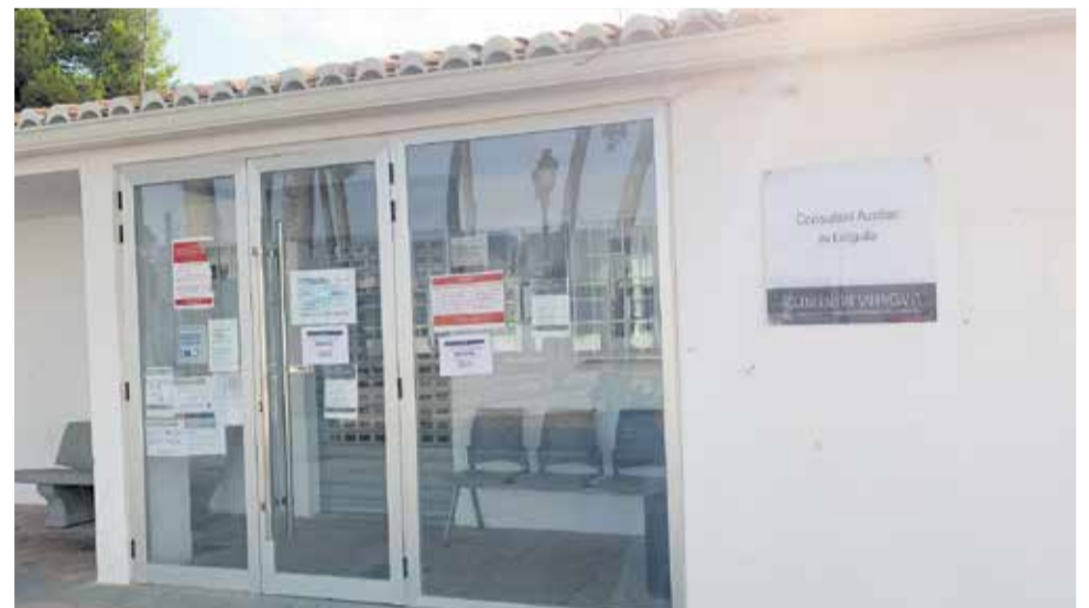
Imagen del consultorio médico de Loriguilla cerrado.

También se puede solicitar cita previa a través de la pá-