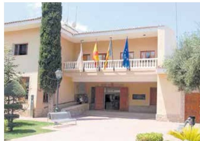
L'Ajuntament de Náquera. / EPDA

El dijous 20 d'agost, la banda musical 5DBrass oferirà un concert a partir de les 20:30 hores al pati del CP Emili Lluch. Es tracta d'un concert didàctic en el qual Cuenti, una conta contes, combinarà les seues històries amb les cançons de la grup. El dimecres 26 a par-