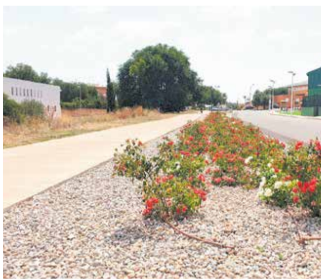
Tramo del carril ciclo-peatonal de Riba-roja.

y Danza, a los que diariamente acuden más de 900 alumnos de toda la provincia de Valencia, con el Parque Flu-