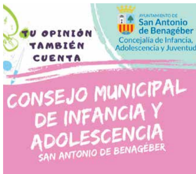
Cartel promocional del Consejo de Infancia.

Niñas, niños y adolescentes que viven en la misma localidad y que se reúnen de manera habitual, se expresan y toman decisiones sobre las cosas y temas que les afectan e interesan del municipio