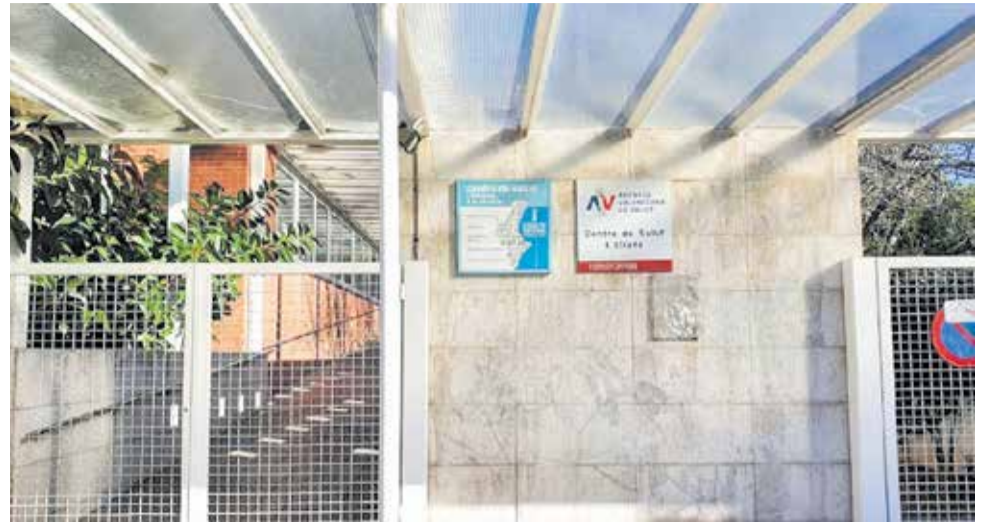
Entrada del Centro de Salud de L'Eliana.

Las recetas nuevas o renovadas se podrán obtener con la tarjeta SIP directamente en cualquier farmacia (sin necesidad de la hoja de receta), los informes y partes de confirmación o bajas podrán recogerse en el mostrador del