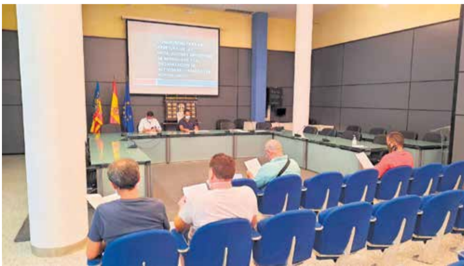
Instante de la reunión del Ayuntamiento con los clubes deportivos. /

alumnos y alumnas que pertenecen a alguno de los clubes deportivos.