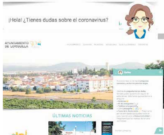
Portal web con la asistente virtual, Carina.

Con este servicio, el Ayuntamiento de Loriguilla quiere dar respuesta a la gran demanda de información e