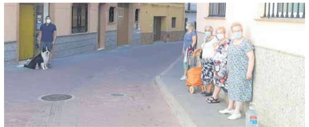
La población de Gátova está muy concienciada para resistir libre de COVID-19.