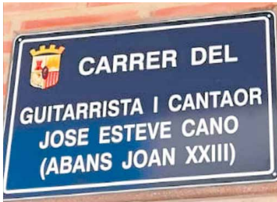
La nueva placa colocada en la calle en cuestión recuerda su antiguo nombre.