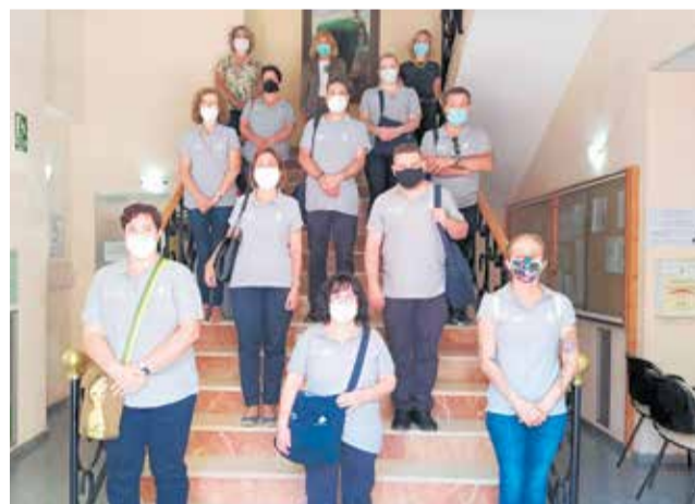
Alumnos y alumnas del Taller de Empleo-Bétera.