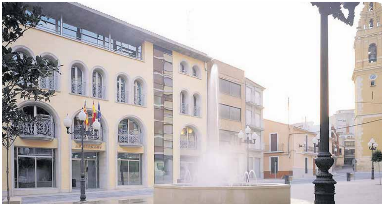
Fachada del Ayuntamiento de Benaguasil.

El edil de Deportes también ha informado en la reunión de la inversión de 180.000 euros que se va a realizar en diferentes espacios deportivos municipales dentro del Plan de Inversiones Provincial que acometerá mejoras en las pistas de tenis, pádel, fútbol 8 y en los vestuarios utilizados habitualmente por los 675