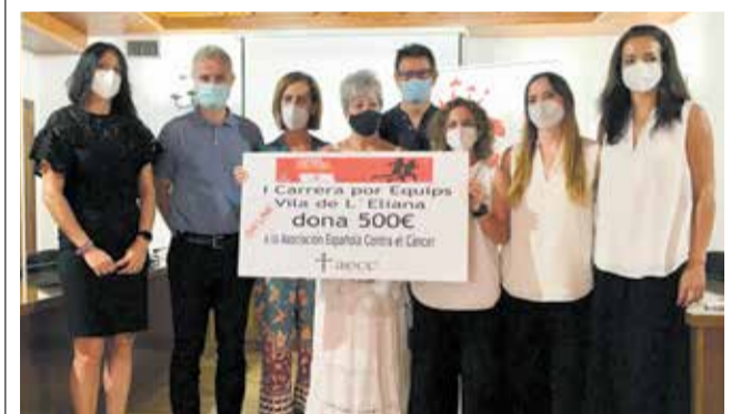
Instante de la entrega del premio a la AECC.