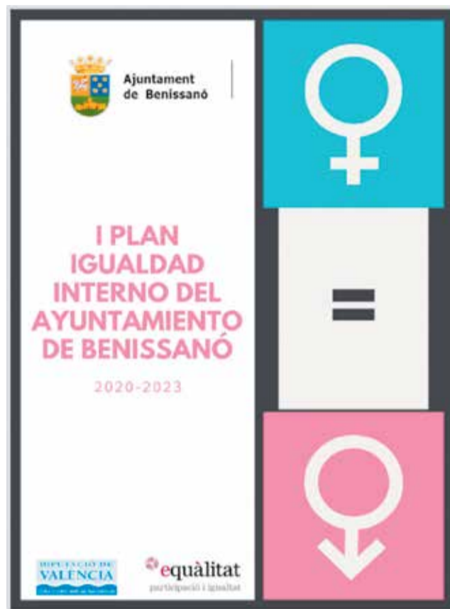
Cartell del Pla d'Igualtat de Benissanó.