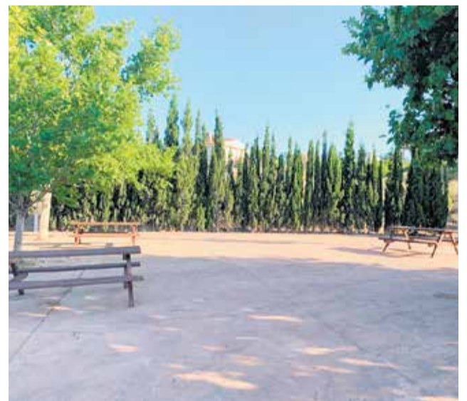
Uno de los espacios públicos de Benaguasil. / EPDA.

Junto a Benaguasil los municipios que se verán beneficiados en la Comunidad Valenciana serán Benigembla, Crevillent, Redován, Algar de Palancia, Barx, Benifairó de la Vallidigna, Carrícola, Mislata, Oliva, Quatretonda, Rafelguaraf, Terrateig y Venta del Moro.