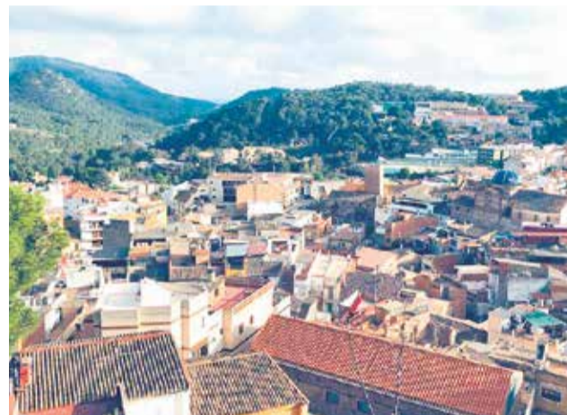
Panoràmica del municipi de Serra.

Part de la quantitat rebuda servirà per remodelar els carrers Pobleta, Barranquet, Extramurs de Sant Roc i Sant Josep, inversions molt demandades pel veïnat. També es procedirà a la substitució del clavegueram en mal estat dels carrers Collaet, Mestra Consuelo Burgos i avinguda la Serrà. Seguint amb la línia de millora dels vials, també s'instal·laran noves luminàries solars al carrer Montalegre, La Pobleta i camí del