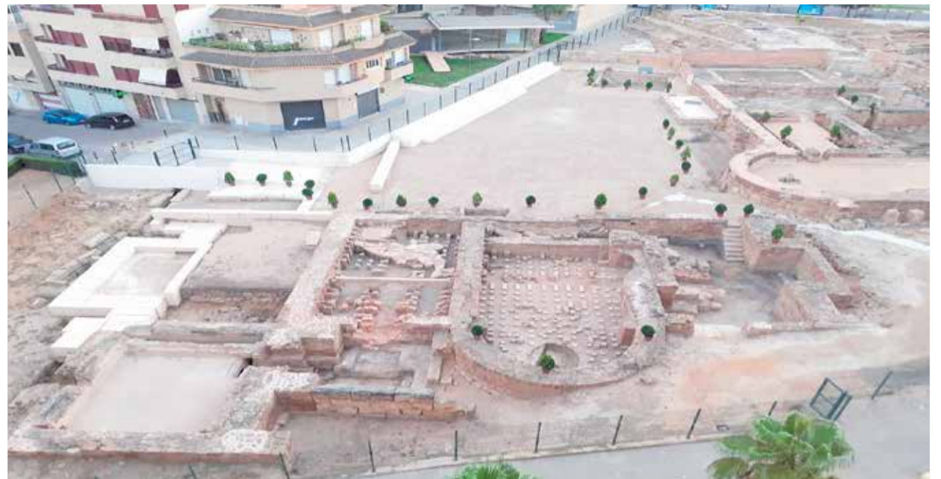
Panorámica de la joya patrimonial de las Termas Romanas de Mura en la ciudad de Lliria.