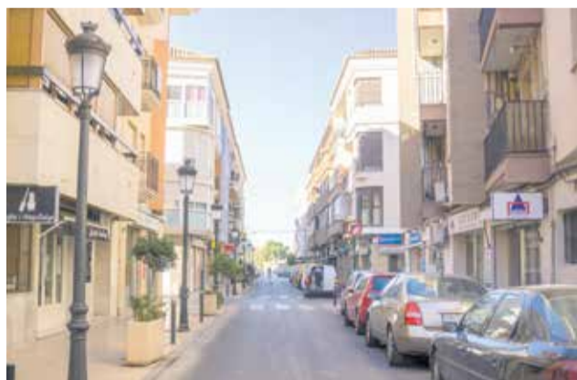
Una de las calles de L'Eliana.

Aquellos cuyos ingresos anuales estén comprendidos entre 22.558 y 26.318 euros, podrán optar al 75 por ciento de la ayuda máxima. La tercera categoría establece unos ingresos anuales de entre 26.318 y 30.078 euros para poder recibir hasta el 50 por ciento de la