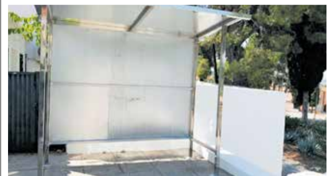
El cerramiento donde se ubicará la consigna.