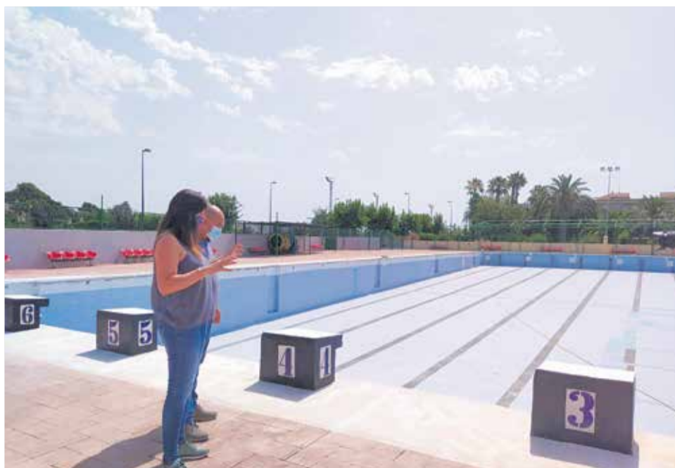
Estado actual de la piscina descubierta de Bétera con las mejoras realizadas.

El deterioro de la piscina era tal que los trabajos de mantenimiento ya no eran suficientes para contener los daños. Según las últimas mediciones de la empresa de mantenimiento de las piscinas municipales, Framat Piscinas, la piscina tenía una