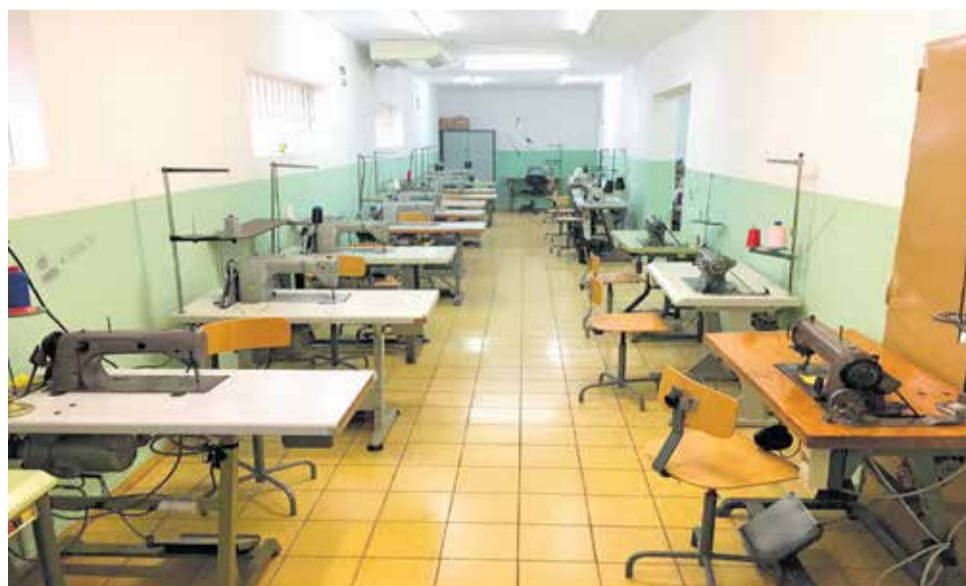
El aula de textil con distancia de seguridad entre mesa y mesa.

No dejes pasar la oportunidad de formarte para adquirir nuevos conocimientos y habilidades para poder desenvolverte en el mundo laboral.