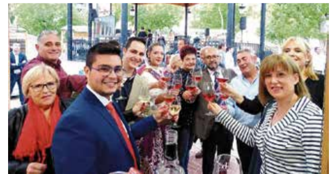
La comarca destaca por sus atractivos gastronómicos

trastar las líneas de actuación de la comarca con las de otras del entorno.