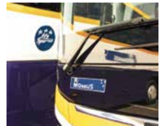
Autocar de Monbus.