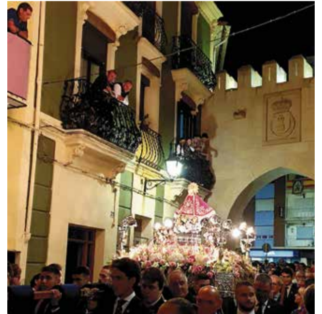
Siempre virgen en tu compañía. / ANDRÉS CEJALVO