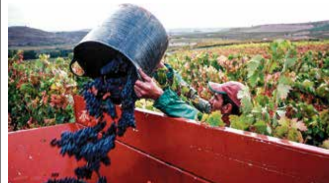
Un temporero recoge la uva en la vendimia.