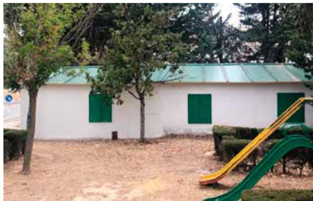
Cubierta de la sede de los scouts.