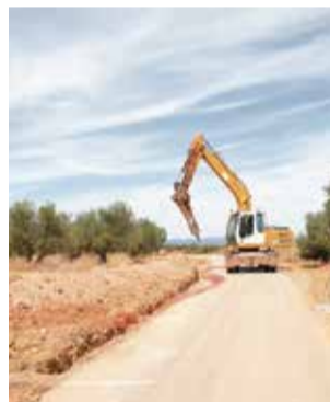
Autoridades y técnicos supervisan el avance de las obras.