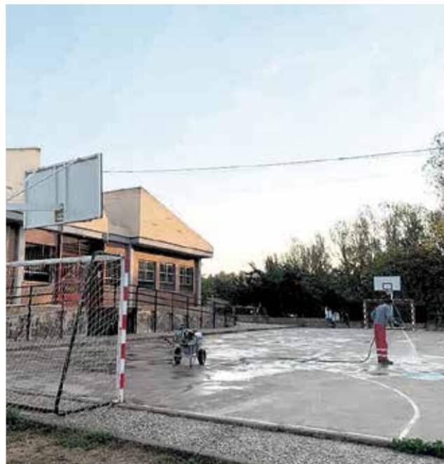
Desinfección de espacios comunes, accesos señalizados y distancia social en los centros de la Venta y aldeas.

En el centro educativo de Venta del Moro se han establecido accesos diferenciados para el alumnado de Infantil y para el resto; se han