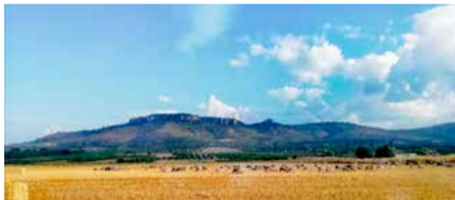
El Molón de Camporrobles. / YASMINA GARCÍA