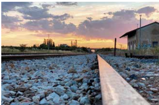
Venir es volver, foto ganadora del concurso.