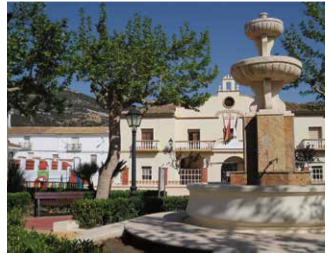
La plaza del Ayuntamiento será uno de los puntos wi-fi.

El Ayuntamiento de Chera ha sido beneficiario de una ayuda por importe de 15.000€ para la instalación de estos puntos de acceso Wi-Fi. Dicha instalación ha sido adjudicada a la empresa ELEC-NOR la cual ya ha procedido a dotar con equipamiento WIFI con cobertura interior y exterior el ayuntamiento (con cobertura interior y exterior), la Plaza de España (cobertura exterior), la Casa de la Música (cobertura interior y exterior), la Piscina Municipal (cobertura exterior), el Poli-