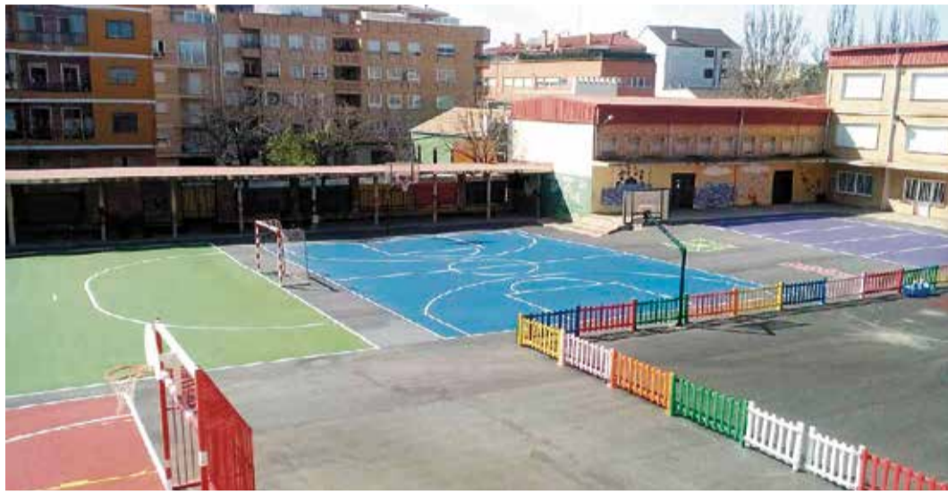
Vista aérea del CEIP Serrano Clavero de Requena.

Es por este motivo que de estas reuniones surge el acuerdo de llevar a cabo Escuela Matinal en los centros educativos de Requena localidad, siempre vinculado a la organización del espacio en cada uno de los centros y a la limpieza y desinfección correspondiente.