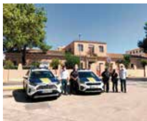
Presentación del nuevo coche.