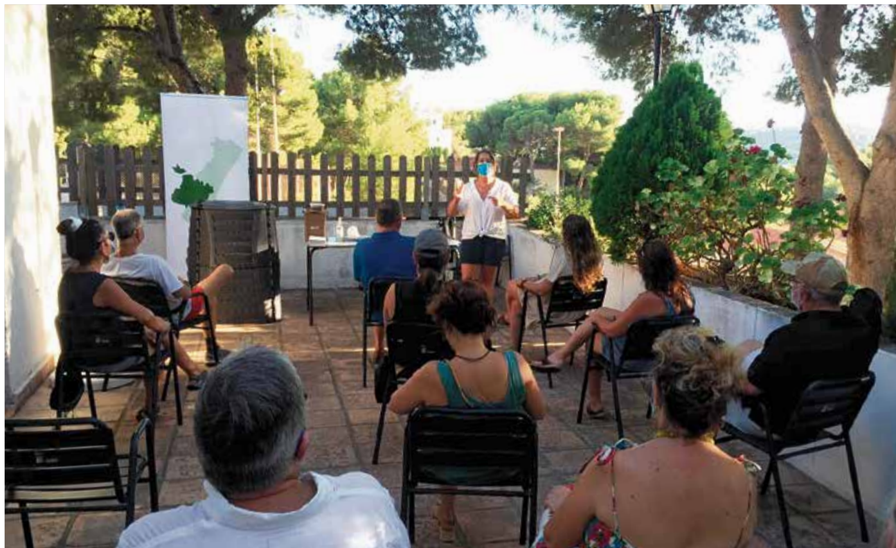
Charla informativa ciudadana.

El CVI está desarrollando el compostaje en dos ámbitos: en los centros educativos y con la ciudadanía en ge-