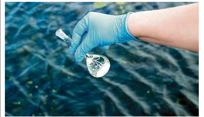
Los últimos análisis han dado 0u/L. / EPDA