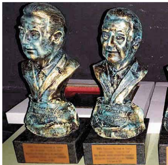
Estatuillas de Los Rambales.

lante con un alto número de contagios y con varias zonas del territorio nacional que han sido confinadas y no se descartan más, por lo que esto supondría un gran inconveniente en caso de seleccionar a algún grupo de la zona afectada. La organización es consciente de la gravedad de la situación actual y las dificultades que encontrarían para celebrar un evento de tal magnitud a nivel estatal.