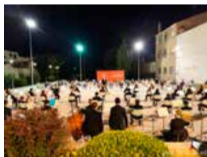
Concierto de verano. / EPDA