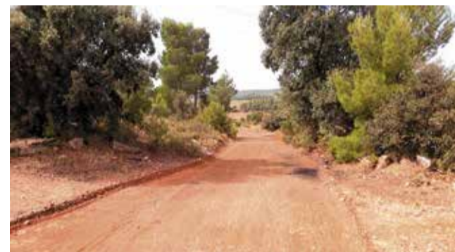
Uno de los caminos que ha reparado el Ayuntamiento.