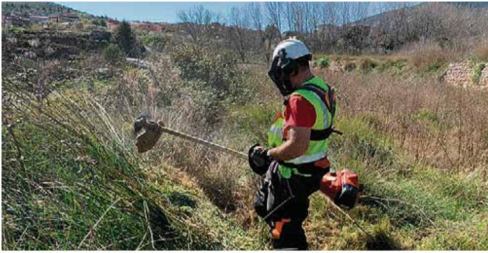
Un operario realiza labores de mantenimiento del bajo monte de Chera.

CHERA HA RECIBIDO MÁS DE 153.000 EUROS ESTE AÑO PARA ESTOS PLANES