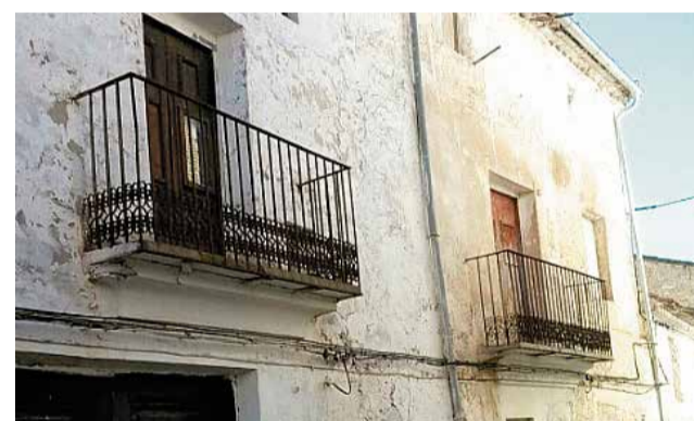
Viviendas en Caudete.