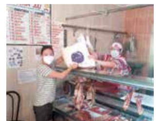
Entrega de bolsas.