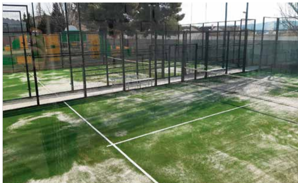
Pistas de pádel del polideportivo municipal de Requena.

DESDE EL PASADO LUNES 15 DE SEPTIEMBRE ESTÁN ABIERTAS LAS INSCRIPCIONES