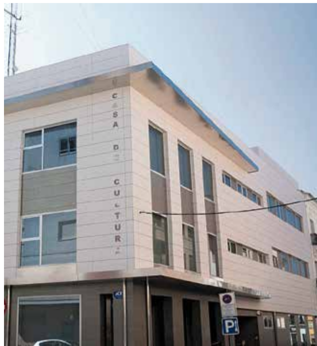
El acto tendrá lugar en la Casa de Cultura de Utiel.

La indiscutible hegemonía del vino y su cultura, acompañada de una vasta tradición artesanal en la elaboración de sus embutidos abren las