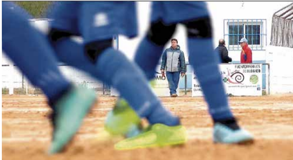
Campo de fútbol de El Moreral de Fuenteserrobles.

Además es importante destacar que el Ayuntamiento de Utiel y el de Caudete de las Fuentes, así como los clubes de las respectivas localidades, han cedido sus instalaciones deportivas para que los cinco equipos de Fuenteserrobles puedan entrenar. El infantil lo hará en Caudete y el resto entrenará en El Nogueral de Utiel.