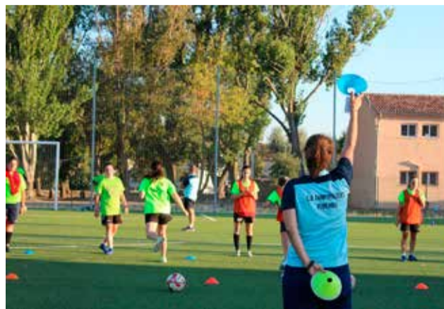
Entrenamiento del CD Camporrobles femenino.

En primaria será obligatoria la mascarilla, tanto para el acceso al centro como dentro