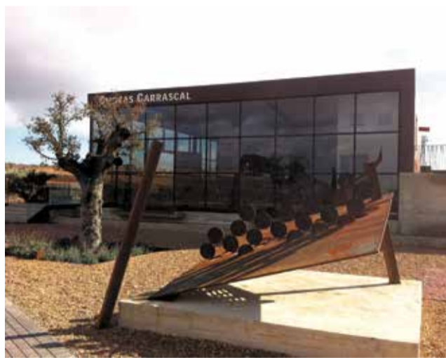
Bodega Chozas Carrascal.

Cabe destacar también que 10 de esos vinos despiden por su inmejorable relación calidad-precio, obteniendo cinco estrellas en esta categoría. Se trata de Aula Syrah 2016 de Bodegas Coviñas; Pugnus Bobal 2016, Expresión Reserva Bobal 2016 y Murviedro Cepas Viejas Bobal 2017 de Bo-