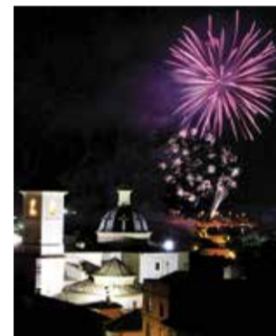
Apoteosis.