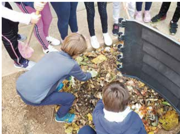
Proyecto del compostaje en un centro educativo.

neral. Los centros fueron los primeros en comenzar a implantar esta campaña transformadora en la gestión de los residuos, concretamente en 2017. En este ámbito son los propios escolares los que