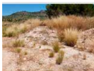
Acopio de tierra.