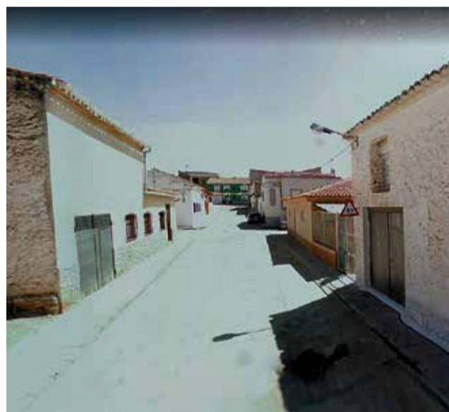
Acceso al centro educativo.

El CRA Entreviñas, por su parte, también ha establecido accesos escalonados para evitar las aglomeraciones. En el Edificio A, destinado al alumnado de Infantil, Primero, Segundo, Tercero y Sexto de Primaria los accesos para entrar están señalizados desde la entrada, pasando por el patio, hasta la puerta principal del edificio, por el lado derecho, subiendo por la rampa. La salida, sin embargo, se realiza por un recorrido paralelo al de entrada, bajan-