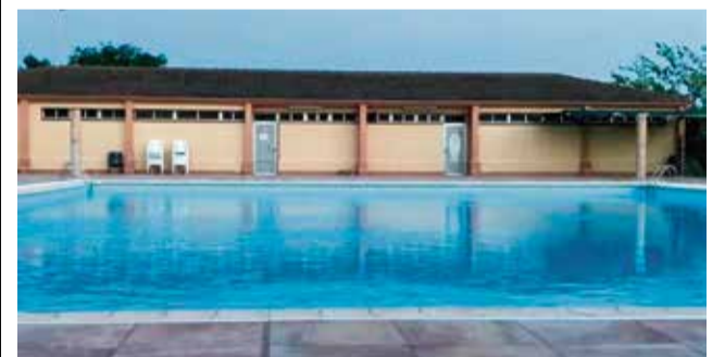
Piscina de Fuenteserrobles.