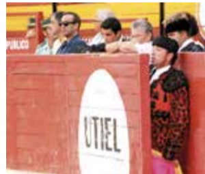
En el burladero.