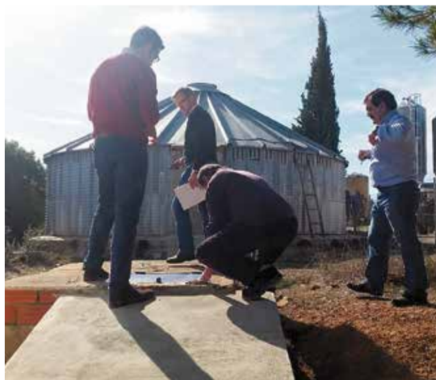
Instalaciones de la red de aguas potables.

El proyecto de canalización y soterramiento de la tubería que conducirá el agua potable desde el Pozo Sierra Bicuercia hasta el depósito intermedio se complementará con la obra que se podrá ejecutar gracias a la subvención concedida por la Secretaría Autonómica de Emergencia Climática y Transición Ecológica de 45.911,87 €. Se trata de las obras de renovación de la estación de bombeo y tubería de impulsión a depó-