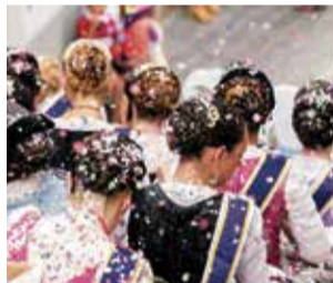
Y colorín, colorado