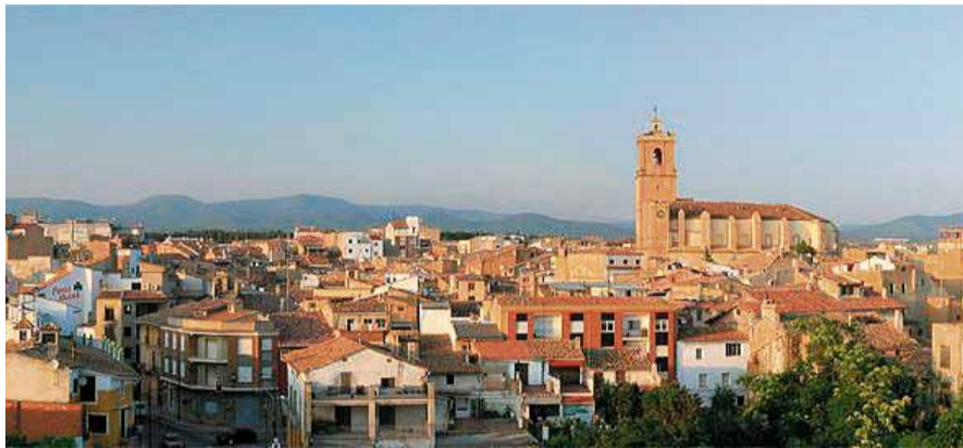
Vista panorámica de Utiel.

En este sentido, se ha intensificado el servicio de limpieza en todos los cen-