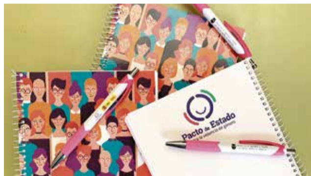
Material divulgativo. / EPDA