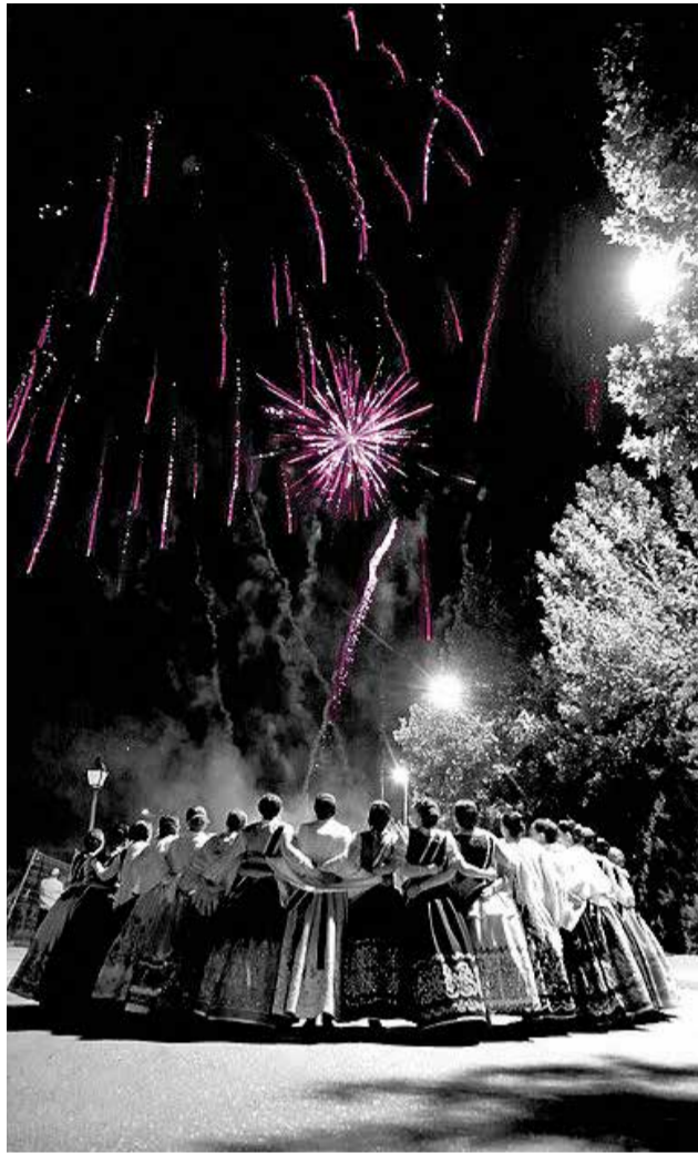
No es un adiós, es un hasta luego.

En total, el Ayuntamiento de Utiel ha concedido 850 euros en premios, que los ganadores podrán canjear por productos o servicios de cualquiera de los establecimientos adheridos a la Asociación de Industria y Comercio de Utiel (AICU), Marca de Calidad y Asociación de Hostelería de Utiel.