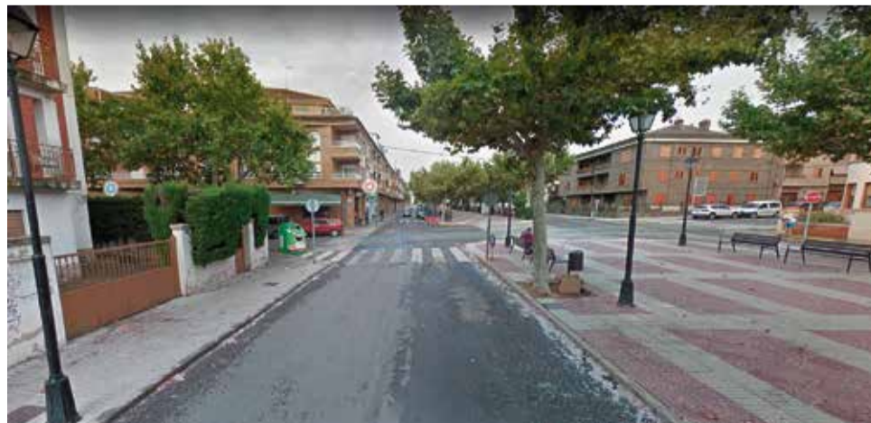
Avenida Arrabal de Requena.

La peatonalización ha cursado con total normalidad y ha cundido la responsabilidad y la precaución.