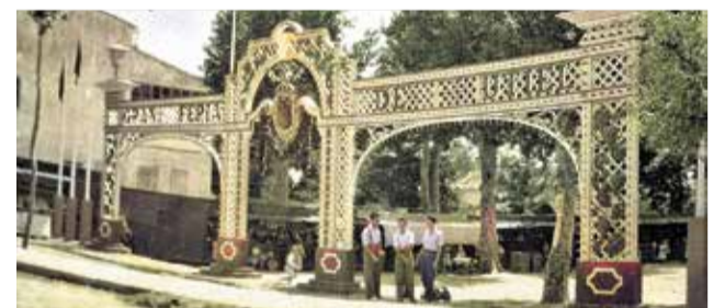
Arco de la feria colorado.