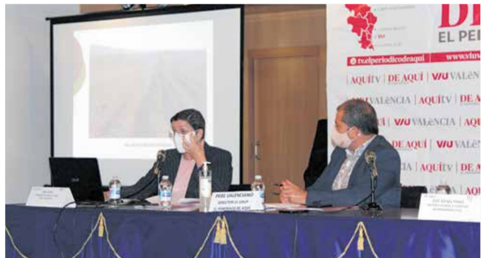
Ponencia de la presidenta de la Ruta del Vino.