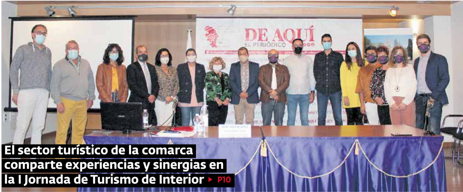
El sector turístico de la comarca comparte experiencias y sinergias en la I Jornada de Turismo de Interior ► P10