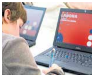
El plan incorporará a 13 personas.