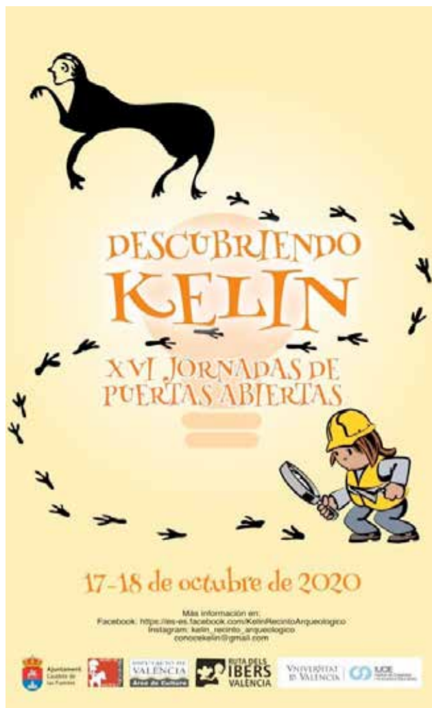
Cartel alusivo de las Jornadas ‘Descubriendo Kelin’.

objetivo de evitar, en la medida de lo posible, los riesgos de contagio de la Covid-19. Se trata de un programa de actividades reducido pero suficientemente ilustrativo de la importancia histórica que tiene y patrimonial que tiene