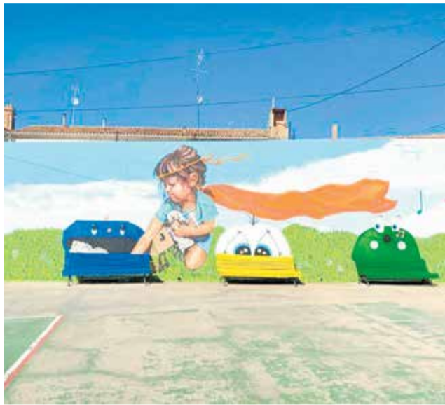
Fragmento del mural realizado por 'Tamoji'.

El mural representa una niña con su capa de super heroína, reciclando en divertidos contenedores de reciclaje, cada uno en su color y dedicado a su residuo (verde vidrio, amarillo plástico y azul papel).