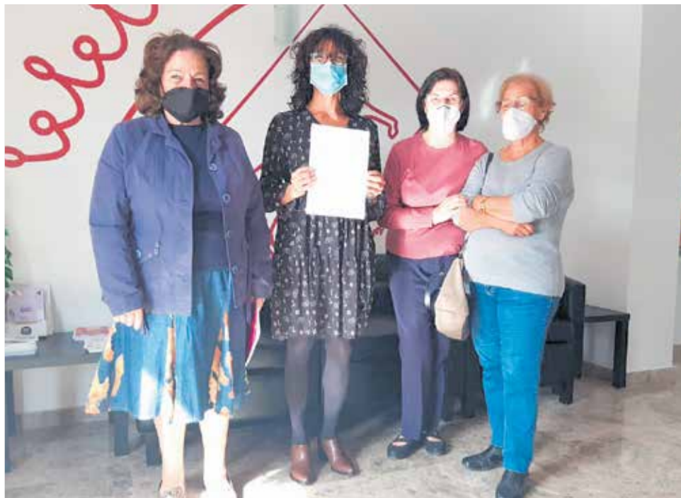
La alcaldesa de Villargordo junto a las vecinas que han recogido las firmas.

“Estamos haciendo todo lo posible para restablecer el servicio del bus en el municipio -ha explicado Suárez- mantenemos reuniones periódicas con el director territorial de