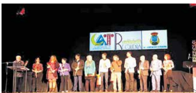
Entrega de premios de la edición 2019.