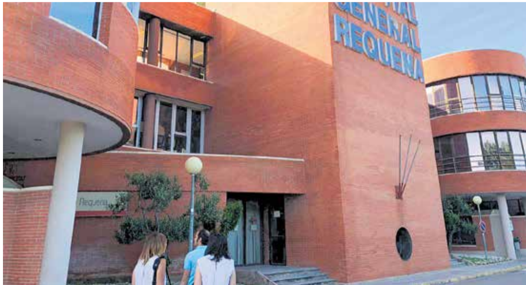
Acceso al Hospital de Requena.

Se parte de la base de que es imposible garantizar un entorno completamente libre de riesgos y, por tanto, "el objetivo no es ni puede ser otro que reducirlo en la medida de lo posible, aplicando las recomendaciones médicas con los conocimientos