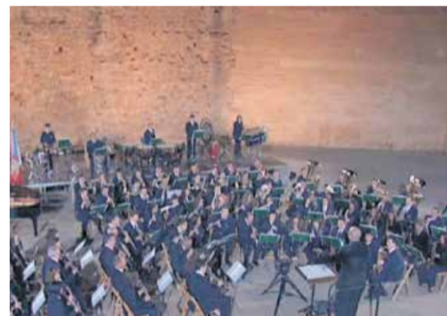
Sociedad Musical Santa Cecilia de Requena.

La primera edición se centró en la Banda Municipal de Valencia, y el domingo 27 de septiembre se estrenó la temporada de bandas municipales con un documental sobre la Sociedad Musical Santa Cecilia de Requena. Este proyecto audiovisual pretende acer-