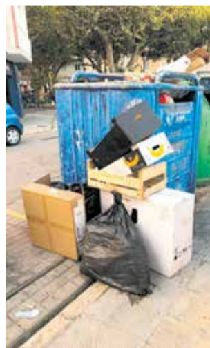
Evitar imágenes como estas es el objetivo del Plan.

tir de ahora para el servicio de limpieza viaria se contará con más personal gracias al nuevo Plan de Empleo local 'Requena trabaja', concluyen.