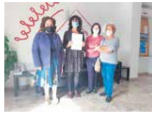
Villargordo exige a las Administraciones una solución para la suspensión del servicio de bus ► P14