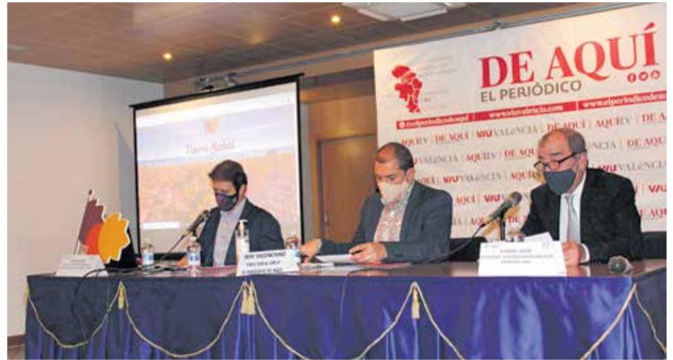
Ponencia de la Mancomunidad del Interior Tierra del Vino.

Tras un coffe-break con vinos de la Do Utiel-Requena y una degustación de productos de la comarca ofrecidos por la Denominación de Origen y por Bodegas Utielanas, el acto se coronó con una visita a las bodegas subterráneas que han recuperado en los últimos años en Utiel.