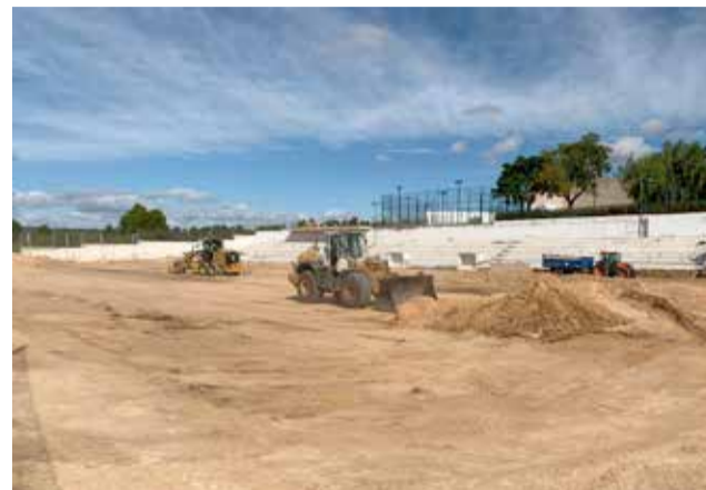
Las palas preparan el terreno para el césped artificial.