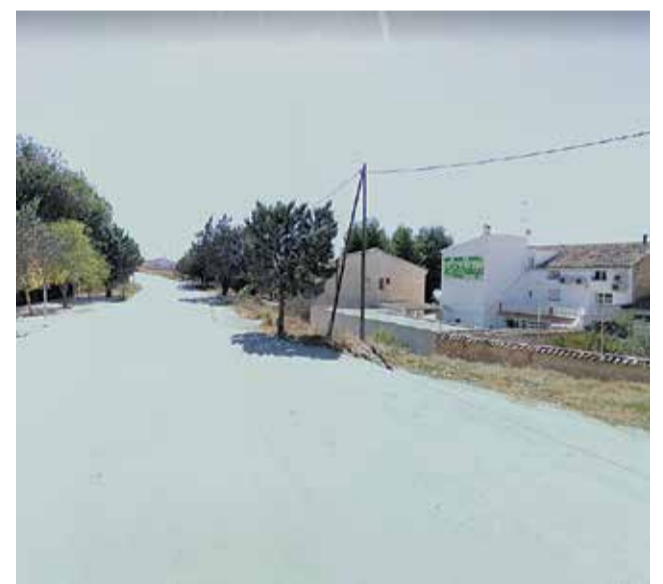
La calle Madrid será una de las remodeladas.

Por último, está previsto también sustituir la infraestructura actual de suministro y de tratamiento de aguas de la piscina pública municipal con la ayuda concedida por la Diputación de València y que, para este concepto, ha destinado 32.728,00 euros.