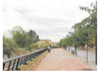
Utiel recibe el 1er premio de la Semana de la Movilidad para pueblos de menos de 20.000 habitantes ► P8