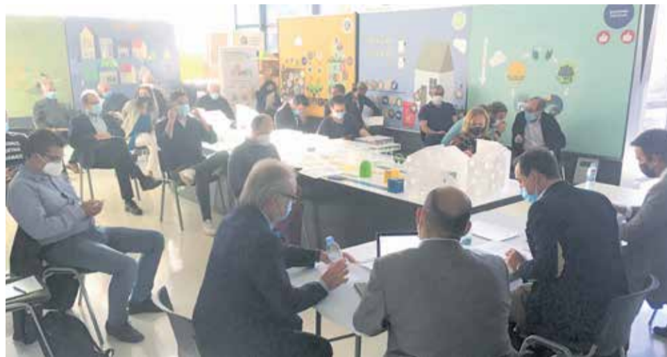
Asamblea del Consorcio Valencia Interior celebrada este miércoles 15 de octubre.

Independientemente de este ajuste de importes para 2021 por la situación anómala de este año, antes del verano el Consorcio decidió retrasar a octubre el periodo de cobro de la anualidad en curso y facilitar la solicitud