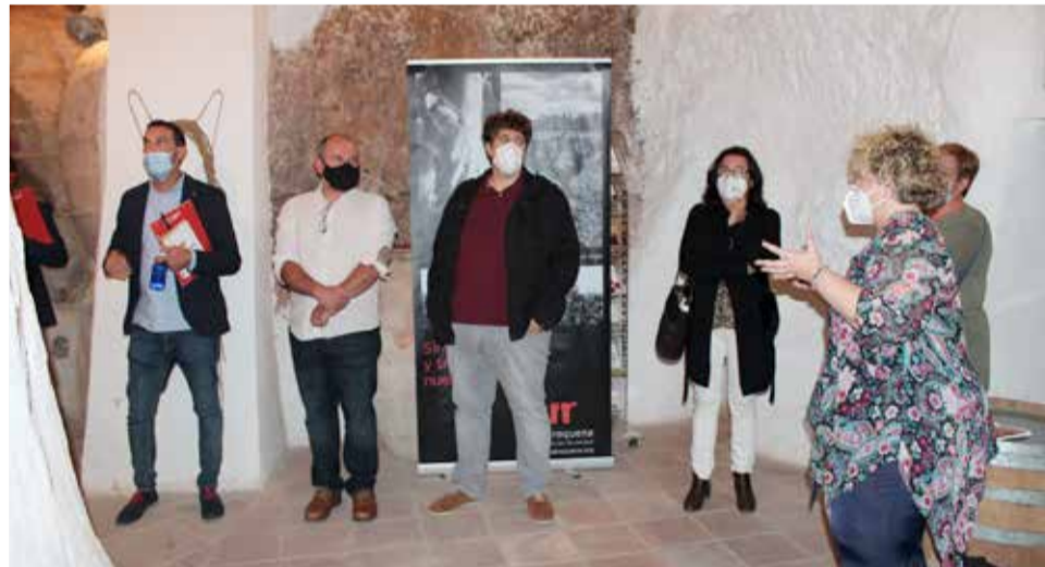
Visita a las bodegas subterráneas.

nio particular de cada pueblo, en nuestro caso, las bodegas subterráneas, que son un valor de gran importancia ya que muestran toda la evolución de la producción vitivinícola a lo largo de los siglos”.