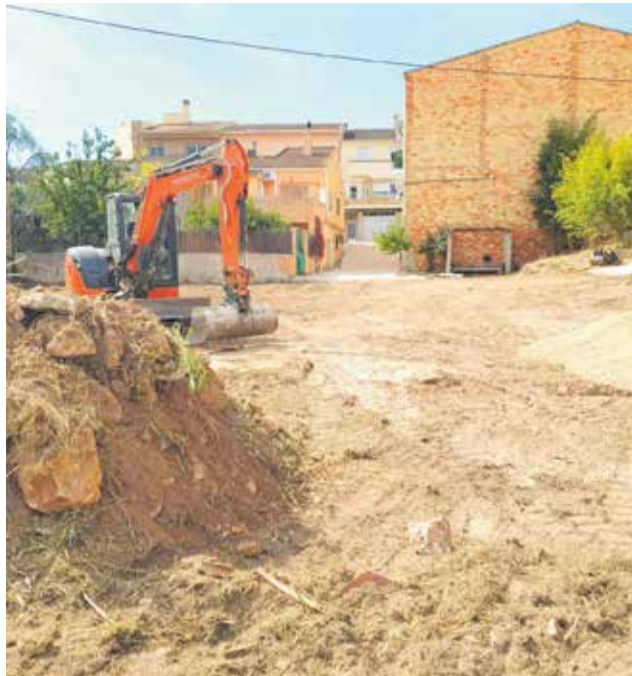
La disponibilidad de aparcamiento es una de las mejoras reclamadas por los cheranos y visitantes.

A esta obra se añadirán una serie de actuaciones también financiadas por la Diputación