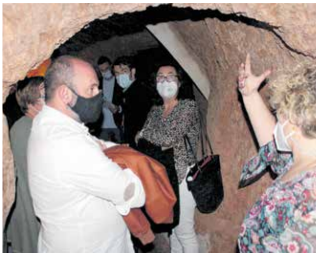
Una visita a las bodegas subterráneas.

Teniendo en cuenta los protocolos de higiene y seguridad