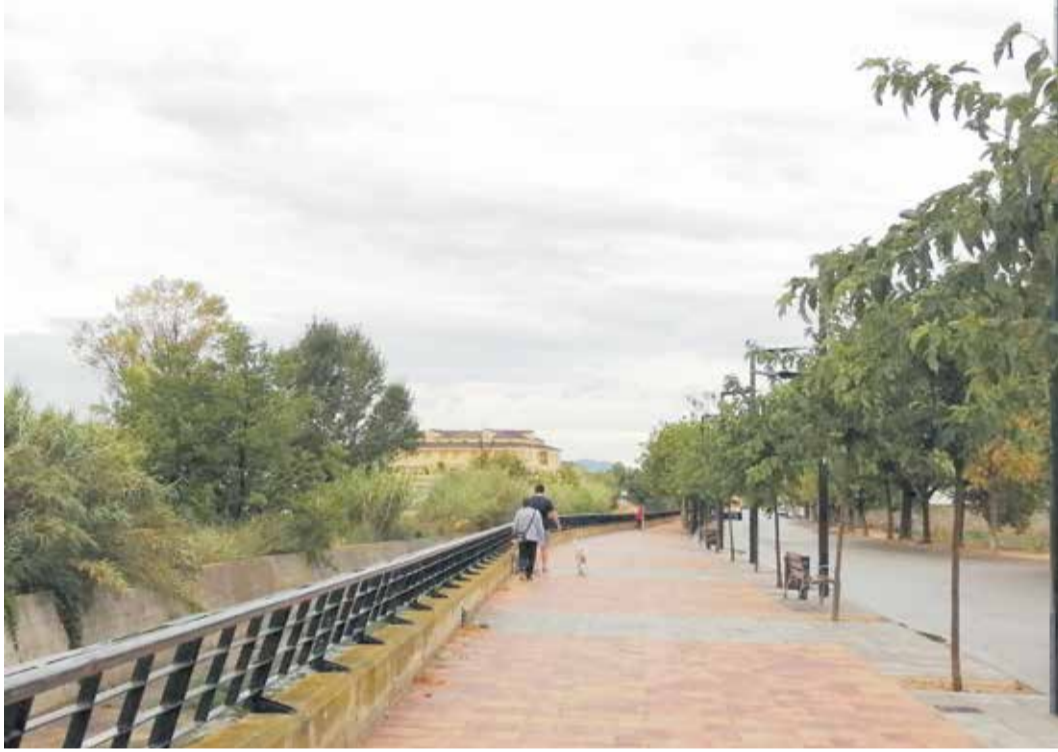
El Paseo del Río Magro es la acción reconocida por la Conselleria.

En concreto Utiel recibía el primer premio en la categoría de municipios de menos de 20.000 habitantes por la recuperación del itinerario peatonal saludable en la zona correspon-