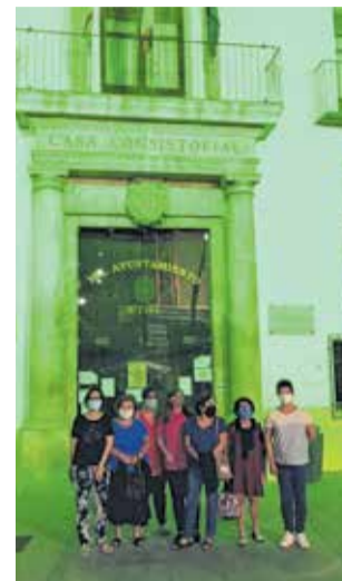
El ayuntamiento, verde.

La iluminación de la fachada consistorial forma parte del programa de actividades que organizó la Asociación de Familiares de Enfermos de Alzheimer de Utiel y Comarca (AFEUC) que incluyó la lectura del manifiesto del Día Mundial del Alzheimer y el llamamiento a la ciudadanía