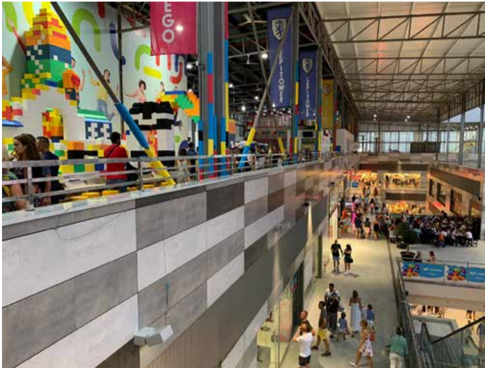
Vista del Centro Comercial L'Épicentre.

Tenemos también la llegada al Centro Comercial de LIAOPASTEL una franquicia de pastelerías, centrada en el amor al producto y al saber hacer, donde presentan las recetas más clásicas con los mayores estándares de calidad y donde los pasteles son el centro de su universo.