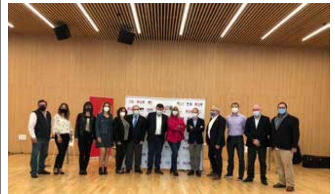
Parte de la directiva en la última asamblea.