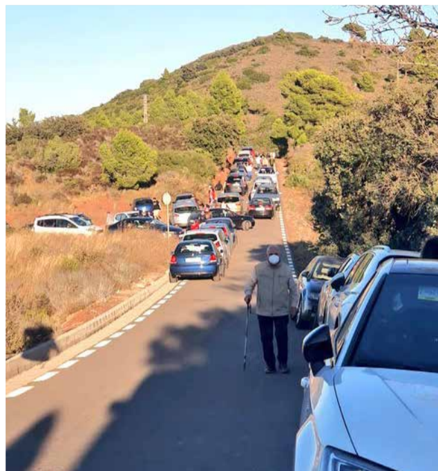
Masificación en el mirador del Garbí

En el caso del mirador del Garbí, esta situación ha provocado que los usuarios acudan con sus vehículos privados a puntos donde las carreteras son muy estrechas, impidiendo la circulación y bloqueando los accesos en el caso de que hubiese alguna emergencia.