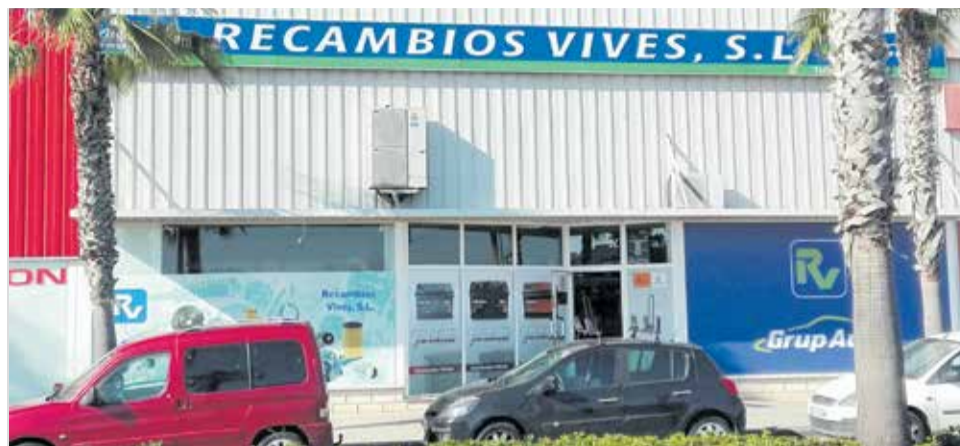
Recambios Vives.

Recambios Vives ofrece piezas y accesorios de coche a precios reducidos, procedentes de fabricantes reconocidos. Tanto si se trata de