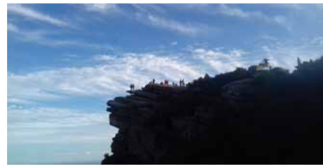
Masificación en el mirador del Garbí

traciones para aprovechar este interés positivo por disfrutar más de la naturaleza para concienciar sobre la necesidad de respetarla a través de la educación ambiental.