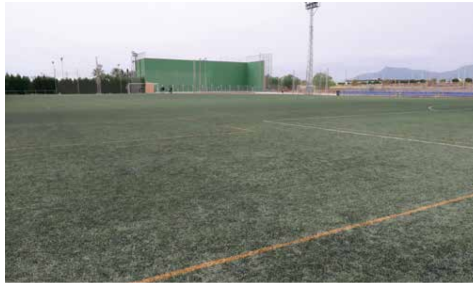
Vista del polideportivo municipal.

Alternatura es un programa impulsado por el departamento de Deportes del Ayuntamiento de Sagunt, el cual fomenta la realización de actividades físicas al aire libre y en espacios abiertos y naturales. La programación se divide en dos temporadas: