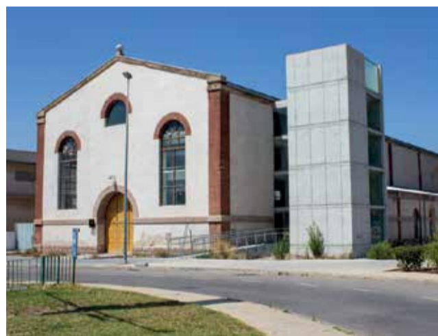
Futuro museo industrial del Port de Sagunt.

La Junta de Gobierno Local de Sagunt ha aprobado los pliegos y el expediente de licitación de las obras de finalización de la rehabilitación de la antigua nave de efectos y repositos que albergará el futuro museo industrial y de la memoria obrera. Cabe recordar que esta es una intervención paralizada desde el año 2013 que partía con la financiación de la Generalitat Valenciana a través del Plan de Inversión Productiva pero que, con la autorización de la Generalitat, actualmente está cofinanciada municipalmente.