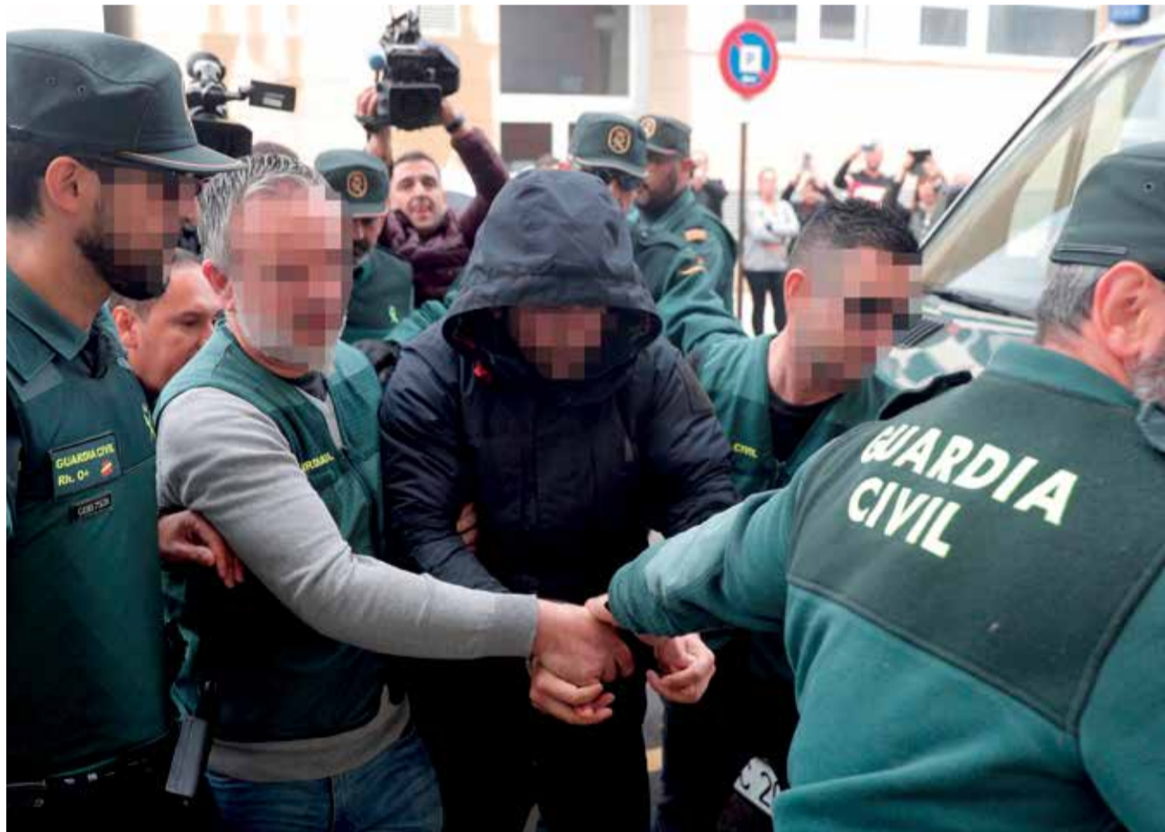
El acusado entra a los juzgados a prestar declaración.