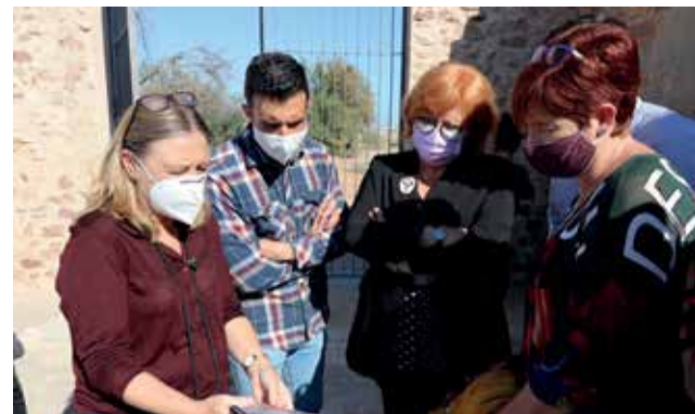
Un momento de la visita.