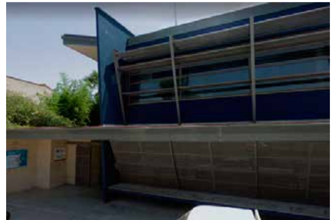
Centro de Salud de Estivella.

Esta incidencia se ha conocido después de que el centro de salud del municipio de Estivella haya enviado una circular a los ayun-