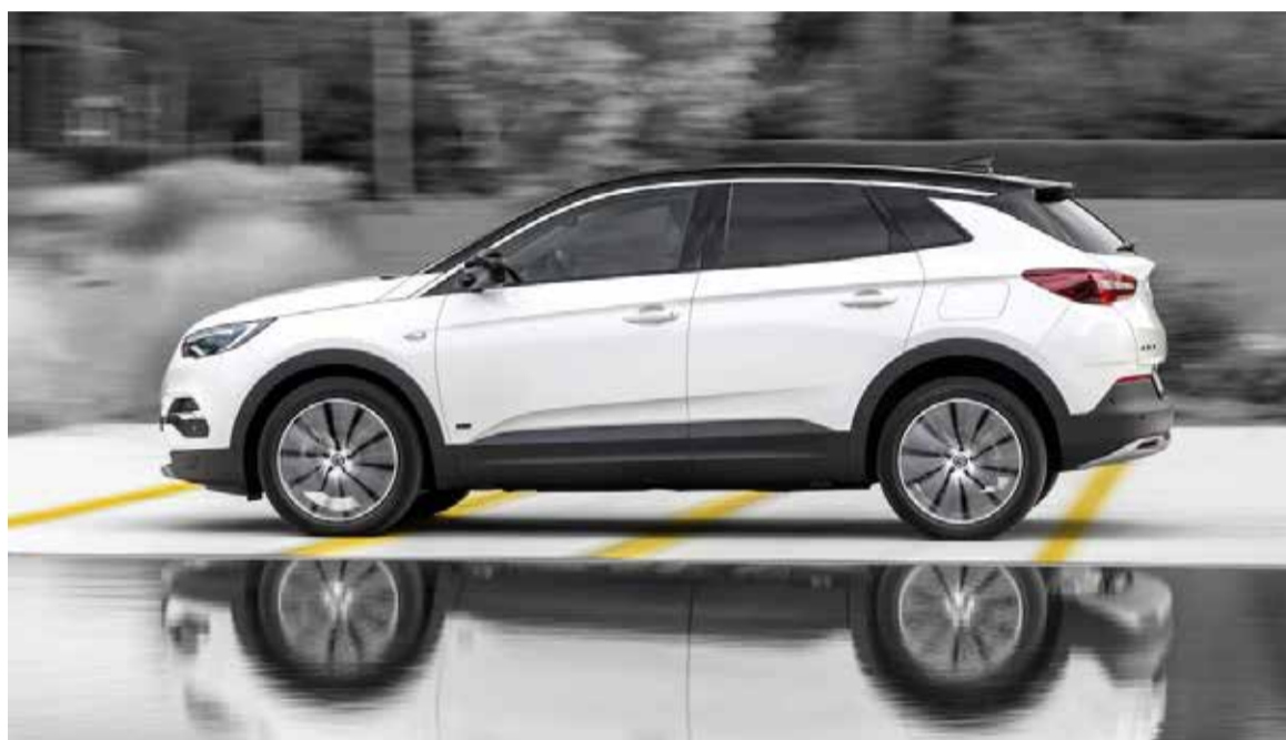
Dos modelos del Grandland X Híbrido.