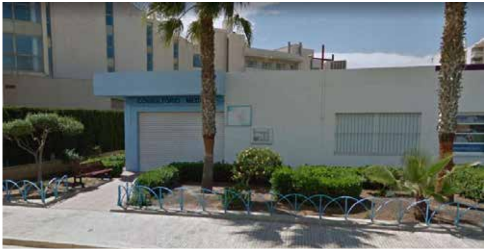
Consultorio auxiliar de la playa de Canet.

LA EDILA DE SANIDAD LO RECHAZA Y RECUERDA QUE SÓLO SE ATIENDE POR TELÉFONO