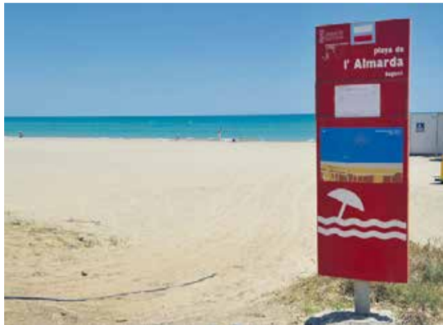
Playa de Almardà.

Los vecinos piden que "una vez elaborado el recurso contencioso administrativo se presente sin mas demora, ya que entendemos que si la Dirección General de la Costa y el Mar presenta un proyecto de re-