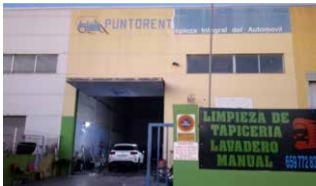
Instalaciones de Punto Rent.

Además de la limpieza integral de turismos, todoterrenos y furgonetas, Punto Rent ofrece el servicio de limpieza y reparación de tapicerías y de desrotulado. Lle La Molineta del Polígono de Canet.