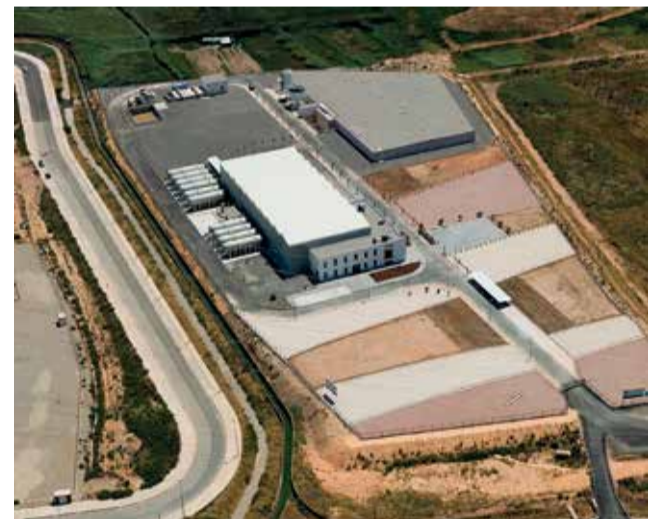
Vista aérea de la desaladora.

La empresa Acuamed promovió la actuación dentro del Programa AGUA (Actuaciones para la Gestión y Utilización del agua) y firmó convenios con los ayuntamientos de Cabanes, Oropesa del Mar, Moncofa, Chilches, Benicasim y Sagunto. Ninguno de los grandes proyectos se materializó en los términos acordados.