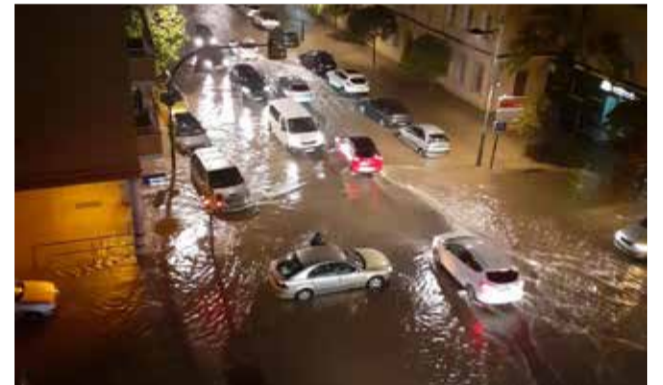
Problemas en diferentes zonas del Port de Sagunt debido a las intensas lluvias.