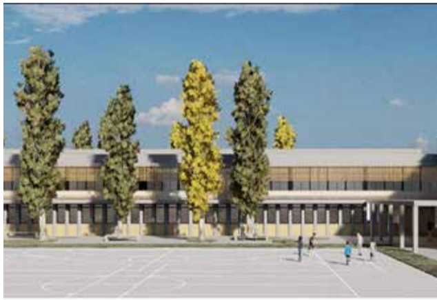
Infografía del nuevo IES de Canet. / EPDA

El IES de Canet, que cuenta con un presupuesto de 6.700.000 euros, se construirá sobre una parcela de 10.000 metros cuadrados ubicada entre el campo de fútbol de la Figuereta y el centro educativo Camarena. Contará con 12 líneas de ESO y 4 de bachillerato, para una capacidad de más de 500 alumnos. El edificio se distribuirá en dos plantas, una planta baja que acogerá los seminarios de tecnología, ciencia..., laboratorio, salas polivalentes, la biblioteca, aula de música, conserjería, sala de