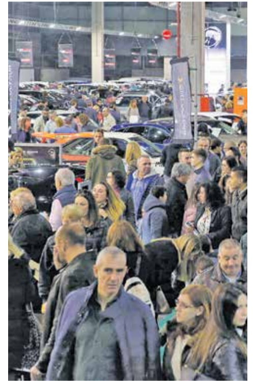
Imagen de una feria.

Este plan de incentivos, aunque también se ofrecerá para la compra de vehículos diésel y gasolina (que en un principio podrían considerarse contradictorios con el plan de transición energética), busca reducir las emisiones contaminantes modernizando el parque automovilístico actual y cambiando modelos con más de 10 años por otros más eficientes y menos contaminantes.