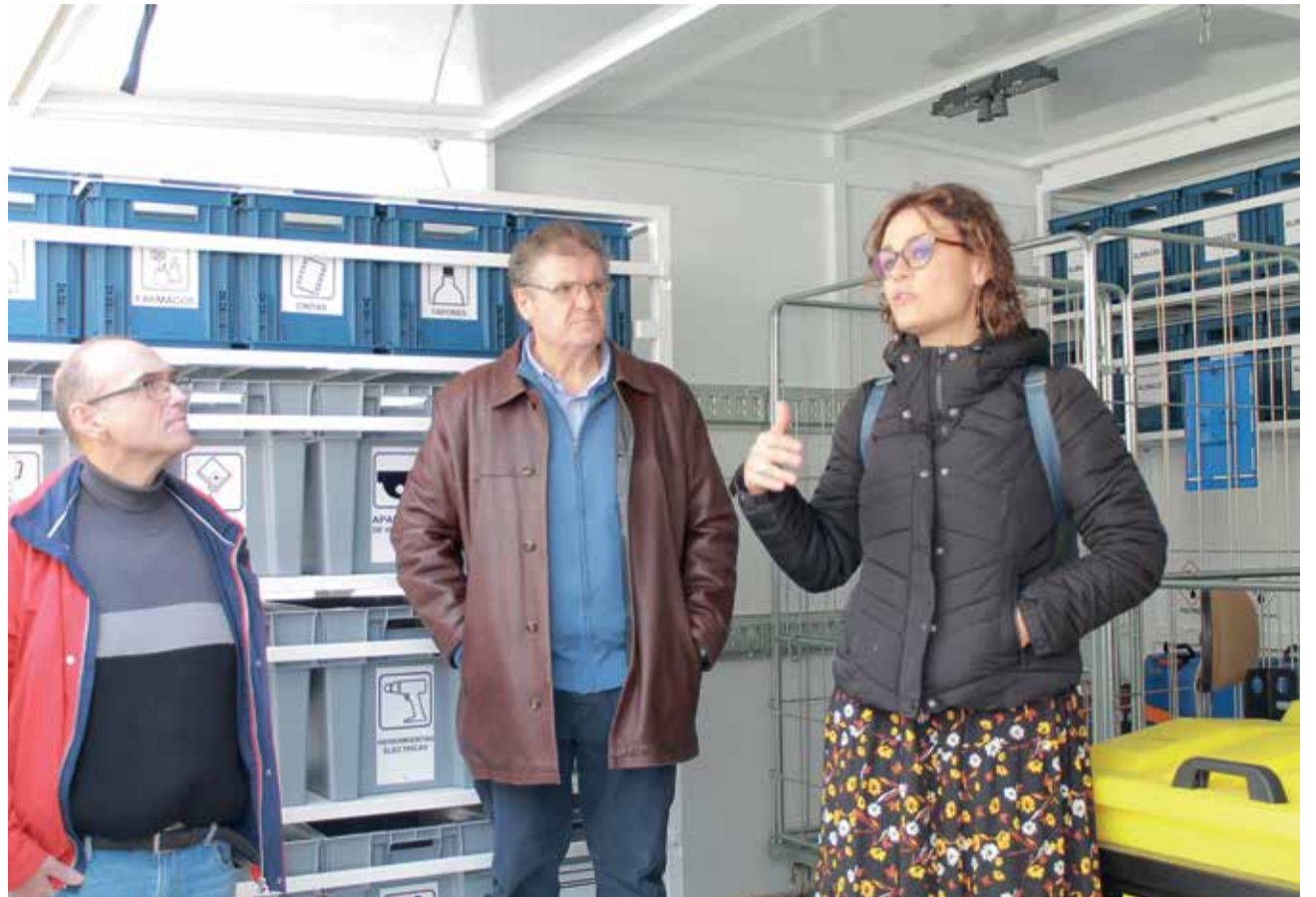
El presidente del Consorcio atiende las explicaciones con el presidente de la Mancomunitat de les Valls.

Durante 2019 la cantidad destinada a reducir la tasa por valorización y eliminación de residuos urbanos fue de cerca de 90.000 euros, lo que supone que este año ha superado cuatro veces esta cantidad.