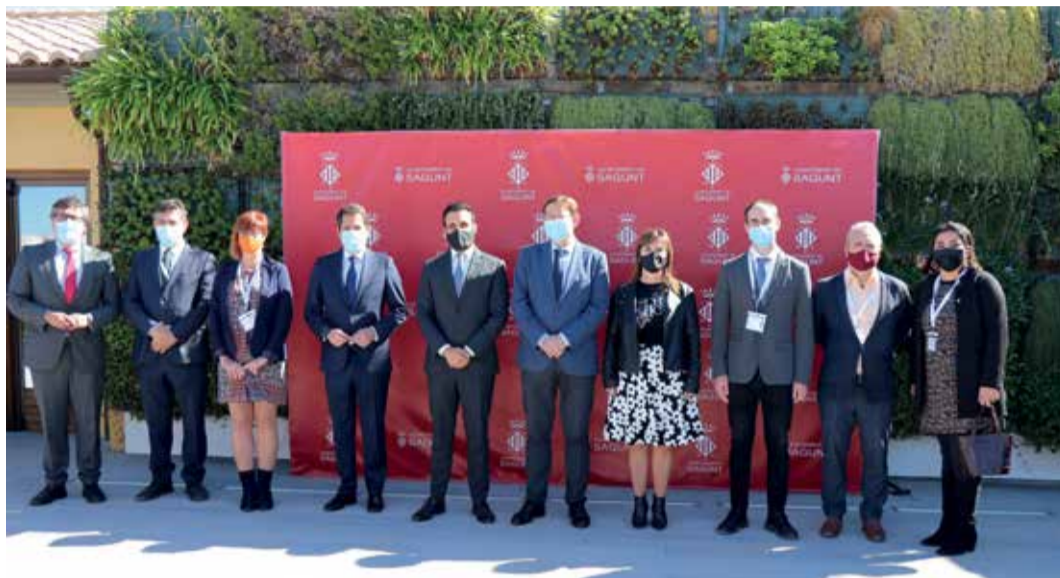
Autoridades tras el encuentro.

En su intervención, el presidente de la Generalitat, Ximo Puig ha destacado la importancia de celebrar este tipo de jornadas que ayudan a sumar todas las inteligencias posibles para avanzar hacia una misma dirección, ya que considera que es necesario que exista una coalición de intereses públicos y privados que trabajen conjuntamente para generar empleo y seguridad en la inversión. Sobre Sagunt, el presidente de la