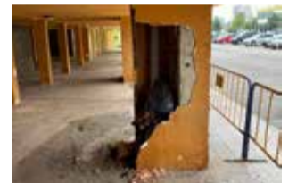
Estado de un pilar.

Llevamos tiempo denunciando esta situación mientras el equipo de gobiernos nos acusan de plantear un problema inexistente pero basta con visitar el barrio, y ver cuál es la realidad.