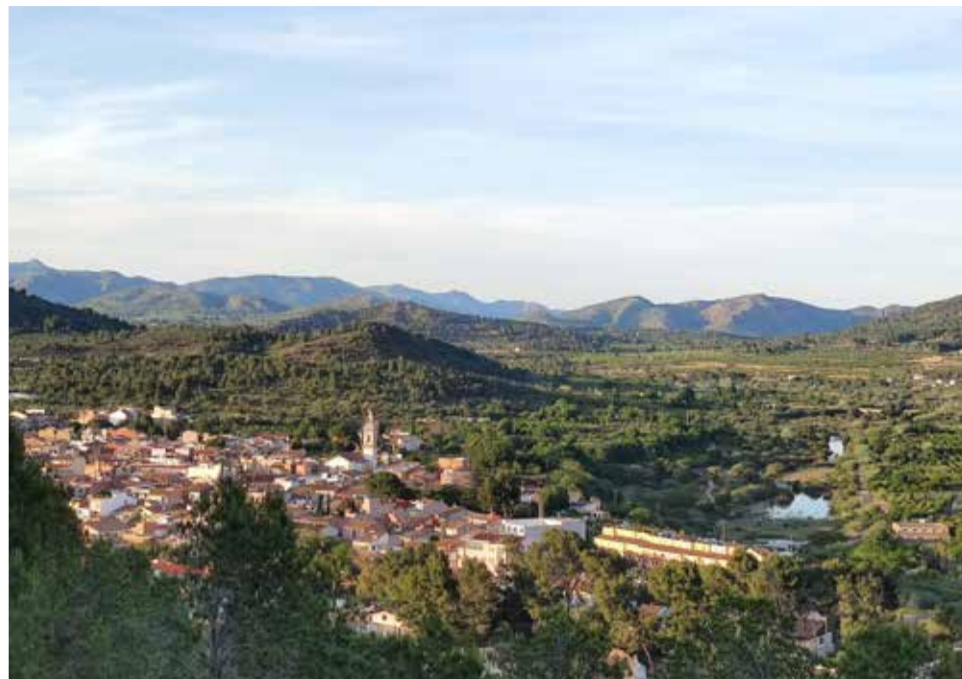
Vista de Estivella.