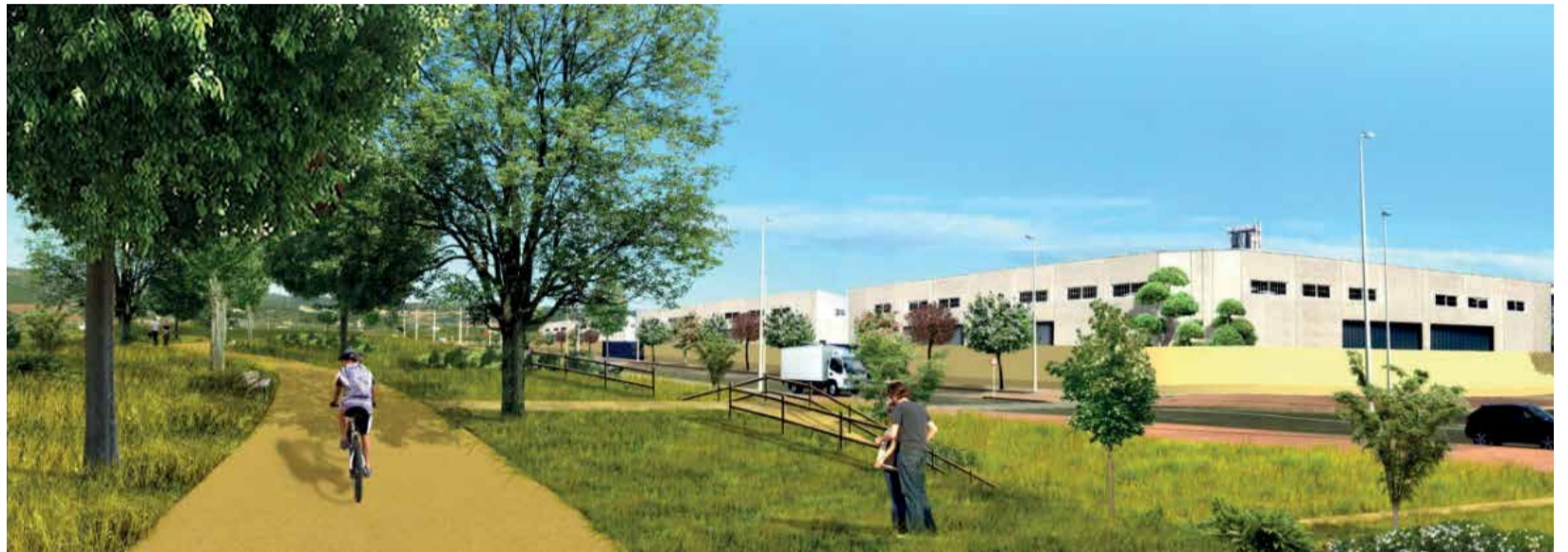
Recreación de la zona verde en Parc Sagunt.

En este sentido, ha recordado que Parc Sagunt se encuentra muy próximo al Marjal del Moro, espacio natural integrando en la Red Natura 2000, como Zona de Especial Protección para las Aves, ZEPA, por la gran diversidad de especies que alberga y por ser un importante refugio para algunas aves en peligro de extinción. También está declarado Lugar de Interés Comunitario, e incluido en el Catálogo de Zonas Húmedas de la Comunitat.