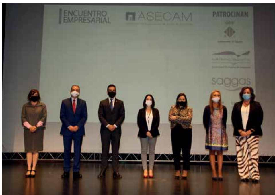
Las autoridades tras el encuentro.

Por su parte, el presidente de la Diputación de València ase-