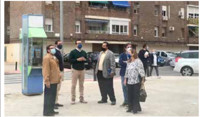
Un momento de la visita al barrio.