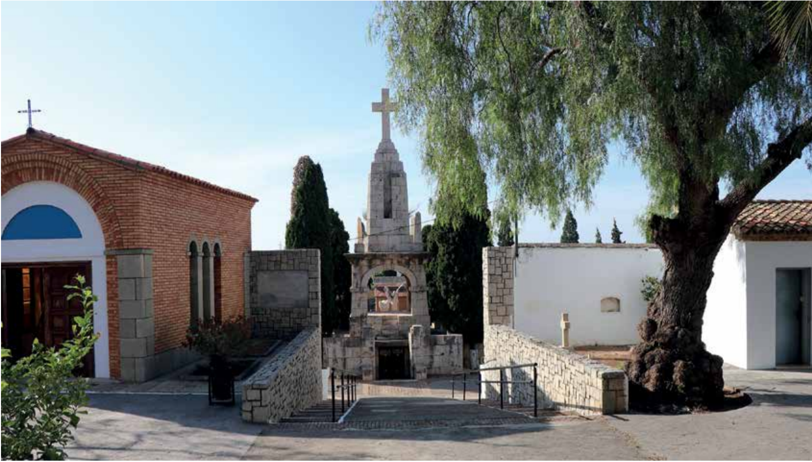
Cementerio municipal de Sagunt.

ESTE AÑO NO SE SUMINISTRARÁN NI CUBOS NI ESCOBAS Y SE RECOMIENDA ESPACIAR LAS VISITAS PARA EVITAR AGLOMERACIONES