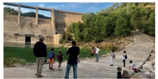
Plaza y presa de Algar de Palància.

objetivo de desarrollar diversas acciones para posicionar la comarca y mostrar a los visitantes el patrimonio cultural, natural y la gastronomía de La Baronía, Les Valls, Sagunto y