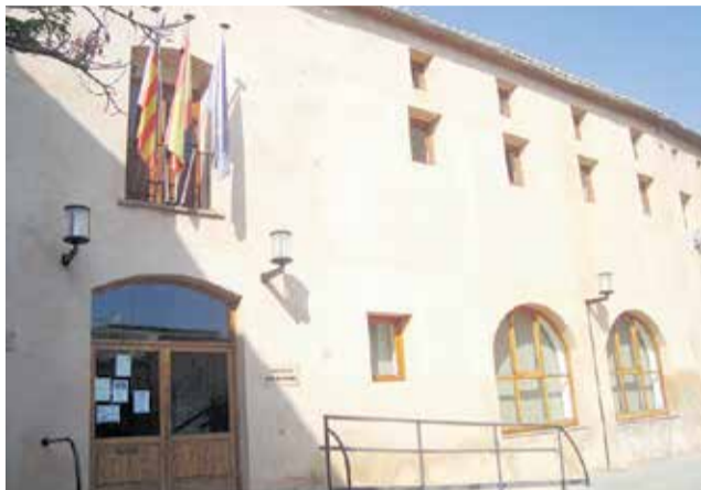
Ayuntamiento de Benavites. / EPDA

Gil ha señalado que el compromiso de la corporación municipal es poder estudiar una nueva rebaja para el