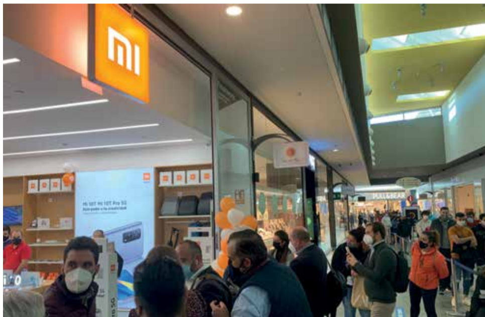
Apertura de una de las tiendas de Xiaomi.

Dentro de su expansión, Xiaomi realiza un estudio mi-