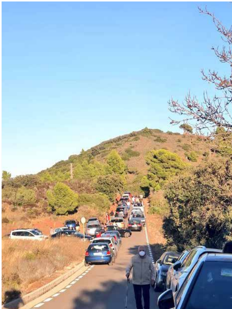
Colapso de una de las vías de acceso al mirador.