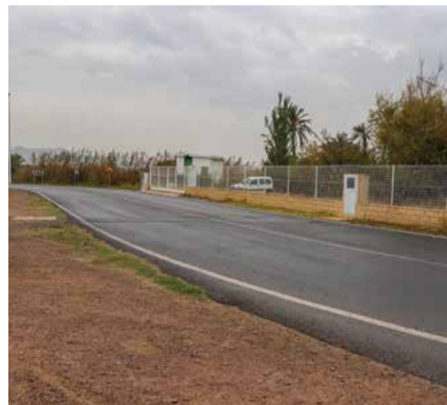
Vial junto a la Casa Peña.

Así el proyecto incluye la finalización de la mota o pantalla paisajística que rodea el ámbito territorial del parque empresarial y lo separa del marjal para adecuarla en los casos en los que sea necesario ampliarla para que pueda albergar el paseo ciclo-peatonal que debe discurrir por su coronación y el arbolado que lo acompaña.