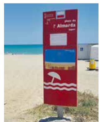
Playa de Almaridà / EPDA

recurso administrativo, «pero no tenemos que perder de vista el contencioso administrativo, dada la falta de respuesta absoluta por parte de la delegación de Costas y de la dirección general de Costas», ha señalado el alcalde.