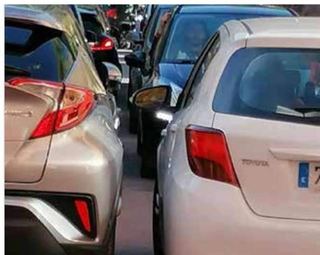
Una de las calles de Segart saturada.

ga, que afirma que "el 80% de los que suben al Garbí o hacen la ruta de las Cadenas, aparcan en el pueblo, invadiendo parcelas, dejando los vehículos en doble fila y bloqueando la salida del pueblo e incluso la circulación", lo que supondría un problema en el caso de que una ambulancia necesitase pasar ante una emergencia. Una situación que "ha ido empeorando desde el inicio de la pandemia, sobre todo desde el desconfinamiento". Se trata de "un pueblo pequeño que no tiene parking ni está preparado" para la llega-