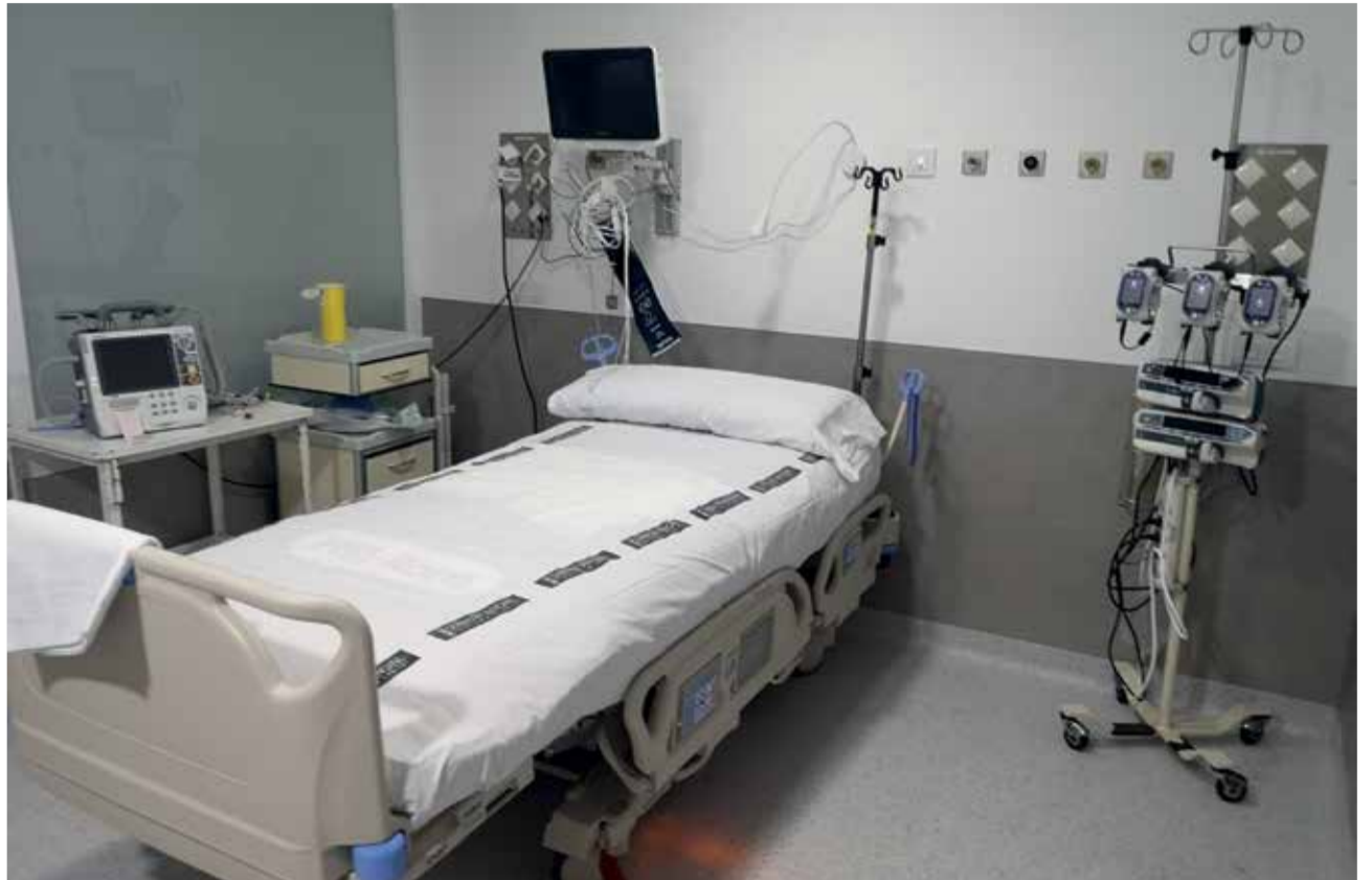
Una de las camas de la nueva ampliación de la UCI.

Se trata de una actuación no prevista que el Departamento de salud de Sagunto ha queri-