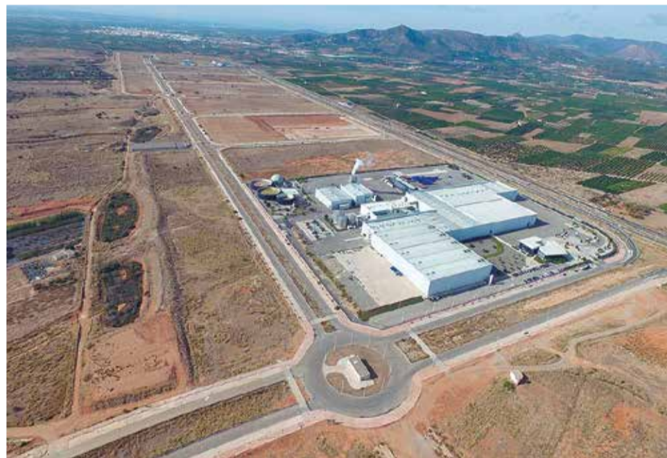
Vista aérea de Parc Sagunt.

Esta ubicación ha hecho necesario el desarrollo de un importante proyecto para la generación de una fachada natural que sirva de delimitación entre los dos espacios, permita la integración paisajística del parque y ejerza de pantalla protectora de impactos acústicos y visuales, para lo que se cuenta con un presupuesto de más de 6 millones de euros.