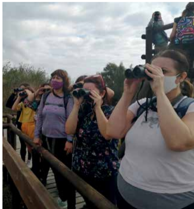
Una de las actividades.

rante el puente de octubre, las cuales han contado con una amplia participación y han despertado el interés de personas de distintos municipios. En to-