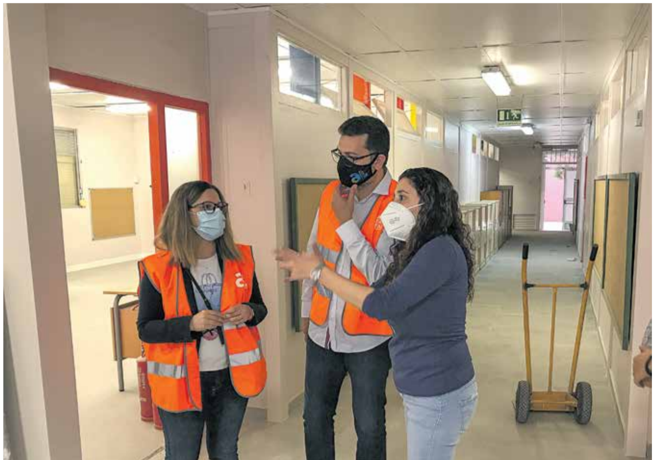
Autoridades visitando las obras del CEI Rabisancho

El propio consistorio de la ciudad d'Alfatar reafirma así su compromiso con la calidad de la educación en todos los centros del municipio y el bienestar de todos los alumnos que participen de ella.