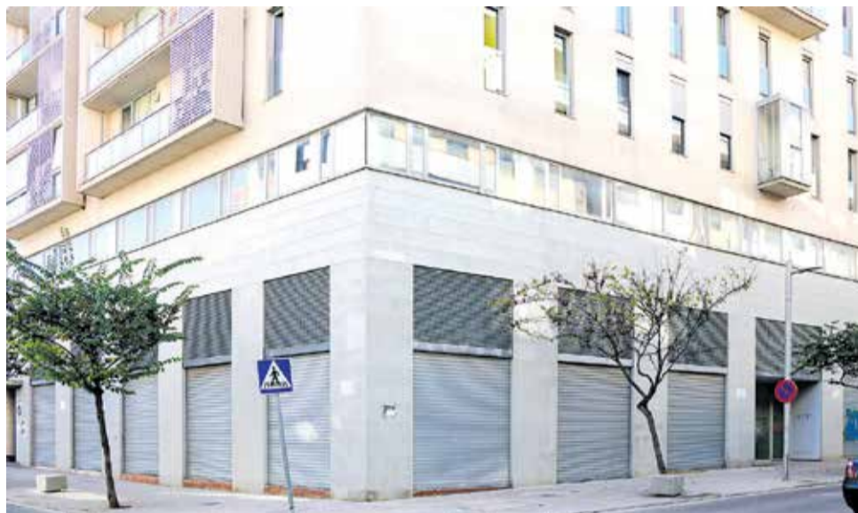
Ubicación en el que se instalará el nuevo centro de salud.

De esta manera, se procederá a la habilitación de los locales que formarán parte del nuevo centro de salud, el cual contará con: Área de Medicina (8 consultas médicas y 4 consultas de enfermería); área de Pediatría (con 2 consultas de Pediatría y 1 de Enfermería); área de Extracciones (con sala de extracciones con 3 puestos de extrac-