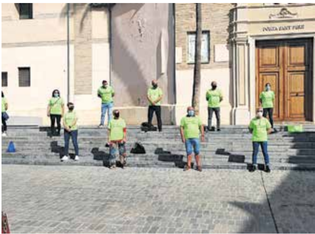
Manifestación a las puertas del retén.

te del 13 de noviembre en la puerta del Ayuntamiento.