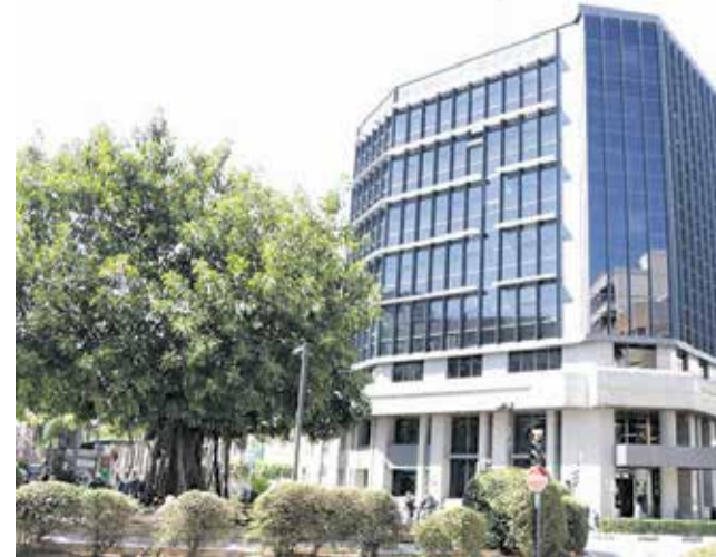
Ayuntamiento de Torrent. / EPDA

Por último, el nuevo programa ECOVID está dotado con 527.326 euros, subvencionado prácticamente al 100% por LABORA (513.752,64 €). El contrato, en este caso, será de seis meses y también se incorporarán a finales de diciembre.