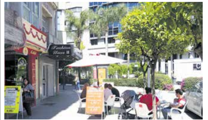
Terraza de un bar en Torrent.