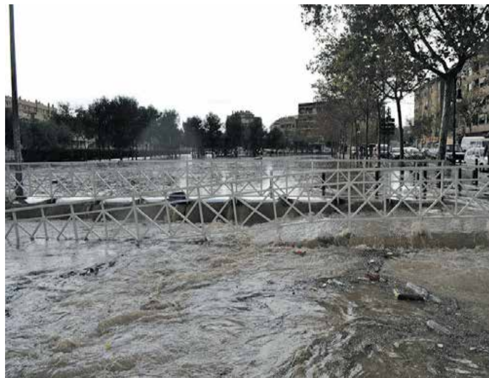
Barranquet de Aldaia.

elevación de la vía de Cercanías y la plantación de diversos árboles y jardines sobre el más pequeño lecho del Barranquet ha ocasionado más inundaciones. Aceleradas por los vertidos de aguas pluviales del Centro Comercial Bonaire y la autovía A3 que ocupan además lechos que antaño eran permeables a las precipitaciones, laminando las avenidas y hoy con el asfalto actúan como un tobogán, como vemos al haber más barrancadas y con menos cantidad de precipitaciones.