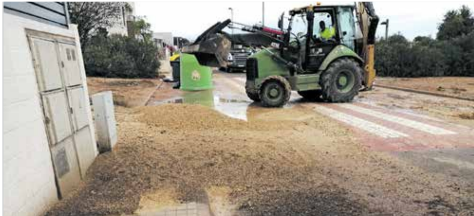
Trabajos de limpieza tras las lluvias caídas en Torrent.

Torrent recupera poco a poco la normalidad tras las fuertes lluvias caídas en los últimos días, que provocaron