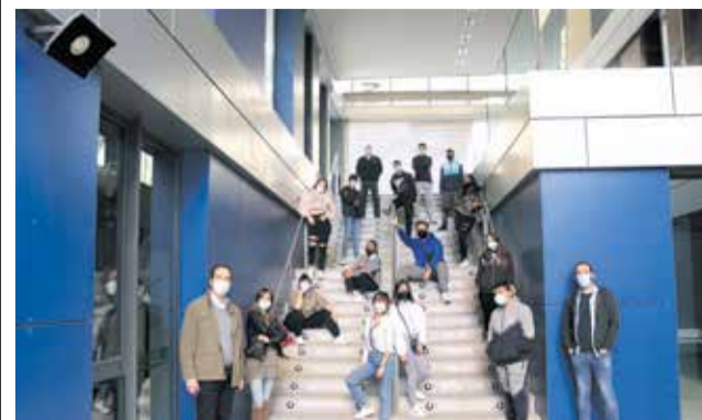
Joopers d'Aldaia. / EPDA