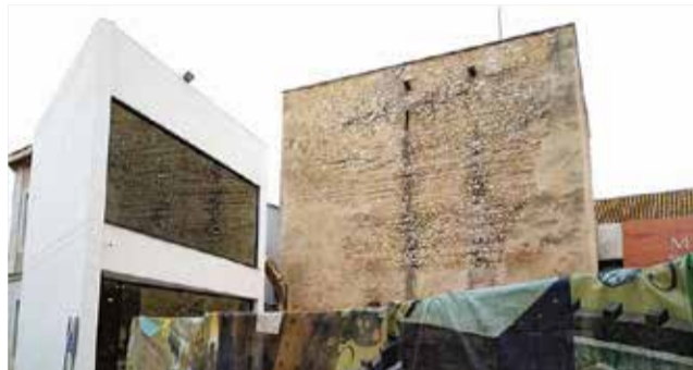
Torre musulmana de Silla.

Entre les activitats programades destaquen activitats de formació en línia, organitzades per l'Institut Valencià de les Dones, la il·luminació violeta de la To-