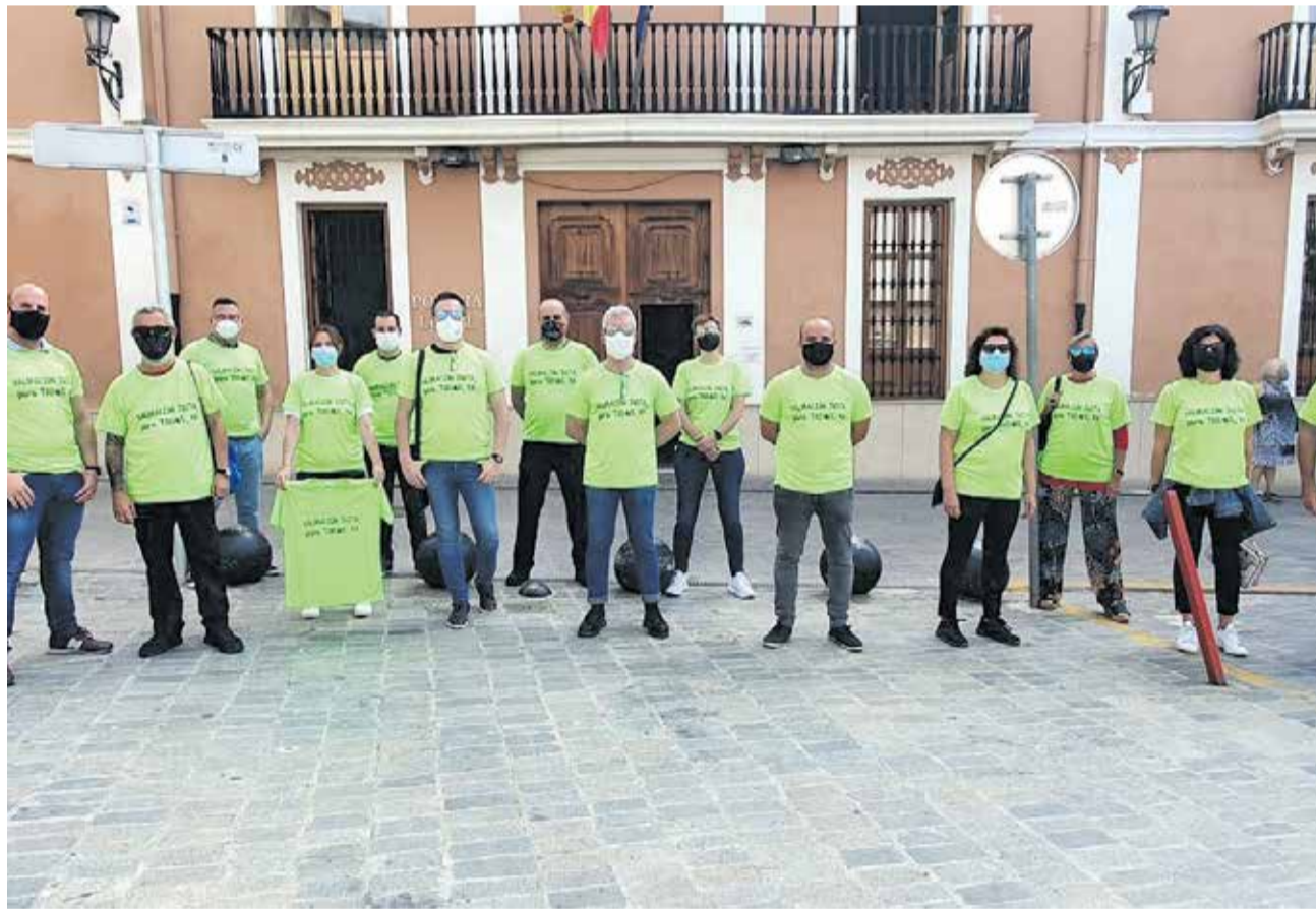
Manifestantes policiales durante la entrega de premios en Catarroja.

Otro de los elementos de las protestas es la nula actualización de la plantilla y la revisión de integrantes que tiene ahora mismo el cuerpo, que unido a un clima laboral de innecesaria tensión, donde se han instruido un número elevado de expedientes disciplinarios durante la última década, que han quedado en nada, y cuyas reclamaciones posteriores de los funcionarios afectados han obligado al comité de seguridad del ayuntamiento a reunirse en diversas ocasiones, ha desembocado en un clima laboral insostenible, según los manifestantes, lo que ha llevado a la plantilla de la Policía Local a realizar acciones de protestas como las del pasado 8 de octubre durante la entrega de un reconocimiento a la Policía Local de su trabajo durante el estado de alarma, el 29 de octubre durante la celebración de un Pleno o la más recién-