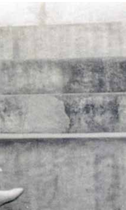
Una partida de pilota.

► HOMENAJES. Fue homenajeado con la medalla de oro de la Federación de Pilota en el año 1991.