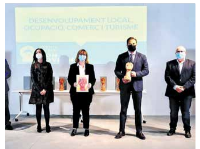
Entrega del guardó.

La creació d'aquests Premis al Bon Govern, per recompensar les Bones Pràctiques als municipis, és una mostra del compromís del municipalisme dels pobles de tot el territori de la Comunitat Valenciana.