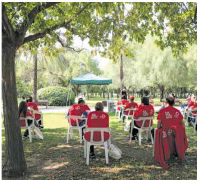
Presentación de los nuevos empleados.

Los beneficiarios finales de este programa, subvencionado