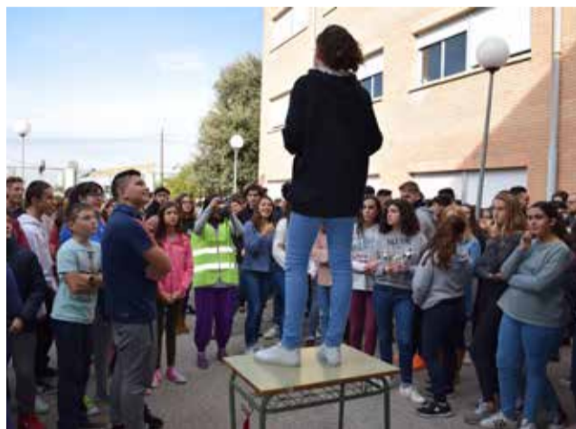
Actividad en el IES Sedaví por el 25N.

"Queremos visibilizar una realidad que cada vez está más presente entre nosotros y no podemos ignorar como sociedad. De hecho, nos gustaría transmitir un mensaje en el que todas las personas podemos contribuir a erradicar la violencia contra la mujer, sea