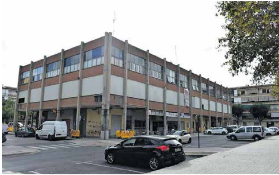
Edificio Meral de Alfajar.

Otras dos actuaciones sociales marcan la agenda de inversiones en los próximos años del municipio. Por una parte, la rehabilitación y conversión del complejo de servicios sociales Tauleta, que