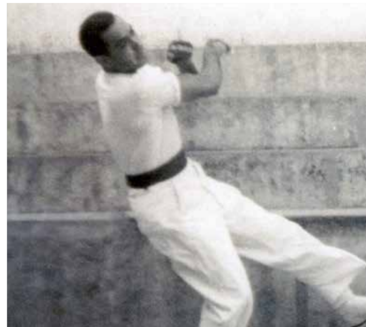
Uno de los característicos golpes de Xiquet de Quart durante un partido.

A pesar de contar con ese apodo no correspondía con