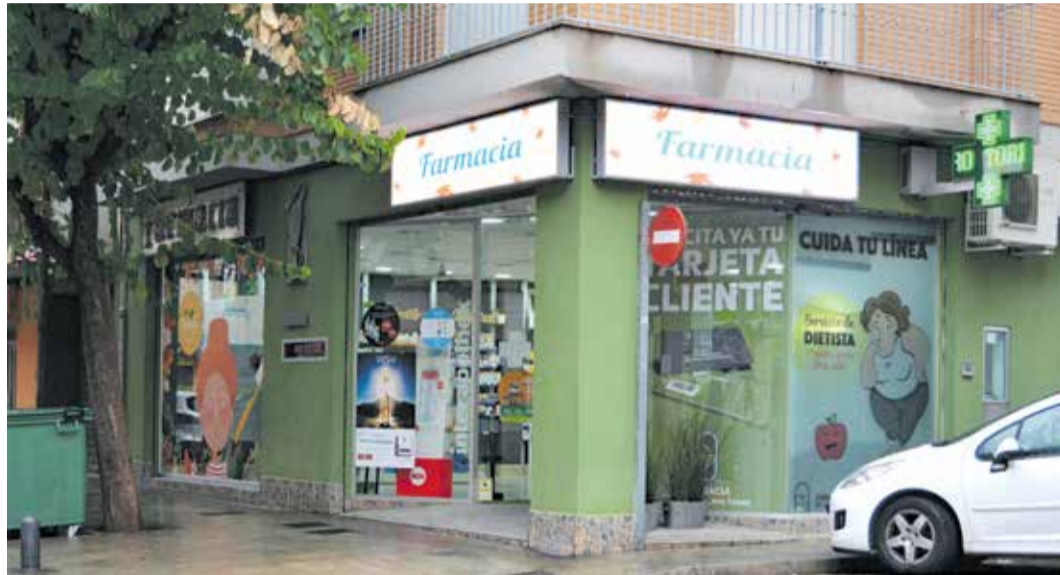
Farmacia de Aldaia.