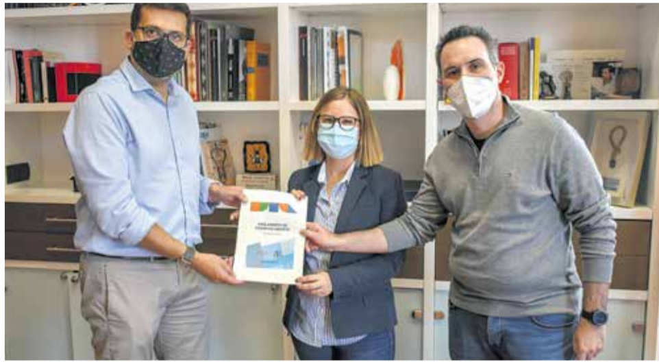
Momento de la presentación del proyecto del gobierno abierto.

La implantación de este proyecto en el municipio permitirá que la ciudadanía obtenga una mayor información sobre los proyectos y acciones públicas que puedan afectarle de forma directa. Además, servirá para ejercer