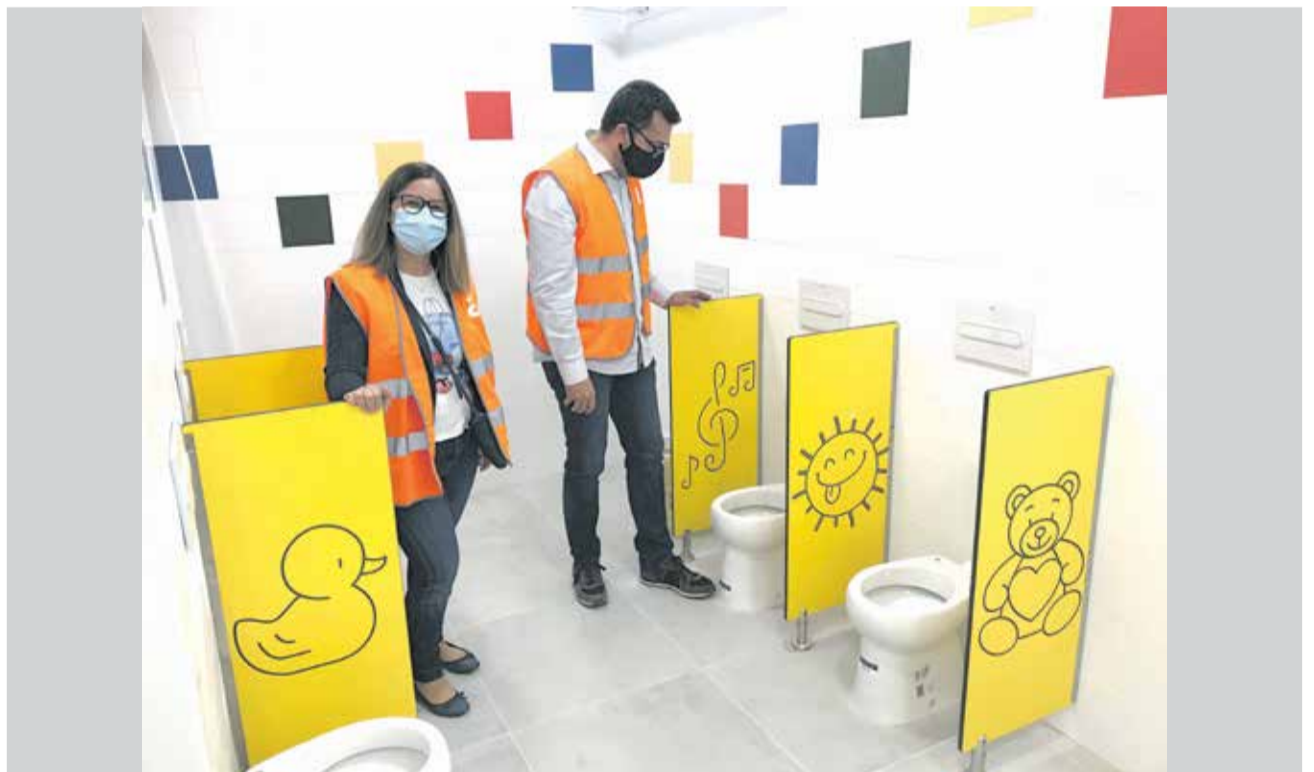
Autoridades visitando las obras del CEI Rabisancho