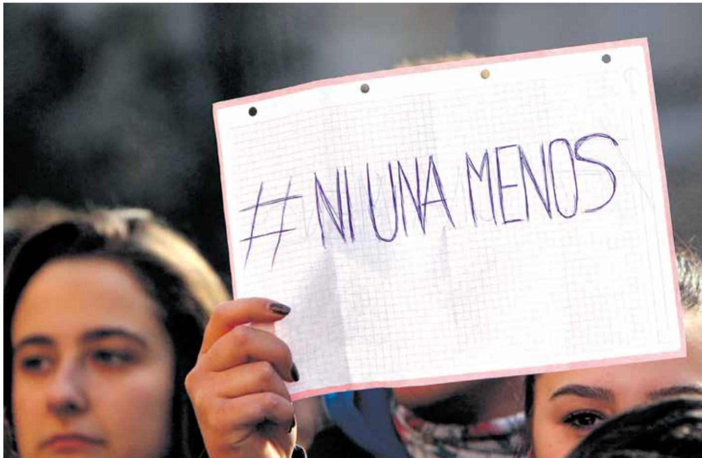
Manifestación en contra de la violencia de género.

Aunque cada caso de violencia de género es distinto, existen algunos factores que se repiten durante el ciclo del maltrato, que de no ser tenidos en cuenta pueden acabar en una situación de riesgo para la persona y los hijos,