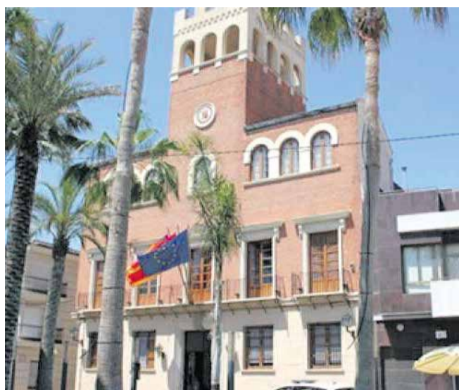
Ajuntament d'Alcàsser. / EPDA

Sin embargo, las inversiones económicas más importantes que se realizarán con esta inyección monetaria por parte de la Diputación de Valencia serán, por un lado, a la construcción de dos balsas-aljibes de compensación de lluvia con el objetivo de