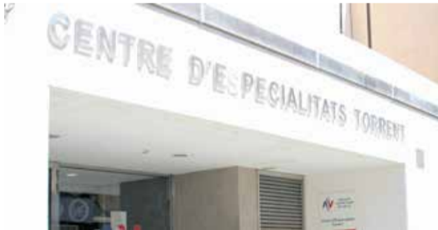
Centro de salud de Santos Patronos.

En estos momentos la ciudad de Torrent cuenta con dos centros de salud, un centro sanitario integrado y un consultorio auxiliar situado en El Vedat