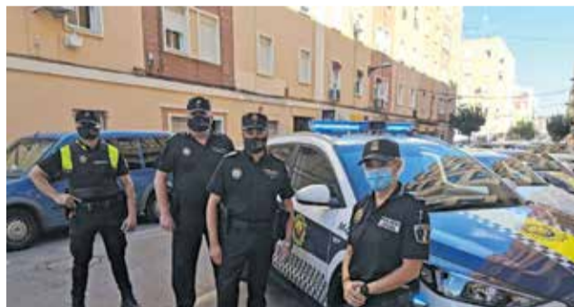
Policía Local de Xirivella.

La Policía Local de Xirivella completará antes de fin de año la incorporación de ocho nuevos agentes. De ellos, dos se han incorporado ya mediante el turno de movilidad, y los seis restantes lo harán en unas semanas en la modalidad de turno libre. Las entradas en plantilla se producen en un momento delicado desde la perspectiva de la seguridad ciudadana. El estado de alarma conlleva un esfuerzo adicional en el control de movimientos, aforos y horarios. "La ciudadanía está asumiendo un sacrificio descomunal con las sucesivas restricciones, y nuestra obli-