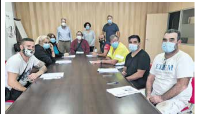
Participantes del plan de empleo.