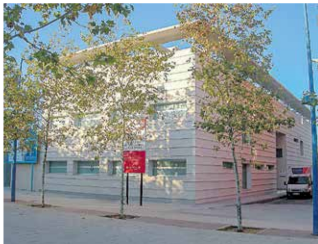
Centro de salud del Barrio Orba.

En la sesión plenaria se aprobó reclamar a la Conselleria de Sanitat la dotación de suministros y servicios para habilitar y poner en funcionamiento la segunda planta del Centro de Salud del Barrio Orba. Este espacio se encuentra sin servicio y l'Ajuntament solicita que se acondicione pa-