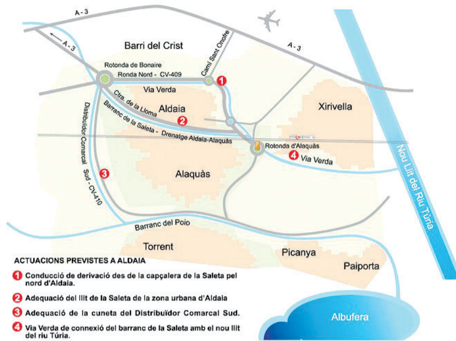
Actuaciones previstas de desvío del agua en Aldaia.

En la actualidad con la construcción de diversos muros, carreteras, aceras, pasos a nivel subterráneos, la