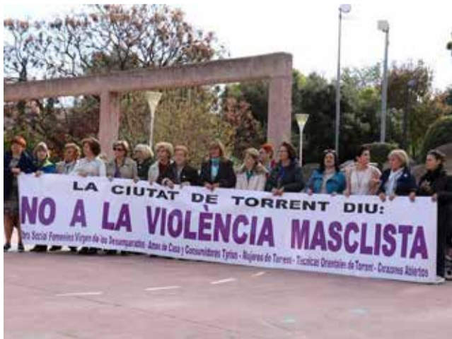
Manifestación en contra de la violencia machista.