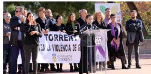
Manifestación en contra de la violencia de género. / EPDA

Viernes 27 de noviembre: La socióloga, investigadora, docente y formadora en cuestiones de género, Carmen Ruiz Repullo, impartirá, a las 18h, el webinar "De la hipersexualización a la pornificación: violencias sexuales en la juventud" desde la página de Facebook de Casa de la Dona.