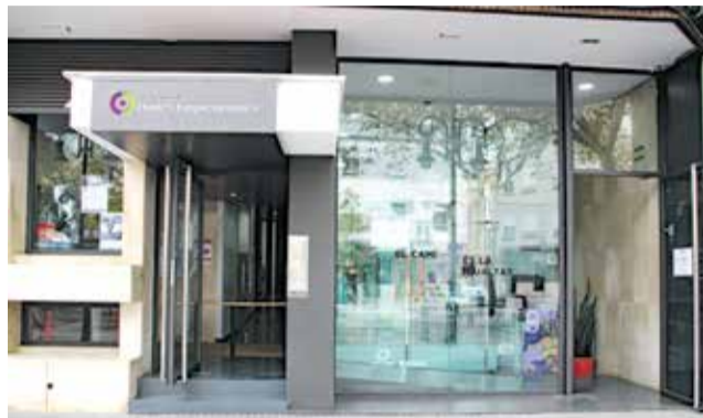
Casa de les Dones d'Aldaia.

Asimismo se han programado actividades educativas para el alumnado de Aldaia