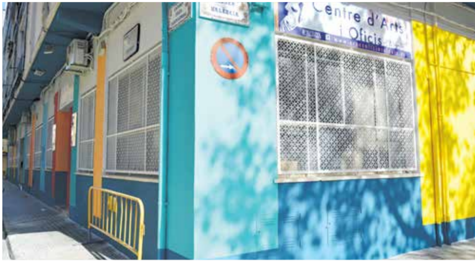
Fachada del centro de artes y oficios de Aldaia.

Por su parte, a finales del pasado año 2017 ya se realizaron otras intervenciones de actualización de espere espacio municipal como la pintura de una amplia zona interior del edificio, la puesta en