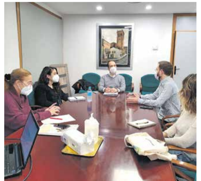
Reunión del ayuntamiento de Aldaia.

nos han concedido una ayuda de 1.107.987 euros para llevarlo a cabo, pero no nos conformamos con esto y aspiramos a competir para traer a nuestro pueblo todas las subvenciones que sean posibles. Por eso -continúa Luján- agradecemos a Gonzalo Albir su presencia en Aldaia como representante del Servicio de Orientación en Proyectos Europeos porque es un tema en el que queremos profundizar.»