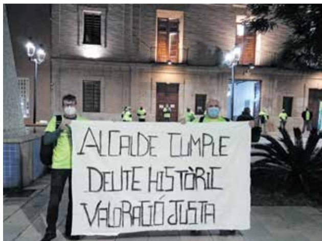
Manifestación a las puertas del ayuntamiento.

Asimismo, otro de los pilares de las manifestaciones se concentran en la demanda de la actualización del material como pueden ser los vehículos patrulla, el material que emplean para su trabajo, la uniformidad e incluso las instalaciones policiales. "Por ejemplo, ahora mismo se está prorrogando el renting de los vehículos patrulla que ha caducado hasta en dos ocasiones, con lo que nos encon-