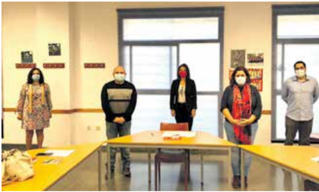
Presentació de la iniciativa. / EPDA