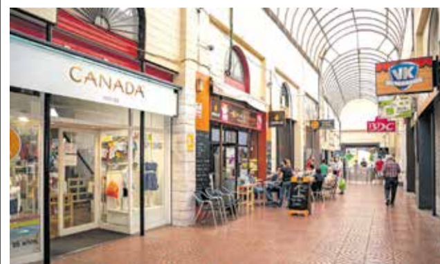
Comercios de Mislata.