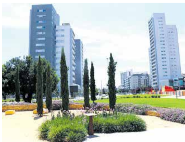
Parc Central de Torrent.

El Grupo Popular en el Ayuntamiento de Torrent ha mostrado su descontento al comprobar que, el gobierno local de PSOE y Cs, no ha optado a las ayudas convocadas por la Conselleria para el Fomento de la Regeneración y Renovación Urbana y Rural (ARRUR). El programa de subvenciones, convocado en el mes de julio, publicó el pasado 28 de octubre en el DOGV la lista de municipios que habían solicitado estos fondos, y los finalmente beneficiarios de ellos, no encontrándose Torrent en esta lista. La línea de ayudas está