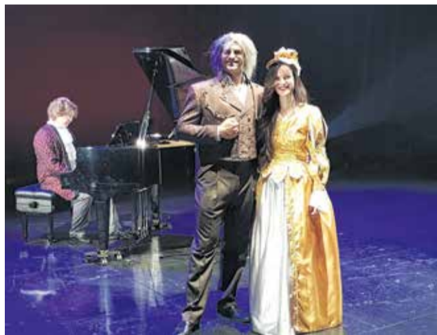
Espectáculo dedicado a Beethoven.

La especial visita se realizará en formato audiovisual, a través de una entrevista, al más puro estilo 'late night', salteada con diversas actuaciones. La grabación, realizada en el TAMA, será entregada a cada aula de música de la localidad. De este modo, los jóvenes aldaieros y aldaieras,