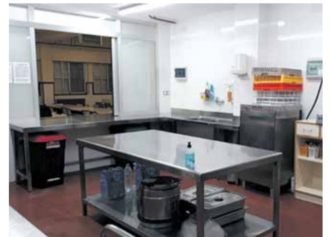
Cocina del CEIP Blasco Ibañez de Beniparrell.

La nueva cocina del centro escolar ya está en pleno funcionamiento y los 135 alumnos del centro ya se están beneficiando de este servicio. La remodelación integral de mobiliario y pavimentación de la cocina del centro escolar está adaptada a las