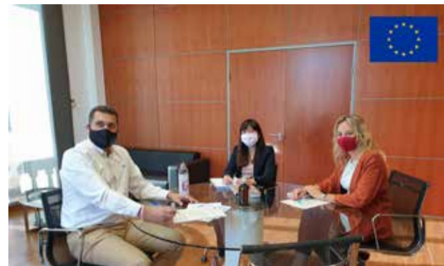
Presentación de la oficina de proyectos.