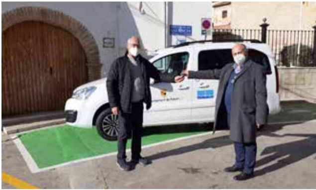
El alcalde de Petrés recibe el nuevo vehículo