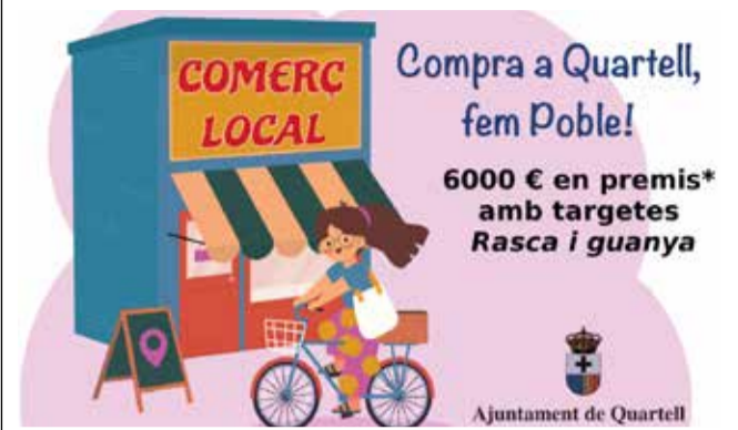
Cartel que anuncia las tarjetas 'Rasca y Gana'