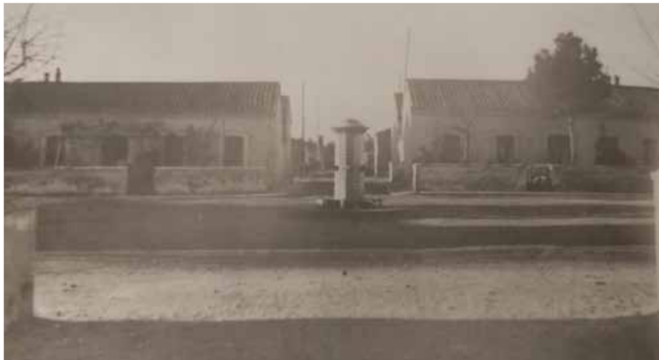
Detall finalització de les obres al Barri Obrer (1921).

Possiblement el succés més greu que ha patit la nostra ciutat el passat segle. "El diable està a tot arreu", es lamentaven els veïns de Port de Sagunt (València) en 1971. Cap d'ells comprenia què va poder passar pel cap del sacerdot José Prat perquè cósira amb 47 punyalades el cos del seu escolà, Francisco Calero Navalón, conegut com Paquito. Tenia nou an-