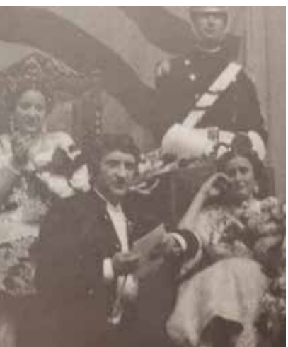
al Teatre Romà (anys 80)

mero dos que ja s'ha iniciat si no a tot el Conjunt Patrimonial Industrial ubicat a el Port de Sagunt.