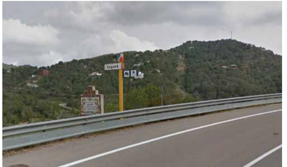
Entrada al municipio de Segart / EPDA

A Estivella le sigue Algímia d'Alfara, con una incidencia acumulada de 791,30; el mu-