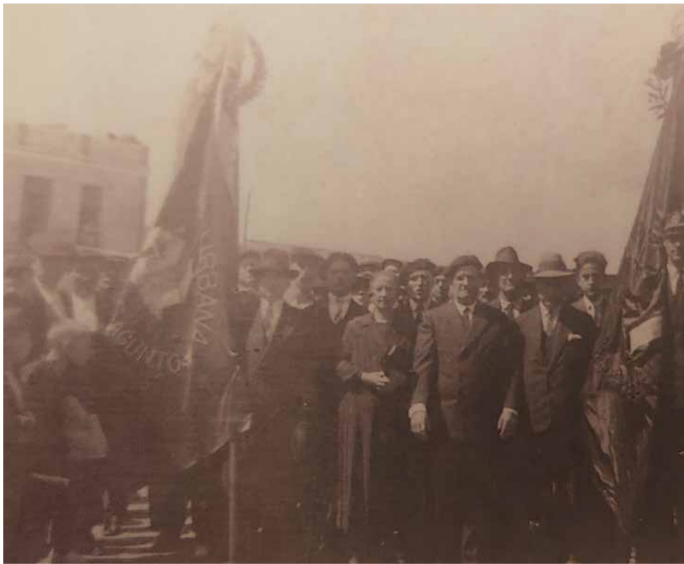
Unión Urbana, primer moviment segregacionista al Port de Sagunt (1931)

En este sentit dins de la trama urbana de Port de Sagunt contem amb un altre fita el