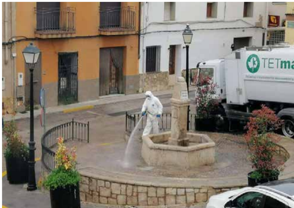
Limpieza y desinfección en las calles de Gilet.

Así, en Benifairó de les Valls se ha procedido a cerrar los parques y espacios de actividades municipales. Una medida que se irá prorrogando y que por el momento per-