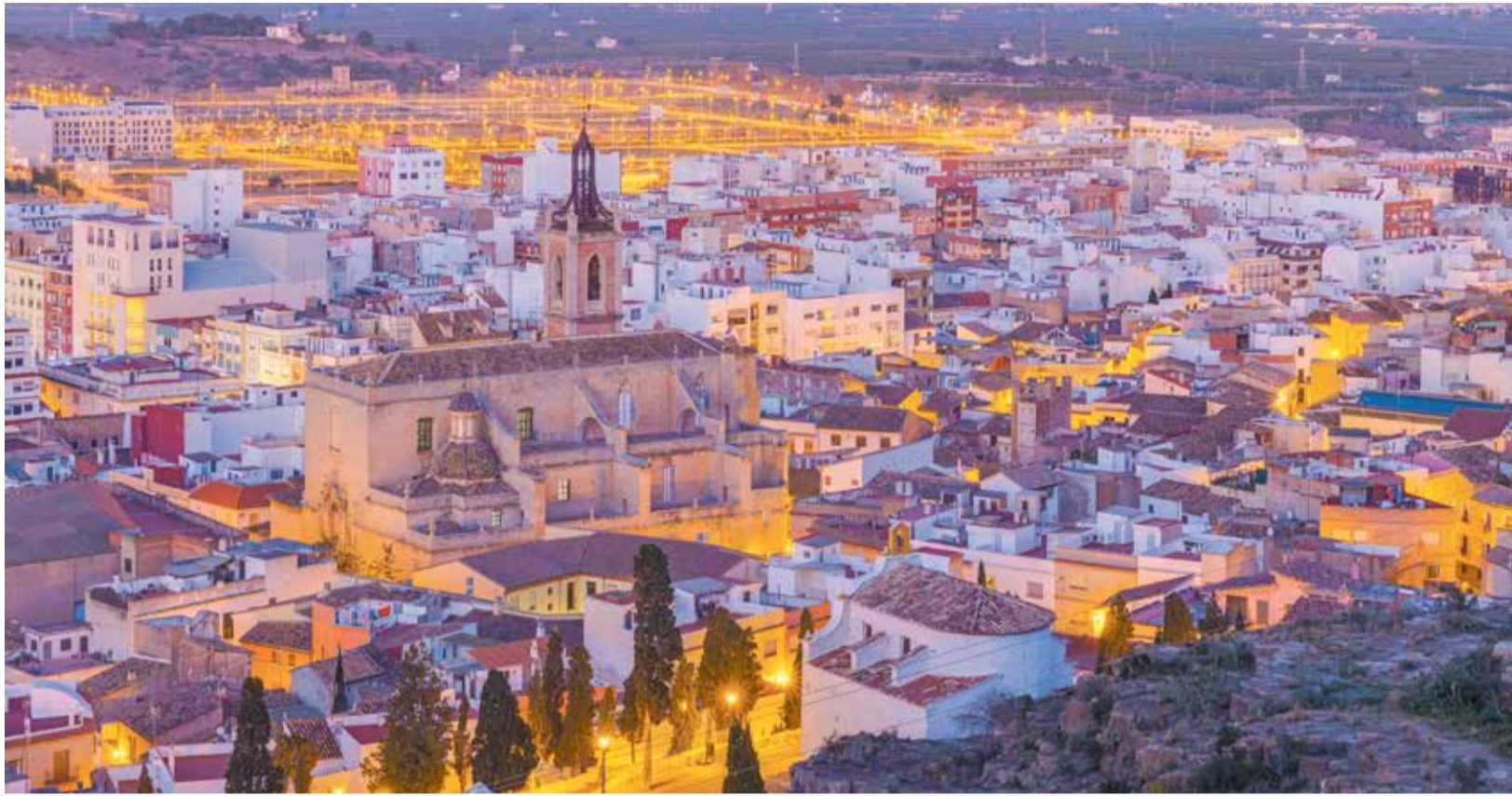
Vista del casco histórico de Sagunt

■ CANET Y SAGUNTO ENCABEZAN EL CRECIMIENTO EN ESTA DÉCADA CON 1.167 Y 914 PERSONAS, RESPECTIVAMENTE