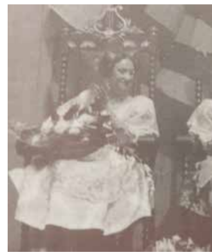
Exaltació Falleres Majors de Sagunt

Centenari que ajuda per a que en aquest 2021 les admi-