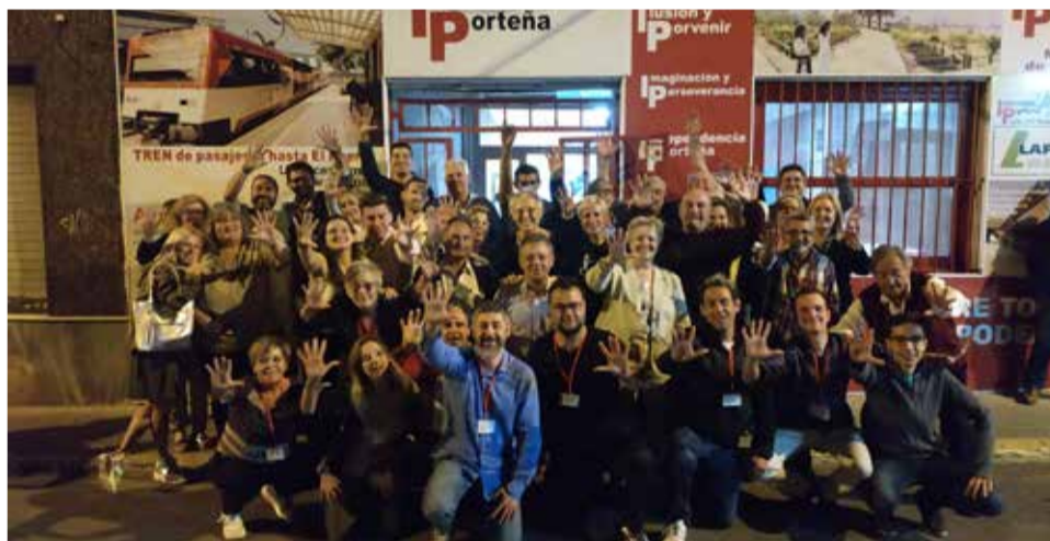
Iniciativa Porteña a la nit electoral de maig de 2019.

final de les obres del Barri Obrer que es plantejava com a habitatges per a la plantilla obrera de confiança que no