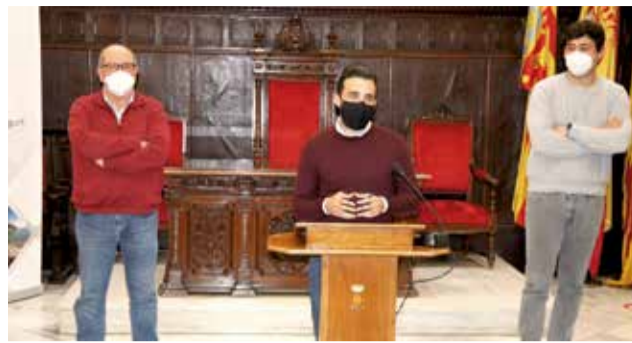
Presentación de las nuevas medidas.

pagación del virus. «Cada contagio que se dé es una persona que puede acabar muriendo, y es una situación que pode-