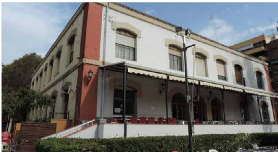
Edifici del Casino Recreativo Puerto de Sagunto.

ys. El seu assassinat va remoure a una Espanya encara en blanc i negre. El religiós