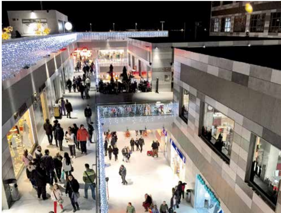
Imagen del Centro Comercial L'Épicentre.

También L'Épicentre ha confirmado a este medio, que nuevamente una empresa valenciana ha apostado por el Centro Comercial, la hamburguesería gourmet "The Fizthermal", empresa perteneciente a Tastia Group, propietaria de los restaurantes