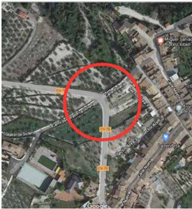
Lugar para la construcción de la nueva rotonda

"A més de ser una carretera complicada per les seues característiques, parlem d'un punt amb un perill afegit, ja que en la mateixa corba es troba l'entrada al municipi i la pujada a la piscina" ha indicat l'alcalde en funcions Ignacio Palmer, qui recorda que "la construcció d'una rotonda solucionarà