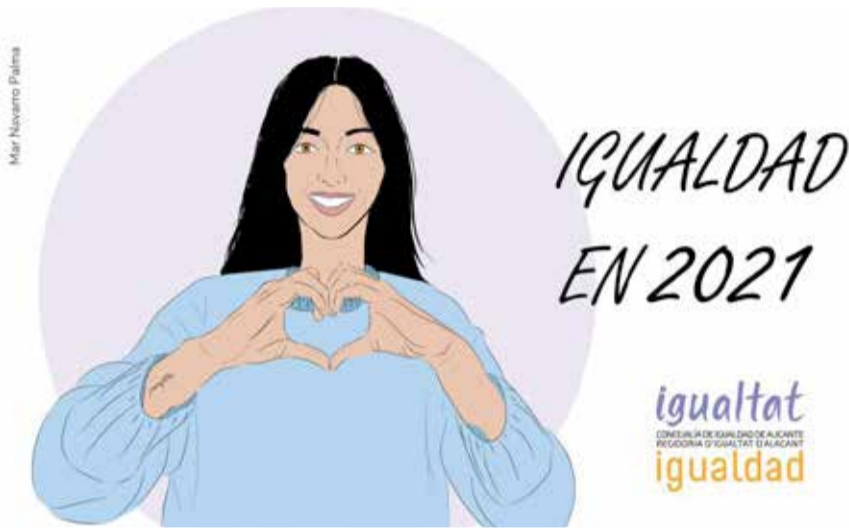
Portada del calendario de igualdad

arriesgado su salud por asumir las tareas de cuidado y las que han sufrido el recrudecimiento de la violencia de género confinadas con sus maltratadores.