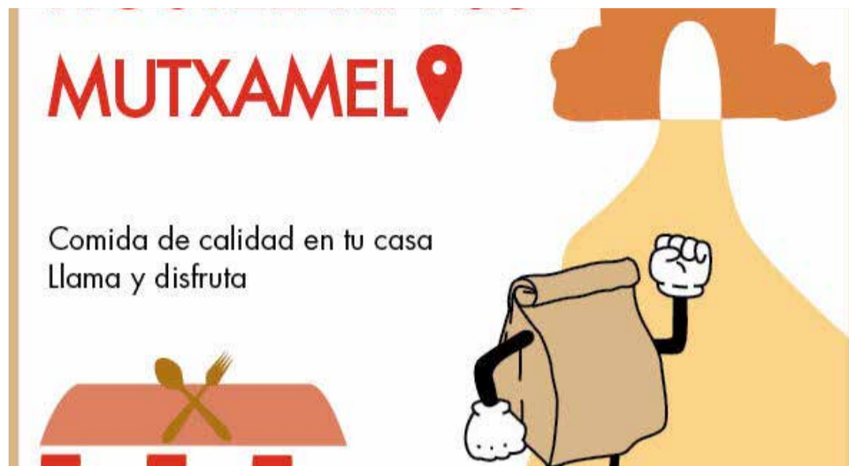
Cartel de la campaña