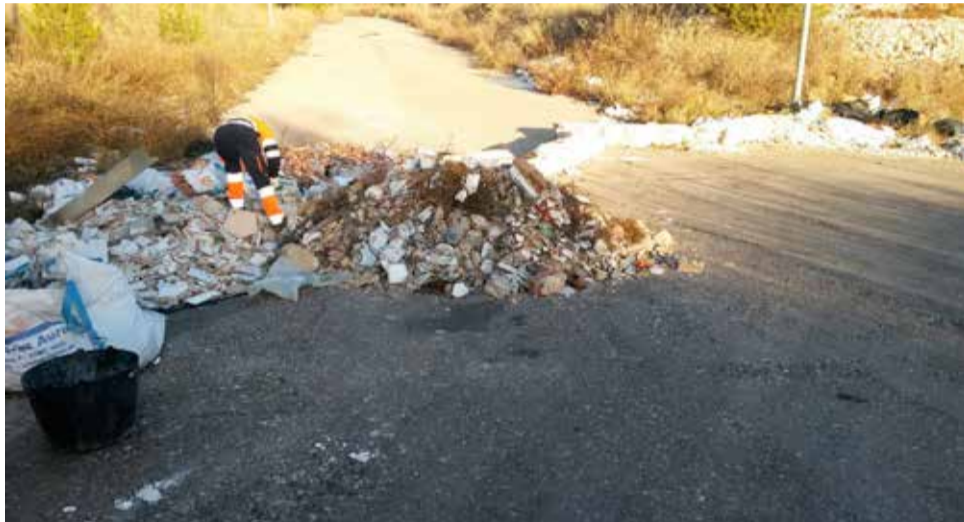
Limpieza de los vertederos

Durante dos días, la empresa de limpieza FCC ha recogido voluminosos, plásticos y otros, junto al personal del departamento de Medio Ambiente que con una máquina 'retro' y a mano han retirado escombros, separando los impropios (materiales que no