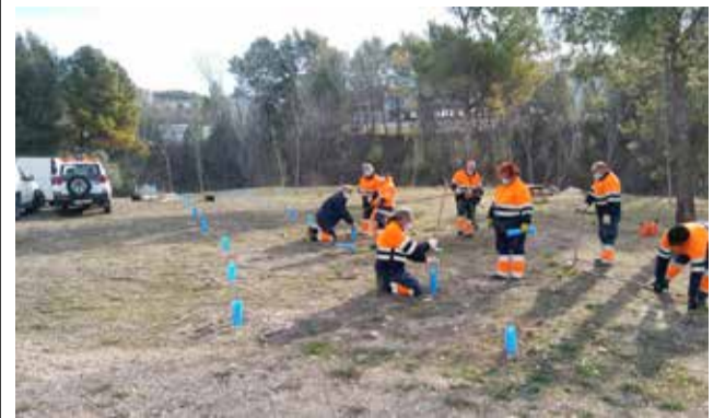
Trabajos de la brigada