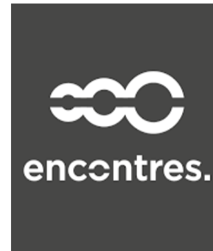
Logo de Encuentros / EPDA