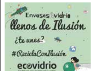
Foto de la campaña