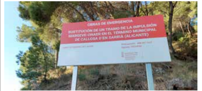
Cartel de las obras / AYTO CALLOSA