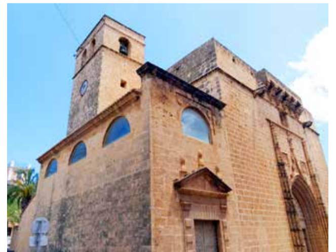
Parroquia de San Bartolomé