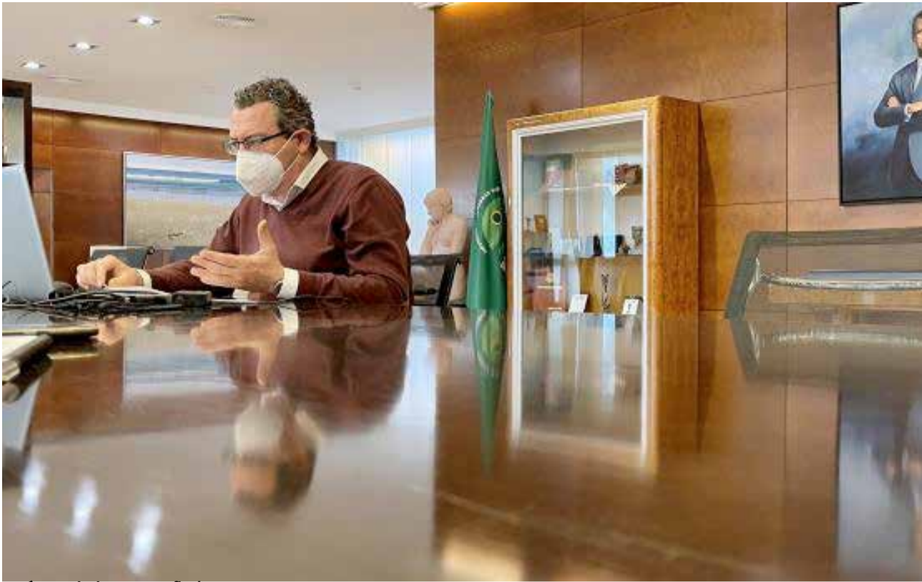
Imágen de la campaña/ EPDA