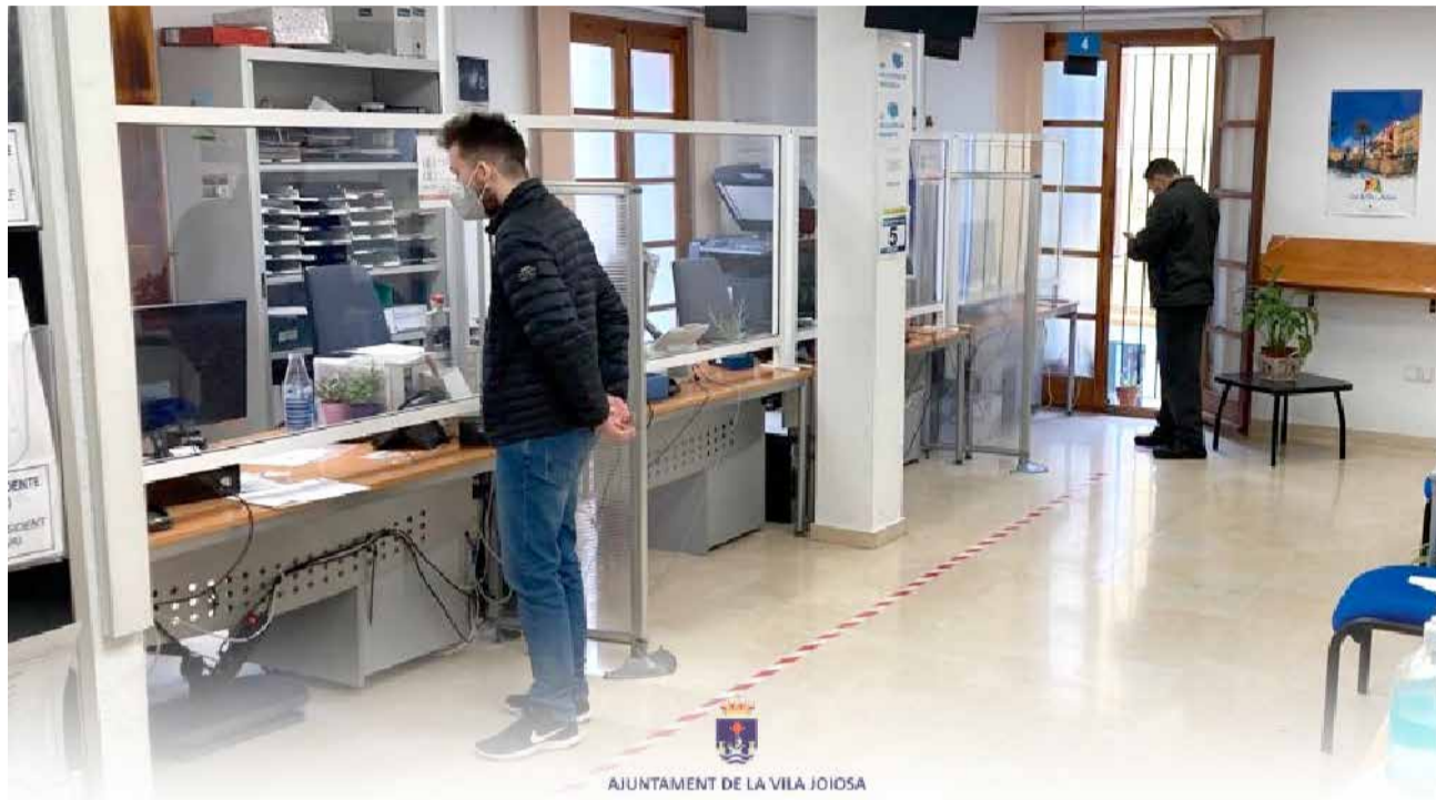
Oficina de Atención a la Ciudadanía de Vila Joiosa / AYO VILAJOIOSA

La extensión administrativa de la Avda. Mariners de la Cala de la Vila Joiosa abrirá de nuevo sus puertas a la ciudadanía para atender sus necesidades en horario de 8:30 a 14:00 horas de lunes a viernes. Para ello será necesario solicitar cita previa a través de la web del Ayuntamiento de la Vila Joiosa. A lo largo de esta semana se habilitará un 'banner' en la página principal de la web del consistorio a través del cual