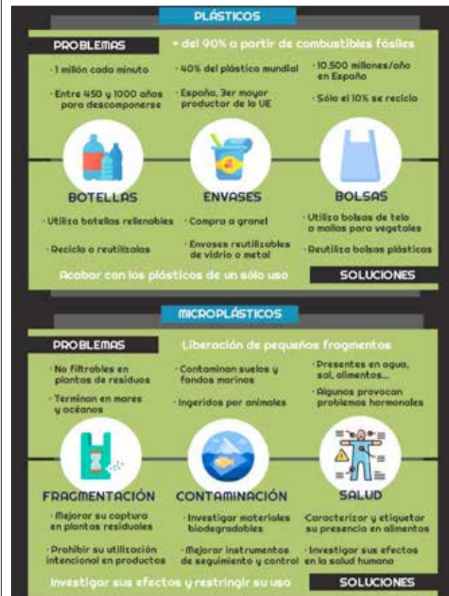
Infografía de la campaña