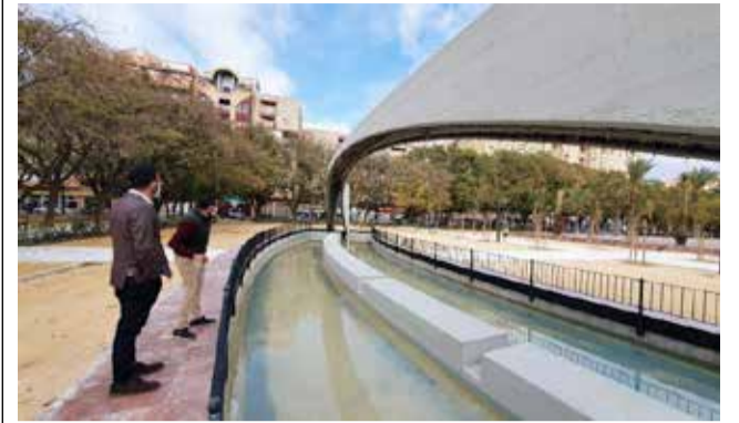
Fuente del parque