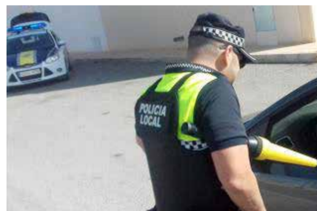
Policía en Sax

Las actas que se han impuesto han sido 21 por ir en grupos de más de dos personas no convivientes y las 15 restantes por no llevar la mascarilla, todas ellas en la vía pública. El objetivo es evitar a toda costa un repunte de la curva de contagios".