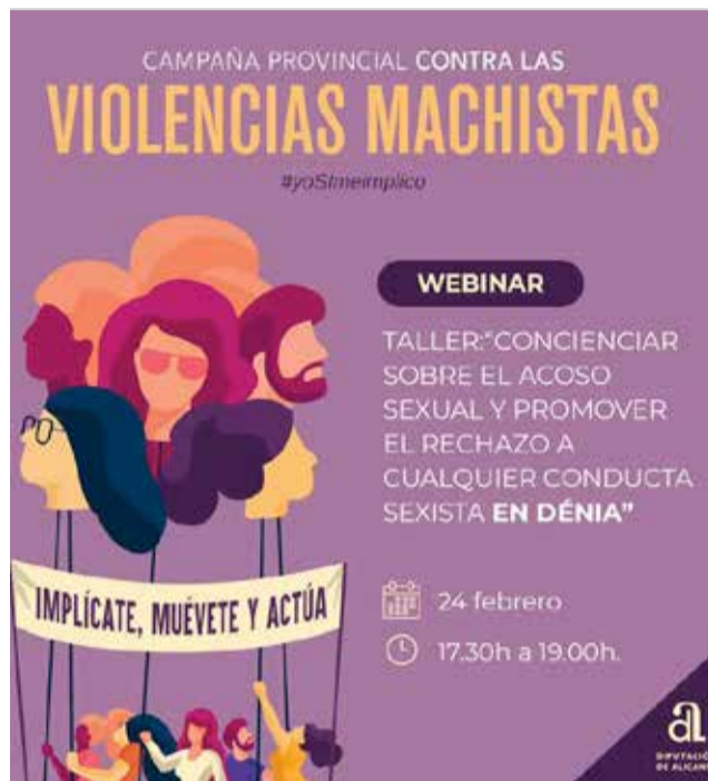
Imágen de la campaña

Para ello han organizado un ciclo de sesiones en línea (webinars) en el que participarán un total de 17 municipios alicantinos exponiendo sus campañas y acciones de lucha contra las violencias machistas. El ciclo comenzó el 27 de enero y se prolongará hasta el 21 de ju-