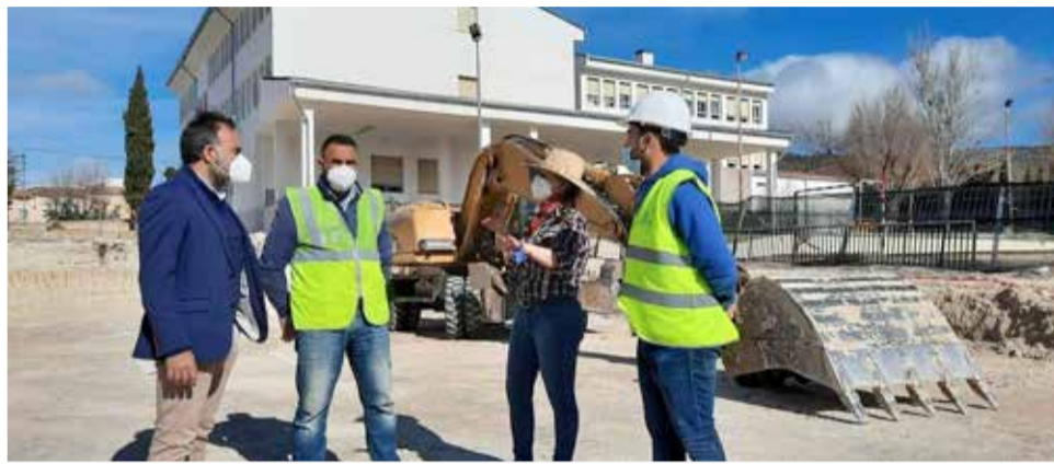
Obras en el CEIP Felicidad Bernabeu

El primero en comenzar ha sido el CEIP Felicidad Bernabeu, el pasado 27 de enero, con un presupuesto de 3.254.854,73 €. El siguiente será el CEIP Poeta Pascual