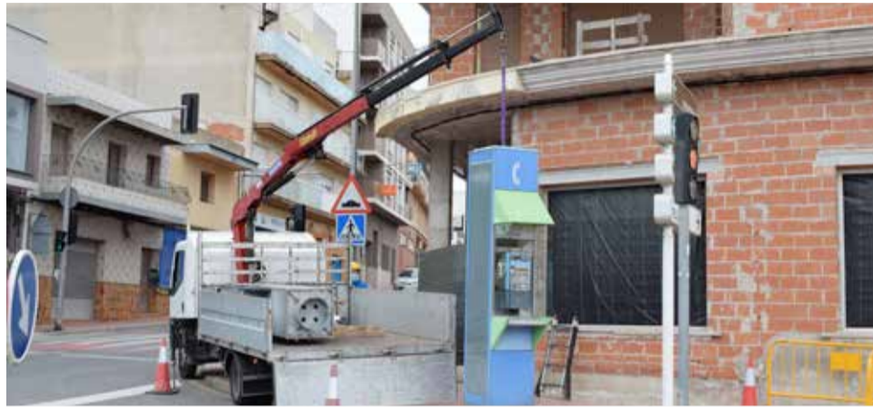
Retirada de las cabinas telefónicas

Las han retirado a petición del Ayuntamiento, con el objetivo de eliminar mobiliario urbano en desuso y deteriorado, que causaba un impac-