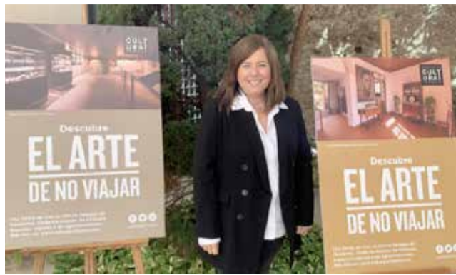
Concejala de cultura de Orihuela