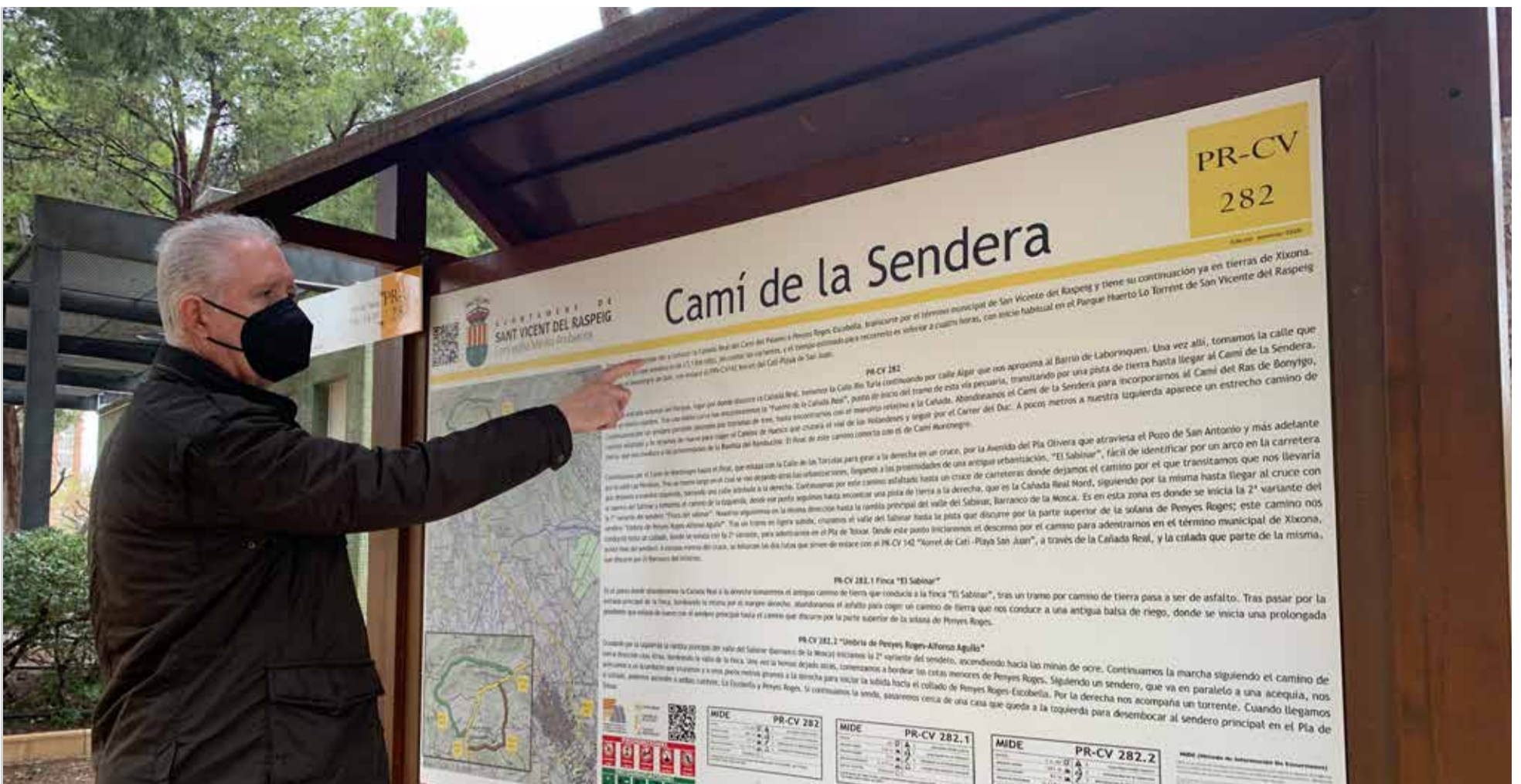
Señalización del Camí de la Sendera