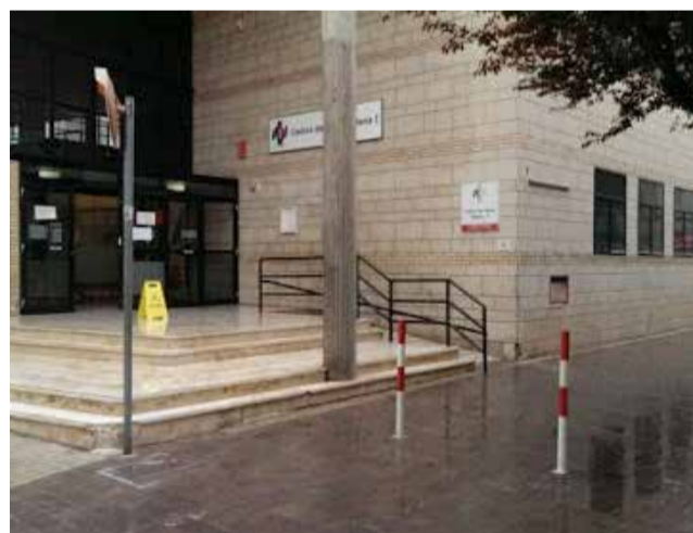
Centro de Salud de Villena

El proceso de vacunación se inició con la llamada telefónica desde Atención Primaria a los vecinos y vecinas censados en la ciudad mayores de 90 años, citándoles a los puntos de vacunación