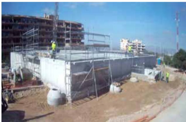
Obras en el depósito Arenales del Sol