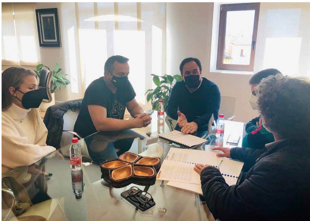
Reunión de vecinos de Terra Marina

estos niveles de ruidos. Y hoy les hemos anunciado que ese estudio les da la razón porque los niveles superan los 65db, que es el máximo permitido por la normativa de la Comunitat y del propio Ministerio para su red de carreteras. Por tanto, desde el Ayuntamiento haremos las alegaciones ante Fomento