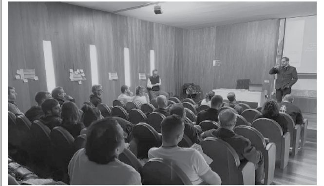
Presentación del nuevo órgano consultivo / EPDA