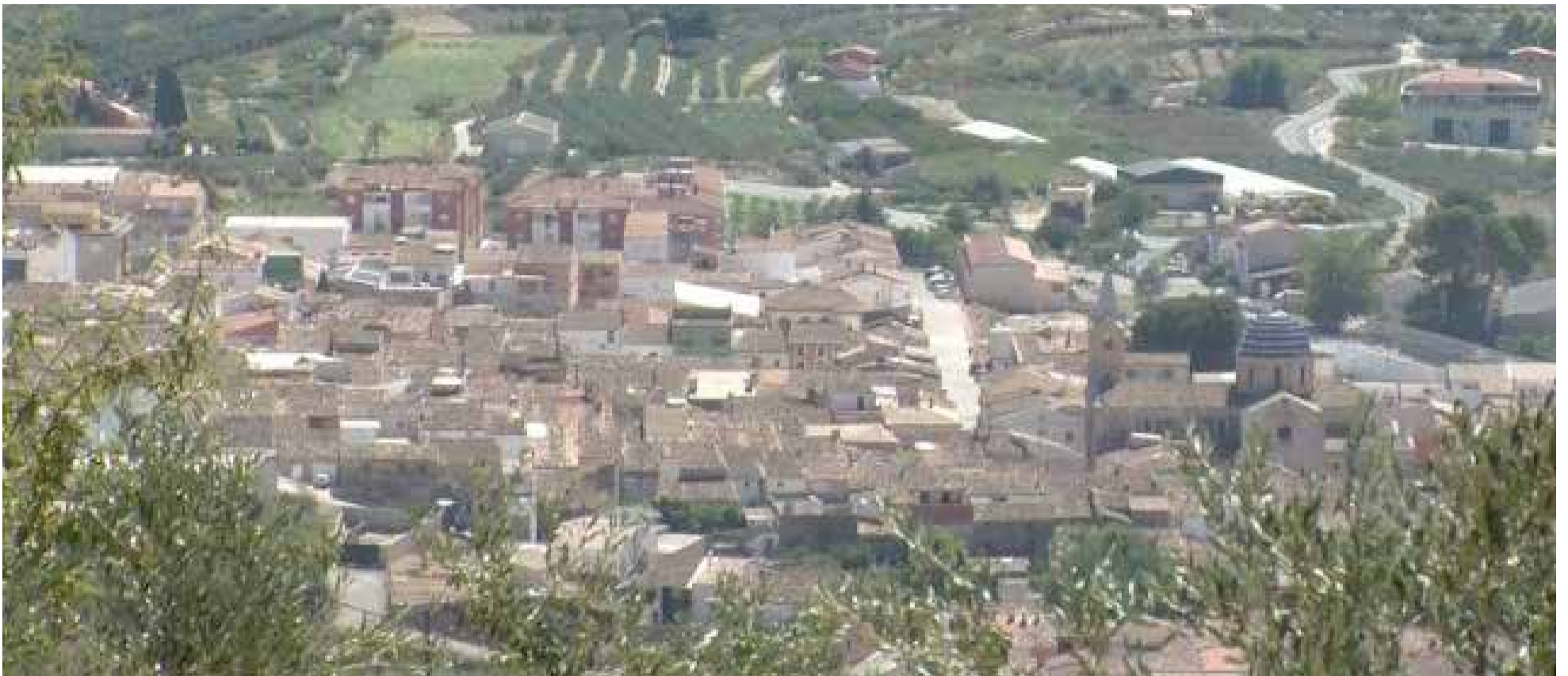
Municipio de Beniarrés / NANDO RICO

■ BENIARRÉS INSISTE EN QUE EL ÉXITO DE LAS MEDIDAS PARA LUCHAR CONTRA EL VIRUS TAMBIÉN DEPENDE DE LA RESPONSABILIDAD INDIVIDUAL DE CADA PERSONA