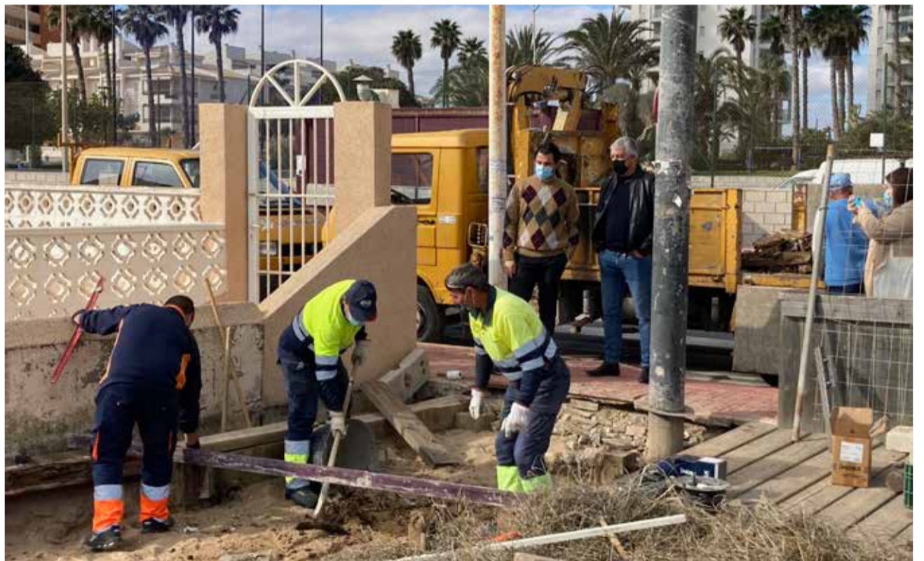
Obras en la pista polideportiva