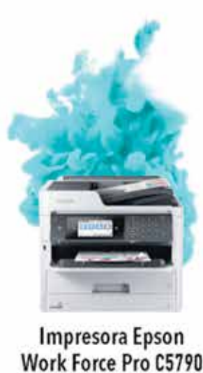
Impresora Epson Work Force Pro C5790

berolina AHORRA MÁS DEL 50% EN IMPRESIONES Y 90% DE ENERGÍA