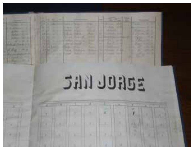
Registro del cementerio / EPDA

De esta manera constan los registros de inhumaciones en las tres galerías subterráneas de San Severo, San Antonio y San Fabián, entre 1882 y 1990, así como las inhumaciones en las galerías modernas de San Jorge, San Vicente, San Ro-