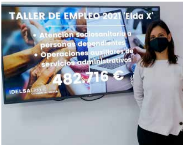
Imágen del taller

Ibáñez ha destacado que "uno de los objetivos estraté-