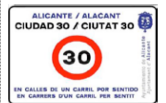
Señal 30km/h / EPDA