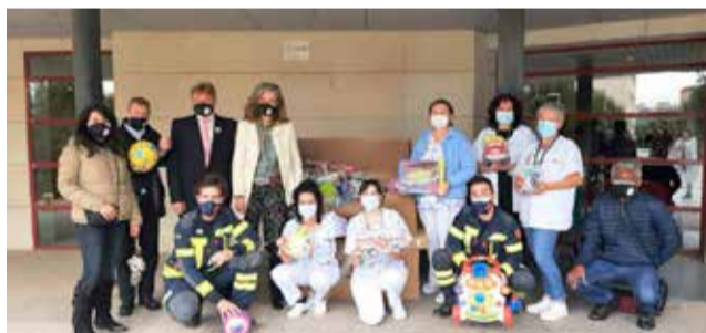
Entrega de juguetes