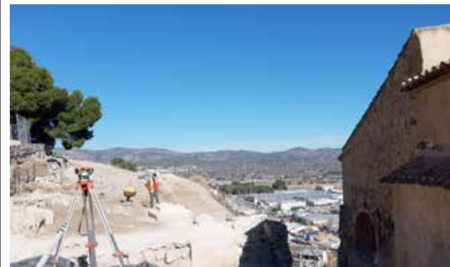
Muralla de Castalla / EPDA