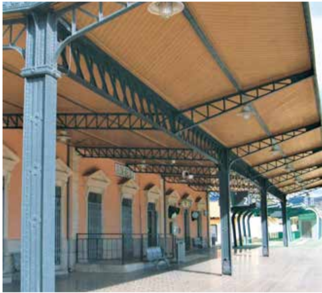
Estación de tren de Elda

Esta actuación en la Estación Ferroviaria de Elda-Petrer se enmarca en el programa de mejoras que Adif está llevando a cabo en las estaciones, instalaciones y equipamientos de la red ferroviaria convencional, con la finalidad principal de optimizar su funcionalidad, bajo la premisa fundamental de su adaptación a personas con algún tipo de discapacidad, sostenibilidad y eficiencia