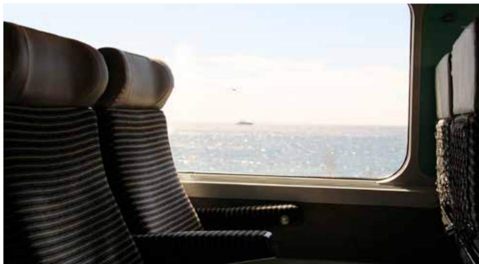
Asientos del tren.

tecnologías dando la oportunidad al desarrollo del sector en el país, las empresas españolas se han consolidado nacional e internacionalmente.