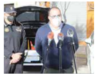
Concejalía de tráfico