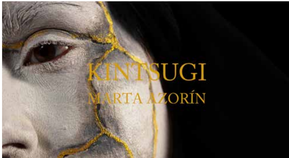
Cartel de la exposición

La concepción de esta técnica radica en el realce y la exhibición de las imperfecciones o roturas de las cerámicas, y de