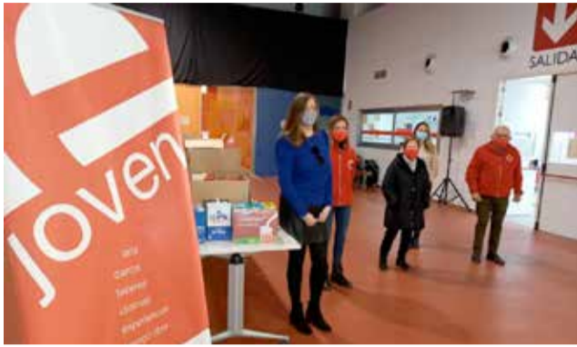
Entrega del material / EPDA