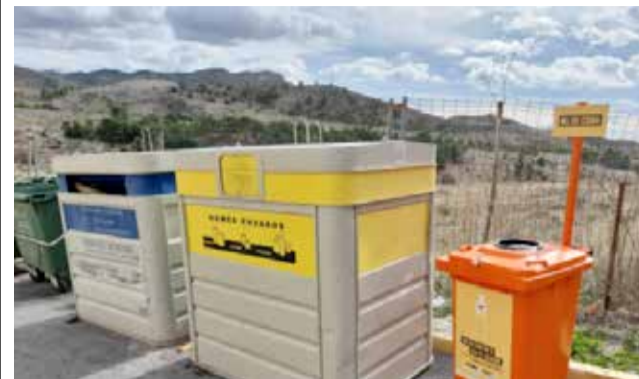
Contenedores en Xixona