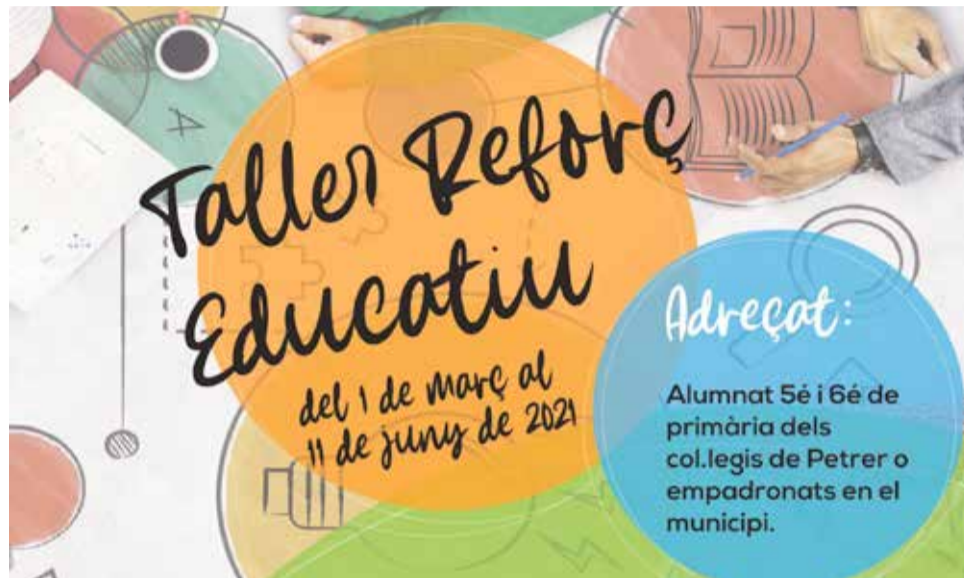
Imágen del taller

La concejala ha señalado que estos talleres serán totalmente gratuitos y forman parte de la subvención concedida por la consellería de Educación, Cultura y Deporte para apoyar iniciativas en esta situación de pandemia que estamos viviendo. Sendra ha subrayado que en el caso de las clases de repaso “están pensadas para apoyar a los alumnos, algunos de los