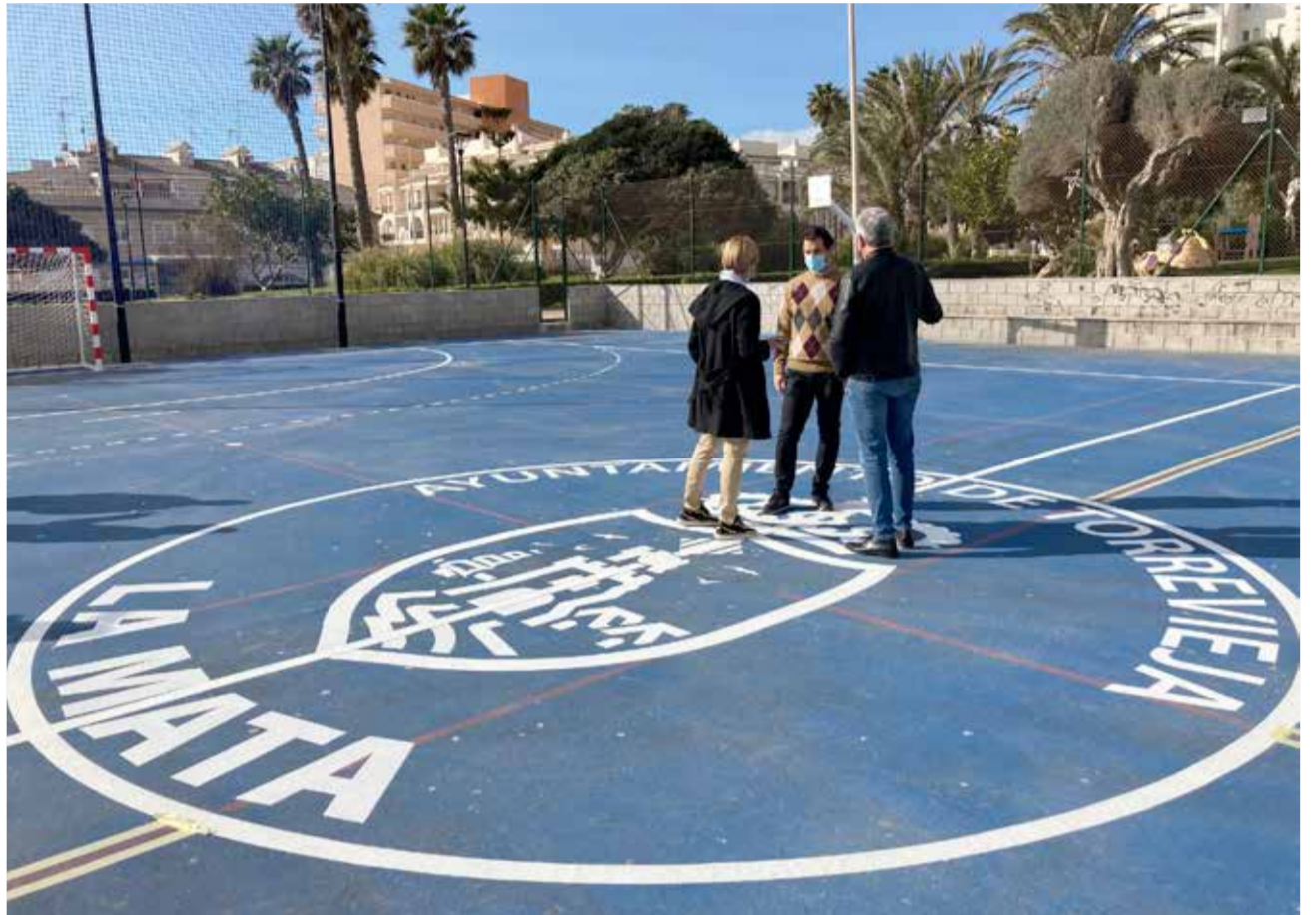
Visita del alcalde la pista polideportiva

De esta forma se pretende desde la Concejalía de Playas que de cara al próximo verano la senda peatonal de La Mata esté en óptimas condiciones para los cientos de personas que diariamente pasean por ella.