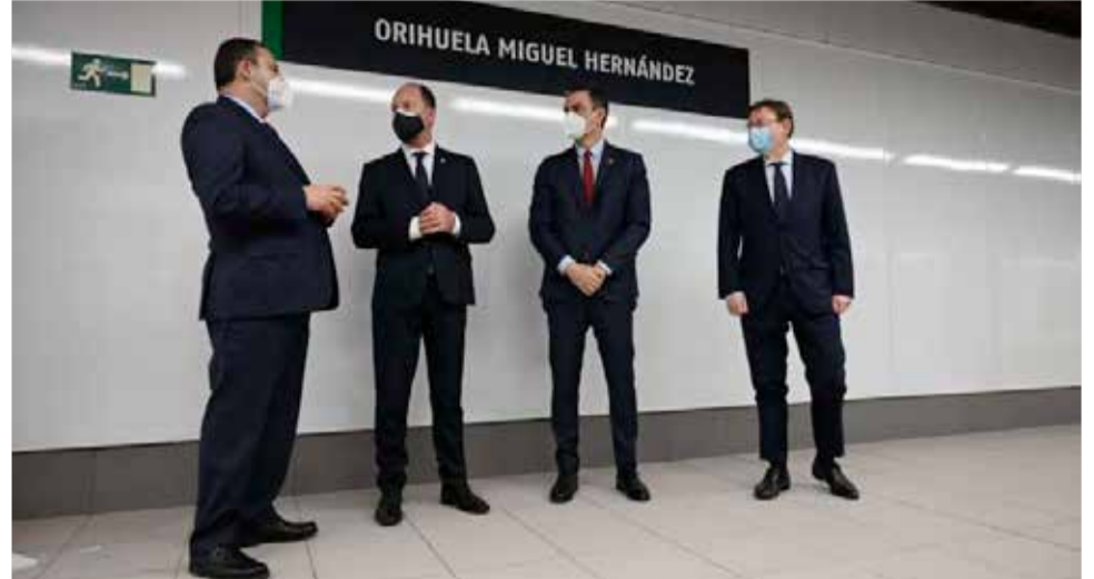
El Presidente del Gobierno junto a varios políticos en la inauguración

En la red española existen distintos tipos de vía, el ancho ibérico o convencional, de 1668 milímetros y veinte