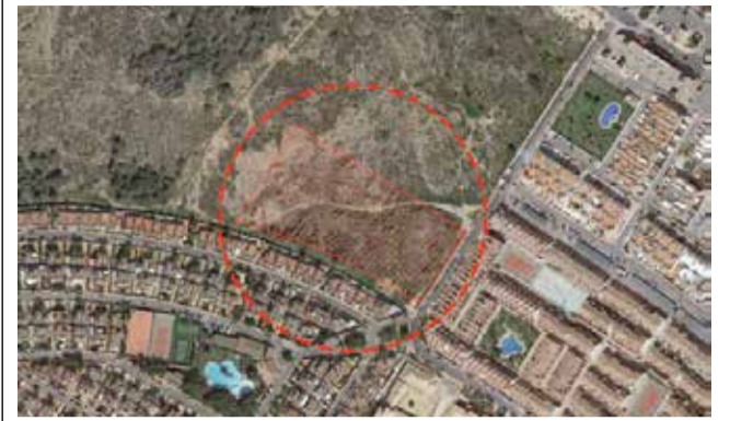
Terreno para el nuevo colegio / EPDA