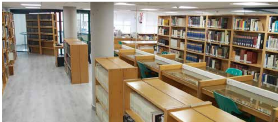
Biblioteca Miguel Hernández de Villena