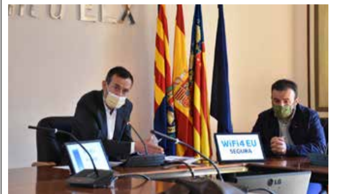
Presentación de Wifi4EU / EPDA