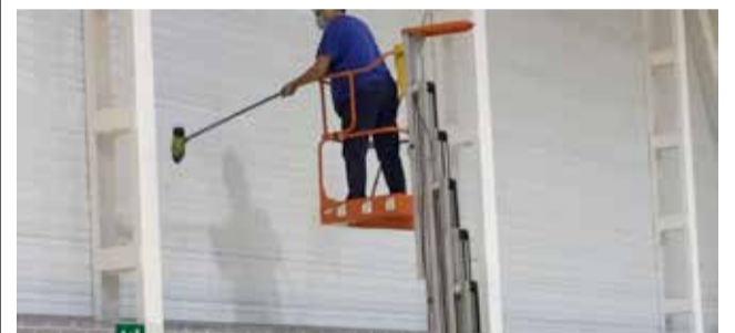
Pintura de paredes / EPDA