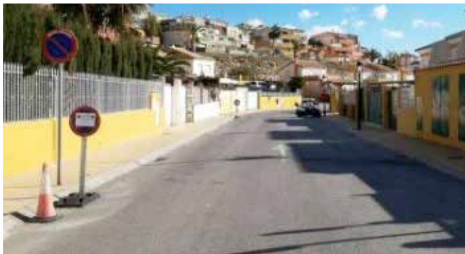
Urbanización Terra Marina / AYTO FINESTRAT

para que subsane estas deficiencias cuanto antes. Cabe tener en cuenta que estos niveles ya superan lo permitido en una época atípica como es un estado de alarma a causa de la pandemia. Por tanto, esta situación seguramente se agravará con el aumento