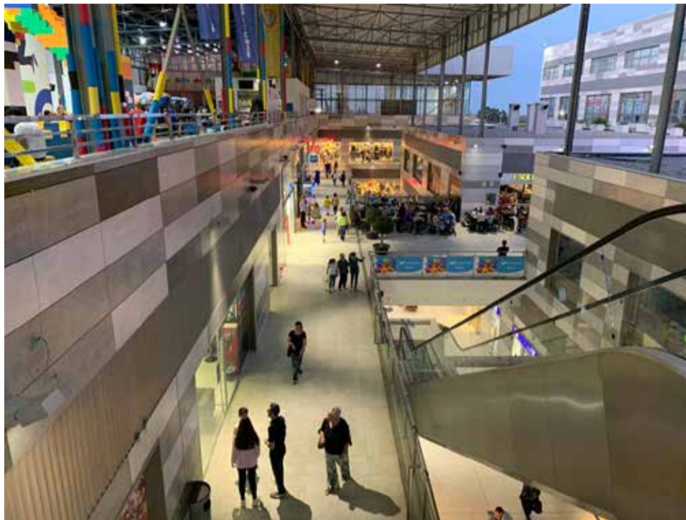
Imagen del Centro Comercial L'Epicentre.

Las obras de JD Sport, empresa británica considerada lí-