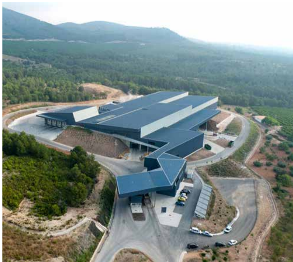
Vista aérea de la planta de tratamiento de residuos de Algímia d'Alfara.

Cabe destacar que la recuperación de todos los subproductos se ha incrementado en el 2020 excepto el papel y cartón, ya que debido al estado de alarma se suprimió su