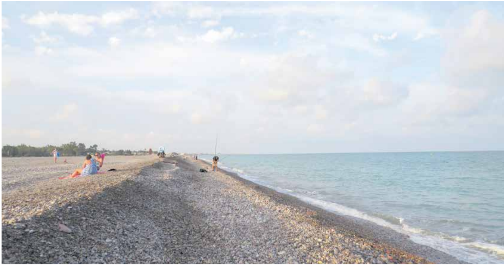
Estat de la platja d'Almardà.

■ ELS VEÏNS D'ALMARDÀ I COMPROMÍS ANUNCIEN QUE PRESENTARN AL·LEGACIONS AL PROJECTE DE COSTAS PER A SAGUNT