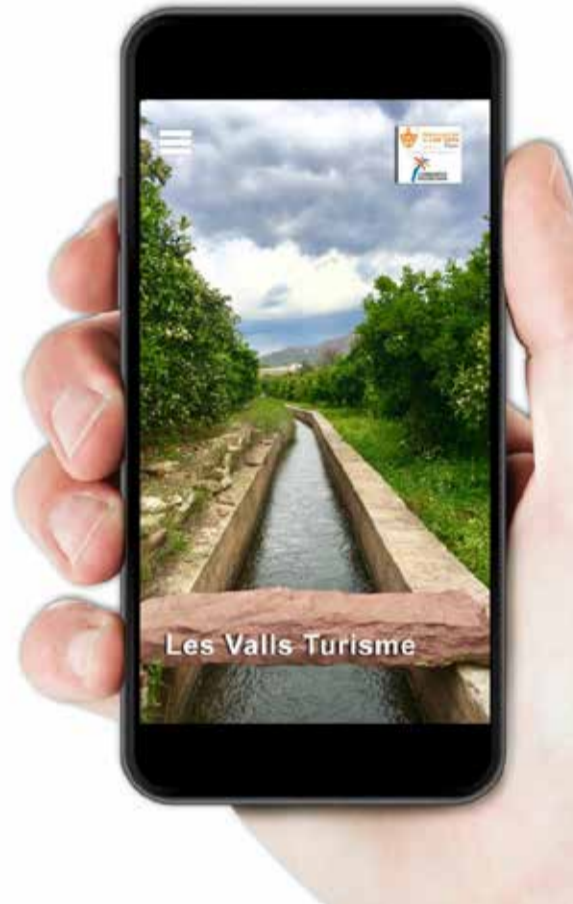
APP de Turisme de Les Valls. / EPDA

L'App permet la prestació de serveis afegits directes a potencials visitants, agències de viatges, tourperadors, etc. L'App així com la web de turisme "http://turismelesvalls.es/index", ofereixen a les persones visitants alternatives d'entreteniment i experiències