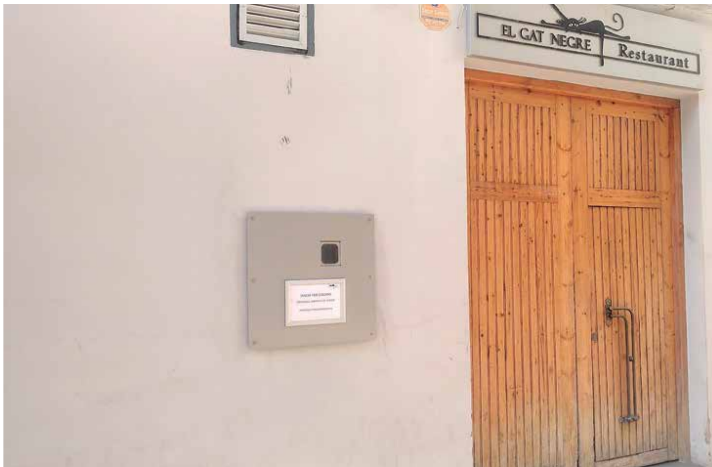
El restaurante El Gat Negre sigue cerrado.