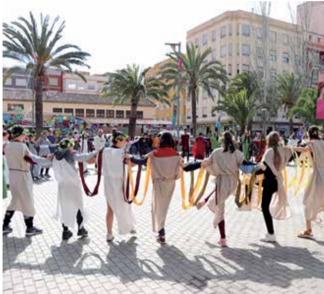
Imagen de una edición anterior.

Este año no se podrán llevar a cabo actividades de