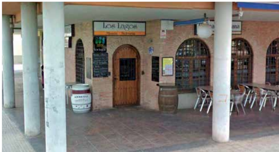
Terraza de Los Lagos en el Port de Sagunt.

en nosotros. Abrimos como referencia a ellos”, matiza el propietario. Una confianza que en tiempos de pandemia se ha vuelto imprescindible para su supervivencia. “Cuando cesaron las restricciones nos llamaron preguntando cuándo volvíamos. A una clientela tan fiel,