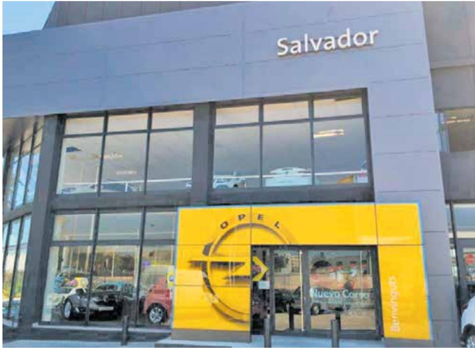
Talleres Salvador, en Sagunt.

El Periódico de Aquí te ofrece, en las siguientes páginas, información sobre nuevos modelos, descuentos, promociones y opciones de financiación en la comarca del Camp de Morvedre.