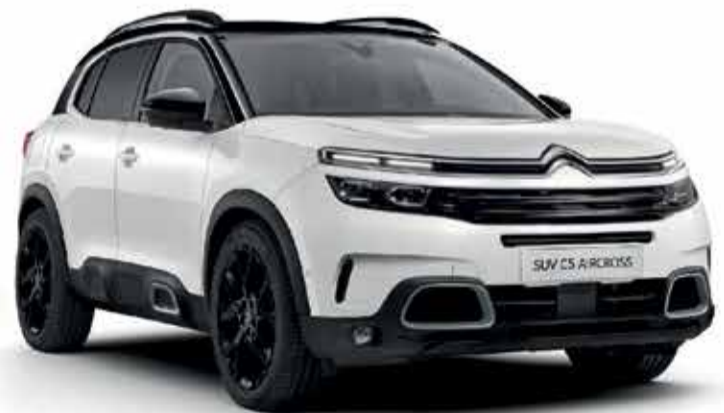
SUV CITROËN C5 AIRCROSS