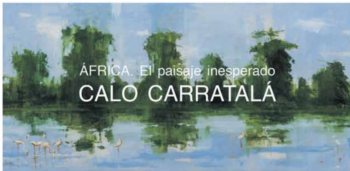
Flamencos en el lago Manyara II, óleo sobre tela 150 x 300 cm. Año 2020.