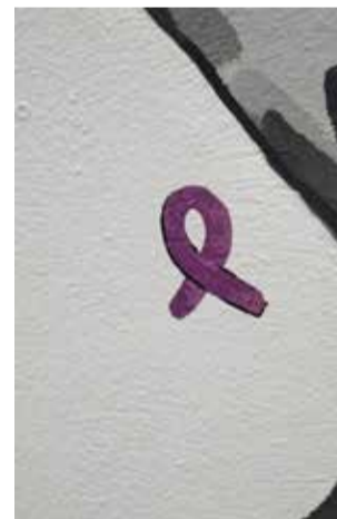
Detall del mural.

ha sigut suficient perquè des de l'entitat memorialista i la seua Comissió d'Igualtat "l'Ideal Femení", s'aportara aquesta iniciativa per a recordar que enguany es compleix el 90è aniversari del vot femení.