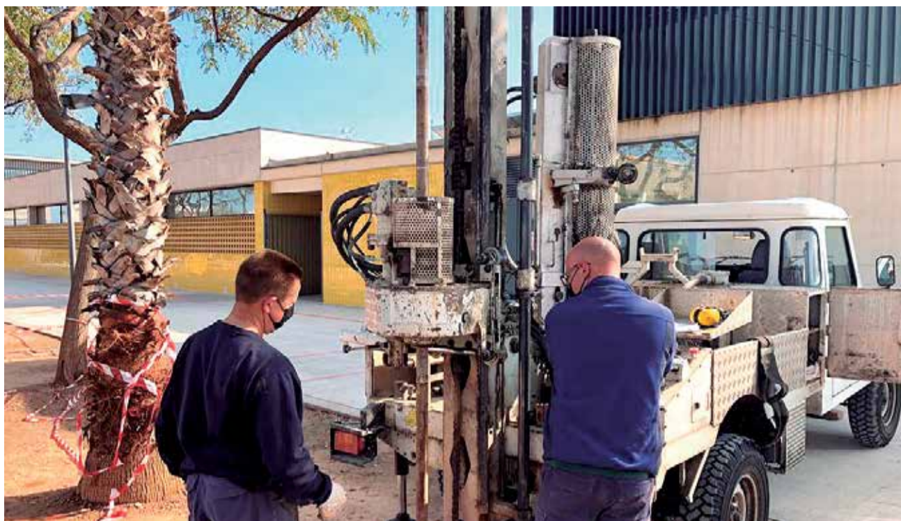
Trabajos para el estudio geotécnico. / EPDA