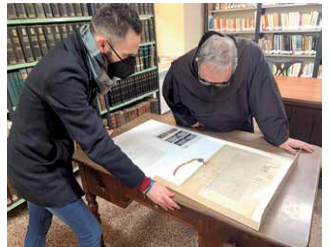
Bula papal al monestir de Sant Esperit.

Es tracta d'una 'litterae gattiosae', per la qual es disposa que aquesta casa, després d'una etapa de crisi, malalties i violències, forme part de la província dels franciscans regulars d'Aragó, es regisca sota la seua regla i costums, i els seus religiosos queden sota l'obediència del provincial-