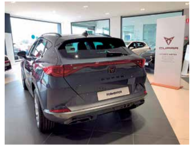
Dos imágenes del nuevo Cupra Formentor.

La capacidad del maletero varía entre los 450 litros de las versiones tradicionales de combustión, los 435 litros de las híbridas y los 420 litros de los modelos equipados con la tracción total 4Drive.