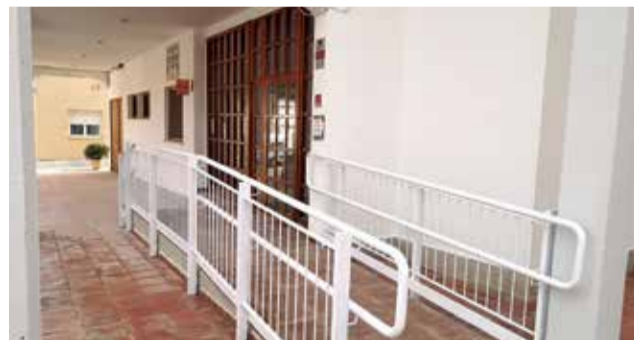
Nova rampa d'accés a l'ajuntament.

Les obres han permès l'eliminació de les barreres arquitectòniques, no sols de l'entrada a l'edifici consistorial, mitjançant la construcció d'una rampa d'accés i una barana, sinó també millorar