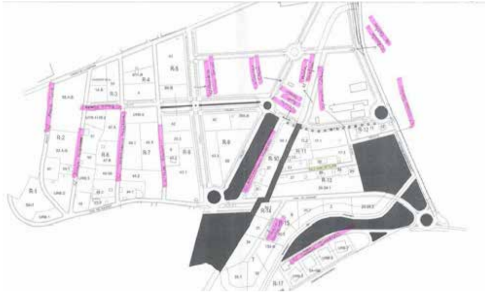
Plano con las calles que se nombrarán.

Una vegada aprovat l'acord, l'Ajuntament de Gilet ha procedit a notificar l'acord a l'Institut Nacional