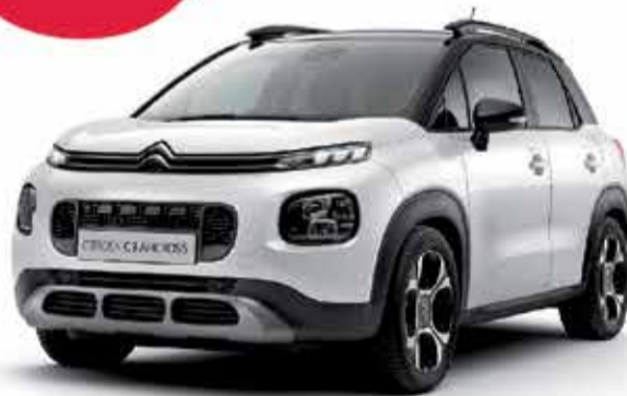
SUV CITROËN C3 AIRCROSS