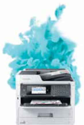
Impresora Epson Work Force Pro C5790

AHORRA MÁS DEL 50% EN IMPRESIONES Y 90% DE ENERGÍA