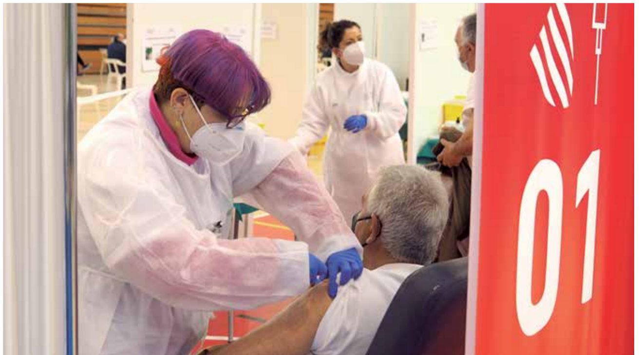
Una de las personas recibe la primera dosis, este miércoles, en el pabellón René Marigil de Sagunt.

Las sesiones transcurrieron con total normalidad y con la asistencia masiva de la población citada, a pesar de transcurrir la segunda de las jornadas del mismo día en que Castilla y León suspendió la inoculación de la vacuna de AstraZeneca a la espera del informe de la Agencia Europea del Medica-