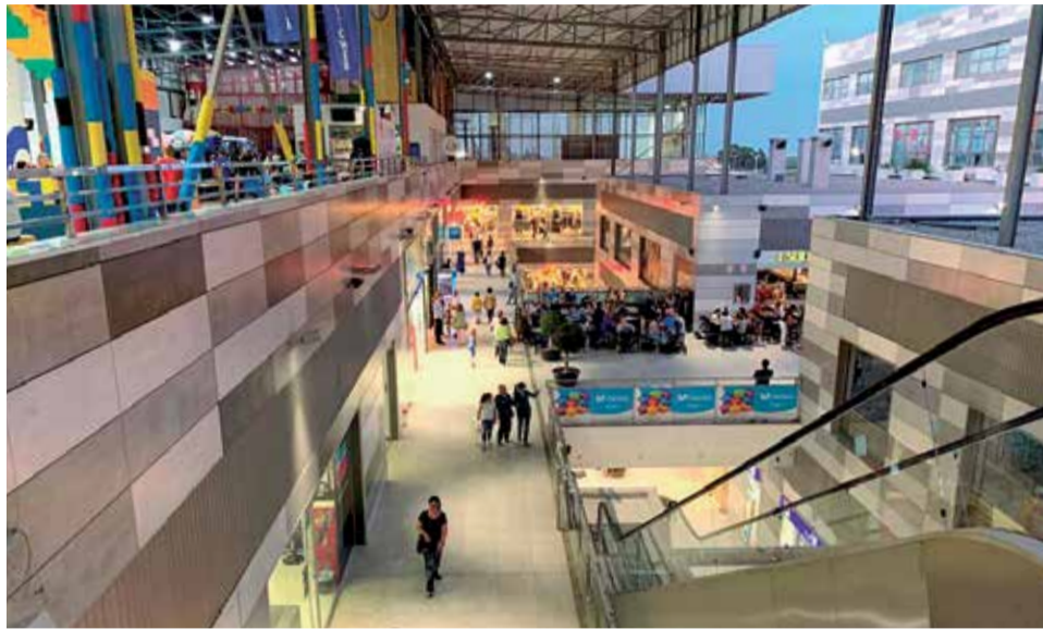
Uno de los pasillos principales del centro.

También la gerencia del centro comercial está contando los días para la reapertura de Lepilandia.