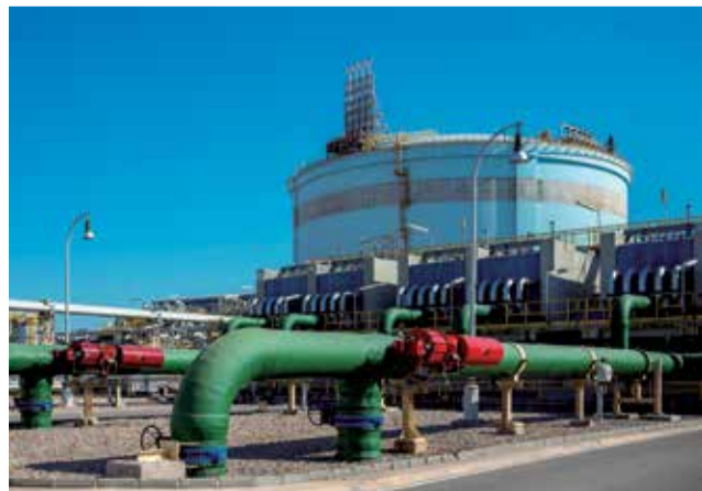
La planta de regasificación de Sagunt.

Durante estos quince años, Saggas ha descargado 811 buques metaneros, con un total de más de 37 millones de tone-