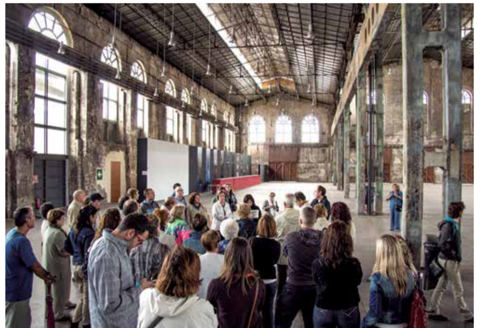
El interior se panelará para distribuir el espacio para distintos usos.

al mismo tiempo cumpliría una función social frente al avance de la actividad portuaria” indican desde la directiva de la asociación autonómica a EPDA y recuerdan que “se trata de rescatar el pasado y proyectarlo en el futuro” por lo que no estarían de acuerdo con el proyecto de la APV si supone la construcción de un nuevo