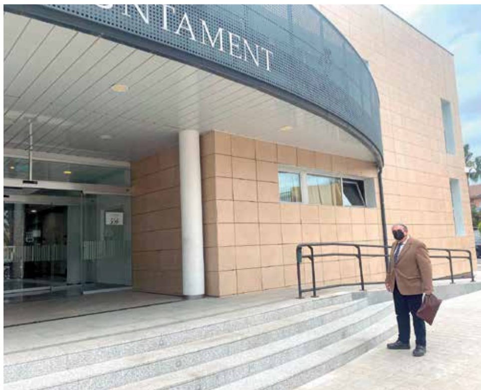
Sancho, a las puertas del ayuntamiento de Canet el pasado miércoles.

Según fuentes municipales, la presencia de Sancho Sempere