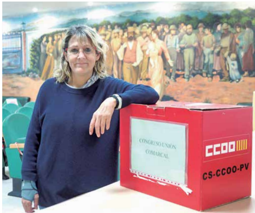
Cortijo, junto a la urna donde se votará a la persona que le sucederá.

► Empecé mi primer mandato con la crisis del 2008 y concluí este tercer mandato con la crisis de la Covid. Los costes en términos de empleo en la crisis de 2008 fueron devastadores para toda la comarca y, además,