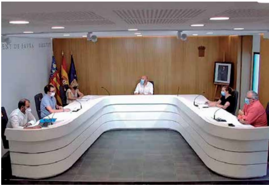
El ple ordinari va aprovar la moció sobre l'habitatge per unanimitat.

D'altra banda, segons indiquen des del consistori, este acord "reportarà un benefici directe en el servei públic que es presta en evitar que la ciutadania haja de donar-se d'alta com a persones sol·licitants d'habitatge en diferents administracions. Al mateix tems, s'evitarà que realitzen incòmo-