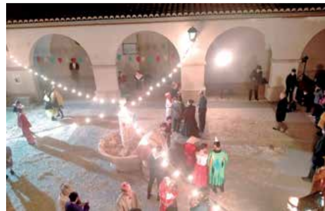
Un moment de la gravació a la plaça.