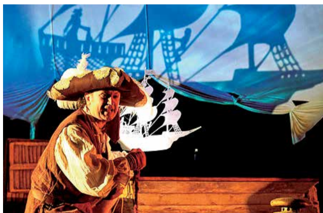
Un dels espectacles de la quarta edició, al 2019.