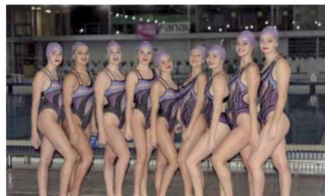
Les participants del club acuàtic.