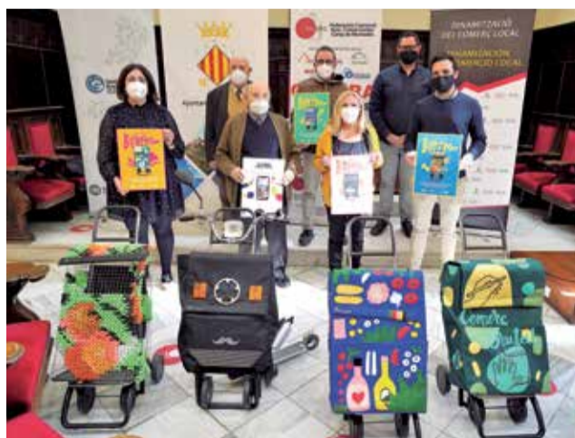
Presentación de la campaña de Unión Gemial / QUILES

Estos carros han sido diseñados por cuatro artistas valencianas en una reinterpretación de este elemento tradicional, pero que no son reproducibles y por ello Facosa ha adaptado la imagen a una serigrafía que incluye el logo de la entidad