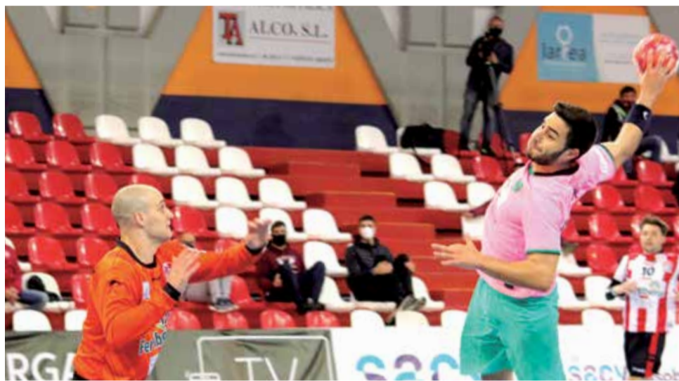
Un instante del encuentro disputado anteayer en el Ovni

El partido comenzó a descompensarse con las paradas del hispano, Gonzalo Pérez de Vargas y la rapidez de equipo blaugrana a la contra hizo que finalmente ambos equipos se