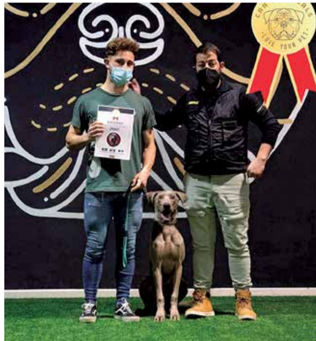
Aprobados en Obediencia Canina Nivel 1./ EPDA

l'Epicentre, una sección en apoyo y reconocimiento al trabajo que realizan por nuestros animales de compañía clínicas veterinarias y guarderías. La empresa destacada del mes ha sido precisamente Can's Animal, en este caso una guardería canina que destaca por ser un lugar de adiestramiento, con ali-