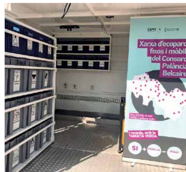
Interior de un ecoparque.

Asimismo, las instalaciones de Algímia d' Alfara van a abordar otra anualidad de inversiones de mejora, tanto desde el punto de vista ambiental como operacional, con el objetivo de disminuir todavía más la huella ambiental de su actividad. Cabe recordar que se trata de una instalación que se acerca a los 10 años de antigüedad pero que no ha parado de implantar mejoras en sus procesos de tratamiento de residuos.