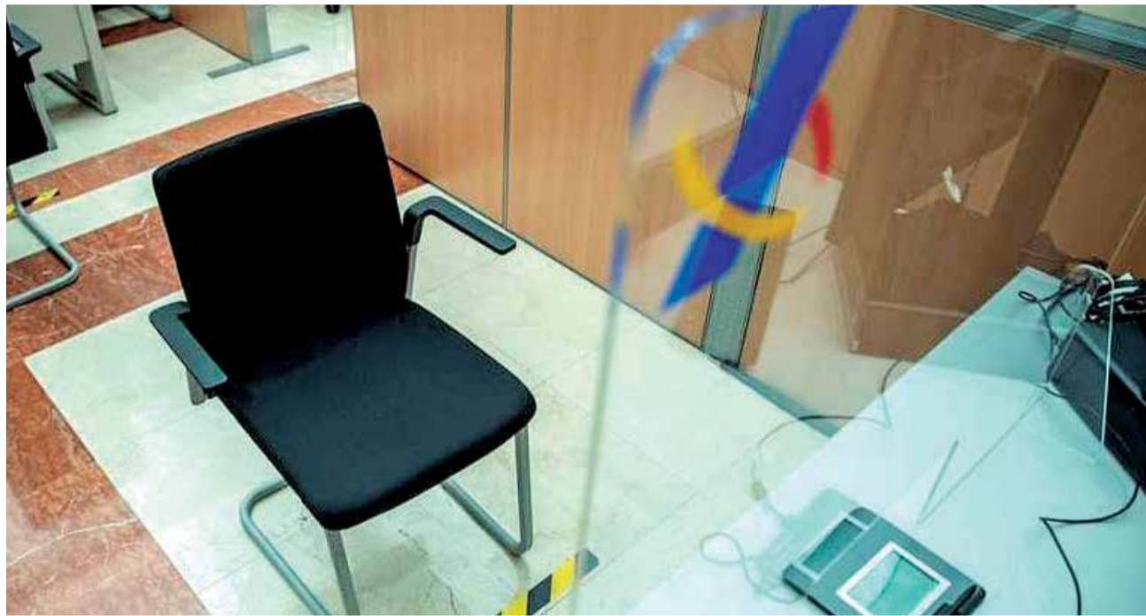
Una oficina de Hacienda, somos todos.

La Agencia ha diseñado la campaña que arranca ahora con un refuerzo de la asisten-