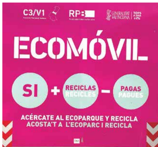
Ventajas por el uso de los ecoparques.

A este respecto, la red global de ecoparques, a pesar del Covid-19 y de los cierres temporales de algunos ecoparques, ha registrado un récord positivo de 19.151 toneladas separadas en origen en 2020, cuando comenzó, era de 7.000 toneladas. Este ascenso histórico se debe a los descuentos económicos en la tasa de tratamiento de residuos que aplica el Consorcio, por las aportaciones separativas a su red global de ecoparques. Asimismo, las instalaciones han tenido un porcentaje