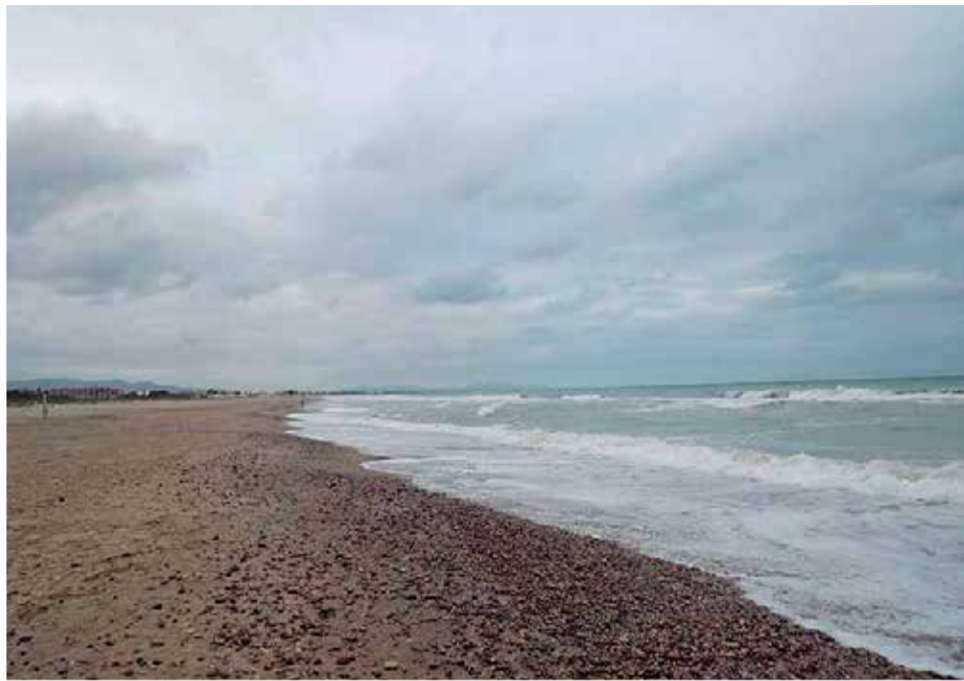
La llegada de piedras a Canet se ha acrecentado desde el temporal Gloria.

gación de la escollera al norte del puerto deportivo Siles, de forma que se cree una barrera natural a las corrientes marinas que circulan de norte a sur en el litoral mediterráneo y que ésta "retenga la arena, que serviría no sólo para evitar nuevas pérdidas de sedimentos en la playa Racó de Mar, sino también para "constituir una reserva de arena que pueda servir en un futuro para suministrar a las playas del norte, evitando así que se deba recurrir, como propone el pro-