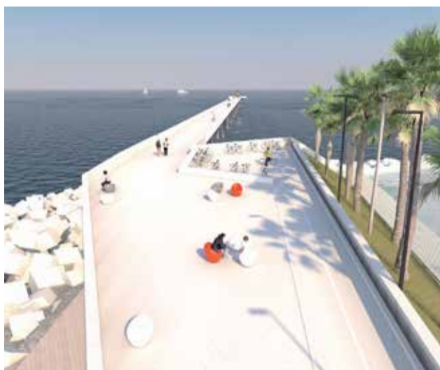
Renderización del proyecto de la APV / EPDA

cho con el consistorio en los últimos años".