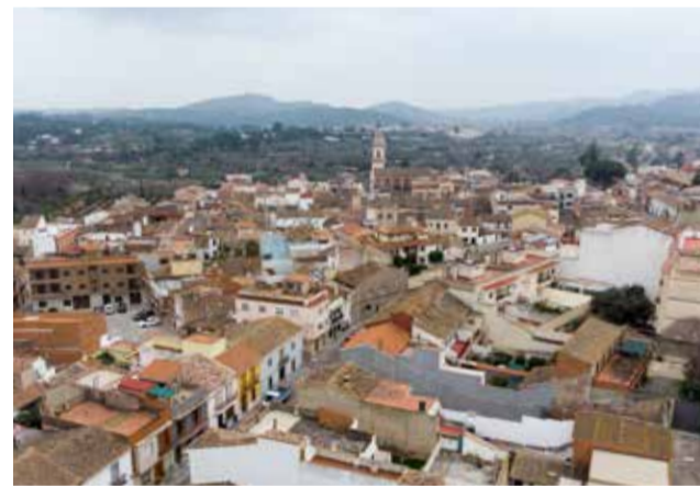
Vista parcial del nucli urbà. / PACO QUILES