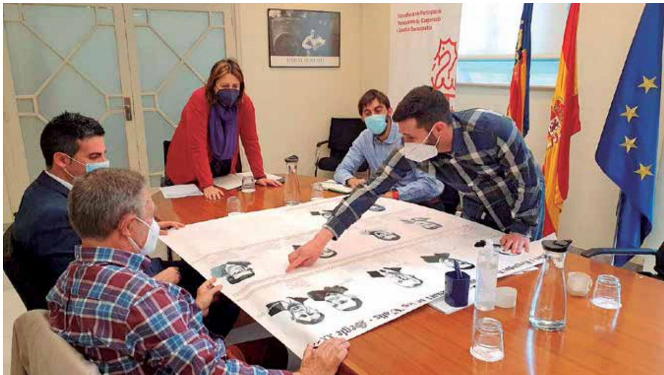
L'alcalde de la localitat i els membres de l'associació, reunits amb la consellera de Qualitat Democràtica.