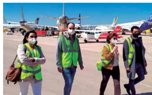
La delegación saguntina en su visita al aeropuerto.