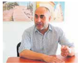
El ex edil Corresa.