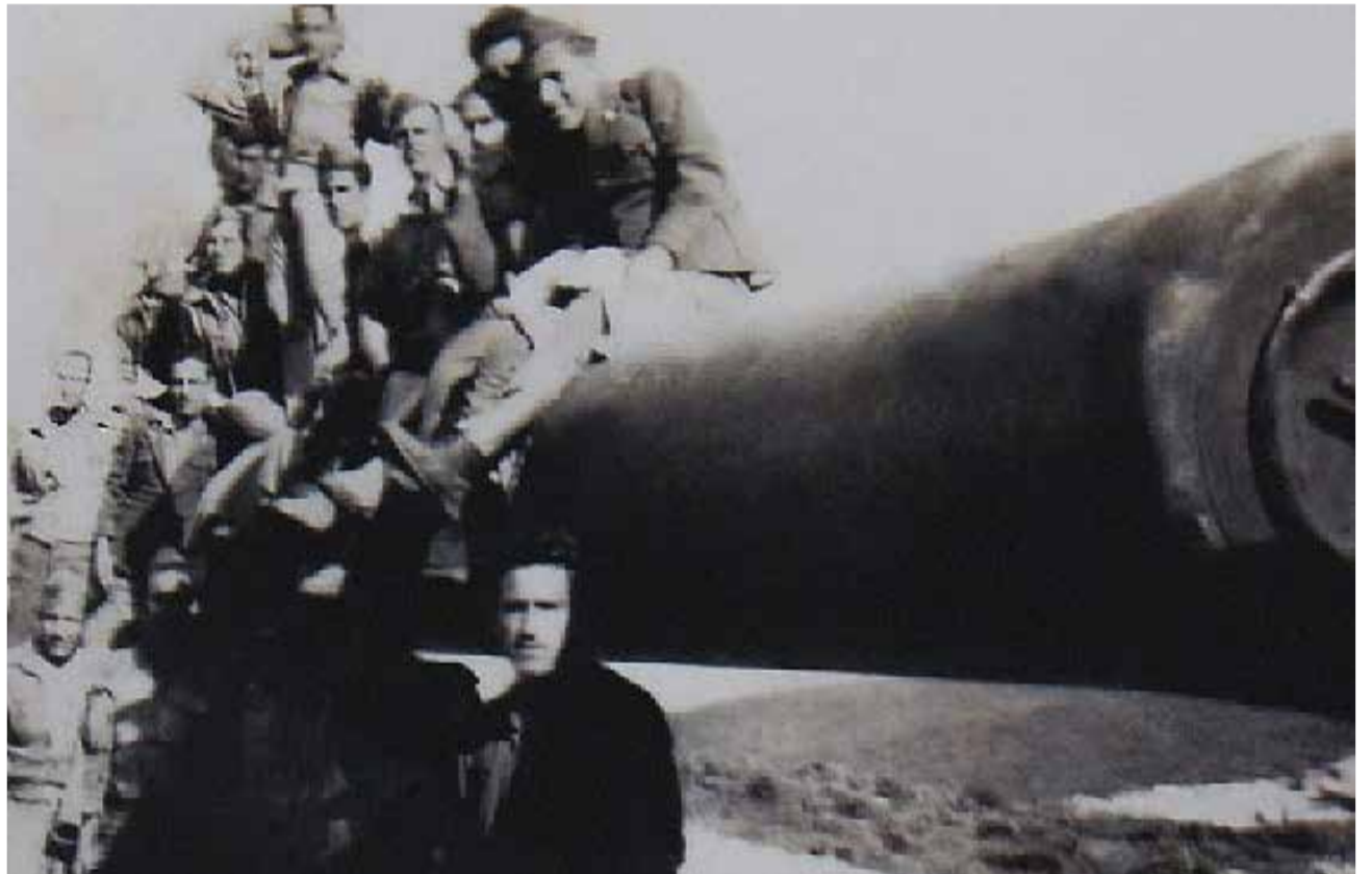
Trabajos en las minas de Almadén de uno de estos batallones del franquismo.

als presoners i presos polítics, la qual cosa atorgava falsa legalitat a aquests càstigs.