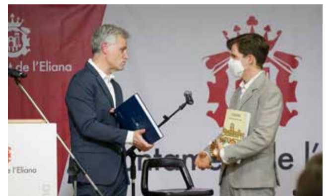
Firma del libro de honor del Ayuntamiento