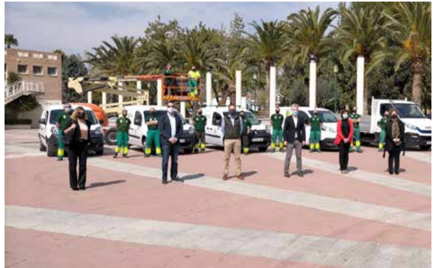
Presentació de les novetats en la jardineria

A més, s'ha incrementat la dotació de vehicles fins a un total de 8 unitats. Els nous vehicles són de propulsió 100%