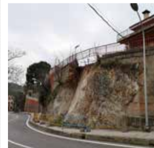
Mur de Serra / EPDA