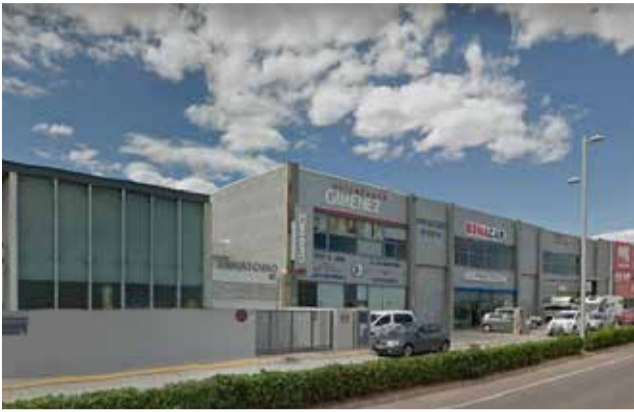
Persona major vacunant-se al municipi