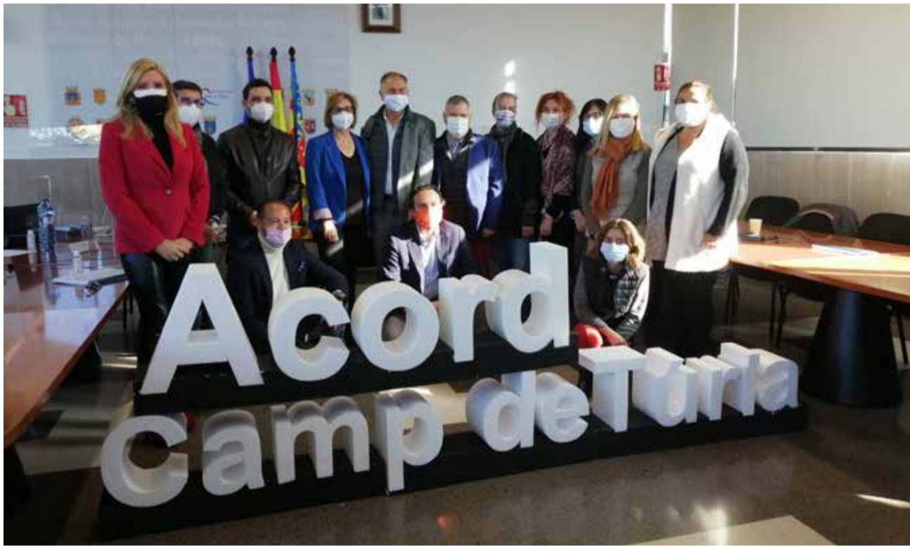
Els membres de les organitzacions després de presentar l'acord de Labora/ EPDA