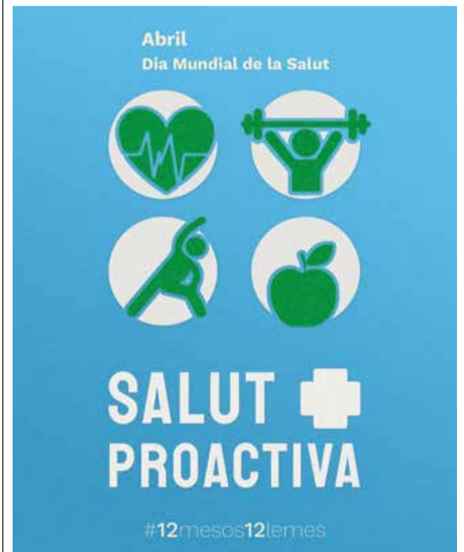
Cartel de Salut Proactiva / EPDA

Apunta't a la vida sana, apunta't a la vida sense addiccions!