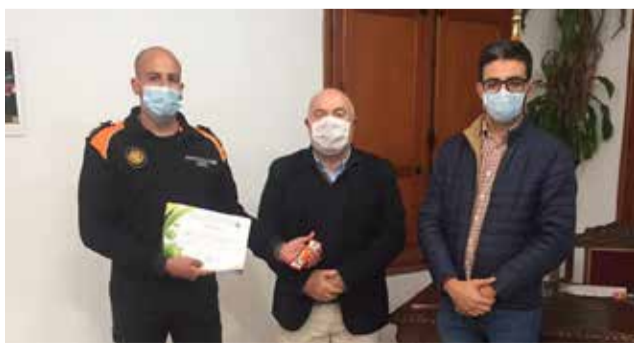
L'alcalde amb els membres de seguretat