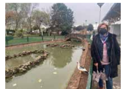
Varias imágenes del pueblo de Marines, en el recorrido junto a su alcaldesa.