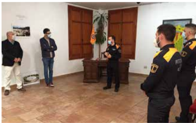
Reunió de les autoritats amb l'òrgan municipal

A més a més, el consistori ha volgut agrair “la labor, disposició, lliurament i participació ràpida durant el confinament” als assistents socials, l'equip de Secretaria, els voluntaris de Càritas i altres treballadors municipals.