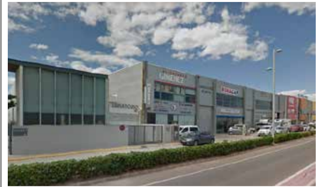
Imagen de una zona de "La Pila" / EPDA