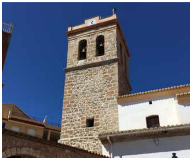
Campanario de Bejís / J.S. MURGUI

Navajo, Ventisquero del Pino, Ventisquero de las Dos Puertas, y Ventisquero Royo.