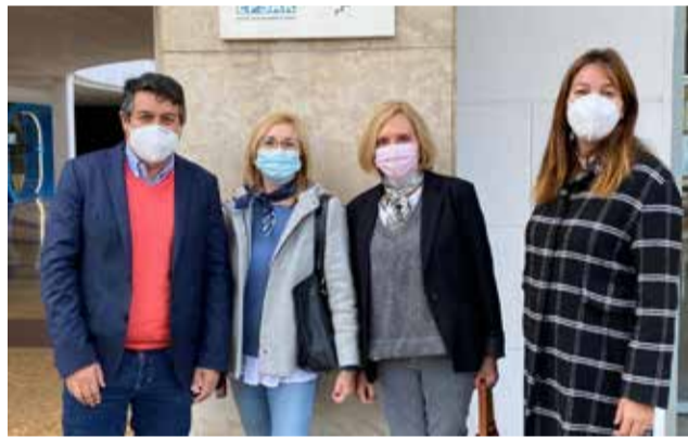
Tras la reunión de la planificación / EPDA

Con este proyecto se pretende dar respuesta al escenario medioambiental actual, y que los municipios cuenten con la proximidad de los servicios de colectores y depuradoras de agua.