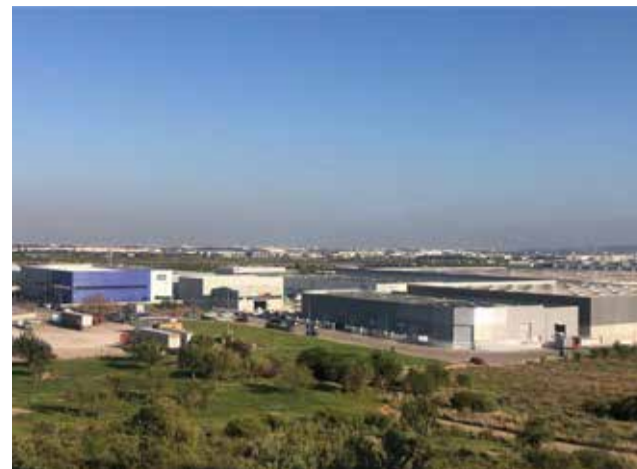
El polígono industrial de Loriguilla / EPDA