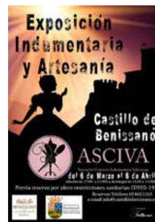
Cartell de l'acte