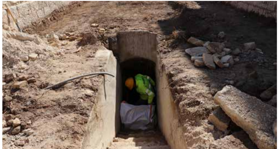
Recuperación del refugio de la Guerra civil

El Ayuntamiento ha dado a conocer estas iniciativas en la última sesión del ciclo de charlas 'Aula de Ciudadanía', celebrada el pasado 29 de marzo con motivo del Día de recuerdo y homenaje a las víctimas de la Guerra Civil y la dictadura en la Comunidad Valenciana, y que está disponible en el canal municipal de YouTube.