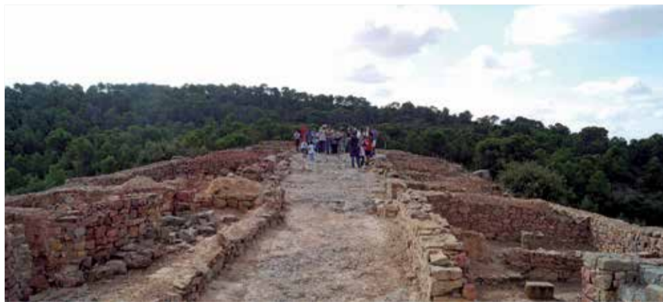
Poblado íbero ubicado en el término municipal de Lliria

construir una vez terminada la Tercera y última Guerra Carlista.