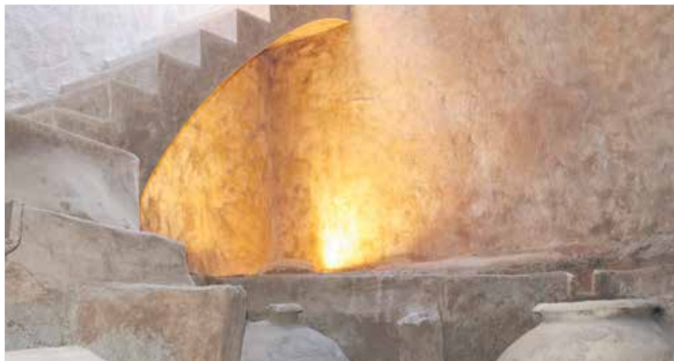
Una de las bodegas subterráneas ubicadas en la localidad de Utiel.

Por la calles del recinto histórico se van intercalando portales, torres medievales, un acueducto de arcos ojivales, un buen lienzo de murallas y coronando todo ello, el Fuerte de la Estrella, que en la antigüedad sirvió de residencia a los reyes de Aragón y hoy acoge una singular fortificación que se terminó de