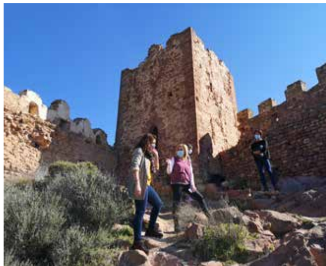
Visita al castell de Serra

En ell s'establiran els diferents projectes i fases a realitzar en el curt, mitjà i llarg termini. També s'estudiarà la viabilitat econòmica, les modalitats de gestió i els programes de difusió d'este important recurs turístic i pa-