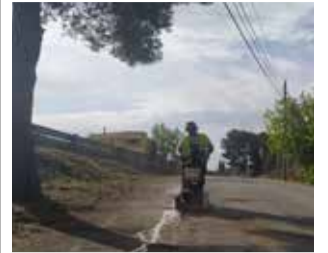
Obras en Bétera