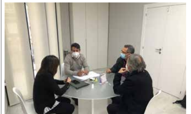
Reunión para la organización de las obras / EPDA