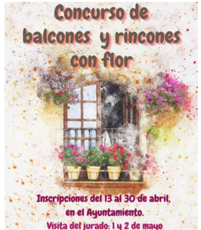
Cartel promocional del Ayuntamiento

Para impulsar esta iniciativa, se ha puesto en marcha