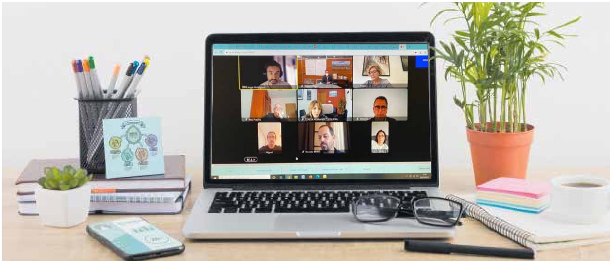
Un momento de la videoconferencia celebrada entre los miembros de la Mancomunidad Tierra del Vino y del Consorcio Valencia Interior.

■ DURANTE ESTA RONDA DE ENCUENTROS VIRTUALES EL CVI PRETENDE ACERCARSE A LOS MUNICIPIOS Y EXPLICAR LOS PROYECTOS DE ESTE AÑO