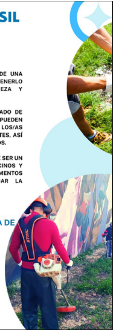
Fotografía de los trabajos en los alcorques