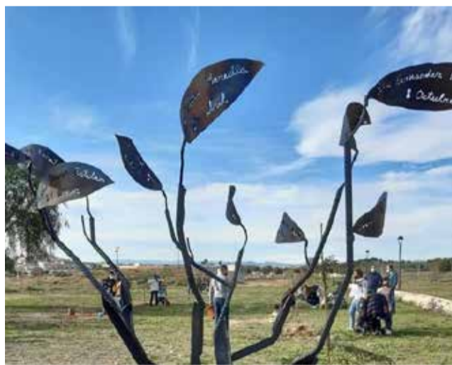
Imatge del solar on estarà el 'Bosc ciutadà'

El Bosc dels Ciutadans de Benissanó està presidit per dues escultures en ferro de l'artista local David Garrido, i que consisteixen en dos arbres, on en les seues fulles, estan escrits els noms de tots els