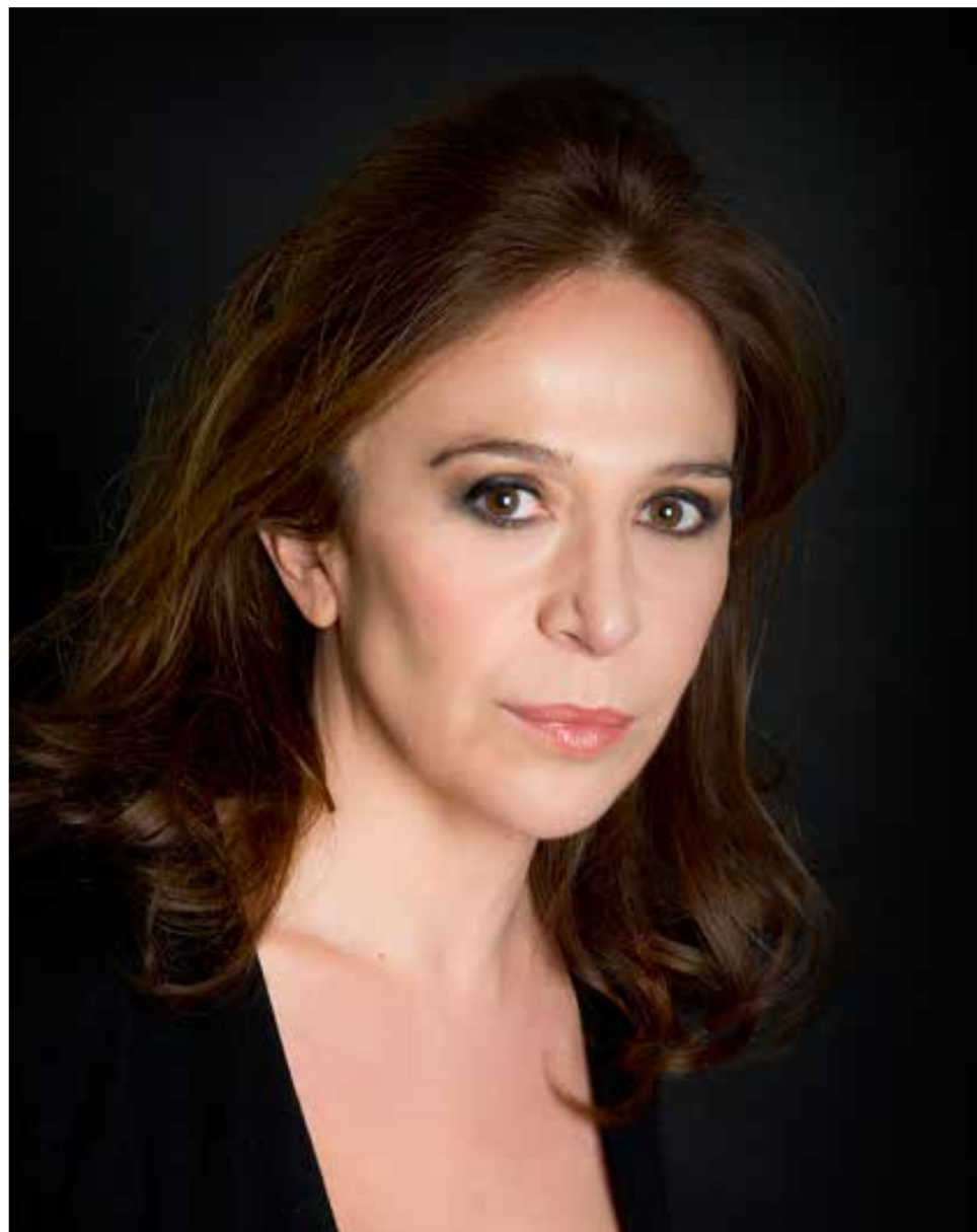
Fotografía de la actriz Lola Montó

► En algún cartel de “Anestesiadas” puede leerse: «una comedia con abrazos y mentiras». ¿Ser sincera sale rentable en una sociedad co-