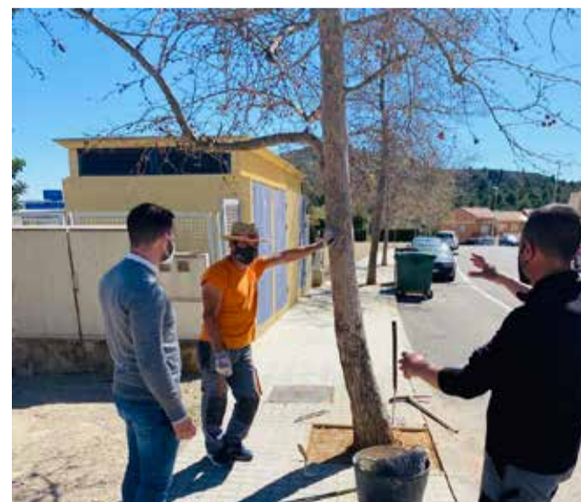
Los trabajos en los alcorques

Estas obras además de reducir los costes de mante-