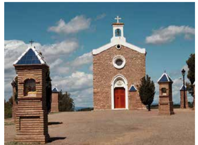
L'ermita de San Francesc a Nàquera

Les reunions per a tractar el tema s'han anat succeint