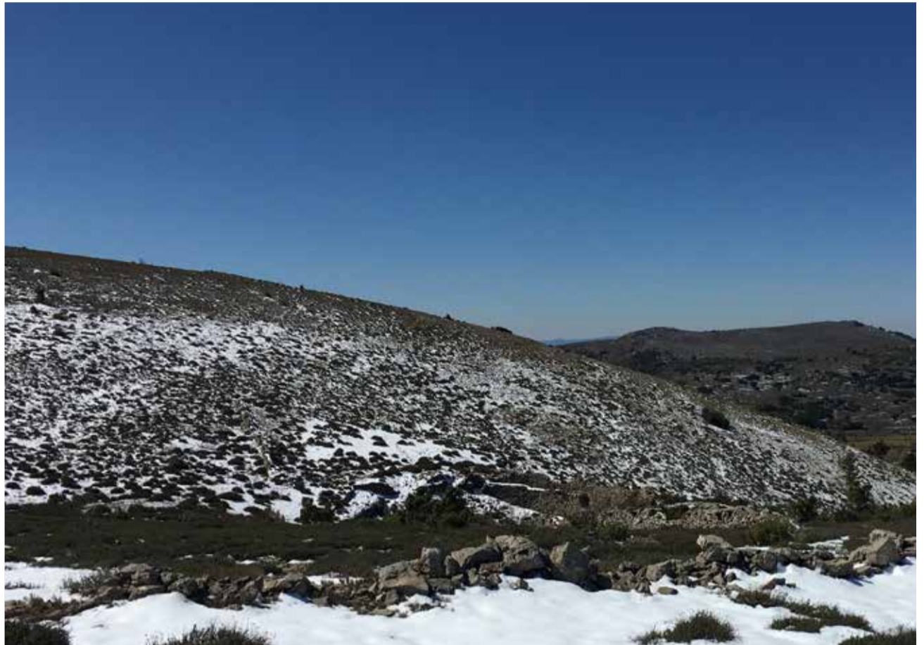
Nieve en Bellida durante estas últimas semanas

Los Ventisqueros tienen su nombre, que va ligado a la propiedad del constructor, del lugar que ocupan, o de detalles que permitían su identificación y los definían: Ventisquero de los Frailes, uno de los que mejor se conserva, y que tiene su nombre por los frailes de la Cartuja de Porta - Coeli, o de los de Val de Crist. Ventisquero del Tío Bartolomé, Ventisquero del Tío Cabrero, Ventisquero del Tío Bodegas, Ventisquero de las Ombrias, Ventisqueros del