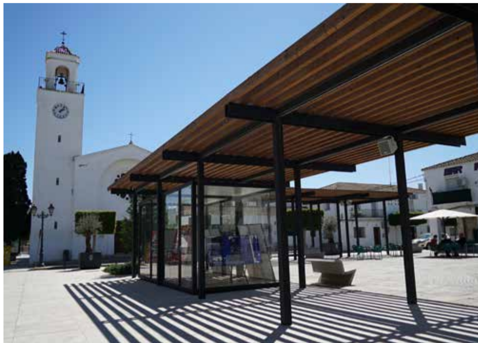
Imágenes expuestas sobre la historia de San Antonio de Benagéber

Así, las imágenes expuestas nos remiten a la historia de la localidad a través de varios hilos conductores: el momento de su fundación, en los años 50, con el éxodo de población procedente de Benagéber por la construcción del pantano; el proceso de segregación de Paterna, que tu-