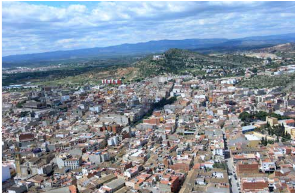
Fotografía aérea de Benaguasil

Además, Benaguasil es el único municipio donde la