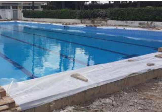
Imagen de las obras y la remodelación dentro de la piscina municipal de Marines / EPDA

Con esto se generará una superficie apta para actividades de deporte, gimnasia, acuagym... Actividades más demandadas por una parte