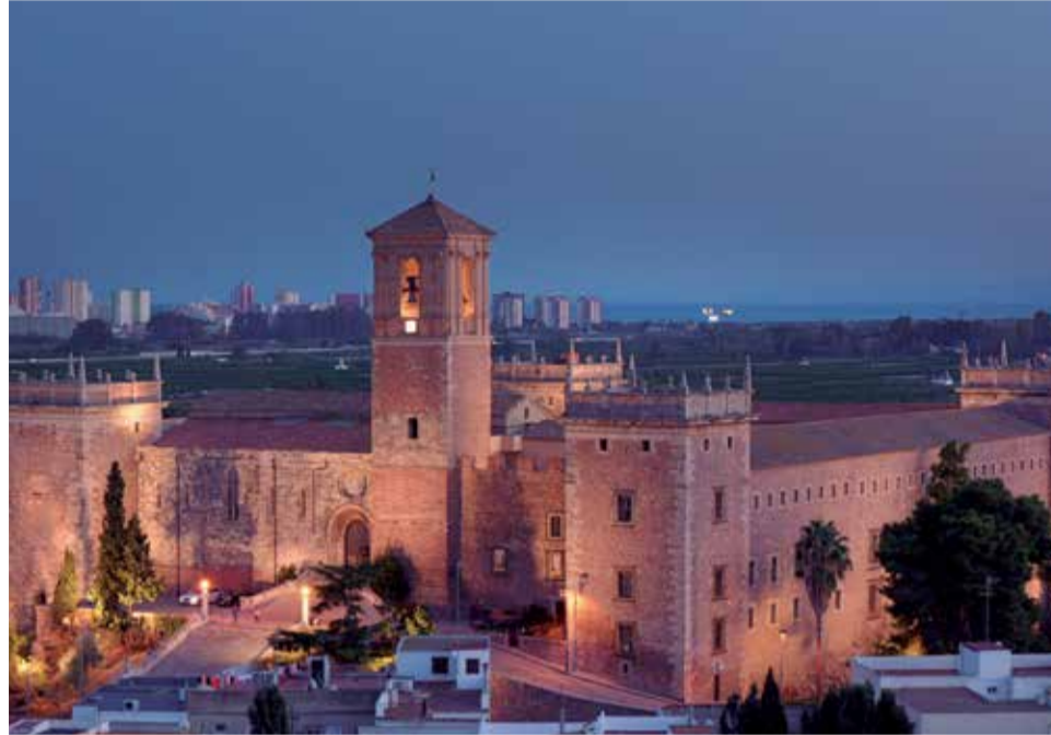
Vista nocturna del emblemático Monasterio de Santa María ubicado en El Puig. /

Esta zona del Camp de Morvedre se localiza al pie de las primeras elevaciones de la Sierra de Espadán. Vegetación mediterránea de pinos que ocupan las montañas que en forma de balcón, ofrecen unas espectaculares vistas de la Costa del Azahar. Rodeando las poblaciones, ocupando un espacio