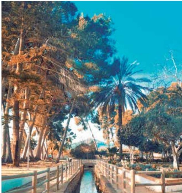
Font de Quart, en la comarca de Les Valls.

El paseo por los restos de las calles y viviendas laterales ibéricas se complementa perfectamente con la visita al Museo Arqueológico, donde se podrán observar detalladamente las reliquias extraídas del lugar. Una forma de trasladarse a otra época