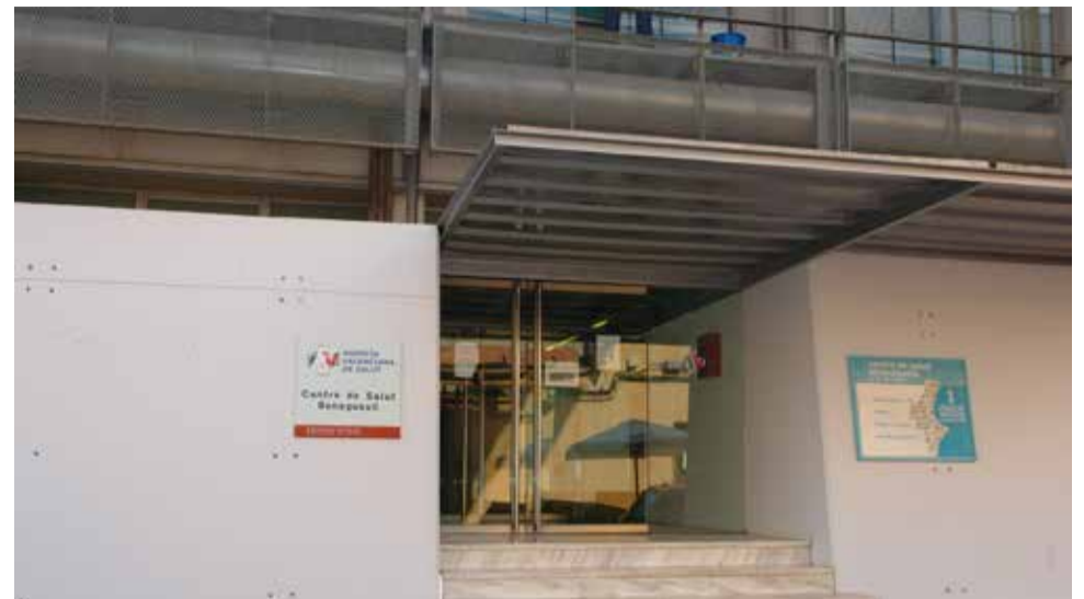
Centro de salud de Benaguasil / EPDA

En las próximas semanas se mantendrán más reuniones de coordinación de cara a tener todo listo cuando se inicien las vacunaciones y “facilitar dentro de nuestras posibilidades, la vacunación masiva de la población”, concluyen.