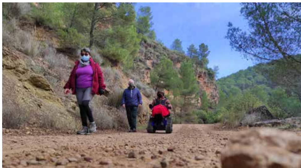
Vecinos de Bétera paseando por las rutas

Dentro de las rutas existe la posibilidad de participar para las personas con movilidad reducida gracias a la in-