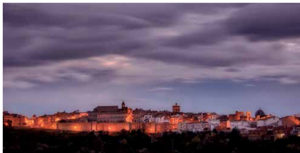
Vista panorámica de la ciudad de Segorbe.