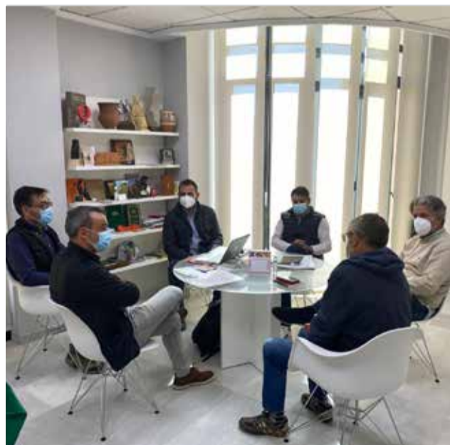
Reunión para la planificación de 'ElsPuntals' / EPDA

El proyecto, aprobado por el Consejo Agrario Municipal y por unanimidad en las