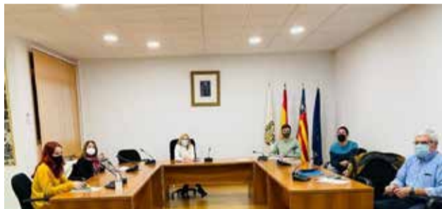
Reunió on es van aprovar els plans / EPDA