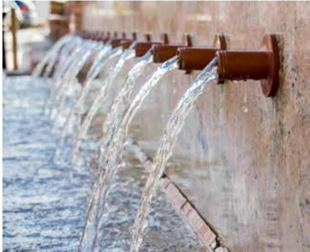
Fotografía de las fuentes de Gátova

En los últimos meses, Gátova ha estado trabajando para ofrecer un servicio de WIFI gratuito para todo el municipio, a raíz de las ayudas europeas. Como en todos los municipios, el presupuesto ha sido de 15 mil euros. “En Gátova hay doce puntos de conexión, que se extienden unos