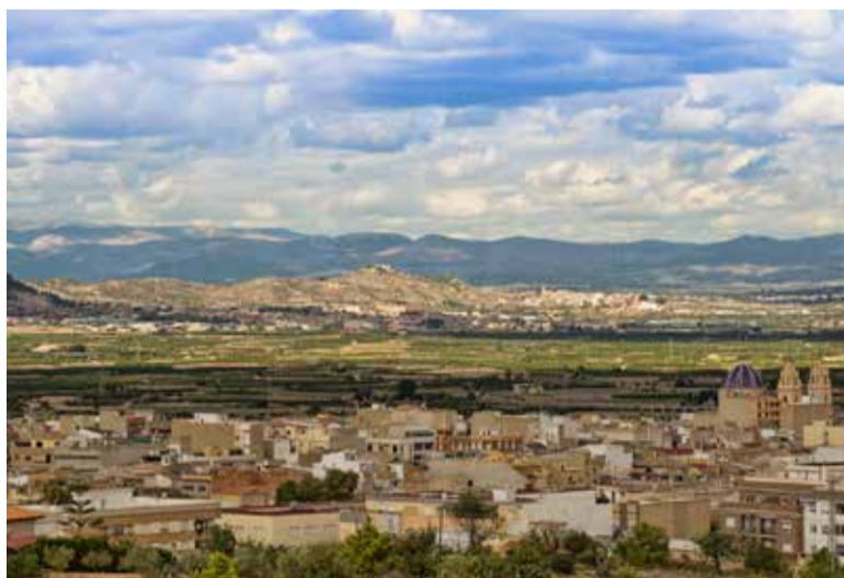
Paisatge de Riba-roja

L'alcalde de Riba-roja, Robert Raga ha explicat que el cent per cent dels projectes tenen un component sostenible i tecnològic que els converteix en projectes clarament elegibles a les ajudes i subvencions europees del Pla de Recuperació per