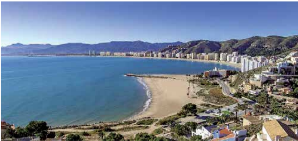
Zona litoral del municipio valenciano de Cullera.

ca en un antiguo yacimiento rodeado por el Parque Natural de la Sierra Calderona.