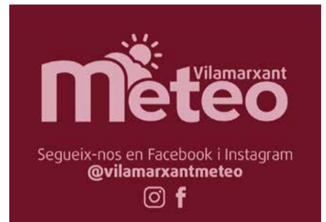
Cartel de promoción del servicio / EPDA

la información procedente de canales especializados y oficiales". "Queremos agradecer también la colaboración de personas voluntarias de Vilamarxant que colaborarán activamente en estos perfiles sociales y que darán la información meteorológica de gran utilidad para todos", ha finalizado Jorge.