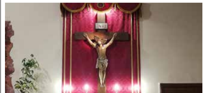
Jesucristo en la Semana Santa de Benaguasil