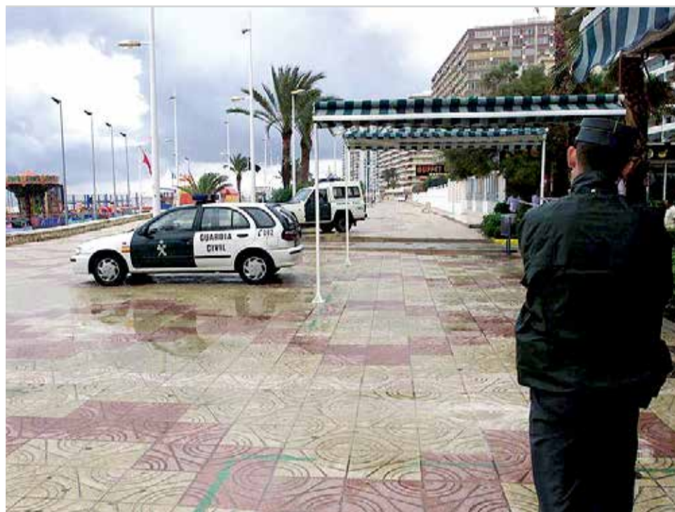
Un agent de la Guàrdia Civil i diverses patrulles a Cullera.

Els agents van procedir a la detenció del presumpte autor dels fets i les diligències han passat a la disposició del Jutjat de Primera Instància i Instrucció número 2 de Sueca.