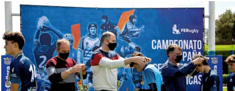
Presentació campionat de rugby a Cullera.

ALGUNES ZONES DEL MUNICIPI SÓN DE CATEGORIA BÀSICA