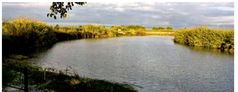
Passeig riu Xúquer per Riola.

Revaloritzar este espai és una de les propostes del govern que opera ara a este municipi de la Ribera Baixa a més de ser un projecte presents en la Diputació de València.