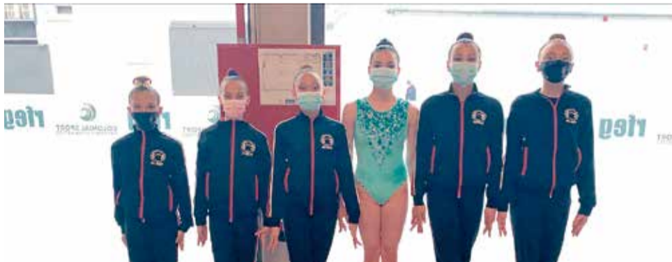
Equip del Club Aceus de Sueca.

L'EQUIP VA FINALITZAR EN LA POSICIÓ 21 I VAN ASCENDIR ELS SIS PRIMERS CLUBS