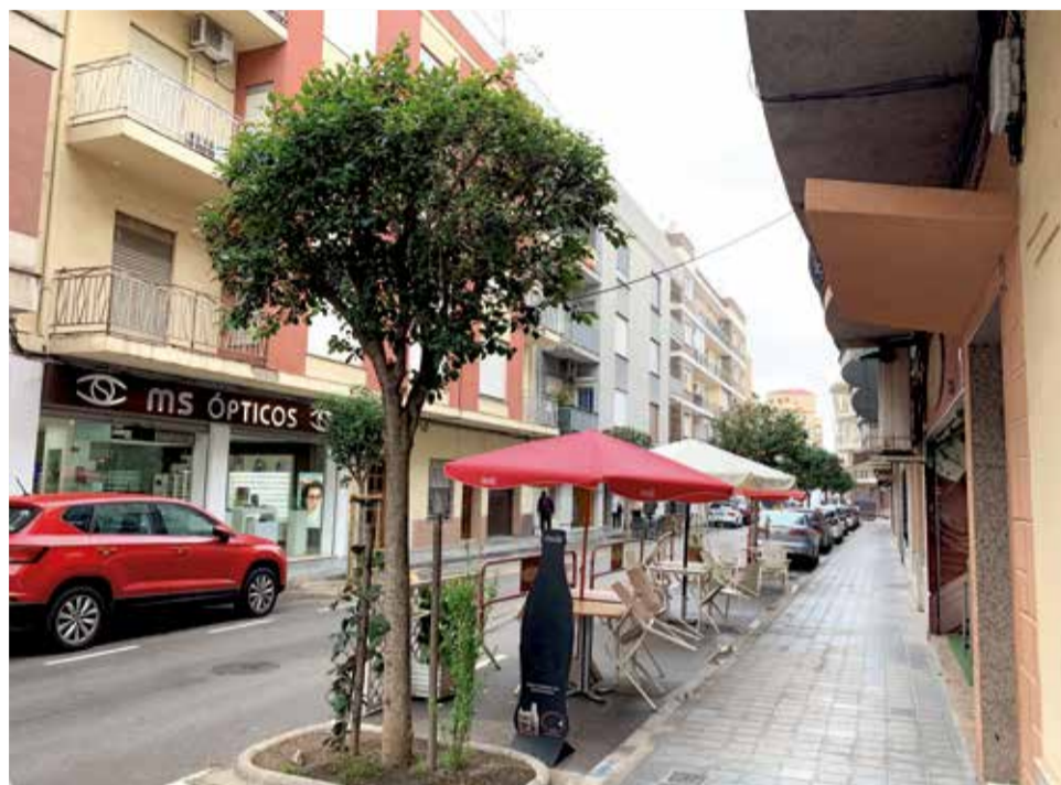
Carrer d'Alberic amb negocis.

vist dur a terme diferents projectes d'obres per a actuar sobre zones importants del nostre municipi i que permet dinamitzar en gran manera la nostra economia local. S'invertirà en les obres al voltant de mig milió d'euros de fons propis, com a fruit del bon estat dels comptes de l'ajuntament. L'equip de govern sap a més que és un moment delicat per a moltes famílies, per la qual cosa la partida de Serveis Socials es va veure incrementada en 60.000 euros en 2020 i hem adquirit material per a lluitar contra la pandèmia per valor de més de 40.000 euros. En total, estem parlant d'una inversió total de l'ajuntament que ascendeix per damunt del milió d'euros”.