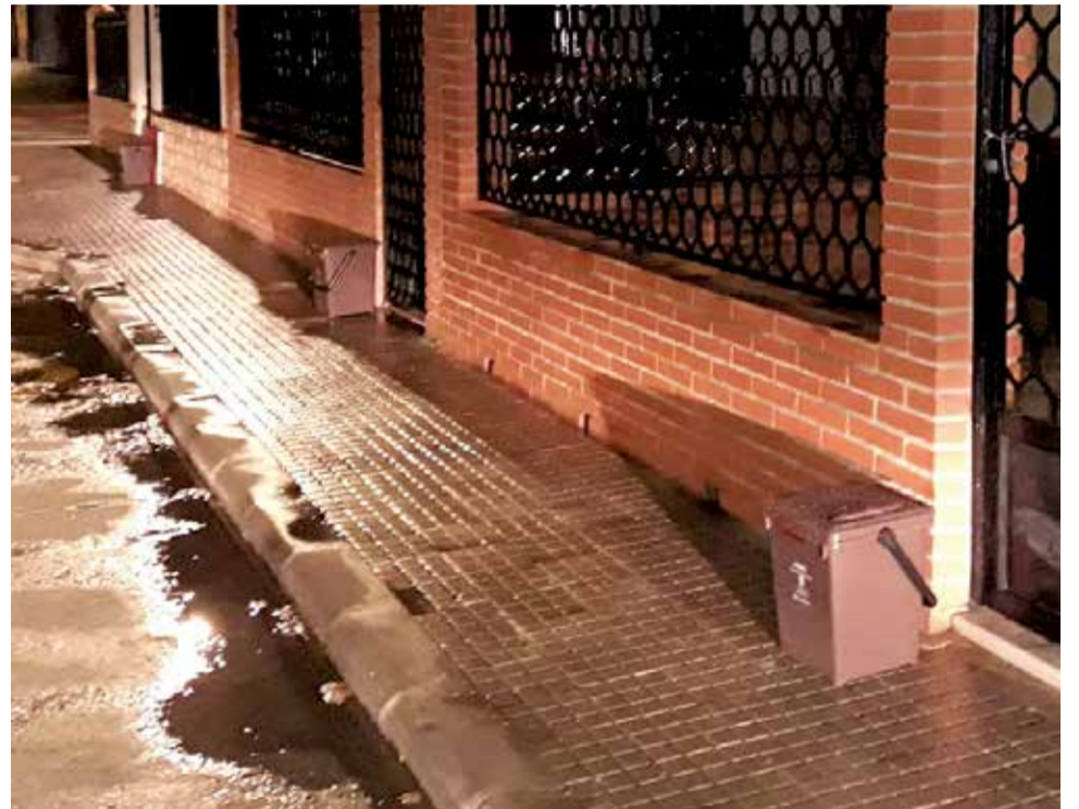
Sistema de recollida Porta a Porta de la Mancomunitat.