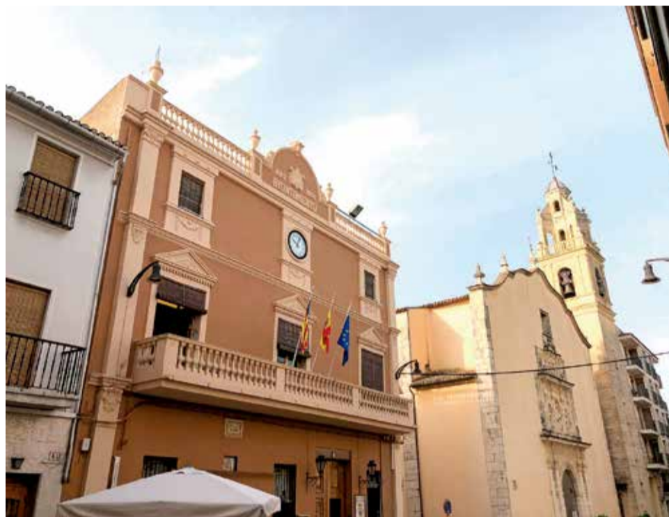
Ajuntament de Guadassuar . / EPDA

Finalment, el Ple aprovà també, amb càrrec al romanent existent, una dotació de 727.000 euros per a dur endavant diferents obres i inversions necessàries per a la població.