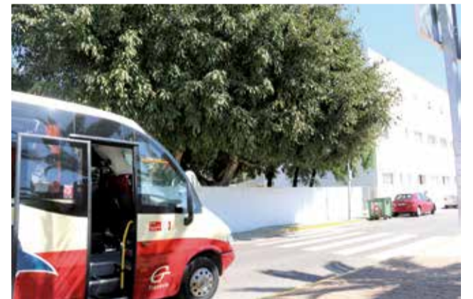
Servei d'autobús gratuït.

D'acord amb les dades d'ús de transport gratuït a l'hospital de la Ribera, que finança l'ajuntament, per a tot el veïnat, al llarg de l'any 2020, s'han transportat al voltant de 250 persones setmanalment. Una xifra que, segurament, amb el període de vacunació, s'incrementarà notablement.