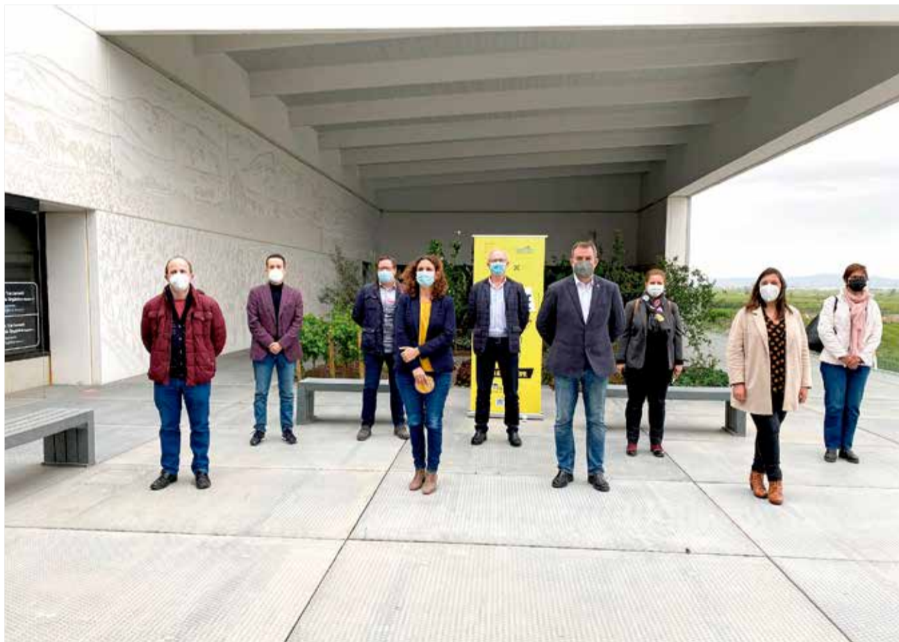
Presentación “El reto del reciclaje” en Consorci Ribera i Vallidigna de Guadassuar.

complicidad entre administraciones y entidades que necesitamos tejer en la ciudadanía. Ni las administraciones vía inversión o las plantas de tratamiento pueden solas con el reto de sostenibilidad ambiental ni la ciudadanía puede sola. Debemos ir de la mano”. Y añadió, “las campañas como esta son absolutamente necesarias porque al final es lo que cambia el comportamiento individual que nos hace ser más eficientes en nuestra sostenibilidad ambiental”.