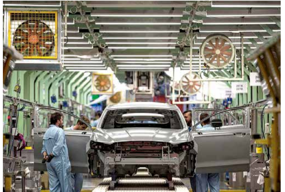
Fábrica Ford de Almusafes.