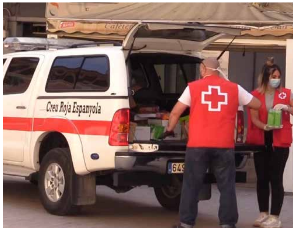
Donació de la Creu Roja Espanyola a la localitat d'Alzira.

Pla de contingència específic SAD per a auxiliars del servei d'ajuda a domicili per a garantir les màximes condicions de protecció i seguretat. Pla específic d'actuació en un marc clar d'objectius per a salvaguardar la qualitat assistencial residencial als establiments residencials, Soli-