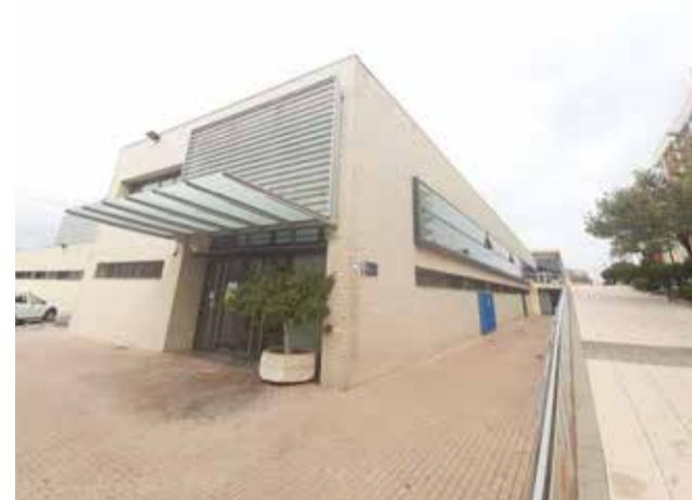
Pavelló Municipal d'Almussafes.

"Quan vam veure que la situació s'havia estabilitzat vam posar la maquinària en marxa per a tornar a oferir la possibilitat de practicar esport en el pavelló, perquè l'exercici físic és qualitat de vida i salut. Des de l'Ajuntament volem brindar a la ciutadania una alternativa més per a dur a terme aquestes activitats, amb les quals està comprovat que millora el nostre present, però sobretot el nostre futur", destaca el regidor d'Esports, Pau Bosch.