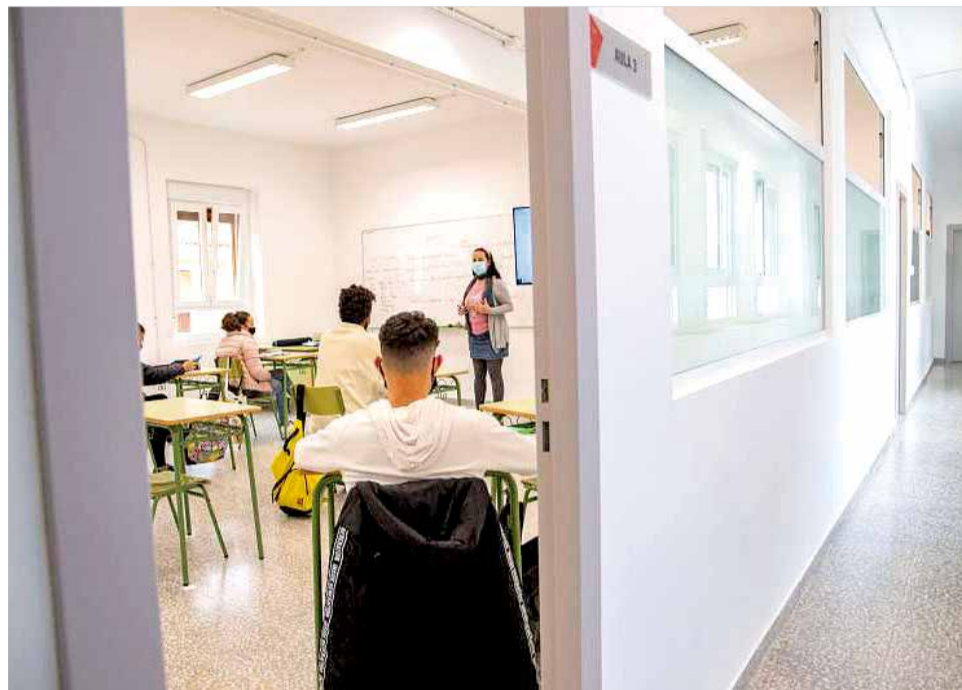
Escola Permanent d'Adults de Cullera. / EPDA

Actualment, l'EPA compta amb més de 400 alumnes matriculats.