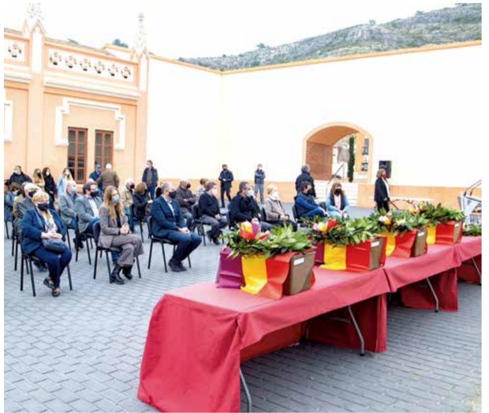
Acte al cementeri municipal en memòria dels fusilats.

Amb la jornada de soterrament i d'homenatge celebrada fa uns dies, estos cinc veïns ja descansen de forma digna al cementeri municipal de Cullera.