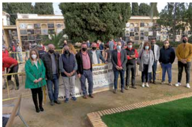
Asistentes al inicio de los trabajos en Paterna.

Por fin podremos llevar a casa al abuelo”, asevera la nieta de una de las personas enterradas en el campo santo de Paterna