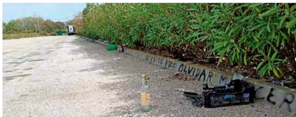
Polígon on es van fer els macrobotellons.

la ràpida intervenció policial es van detectar dos macrobotellons al parc industrial, tots dos localitzats en les zones d'aparcament públic. Es concentraven entre 20 i 30 vehicles en cadascun d'ells i consegüentment multitud de joves reunits. L'operació va concloure amb l'alçament d'un total de 46 actes per infracció a joves de Picassent, Almussafes, Benifaió, Solla-na, Alginet i Alberic.