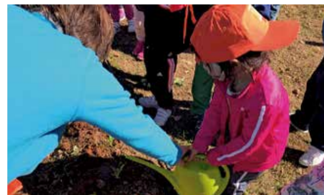
Activitat pel dia de l'arbre.