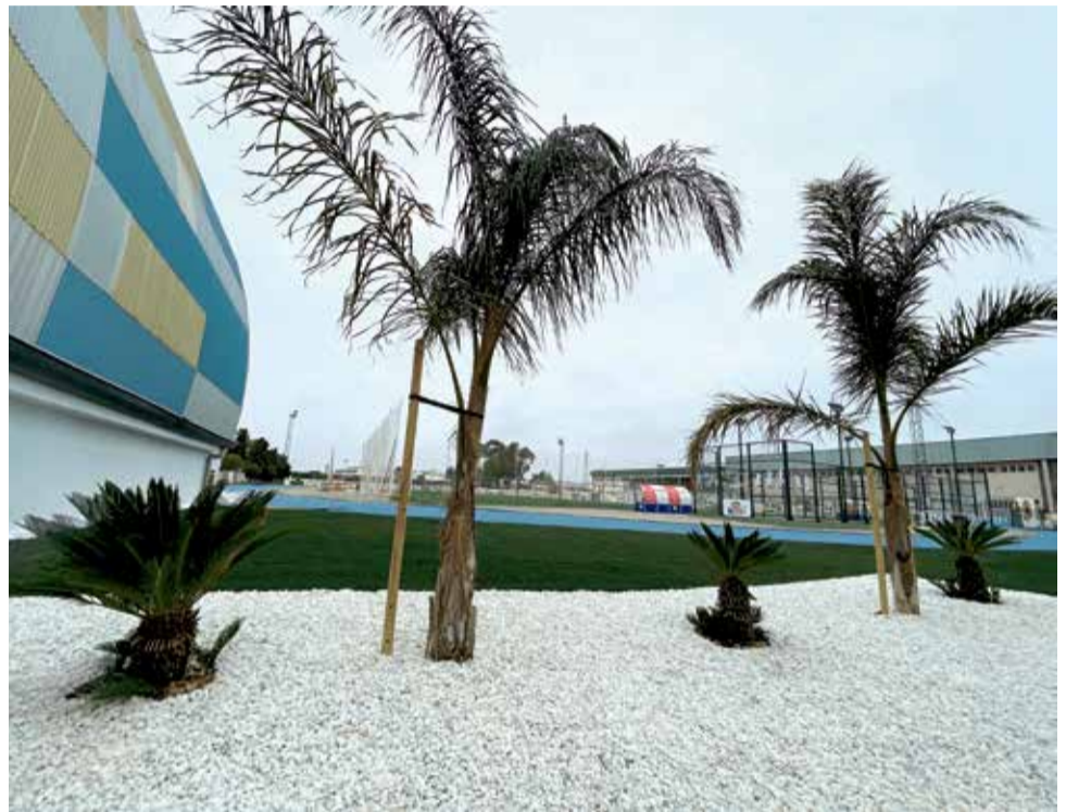
Nuevas instalaciones deportivas de Benifaió.