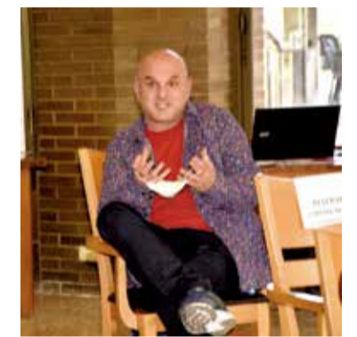
Diferentes instantes del encuentro celebrado en el Club Deportivo Saladar.