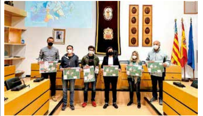
Presentació rutes a l'Ajuntament.