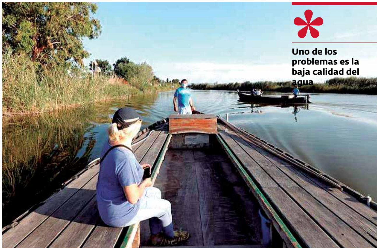
Usuarios realizan un viaje en el Parque Natural de L'Albufera.

La CV-500 vive un colapso continuo. La congestión de tráfico es la norma habitual todos los fines de semana y festivo a lo largo del año, y la estampa es casi diaria durante los meses de la temporada estival. La carretera hacia Valencia y también en dirección a los municipios de la Ribera se vuelve intransitable. Este realidad una de las principales denuncias de los vecinos de la zona y también de los negocios de hostelería que hay en la zona, que aseguran que los problemas de tráfico son uno de los principales motivos desincentivadores para asistir a sus locales. La mejora del transporte público y mejores dotaciones para el transporte sostenible podrían mejorar la situación de una zona que está entre las preferidas por los valencianos para disfrutar del tiempo libre.