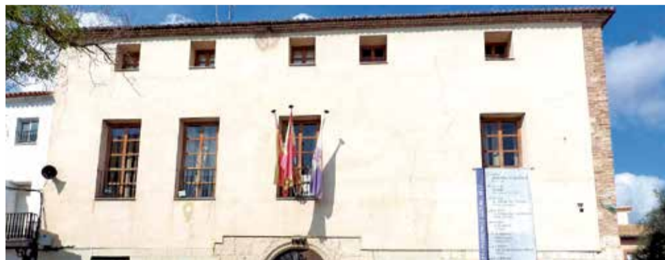
Ajuntament Sumacàrcer. / EPDA

ELS ACTES VAN INICIAR-SE AMB LA PEL·LÍCULA 'GAG MOVIE'