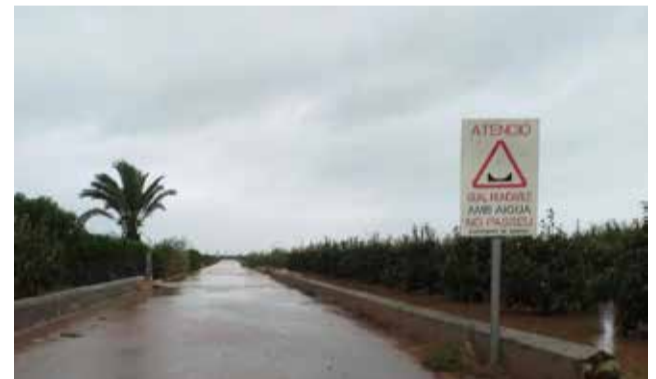
Paso cortado por el temporal de lluvias.

Los votos a favor de todos los grupos políticos sacaron adelante esta propuesta además de aprobar de forma conjunta dotar una partida presupuestaria municipal extraordinaria para acondicionar los caminos rurales.