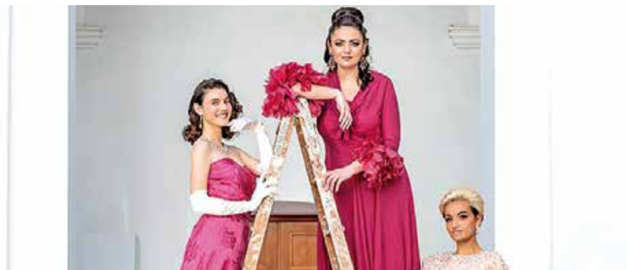
Indumentària tradicional a l'exposició.

L'EXPOSICIÓ ESTÀ OBERTA AL PÚBLIC DES DEL 10 D'ABRIL