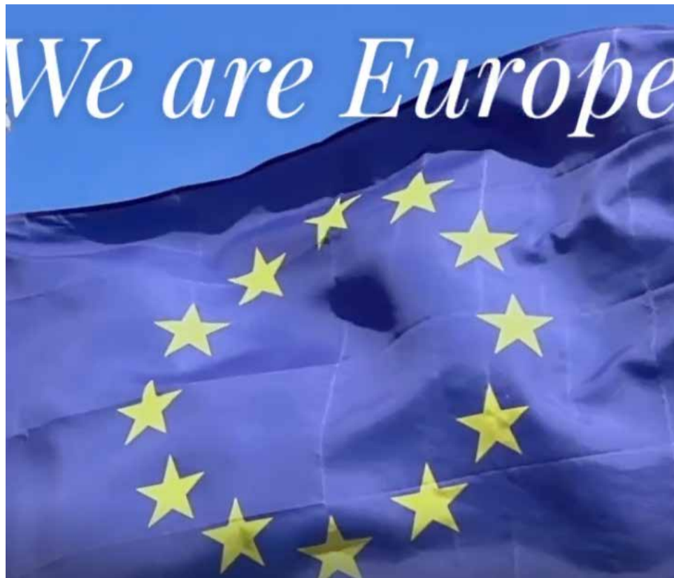
Projecte transnacional de Montserrat.

Els objectius del projecte són: sensibilitzar sobre els valors de la ciutadania europea i la participació activa en la vida comunitària, fomentar l'esperit empresarial i la creativitat a través de l'experiència i la