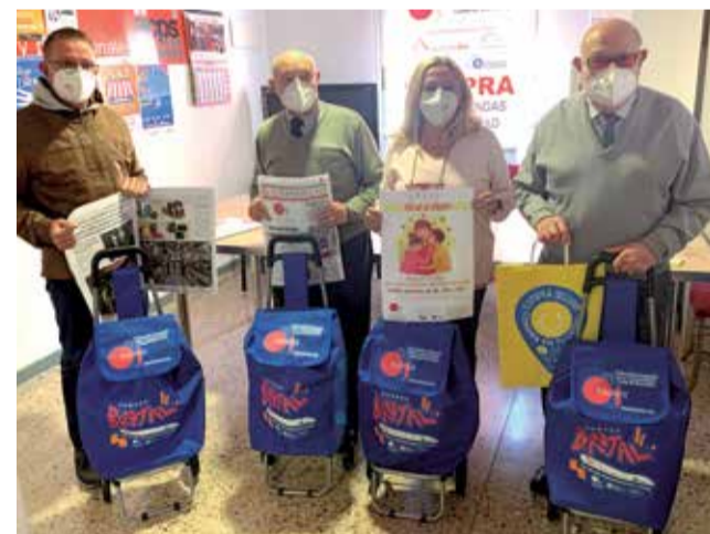
Los representantes de las cuatro asociaciones.

Además, Torrente traslada la importancia del pequeño comercio, en un momento tan difícil por la pandemia, que se ha visto obligado a cerrar. Como acto de solidaridad y responsabilidad, siempre pensando en la salud de la población, ahora nos toca corresponderles", incide la portavoz y presidenta de la federación de comercio.