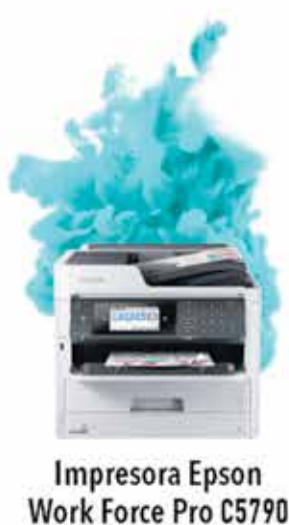
Impresora Epson Work Force Pro C5790

berolina AHORRA MÁS DEL 50% EN IMPRESIONES Y 90% DE ENERGÍA