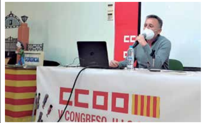
Villalba, durante el V Congreso de la U.I. de CCOO.