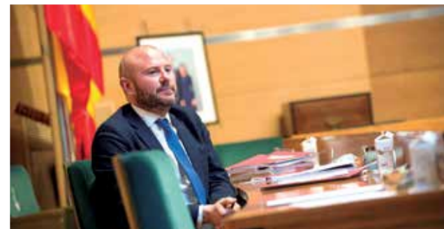
Toni Gaspar, presidente de la Diputació de València

cias corrientes de la Diputación y, junto al plan de Inversiones, deja cada año más de 120 millones de euros en los municipios valencianos, con el objetivo de garantizar la liquidez de los ayuntamientos, en especial los más pequeños, y dar respuesta a las necesidades de los consistorios para ejercer esa autonomía local en la que basa su gestión el presidente de la institución, Toni Gaspar.