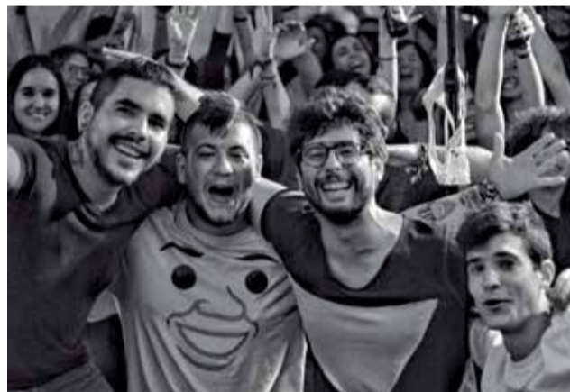
El grupo Yo vivo navegando actúa en el Casino del Port.

Asimismo, a causa de la situación sanitaria ocasionada por la Covid-19, la mayoría de las actuaciones se realizarán en espacios abiertos, y cada una de ellas tendrá una duración aproximada de 90 minutos. Actualmente está programado hasta principios de mayo, aunque se alargará hasta finales de junio con otros conciertos.