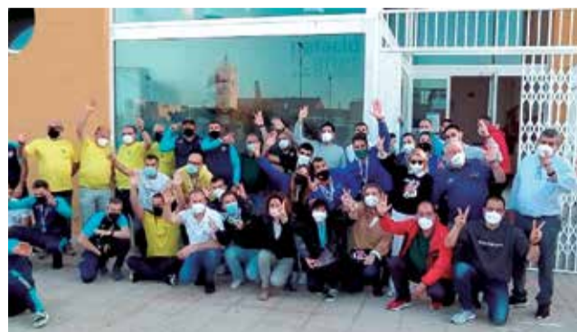
Participantes en el campeonato.

El evento, contó con 16 participantes, dos en categoría femenina y catorce apneistas en la categoría masculina. Una competición donde regieron las medidas sanitarias y todos los integrantes de la organización, así como el personal de seguridad y los competidores, pasaron un test de antígenos previos. La cita autonómica tampoco contó