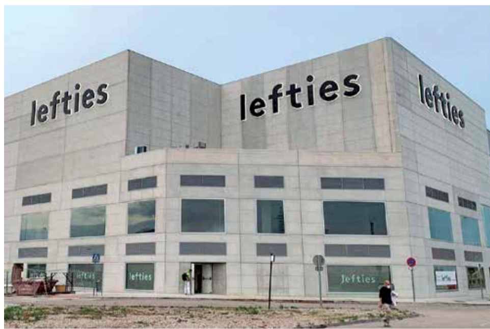
El centro comercial, con el rótulo de Lefties ya colocado en su fachada.

Otro de los hitos relevantes anunciados por el centro comercial es la apertura de Xiaomi, el próximo día 3 de mayo.