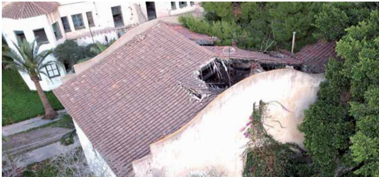
Las cubiertas de los edificios están en un avanzado estado de deterioro

Todas estas cuestiones fueron abordadas en el Consejo Asesor de Patrimonio, que se ha reunido por primera vez en esta legislatura y en el que están representadas las asociaciones de defensa del pa-