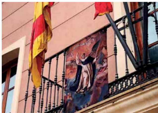
Un dels frontals de balcó amb el quadre.

Ara, els balcons del municipi podran exhibir amb orgull el seu patró, gràcies a la iniciativa presa per l'església, que ha confeccionat frontals amb la pintura de Bonanat que es troba