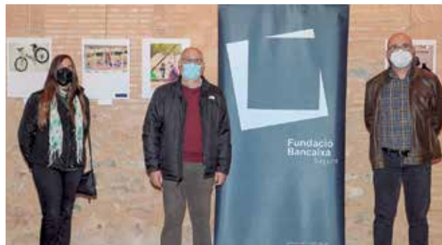
En la sala Michavila (casa Capellà Pallarés), de 17-21 h. / EPDA