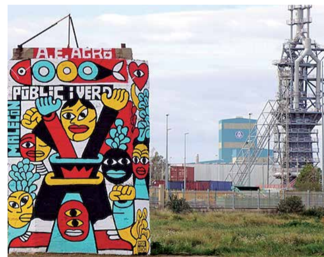
Uno de los actos reivindicativos en el Malecón

La entidad incide en la necesidad de restaurar y proteger ambientalmente esta zona con una superficie apta para una cubierta vegetal de especies autóctonas, que pueda ser garante de dicha protección y que ejerciera de corredor biológico con los ecosistemas dunares costeros.