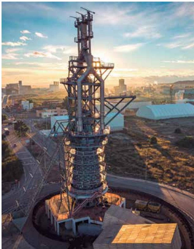
Horno Alto de Port de Sagunt

La implantación de la nueva marca turística, es un proceso "importante porque to-