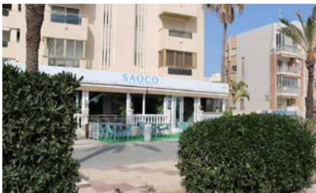
Interior y fachada del restaurante.