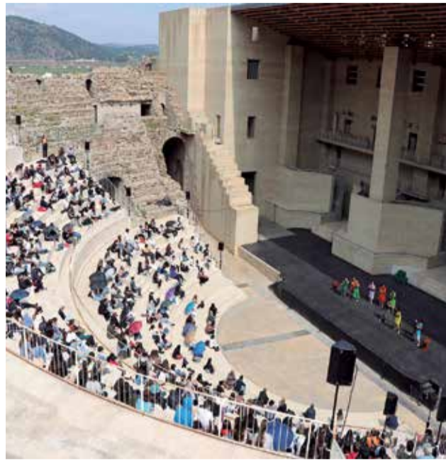
Teatro Romano, este martes.

Cincuenta escuelas e institutos de toda España han participado en los talleres digitales diseñados para promover la cultura clásica entre el alumnado, pasando por Sagunt una media cercana al medio centenar de alumnos a diario, como resalta Tarazona, que hace un balance