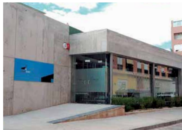
El Casal Jove del Port acogerá este departamento.

"Pretendemos seguir con nuestra apuesta por los jóve-