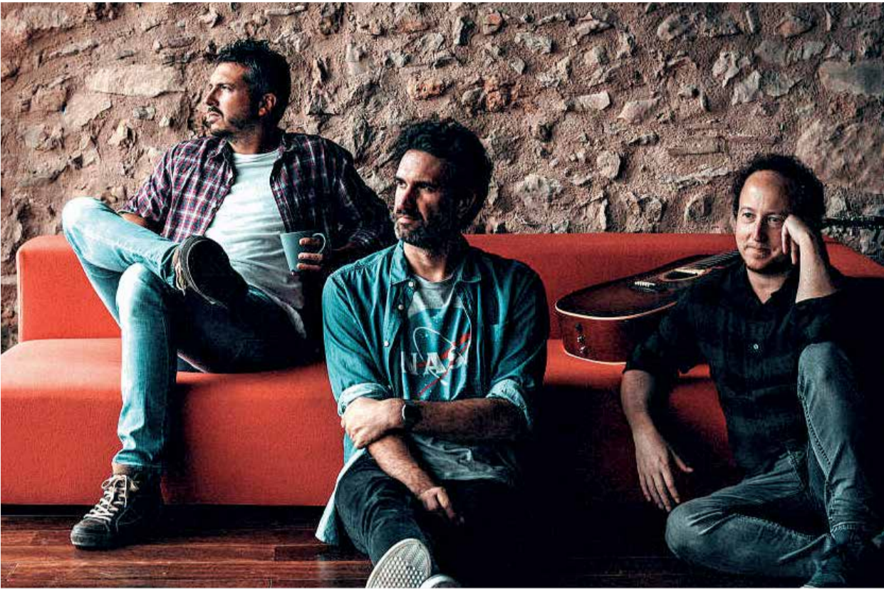
El cantautor valencià i el seu equip.