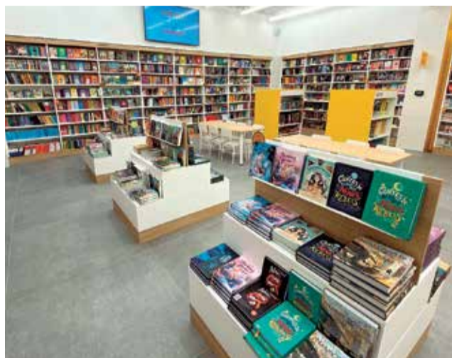
Librería de Abacus Cooperativa.

La festividad internacional que recuerda el fallecimiento de grandes autores como Miguel de Cervantes o Shakespeare, el Día Mundial del Libro y del Derecho de Autor, fue cancelada en 2020 en su fecha habitual y pospuesta a unos meses después. "Pero no fue lo mismo, no vendimos como esperábamos", indican desde una librería. Este año, sin embargo, ha sucedido todo lo contrario: "durante toda la semana se están ven-