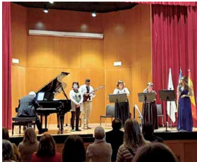
Concierto en el Ateneo Mercantil de València.

El departamento sanitario, por su parte, ha agradecido el gesto realizado por Caveró en redes sociales. El personal sanitario afirma sentirse emocionado por este homenaje, concierto en el que el grupo