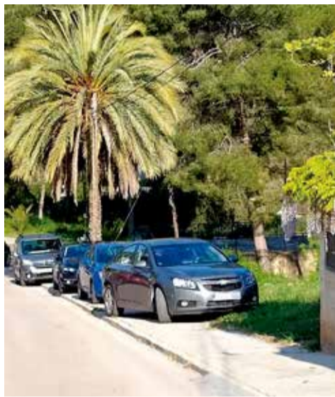
Vehicles estacionats entorpint el pas per les voreres i als habitatges.

Una situació que no és nova, malgrat veure's agreujada amb la popularitat dels espais naturals després del confinament domiciliari i la necessitat d'esplai a l'aire lliure. "L'any passat va vindre el pare d'un amic en cadira de rodes i el vam haver de pujar pel garat-