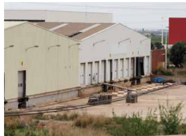
Antiguas instalaciones de Bosal.

La implantación de Aldi se suma a la de otras grandes empresas que han apostado por la capital comarcal para su implantación, entre las que destaca Mercadona, con su bloque logístico en Parc Sagunt con capacidad para