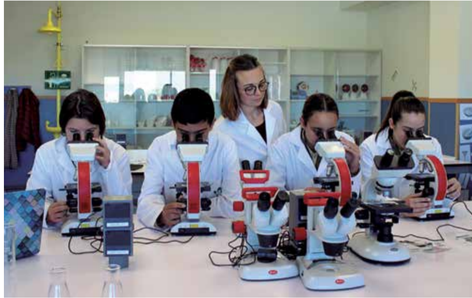
Alumnado en una de las clases impartidas en laboratorio

En su búsqueda por seguir mejorando, el centro vio que los programas de la Organización del Bachillerato Internacional (OBI) eran los adecuados para complementar su proyecto educativo. Tras tres años de intenso trabajo, el centro ha superado un exhaustivo proceso de autorización para poder ofrecer el Programa de la Escuela Primaria (PEP), el Programa de los Años Intermedios (PAI) y próximamente el Programa del Diploma. Con ello, ha conseguido ser el único colegio de Camp de Morvedre con la autorización para impartir estos prestigiosos programas, reconocidos