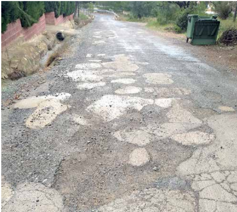
L'asfalt té nombrosos desperfectes.

Hui dia, són molts els habitants del poble als que se'ls interromp enmig d'un passeig per a preguntar-los pel camí que condueix fins al Garbí. "He arribat a comptar dos centenars de cotxes en una hora mentre pintava la porta de casa", apuntava amb contun-