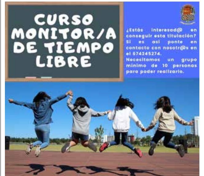
Cartel del curso de monitor de tiempo libre / EPDA