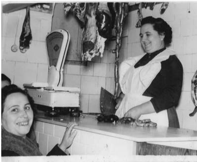
Carnicería Estrella, en Chulilla (La Serranía).

Sin embargo, un lotero de Carmona, pugnó hace unos años por arrebatarle el título honorífico, pero todo quedó en una mera anécdota ya que la rivalidad fue "amistosa" y la de Sevilla "vendía la lotería de números, la precursora de la actual Bonoloto, y no la Lotería Nacional como probamos nosotros", como afirma la familia.