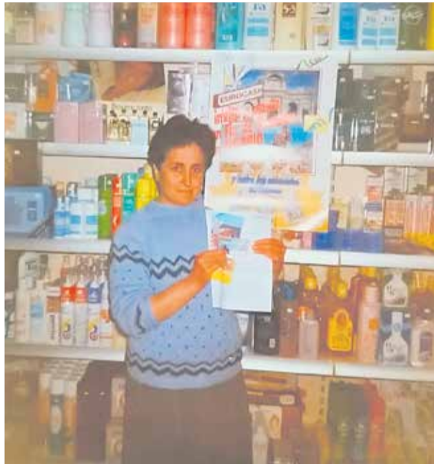
La tienda de María, en Gátova (Camp de Túria).

► L'HORTA SUD. La carnicería Albert de Picassent, un comercio de referencia desde el año 1916.