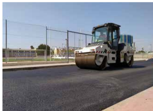
Dalt, Prat de Cabanes. Baix, Carrer Diputació

Aquest camí té un tram d'al voltant de 550 metres, dels quals els 300 primers compten amb una gran deterioració que fan que el vial siga pràcticament intransitable. Els treballs se centraran en