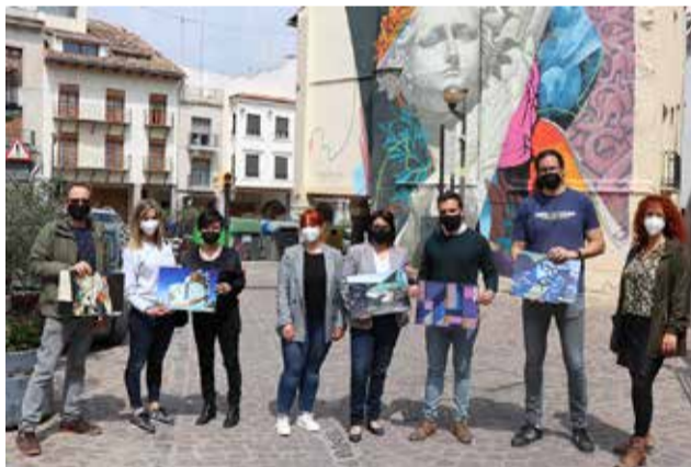
Representantes municipales en la presentación.

Por otra parte, MésQueMurs es un festival de arte urbano, organizado por el departamento de Juventud e Infancia