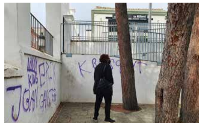
Algunos de los actos vandálicos localizados.