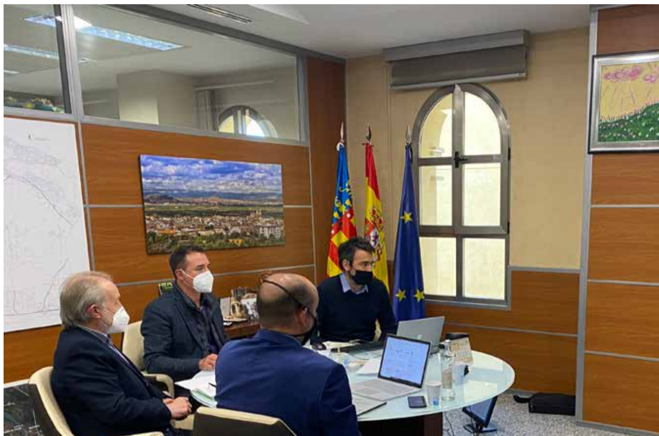
Reunión de los miembros del Consorcio de Valencia Interior / EPDA

También se avaló el inicio de un nuevo expediente de modificación del contrato pa-