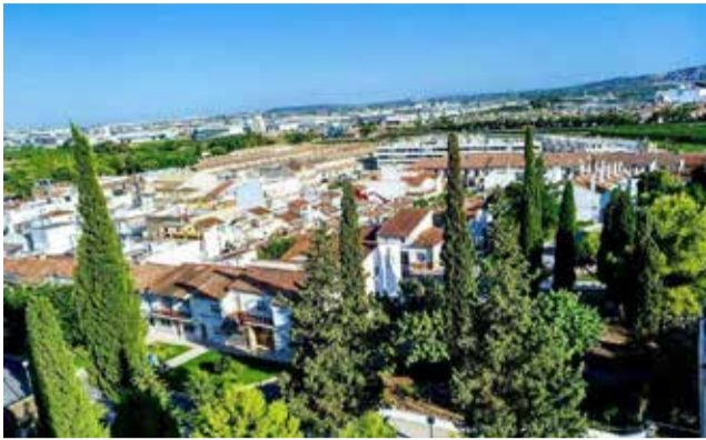
Loriguilla vista desde arriba.