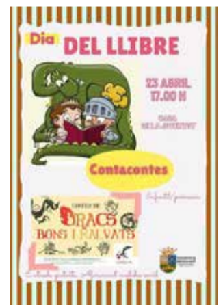
Cartell promocional / EPDA