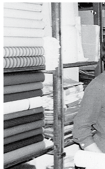
Tejidos Clavijo, en Segorbe (Alto Pa...