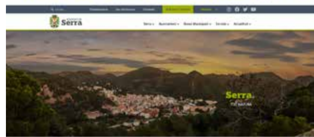
Pantalla de inicio de la nueva web municipal.

El nuevo portal se divide en cinco secciones: Serra, Ayuntamiento, Áreas municipales, Servicios y Actualidad. Dentro de Serra podremos encontrar la información general del municipio. Las asociaciones, comercios y empresas también tienen su lugar. En la sección Ayuntamiento, encontramos información sobre la alcaldía, concejalías, la junta de gobierno y comisiones informativas.