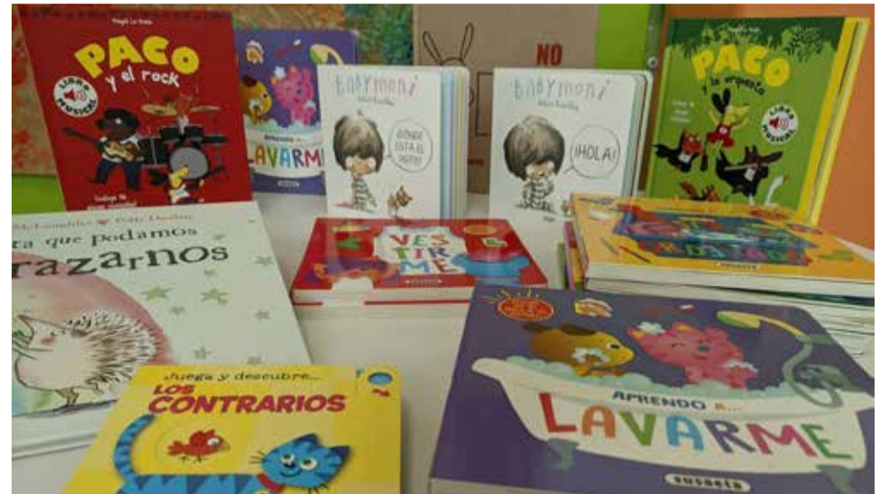
Algunos de los libros repartidos durante la Semana del Libro

Algunos de los títulos de los cuales disponen ahora los centros son: El niño que no quería ser azul, Cuentos