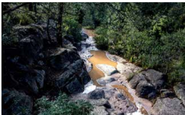
Una de las fotografías nominadas.