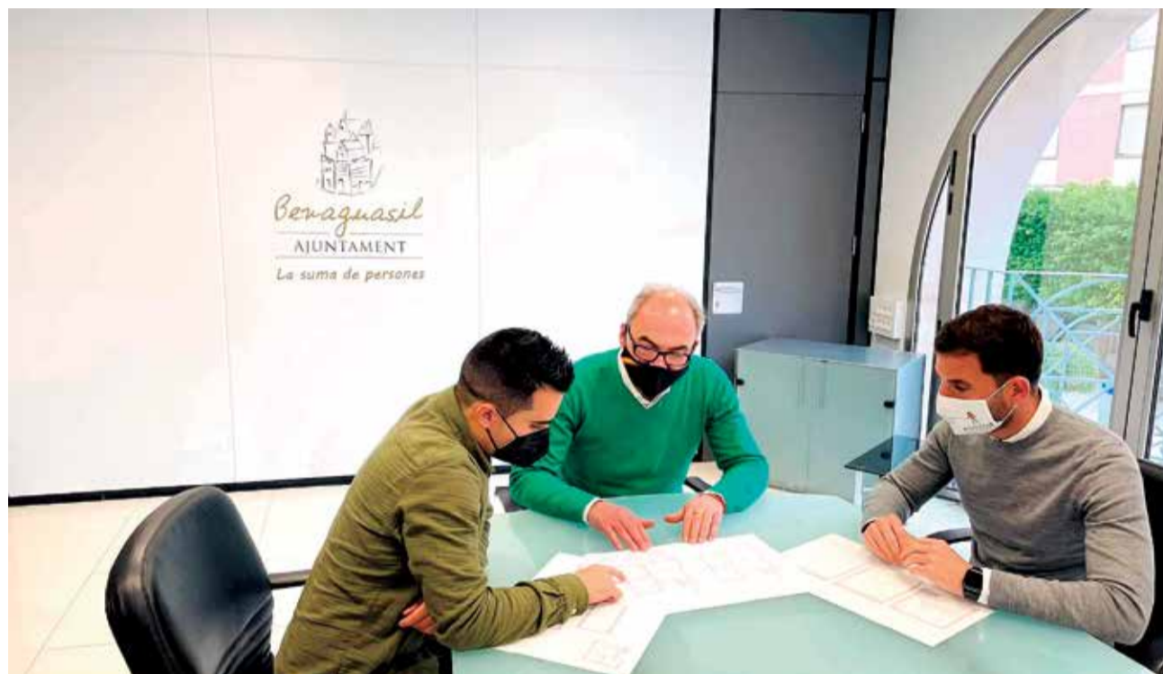
Reunión en Benaguasil para establecer los planes del proyecto

Desde el Ayuntamiento indican que “se va a realizar una rehabilitación completa del local que alberga las sedes de las asociaciones de mujeres Amas de Casa y Consumidores Tyrius y Unió de Dones de Benaguasil para que puedan disfrutar de un lugar en el que reunirse y en el que organizar y coordinar las distintas ac-