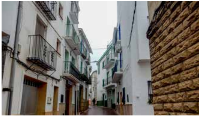
Un carrer de Gátova després de la pluja