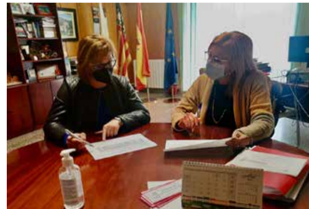
Reunió de las entidades / EPDA

i adolescents. Quant a UPC-CA, en l'àmbit escolar han participat un total de 4.393 alumnes i alumnes i s'han desenvolupat 130 accions que s'aconsegueixen pels 54 programes de Prevenció de Conductes Addictives i les 76 d'activitats preventives. La reunió ha servit també per a marcar les línies de treball que es desenvoluparan al llarg d'enguany 2021. Un programa que té ubicacions a La Pobla de Vallbona, Vilamarxant, Bétera i Ribarroja de Túria.