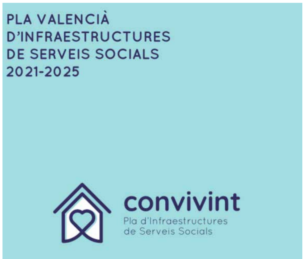
Pla Valencià d'Infraestructures de Serveis Socials / EPDA

Aquesta xarxa de centres aspirem a veure-la complementada amb la posada en marxa d'habitatges tutelats i ampliar els programes