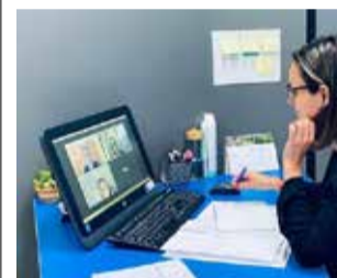
Reunión online / EODA