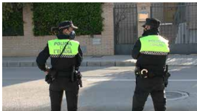
Policía Local de L'Eliana.