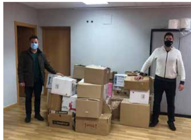
Donaciones de libros a la Biblioteca Solidaria / EPDA

para entender el mundo, Animales de la Granja, La ciudad de vapor y Nuestros Inesperados Hermanos. Por otro lado, desde el área de Cultura y en colaboración con el Club de Lectura, se ha realizado un emotivo video en el cual los integrantes del Club de Lectura narran un fragmento del libro "Loriguilla", de Rafa Jordá i Abel Soler. En concreto, el