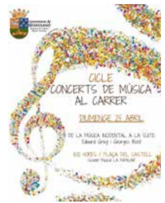
Pie de foto.