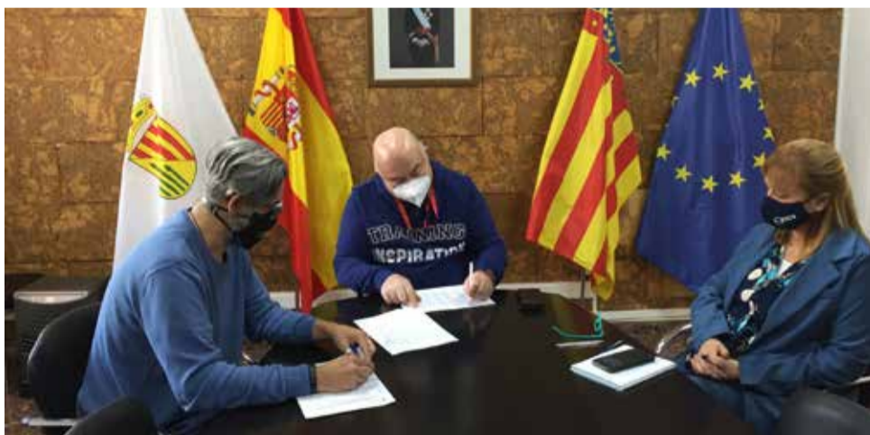
Reunió per a la creació del Pla Colonial. / EPDA