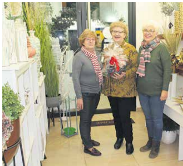
Flores Paquita, en Alzira (La Ribera Alta).