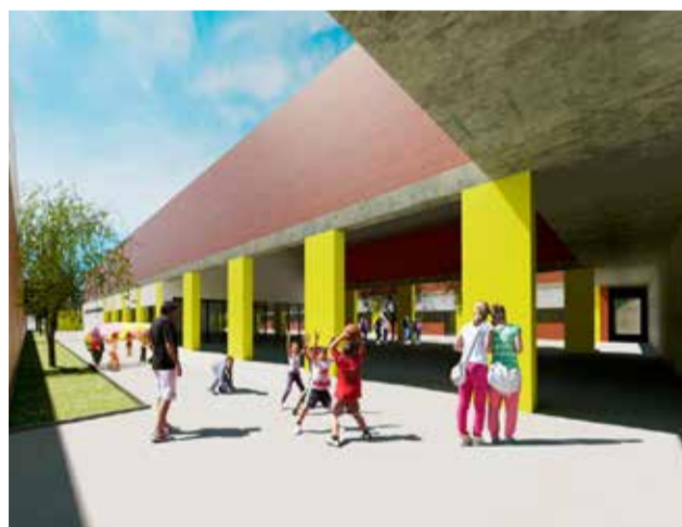
Projecte del nou CEIP de San Antonio / EPDA

A més, el nou CEIP ampliarà les seues vies d'accés gràcies a la nova passarel·la que connectarà Montesano amb el nucli urbà de Sant Antoni.