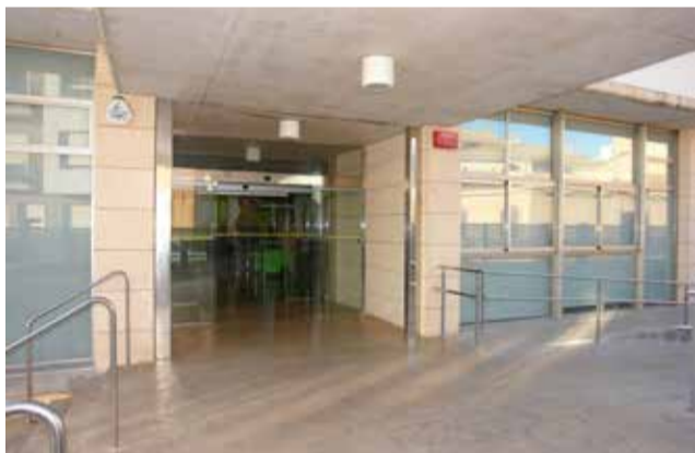
Centre de dia de Benaguasil.