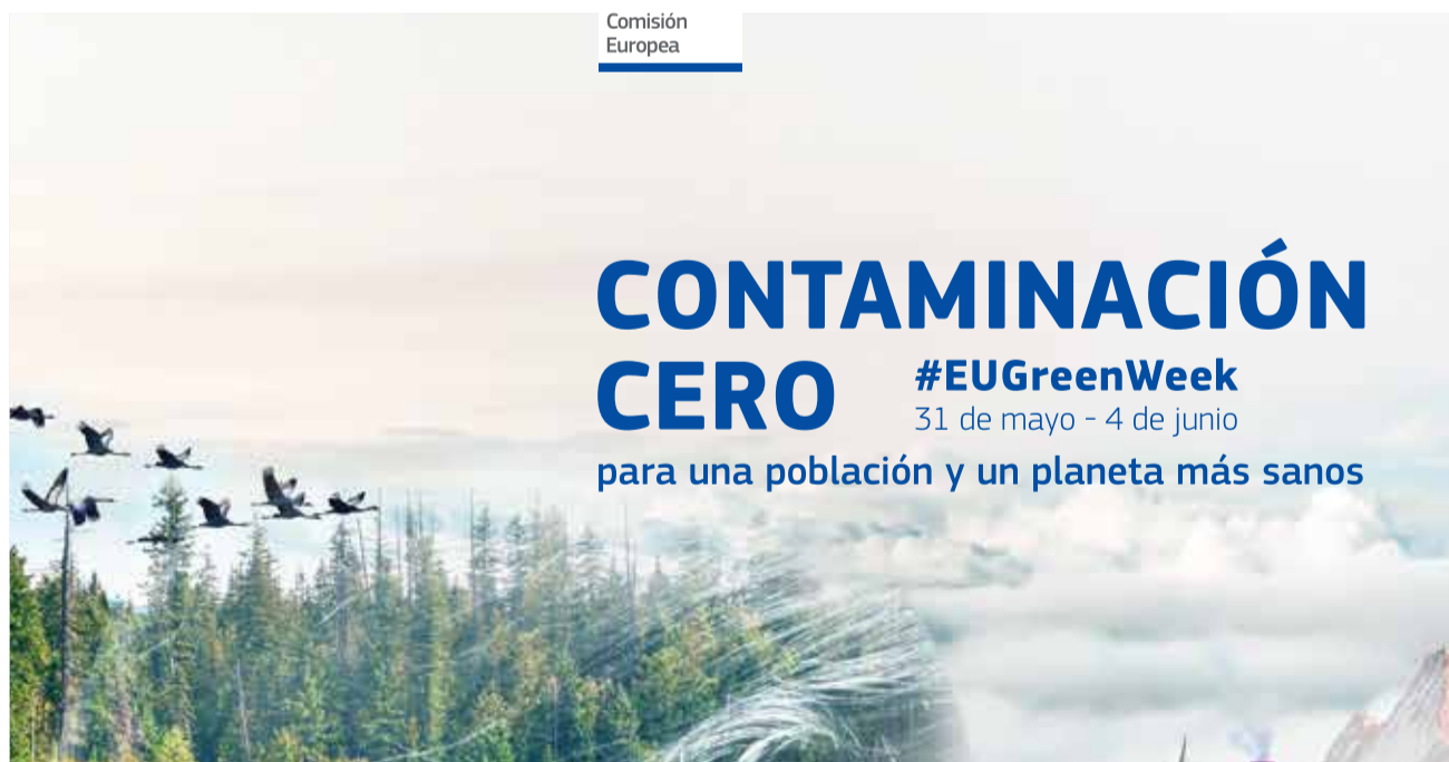
Cartel promocional del evento / EPDA

La Setmana Verda de la Unió Europea (UE) és una oportunitat anual per a debatre i discutir la política mediambiental europea que, organitzada per la Direcció General de Medi Ambient de la Comissió Europea, és clau en el calendari de polítiques ambientals