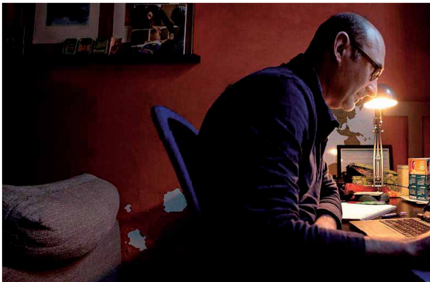
Persona teletrabajando desde casa