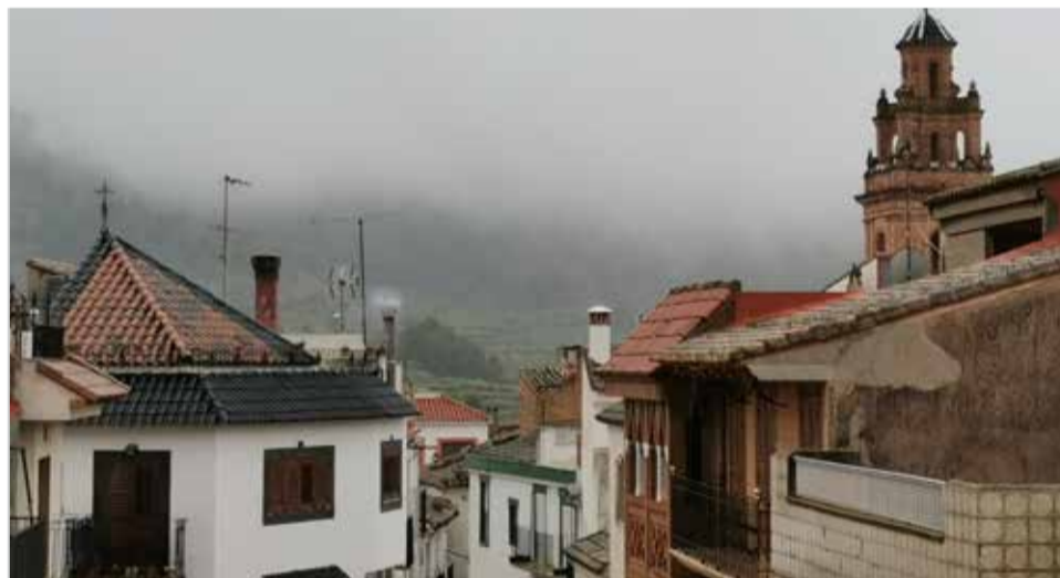
Paisaje del municipio de Gátova.