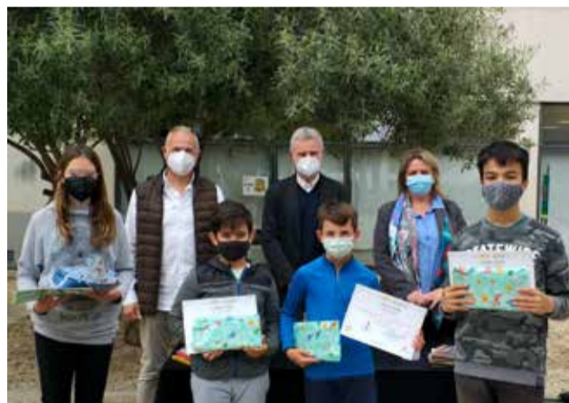
Los vecinos de L'Eliana en la Setmana del Libre

Por su parte, del 19 al 25, se ha celebrado la tradicional Semana del Libro Escolar con actividades de fomento de la lectura en los 7 centros educativos de Primaria de la localidad. Para ello, el Consistorio ha remitido a todos