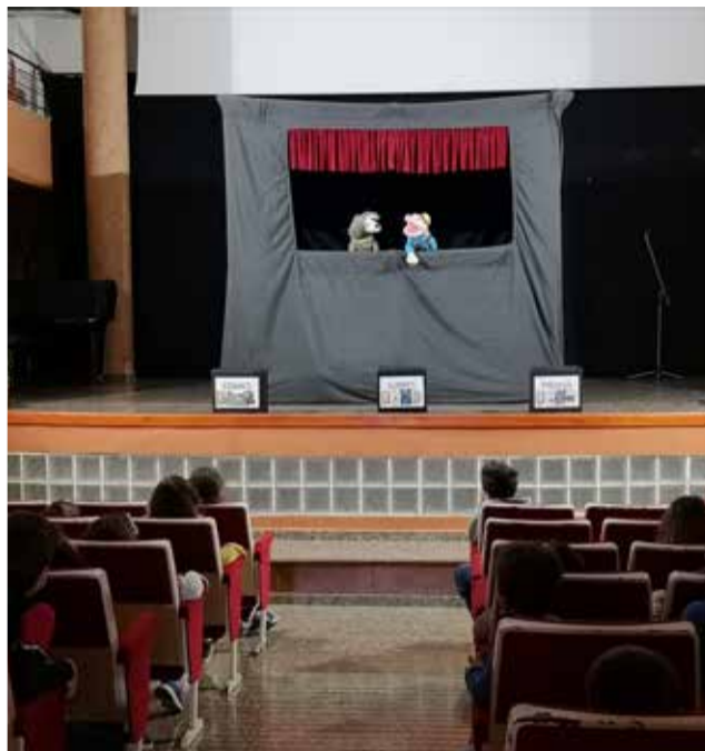
Espectacle de titelles de la Casa de Cultura

Amb estes activitats el municipi ha représ els esdeveniments culturals. "Com cada 23 d'abril, visibilitzem la importància dels llibres en les nostres vides", ha defensat el consistori des de les seues xarxes. Així, un dels especta-