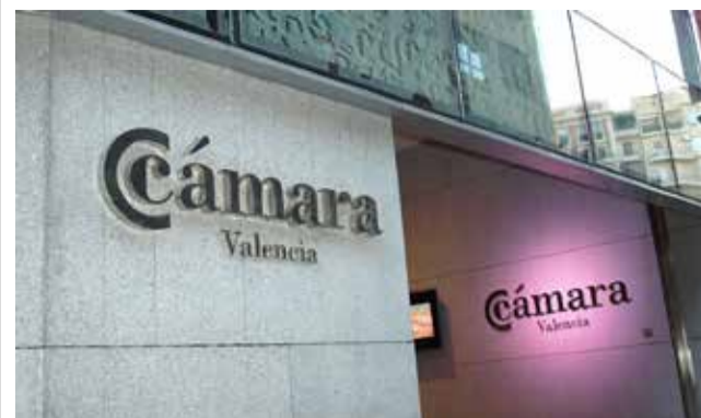
Cámara de comercio / EPDA