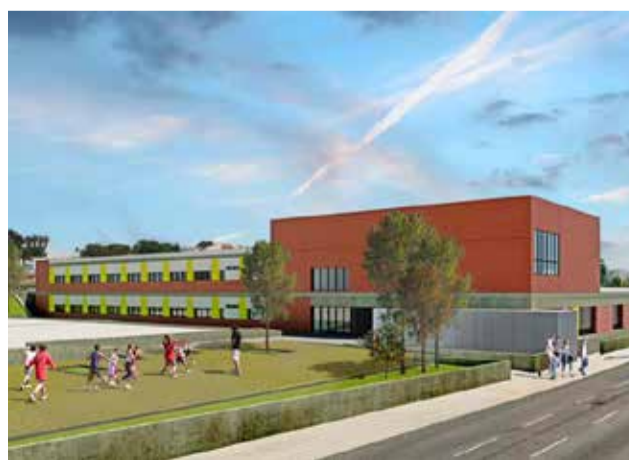
Exteriors del projecte del CEIP / EPDA