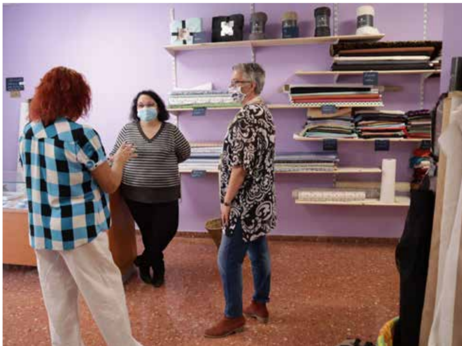
Conversación de coaching con propietarias de un comercio en el Camp de Túria

Así, en los primeros 40 meses en los que se ha desarrollado el Acord Camp de Túria se han atendido a 218 emprendedores/as. A través