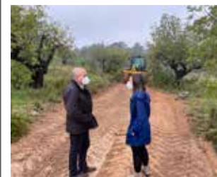
Caminos / EPDA