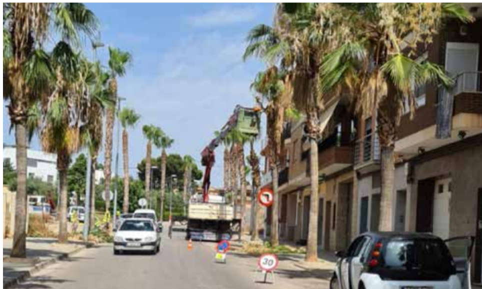
Municipi de Benaguasil / EODA

L'objectiu fonamental del PUAM és facilitar el disseny d'un full de ruta d'actuacions en l'àmbit municipal, participada amb la ciutadania i els