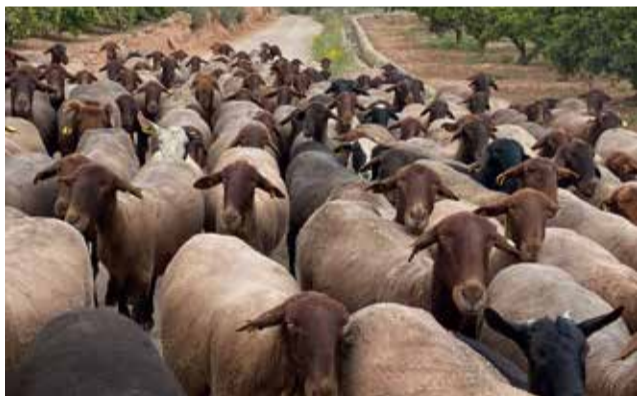
Camí de La Garrofera en Olocau.