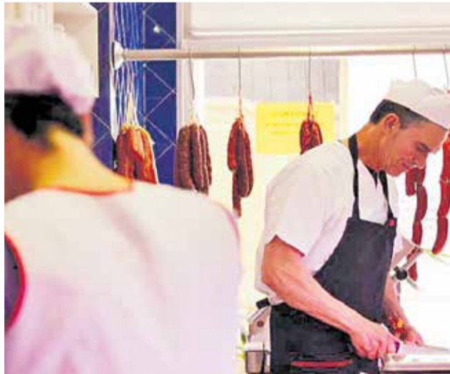
Carnicería Albert, en Piscassent (L'Horta Sud).

berolina AHORRA MÁS DEL 50% EN IMPRESIONES Y 90% DE ENERGÍA