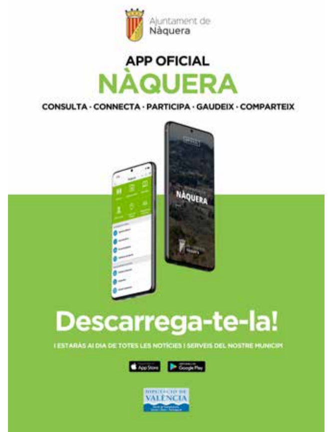
Cartell de promoció de la web.

Aquesta nova web es tracta d'una modernització necessària per a poder posar tots els aspectes importants a l'abast de tots alhora que es mostra una imatge més ac-