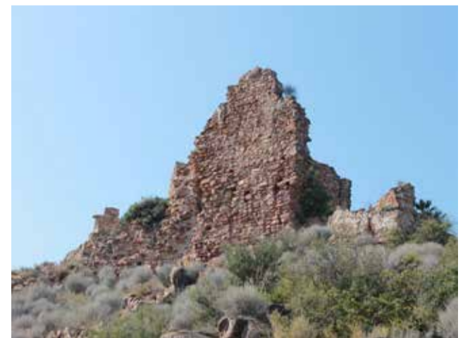
Castillo de Alí Maimó.