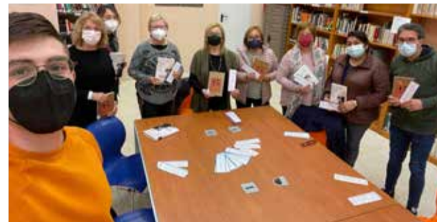
Dalt, el contacontes. Baix, el Club de Lectura / EPDA

per comentar 'Septiembre puede esperar', de Susana Fortes. El consistori anima als veïns del municipi perquè participen en esta iniciativa a través de les xarxes socials.