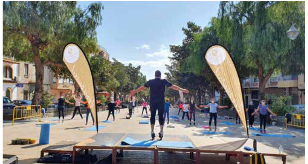
Fent activitats al la plaça.

terial i mans, distància de seguretat i ús de la màscara. Les persones interessades a participar poden formalitzar la inscripció a l'Ajuntament o a través de l'email poliesportiu@benaguasil.com.