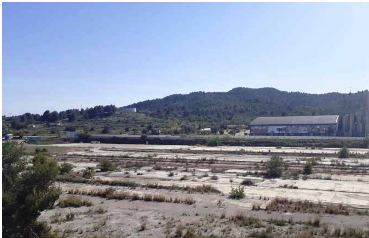
Parcela del PAI anulado en la que se instalará el centro de salud

La compra de los terrenos de Pacadar permitirá, al mismo tiempo, saldar una deuda de la propia empresa promotora del PAI, actualmente