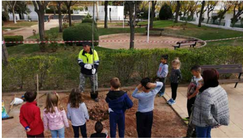
Demostración de la plantación de los ficus en Marines.

“Nos preocupa que nuestras generaciones futuras respeten el entorno, lo cuiden y lo protejan. Por eso, realizamos actividades de este tipo, concienciar a la población es nuestro deber si queremos conservarlo”, ha apuntado Celda.