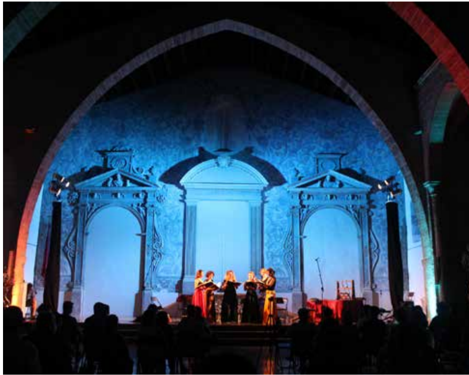
Actuación musical en Lliria

En primer lugar, como Ciudad Creativa de la Música, la localidad conmemorará el Día Mundial de la Música (21 de junio) con la tercera edición del festival de Patrimonio Histórico y Música Antigua eMe: EarlyMusic of Edeta, que también contará con la colaboración de otras ciudades que forman parte de la Red de Ciudades Creativas de la UNESCO