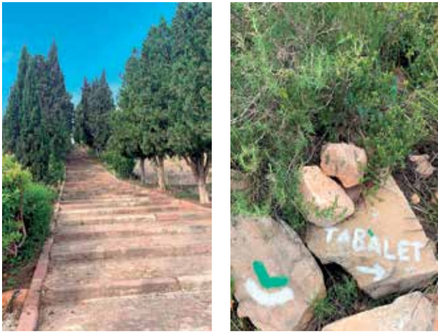
Senders y señalética actuales de Benifairó.