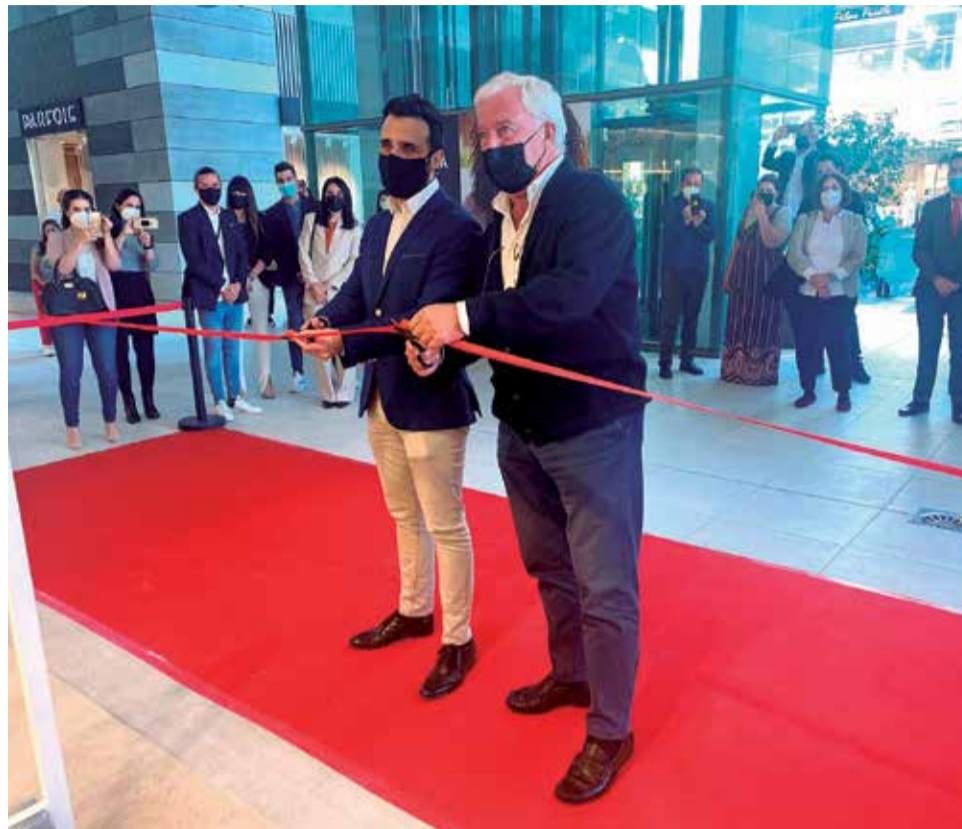
Acto de inauguración de la nueva tienda de Lefties en l'Epicentre

La nueva tienda cuenta con más de 2.000 metros cuadrados. "Se trata de la mayor apertura en 30 años y sin duda la de mayor impacto", tal