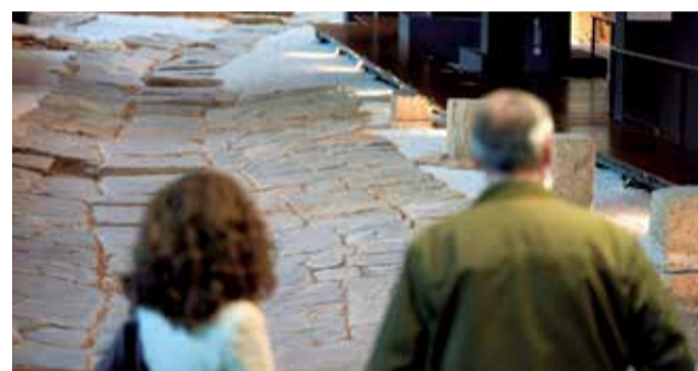
Vía del Pòrtic.

Situado en un edificio gótico del s. XIV, en la misma calle que sube al castillo. Es el lugar idóneo para observar la importante colección de piezas arqueológicas procedentes de excavaciones que se han realizado en la ciudad.