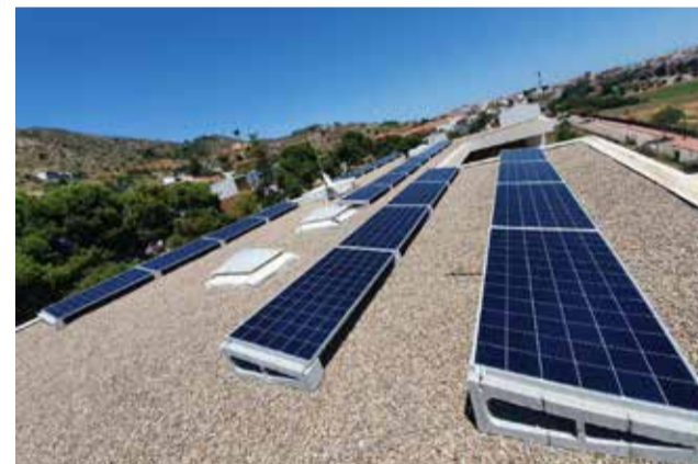
Instalación de placas solares en una vivienda.

Con el objetivo de conseguir para los proyectos las mejores condiciones, llega GNS Energía Sostenible con una apuesta por el desarrollo, fomentando la economía circular y el KMO.