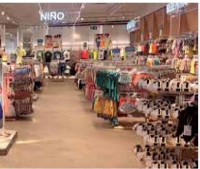
s en l'Epicentre. / EPDA