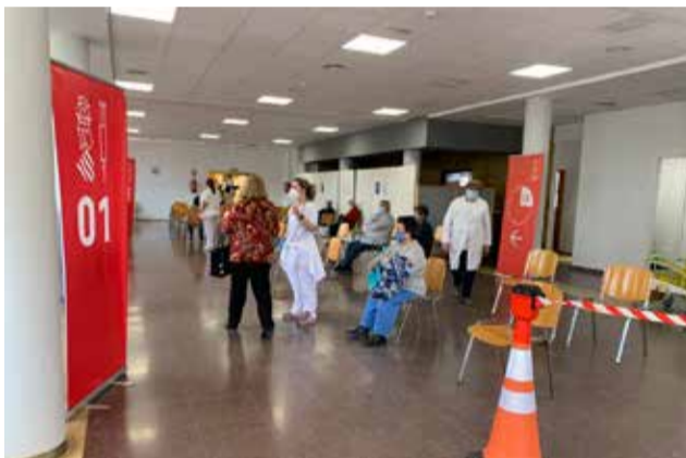
Ciudadanos esperando la vacunación.

en la calle Doctor Fleming, con entrada y salida por la rotonda de la calle Periodista Azzati con la avenida 9 d'Octubre; y otras 30 en el interior de los jardines del Antiguo Sanatorio, con entrada y salida por la rotonda de la calle Periodista Azzati con la avenida de la Hispanidad. Además se ha habilitado también una zona con 10 plazas para personas con movilidad reducida, ubicada delante del propio Centro Cívico, justo junto al área