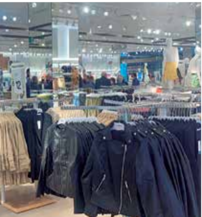
s en l'Epicentre. / EPDA