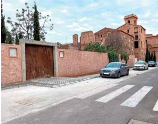
El nuevo aparcamiento de Benifairó.

Las obras han supuesto la urbanización del tramo de calle ubicado a continuación de la Escudería del Palau Vives de Canyamàs, una sala de exposiciones recientemente habilitada por el Ayuntamiento en dicho edificio emblemático del municipio. Las obras han permitido completar la zona peatonal de la