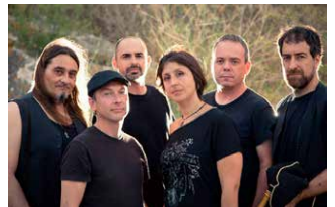
Grupo saguntino Arse Folk.

La actuación es el sábado 8 de mayo a las 19.00 horas de la tarde en el Centro Cultural Mario Monreal de Sagunt.