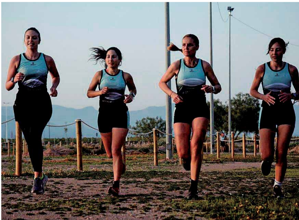
Integrantes en uno de los entrenamientos del club ISD TRIRUN.

► Empezamos 5 amigos. Juntemos a algunos más y comenzamos el club con unos 15 deportistas. Nuestro objetivo era cerrar el año con un número de 100 corredores. En tres meses hemos logrado la mitad del objetivo. Estamos muy sorprendidos con la buena acogida. Además, tenemos una gran presencia femenina. Esto era