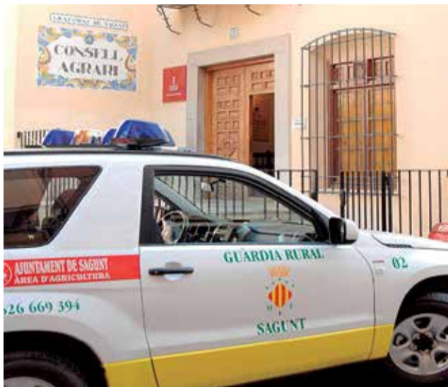
Consell Agrari del Ayuntamiento de Sagunt.

La UI de CCOO del Camp de Morvedre y Alto Palancia considera que cualquier intromisión en la elección de los representantes de los trabajadores debe ser perseguida y condenada, y por eso insta a que los hechos ocurridos en el Consell Agrari se denuncien judicialmente para que se ini-