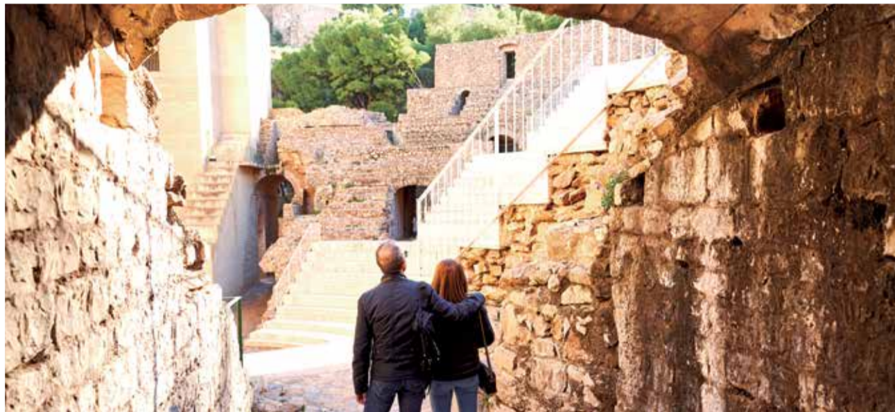
Teatro romano de Sagunt.

¿Sabías que la Vía Verde más larga de España termina