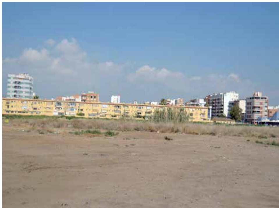
Imatge actual del Malecò de la extinta companyia minera de Sierra Menera.

El manifest, convertit en moció i acord plenari, explica que els terrenys coneguts com a Malecò de Menera, que tenen una superfície de més de 60.000 m 2 , “estan amenaçats per la proposta del Ministeri per a la Transició Ecològica d'efectuar una delimitació i excloure'ls del