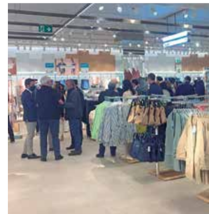
Interior de la nueva tienda de Lefties

histórico, con una tienda repleta y un centro comercial cuyas tiendas se contagiaron del bullicio del estreno de la marca del Grupo Inditex.