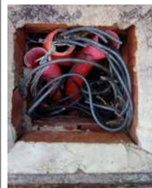
Alumbrado. / EPDA