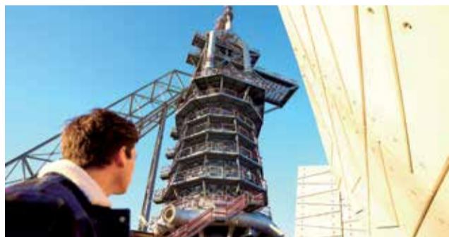
Horno Alto.

en Sagunto? La Vía Verde de Ojos Negros era la vía por la que llegaba el mineral de las minas de Sierra Menera hasta Puerto de Sagunto.