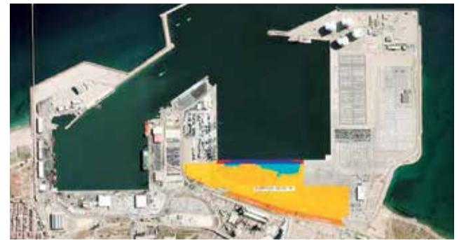
Lugar en el que se ubicará la nueva terminal.