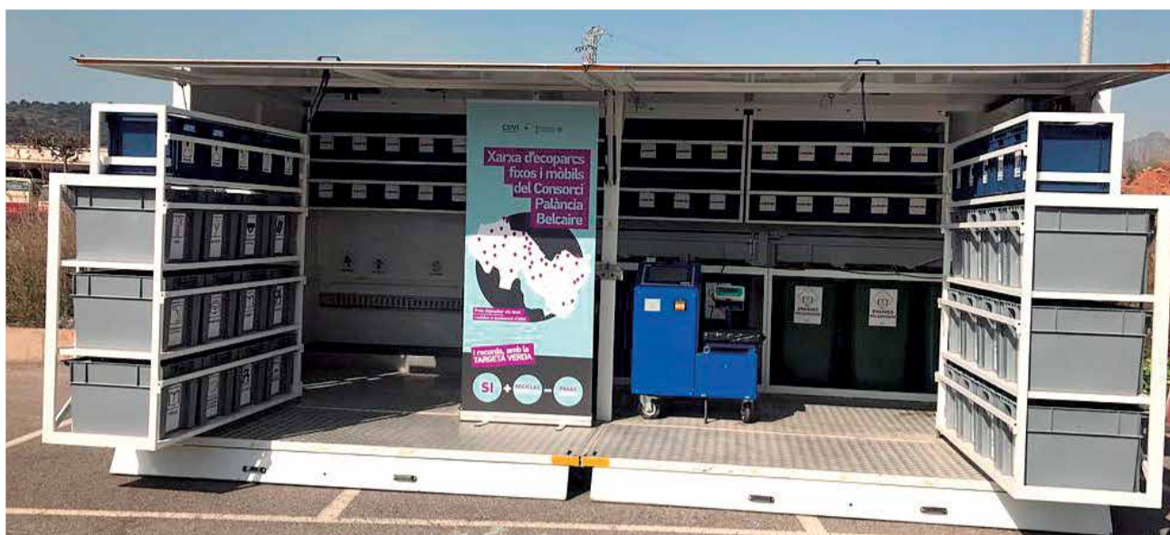
El ecoparque móvil, también en el Camp de Morvedre.

Estas subvenciones, aprobadas por mayoría de la Junta de Gobierno con la abstención del Ayuntamiento de Sagunto, premiarán a los 20.061 usuarios y actividades que durante el 2020 han separado en origen, a través de