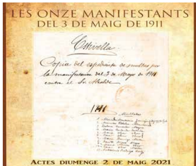
Còpia de l'expedient de multes.