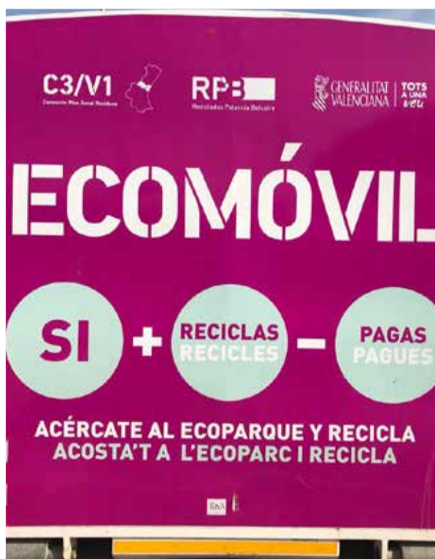
El ecomóvil también en la comarca.

su Tarjeta Verde, los residuos urbanos cuyo destino es la red consorciada e informatizada de ecoparques del área de gestión C3/V1 permitiendo su reutilización, reciclaje y valorización.