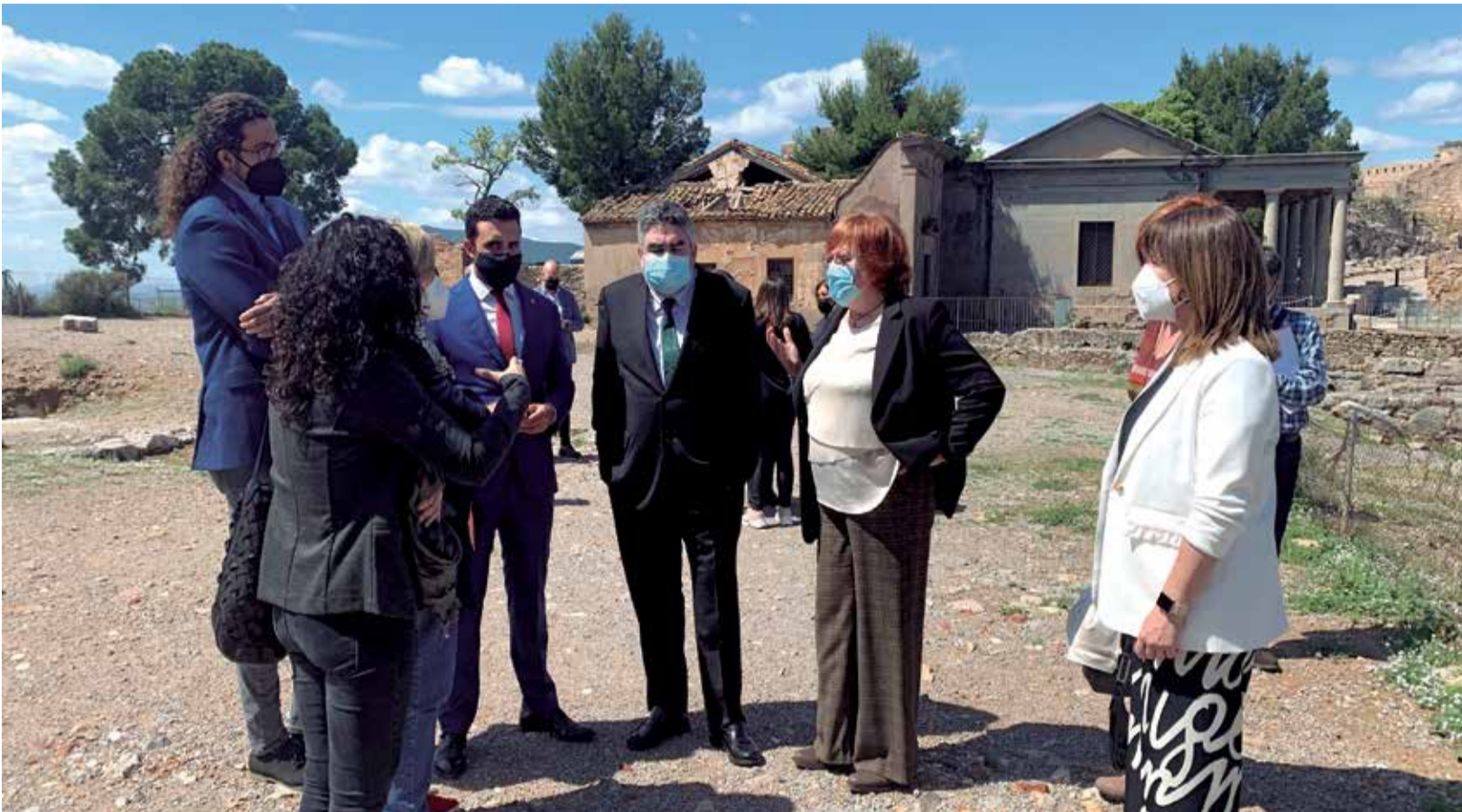
El ministro de Cultura, junto con el alcalde de Sagunt, la delegada del Gobierno y los concejales en su visita al Castillo de Sagunt.

EL CONSISTORIO PREVÉ CONSOLIDAR SU OFERTA CULTURAL CON LA PRESENCIA DE COMPAÑÍAS DE RENOMBRE