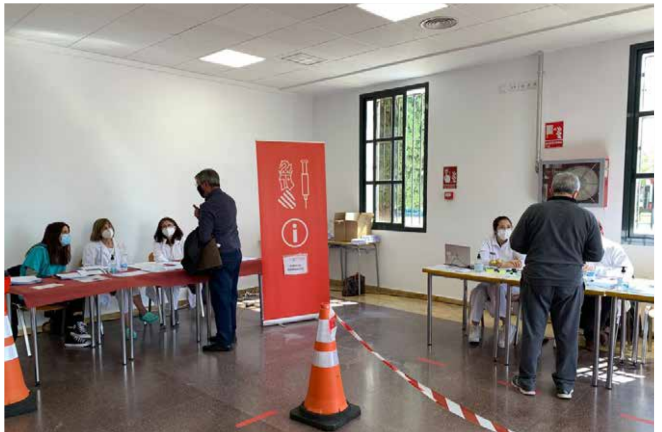
Recepción del Centro Cívico-Antiguo Sanatorio de Altos Hornos del Port de Sagunt.

De la misma manera, desde el departamento de Salud de Sagunt, se destaca que las dos jornadas fueron tranquilas, en las que se respetaron rigurosamente las medidas de distanciamien-