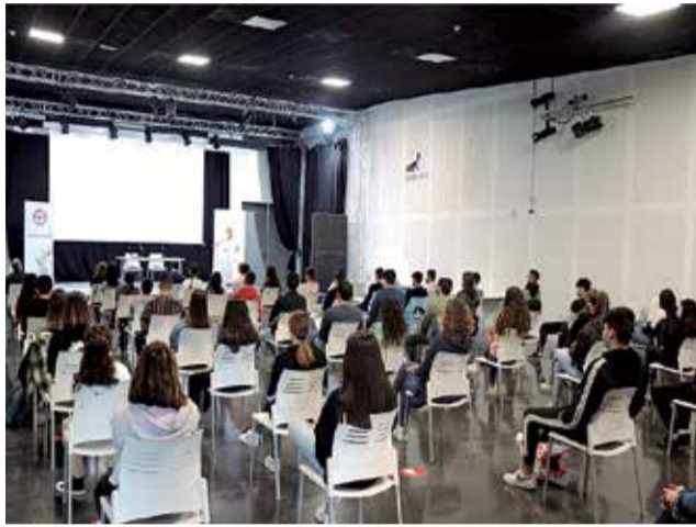
Presentación de la campaña Ruta Urban Art.

El III Ciclo de Jornadas sobre Emprendimiento y Economía Social y Sostenible está organizado por la Universitat de València a través del Aula Empresarial, con financiación de la Diputación de Valencia y la colaboración de Divalterra y del Ayuntamiento de Sagunt, y se estructura en 2021 en 3 grandes bloques temáticos: emprendimiento sostenible, emprendimiento en cooperativa, y