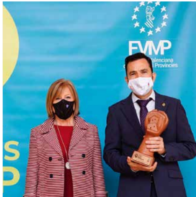
Acte de lliurament dels Premis FVMP / EPDA

El proyecto #CanetPlatjaSegura permitió gestionar durante el verano pasado el servicio de playa, las actividades culturales y deportivas que se ofertaron durante el periodo estival con la máxima garantía de seguridad contra la COVID-19. Acciones como la parcelación de la playa o el desarrollo de una App móvil para la gestión de aforos y reservas en las diferentes actividades desarrolladas durante el verano, han sido valedoras del premio recibido.