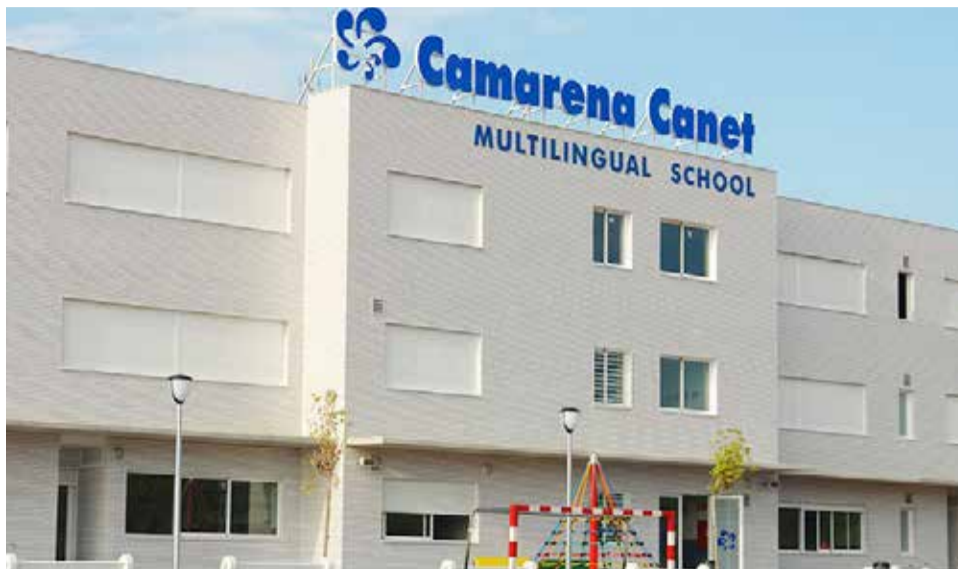
Fachada del colegio de Camarena Canet.

En su búsqueda por seguir mejorando, el centro vio que los programas de la Organización del Bachillerato Internacional (OBI) eran los adecuados para complementar su proyecto educativo. Tras tres años de intenso trabajo, el centro ha superado