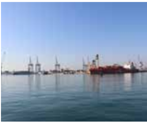
Puerto de Sagunt.