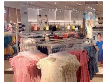
Interior de la nueva tienda de Lefties

Será la segunda tienda en abrir en Valencia, la tercera de toda la Comunitat Valenciana y una de las 150 que Inditex tiene en 6 países del mundo.