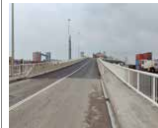
Actuacions al pont / EPDA