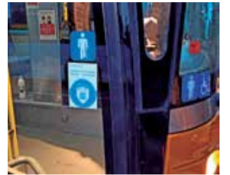
Autobús AVSA / EPDA