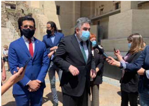
José Manuel Rodríguez y Darío Moreno.

El Ministerio de Cultura y Deporte invertirá este 2021 más de un millón de euros en la rehabilitación y mejora del Castillo de Sagunto para optimizar la experiencia de visitantes y turistas y contribuir a un mejor conocimiento de este monumento nacional. El ministro de Cultura y Deporte, José Manuel Rodríguez, visitó Sagunto el jueves 29 de abril para conocer de primera mano el Patrimonio Histórico e Industrial del municipio, así como los puntos del Castillo en los que se invertirán los fondos