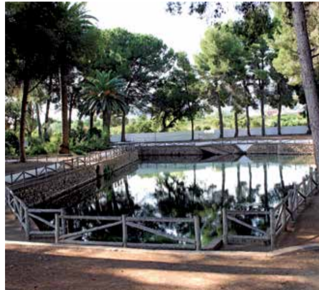
La Font de Quart, el brollador d'aigua dolça.

A l'eixida oest, es troba l'Ermida del Crist envoltada d'una zona arbrada. El lloc mereix una visita, perquè es tracta d'una veritable església en miniatura que data del segle XVIII. Al costat d'aquesta ermita es troba el col·legi CRA Benavites-Quart de les Valls el