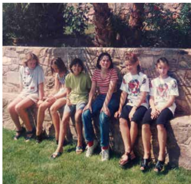
Niñas de Chernóbil acogidas en Algar.