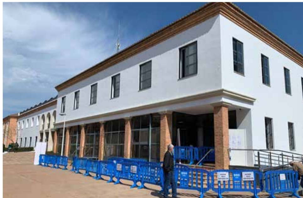
Lugar de espera del Centro Cívico del Port de Sagunt.

to social y, además, se contó "con muy buena colaboración ciudadana".