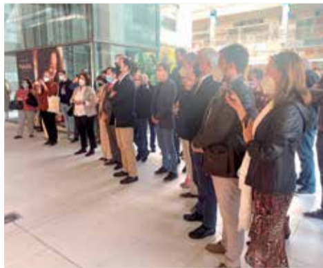
Inauguración de Lefties.