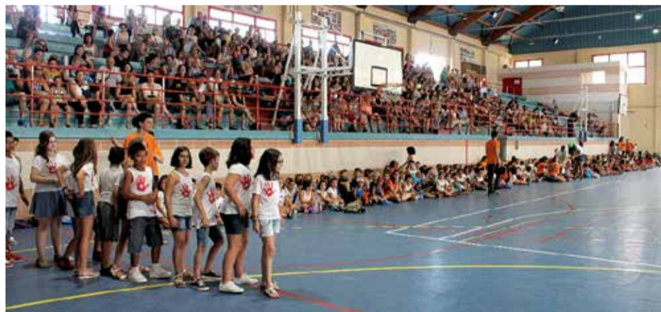
Escola d'Estiu passada a Sueca.