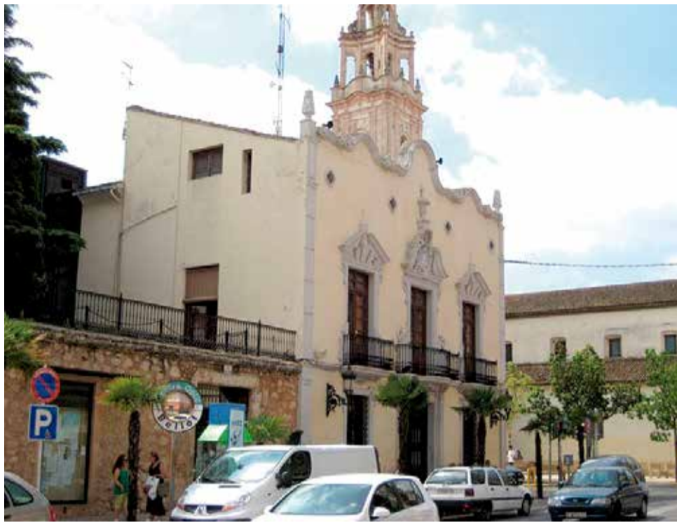
Ayuntamiento Alginet. / EPDA

Fuentes de la Delegación del Gobierno en la Comunitat Valenciana informan por su lado de que han solicitado a la Guardia Civil un informe sobre los hechos para saber qué ocurrió y por qué se puso en marcha ese dispositivo de seguridad. Tras