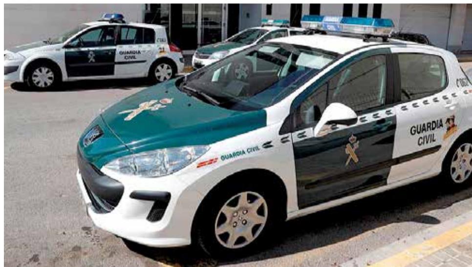
Foto archivo de una patrulla de la Guardia Civil.

Las diligencias pasaron a disposición del Juzgado de Guardia de Picassent.