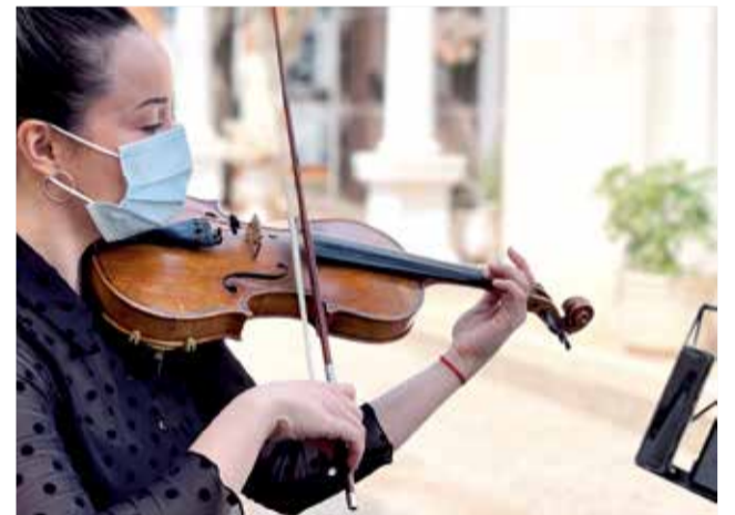
Acte homenatge a Alzira.