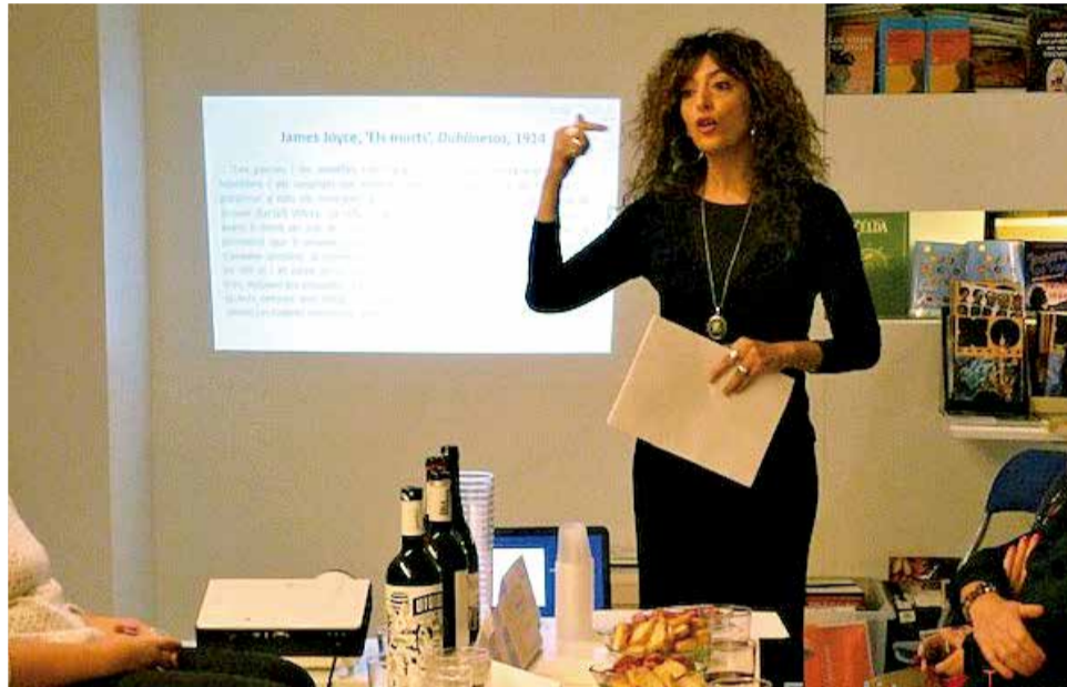
VI Edició del Festival de Cultura de Montserrat.