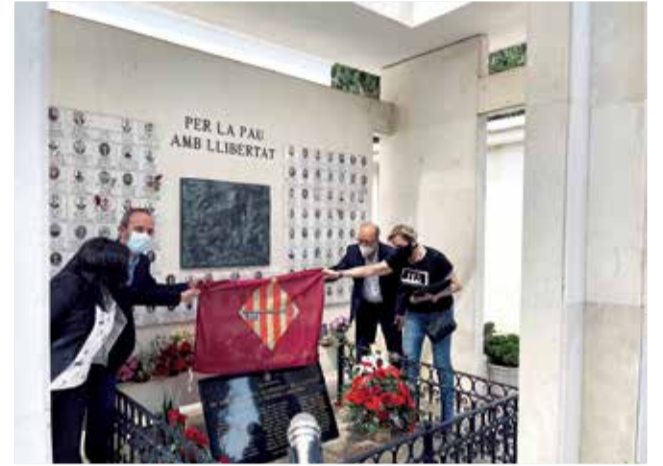
Acte homenatge a Alzira. / EPDA