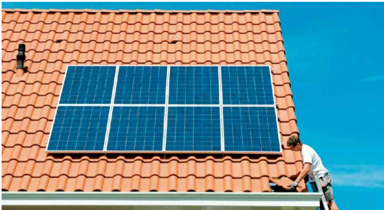
Plaques fotovoltaïques.