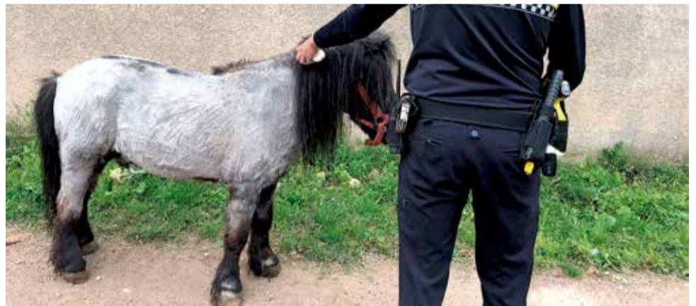
Caballo rescatado.