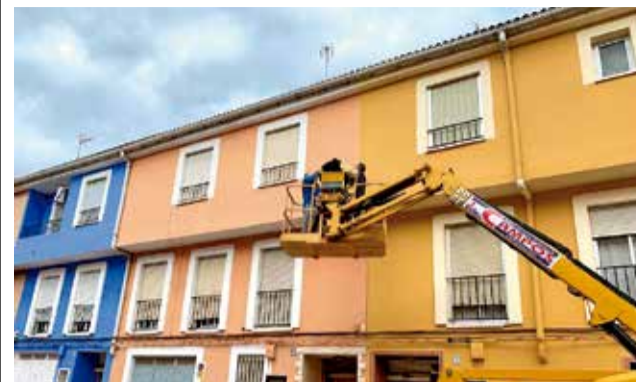
Façana finca Rafelguaraf.