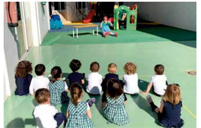
Alumnado Benifaió.

La alcaldesa señala que en este curso escolar “se ha ofrecido por segunda vez esta campaña ya que debido a la pandemia la campaña teatral de mayo del 2020 paso a realizarse en el mes de octubre y de nuevo este año ahora en mayo hemos vuelto a programar la oferta cultural”.