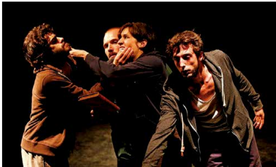
VI Edició del Festival de Cultura de Montserrat.

ca. És una revisió del segon muntatge de la companyia A Tiro Hecho, Ladran, luego cabalgamos, recuperada per un grup de joves que ens aporta la seua visió de la història i de l'ave-