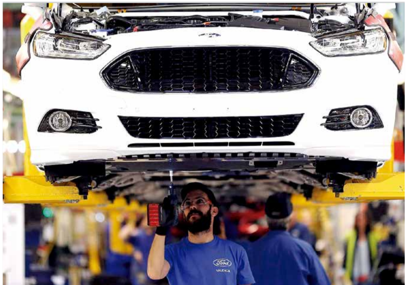
Fábrica Ford de Almussafes.

para motores, y los viernes 21 y 28 parará motores; en junio serán ambas plantas las que se paralicen la semana del 7 al 11, y los días 18 y 25 solo motores; y ya para julio se han programado paradas conjuntas los días 2, 9, 14 y 15, y el 19 solo en motores.