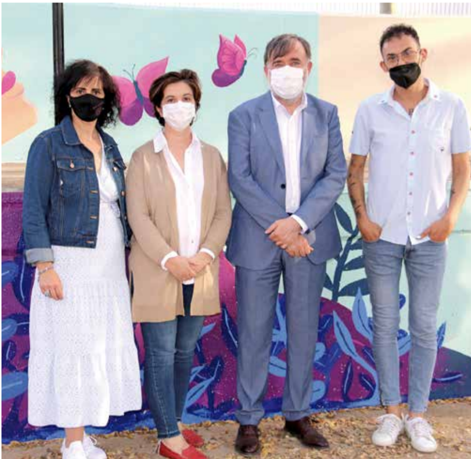
Presentació mural a l'Alcúdia.

sibles, junt amb algunes de les persones associades, acompanyaren l'alcalde de l'Alcúdia i altres representants del consistori a fer una visita al mural, pintat per l'artista local Pili Ortega, que va rebre la visita i va explicar la simbologia que ha volgut plasmar en el mural, amb la vista posada en un futur esperançador per a totes les persones que estan afectades per esta dolença.