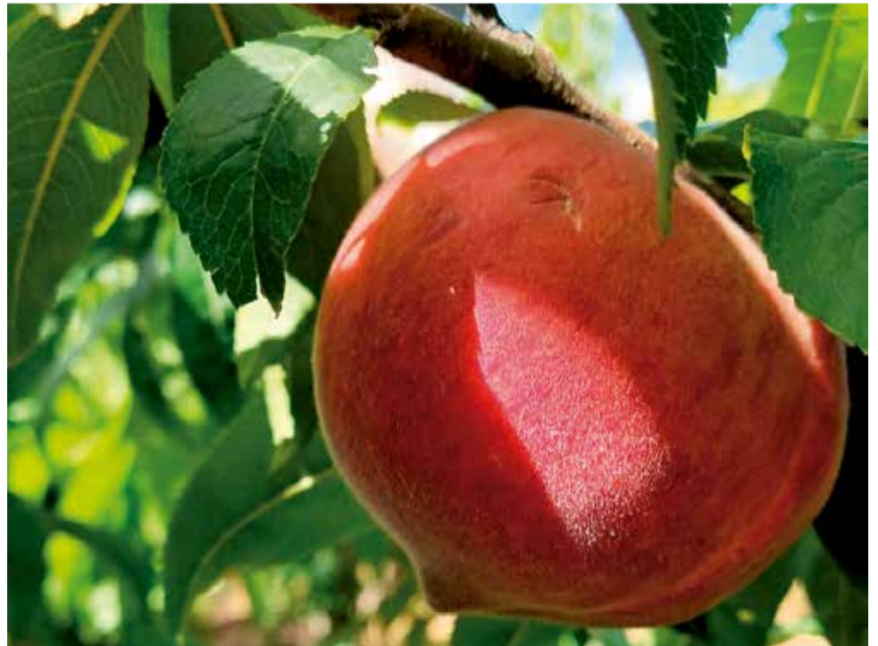
Gràfica del registre d'entrada de Carlet .

Por ello, la organización solicita a las administraciones medidas fiscales y ayudas directas a los productores damnificados: a los ayuntamientos les exige una bonificación del IBI Rústico mientras que a la Generalitat Valenciana y al Gobierno les reclama exenciones a las cuotas de seguridad social y créditos bonificados.