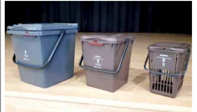
Poals de recollida.