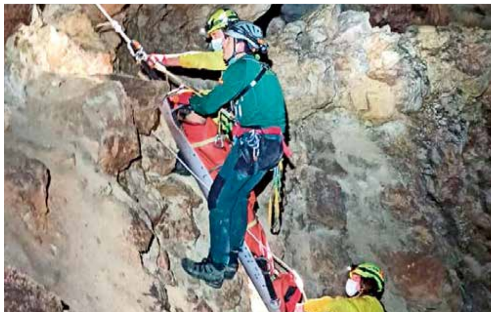
Momento rescate senderista.

Gracias a la profesionalidad y determinación que demostraron los participantes en esta actuación, lograron auxiliar al desaparecido evitando así un mal mayor.