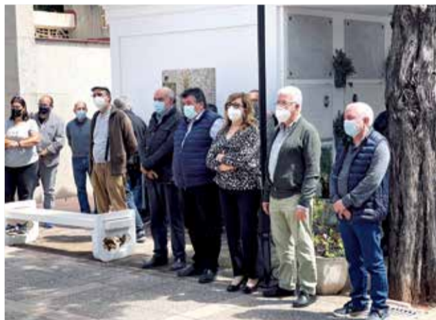
Acte homenatge a Alzira.