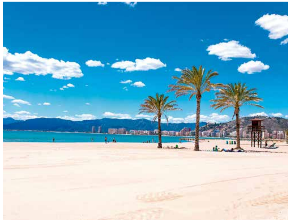
Platja Los Olivos de Cullera. / EPDA

A més, en juny també es posarà actiu el bany assistit en les seues platges accessibles.