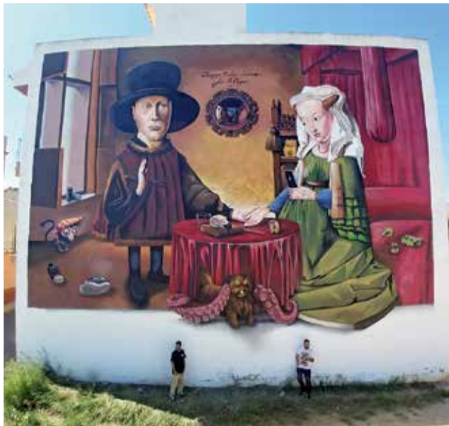
Arte Urbano en Alberic.