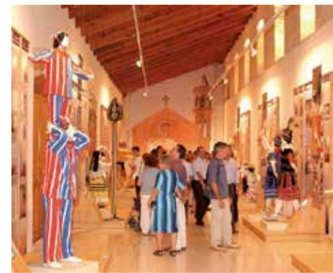
Museo de Algemesí.