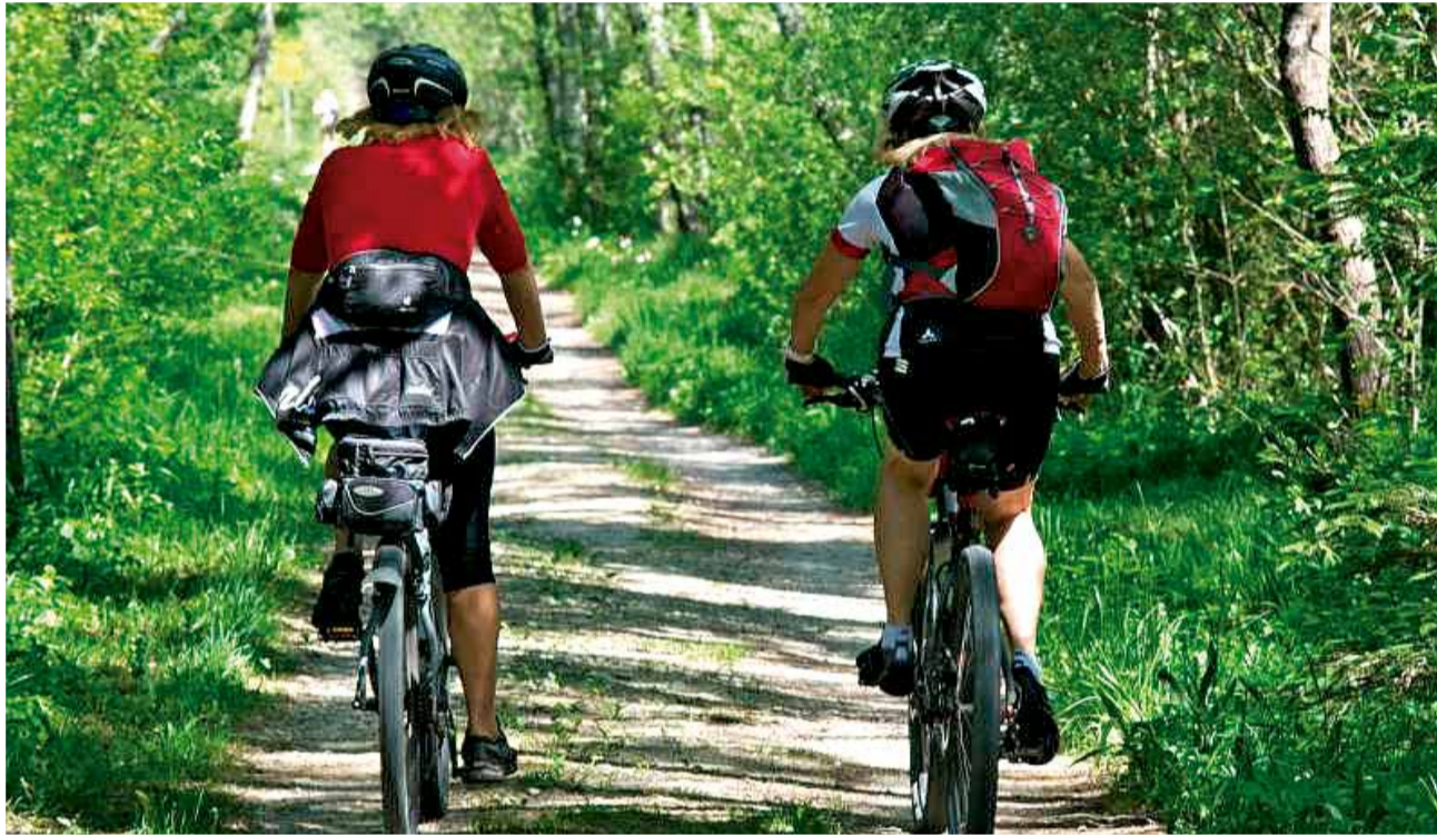
Imagen de archivo de dos ciclistas circulando por un camino.

Según han informado en semanas pasadas fuentes del Centro de Información y Coordinación de Urgencias (CICU), el suceso ocurrió sobre las 11:45 horas del domingo 25 de abril cuando el hombre circulaba en bicicleta por la carretera CV-505, que une Algemesí con Albalat de la Ribera, a la altura de la Finca de Sinyent, en el término municipal de la localidad de Polinyà de Xúquer.