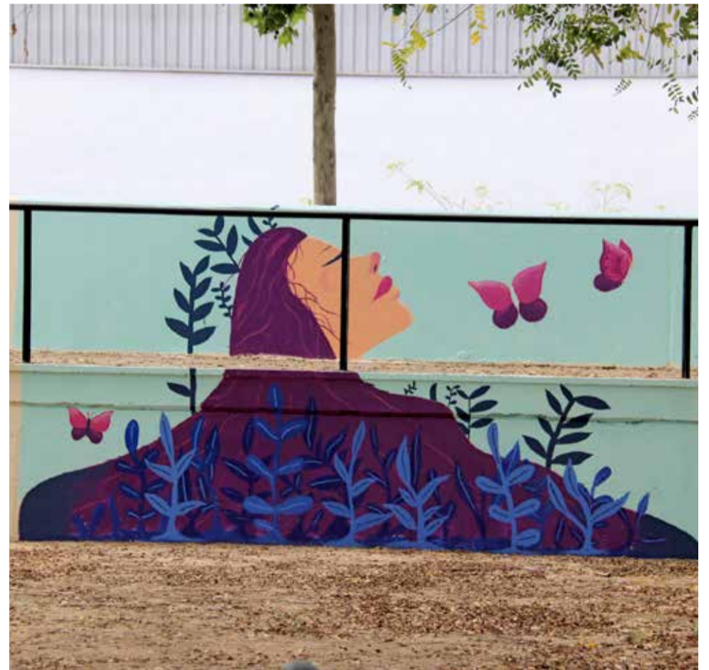
Mural. / EPDA