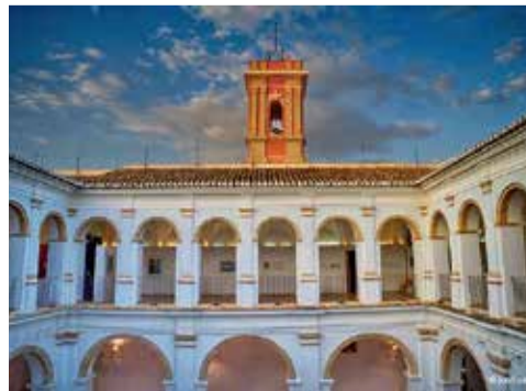
Museo de Algemesí.