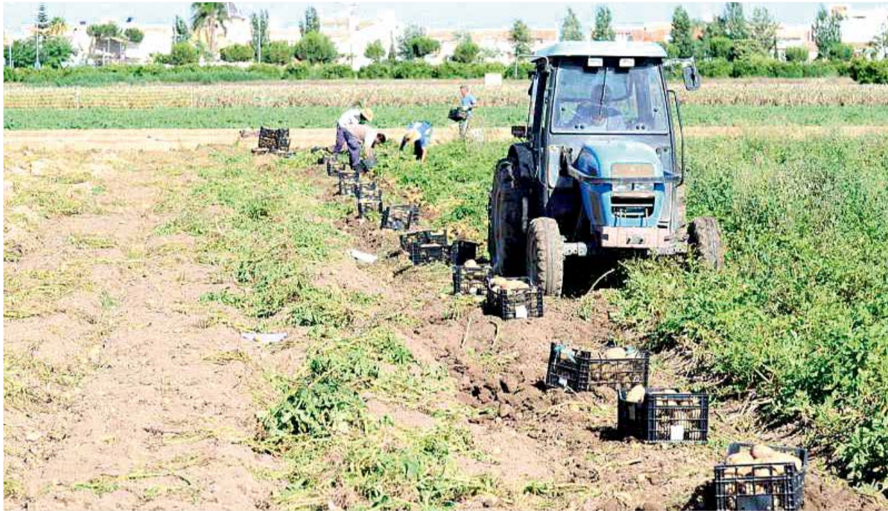
Foto archivo campo agrícola.

El Servicio Público de Empleo Estatal subvencionará la mano de obra, pero en el caso de los materiales, herramientas, los