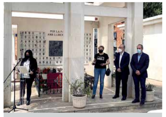
Acte homenatge a Alzira.