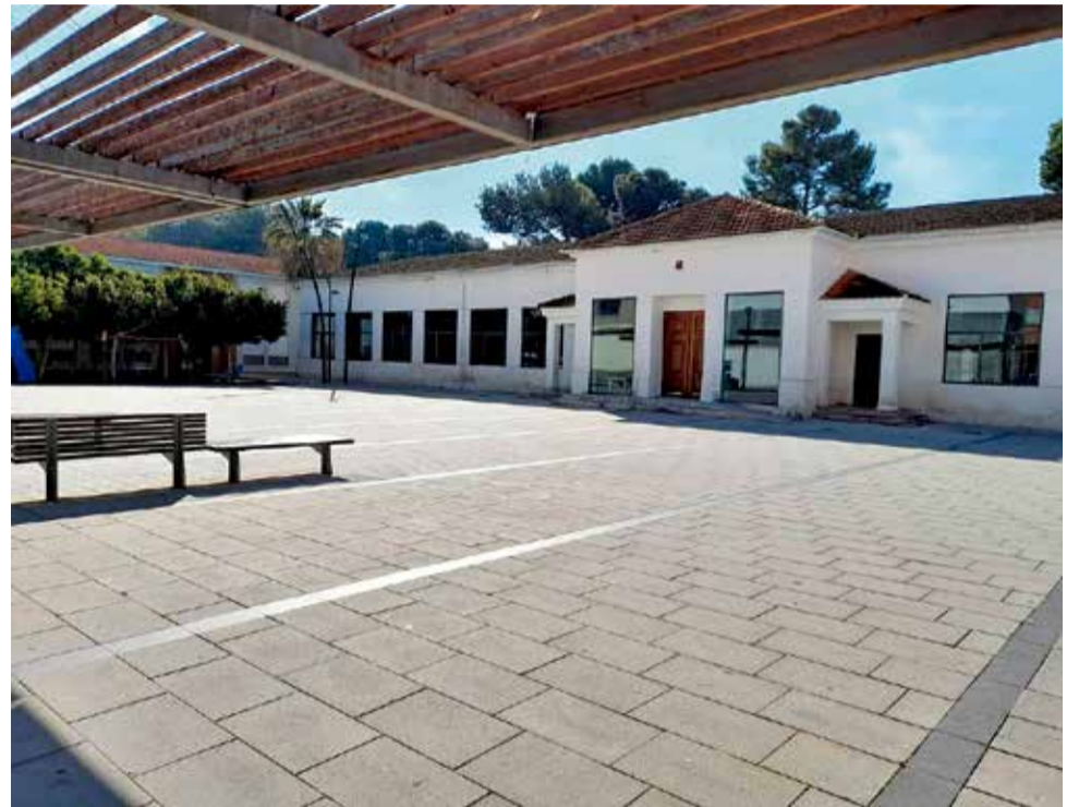
Guadassuar.