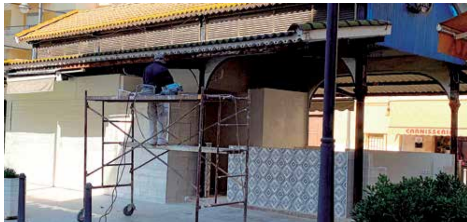
Rehabilitación Mercado Municipal.