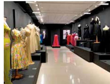
Museo de Algemesí.