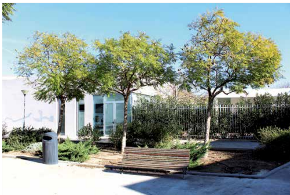
Residència de persones majors d'Almussafes.