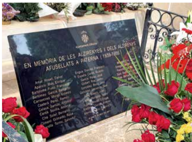
Acte homenatge a Alzira.