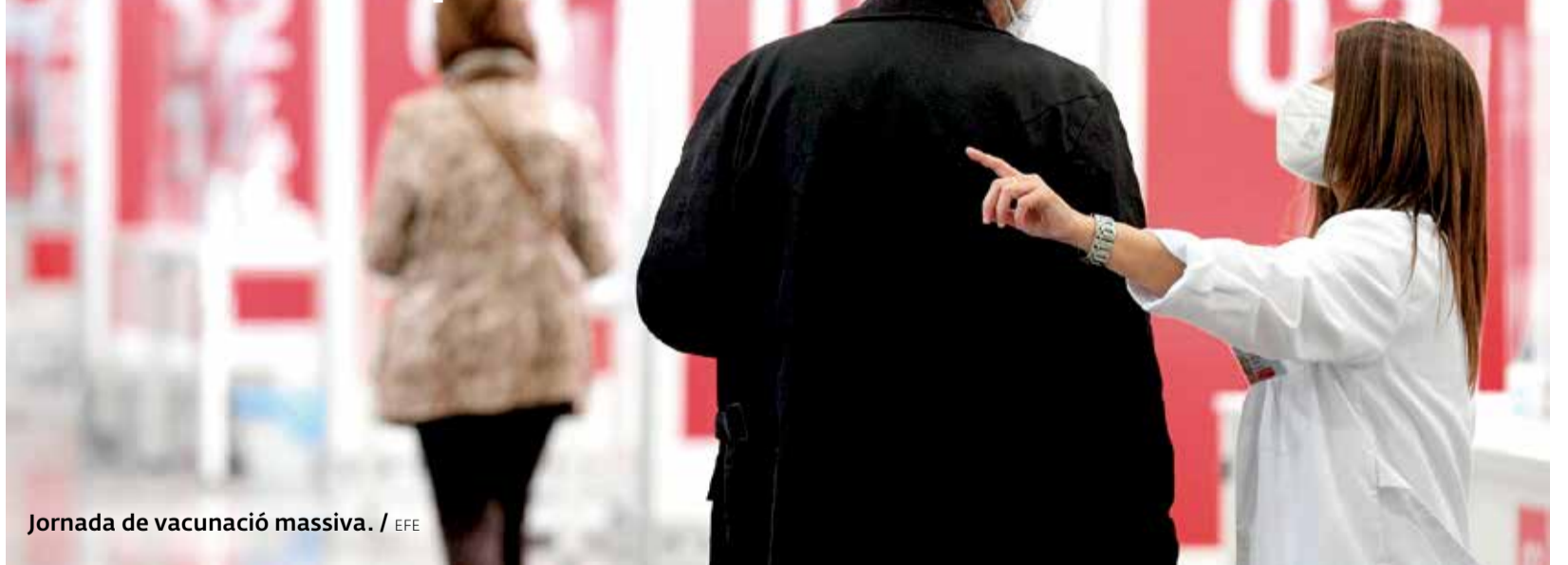
Jornada de vacunació massiva.