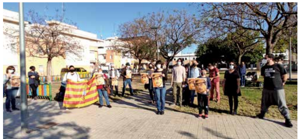
Homenatge a l'Alcúdia.

Un homenatge senzill, a un gran escriptor, que va aglutinar les "Rondalles Valencianes" basades en la recopilació de les narracions presents a la tradició oral valenciana i que tenen un doble valor literari i patrimonial ja que ha permès conservar les rondalles i projectar-les més enllà de les nostres fronteres.