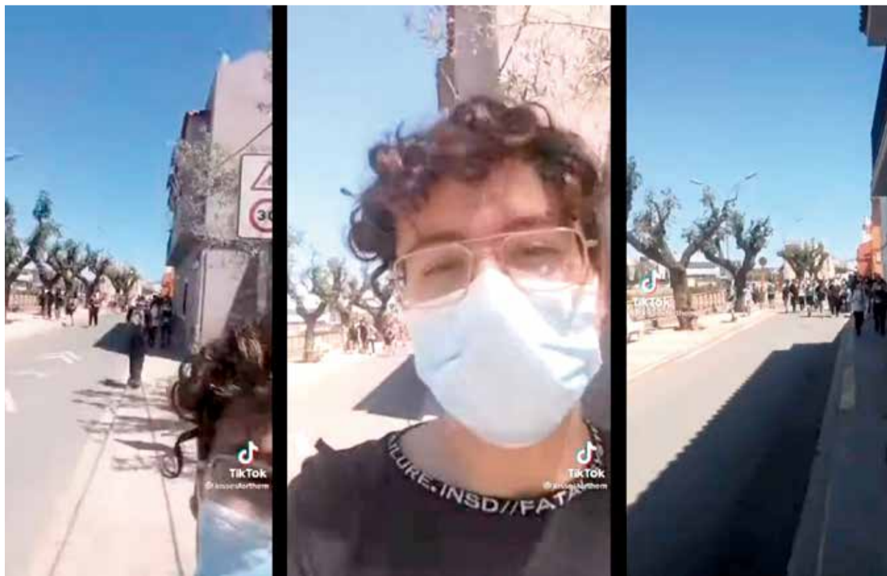
Capturas del vídeo de su perfil de Tik Tok.

En el vídeo en cuestión que no dura más de 36 segundos se le puede escuchar "todos esos que hay por detrás están gritándome maricón desde que he salido de clase. Todos, todos, todos llamándome maricón. Luego dicen que no hay homofobia. El vídeo se ha viralizado y ha encontrado apoyo en todas las personas que lo compartieron. Así pues, el ayuntamiento de la localidad de la Ribera,