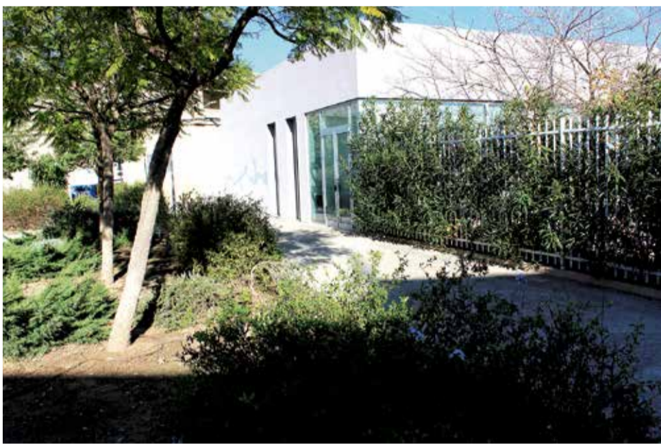
Residència de persones majors d'Almussafes.

■ L'EMPRESA CONCESSIONÀRIA DEL SERVEI INVERTIRÀ 1.700.000 EUROS EN LA INTERVENCIÓ QUE COMENÇA ESTE 2021 I ES PROLONGARÀ NOU MESOS