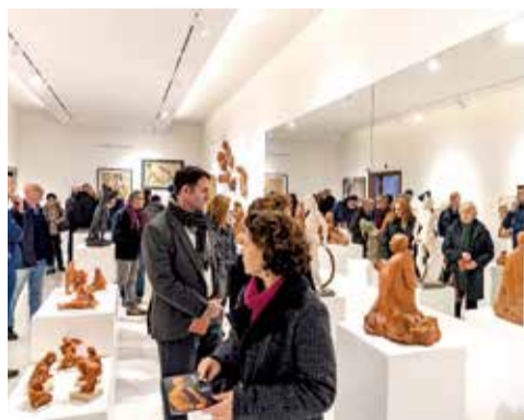
Museo de Algemesí.