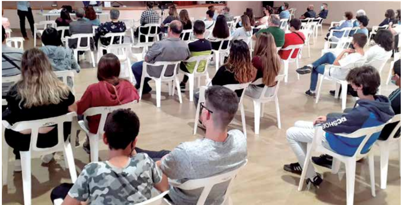
Presentació del curs a L'Énova.

Des del Consistori indiquen que per a fer la matriculació es tindrà per a accedir al Cicle de Formació Professional Grau Mitjà d'Activitats Comercials serà al Centre Integrat Públic de Formació Professional La Costera de la localitat veïna de Xàtiva.