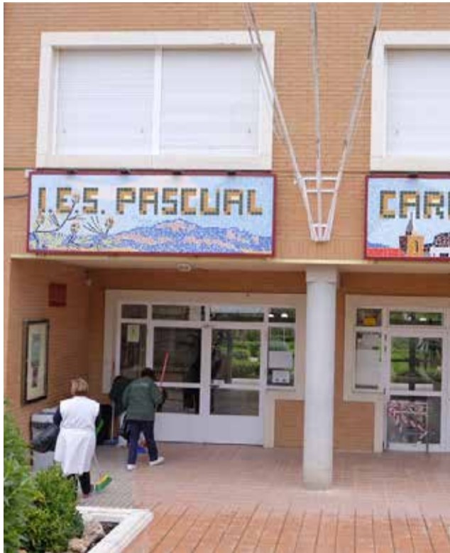
IES Pascual Carrión.

Así, el Intituto de Educación Secundaria Pascual Carrión quiere cambiar su actual Formación Profesional Básica de Jardinería por la especialidad de Instalaciones Electrotécnicas y Mecánicas tal y como se aprobó por unanimidad en el último Consejo Escolar extraordinario. Una propuesta que previamente la concejalía de Educación había consensuado con la inspectora y ya se ha comunicado a la consejería.