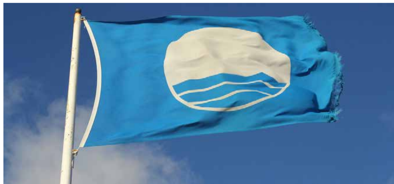
Bandera Azul ondeando.

Nuestro país mantiene, un año más, el liderato mundial en lo que la concesión de banderas azules se refiere. Con 713 banderas azules repartidas entre 615 playas, 96 puertos deportivos y dos