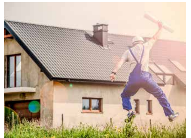
La construcción, uno de los motores del empleo.

En términos interanuales, los datos son ligeramente peores que los de un año atrás, ya que en marzo de 2020 la tasa