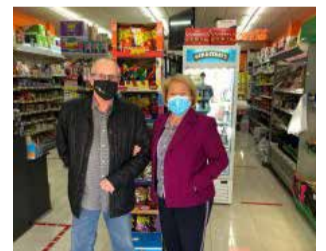
Donación solidaria. / EPDA