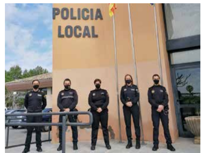
Nuevos agentes de Villena.