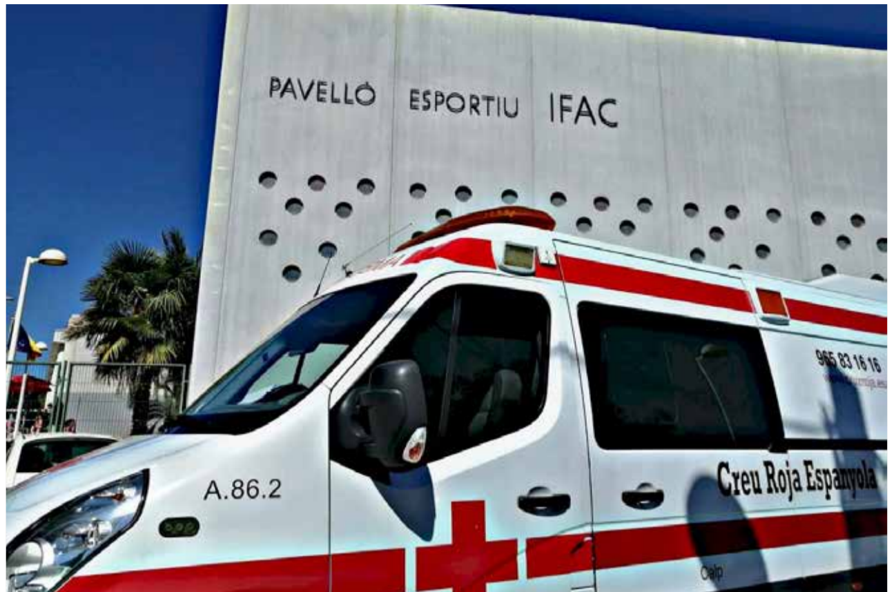
Transporte sanitario.

A pesar de los esfuerzos del Ayuntamiento por reforzar el servicio de transporte sanitario, en enero de 2019 el