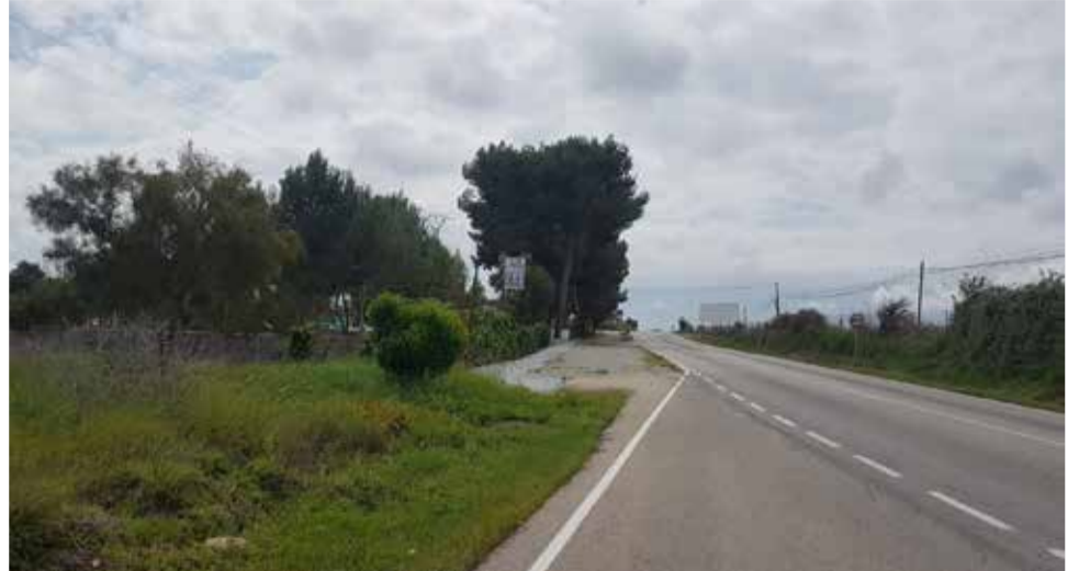
Nuevas papeleras a instalar.

El concejal de Limpieza Viaria y RSU vuelve a insistir en la importancia de usar siempre las papeleras pero con la crisis sanitaria son totalmente necesarias.