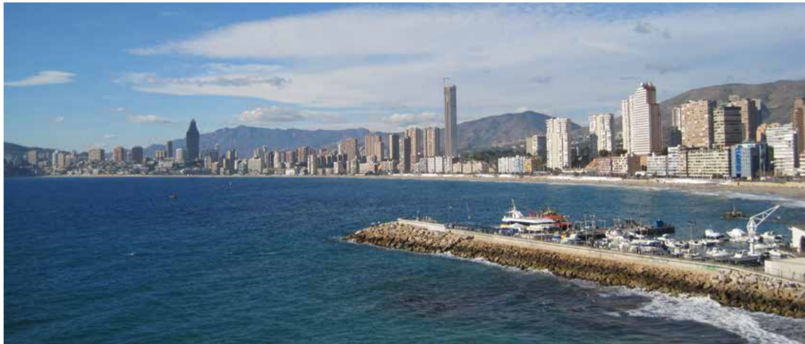
Playa Ponent de Benidorm.

Los criterios para conseguir la bandera azul se dividen en cuatro áreas fundamentales: Calidad de las