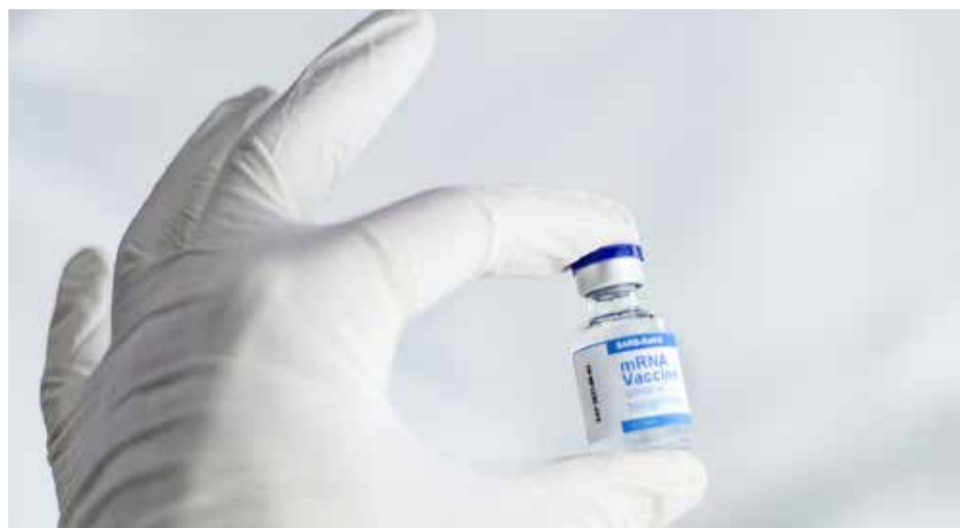
Dosis de la vacuna.

El fin del Estado de Alarma y de muchas de las res-