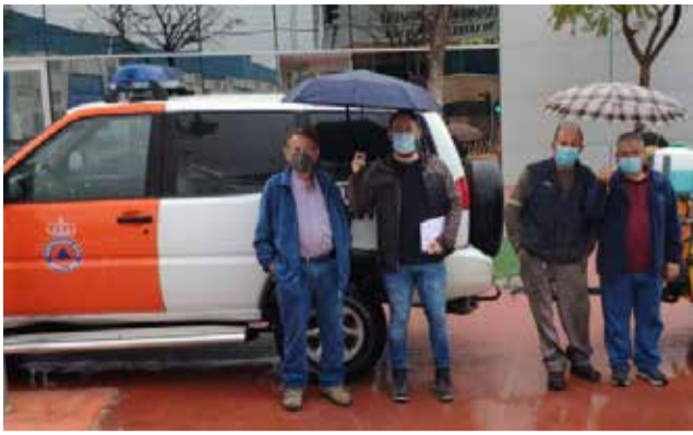
Protecció Ciutadana de Crevillent / EPDA