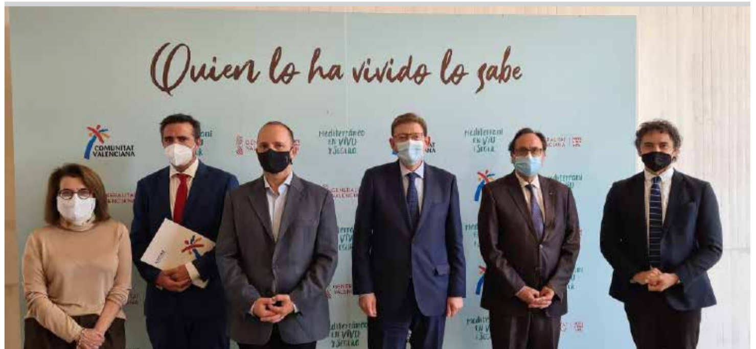
Arriba, autoridades autonómicas en la presentación de la campaña. Abajo uno de los carteles.

Así, junto al conocido lema #MediterráneoEnVivoSeguro usado en la publicidad durante la pandemia para transmitir la seguridad de los establecimientos y destinos de la Comunitat, ahora se añade el valor de la opinión personal de los turistas, la seguridad de lo conocido. La campaña evolucionará para sumar a la de Lope de Vega otras voces que aporten la visión de los propios valencianos o de viajeros llegados de lejos. De hecho, se activará un microsite www.quienlohavividolosabe.com en el que los usuarios podrán colgar sus propias fotos de la Comunitat.