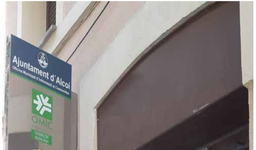
Instalación de los purificadores.

Se trata de 33 purificadores de aire portátiles, provistos de filtros HEPA H13, diseñados para cualquier entorno y que se pueden usar en espacios de hasta 99m2. Utilizan un sistema de limpieza de aire de cuatro etapas, con un prefiltro de malla fina, un filtro de carbón activado, un filtro True HEPA 99.9% y WINIX PlasmaWave® Technology para la eliminación de virus, bacterias y gases de forma natural, sin producir ozono dañino. La misión de estos equipos es hacer circular el