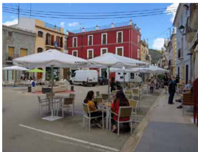
Hostelería en Xaló.