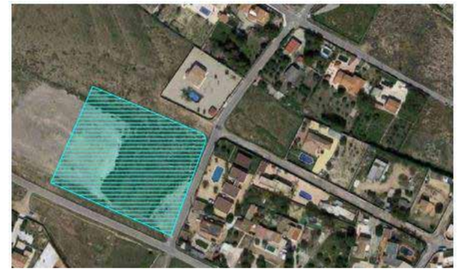
CEIP La Cañada. / EPDA