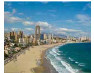
Playa de Benidorm.