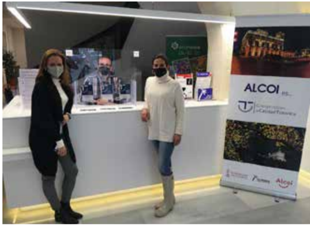
Tourist Info d'Alcoi.