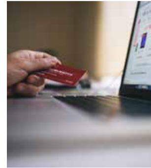
Comerç Online.

El treball d'aquesta digitalització seguirà a marxes forçades durant els pròxims mesos de la mà de l'equip de