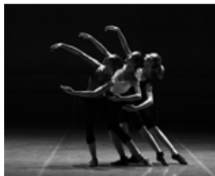
Alumnas de danza.