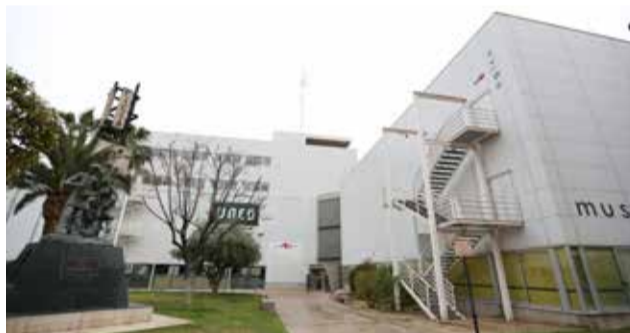
Museo del calzado de Elda.