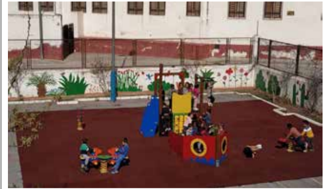
Colegio Cristóbal Colón. / EPDA