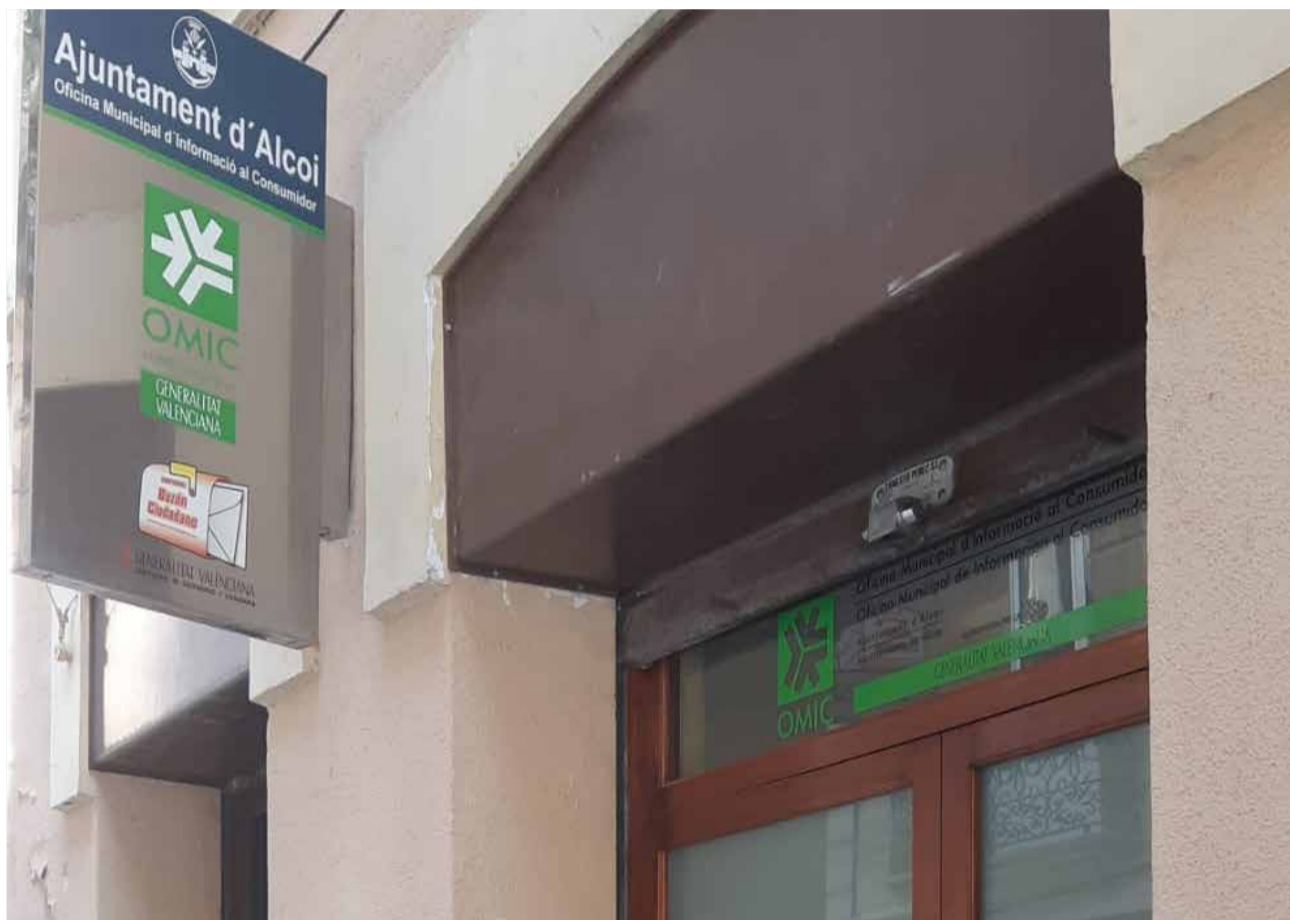
OMIC d'Alcoi / EPDA

Cal destacar que quan s'ha complert alguna cosa més un any de la declaració de primer estat d'alarma, encara són molts els consumidors que no han obtingut el reembossament dels viatges cancel·lats en diferents moments, a conseqüència de la pandèmia. En bastants casos han rebut un bo que no han pogut utilitzar o bé han iniciat alguna reclamació, sense èxit.