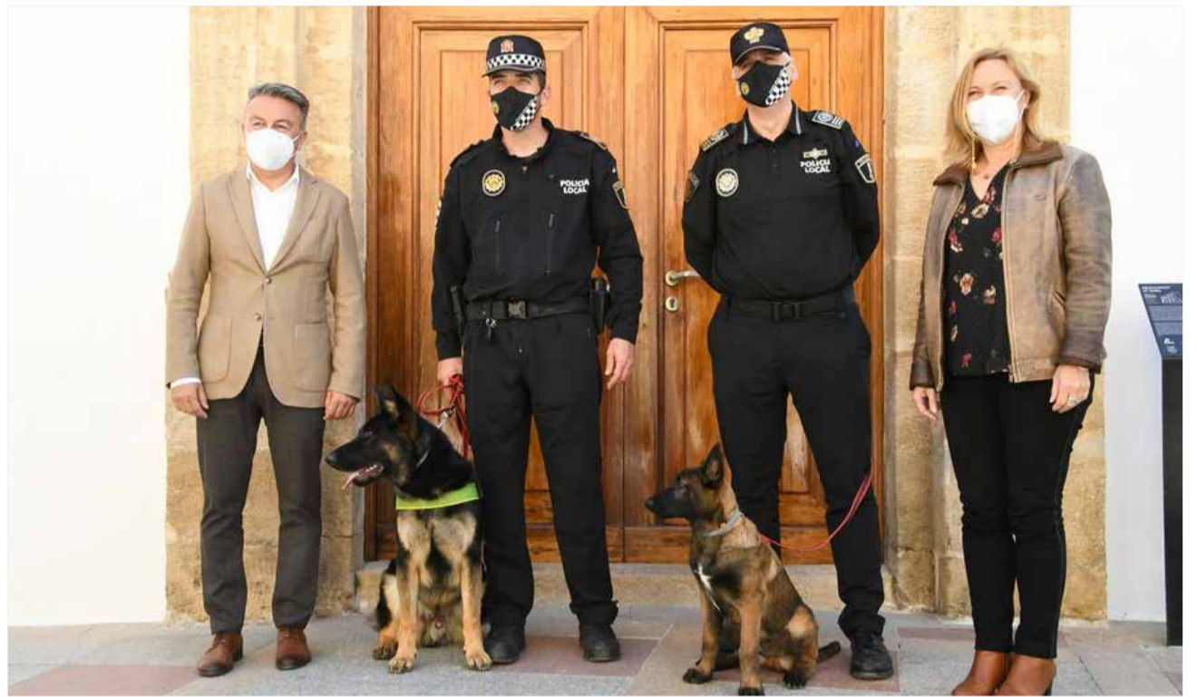
“Khalan” y “Kosmo” con la Policía de Xàbia.

Khalan está siendo adiestrado de la mano de especialistas en rescate y salvamento y