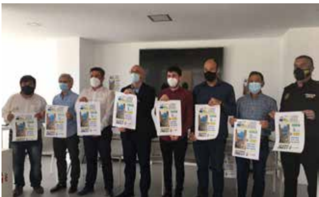
Presentación de la Vuelta Ciclista.