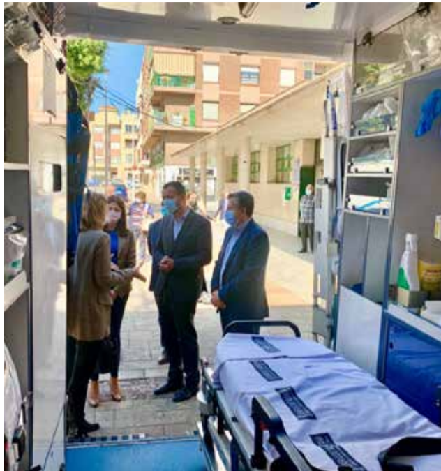
El regidor ilicitano en su visita para comprobar el servicio. / EPDA

en esta pedanía donde habitan más de 5.000 vecinos y vecinas”, ha destacado el regidor ilicitano en su visita para comprobar el servicio. / EPDA