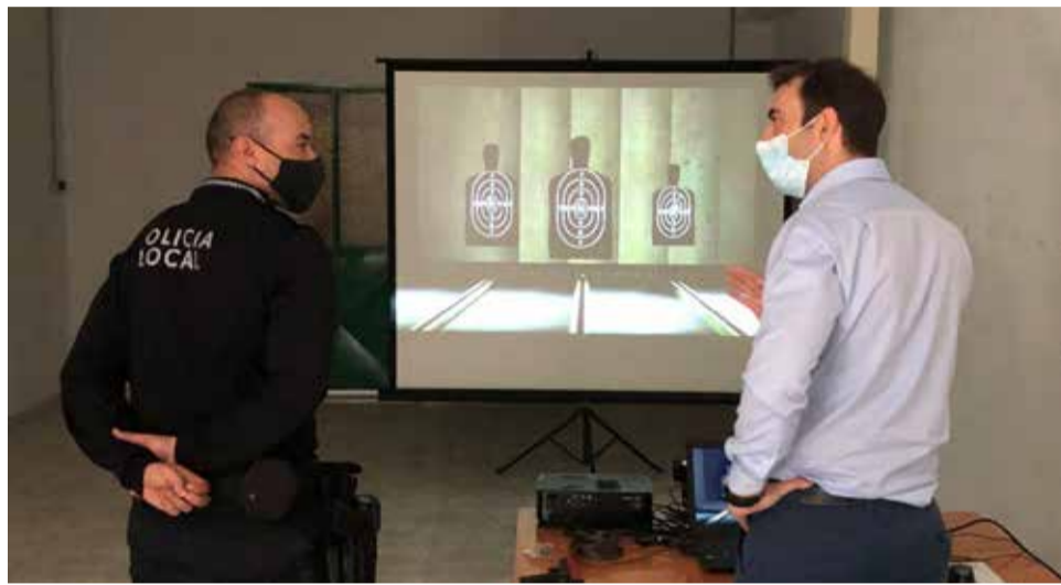
Formación en el seminario.