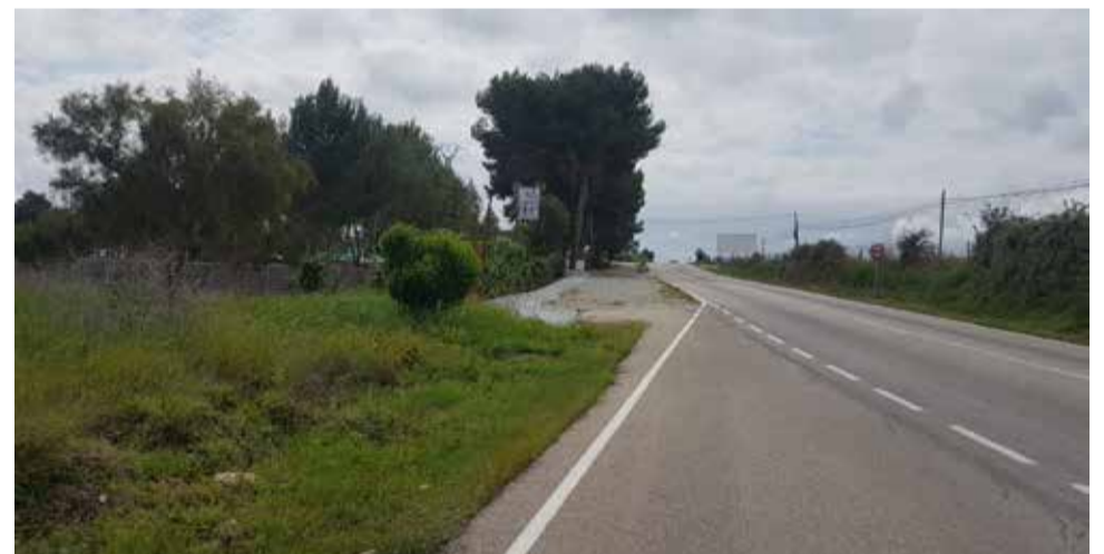
Espacio para las obras. / EPDA

do en las líneas de actuación basadas en Objetivos de Desarrollo Sostenible, y más en concreto en el desarrollo de la movilidad urbana sostenible, conectando zonas deportivas, pedanías y zonas industriales y favoreciendo así el paso a una economía baja en carbono, lo que provoca una calidad de vida mayor, ya que el transporte sostenible puede erradicar muchas enfermedades.