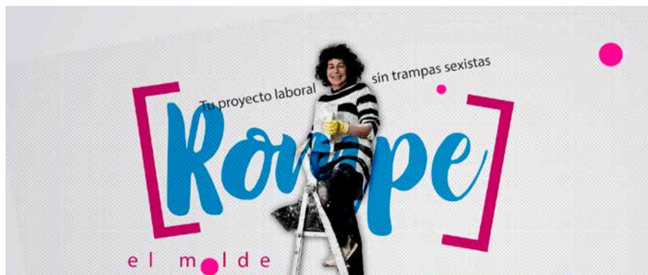
Imágen de la exposición.

La Marina Alta acoge la presentación pública de carácter semipresencial de la exposición fotográfica ‘Rompe el Molde: tu proyecto laboral sin trampas sexistas’ de la Secretaría de Formación, Mujeres y Políticas LGTBI de la U.I. El Alacantí - Las Marinas CCOO PV. El aterrizaje de este proyecto en nuestra comarca viene de la mano de la colaboración entre CCOO de l’Alacantí y las Marinas y la Concejalía de Igualdad del Ayuntamiento de Pedreguer, la Mancomunidad de Servicios Sociales de la Marina Alta y la Concejalía de Igualdad y Juventud del Ayuntamiento de Gata de Gorgos.