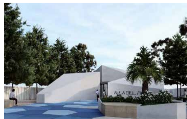
Aula del Mar.