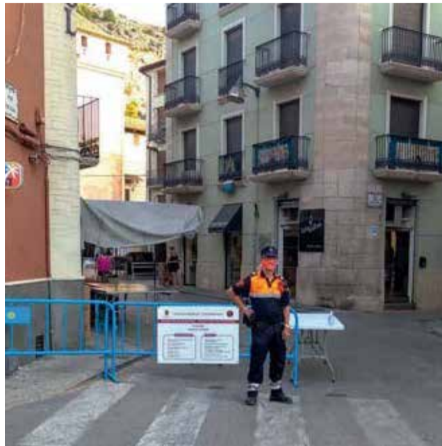
Mercat de Cocentaina.

D'acord amb les directrius de la Conselleria de Sanitat, l'Ajuntament de Cocentaina ha optat per reduir els metratges habituals al que la normativa regula, evitant d'aquesta forma el desplaçament del mercat a una ubicació alternativa. Amb la citada reducció es disposarà de més superfície hàbil per als consumidors que garantisca la distància de seguretat tant per part dels consumidors, com per part dels propis mercaders. Malgrat la nova flexibilitat, es seguirà duent a terme un control en els aforaments,