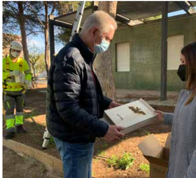
Instalación de las cajas nido.

La empresa que combate las plagas en San Vicente explica que un solo murciélago puede llegar a capturar hasta 1.200 mosquitos en una hora. De ahí que sea un gran aliado para combatir a los molestos mosquitos que con la llegada del calor comienzan a proliferar en la ciudad. Los murciélagos son también depredadores de la procesionaria y