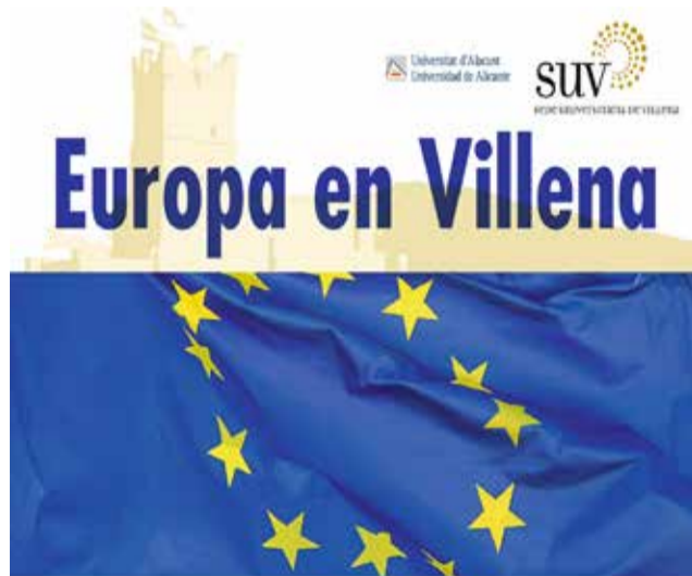
Logo de la iniciativa.

Entre los actos previstos en este mes de mayo, Villena participará en la iluminación de monumentos durante el día de Europa, organizará conferencias para el análisis de la contribución de la UE en la ciudad y establecerá un ciclo de reuniones con colectivos para dar los primeros pasos hacia la redacción de los próximos proyectos de