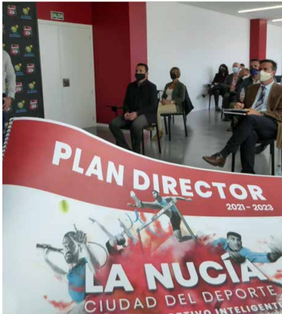
Presentación del Plan Director DTI / EPDA

"Es un día importante para La Nucía e importante para el destino Comunitat Valenciana. Ahora mismo La Nucía está en el máximo nivel, nivel 3 en la Red de Destinos Turísticos Inteligentes de la CV y no sólo eso, sino que también se ha incorporado a la Red Nacional. Pero esto no es fácil porque hay que cumplir unos requisitos muy estrictos para trabajar y para ir avanzando en los distintos niveles de Destinos Turísticos Inteligentes. Significa que un Ayuntamiento tiene claro lo que quiere ser y acompaña esa voluntad política con recursos y trabajo constante. Hoy La Nucía es un destino turístico más fuerte porque refuerza su gobernanza, se alinea con los ejes de sostenibilidad turís-