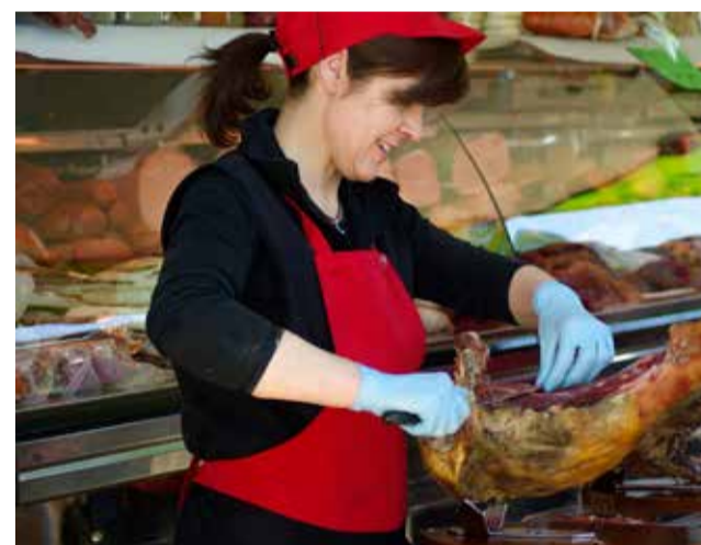
Carnicera cortando jamón.

El curso está compuesto de 130 horas de teoría y 60 horas de prácticas en superficies comerciales de la zona. Entre los contenidos está el manejo de materia prima, tanto de carnes como pescados, manipulación, corte, fileteado, uso de EPIs, alérgenos, prevención de riesgos laborales, además de competencias digitales e igualdad de género.