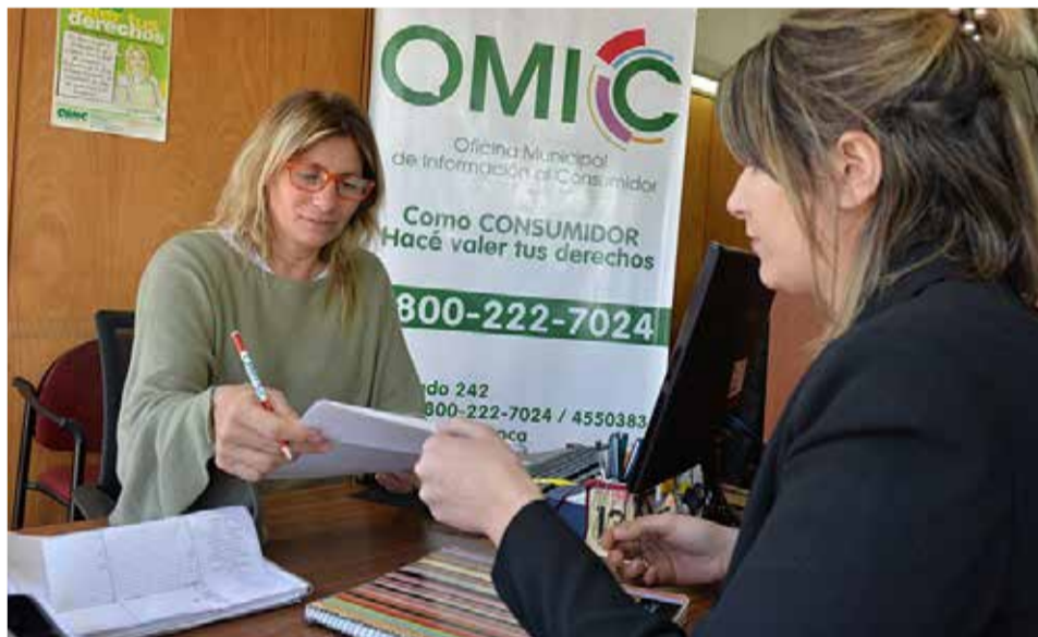
Atenció al consumidor.

Les mesures excepcionals adoptades en el seu moment pel Govern per a afrontar els efectes de la crisi provocada pel coronavirus permetien que les agències de viatges,