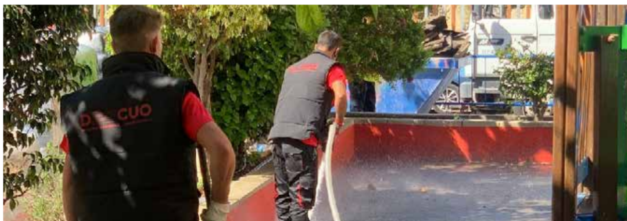
Renovació del parcs de la Vila Joiosa.

berolina AHORRA MÁS DEL 50% EN IMPRESIONES Y 90% DE ENERGÍA