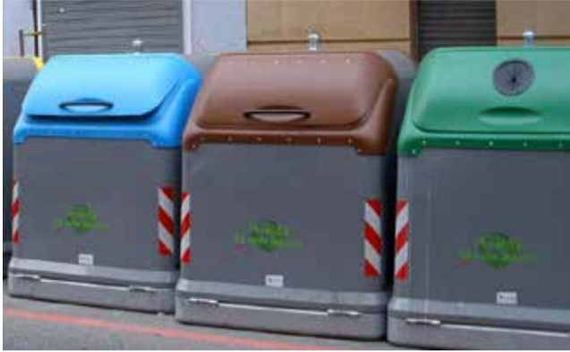
Contenedor de residuos orgánicos.