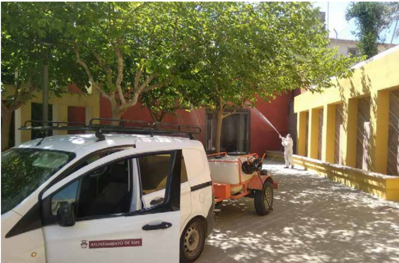
Tareas de fumigación.