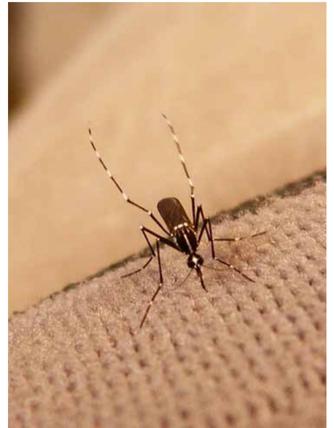
Mosquito tigre. / EPDA