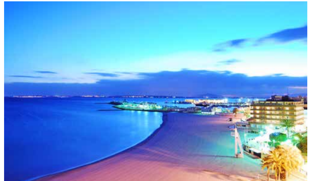
Municipi de Santa Pola.