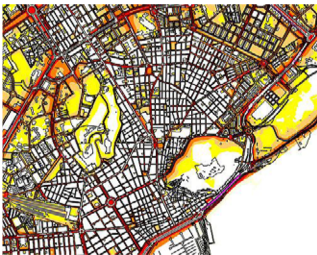
Mapa del ruido.