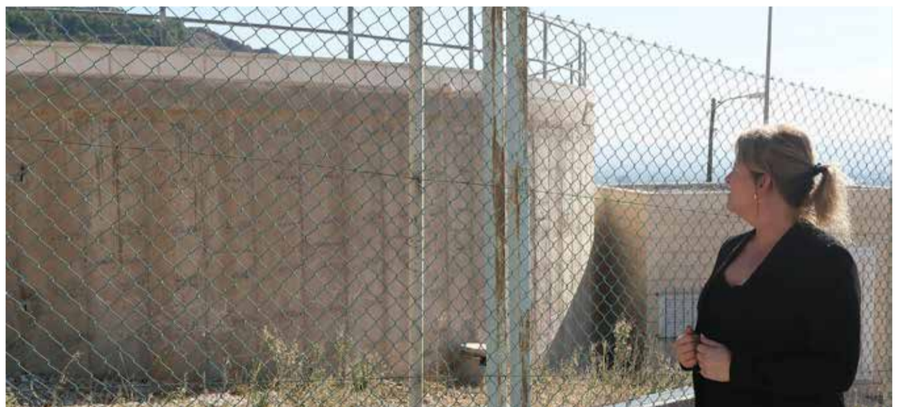
Visita de las entidades a los pueblos de El Comtat.