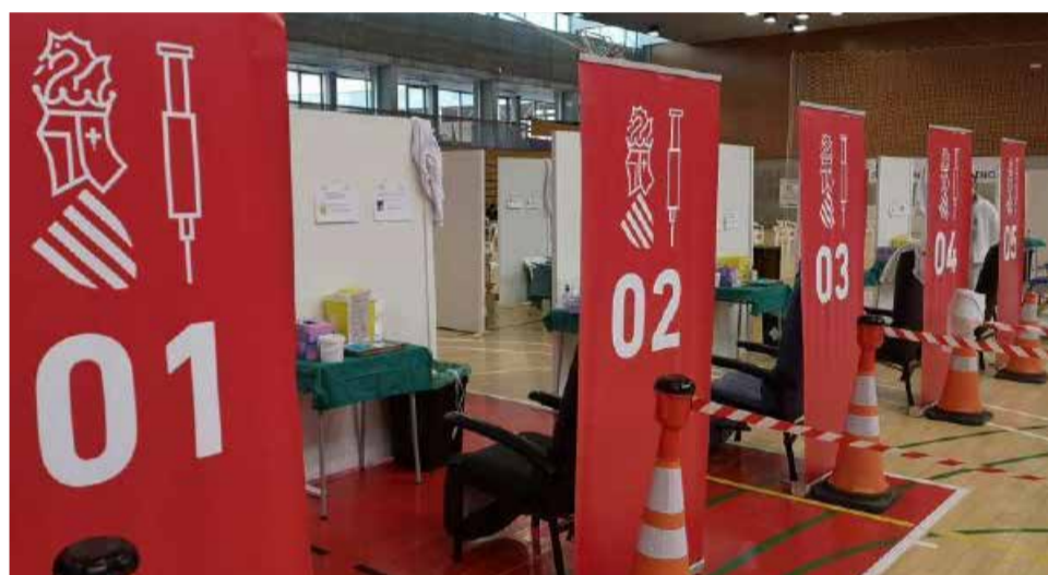
Punto de vacunación masiva.

tricciones que bajo su paraguas jurídico estaban aplicadas en todas las Comunidades Autónomas, dejó unas vergonzosas imágenes en las que centenares de irresponsables llenaron las calles a media noche en Madrid y muchas otras ciudades como Barcelona, Granada o Salamanca al grito de libertad y no dudaron en hacer botellones incluso a las puertas de algunas UCIs, desde donde los sanitarios se echaban las manos a la cabeza ante lo que veían y escuchaban.