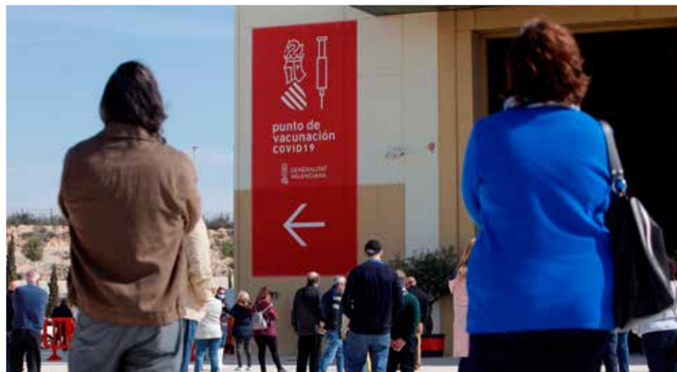
Punto de vacunación.

dosis. En la provincia de Alicante se han administrado ya 714.973 dosis de la vacuna contra el coronavirus.