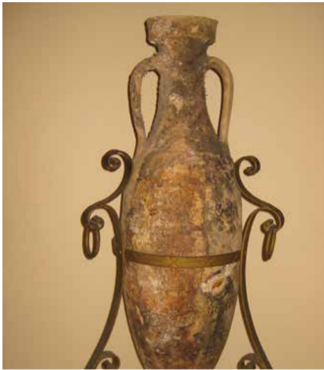
Ánfora cedida por la familia.

La datación de la pieza nos lleva, pues, a la época romana republicana y su función era la de ser usada en el transporte y comercialización del vino, especialmente el destinado al