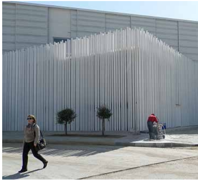
El “Pabellón Blanco”.

Las actuaciones, que podrían comenzar a llevarse a cabo a partir del mes de julio para finalizarlas en noviembre, son el cerramiento hasta el techo de las dos salas de la planta superior, la instalación de barandillas de seguridad