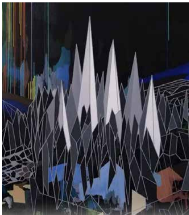
Paisatge sonor de la Vila Joiosa.

El mes de setembre de l'any passat, Trujillo va acceptar el repte d'Antonio Cervera, participant en l'exposició inaugural d'Espai Bigueta. Durant dues setmanes, Trujillo va fer un treball de camp a la Vila Joiosa en el qual va capturar mostres en set passejos geolocalitzats, va captar els fluxos dels senyals de telefonia mòbil, wifi, ràdio, tv, radiacions electromagnètiques de baixa freqüència, equipats amb un analitzador d'espectre i una gravadora d'àudio digital, i ha transformat aqueixos senyals en so audible i en estí-