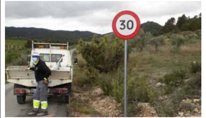
Señalética de seguridad.