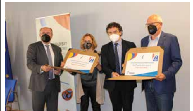
Recogida del premio.