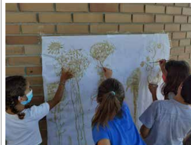
Curso de verano de Mas Camarena Canet.