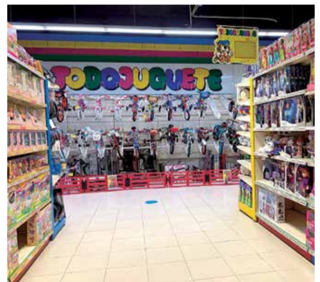
Una tienda de Todojuguete.

Además, os acompañarán desde el nacimiento de vuestro peque con Todobebé, su sección de puericultura donde encontraréis todo lo necesario para comenzar el maravilloso mundo de ser papá/mamá. Su selección de marcas son sin duda una garantía de calidad, seguridad y comodidad tanto para vosotros como para vuestro bebé.