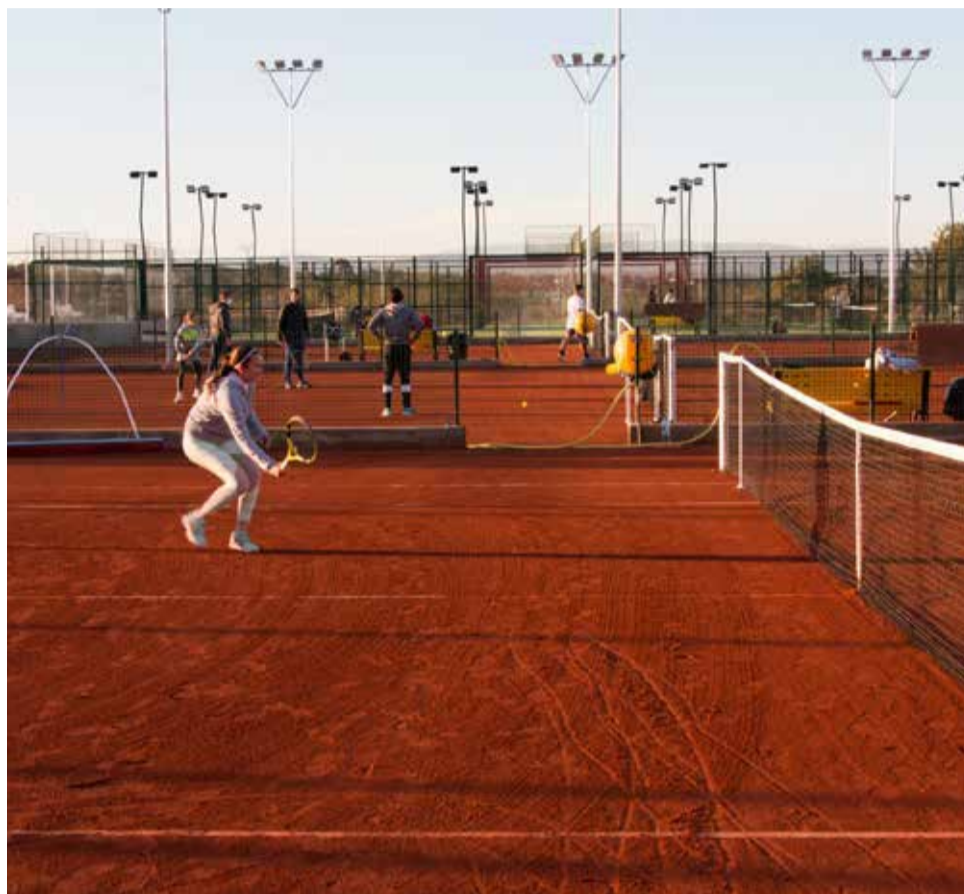
Curso de verano de Camarena Canet.

Para los más pequeños desde 4 meses hasta 3 años tiene preparado un curso exclusivo, con especialistas de Infantil, su “Baby Summer” es