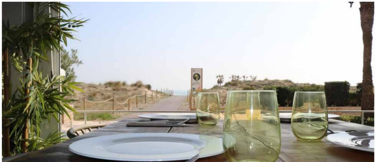
Terraza del restaurante Saoco, en pleno paseo marítimo de Canet.

Pero el verano del 2021 se prevé mucho mejor. Con una parte importante de la sociedad ya vacunada, con menos restricciones y con mucha más responsabilidad y concienciación, las fuentes consultadas por El Periódico DE AQUÍ en distintos sectores comerciales de Canet d'En Be-