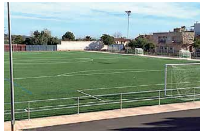
Camp de futbol de Benifairó de les Valls.