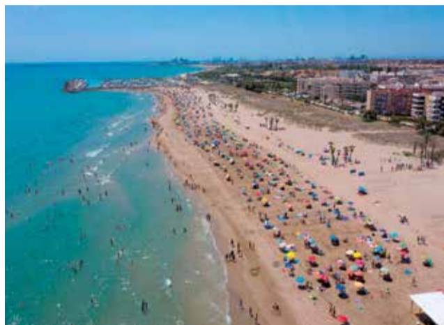
Playa en Canet d'en Berenguer.