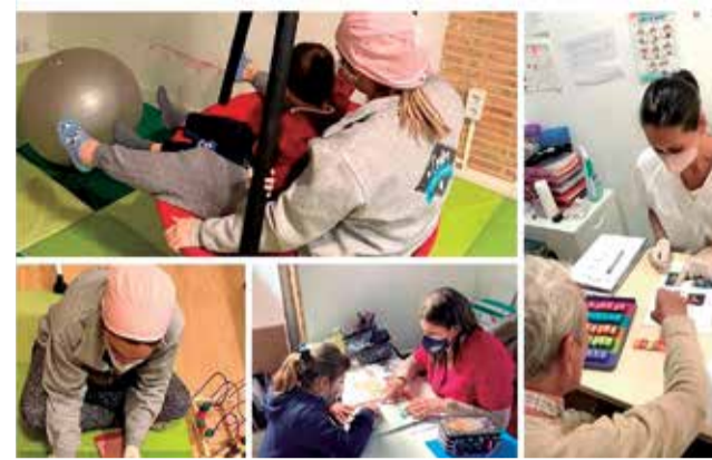
Personas con diversidad funcional en terapias.