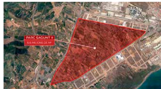
Parc Sagunt II. / EPDA