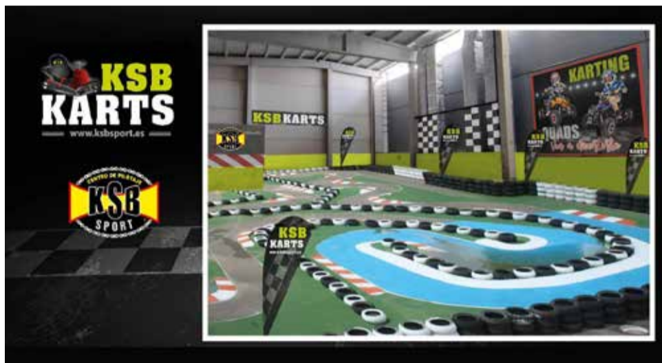
KSB Karts, una de las nuevas aperturas en l'Epicentre.

Gracias a empresas como el Grupo Inditex que han apostado por el L'epicentre, han logrado el mayor crecimiento de la zona en los últimos años. Lo han hecho apostando por el desarrollo comercial e Industrial.