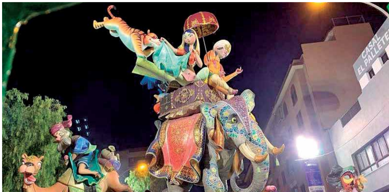
Monumento de la Falla El Palleter de Port de Sagunt. / EPDA