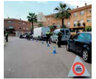
Control en Sagunt.