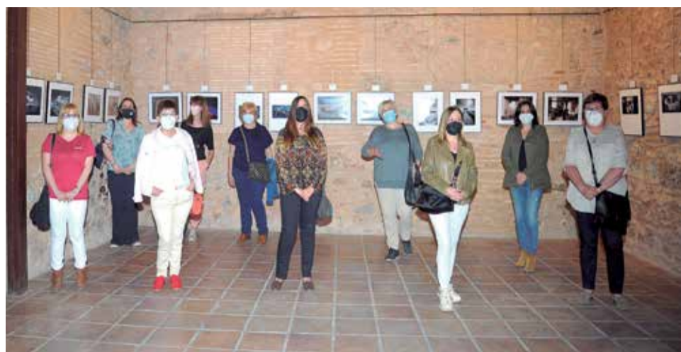
Exposición 'Mujeres tras un objetivo' de la Fundación Bancaja en Sagunt

La muestra, de entrada gratuita, se puede visitar de lunes a viernes de 17 a 21h en la Sala Michavila de la Casa Capellà Pallarés (C/Caballeros, 12).