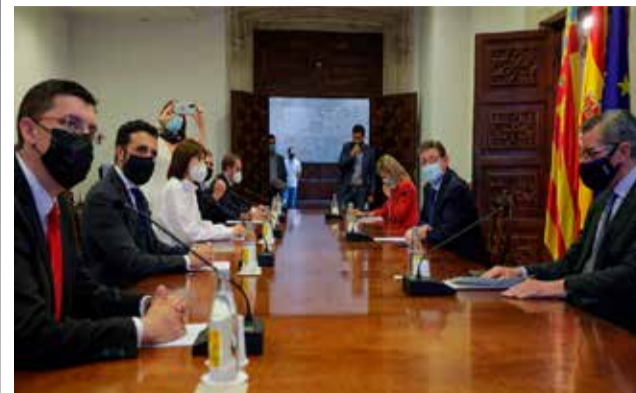
Reunió entre alcaldes i membres del Consell.