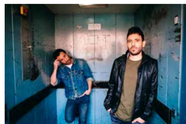
Promoción del concierto Ciudad Jara.

tado de alarma ni se habían suavizado las restricciones y tampoco se sabía hacia dónde evolucionarían las medidas. Por eso desde la Delegación de Cultura se decidió, por precaución y seguridad tomar como referencia las medidas de seguridad que estaban activas en el momento.