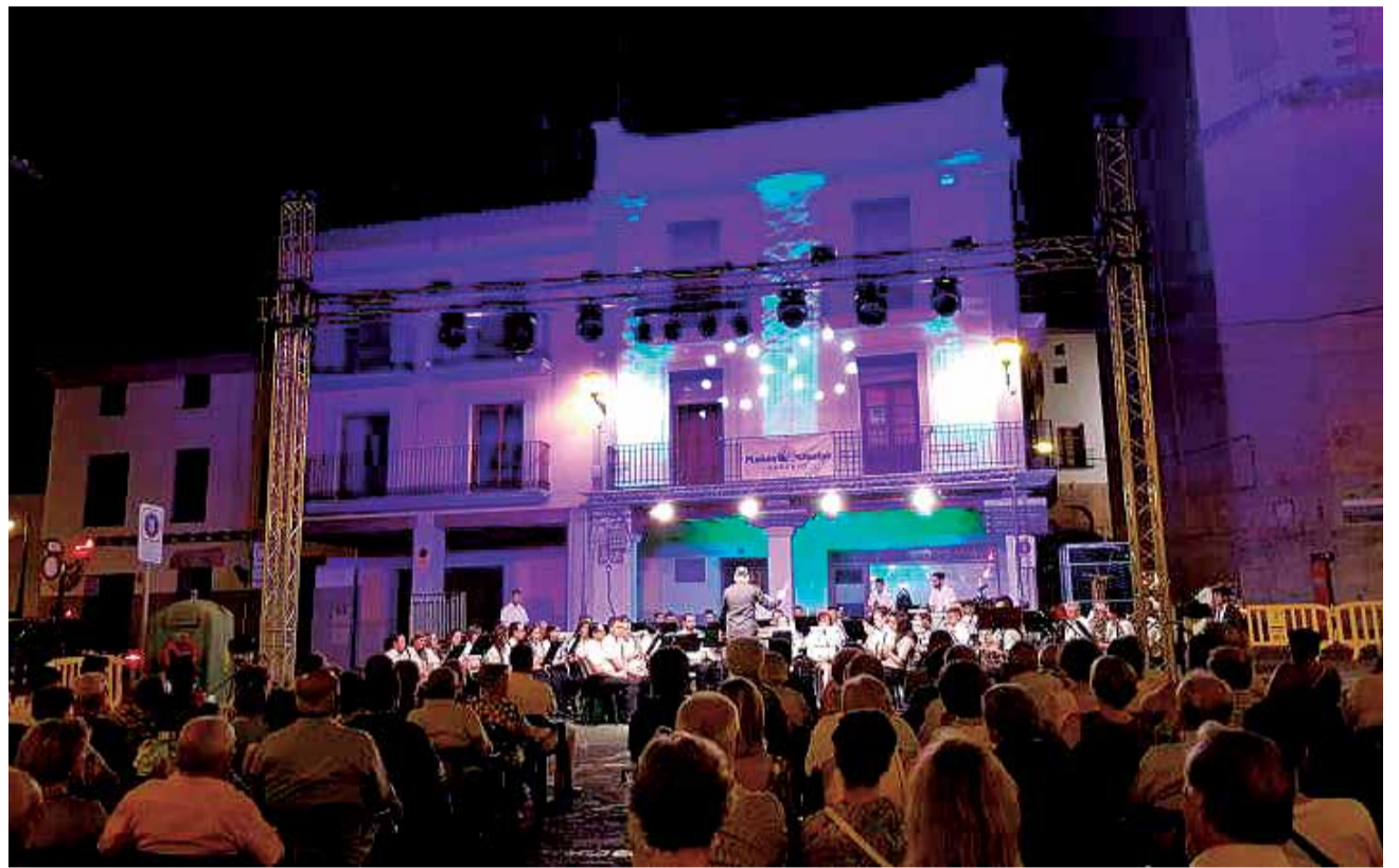
Discomóvil en un municipio de la Comunitat Valenciana antes de la pandemia.