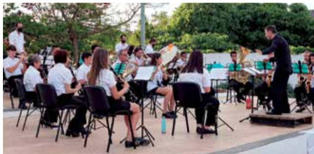
Concert benèfic contra el càncer.

L'actuació benèfica va tindre lloc al pati del musical i va assistir un representant de la Junta Provincial. Esta actuació és la primera que realitza la banda després de l'estat d'alarma. L'acolliment va ser destacable.