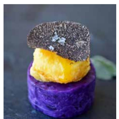
Patata violeta con yema.