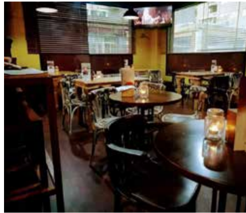
El interior de Molly Malone's.