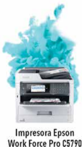
Impresora Epson Work Force Pro C5790

berolina AHORRA MÁS DEL 50% EN IMPRESIONES Y 90% DE ENERGÍA