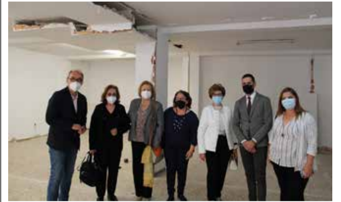
Visita del vicepresidente al espacio.