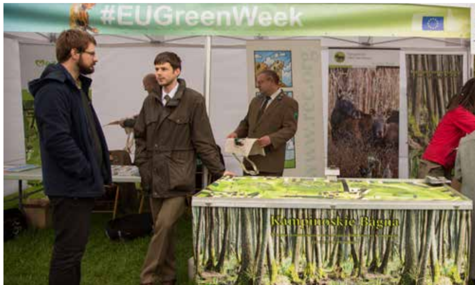
Presentación de las mesas dentro de la Semana Verde de 2019 / EPDA