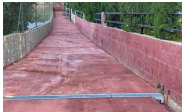
Pasarela de la zona dels Puntals.