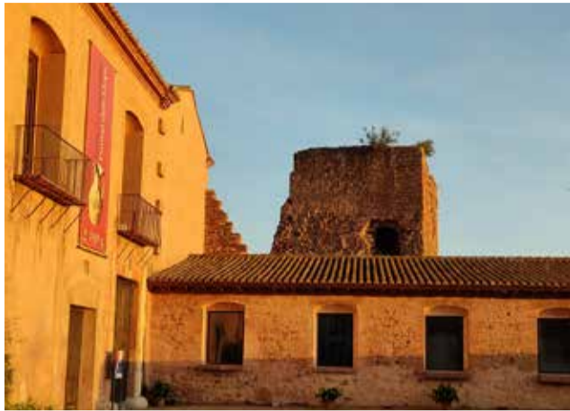
Torre de Pardines.

Continuamos así con nuestra estrategia de trabajo de recuperar todos los monumentos BIC del municipio". El objetivo de esta actuación es el de restaurar la torre y el