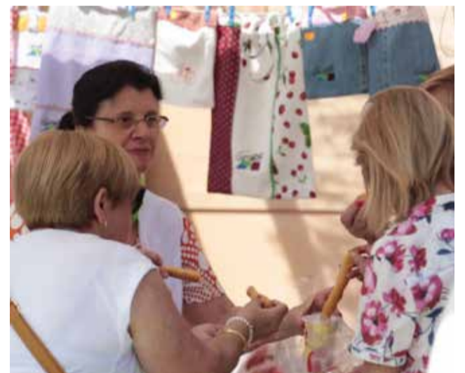
Fira de Comerç de Gátova de 2019.

vertisca en un record penjat als museus, sinó en un futur d'alimentació i compra sostenible. Per altra banda, no s'ha d'oblidar el paper del comerç local durant els moments