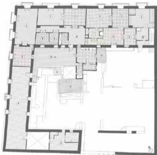
Exterior (arriba) y plano del interior (abajo).

ELS ORÍGENS D'ESTE GRAN EDIFICI ES REMUNTEN AL SEGLE XVIII