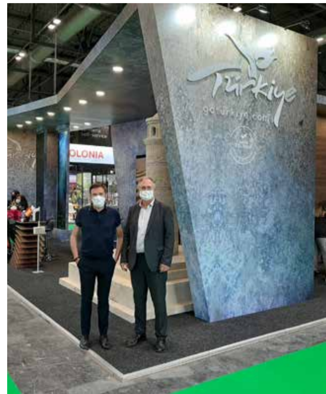
Presentación en FITUR

El Ayuntamiento de Llíria, además, promocionará en Fitur el programa de 'Sinfonía de Culturas', que permite recorrer el municipio en diferentes contextos históricos a