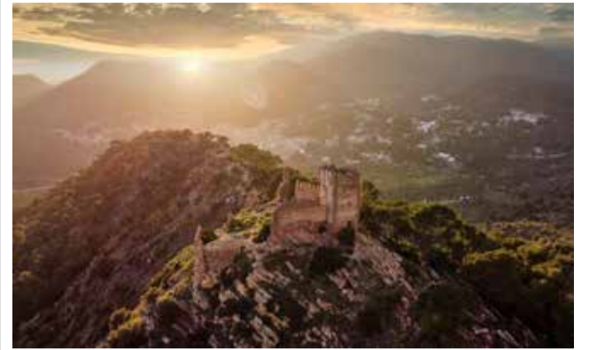
Panoràmica guanyadora / VICENTE FORES