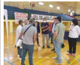
Pavellón municipal / EPDA