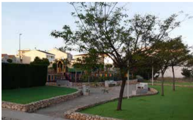
Espai de la Canyaeta.