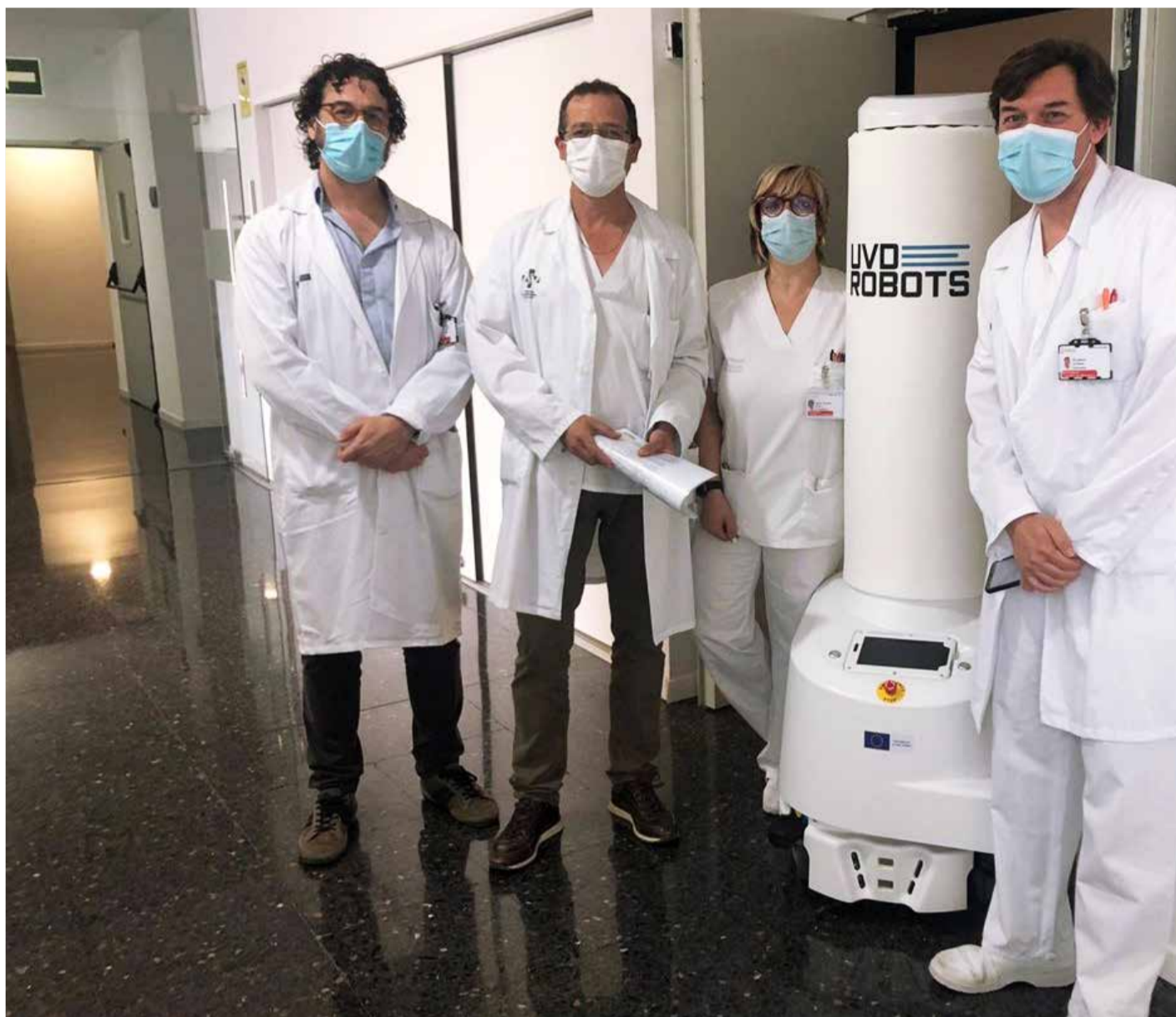
Presentació del robot UVC al Departament de Salut Arnau de Vilanova-Llíria

El desenvolupament de la robòtica o la intel·ligència artificial s'ha vist àmpliament representat als processos de fabricació, però és al nucli sanitari on s'han trobat més dificultats per aplicar-la. I no per falta de tecnologia. Fa molts anys que diferents enginyers i investigadors estudien arreu del món com compaginar l'aprenentatge, les dades i la mobilitat dels robots per crear algun invent que pugui ser d'ajuda. Simplement, la societat general li havia donat un caràcter futurista o utòpic a unes ferramentes amb molt de potencial. Ara bé, sí que s'han fet avanços, i el territori valencià ha sigut un camp de cultiu pròsper per a moltes xicotetes iniciatives en aquest terreny. Les aplicacions, la intel·ligència artificial o la robòtica són, ara més que mai, una finestra per obrir.