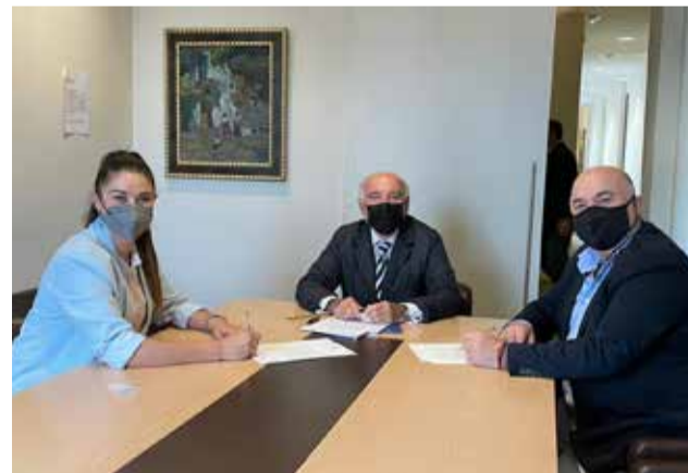
Reunió de l'alcalde, Vaersa i la Consellera

Aquesta concessió dona un dret de superfície de la parcel·la Polígon Industrial Llama Llarga de Nàquera, on se situa el centre de reciclatge