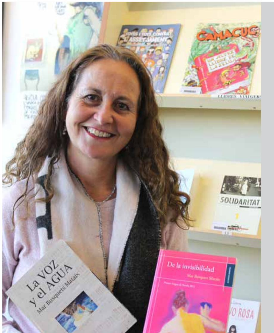
La escritora durante las firmas de libros

► La plataforma surgió hace tres años por la necesidad de realizar actividades