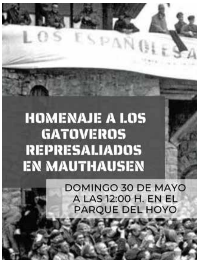
Cartel del acto