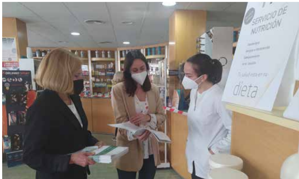
Reparto el cuaderno por varios lugares de Bétera / EPDA

El cuaderno se compone de dos partes, por un lado, las actividades físicas que