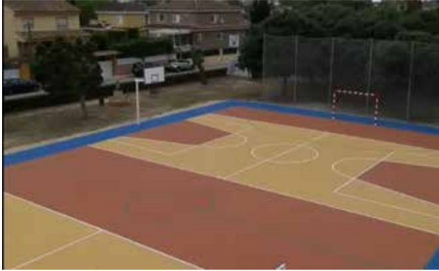
Una de les zones esportives.