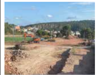
Obras en el colegio.