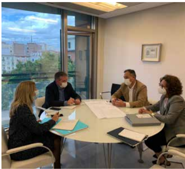
Reunión para la construcción