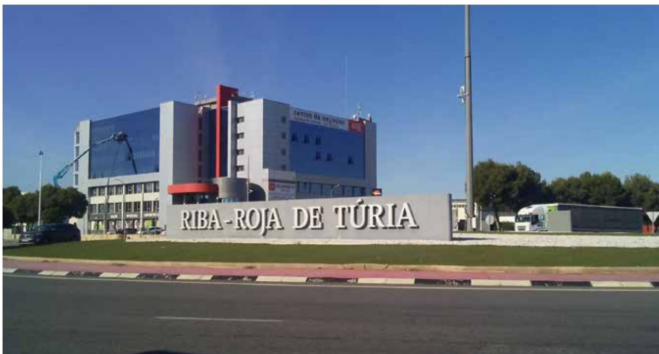
Entrada al municipio de Riba-roja