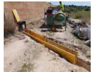
Reparación / EPDA