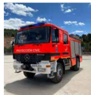
Pie de foto.