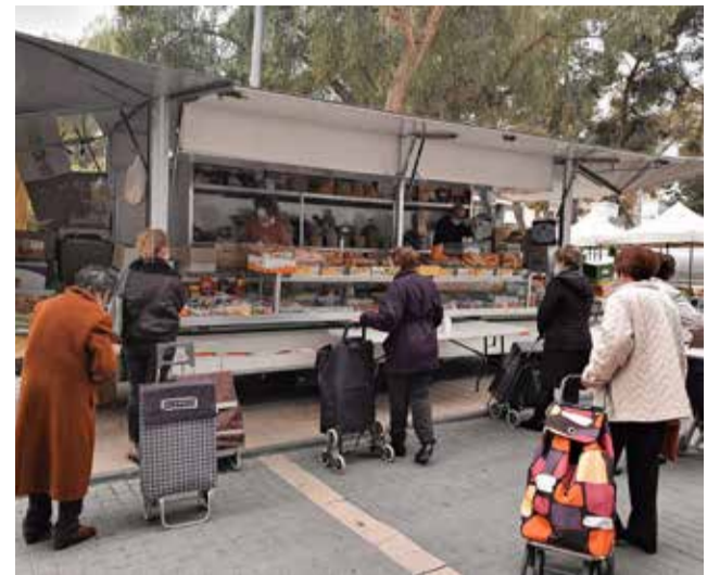
Dones esperant al mercat de Benaguasil.

En 2020 es van importar quasi 4 milions de tones de fruites i verdures, la majoria taronges i plàtans