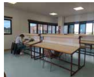
Sala de Estudio / EPDA