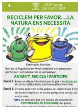
Cartell informatiu.