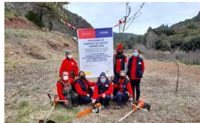
Personas contratadas en Gátova.