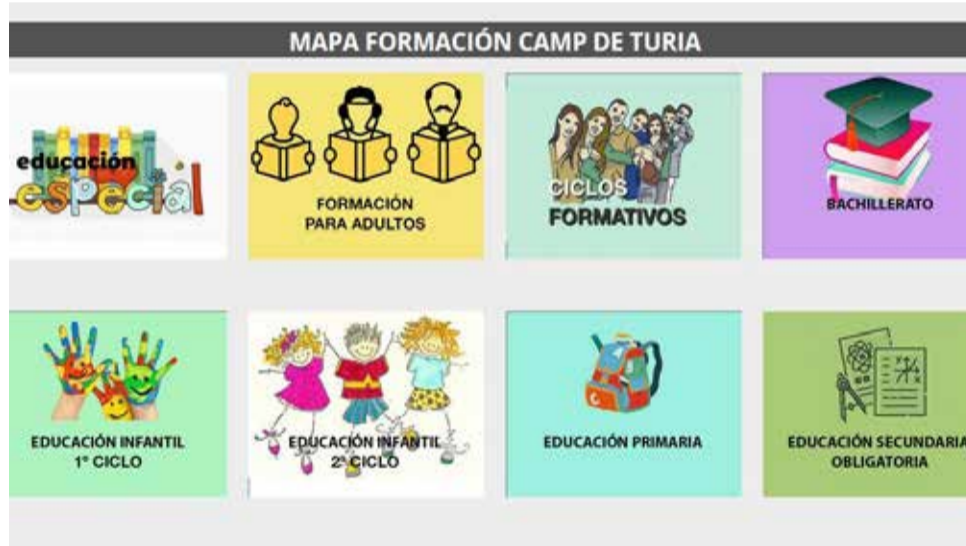
Mapa de les diferents opcions educatives.

sonal tècnic ja està treballant, com és l'elaboració i difusió d'un butlletí de formació. La Mesa de Formació és una de les quatre que es desenvolupen dins de l'Acord Territorial d'Ocupació. Una fórmula per a desenvolupar polítiques que milloren l'ocupabilitat a la comarca. Al costat d'educació, indústria, agricultura i comerç són les altres tres meses de treball.