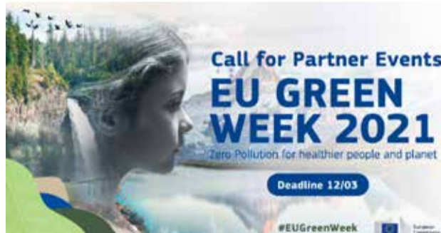
Cartel de la Semana Verde / EPDA

La Semana Verde es la conferencia anual sobre políticas ambientales más importante de Europa. En ella se dan cita representantes de gobiernos, industrias y organizaciones