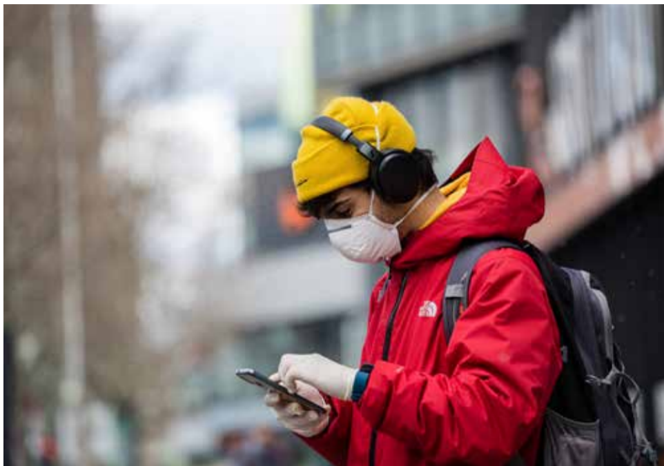
Una persona con mascarilla consulta su teléfono móvil.

Els robots col·laboratius poden treballar en entorns amb persones, i fer una feina repetitiva amb major efectivitat"