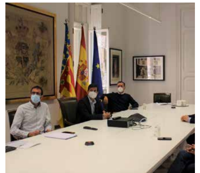
Reunión de los alcaldes con el diputado

no y situarla debajo del puente del ferrocarril, además de crear un paso superior para redirigir el tráfico. De esta forma, los vehículos podrían circular con fluidez, ya que el tráfico continuaría recto por el paso superior sin cruzar su trayectoria con otros vehículos pesados que se dirijan a los diferentes sectores industriales. Además, el estudio contemplaba el futuro crecimiento de los sectores industriales y del suelo urbanizable, así como el acceso de Masía Baló, situado en el oeste del enlace actual y previsto por el Ministerio de Transportes. El alcalde de Loriguilla ha dado la enhorabuena al equipo técnico por "el gran trabajo realizado".