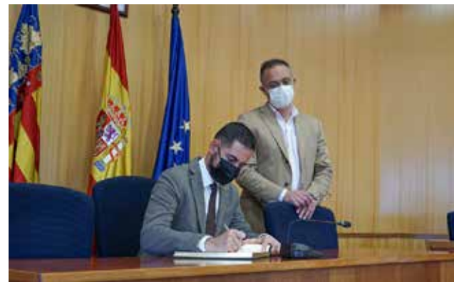
Firma del libro de honor del Ayuntamiento.