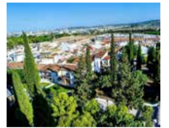
Pie de foto.