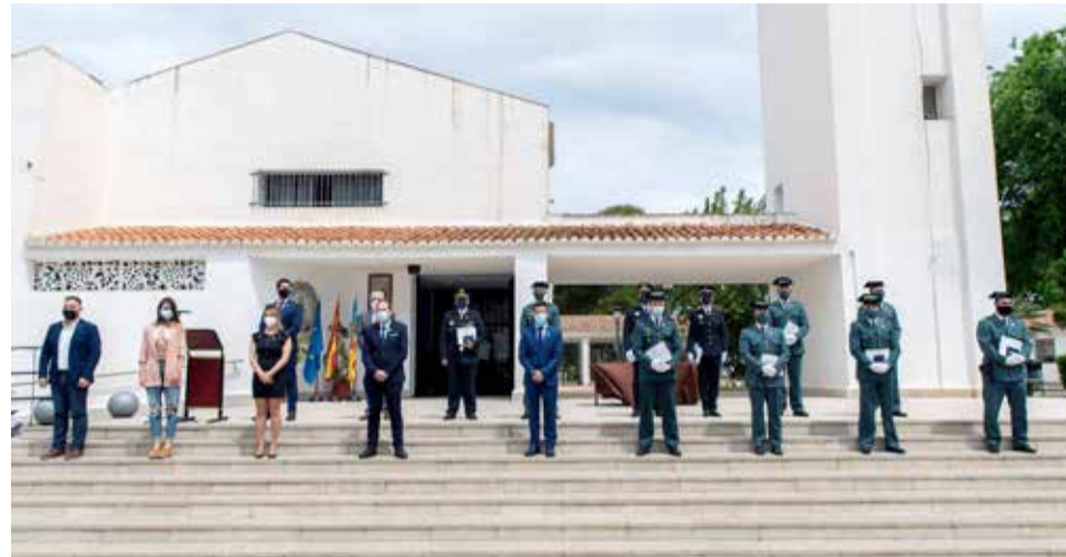
Acto de entrega de las medallas.

■ SE HA CELEBRADO UN ACTO EN LA PLAZA DEL AYUNTAMIENTO PARA OTORGAR LAS MEDALLAS