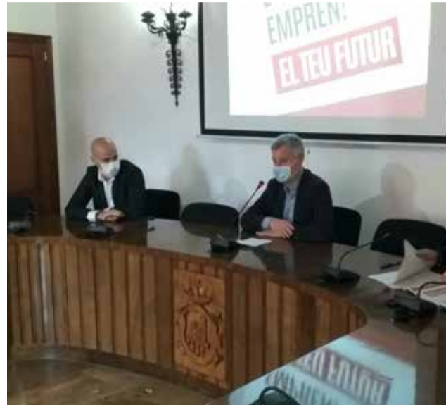
Reunió per presentar el projecte / EPDA

El projecte arrancarà amb el llançament d'un concurs d'idees, on emprenedors, innovadors, artesans, petites i mitjanes empreses locals podran presentar les seues propostes de negoci. Aquestes iniciatives poden estar immerses en qualsevol de les seues diferents etapes, independentment que encara no s'hagen executat, estiguen en procés o es troben en fases inicials del projecte.