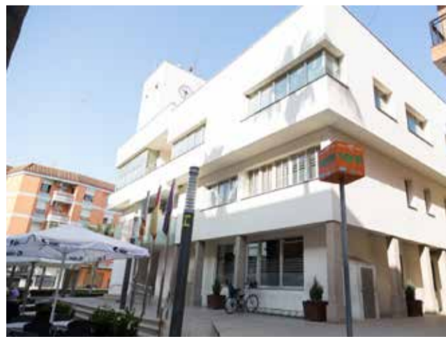
Centro de Vilamarxant.

"El proceso estará guiado por un mediador que no propondrá ninguna solución, sino que pondrá a disposición