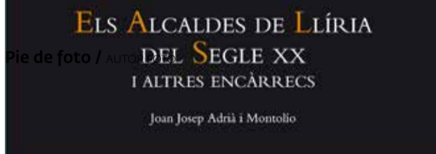
Cartel de uno de los actos del aula.