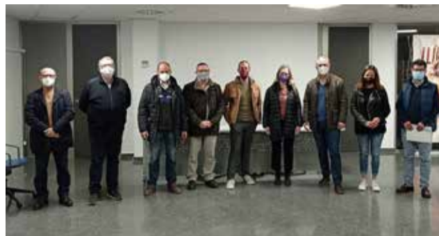
Una de las últimas sesiones del Aula.