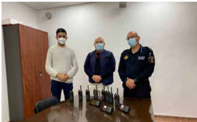
Recepció de las ferramentes.