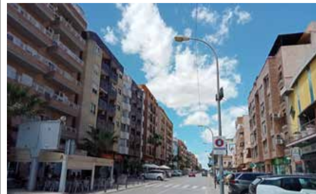
Pie de foto.