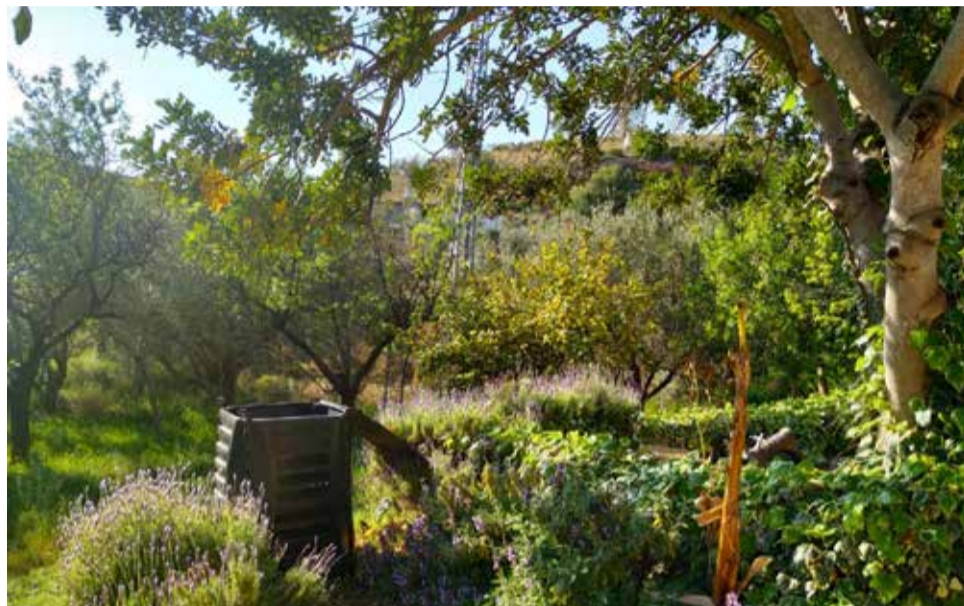
Recogida de basuras en el paraje natural

El programa de compostaje doméstico se está iniciando en áreas de viviendas con jardín como complemento voluntario al sistema de gestión de residuos actual. En segundo lugar, se está implantando