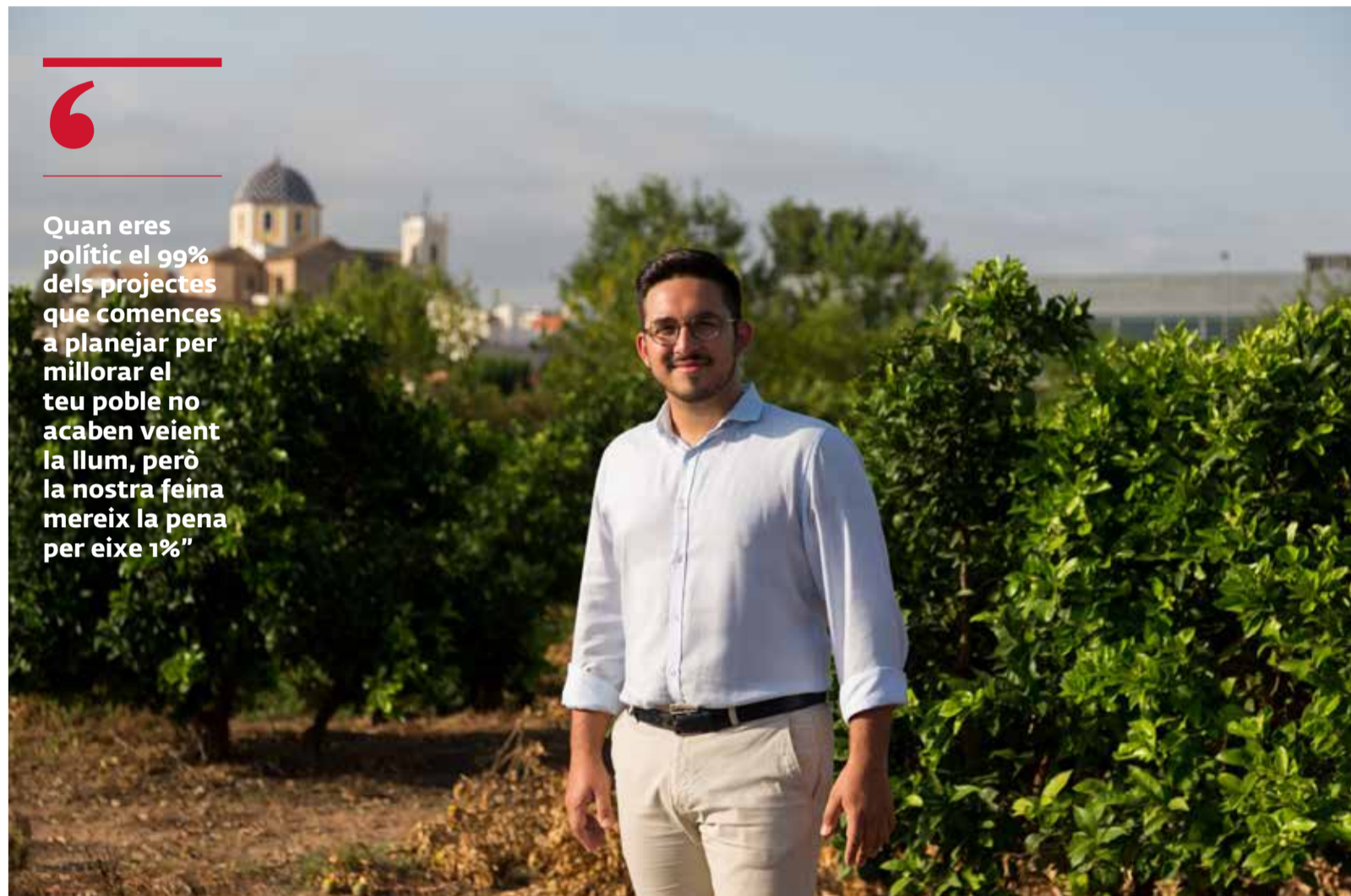
El alcalde de Vilamarxant, Héctor Troyano.

📍 L'ALCALDE DE VILAMARXANT ACABA EN JUNY LA SEUA LEGISLATURA, I DEIXARÀ PAS A CIUTADANS, ENCARA QUE HA CONFIRMAT LA INTENCIÓ DE PRESENTAR-SE A LES PRÒXIMES ELECCIONS SI EL GRUP AVALA LA CANDIDATURA