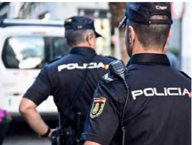
Agentes de la Policía Nacional.

A los detenidos, a los que se les ha puesto a disposición, se les atribuye la presunta autoría de los delitos de usurpación de estado civil, falsedad documental, estafa, daños informáticos,