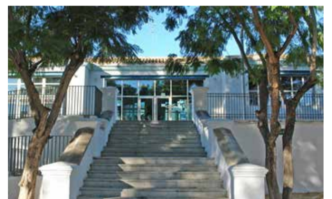
El centro de vacunación de Benaguasil.