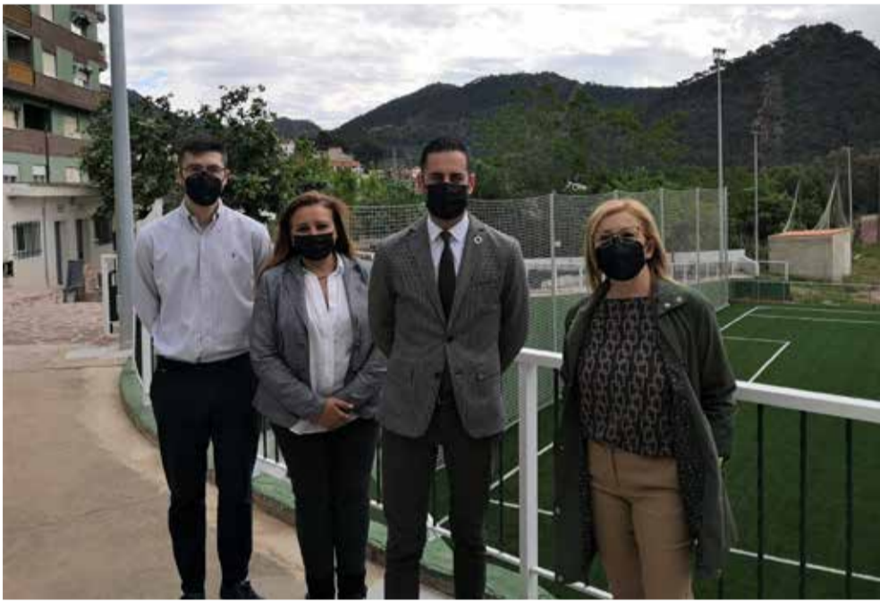
Visita de la Diputació a les instal·lacions de Serra / EPDA

■ L'ALCALDESSA HA AGRAÏT AL DIPUTAT L'ESFORÇ I AJUDA QUE ELS MUNICIPIS ESTAN REBENT