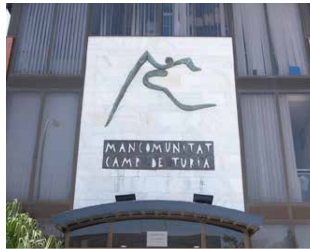
Sede de la Mancomunitat.