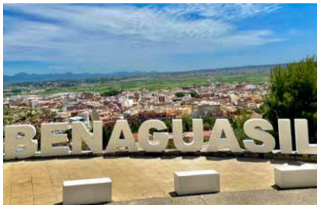
Rótulo turístico en el municipio.