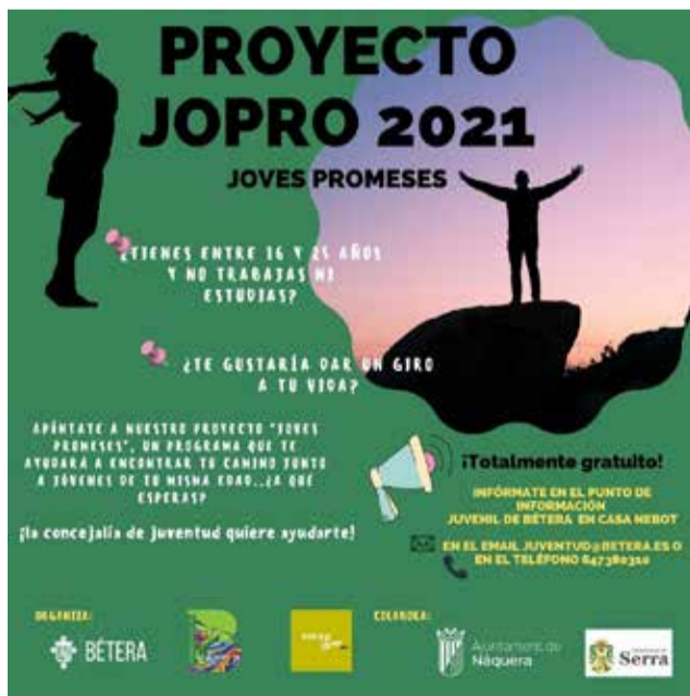
Cartel de promoción del proyecto/ EODA

Este proyecto, desarrollado por la concejalía de Juventud, se constituye para que la población más joven disponga de nuevas opciones formativas gracias a un coach-orientador que los