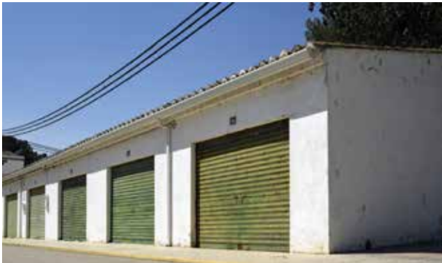
Instalaciones para el Aula Respiro.