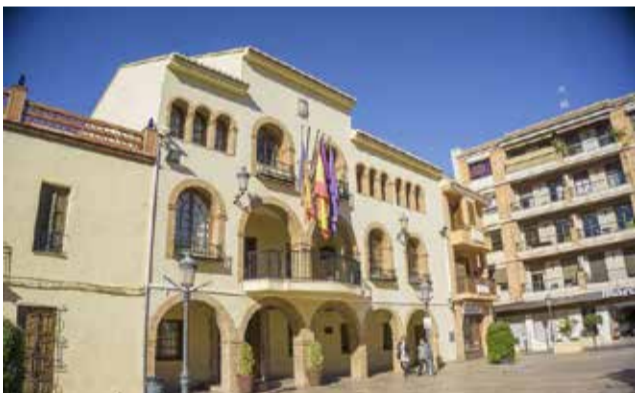
Ajuntament de L'Eliana. / EPDA