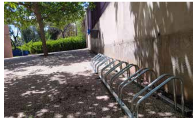
Los aparcabicis del centro escolar.