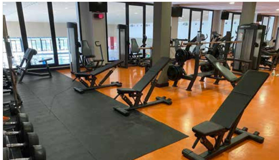
Centro deportivo de Benaguasil.