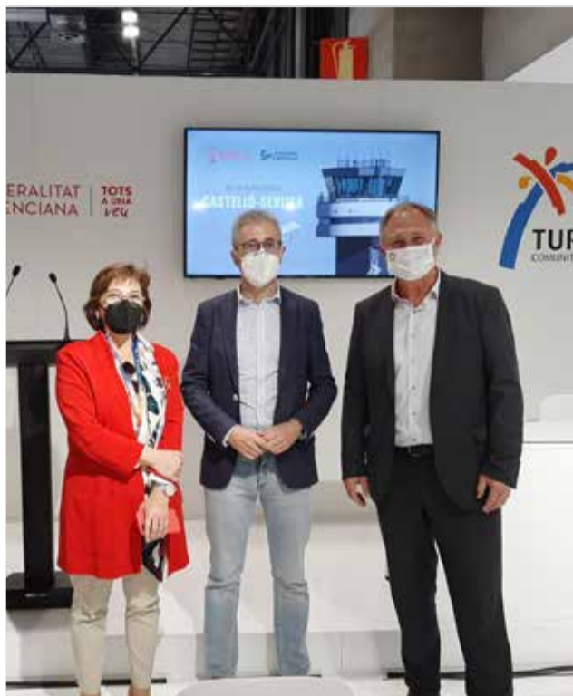
Presentación de Llíria en la feria

También se promocionará otro de los grandes reclamos turísticos que tiene la ciudad este año, como es el Mundial de Balonmano Femenino que se celebrará en España el próximo mes de diciembre. Igualmente, Turisme Llíria presentará un pequeño avance del concierto online preparado para el Sanliurfa Spring Music Festival, organizado por esta ciudad turca y que estaba