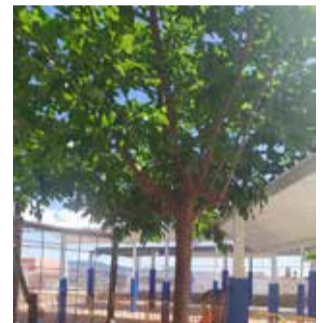
Pilares / EPDA