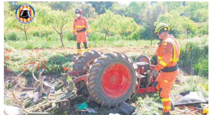
Bomberos en el lugar del accidente.