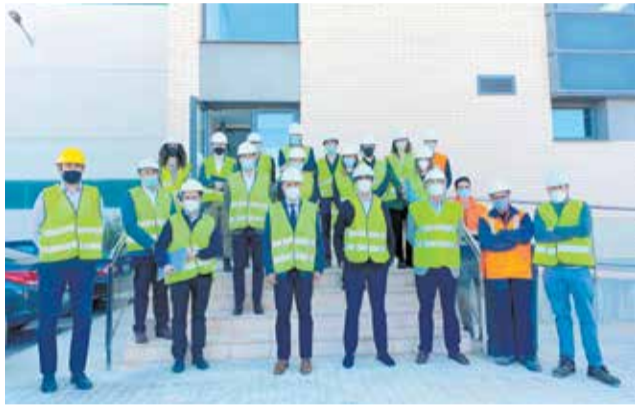
Visita de los técnicos de Mercadona.

Durante el encuentro se han cumplido los protocolos anticovid y se ha dividido