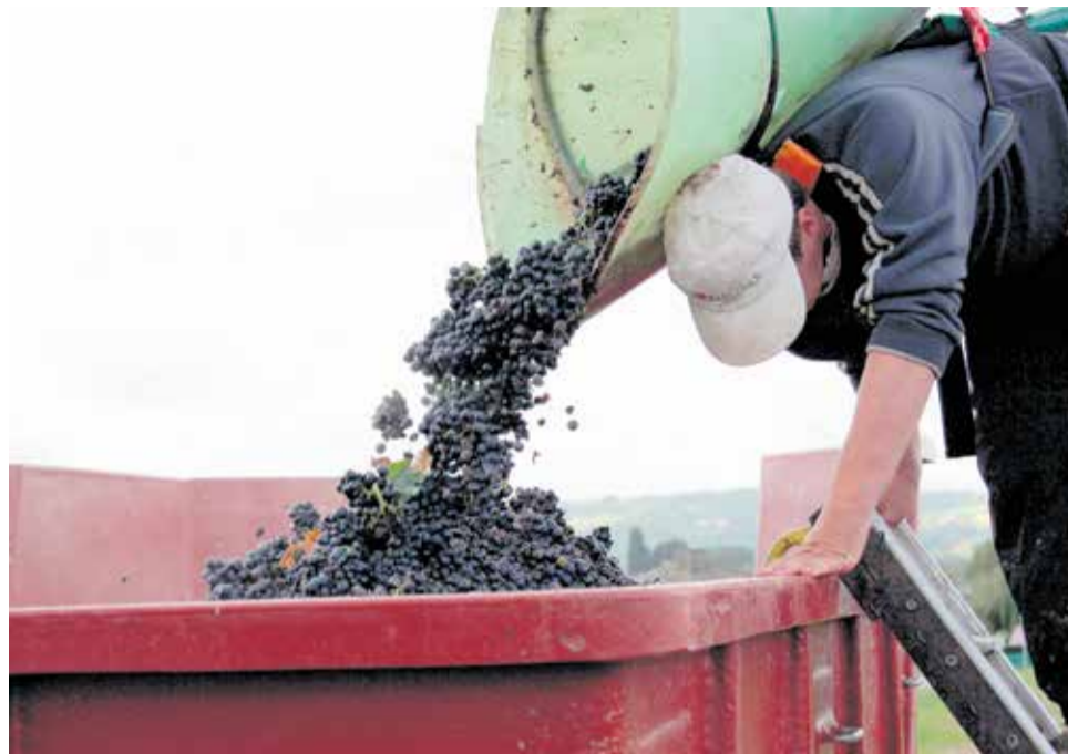
Un agricultor vendimia uno de los campos de Utiel.

Se trata de una de las líneas de ayudas incluida en el plan de choque municipal que el consistorio utielano ha puesto en marcha para mitigar el