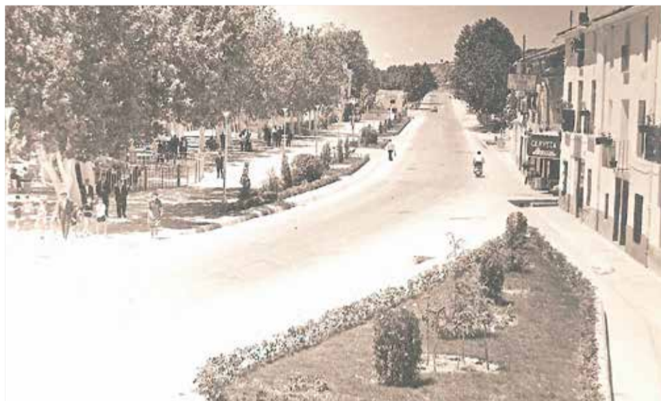
Restaurante Casa la Abuela de Caudete de las Fuentes.

En esa misma vía nos encontramos con otros negocios centenarios como Casa Valeriana y la Farmacia Iranzo . Esta última fue fundada en 1916 y es la farmacia más antigua de Requena además de una de las más antiguas de la Comunidad Valenciana. Por su mostrador, que todavía hoy mantiene la esencia de sus orígenes, han pasado tres generaciones de farmacéuticos adaptándose a los tiempos y combinando profesionalidad e iniciativa para seguir ofreciendo a sus pacientes todos los servicios que la sociedad del siglo XXI demanda. Casa Valeriana , por su parte, data, al menos, de 1903 y sus actuales propietarios continúan con el negocio que pusieron en marcha sus antepasados y en el que siguen ofrecien-