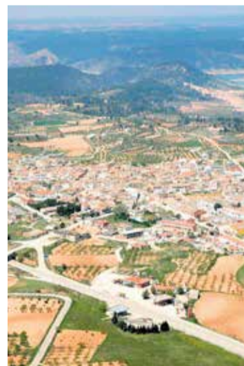
Vista aérea del pueblo.

En segundo lugar, pero no por ello menos importante es el grave peligro de incendio que generan este tipo de parcelas en semiabandono, donde los restos de vegetación seca, botellas, latas, etc. pueden convertirse en auténticos