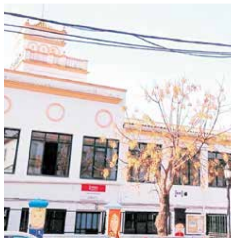
Fachada e interior de una de las aulas de la Escuela Oficial de Utiel.

De la misma manera, es importante que los candidatos revisen el protocolo Covid-19 establecido para evitar aglomeraciones y situaciones que pongan en riesgo la salud pública. Así mismo, desde el centro animan a enfatizar en la importancia de llevar las mascarillas correctamente colocadas, que mantengan la distancia de seguridad durante to-