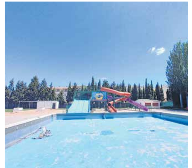
Trabajos de mejora en la piscina municipal.

"Desde el Ayuntamiento de Utiel apelamos una vez más a la concienciación y a la responsabilidad ciudadana y solicitamos la colaboración de todos para que, en el caso de detectar cualquier acto incívico, lo pongan en conocimiento de la Policía Local para actuar cuanto antes frente a estos comportamientos delictivos", han concluido los responsables del equipo de gobierno.