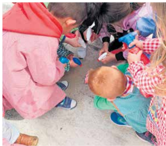
Escuela infantil de Venta del Moro.

de incorporar el servicio y favorecer así el arraigo. En total, el próximo curso se ofrecerán más de 18.000 plazas en 900 aulas de estas características en toda la Comunitat Valenciana.