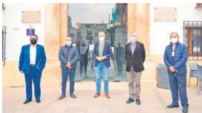
Visitas oficiales de los consellers Arcadi España y Gabriela Brava a Utiel.

Judicial en Utiel. Bravo También aseguró, entre otras medidas, que la Generalitat Valenciana asumirá el coste de los traslados de las víctimas de violencia de género mediante taxis