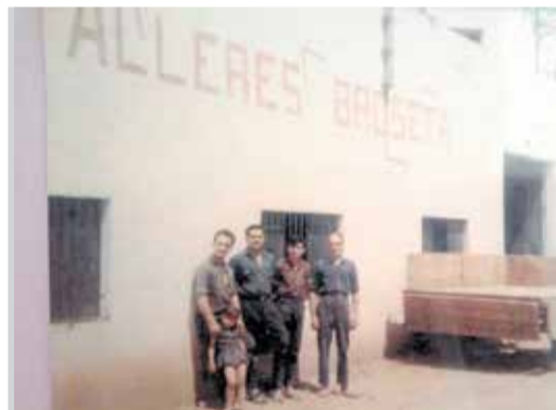
Talleres Broseta de Utiel.