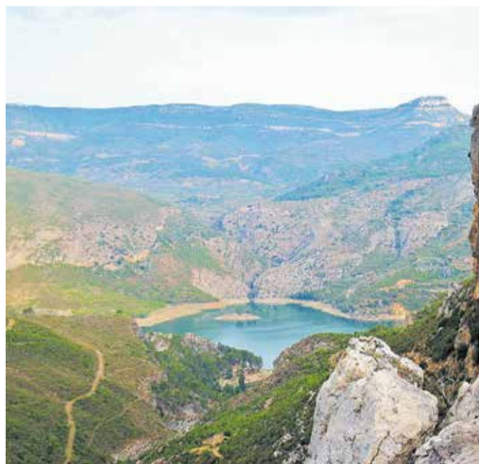
Vereda del barranco de la Hoz. / ENCHERATE

El Risco del Fraile fue escalado por primera vez en 1948 por una mujer valenciana de un Club de montaña y, desde entonces, se ha convertido en un símbolo de los escaladores valencianos de la época, así como los senderos y antiguos caminos que eran utilizados por los montañeros para acceder al Risco y a otras montañas de Chera.