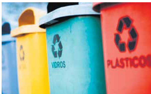
Contenedores de reciclaje. / EPDA