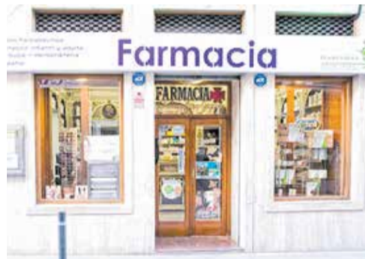
Farmacia Iranzo de Requena.