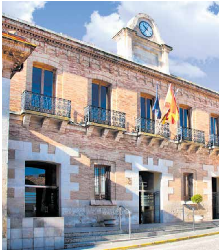
Fachada del ayuntamiento de Camporrobles.

Camporrobles, por tener una población inferior a los 1.500 habitantes ha recibido una asignación de la Diputación de Valencia de 3.414,66 euros para la elaboración de este plan cuya finalización está prevista para antes de que finalice el año.