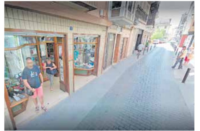
Casa Valeriana de Requena.

tención de vender productos relacionados con los vinos y la música "pero la clientela ha sido la que al final me ha hecho mantener la mercería".