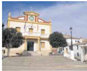
Ayuntamiento de Sinarcas.