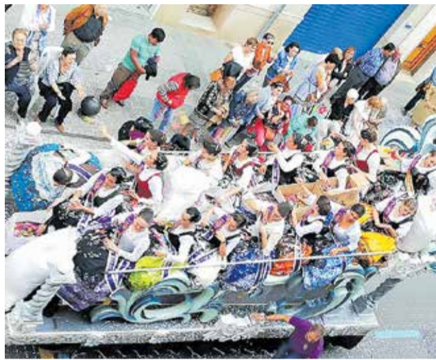
Última edición de la Feria y Fiestas, en 2019.

El objetivo principal es garantizar la salud y la seguridad de la ciudadanía en un momento en el que, a pesar de la baja incidencia del virus, la celebración de este tipo de eventos podría conllevar graves riesgos.