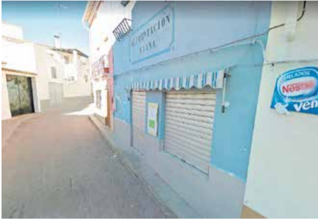
Alimentación Viana de Caudete de las Fuentes.