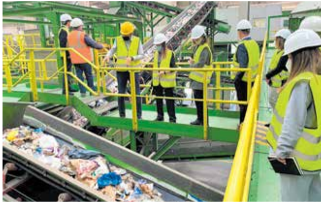
Planta de tratamiento de residuos de Caudete.

a las personas visitantes en dos grupos, de manera que la visita guiada por la planta se ajustara a las necesidades de los asistentes. Los grupos han recorrido la nave de triaje, donde se ha puesto el foco en la selección de envases en pretratamiento y donde se