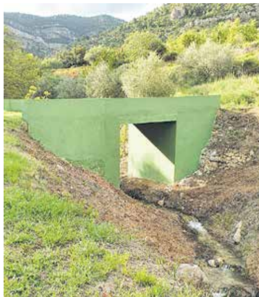
Puente de la Puentequilla.

diciones posibles y por la que es considerada una de las localidades preferidas por los aficionados al turismo sostenible.