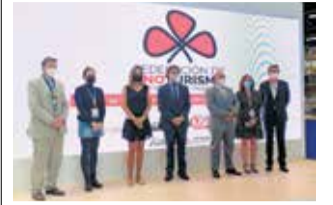
Acto de presentación.