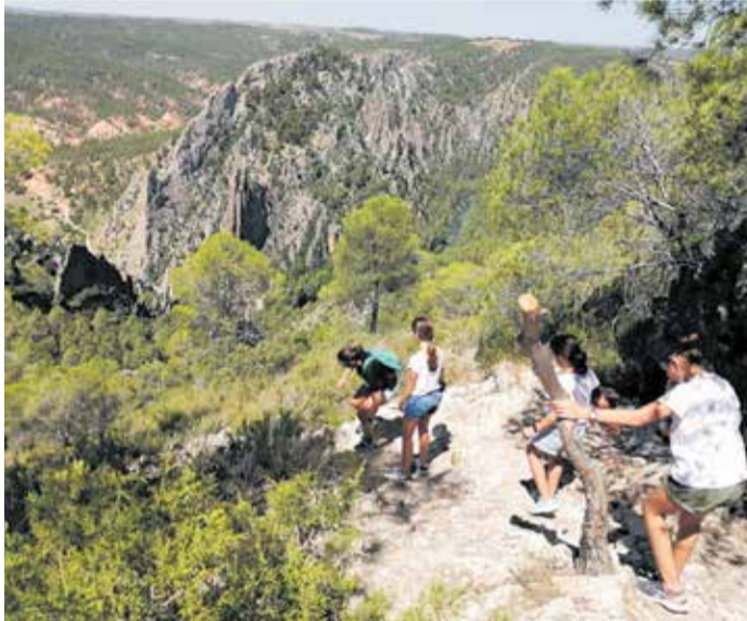
Senderistas en la ruta morada de las Hoces.

No ha sido esta la única iniciativa realcionada con el parque