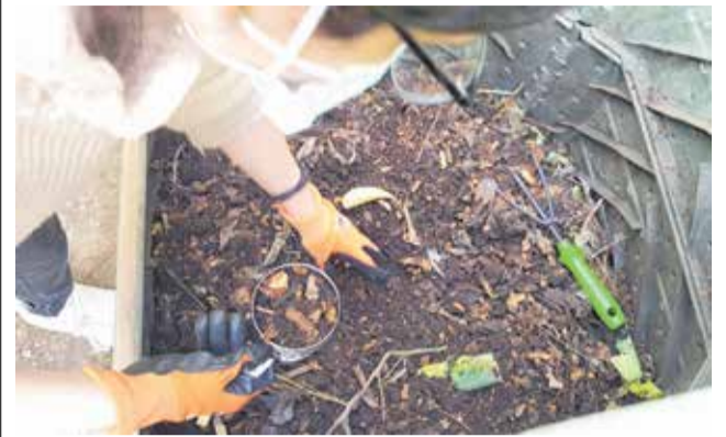
Programa de compostaje del CVI. / EPDA