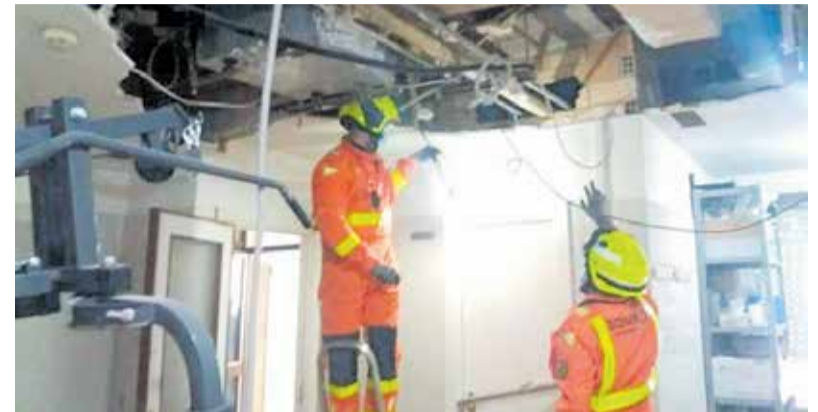
Bomberos del parque de requena revisan la zona afectada.

Hasta el lugar del accidente se trasladaron los bomberos de Requena, Chiva, bomberos voluntarios de Sinarcas y el sargento de Requena. Tras conseguir liberar al hombre, lo trasladaron posteriormente al hospital en un helicóptero medicalizado de la Generalitat Valenciana