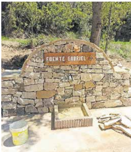
Fuente de Gabriel.