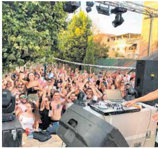
Baile del vítores de 2019 y IV Out Cycling Event, dos 'clásicos' de Fuentes de Andalucía antes de la pandemia.

Álvarez incidió en el aspecto emocional pero también en el económico y en la necesaria dinamización del municipio para no ahon-