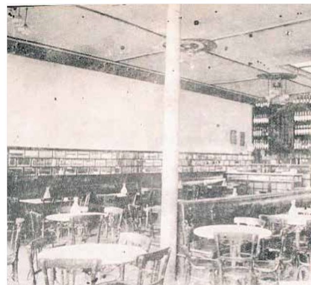
Café-Salón Pérez de Utiel.