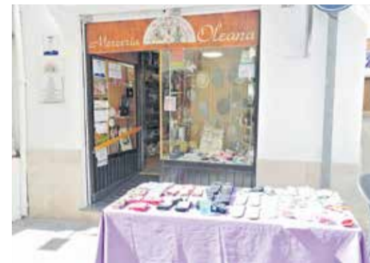
Mercería Oleana de Utiel.