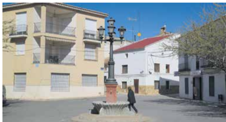
Plaza Enrique Pedrón, en Fuentes de Andalucía.