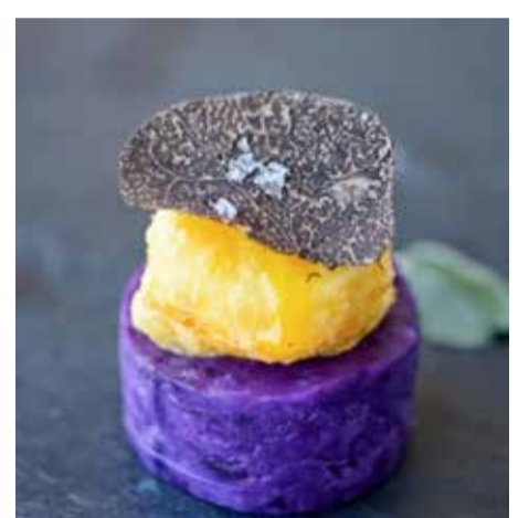
Patata violeta con yema.