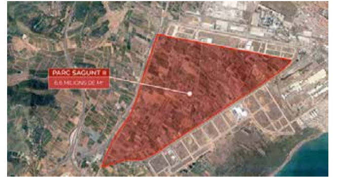
Parc Sagunt II. / EPDA