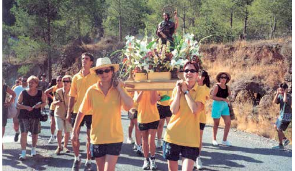
Fiestas de Estivella en verano en una imagen de archivo.

La Mancomunitat de les Valls, a diferencia, todavía no ha mantenido ninguna reunión formal al respecto. Algunos de los alcaldes que la conforman se reunieron la semana pasada, aunque no se tomó ninguna decisión. Tienen previsto citarse a lo largo de las próximas semanas, tal y como confirma El Periódico de Aquí . Propondrán celebrar sus fiestas, aunque, eso sí, con alternativas culturales con el obje-