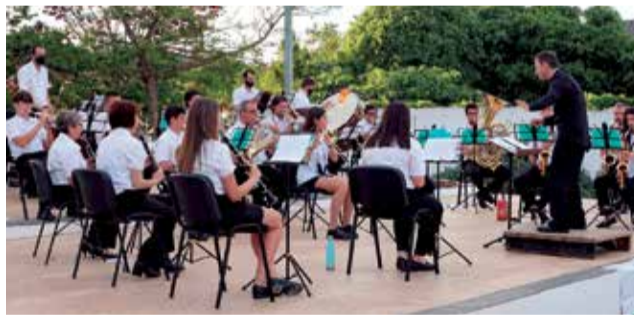
Concert benèfic contra el càncer.

L'actuació benèfica va tindre lloc al pati del musical i va assistir un representant de la Junta Provincial. Esta actuació és la primera que realitza la banda després de l'estat d'alarma. L'acolliment va ser destacable.