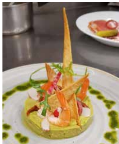
Guacamole con gambas.