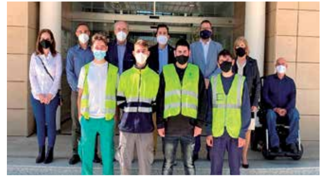
Els estudiants de Formació Professional.