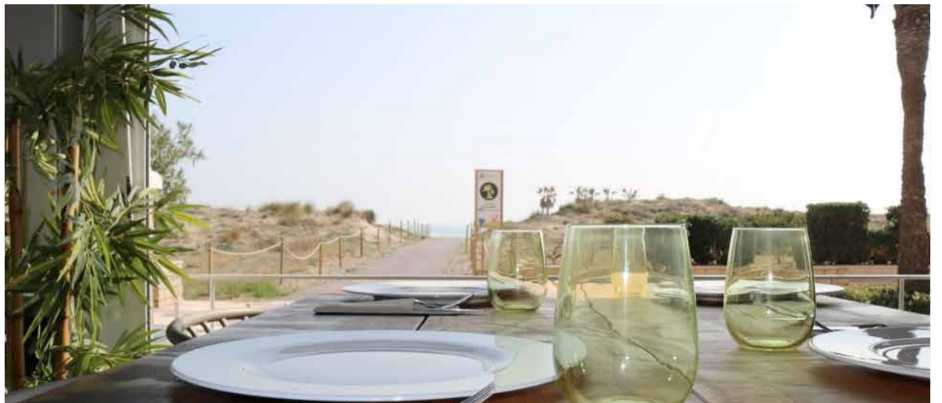
Terraza del restaurante Saoco, en pleno paseo marítimo de Canet.

Pero el verano del 2021 se prevé mucho mejor. Con una parte importante de la sociedad ya vacunada, con menos restricciones y con mucha más responsabilidad y concienciación, las fuentes consultadas por El Periódico DE AQUÍ en distintos sectores comerciales de Canet d'En Be-