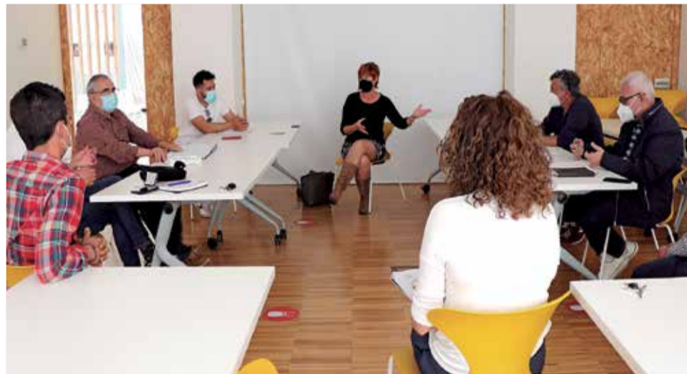
Reunión entre la concejala de Fiestas de Sagunt y las Federaciones de Peñas.

“La actividad festiva como fiestas patronales no está permitida”