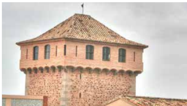
Torre de Gilet / EPDA

ta d'accés, de gran espessor i orientada al sud, està totalment coberta de planxa de ferro. Al costat nord hi havia una casa adossada i en la façana sud, hi ha un cridaner rellotge de sol.