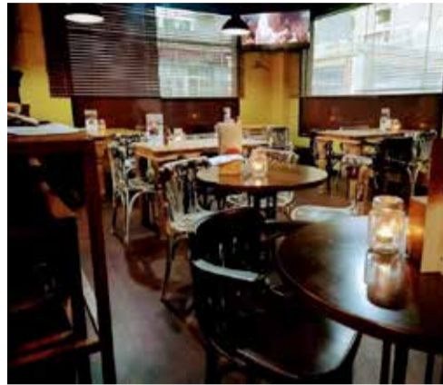
El interior de Molly Malone's.