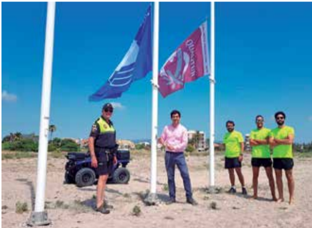
Playa en Sagunt.

nas, del esfuerzo del personal del Departamento de Playas, de Turismo, de la Policía Local, de la plantilla profesional de Salvamento y Socorrismo y personal del servicio de Playa Accesible, y de la buena gestión y limpieza gracias a la empresa pública municipal, a la SAG». A lo que añadió que la inversión que se hace año tras año desde el Equipo de Gobierno, «hace que tengamos unas playas excepcionales, de las mejores de la Comunitat Valenciana, y sin duda, también, de las mejores playas de España».