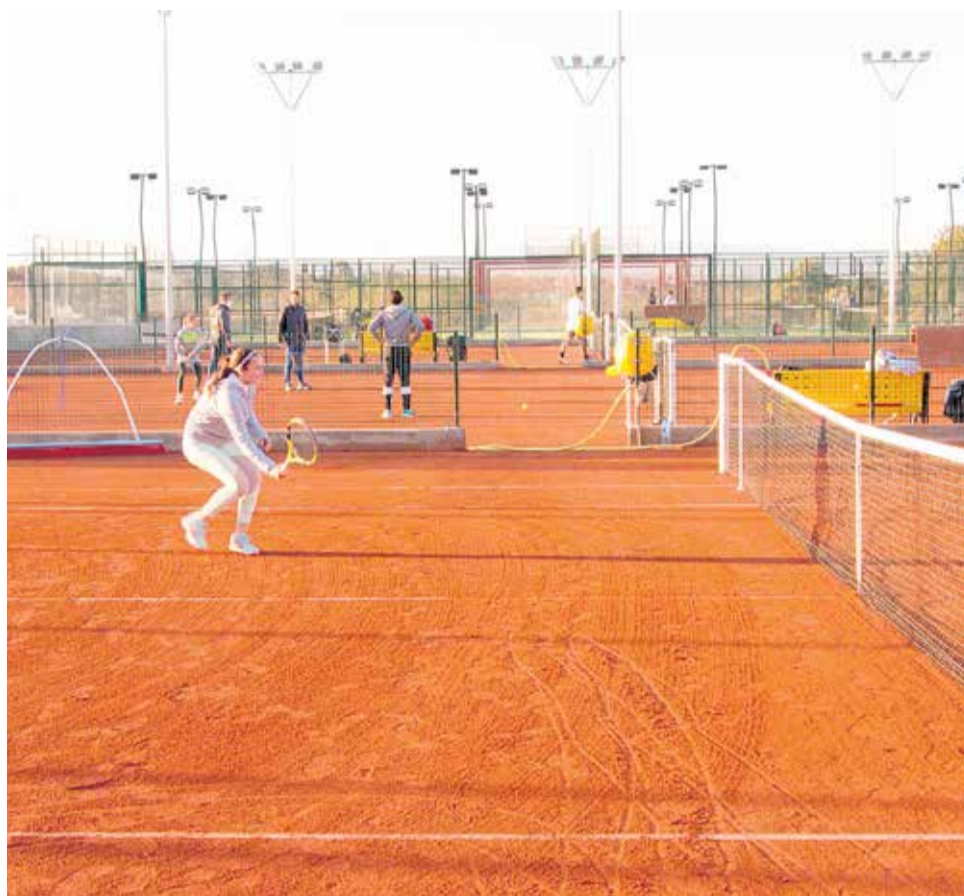
Curso de verano de Camarena Canet.

Para los más pequeños desde 4 meses hasta 3 años tiene preparado un curso exclusivo, con especialistas de Infantil, su “Baby Summer” es