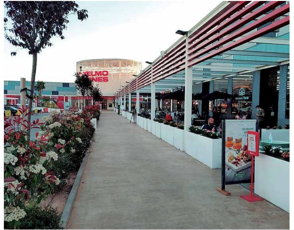
Parque comercial Vidanova Parc.

La promoción concluirá el día 11 de julio de 2021 o hasta agotar las existencias de las 2.500 entradas. ¿A qué esperas?