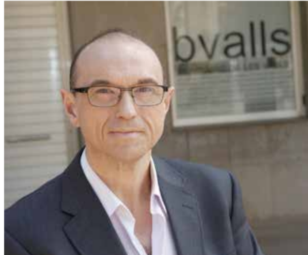
El alcalde de Benifairó de les Valls.

► Sí, mucha: al Gobierno del Estado, a la Generalitat Valen-