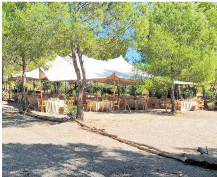
El Espai Les Panses, en Albalat dels Tarongers, uno de los mejores restaurantes de la comarca.

Entre el valle y la montaña, en la comarca del Camp de Morvedre, se encuentran las subcomarcas de Les Valls y de La Baronia. En ambas, con municipios muy queridos, encontraremos lugares recónditos, paisajes, naturaleza, fuentes y un comercio tradicional de toda la vida, donde se atiende con ese trato personal y esa sonrisa impagables. Cuando viajamos al extranjero, nos encanta conocer cualquier rincón, cualquier municipio con sus peculiaridades, y en muchas ocasiones desconocemos nuestro entorno más próximo. Si vamos a Les Valls, vamos a disfrutar de los hornos tradicionales, de las floristerías, bares, cafeterías y restaurantes como los que ofrecen Faura, Benifairó de les Valls, Quart de les Valls, Benavites y Quartell. Con entornos como la Rodana, la torre de Benavites, la Font de Quart... Con calles por las que pasear tranquilamente haciendo turismo, fotografiando rincones que nunca hubiésemos imaginado que tendríamos tan cer-