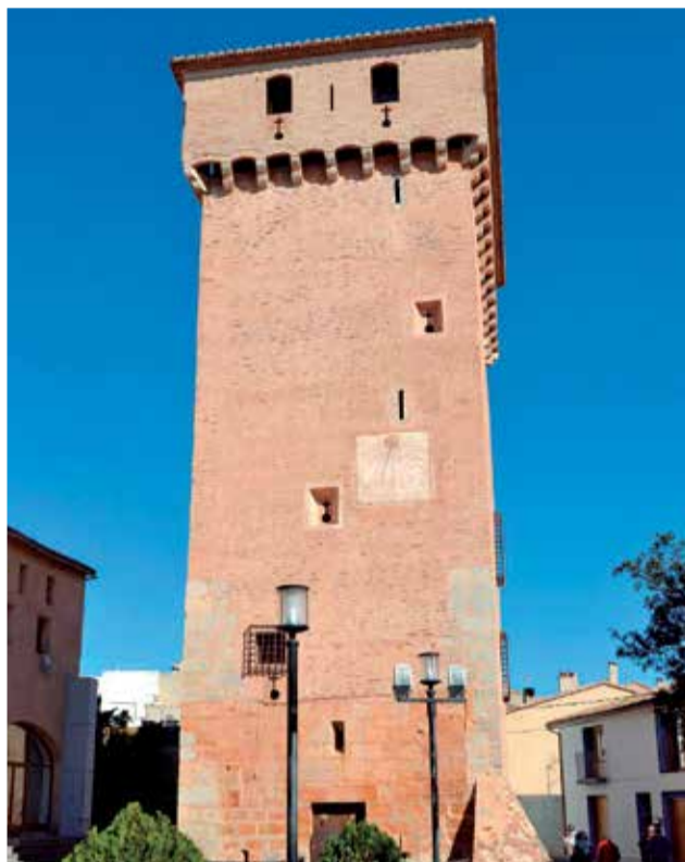
Torre de Benavites.

La torre, de més de 22 metres d'altura, està clarament preparada per a l'ús d'armes de foc, com testimonien les seues espitlleres. La por-