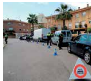
Control en Sagunt.