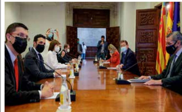
Reunió entre alcaldes y miembros del Consell.