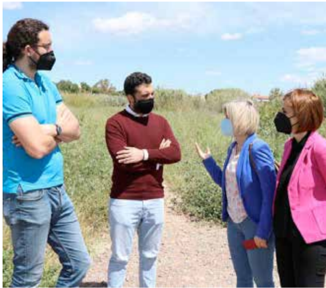
Directora general de costas, alcalde y miembros / EPDA