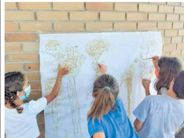
Curso de verano de Mas Camarena Canet.