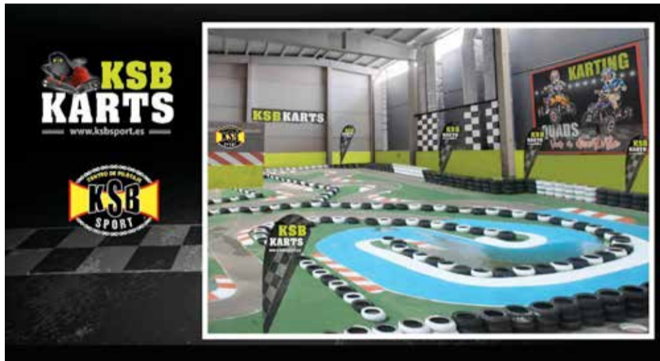
KSB Karts, una de las nuevas aperturas en l'Epicentre.

Gracias a empresas como el Grupo Inditex que han apostado por el L'epicentre, han logrado el mayor crecimiento de la zona en los últimos años. Lo han hecho apostando por el desarrollo comercial e Industrial.