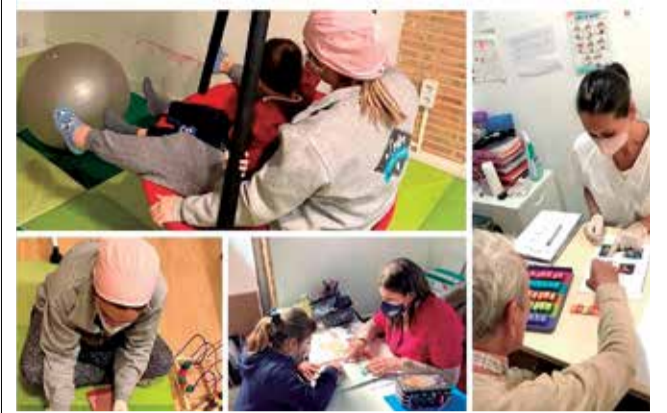
Personas con diversidad funcional en terapias.