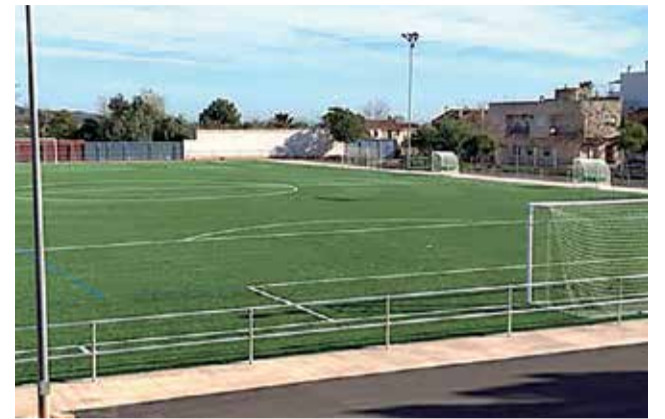
Camp de futbol de Benifairó de les Valls.