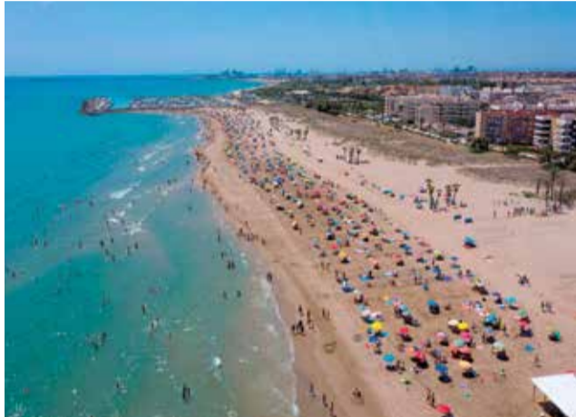
Playa en Canet d'en Berenguer.