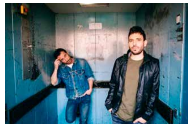
Promoción del concierto Ciudad Jara.

tado de alarma ni se habían suavizado las restricciones y tampoco se sabía hacia dónde evolucionarían las medidas. Por eso desde la Delegación de Cultura se decidió, por precaución y seguridad tomar como referencia las medidas de seguridad que estaban activas en el momento.