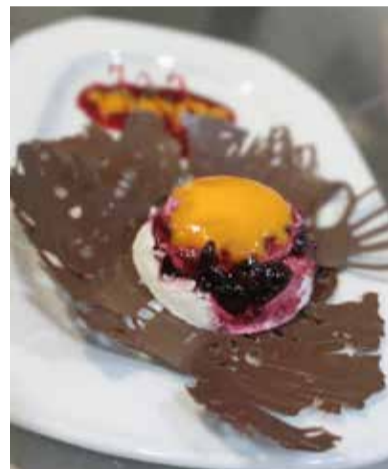
Postre Pasión Guillermo.