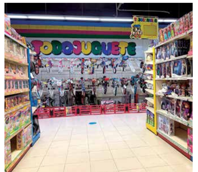
Una tienda de Todojuguete.

Además, os acompañarán desde el nacimiento de vuestro peque con Todobebé, su sección de puericultura donde encontraréis todo lo necesario para comenzar el maravilloso mundo de ser papá/mamá. Su selección de marcas son sin duda una garantía de calidad, seguridad y comodidad tanto para vosotros como para vuestro bebé.