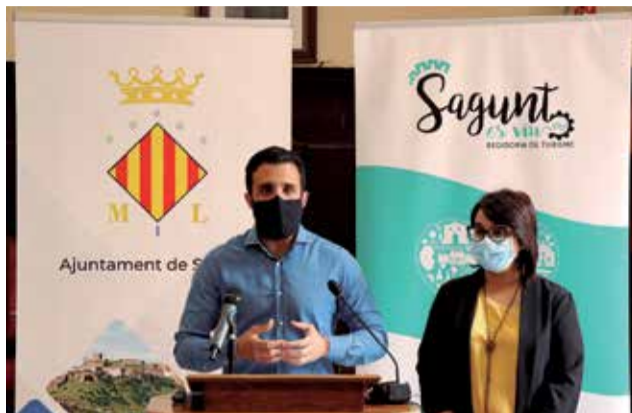
L'alcalde de Sagunt i la regidora de Turisme.

El mes de maig és el mes Urban Art a Sagunt. Es pot visitar en qualsevol moment de l'any, però durant este mes es realitzen visites especials, tallers, degustacions, descomptes... La Ruta té com a base