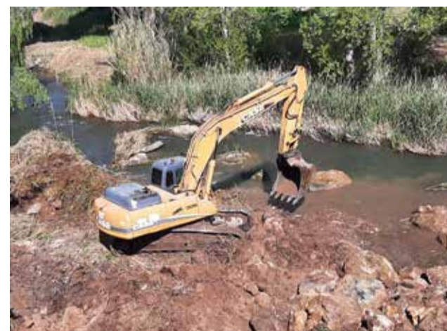
Máquina trabajando en el cauce.

Emergencia Climática y Transición Ecológica, para alcanzar los objetivos medioambientales recogidos en el Plan Hidrológico del Júcar, en tramos fluviales situados en zonas de la Red Natura 2000 y que presentan alto riesgo de incendio forestal. La Consellería de Agricultura se encargará del mantenimiento de las coberturas durante su permanencia en las riberas.