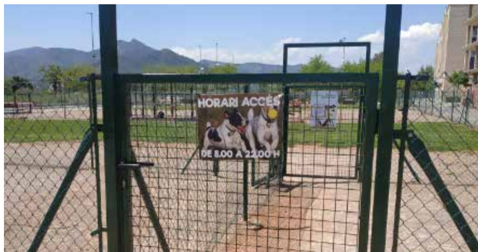
Parc caní de Nules.

Amb tot, Nules compta amb un total de cinc parcs canins ubicats en diferents punts, tant al poble com a la zona marítima, amb els quals es vol donar servei al conjunt de la ciutadania propietària de mascotes.