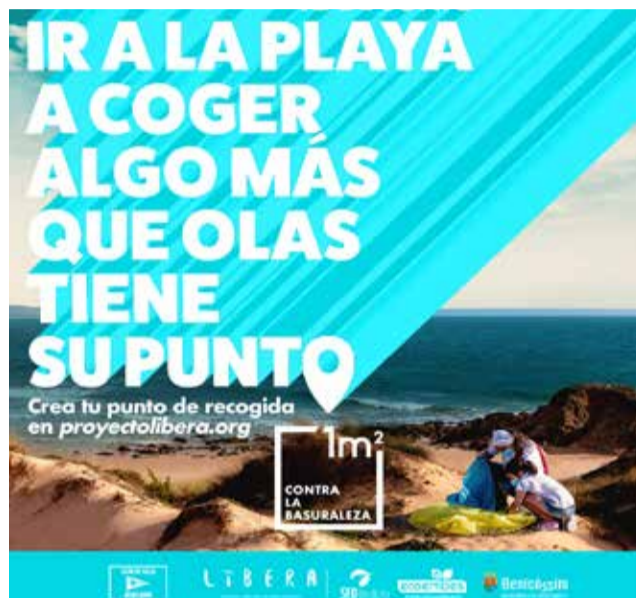
Imagen de la campaña.

En el caso de Benicàssim, se procederá a limpiar las playas y se han creado cuatro puntos de recogida de basura: dos en la playa Heliópolis, uno en Els Terrers y un cuarto en la