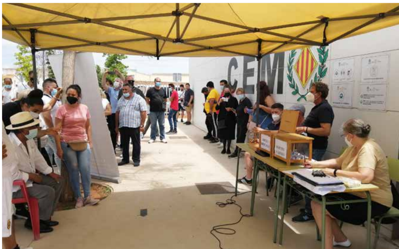
Sorteig al mercat.

En el cas del cap de setmana, el mig centenar de llocs de fruita i verdura recuperen la seua ubicació pre-covid a l'avinguda del Cardenal Tarancón, mentre que els 90 llocs de roba i comple-