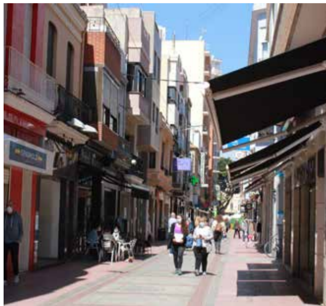
Comercios en Burriana.

El gobierno municipal impulsa por primera vez este programa de ayudas y, para ello, suscribirá un convenio con la Confederación de Comercio de la Comunitat Valenciana para la gestión de los bonos para el comercio. Previamente, el Pleno del próxi-