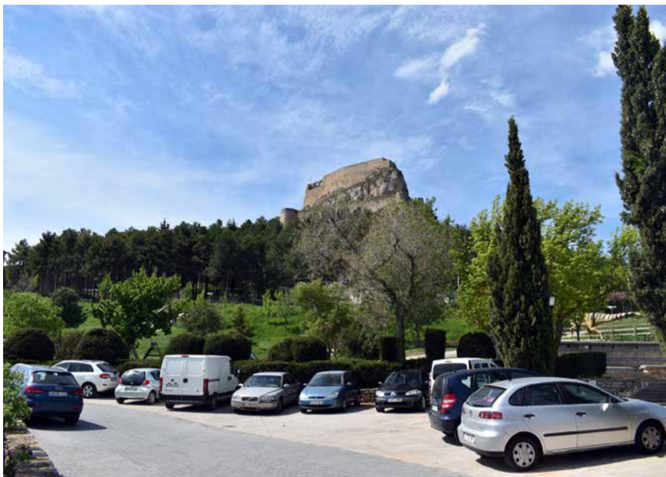
Vehículos residentes y autorizados.