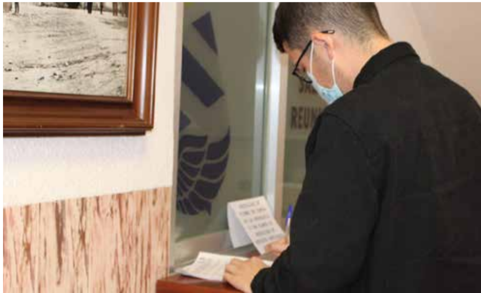
Recollida de firmes.

La finalitat de aquesta recollida de firmes és traslladar a la Generalitat Valenciana l'oposició i el malestar dels veïns davant aquest projecte que "incompleix el Pla General d'Ordenació Urbana de l'Alcora", per la qual cosa demanden a la Conselleria que anul·le el procediment i arxive l'expedient, doncs, "en cas contrari, s'estarà vulnerant