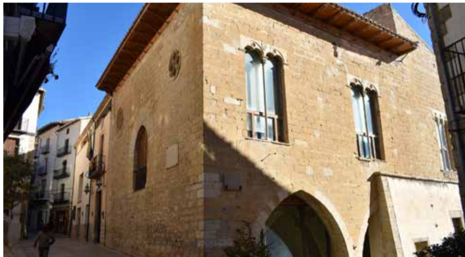
Ayuntamiento de Morella. / EPDA

las características de las diferentes autorizaciones y como solicitarlas». Finalmente, ha remarcado que «recordamos que hasta el 15 de septiembre tienen validez los distintivos actuales y que, para hacer el cambio, tienen