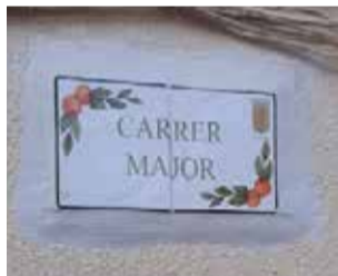
Pie de foto.