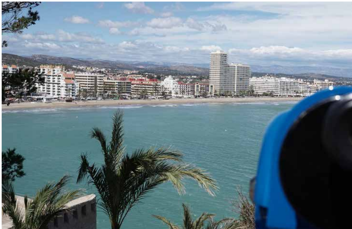
Mirador en Peñíscola.

12. Vive una preciosa experiencia en el Santuario de la Balma, un santuario dentro