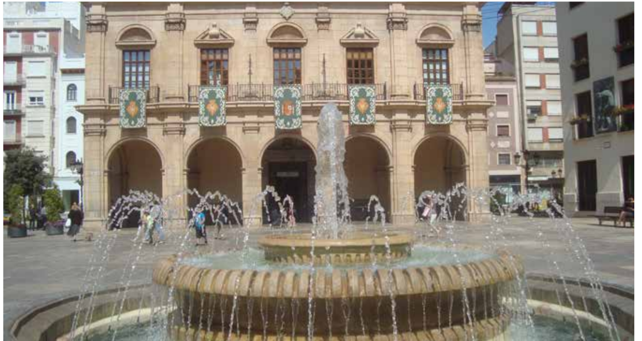
Ayuntamiento de Castelló. / EPDA

LA ALCALDESA DESTACA QUE ESTO APORTARÁ NUEVAS HERRAMIENTAS PARA EL FOMENTO DEL RESPETO Y LA CONVIVENCIA LOCAL