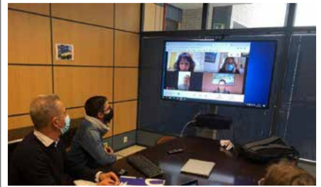
Reunió telemàtica.