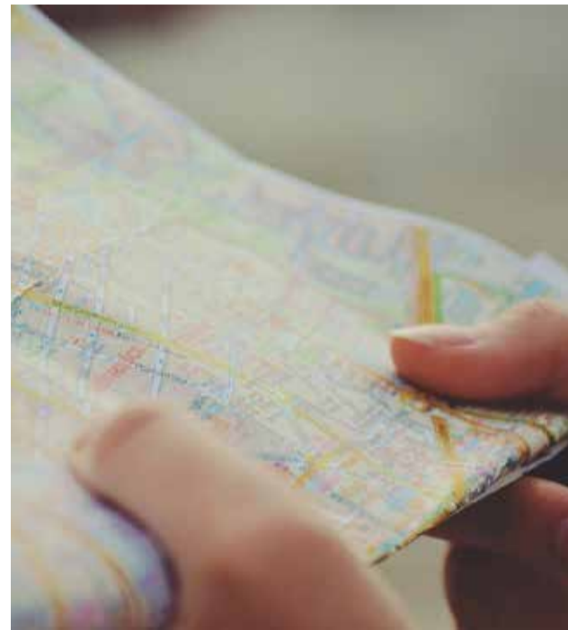
Servicios turísticos.

El coste total máximo de ejecución de las actuaciones asciende a 150.000 euros. La Asociación Intermunicipal