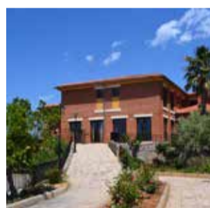
Centro de día.