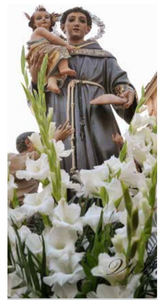
San Antonio.

dos conciertos que ofrecerá la Unión Musical de Sot de Ferrer los días 6 y 13, una zarzuela en la tarde del día 12 y que culminarán con la celebración del Festival ZigZag los días 25, 26 y 27 de junio. Este año celebraremos la III edición de este festival en el que se pone en valor a artistas comarcales, se habla de respeto al medio ambiente y en el que la mujer adquiere gran protagonismo. En esta edición de las fiestas los actos van a ser restringidos al aforo correspondiente al local o espacio en donde se realice y a la normativa vigente.