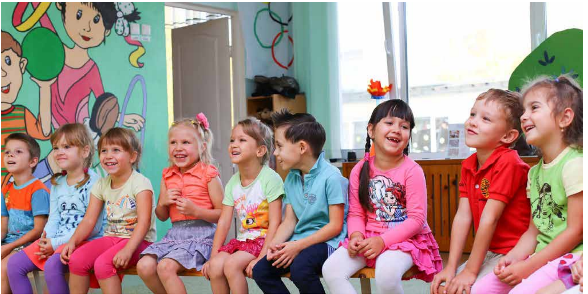
Infantes en campaña de animación en verano.