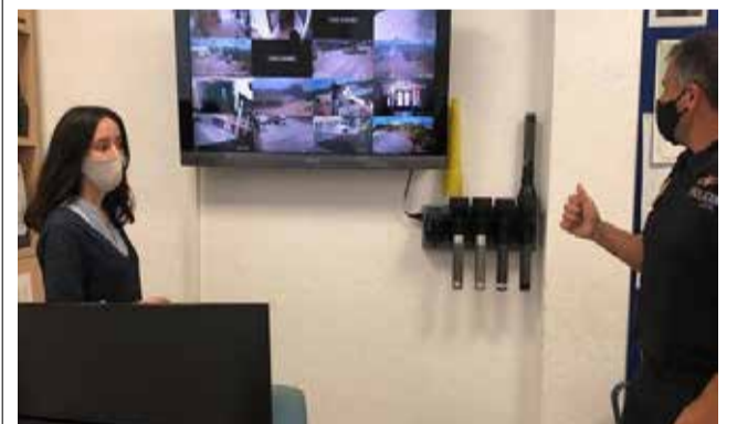
Instalación de las nuevas cámaras.