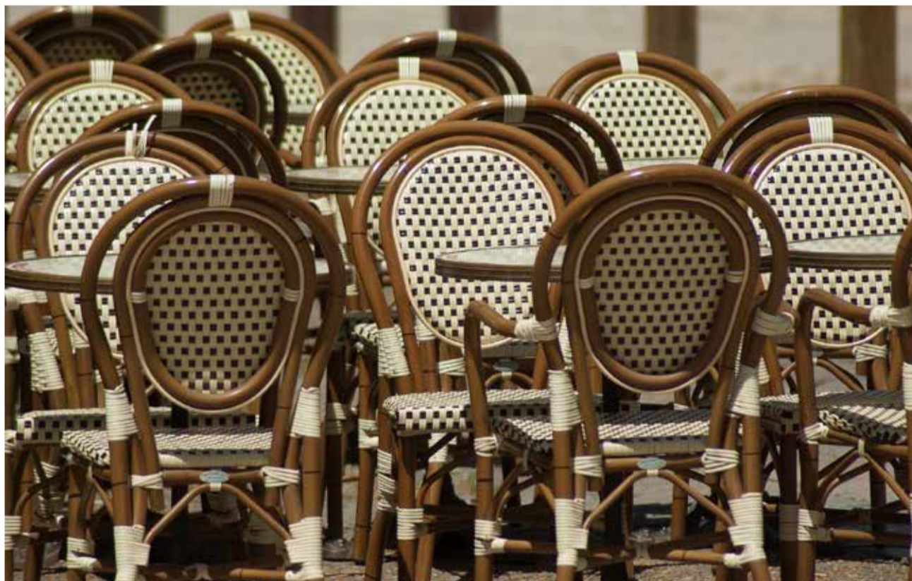
Terraza de un bar.

La alcaldesa de Castelló, Amparo Marco, ha puesto en valor las medidas tomadas por el gobierno municipal para ayudar a paliar los efectos económicos y sociales derivados de la pandemia y para contribuir a la reactivación de la economía local. "Desde el Ayuntamiento hemos impulsado ayudas directas e indirectas para ayudar a los vecinos y vecinas de