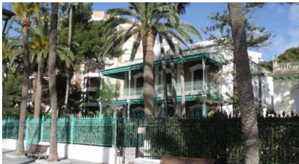
Ruta de las Villas en Benicàssim.

de la montaña. Una creación que roza el milagro.