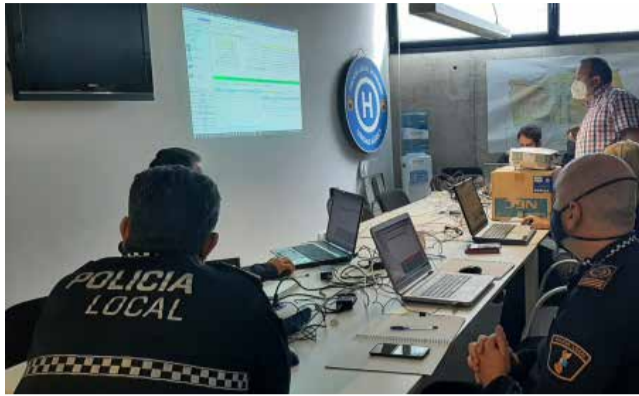
Policía Local de Burriana.