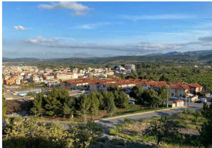
Lugar de Altura para la residencia. / EPDA