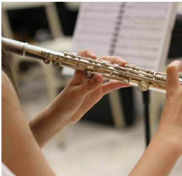
Instrumento en banda de música. / EPDA

El pleno municipal celebrado ayer tarde dio luz verde al trámite de la misma solicitud, a través de una