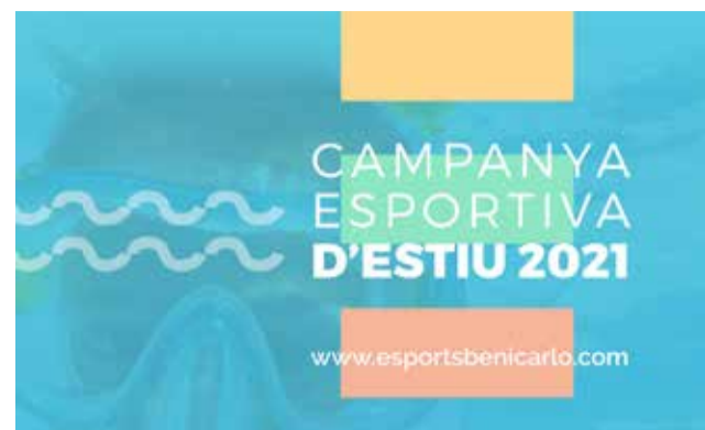
Cartell de la campanya.