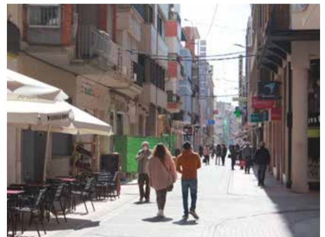
Calle comercial en Burriana.

Así, se repartirán regalos como bidones, balones de