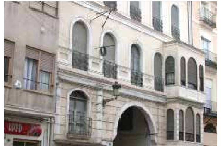
El centro de Segorbe se ubicará en el Garaje Aragón.

EL PLAN 'CONVIVINT' DE INFRAESTRUCTURAS DE SERVICIOS SOCIALES 2021-2025 CONTEMPLA INVERSIONES EN 14 POBLACIONES DE LAS COMARCAS DEL PALANCIA Y MIJARES