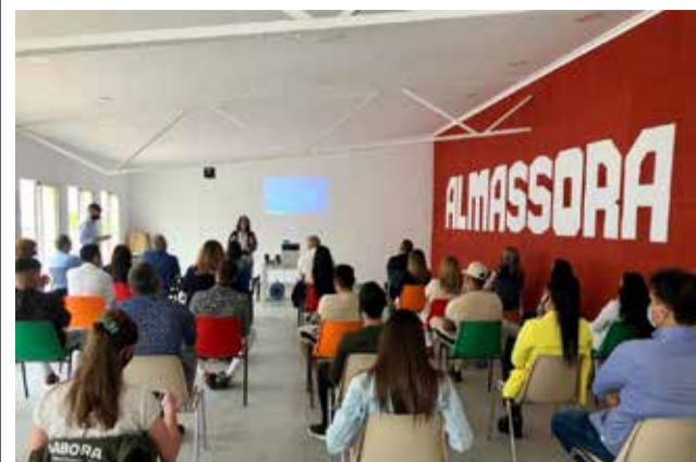
Estudiants d'Almassora.