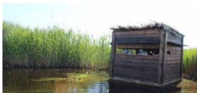
Observatorio de aves.