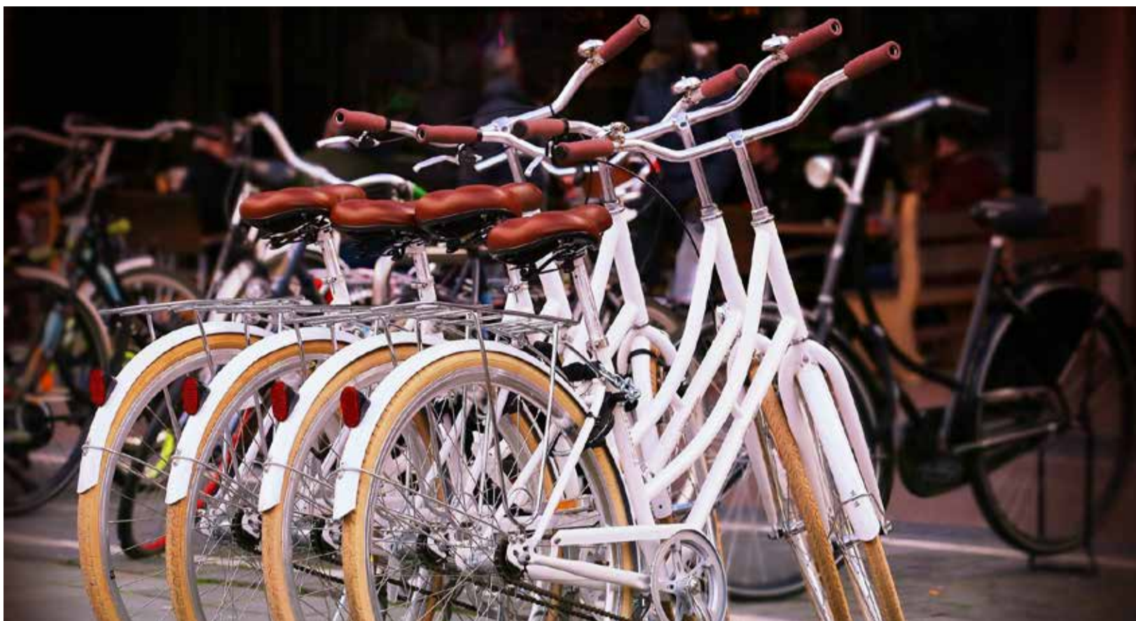
Bicicletas en la calle.