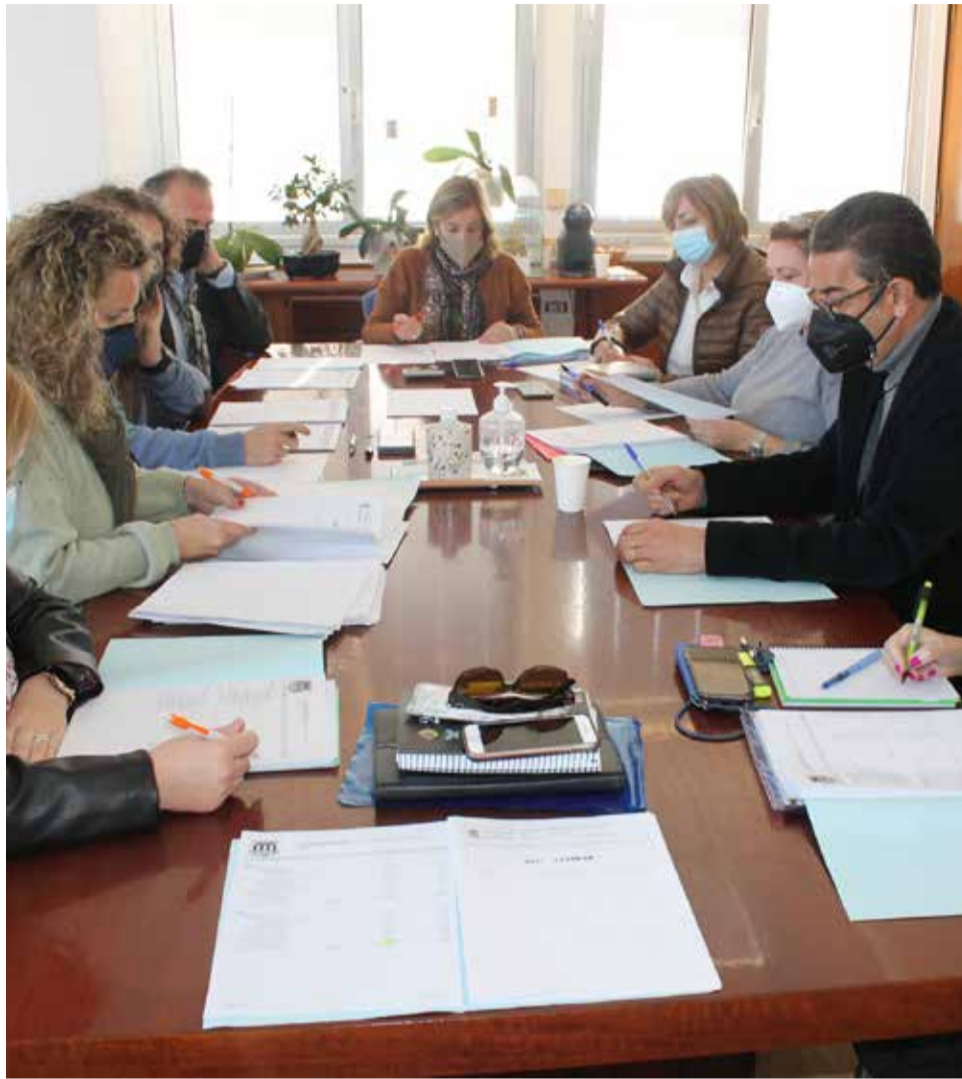
Reunión del equipo de gobierno.

Con motivo de la pandemia, se ha puesto de relieve la precariedad de las instalaciones actuales para dar respuesta y atención a la ciudadanía con la mejor calidad del servicio. Se deben contar con nuevos es-