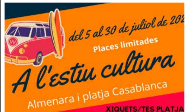
Cartel de los cursos de verano.