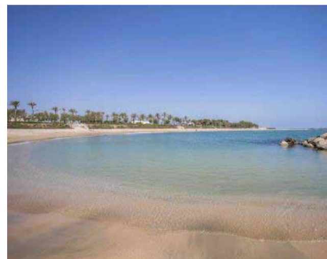
Platja de Vinaròs.

L'objectiu d'aquesta temporada és que per a la Fira i Festes de Sant Joan i Sant Pere es puguin prestar tots els serveis amb total normalitat.