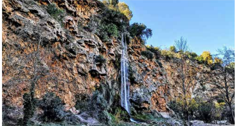
El Salto de la Novia, en Navajas.

41. Da un paseo nocturno por Marina D'Or para disfrutar de su llamativa iluminación, ¡es un plan magnífico para una noche de verano!