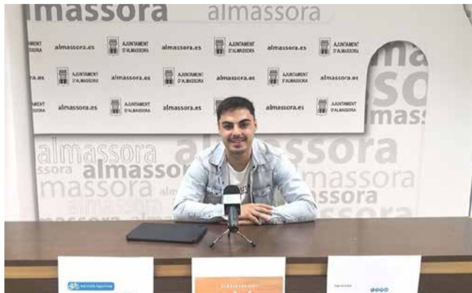
Presentació de las activitats. / AUTOR FOTO

Els possibles participants hauran d'acudir a la piscina coberta des de dilluns que ve fins al dissabte 12 de juny per a recollir el número que els permetrà participar en el sorteig de les activitats. El dimarts dia 15 d'aquest mes tindrà lloc el sorteig en les oficines del Ser-