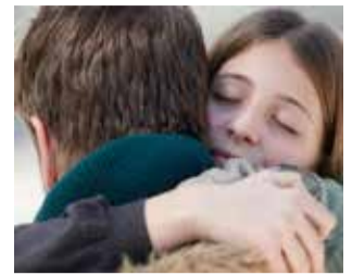
Cartell. / EPDA