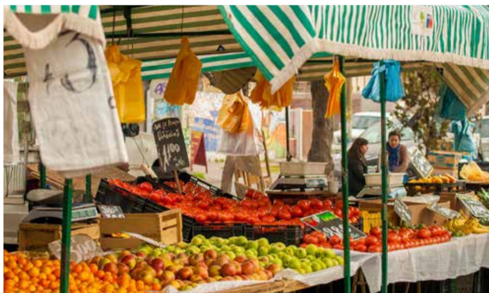
Mercat ambulant.

ments que munten a Vila-real podran traure els seus productes al carrer en una nova ubicació, que quedarà delimitada en forma de 't' des del carrer Hospital (enfrent del Convent, espai d'art), Barranquet i raval del Carme. "D'aquesta manera, s'allibera també els caps de setmana la plaça Major i s'aconsegueix