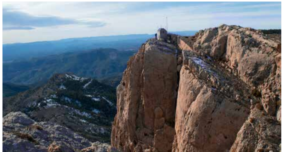
Subida al pico de Peñagolosa.

42. Si vas a Oropesa del Mar, no pierdas la oportunidad de hacerte una foto en su instagramable columpio acuático. ¡Ha causado toda una sensación!