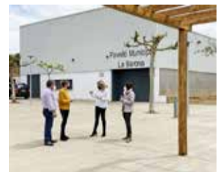
Plaza de la Barona.