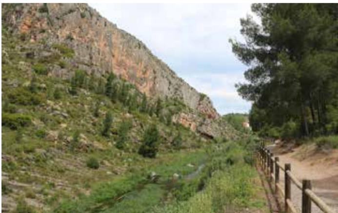
El Palancia por la Vuelta de la Hoz de Jérica.

Así ocurría con un problema cuyo origen se remonta a principios de la década de los 70, cuando la Confederación Hidrográfica del Júcar ejecutó unas obras de derivación en el río Palancia entre los términos municipales de Viver y Jérica en Castellón. En esta actuación se construyó un canal paralelo al río Palancia, por donde circulaba el agua evitando la infiltración al terreno en el cauce del río, sorteando 8,3 km del río Palancia cuyo régi-