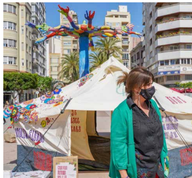
Tenda de campanya.

Des de l'ONG AIDA expliquen que les frases que es poden llegir a la tenda són de persones refugiades que van demanar a Daudy que transmetera al món, juntament amb dades i xifres que ajuden els visitants a posar-se en la pell d'aquestes persones desplaçades, acostant així la realitat de la vida de les persones refugiades.