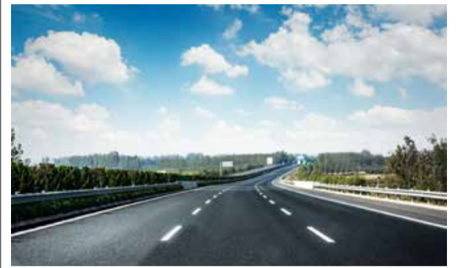
Connexió entre localitats. / EPDA