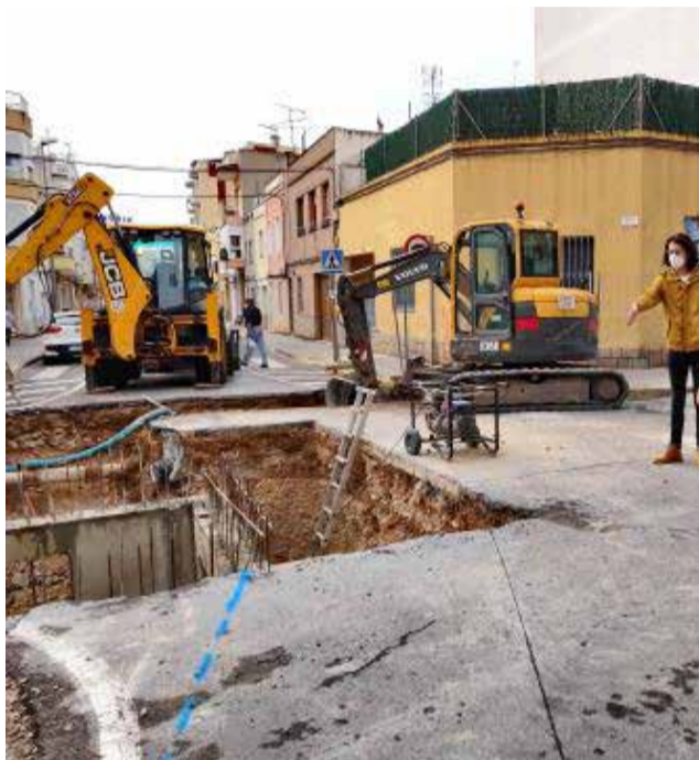
Obres dels pluvials.

El regidor Chaler, ha indicat, que "tot i les molèsties que puguen ocasionar, es tracta d'unes obres importants per a millorar els pluvials i reduir el risc d'inundacions al centre de la localitat quan es produeixen fortes pluges". Segons explicava les obres que es realitzen a l'encreuament entre les