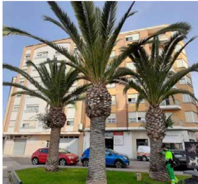
Palmeras en la rotonda.

Sin embargo, ha precisado que desde hace aproximadamente un mes se ha observado que el estado de la palmera "ha empeorado irremediable-