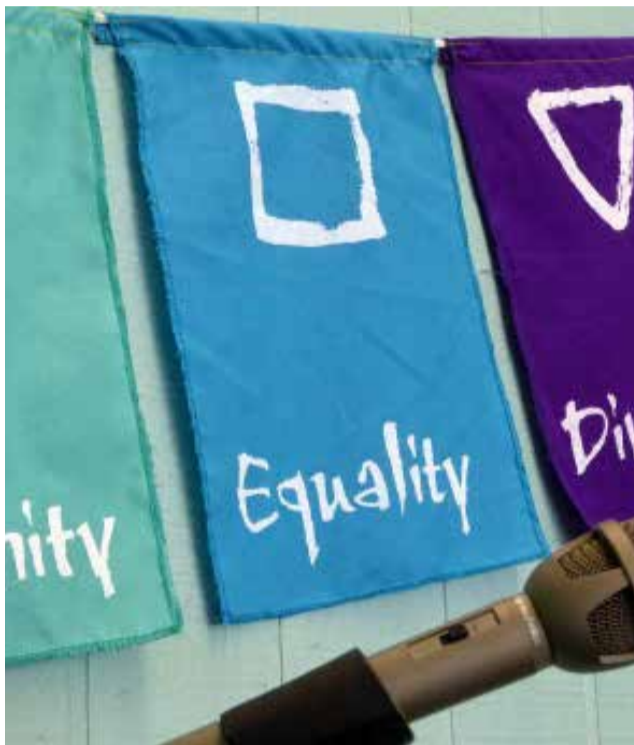
Cartel de igualdad.

Este 2021, la categoría de participación especial, llamada Premio Cultural 'Dona Coratge' y que cada año cambia de disciplina artística, se centra en la pintura. El Premio "Pinzells violeta" tiene el objetivo de promover la igualdad de género a través del arte y la pintura, con obras que potencian el papel de las mujeres en la sociedad actual. El mundo donde vivimos está formado por imágenes que nos