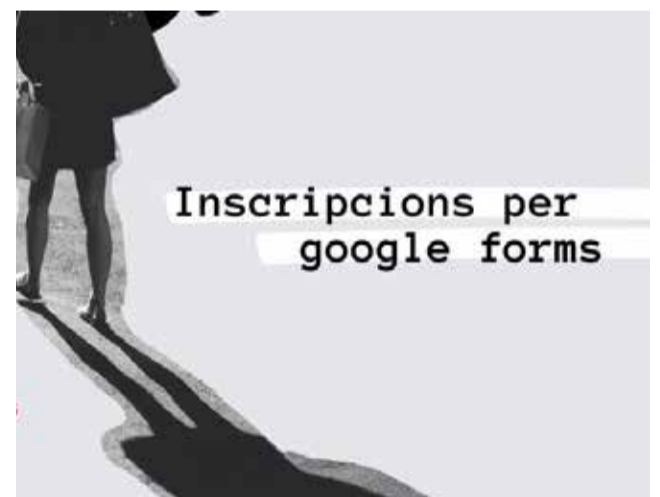
Cartell Camí a casa.

Las plazas son limitadas hasta el 10 personas.