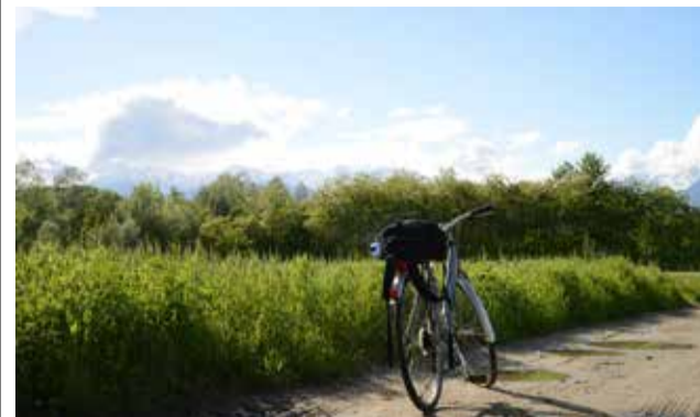
Bici al camp.