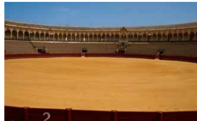
Plaza de toros.