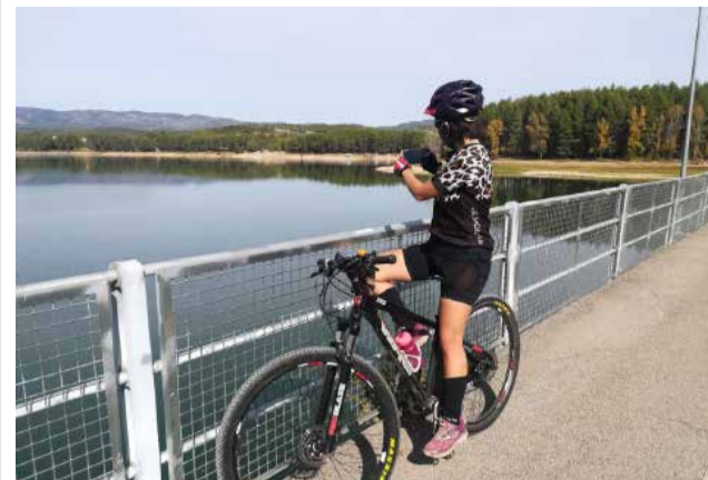
Pantano del Regajo, parada obligada.