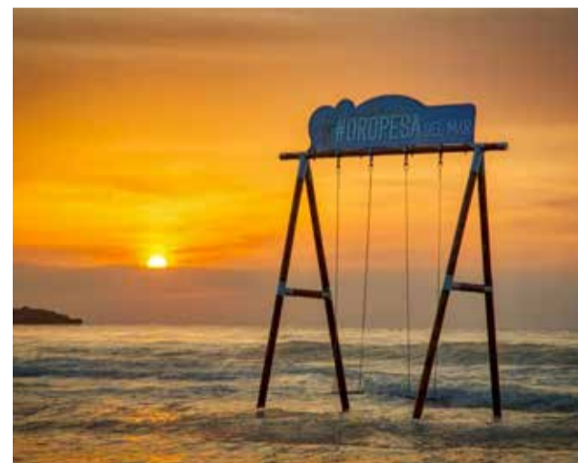
Oropesa del Mar.

Y es que la transformación de Oropesa del Mar en un DTI supone la puesta en marcha de una estrategia integral en el destino a través de la innovación y la tecnología, con el propósito de incrementar la competitividad del sector empresarial, mejorar el aprovechamiento de los recursos turísticos, adecuar los productos actuales a las nuevas tendencias de la demanda turística, etc.