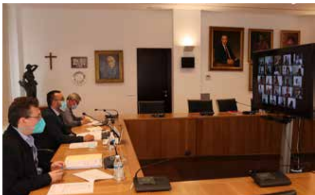
Ple de Vila-real.