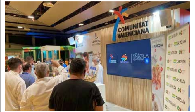
Peñíscola en Madrid Fusión.