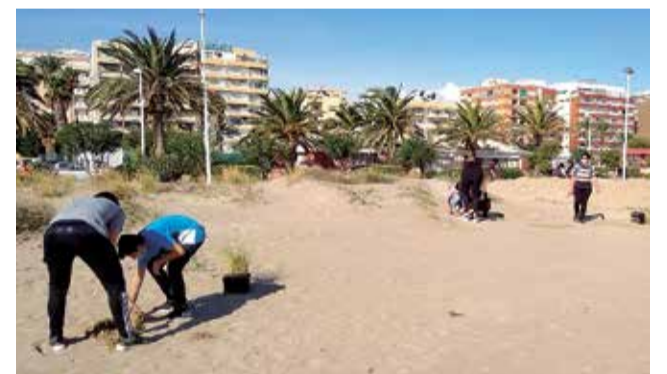
Plantan vegetación autóctona en la playa.

Los de Jaime I y los Hoyo del Moro han plantado en el Riu Palancia, donde también han realizado varesos de limpieza. Y los del San Vicente Ferrer han diseñado un itinerario con códigos QR en el pinar que rodea el colegio para poner en valor la vegetación autóctona de este rincón del entorno a la Montaña de Romeu. Además, los y las alumnas del Camp de Morvedre y de Eduardo Merello han realizado actuaciones en parques y jardines.