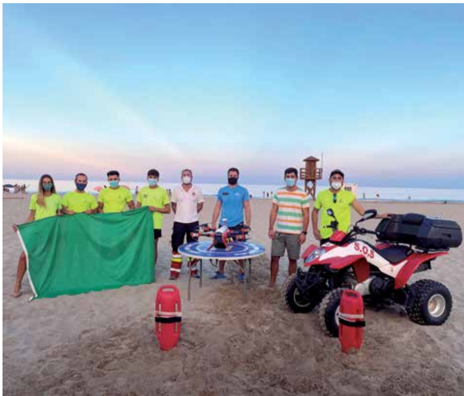
Personal de vigilància, salvament i el dron de les platges de Sagunt.