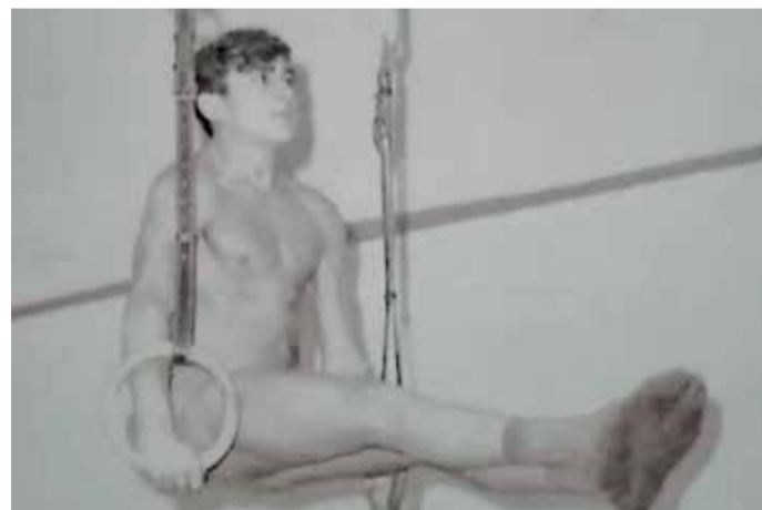
Practicando gimnasia deportiva de adolescente.

“No voy a dejar la halterofilia hasta que, con 90 años, me echen de los gimnasios”