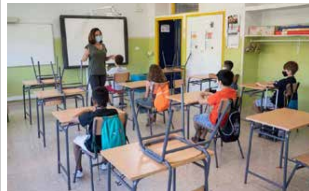
Un aula de la Comunitat Valenciana.