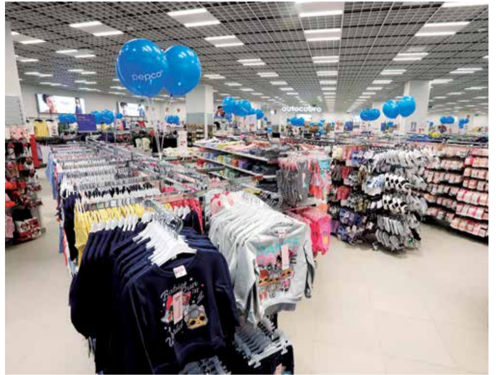
Pepco, la compañía de retail no alimentaria más grande de Europa.

Por último, junto a las instalaciones de LEPILANDIA en la planta Segunda del Centro Comercial, la empresa de ocio KSB Sport con su línea KSB Kart, también ha anunciado su próxima inauguración. KSB Sport tiene una dilatada experiencia en el mundo del deporte infantil, en donde de una manera pionera, desarrolla circuitos con vehículos