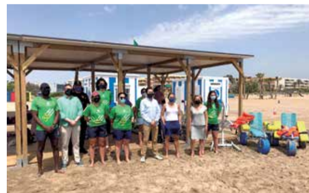
Punt accessible de la platja de Canet.

Dos cadires amfibi infantils i una flexipassarel·la seran les novetats d'enguany. El punt accessible estarà obert fins el pròxim 19 de setembre i és un servei destinat a persones amb diversitat funcional, que disposa de tots els mitjans a l'abast d'aquest col·lectiu perquè puguen gaudir de l'estiu i de la platja igual que la resta de persones. Tindrà un total de sis auxiliars diaris en horari ininterromput.