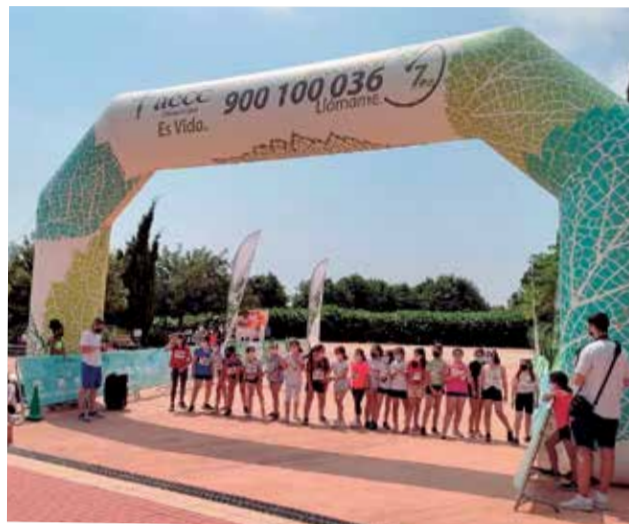
Una de les activitats organitzades a F.

el 9 de juny tot el centre va participar en una carrera a la muntanya de La Rodana. Per últim, a la lluita contra el càncer, l'Ajuntament ha volgut unir una altra celebració que també ha quedat suspesa enguany: el Dia de l'Arbre. Per això el premi que rebrà cada escolar per la seua participació a la carrera no serà una medalla o una copa, sinó un test i unes llavors que hauran de plantar i regar.