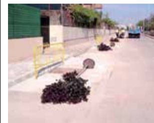
Los nuevos árboles.

► L'Ajuntament de Canet d'en Berenguer continua amb els tractaments contra els insectes a tot el municipi. La setmana passada s'aborava la zona dels cada-fals. Posteriorment, es va procedir a plantar els arbres de l'espècie Prunus en substitució dels antics del carrer Jorge Juan.