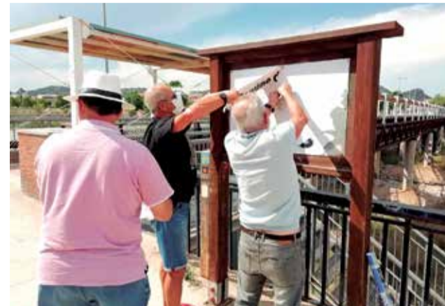
Emplazamiento de la señalética.

Según destacan desde el colectivo, este recorrido es “duro y exigente”, porque, además, “no cuenta con una infraestructura consolida-