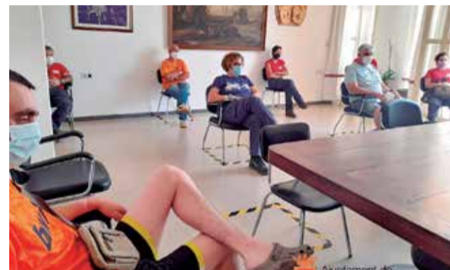
Reunió amb el grup Emerge 2021. / EPDA

les escapades amb els amics o la colla. Llançar a terra puntes de cigarret o plàstics pot ser el causant d'incendis forestals descontrolats. Des del consistori, agraiem als veïns que recol·lecten fem del bosc per aconseguir un espai lliure de contaminació i segur per a tots els ciutadans.