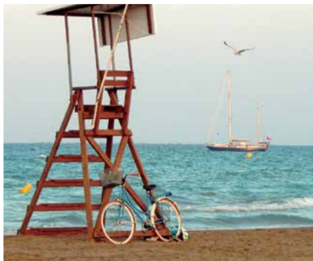
Platja de Canet d'en Berenguer.

EL CONCURS D'ONDACERO.ES, QUI LI HA ATORGAT EL GUARDÓ, JA INICIA EL PROCÉS PER RECONÈIXER-LA COM A LA MILLOR D'ESPANYA