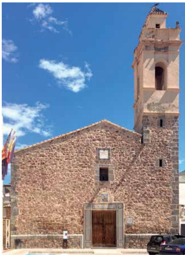
Façana de la Casa de la Cultura reformada.