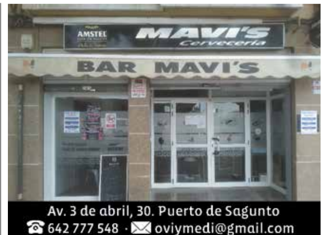
Av. 3 de abril, 30. Puerto de Sagunto 642 777 548 · oviymedi@gmail.com

Se puede participar a través de una encuesta breve a través de un código QR, disponible en los carteles que estarán distribuidos por el municipio, en la página web y en las cuentas de Facebook.