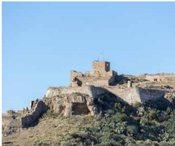
Castillo de Sagunt.

Donde haya una buena estrategia turística, el impacto en otros sectores y en la sociedad también será positivo"