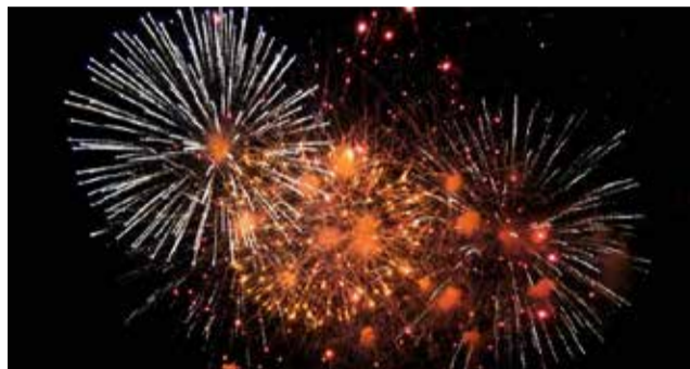
Imatge d'arxiu de focs artificials.

La programació continuarà el dia 24 de juny amb el musical infantil "Toys: una història de joguetes" de "Representaciones Montecarlo". Per a l'ocasió, l'Ajuntament habilitarà un recinte tancat en l'avinguda de Blasco Ibáñez i el carrer del Mare Nostrum. L'actuació començarà a les 22.30 hores.