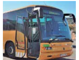
Una de las obras.