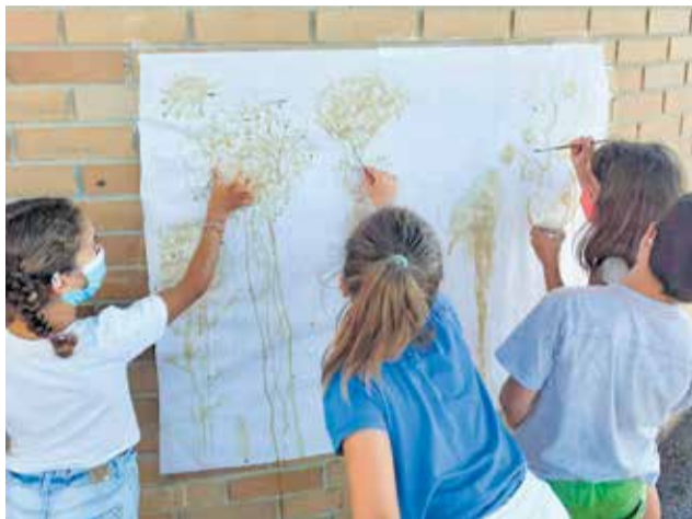
Curso de verano de Mas Camarena Canet.

Estos cursos de verano están dirigidos a niños desde los cuatro meses hasta los 16 años. Respecto a las fechas, los programas comienzan el