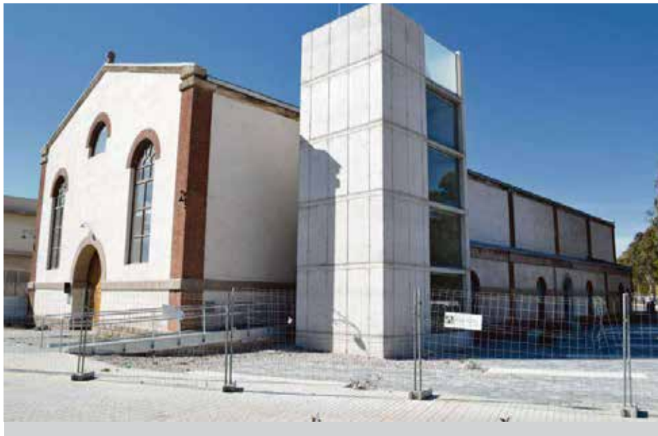
Museo industrial de Sagunt, cuyas obras están paralizadas.