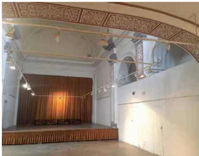
Acondicionament de llums per a exposicions.

L'alcalde Pasqual Sevillà, en el llibret informatiu de l'ajuntament editat al ge-