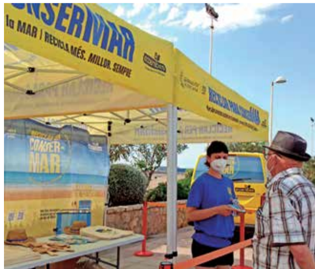
Campaña 'Reciclar para ConserMar'.

En definitiva, se trata de implicar a los ciudadanos como agentes activos preservadores del patrimonio común que representan nuestras playas, valorándolas como lo que