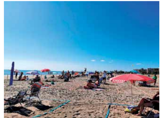
Parcel·lació de la platja de Canet.