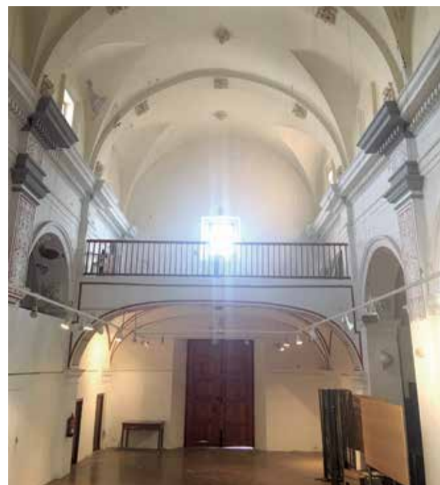
Interior de l'edifici de la Casa de la Cultura.