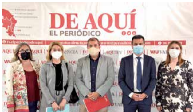
Algunos de los representantes en el acto.

ra la Generalitat Valenciana, quien aseguraba que Europa es la "puerta de las oportunidades" para el comercio de proximidad, ya que ha tenido y tiene un papel fundamental en hacer que las empresas no