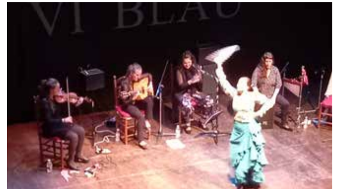
Festival de Guitarra a Quartell d'un altre any.