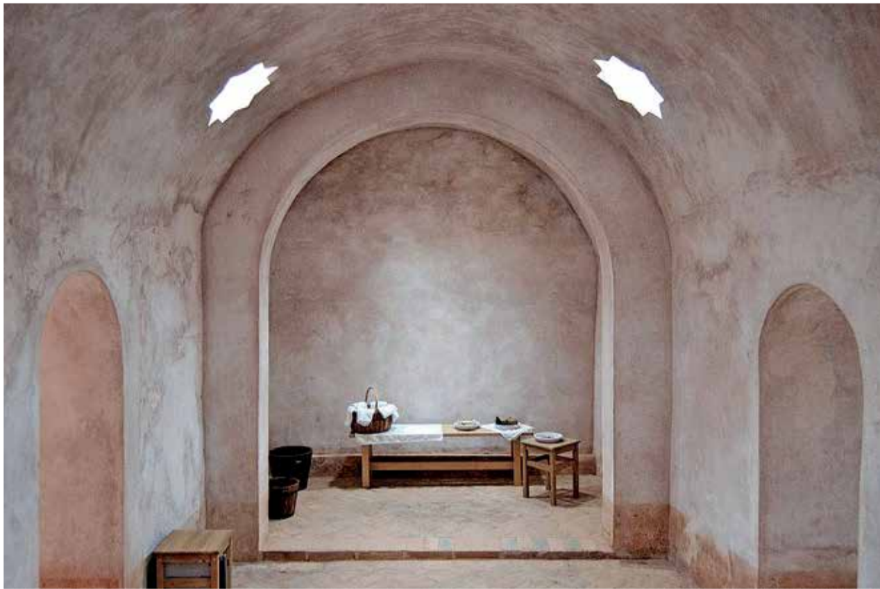
Baños árabes de Torres Torres.