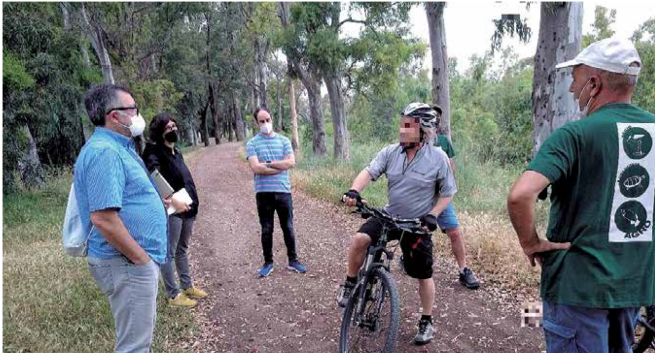
Miembros de Agró, concejal de movilidad urbana, técnico del área y deportistas.