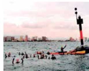
Una de las obras. / EPDA