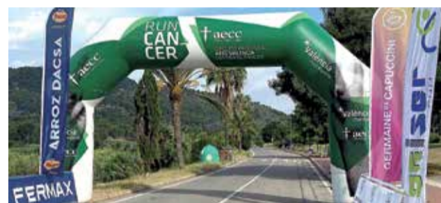
RunCàncer d'Albalat dels Tarongers.

corde. Va aconseguir recaptar ni més ni menys que un total de 3.000 euros, dels quals 1.340 es destinaran a promoure la investigació del càncer.