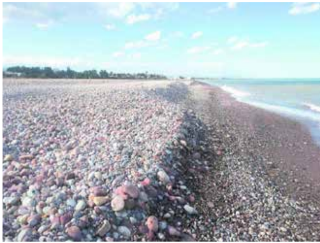
Escalón de piedras en l'Almardà.

En ese sentido, Muniesa asegura que vecinos de la zona se han puesto en contacto con el grupo municipal para expresar “su malestar, porque si el año pasado estaban