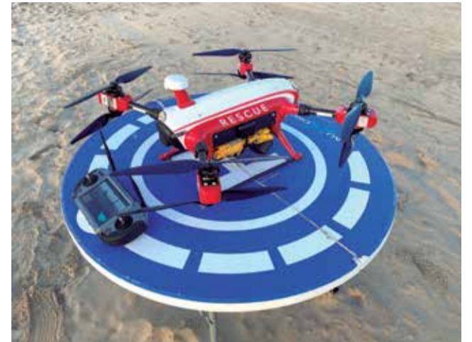
Dron de vigilància de les platges de Sagunt. / EPDA