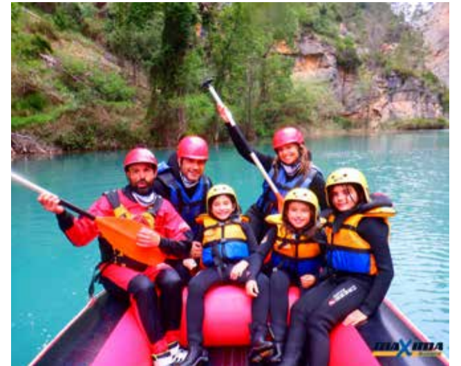
Actividades de Máxima Aventura. / EPDA

Este verano, no lo dudes y visita Montanejos con Máxima Aventura. Están muy cerca de ti. Contacta a través de la web: www.maximaaventura.es , o en el teléfono 619555921. También los encontrarás en redes sociales.