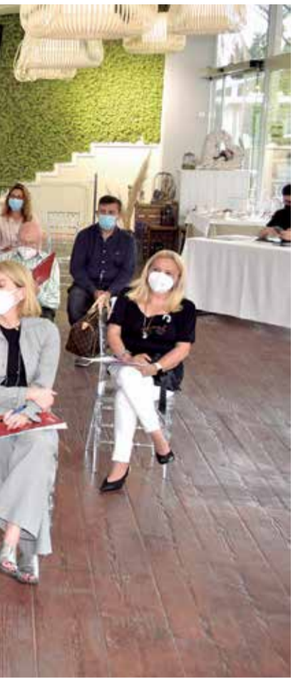
El Mirador de Sagunt. / PLÁCIDO GONZÁLEZ