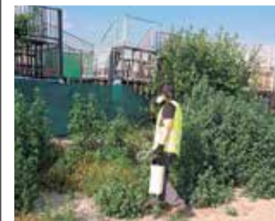
Tratan los insectos. / EPDA

Tractaments contra els insectes i nous arbres a Canet