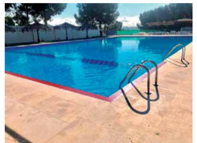
Imatge d'una piscina municipal.

"Pràcticament totes les mesures i novetats que es van implantar l'any passat es van repetir este any", explicava el Rovira. En eixe sentit, la platja de Port de Sagunt estarà dividida en sectors, cadascun dels quals tindrà un aforament que es controlarà a través d'un dron i de la intel·ligència artificial. A diferència de Canet, a Sagunt no es van a parcel·lar les platges. Tal com assegura el regidor de platges i atinent a l'experiència de l'estiu passat, "l'aforament no es va sobrepasar en cap moment i es van respectar les normes que hi havia, les quals eren més estrictes que les vigents actualment". Els agents de platja i la presència del dron garantirán el compliment de les distàncies interpersonals.