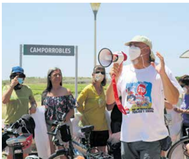
Representantes de los colectivos organizadores durante sus alegatos en la estación de Camporrobles.

“Cuando se hizo la remodelación de la Estación se anuló una vía y desde entonces no hay cruce de trenes. Por eso conformamos la agrupación Pueblos con el tren. Desde los años 50 en que se construyó, no se ha invertido en renovar las infraestructuras, continúan las traviesas de madera, el tren circula a 55-60 km/h, por lo que trasladarte a Valencia te cuesta dos horas y media y cuatro a Cuenca. Nos acordamos de la España vaciada pero no invertimos en ella. El AVE fue