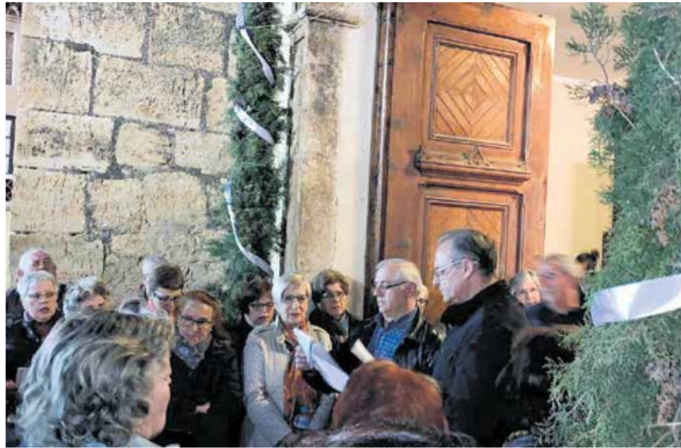
El Canto de los Mayos de Venta del Moro.