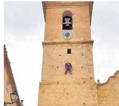
Ritual del Judas.

tación esta gran noticia no hubiese sido posible”, ha concluido López.