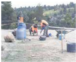
Operarios. / EPDA