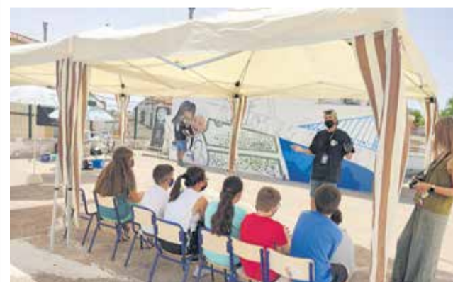
Participantes del taller de grafiti.