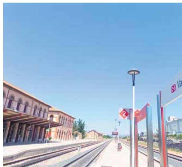
Estación de Utiel.

Los objetivos fundamentales que se persiguen con las actuaciones de mejora a realizar en la línea entre Buñol