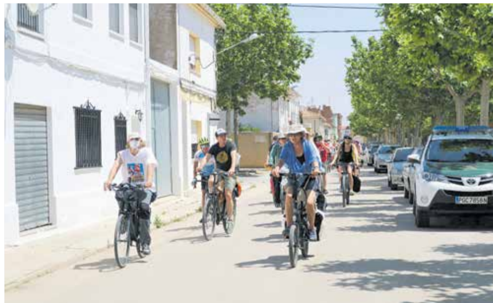
Llegada de los manifestantes a Camporrobles.