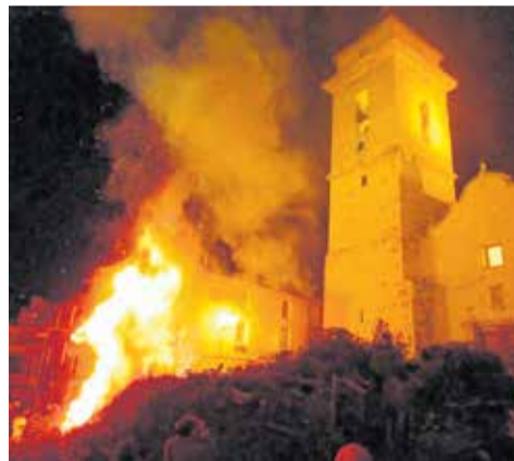
Las Hogueras de la Virgen de Loreto.