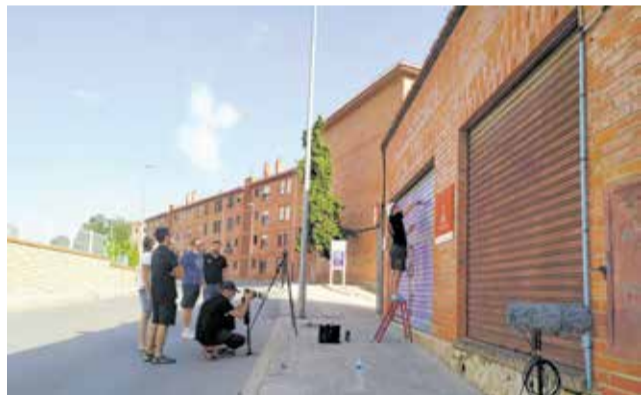
Grabación de uno de los cortos.