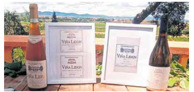
Galardones concedidos a la Bodega.