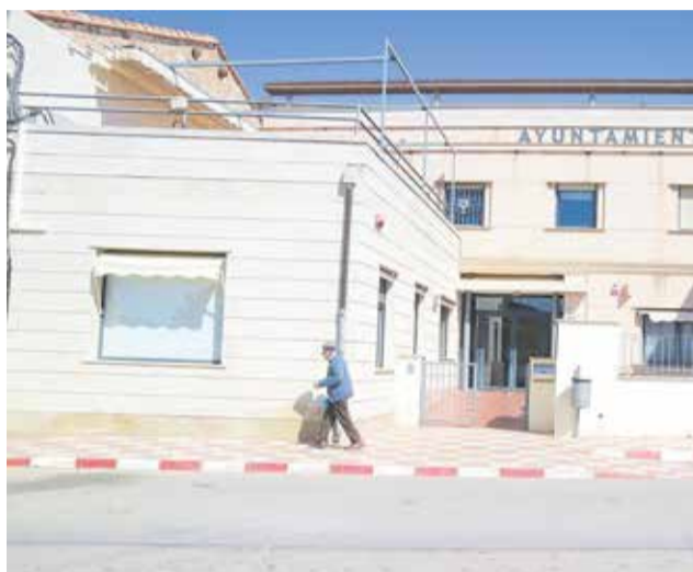
Ayuntamiento de Villargordo. / EPDA

Desde el equipo de Gobierno consideran que este uso telemático recomendado facilitará la gestión diaria del Ayuntamiento y "permitirá al personal municipal dedi-