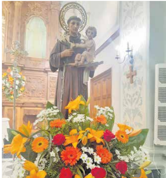
Imagen de San Antonio de Padua.

Este año, por la pandemia, tampoco se pudo realizar la tradicional procesión, ni compartir el vino de honor. Sin embargo, la liturgia congregó a los vecinos y vecinas de la localidad entorno a algunos de los actos más emblemáticos de la festividad. Así, tanto el sábado como el domingo se celebró la misa en honor al Santo Patrón, San Antonio de Padua y, poste-