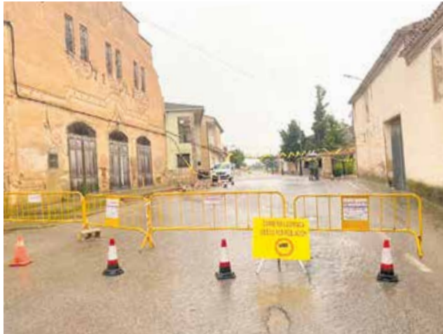
Zona afectada por el derrumbe.

Tras caer la parte de las dos fachadas, el tendido eléctrico quedó en mitad de la carretera