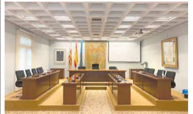
El salón de plenos reestructurado.