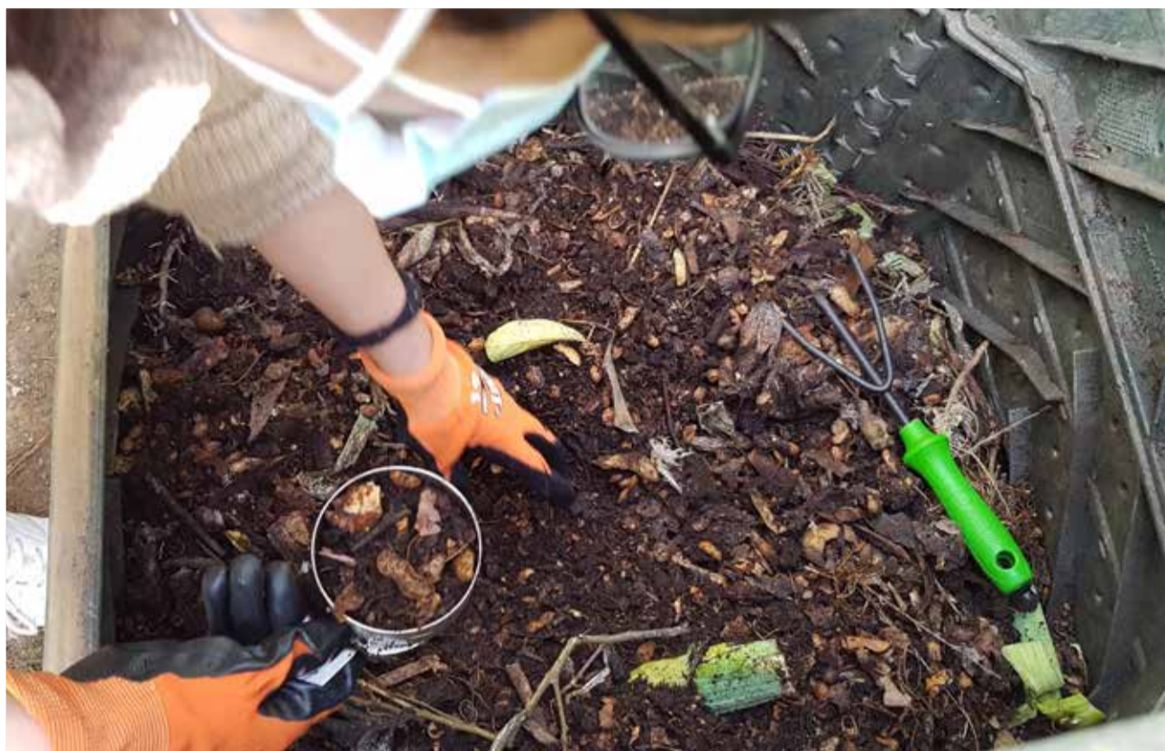
Residuos naturales

El Plan Integral de Residuos de la Comunitat Valenciana señala a los ayuntamientos la necesidad de desarrollar su Plan Local de Residuos, obli-