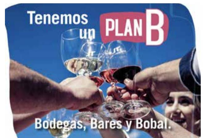
Imagen de la campaña de la DO.

Esta guía está disponible de forma impresa en múltiples puntos para que cualquiera que se acerque a estas tierras pueda disfrutar de sus momentos especiales con una elección adecuada de algunos de los mejores vinos del país.