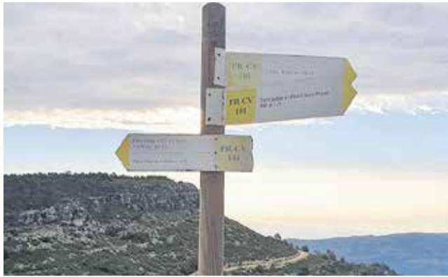
Señal de rutas PR-CV en Chera.