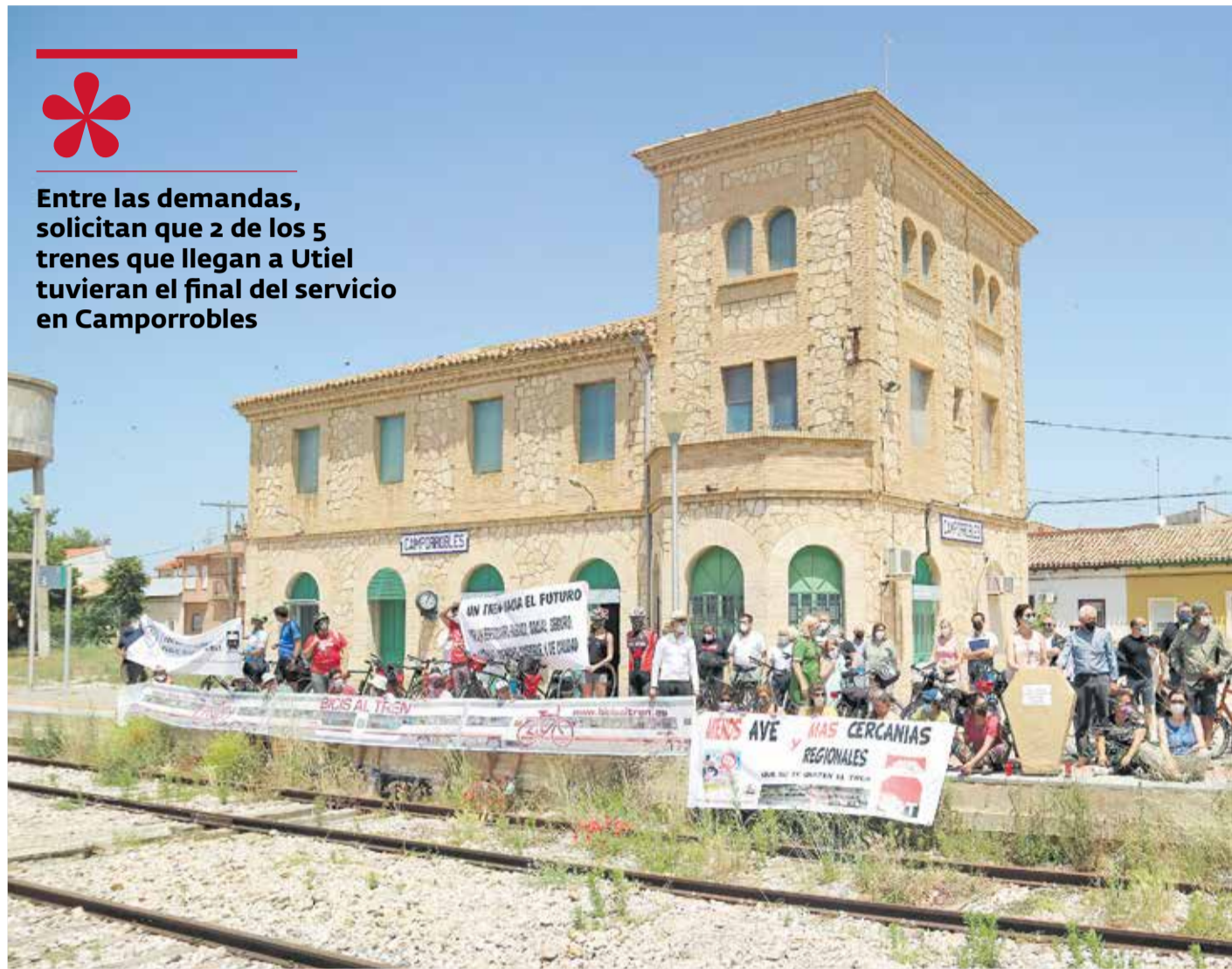
Concentración de los participantes en la marcha frente a la estación de tren de Camporrobles.

Entre las demandas, solicitan que 2 de los 5 trenes que llegan a Utiel tuvieran el final del servicio en Camporrobles