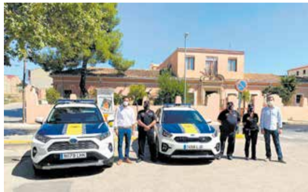
Policía Local en la presentación de vehículos.