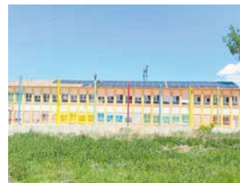
Instalación de placas fotovoltaicas en el CEIP Maestro Aguilar.

tar de energía renovable en forma de autoconsumo. “Esta forma de gestión nos brinda la oportunidad de aplicar ‘kilómetro cero’ a un nuevo modelo energético sostenible, además, la instalación se