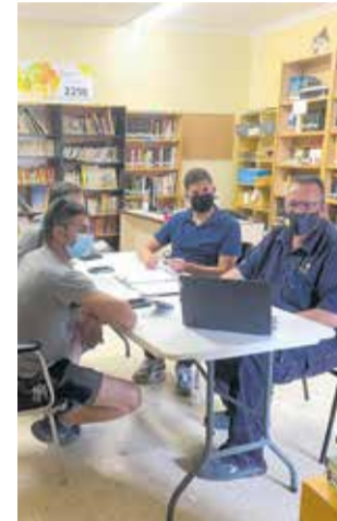
Reunión de trabajo.

La instalación ha tenido un coste de 6.000 euros que se