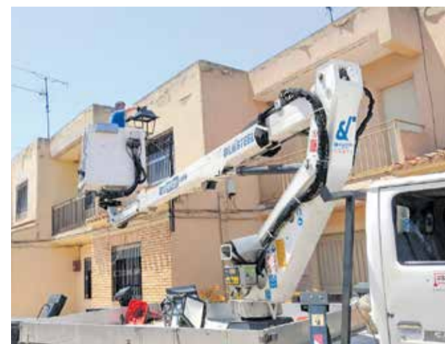
Sustitución de las luminarias en Las Cuevas.

El Ayuntamiento de Utiel ha realizado una auditoría energética en todo el municipio. De hecho, el consistorio utielano ha implantado sistemas de ahorro energético a través de diferentes intervenciones como la optimización de cuadros de alumbrado público mediante la colocación de reductores de flujo tanto en Utiel como pedanías; el reemplazo de luminarias en vías públicas y en áreas industriales o la implantación del proyecto 50/50 en centros educativos de Utiel para educar e implicar a los más pequeños en el uso responsable de la energía.