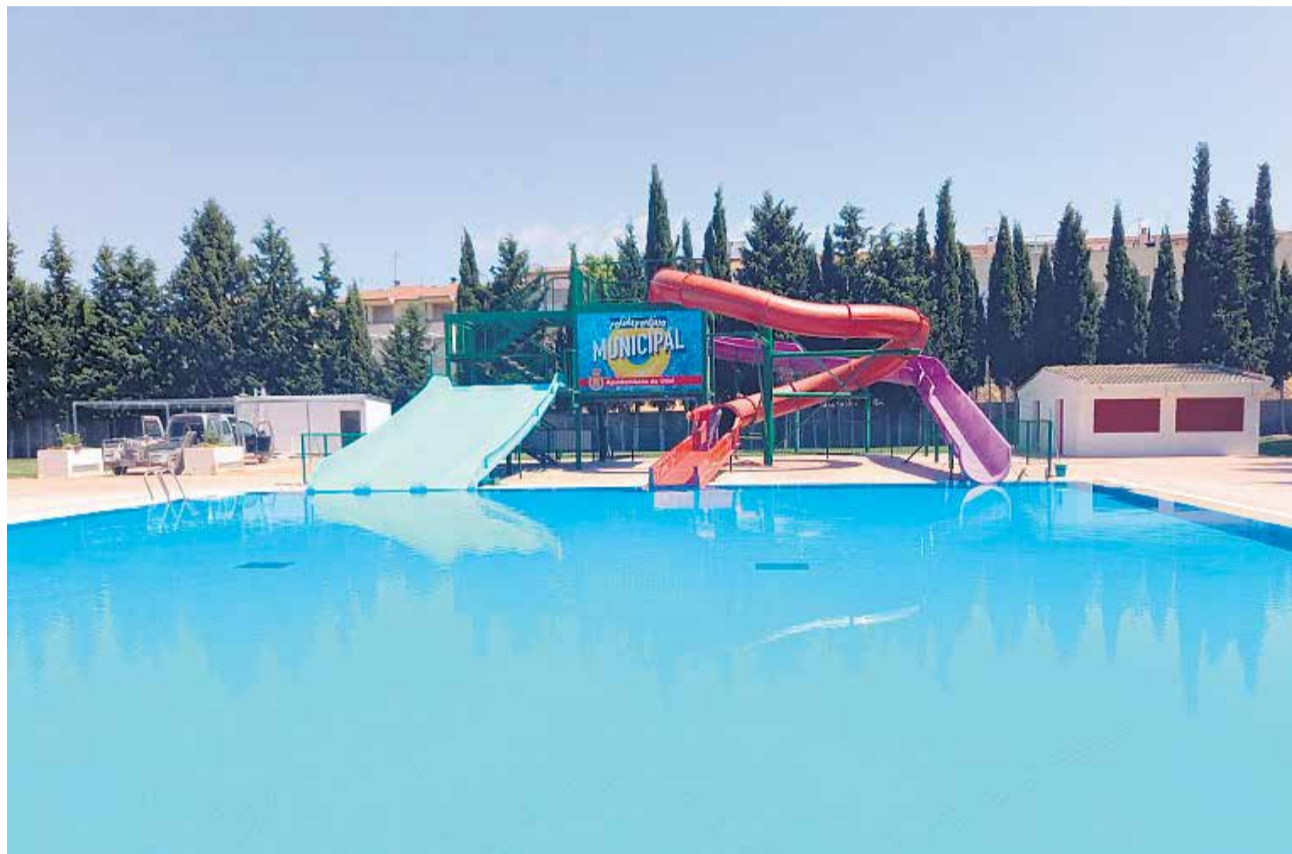
La piscina municipal de Utiel abre sus puertas con normativa Covid-19.

En esta temporada se han puesto a la venta tanto bonos como entradas, repartidos en 540 abonos mensuales y 60 pases diarios, cumpliendo así con el aforo permitido de ac-