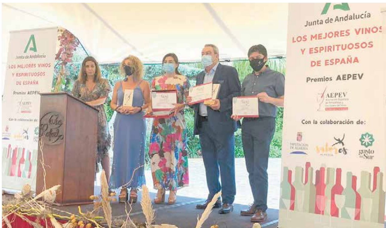
Representantes de Marqués de Riscal, Bodegas Otazu y Tierra Bobal en la entrega de premios.

Este reconocimiento llena de orgullo tanto a la MITV como a los municipios de Camporrobles, Caudete de las Fuentes, Chera, Fuenterrubles, Requena, Sinarcas, Utiel, Venta del Moro y Villargordo del Cabriel y las entidades territoriales que están incluidas en la estrategia premiada. Dicha