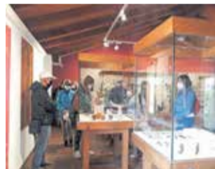
Visita al museo.