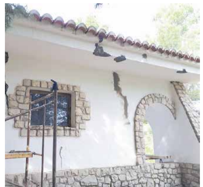
Obras de reforma en la fachada del refugio.

Con esta actuación se van a reparar las chimeneas de los dos refugios de la zona y se van a reparar y pintar las paredes exteriores del que está ubicado en la Fuente de la Puerca.