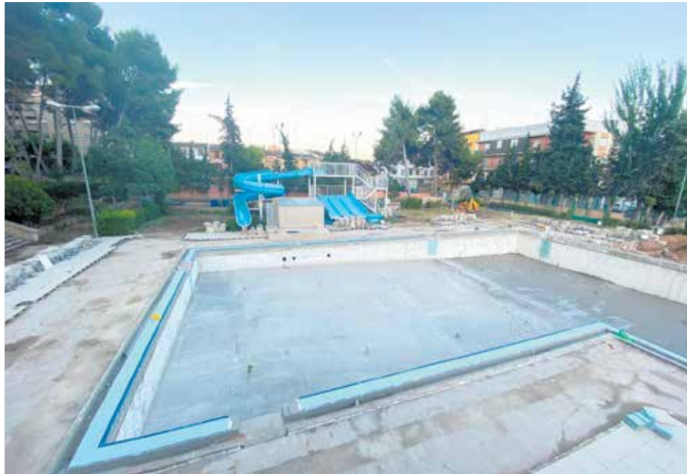
Obras en la piscina municipal de Requena.

Las mejoras que se han efectuado hasta el momento