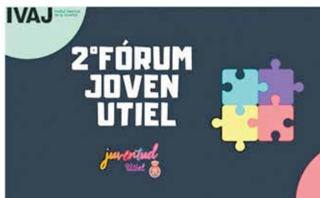
Imagen del cartel de la campaña.