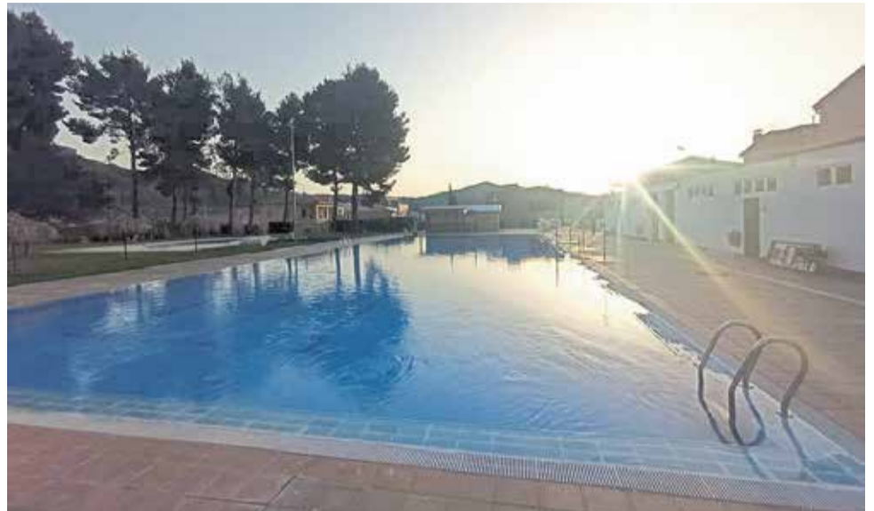
La piscina de Chera es uno de los reclamos estivales de la comarca.