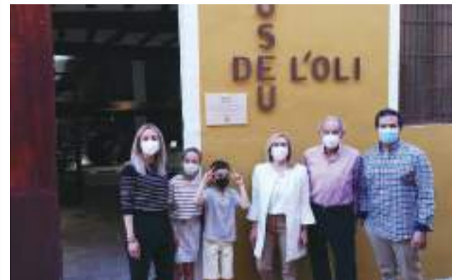
Inauguració del Museu.