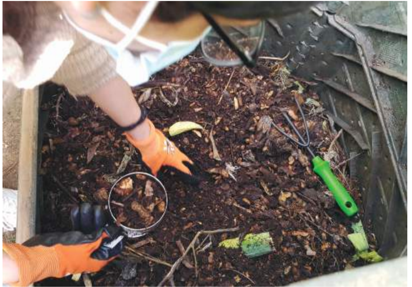
Residuos naturales/ EPDA

El Plan Integral de Residuos de la Comunitat Valenciana señala a los ayuntamientos la necesidad de desarrollar su Plan Local de Residuos, obligatorio ya para los municipios mayores y cuya obliga-