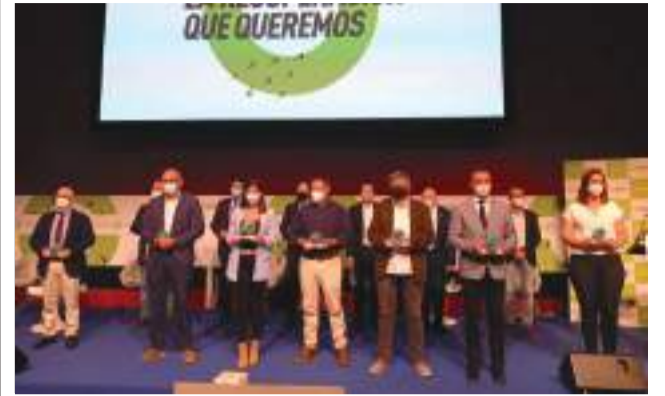
Recepció del Premi CONAMA a Madrid.