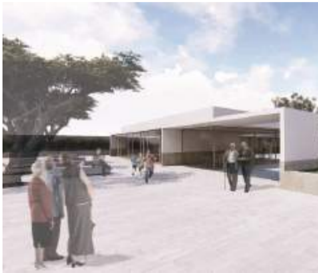
Vistas proyectadas del centro de día.