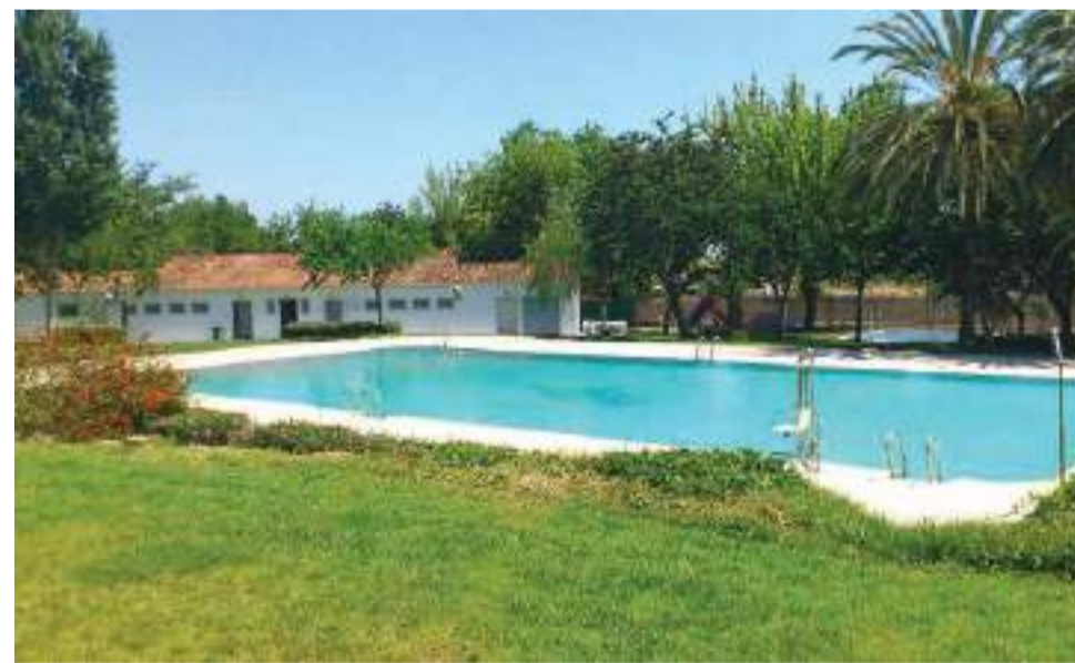
Piscina municipal de Loriguilla a la espera de apertura

Este año, para garantizar el orden y la seguridad, el servicio de piscina será gestionado por una empresa externa que se hará cargo del correcto funcionamiento de la instalación,