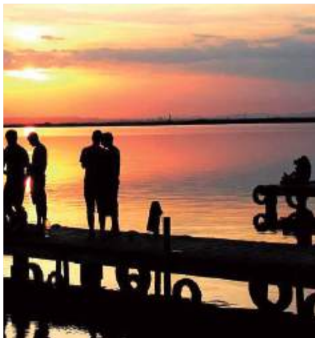
Atardecer en el Parc Natural de l'Albufera.

► EL ENTORNO. La zona dels peixets es el primer enclave no urbanizado al norte del puerto de Valencia.