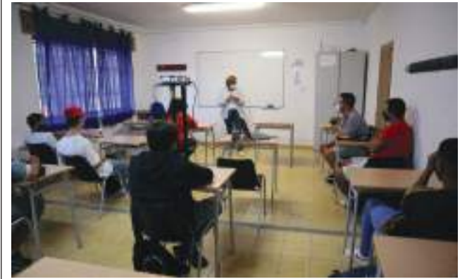
Aulas de formación / EPDA