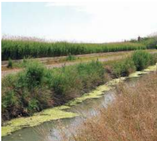
El Marjal dels Moros (Camp de Morvedre).

ten en una perfecta excusa para abandonar la ciudad y practicar la observación de la naturaleza. Durante todo el año, la gran biodiversidad de este espacio natural protegido permite observar una importante variedad de fauna y flora.