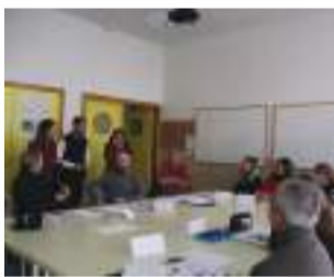
Uno de los talleres.