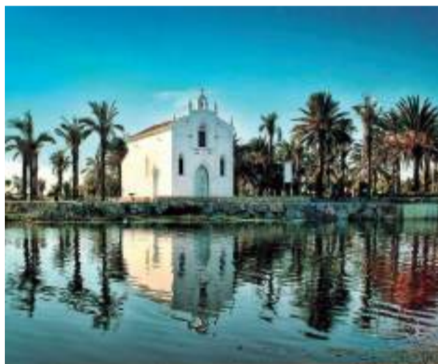
La ermita dels Peixets de Alboraya.

de singular importancia por su flora, fauna, paisaje, características geológicas y sus valores socioeconómicos y culturales, se encuentra muy vinculado al medio rural tradicional. El Parque, con una extensión de 31.446 ha, tiene al río Cabriel como