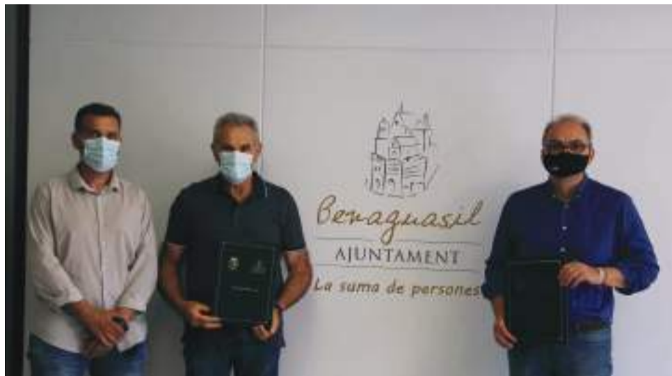
El alcalde tras la firma del convenio

El convenio de arrendamiento del solar de la calle Palau, titularidad de la Cooperativa Rural San Vicent Ferrer de Benaguasil, ha sido rubricado esta mañana entre el presidente de la entidad agrí-