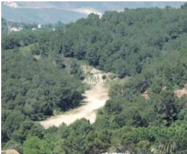
Las Salines, en el municipio de Manuel (La Ribera).

del Cabriel, Venta del Moro y Requena, se encuentra el Parque Natural de las Hoces del Cabriel, uno de los espacios naturales más significativos del territorio valenciano, declarado Reserva de la Biosfera el pasado 2019. Este territorio