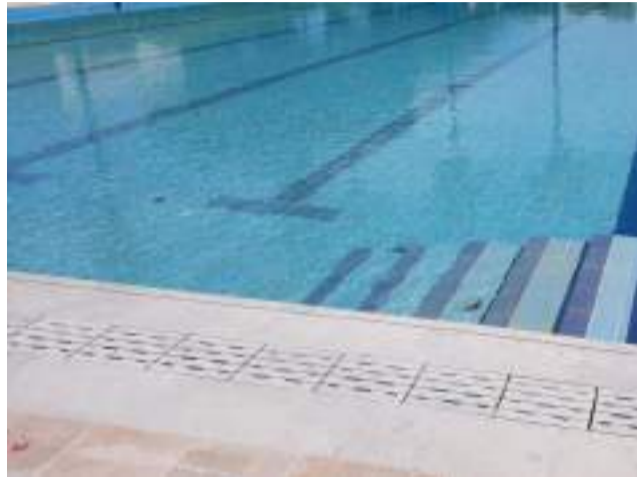
Piscina de Marines.

En este sentido, los vecinos y vecinas de Marines, así como los visitantes, podrán disfrutar este verano de la piscina municipal. Además, el ayuntamiento va a poner a disposición de la ciudadanía cursos de natación en diversos niveles: iniciación, perfeccionamiento y adultos, así como acuagym. Próximamente, se dará más información al respecto para realizar las matriculaciones con detalles sobre horarios y precios.