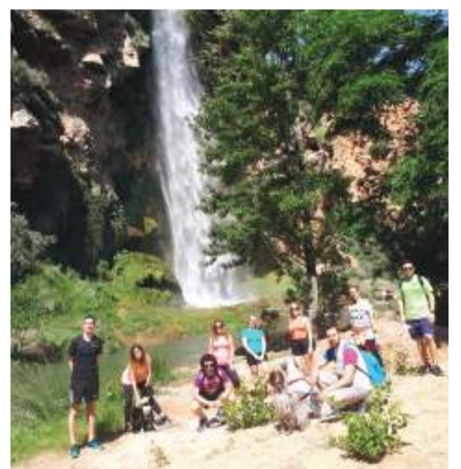
El salto de la novia de Navajas (Alto Palancia).

► LA PLAYA DELS PEIXETS. Es muy apreciada para acercarse al mar en un entorno rural.