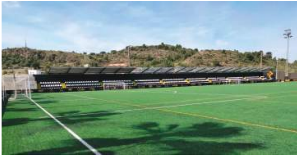
Interior del campus de fútbol.