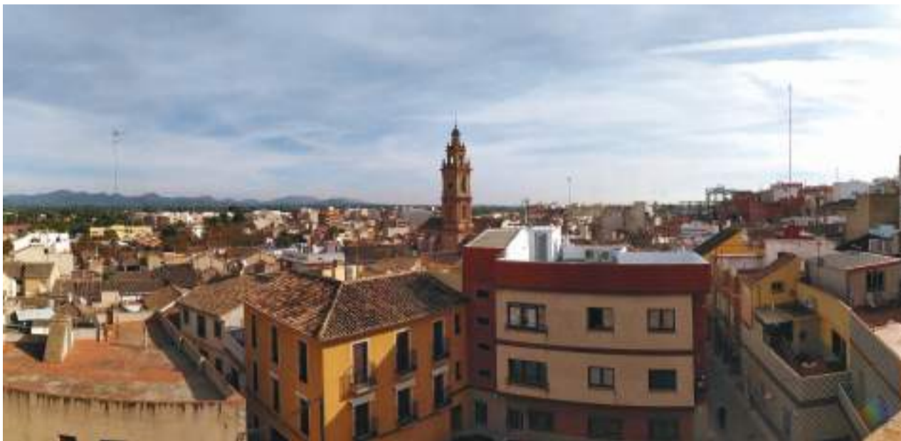
Vista de Bétera

“Que durante años se haya contenido el gasto es muy positivo para las arcas municipales pero siempre y cuando esto no repercuta en el cuidado de nuestras calles, en