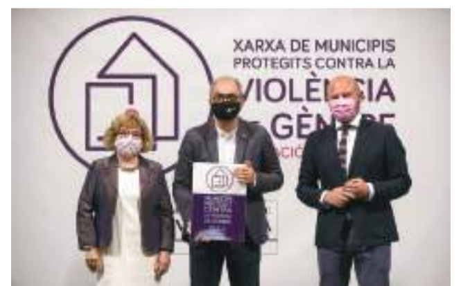
Presentación de la Red en Benaguasil / EPDA

res víctimas de malos tratos. La adhesión de Benaguasil a esta Red, impulsada por la institución provincial, supone una muestra más de las acciones que el equipo de gobierno está llevando a cabo a favor de la igualdad entre hombres y mujeres.