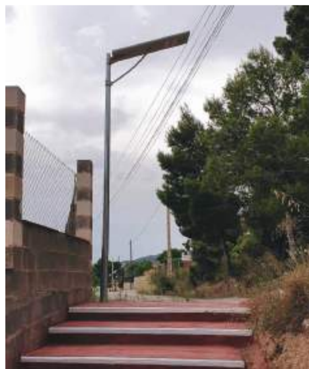
Farolas en una calle de Olocau.

Se trata de una actuación sufragada con fondos propios y de la Diputación de Valencia. "Nuestra intención es continuar colocando nuevas farolas solares en zonas diseminadas de la población. Iluminarnos zonas para aumentar la seguridad y visibi-