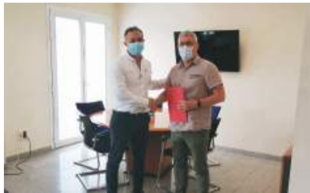
Presentación después de la firma.