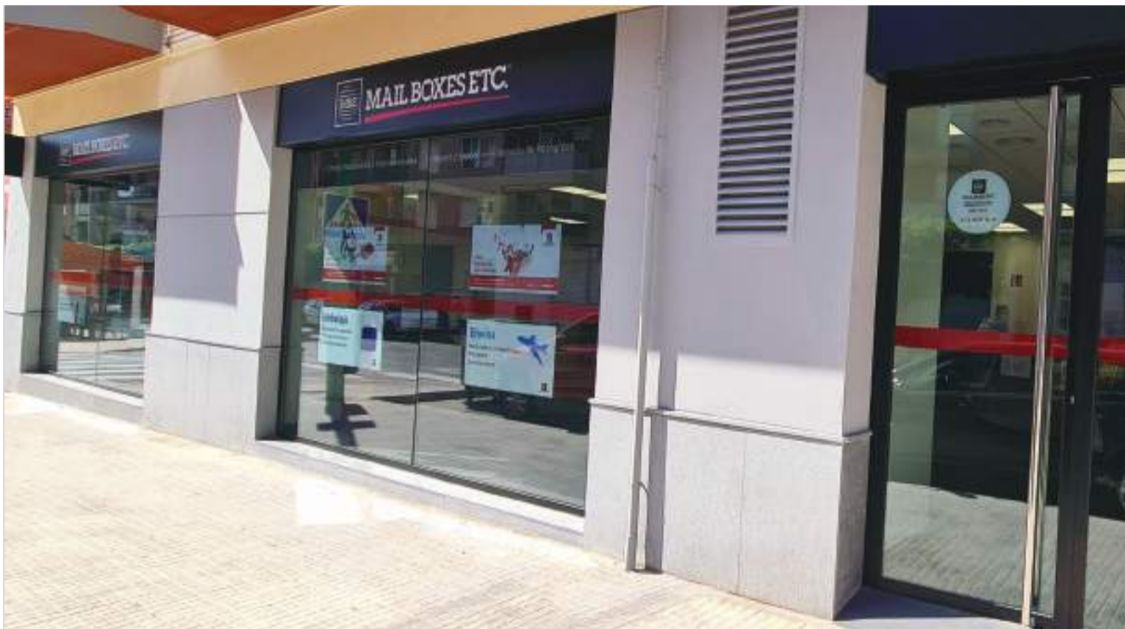
Exteriores de las nuevas instalaciones de Mail Boxes Etc. / MAIL BOXES

LA EMPRESA SE REINVENTA CON UN LOCAL MÁS MODERNO, ADEMÁS DE LA INCLUSIÓN DE UN SERVICIO DE E-COMMERCE, DEBIDO A QUE LA COVID-19 HA DEMOSTRADO LA IMPORTANCIA DE LA PRESENCIA ONLINE PARA LAS PYMES