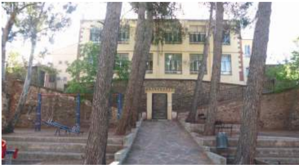
Entrada del colegio de Gátova.