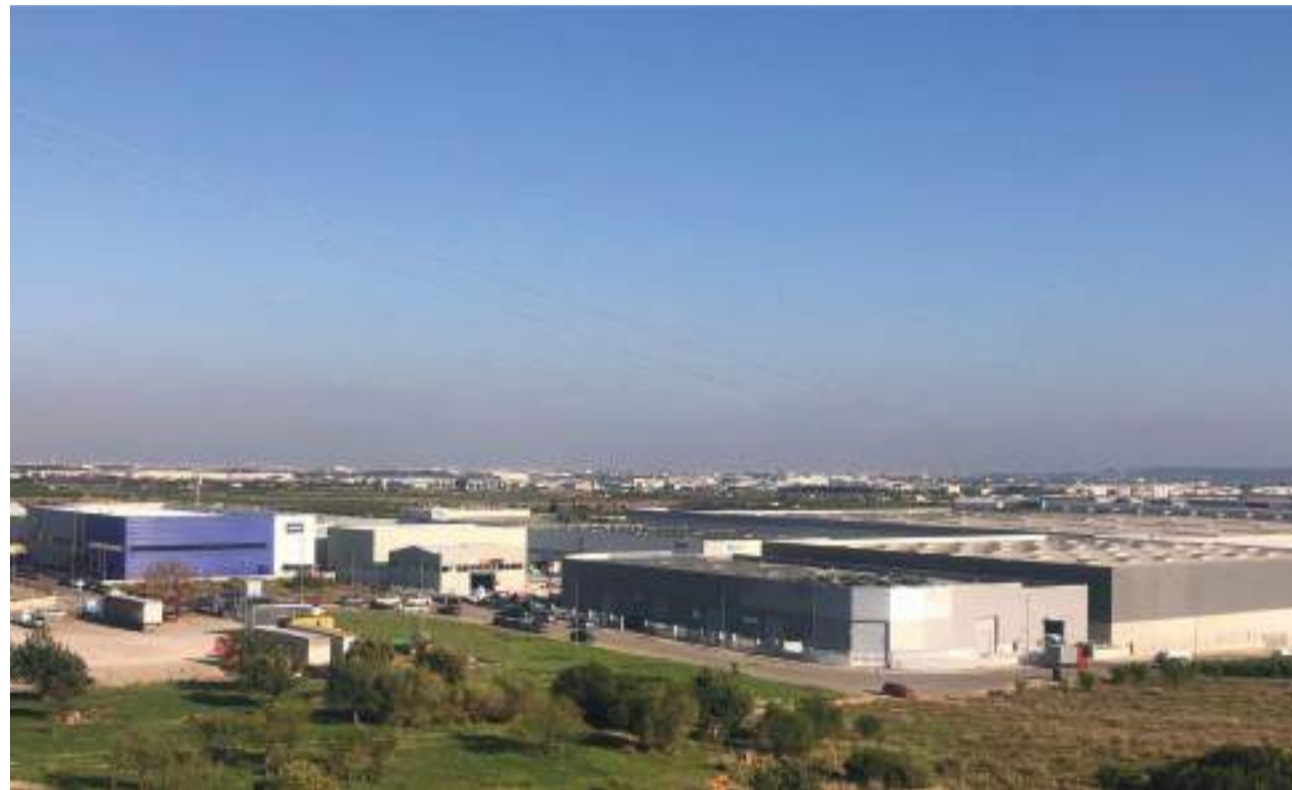
Espacio industrial en el municipio de Loriguilla

Una de las principales cuestiones que se tratará durante el encuentro será cómo afecta a las empresas de Loriguilla la ley 14/2018 de gestión, modernización y promoción de las áreas in-