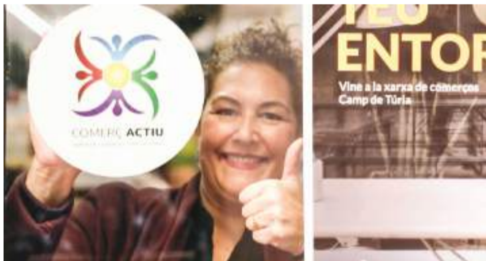
Comerciante del Camp de Túria

Un spot donde los 17 municipios de Camp de Túria son los protagonistas, pero donde, sobre todo se dirigen al consumidor. Poner en valor la calidad, la humanidad