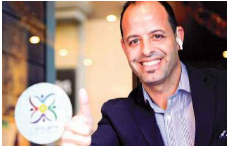
La intención es aunar esfuerzos con los comerciantes

El próximo 21 de junio, aprovechando que estrenamos nueva estación, lanzaremos la campaña a nivel comarcal.