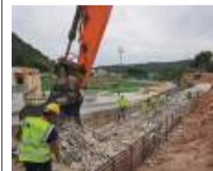
Obras del colegio.