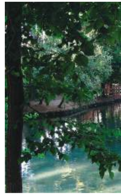
Paisaje en el Parque Natural de Sar