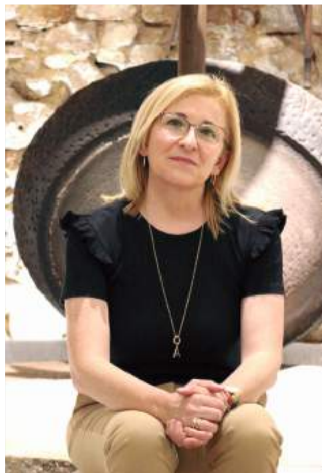
La alcaldesa frente a los utensilios del Museo

► Tenemos que decir que no hemos parado, el Museo es una muestra de ello. Tenemos muchas más obras pendientes; una de las obras que para nosotros es importante es el Aula Respir. En este tiempo, que ha estado cerrado, lo hemos ampliado para poder