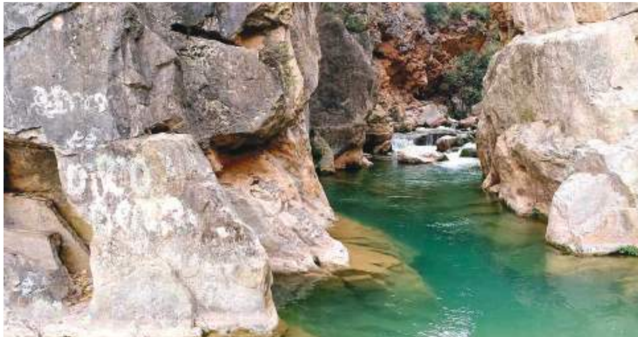
Corriente del río en la Ruta del agua de Chelva (La Serranía)

Su proximidad y facilidad de acceso lo convier-