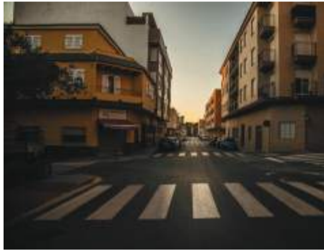
Carrer de Riba-roja abans de la caiguda del sol

La proposta de l'equip de govern del PSPV de Riba-roja de Túria ha comptat amb el suport de la resta de grups amb representació en el ple municipal, com és el cas del Partit Popular, Ciudadanos, Compromís, Podem Riba-roja Pot, Esquerra Unida i, finalment, Vox. La carta de serveis completa, per tant, tots els