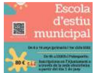
Cartel de la escuela.