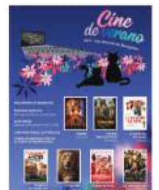
Cartel cultural.