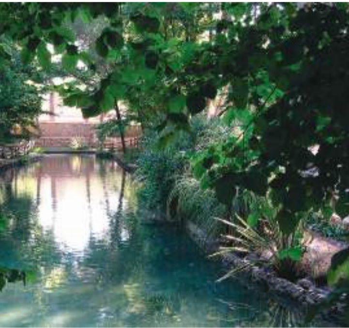
San Vicente en Lliria (Camp de Túria).

► MIRACLE DELS PEIXETS. La ermita tiene como fin la conmemoración del milagro del año 1348.