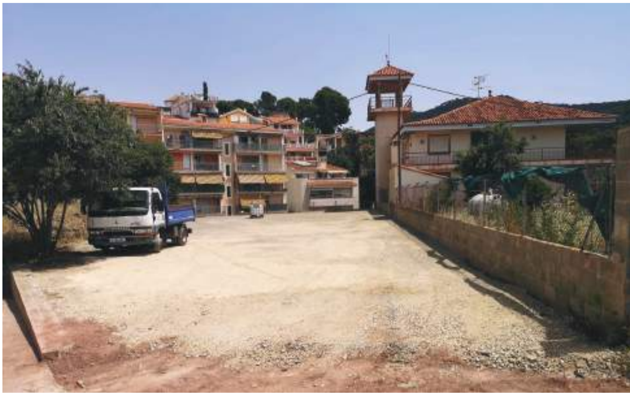
Zona per a situar l'aparcament a Serra