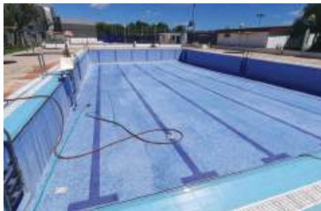
La piscina municipal.