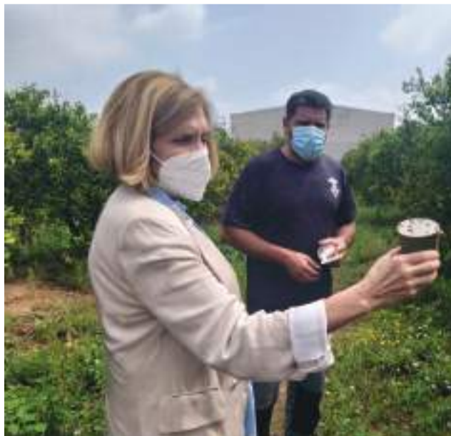
La alcaldesa durante la operación

Ayuntamiento de manera masiva por todo el término, después de que el insectario municipal haya dado sus frutos, tras meses de trabajo, para criar la especie cryptoleamus. Una especie que se caracteriza por ser depredadora del cotonet que ataca directamente a los cultivos provocando, entre otros efectos, deformaciones en los frutos y manchas. Tal y como ha destacado la concejala de Agricultura, “nuestros cultivos avanzan hacia prácticas agrícolas más ecológicas por lo que se imponen soluciones biológicas por encima de las químicas que nos permiten actuar de una manera más sostenible en Bétera”. De esta manera, Bétera mantiene a raya esta plaga para proteger sus cultivos.