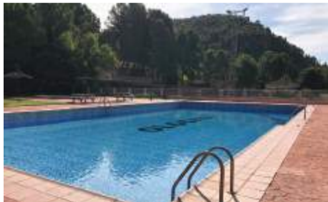
La piscina municipal de Olocau.