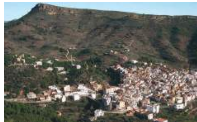
Personas contratadas en Gátova. / EPDA