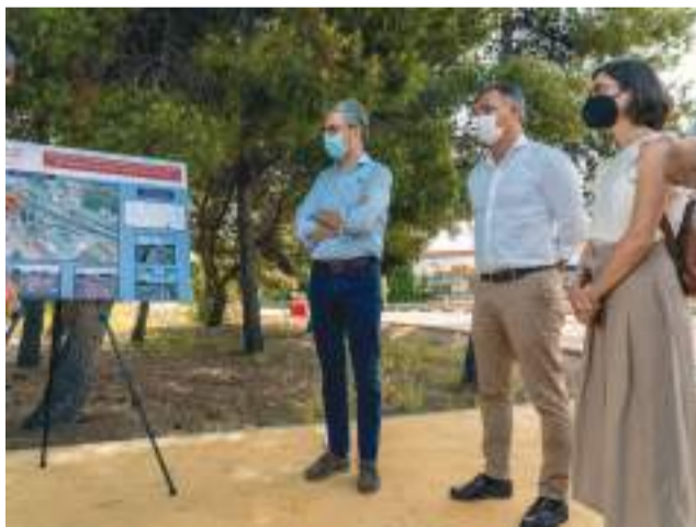
Presentación del proyecto.

En el seguimiento que el conseller ha hecho a las obras de permeabilización ciclopeatonal entre los márgenes de la CV-35 y de instalación de pantallas acústicas a la altura de San Antonio de Benagéber, Arcadi España ha indicado que estas “importante actuaciones” son un ejemplo de “la nueva orientación que estamos dando en la Generalitat, a las infraestructuras, pensando en las personas”.