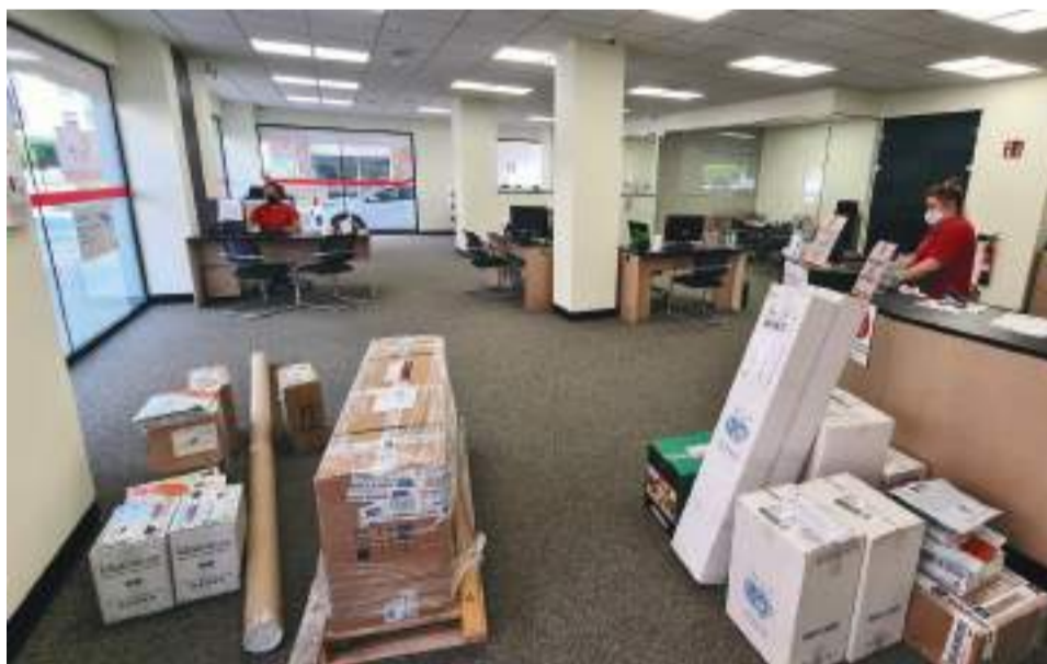
Instalaciones interiores en La Poble de Vallbona. / MAIL BOXES

“Tenemos una capacidad de envío casi ilimitada, y nos encargamos de recoger la paquetería con medios propios”, señala el gerente. MBE