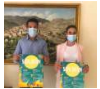
Los carteles.