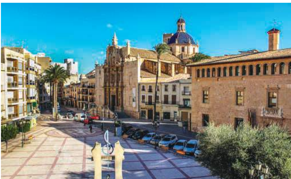
Municipio de Llíria. / EPDA