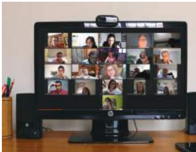
Ple telemàtic de Riba-roja/EPDA

La proposta, amb el suport de tots els grups citats, reclama al Ministeri de Cultura i Esport una rectificació immediata sobre la frase que contenia el decret publicat en el BOE el passat 30 de març en la qual l'origen d'aquest moviment no s'ajustava a la realitat històrica.