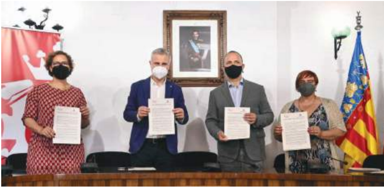
Signatura del conveni per a facilitar l'adquisició d'habitatge social

Una altra dels avantatges sobre la cessió d'aquest dret és que s'assegura una major proximitat en els serveis