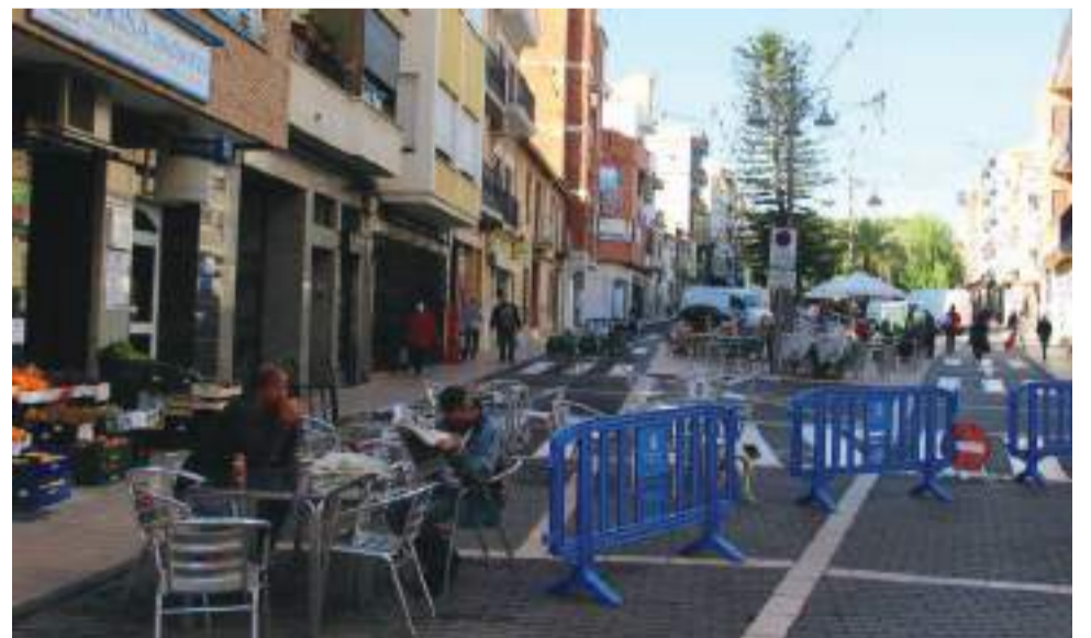
Hostelería y comercios en una calle de Benaguasil

Esta nueva línea de ayudas económicas se suma a otras llevadas a cabo por el Ayuntamiento para seguir contrarrestando los efectos provo-