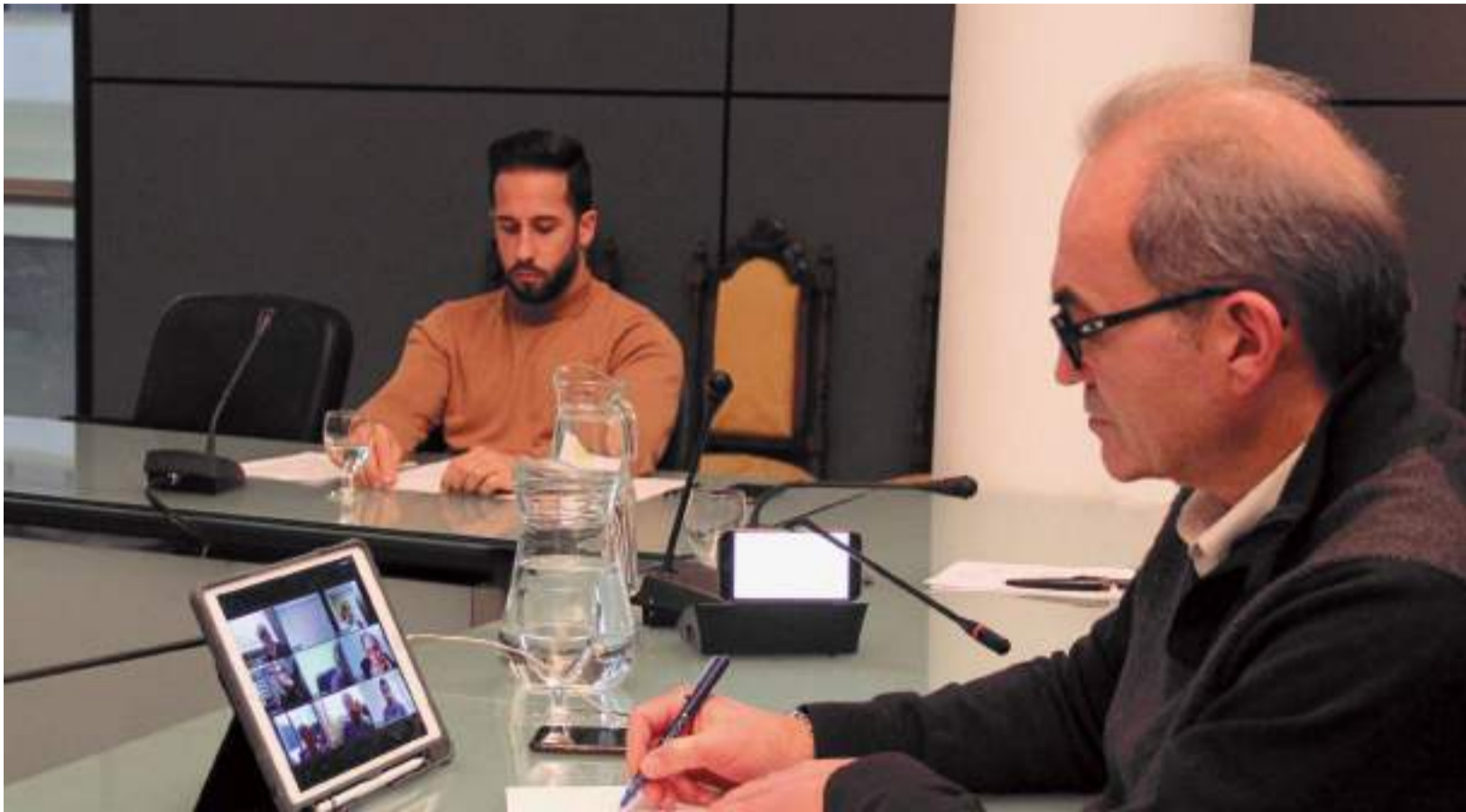
El alcalde, Ximo Segarra, en una reunión telemática para debatir el presupuesto

EL MUNICIPIO HA DISMINUIDO LA DEUDA EN UN 40% EN CUESTIÓN DE DOS AÑOS, A PESAR DE LAS INVERSIONES