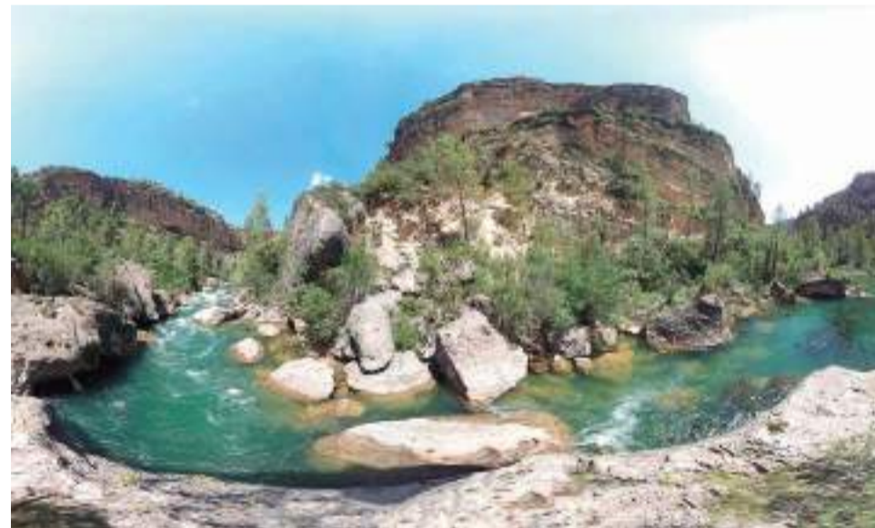
Parque Natural de las Hoces del Cabriel (Plana Utiel-Requena).

nidad Valenciana. Está situada entre los términos municipales de Sagunt y de Puçol y, además de ser un auténtico placer visitar su entorno, cuenta con aves acuáticas en peligro de extinción y con una gran cantidad de peces autóctonos. Es un paraíso con unas características únicas que, a pesar de las innumerables amenazas a lo largo de décadas que vinieron de la mano del hombre, se ha podido recuperar parte de su naturaleza. Se han creado nuevas lagunas y se han demolido las últimas edificaciones que había dentro del Marjal. Además, la caza y la pesca han quedado prohibidas. Actualmente, el Marjal dels Moros dispone de varios miradores, una pasarela de madera sobre el agua y un recorrido por el paraje que hacen de su vi-