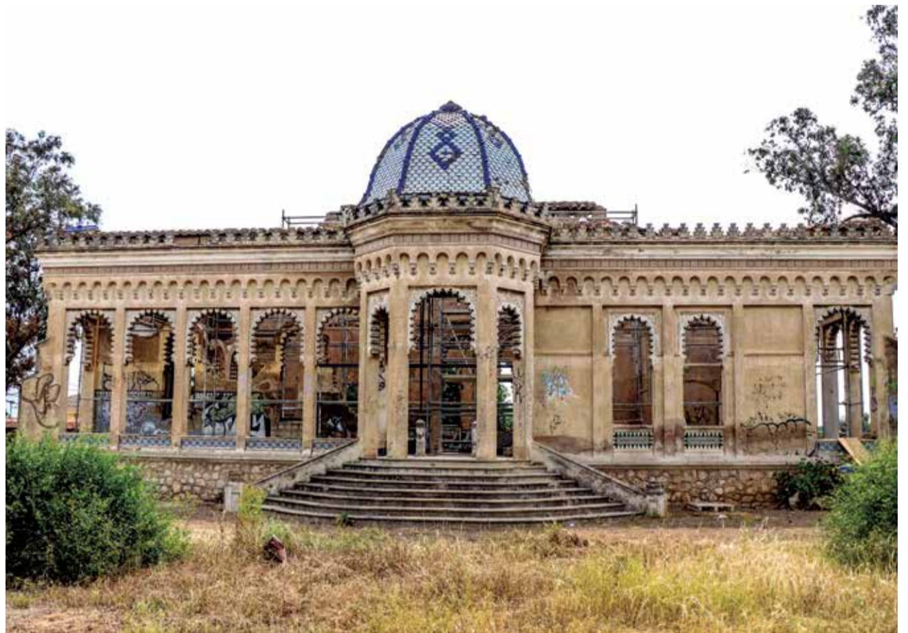
El Palauet Giner-Cortina en Torrent.

En 2006 el edificio residencial sufrió un incendio, como consecuencia del cual los elementos estructurales de madera y, sobre todo, la cúpula y la cubierta quedaron muy dañados, por lo que el conjunto arquitectónico se ha visto desprotegido y expuesto a la acción de la lluvia y la erosión. Por este motivo, las siguientes actuaciones que plantea este proyecto son medidas para recuperar en primer lugar el edificio residencial, es decir,