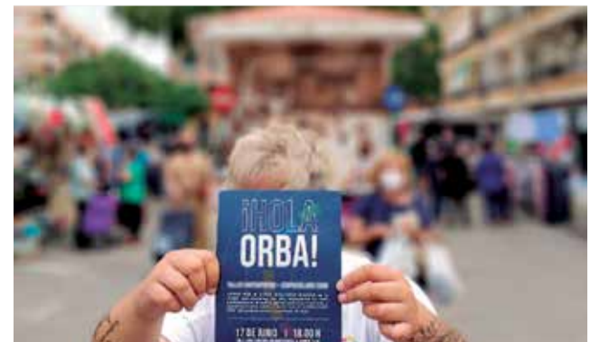
Plan estratégico municipal.