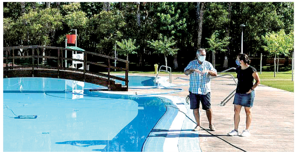
Supervisión de los trabajos en la piscina de Paiporta.

Benetússer será la única localidad de l'Horta Sud que opte finalmente por mantener cerrada este año la piscina de verano, tal y como ya pasó el pasado año pasado.