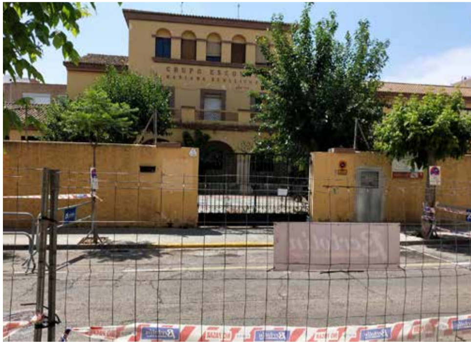
Façana de la nova biblioteca d'Aldaia.

Per a l'alcalde, Guillermo Luján, "es tracta del projecte més rellevant i demandat pels veïns i veïnes d'Aldaia des de feia temps, ja que l'antiga biblioteca s'havia quedat xicoteta, i realment el nostre municipi necessita un espai d'estudi i de formació a l'altura d'una ciutat de 32.000 habitants com la nostra". En este sentit, segons expliquen els tècnics de l'àrea, l'actual biblioteca compta amb 582 metres construïts enfront