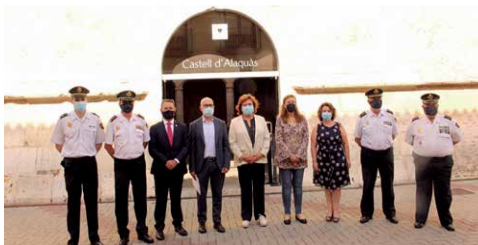
Acto de entrega del Bastón de Mando.