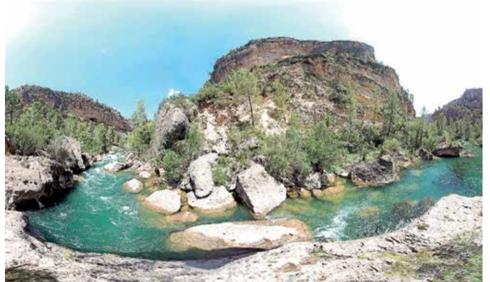
Parque Natural de las Hoces del Cabriel (Plana Utiel-Requena).

En los alrededores de la ermita había mucha actividad recreativa. También formaban parte del paisaje habitual de la ermita las casetas de los pescadores desde donde esperaban pacientemente la captura de una buena pieza. Este característico espacio de Alboraya está ubicado en una zona donde conviven campos agrícolas y una playa virgen. Pese a que este espacio está pendiente de un proyecto de regeneración ante la degradación sufrida con el paso del tiempo y la construcción en su alrededores de infraestructuras de comunicación, el entorno de la ermita dels Peixets conserva una singularidad digna de conocer.