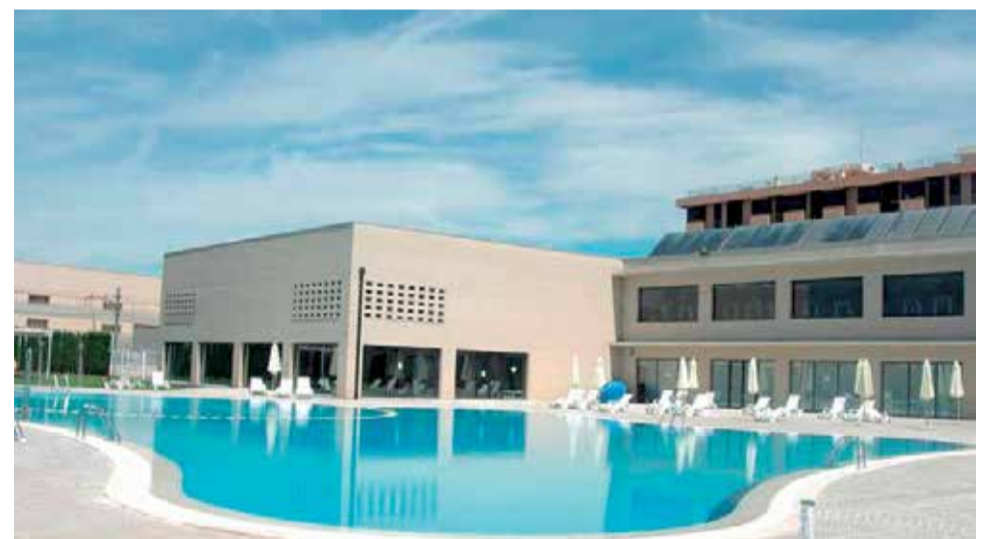
Piscina de verano en Alfafar.