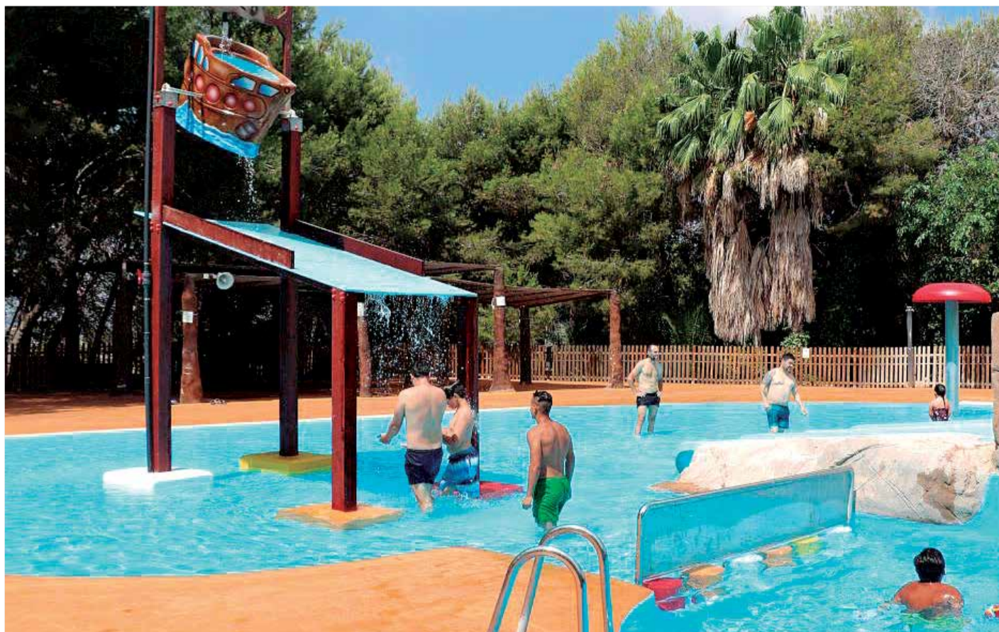
Piscina de el Vedat, en el municipio de Torrent, que abrirá sus puertas el próximo 1 de julio, con una gran cantidad de me-

En Catarroja, después de que el año pasado la piscina estuviese limitada exclusivamente para los equipos profesionales y la escuela de verano, el Ayuntamiento de Catarroja reabre su piscina al público general. También ha sido uno de los primeros