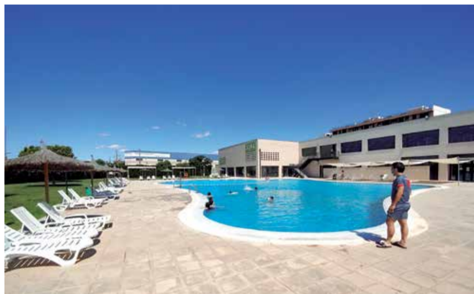
Piscina de verano de Alfafar.

época estival, ya que permitirá el baño de proximidad en una comarca valenciana que carece de costa para que los residentes puedan refrescarse. El Periódico de Aquí ofrece la lista completa de apertura. ▶ P6-7