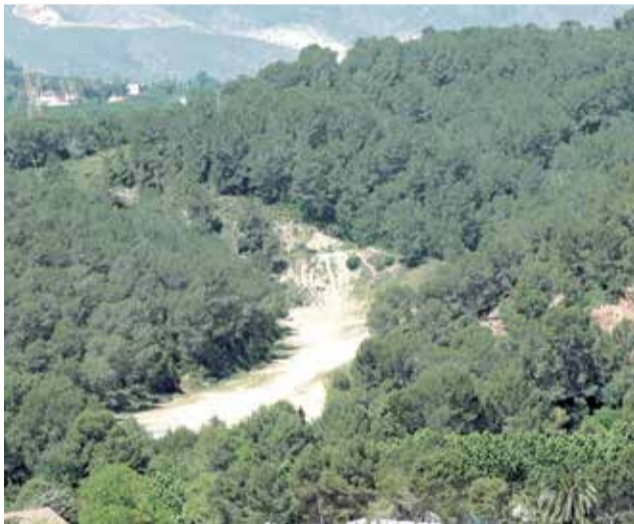
Les Salines, en el municipio de Manuel (La Ribera).

desierto como tal, sino un Parque Natural que ocupa cinco municipios: Benicàssim, Cabanes, La Pobla Tornesa, Borriol y Castellón de Plana, conformando más de 3000 hectáreas.