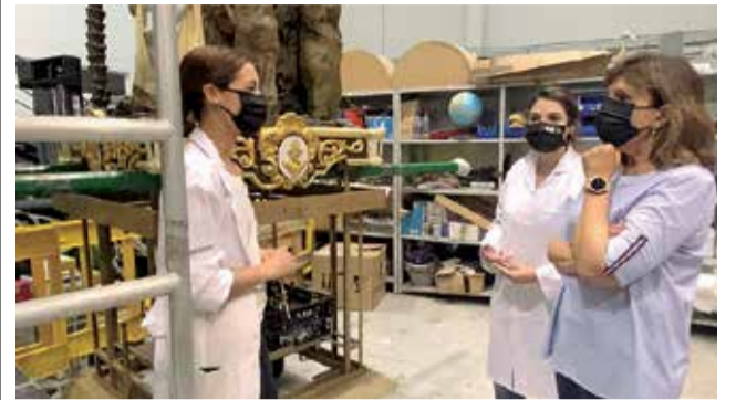
Restauración de San Onofre. / EPDA