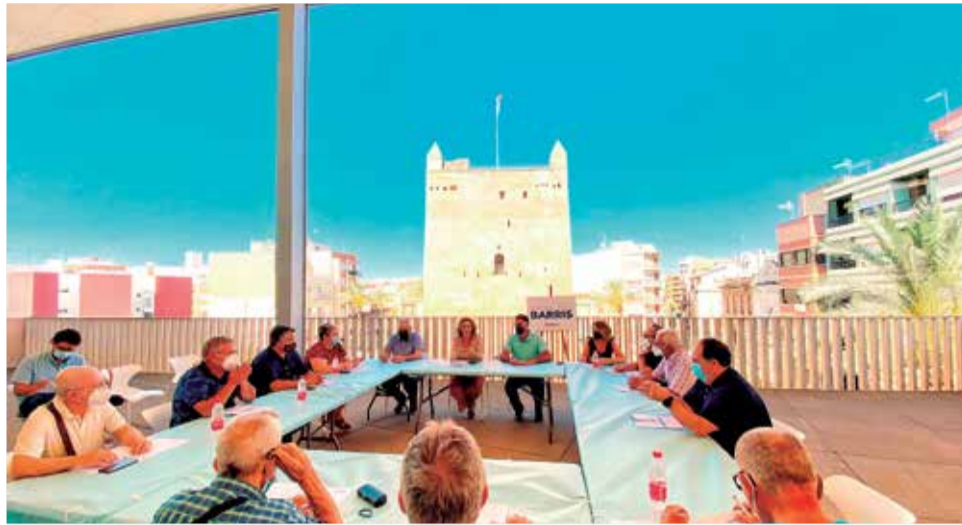
Reunión vecinal en Torrent.