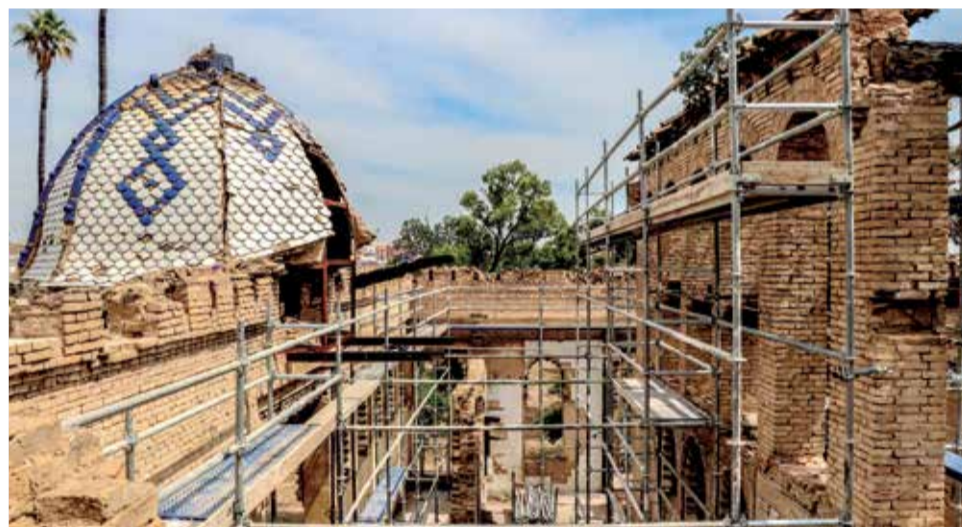
Trabajos de reparación en la estructura del inmueble.

el palacete, y consistirán en la retirada de los elementos de la estructura deteriorados; la retirada de los escombros y restos del derrumbe de la cubierta que permanecen en el interior de la edificación; la reparación de los elementos