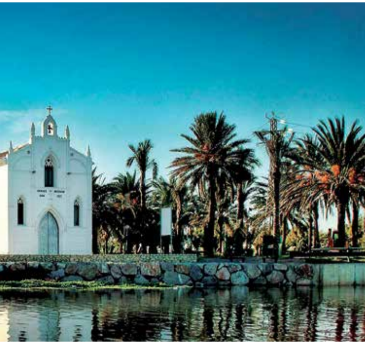
ubica junto al barranco del Carraixet.

► VERTEBRACIÓN. L'Albufera afecta a Alfafar, Sedaví, Massanassa, Catarroja, Albal, Beniparrell y Silla.