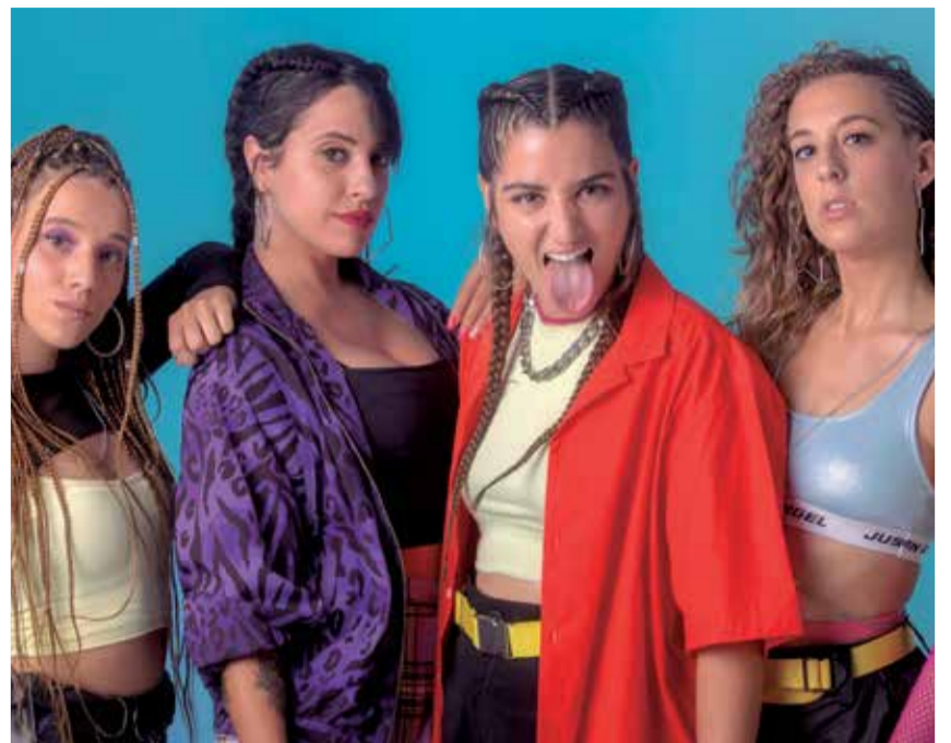
Actividades de ocio en el municipio de Mislata.

y volver a compartir experiencias son signos de que estamos recuperando nuestras vidas y el final del túnel está cada vez más cerca".