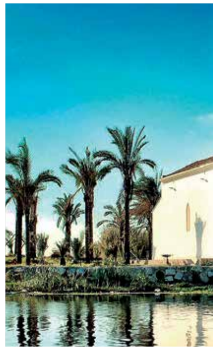
La ermita dels Peixets de Alboraya se