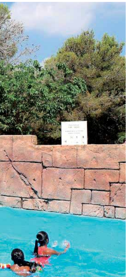
Medidas de seguridad.

deportistas federados También la dotación de Sedaví esta activa desde el 19 de junio, entre las 11 y las 19 horas y con abonos especiales para rebajar el precio de las entradas a los residentes.