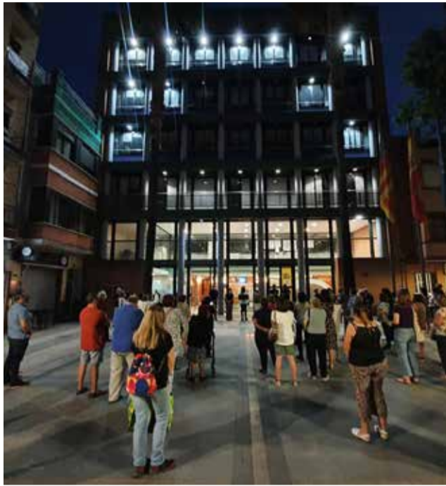
Concentrados frente al ayuntamiento.