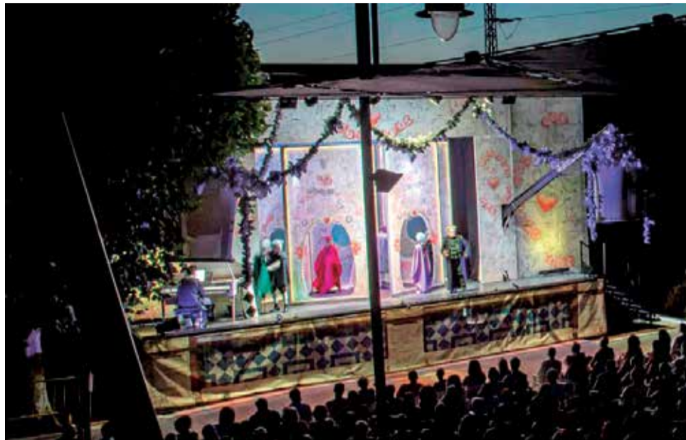
El Tutor Burlat, en su formato ambulante.

Amable, jovial y fresca como el paisaje de la campiña romana donde ocurre su trama, esta comedia primera de Vicente Martín i Soler evoluciona desde la crítica velada a las férreas normas sociales establecidas a mediados del siglo XVIII hacia la defensa de la libertad y el amor por encima de la convención y la conveniencia, a la vez que expone con cordial clarividencia el nuevo posicionamiento social de la mujer en los años previos a la Revolución Francesa. Este es el título que Les Arts presenta en su formato ambulante.