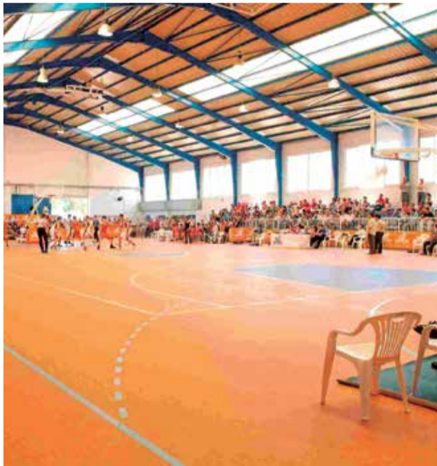
Poliesportiu d'Alcàsser.

El preu per a participar per al primer fill o filla és de 110 euros tot el mes o 70 euros cadascuna de les quinzenes, del 5 al 16 o del 19 al 30. En el lloc web municipal estan especificades les diferents bonifica-