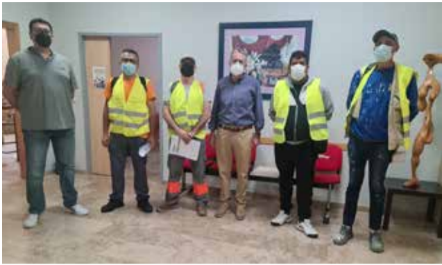
L'alcalde i el regidor durant la reunió.