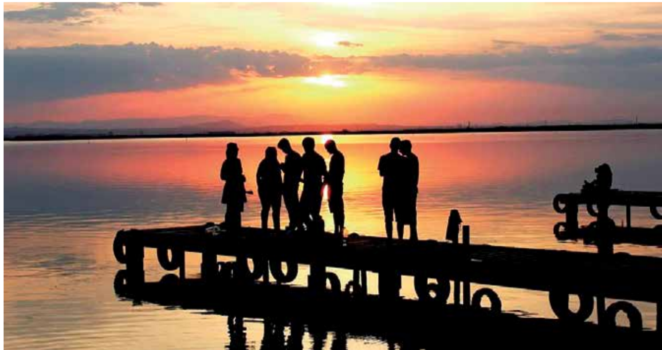
Atardecer en el Parc Natural de l'Albufera, uno de los humedales más valiosos (L'Horta Sud).

En un rincón de Alboraya, al lado del mar y en el margen derecho del Barranc del Carraxet, se encuentra una pequeña ermita marinera de estilo neogótico. Esta ermita, está dedicada al Santísimo Sacramento y tiene como fin la conmemoración de Miracle de los Peixets, ocurrido, según cuenta la leyenda, en 1348 en este mismo lugar.