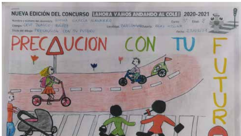
Dibuix premiat a Beniparrell.

El passat dia 2 de juny es va realitzar l'acte d'entrega del premi, consistent en una bicicleta i un casc valorats en 200€.