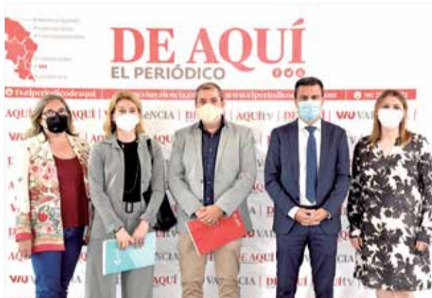
Algunos de los representantes en el acto.

agentes sociales, todas las empresas y todas las instituciones.