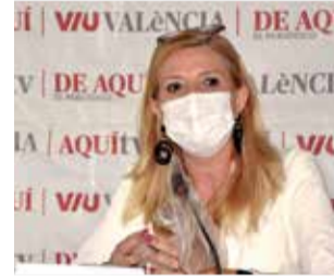
El Mirador de Sagunt, donde hubieras varias ponencias informativas.

se vea representado". La directora explicaba, en ese sentido, que, frente a los retos y amenazas de las grandes plataformas