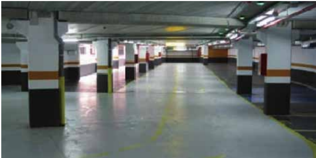
Pàrquing de San Cayetano a Manises.

Els fets es remunten a l'any 2010 quan el govern del PP va inaugurar l'aparcament i va començar a cobrar-li un cànon a l'empresa gestora i aquesta va reclamar un reequilibri econòmic per les pèrdues als dos anys d'obrir. En 2013 la mercantil va renunciar a la gestió de la infraestructura i l'ajuntament va iniciar, un any després, la rescissió del contracte. Llavors