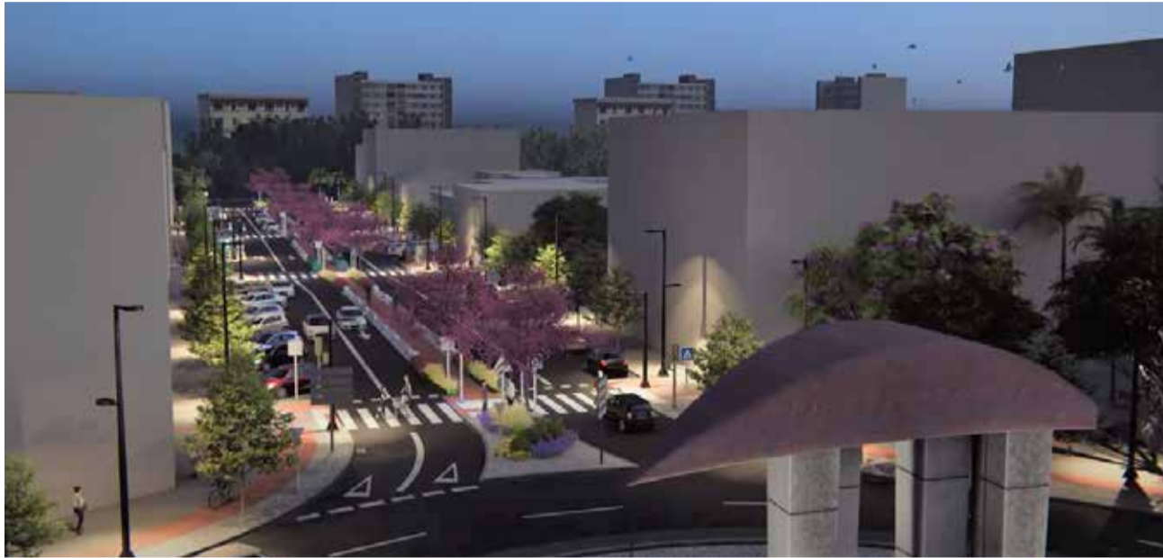
Carrers que s'estan millorant a Aldaia.

D'altra banda, en els treballs es millorarà l'eficiència i eficiència energètica amb el nou