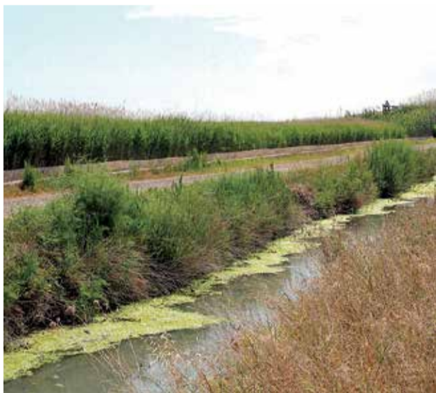
El Marjal dels Moros (Camp de Morvedre).