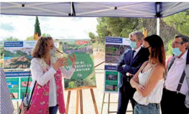
Visita a la zona de la Cantera.