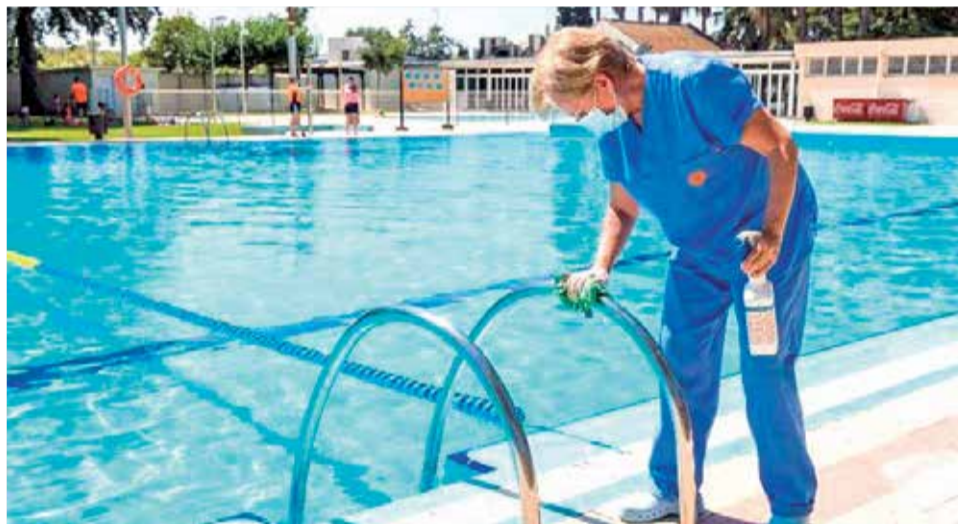
Trabajos de desinfección en la piscina de Picassent.

y mantendrá abierta la instalación hasta el 12 de septiembre, el cierre más tardío.