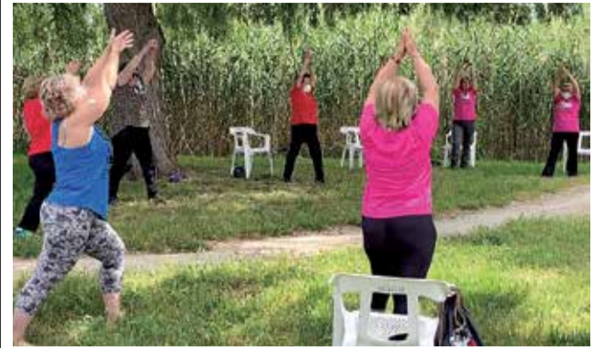
Mayores haciendo actividades al aire libre.