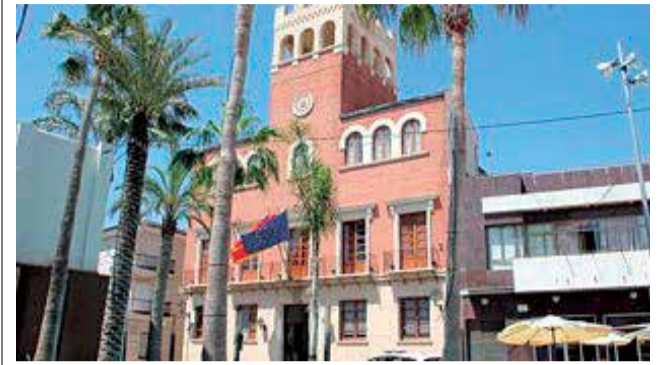
Ajuntament d'Alcàsser. / EPDA