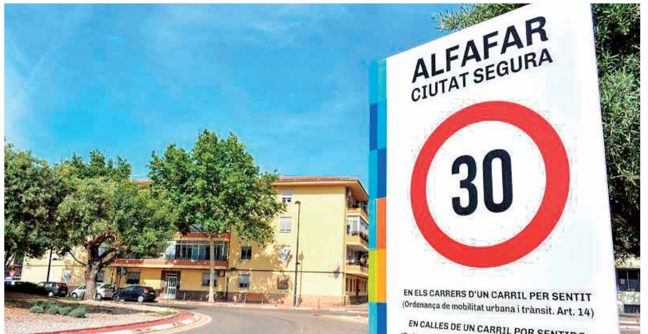
Señal de Alfatar a zona a 30.

De acuerdo con la normativa vigente, si no se respetan conllevan una sanción, así la multa por exceder la velocidad en las ciudades puede oscilar entre 100 y 600 euros, además de la posibilidad de perder hasta 6 puntos en el carné de conducir.