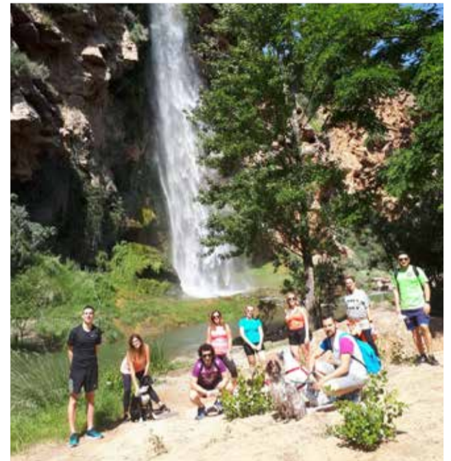
El salto de la novia de Navajas (Alto Palancia).

► BIODIVERSIDAD. La zona permite observar una importante variedad de fauna y flora.