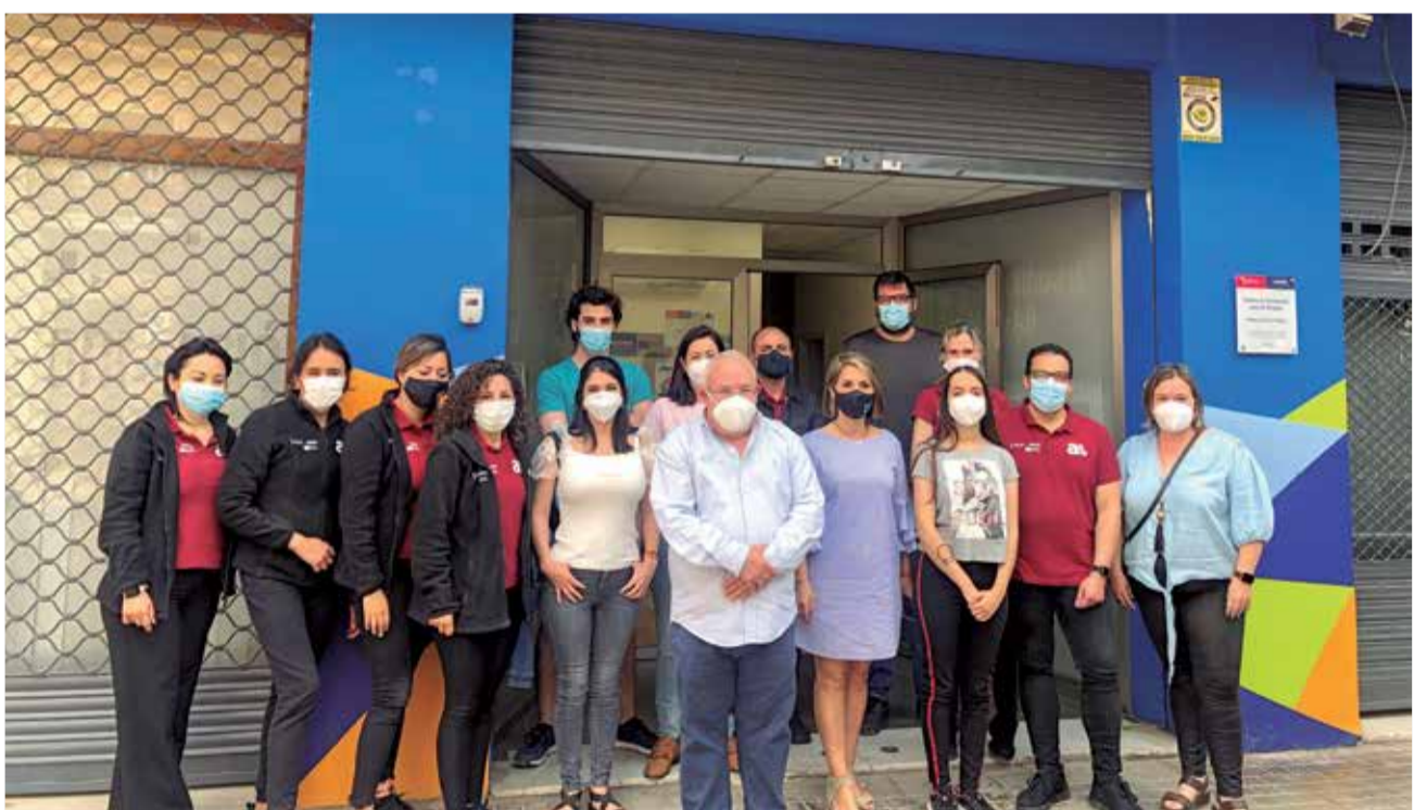
Alumnado el programa de formación y empleo. / EPDA

El alumnado continúa su formación teórico-práctica durante 12 meses