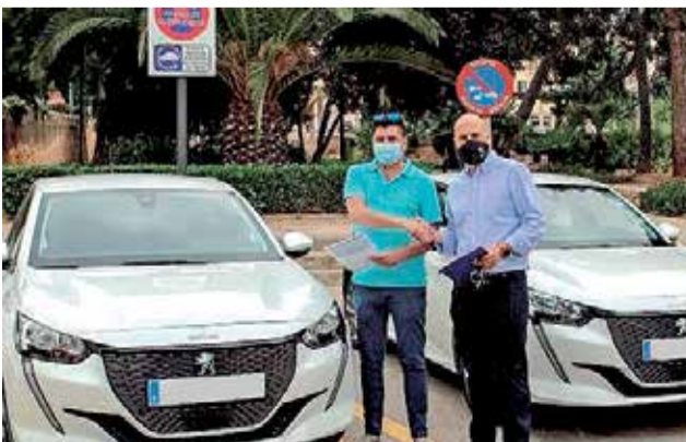
Visita a la zona de la Cantera.

El plan contempla también la instalación de un total de 15 puntos de recarga de vehículos eléctricos y la renovación del parque móvil con seis motos eléctricas.