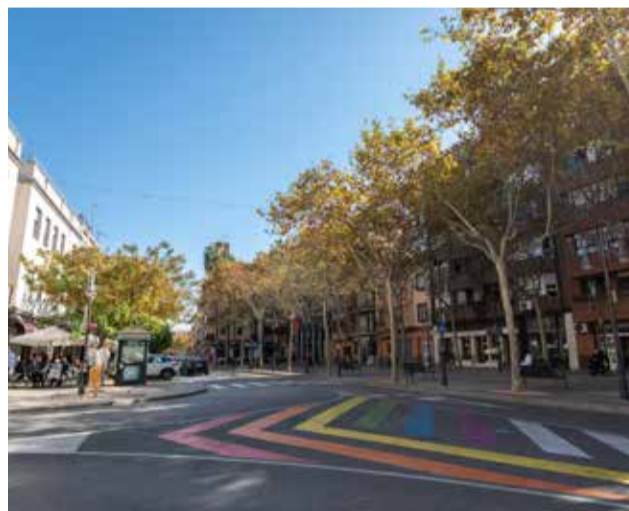
Plaza del Ayuntamiento de Aldaia.

Dado que la encuesta es totalmente online, desde el consistorio se ofrecerá a las personas mayores o con dificultades para gestionar las nuevas tecnologías con el objetivo de facilitar su participación en este proceso a través de la web y la app municipales, y hacer frente así a la bre-