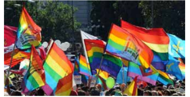
Manifestación del Orgullo.

cárcel e incluso penas de muerte, con un crecimiento de las agresiones homófobas.