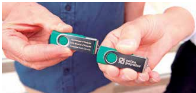
No hi havia una foto pitjor.

El Cant de la Carxofa és una de les senyes d'identitat culturals més importants d'Alaquàs que recentment ha sigut informat favorablement per la Comissió tècnica del Servei de Patrimoni Cultural de la Generalitat Valenciana i en breu serà declarat Bé de Rellevància Local Immaterial. Per este motiu, i amb la intenció de continuar protegint i donant a conèixer aquest Cant per tal d'apropar-lo a la ciutadania, l'Ajuntament d'Alaquàs, l'associació Amics i Amigues del Cant de la Carxofa, la Unió Musical d'Alaquàs i Caixa Popular han posat en marxa una iniciativa de promoció per tal de fer partícip totes les veïnes i veïns d'esta festa.