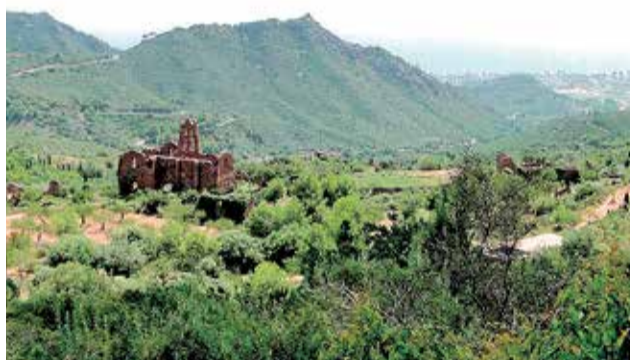
El desierto de Las Palmas (Castelló).

El parque está lleno de palmitos, única especie palmera originaria del continente europeo. Desde su punto más alto, la Cima del Bartolo, en la que se