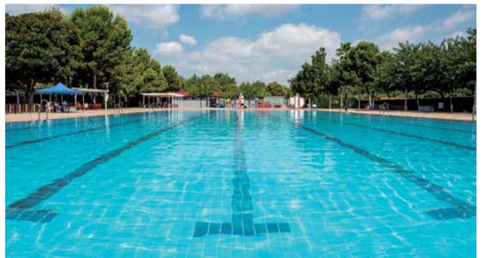
Todo listo en la piscina de Mislata.