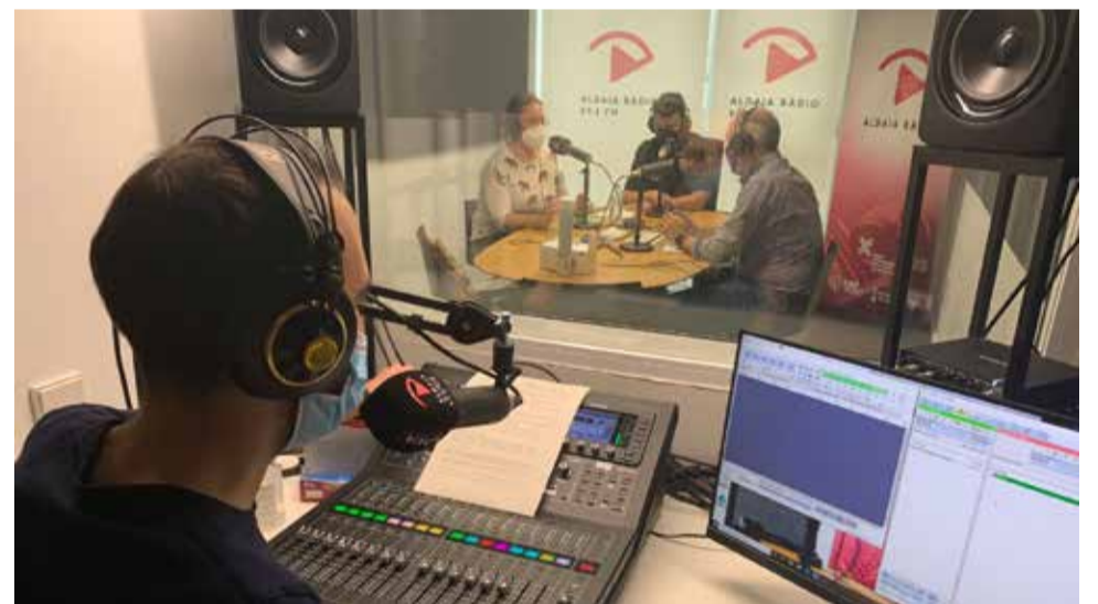
Un dels primers programes.

"Refresca't" s'emeta cada dimarts a les 20:00h en la 89.4