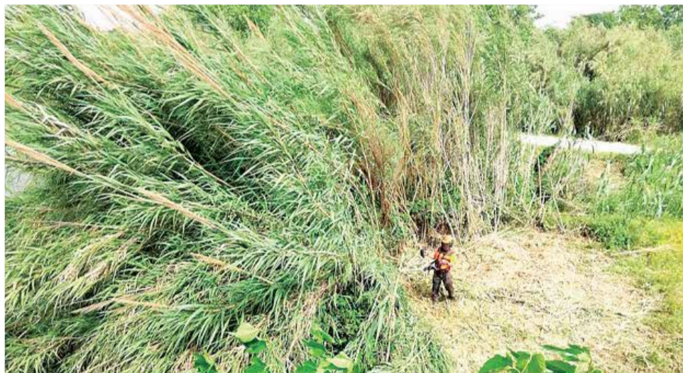
Tareas de limpieza de cañas en Quart.