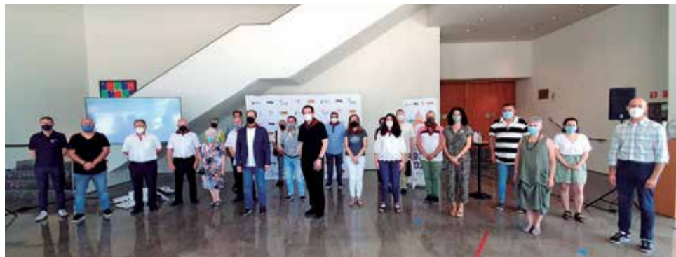
Un moment de la presentació.

Enguany, en commemoració del centenari del format actual de la celebració, s'han programat diferents actes culturals al voltant de la Baixà. El 22 de juliol a les 20.30 hores al carrer Major d'Aldaia tindrà lloc la inauguració de l'exposició "5 d'agost d'un