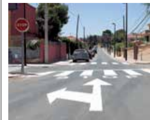
El Vedat.