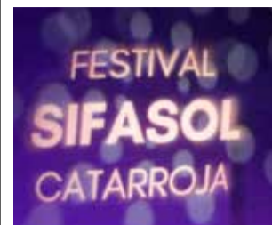
Festival Sifasol.