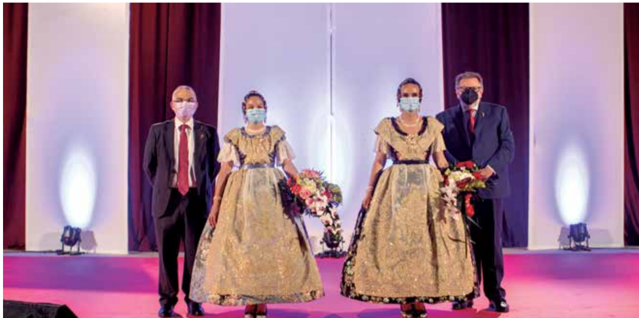
Falleras Mayores de Torrent de 2022.