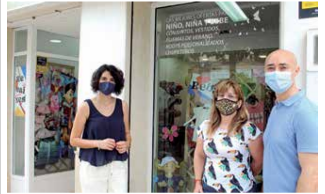
Ayudas al comercio en Quart.