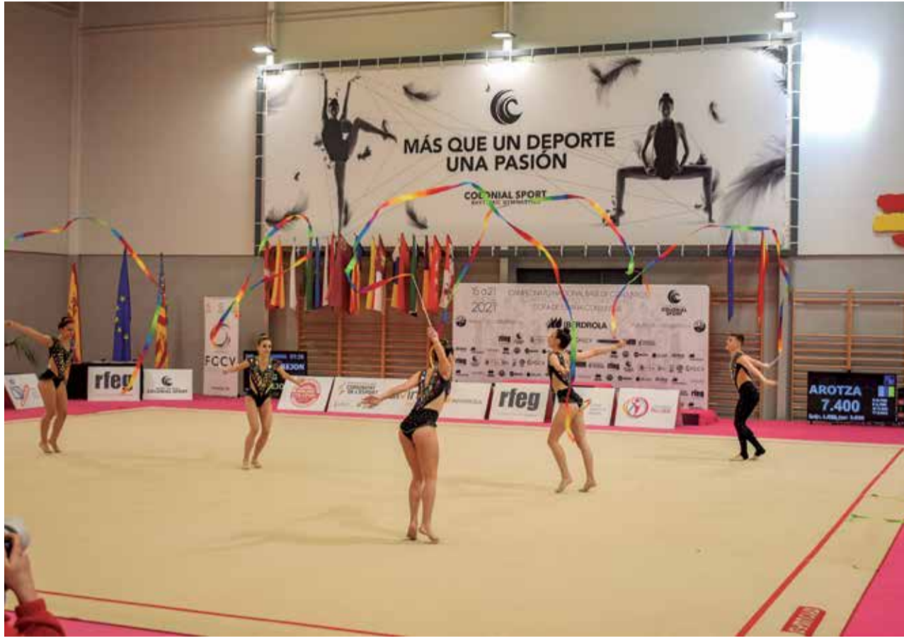
Campeonato Nacional de Gimnasia Rítmica en Alfajar.

Desde l'Ajuntament d'Alfajar, el concejal de De-