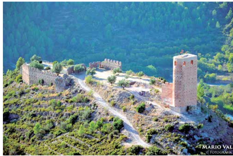
Fortaleza ubicada en la Sierra de espadán, en el término de Vall de Almonacid.

Entre las cumbres más altas de la Sierra de Espadán, en término municipal de Vall de Almonacid, destaca una fortaleza que fue levantada en el siglo XII