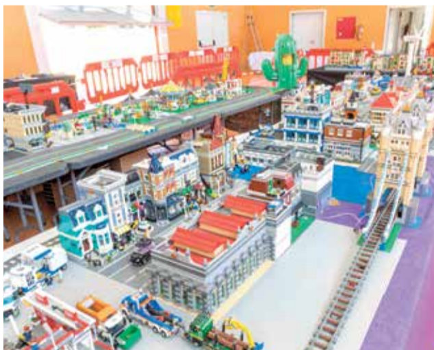
Imatge de la mostra.

I és que, la Regidoria de Joventut, ha posat en marxa per a este mes de juliol diverses activitats entre les quals es troba esta mostra, coordinada pel col·lectiu «Valbrick»