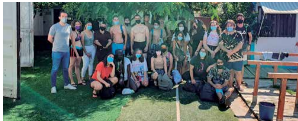
Joves participants.

Dimarts 29 de Juny: -Es va Visitar al Consell Valencià de la Joventut: Entitat orga-