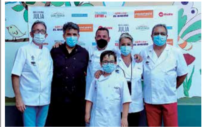
El xiquet participant a Manises.