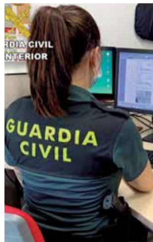
Agent de la GC. / EPDA

La Guardia Civil, en el marco de la operación "FACAL", ha investigado a 3 personas por un delito de extorsión, a través de amenazas de muerte, a un varón de avanzada edad. La investigación comenzó a finales del pasado mes de mayo, cuando un varón denunció, en el Puesto de la Guardia Civil de Picassent, que estaba siendo extorsionado por un individuo bajo amenazas de muerte. El presunto autor acompañaba a la víctima al banco para que extrajera dinero en efectivo y le hiciera entrega del