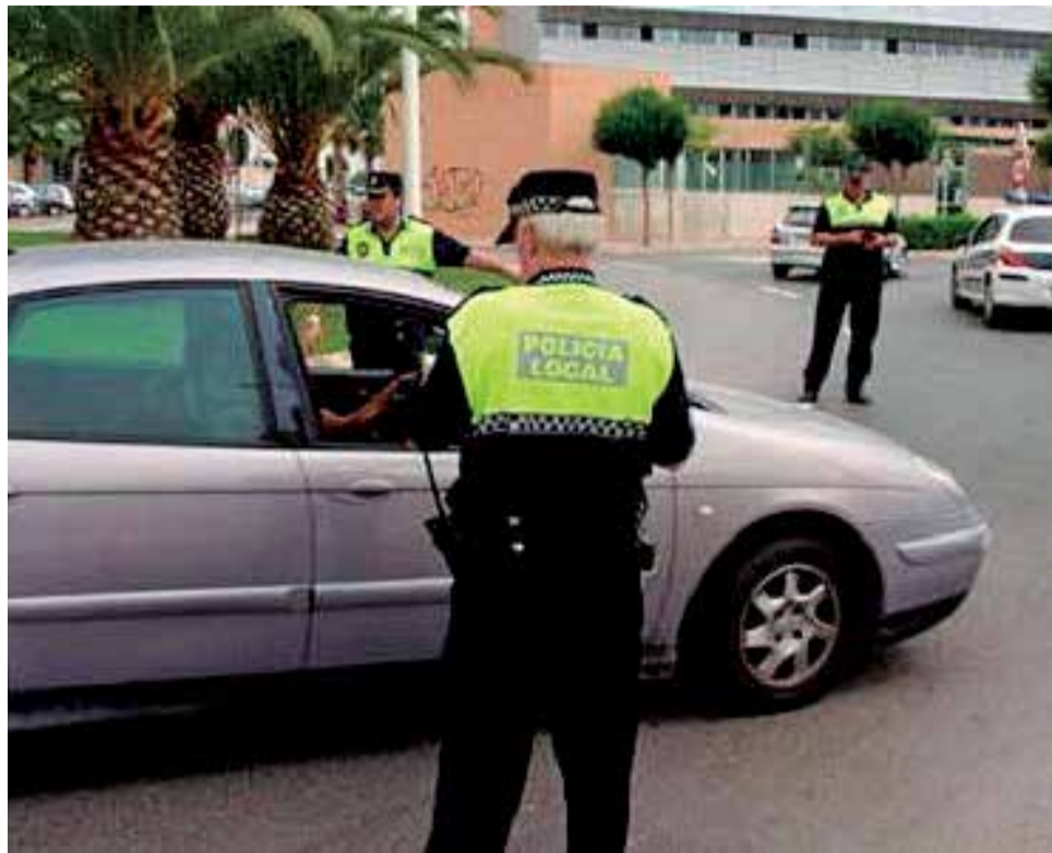
Agentes de la policía local de Catarroja.

acoso contra el comisario jefe del cuerpo. Aseguran que sufrían una "persecución" por parte de este superior, el cual intentaba acumular expedientes disciplinarios con-