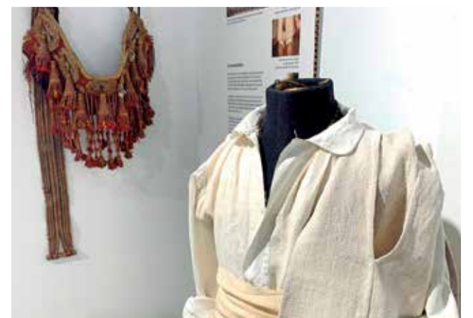
Part de l'exposició.

D'esta manera, l'exposició consta de 22 panells i més de 50 objectes, entre peces d'indumentària tradicional i objectes del camp per a cultivar el cànem. I es pot visitar fins al 30 de setembre de 2021, de 9 a 21 hores.