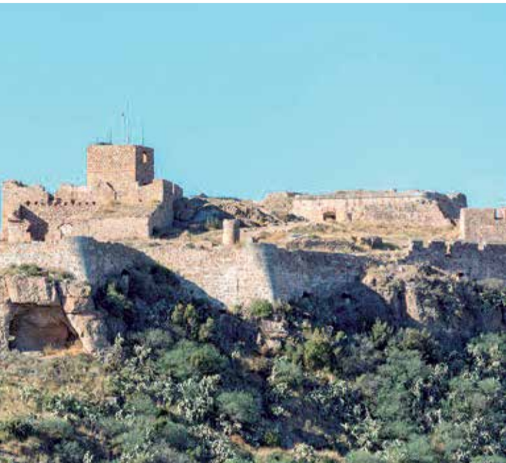
Los más importantes de la Comunitat Valenciana.

► INTERÉS CULTURAL. Fue declarado como Bien de Interés Cultural en 1990.