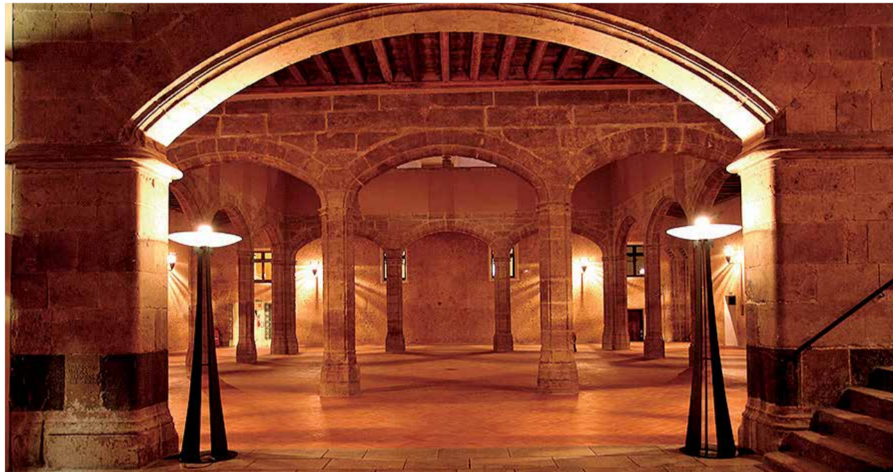
Patio interior del Castell d'Alaquàs.

En lo alto de la cima de la montaña de este municipio de la Ribera Baixa se ubica la imponente fortaleza del Castillo de Cullera. Construido por el estado cordobés en el siglo IX para el control estratégico de recursos naturales, vías de comunicación y fronteras, está configurado por la alcazaba y dos albacaras que cumplían funciones de guarecer a las tropas, caballerías, ganado y a la propia población en los momentos de asedio. Este castillo es fruto de numerosas remodelaciones y reformas llevadas a cabo durante más de mil años de historia. Desde la Edad Media hasta las Guerras Carlistas, el Castillo de Cullera ha sido testi-