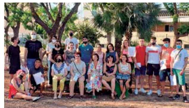
Alumnes i professors. / EPDA