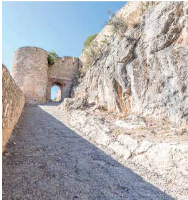
El Castillo de Chulilla, en la comarca de La Serranía.

► HISTÓRIA. Un gran proyecto constructivo datado a principios del s. XVI.