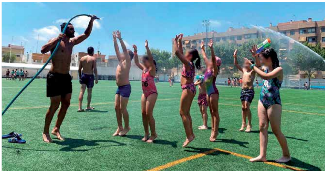
Els xiquets i xiquetes d'Aldaia s'ho passen d'allò més bé.

Així mateix la tradicional Escola d'estiu municipal continua sent una altra de les opcions favorites dels més menuts de la localitat. Amb una programació pensada de manera especifi-