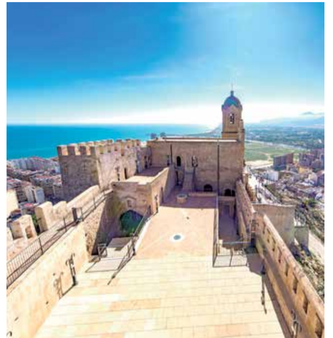
Castillo de Cullera, en La Ribera Baixa.

► POLIVALENTE. Acoge exposiciones pictóricas y escultóricas y representaciones teatrales.