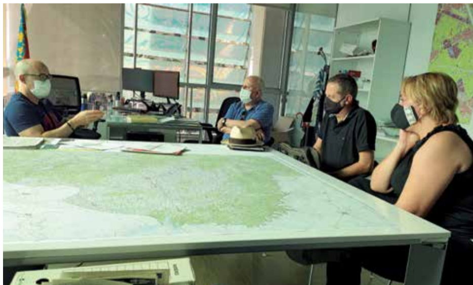
Reunión de acuerdo entre entidades.

La decisión se toma atendiendo a la Ley 21/2018, de 16 de octubre de Mancomunidades de Comunitat Valenciana