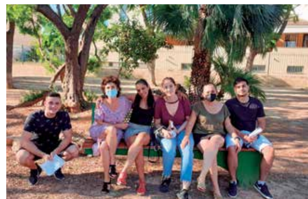
Alguns alumnes.