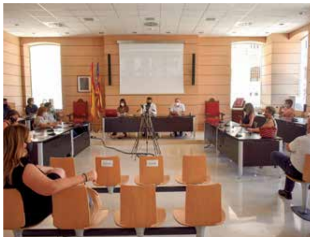
Pleno del Ayuntamiento de Alfafar.

Esta nueva Relación de Puestos de Trabajo (RPT) es un instrumento técnico que actualiza la ordenación de personal, de acuerdo con las necesidades de los servicios municipales, y se precisan los requisitos para el desempeño de cada puesto de trabajo, así como sus características retributivas. La necesidad de la