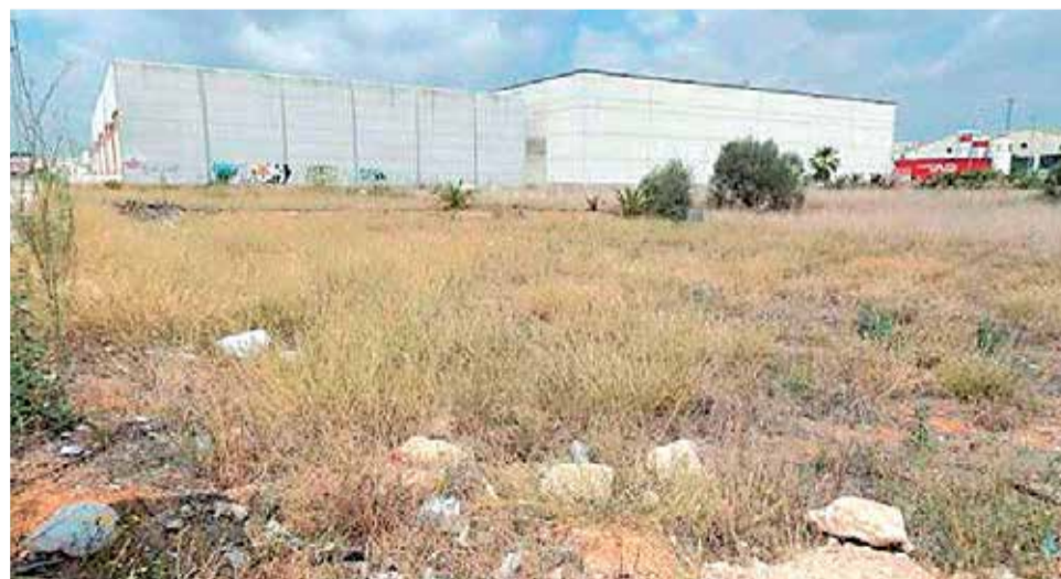
Un solar en mal estado en Alcàsser.

Del mismo modo, se llevan a cabo bandos informativos para la población advirtiendo de la necesidad de que los propietarios adecuenten los solares, ya que en muchos de ellos se incrementan los matorrales sin control, un tipo