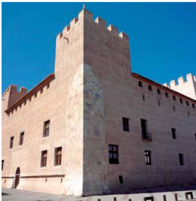
Fachada del Castell d'Alaquàs

monio de numerosos y relevantes hechos históricos. Está declarado Bien de Interés Cultural y es uno de los monumentos más visitados tras su recuperación y puesta en valor.