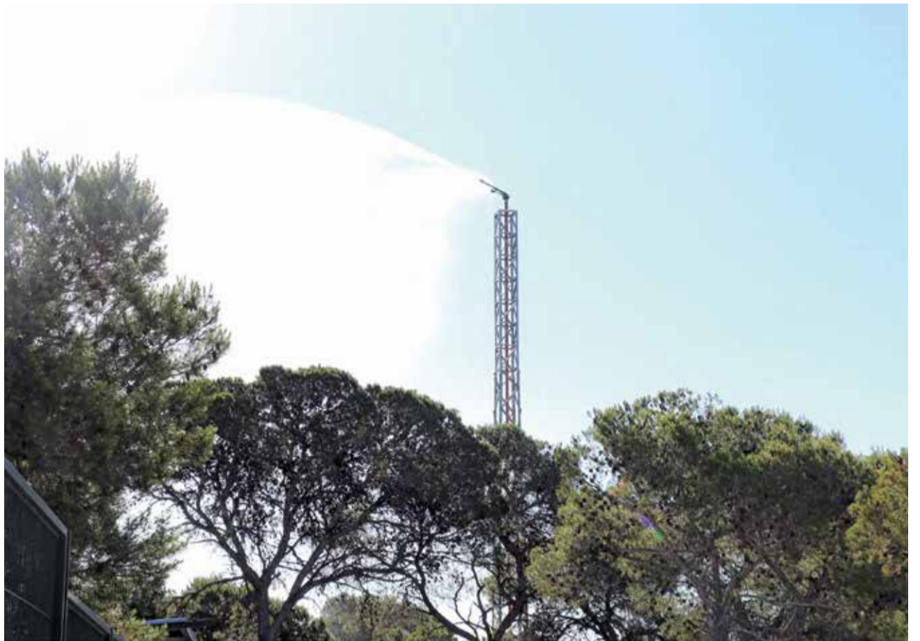
Cañones de agua en El Vedat de Torrent.

En este sentido, desde el ayuntamiento de Alcàsser aseguran que se realiza una limpieza exhaustiva de los caminos rurales, así también como de las acequias.