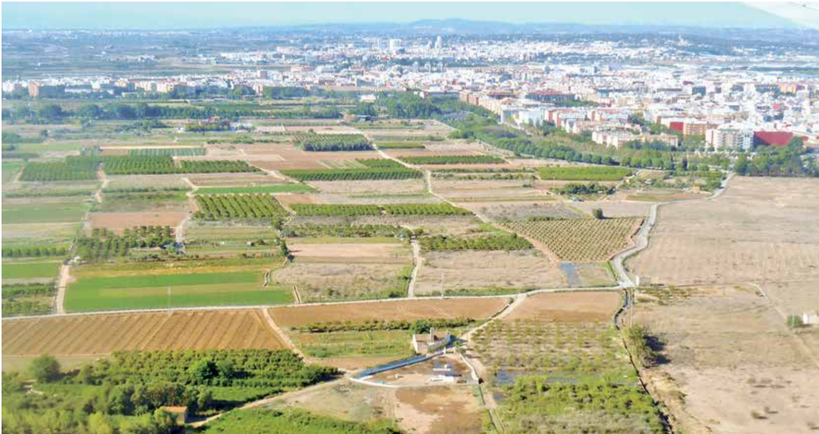
Vista aérea de la comarca de l'Horta Sud.

LA MANCOMUNITAT Y LA FUNDACIÓN HORTA SUD TRABAJAN DESDE 2017 EN LA DENOMINACIÓN ÚNICA DE LA COMARCA