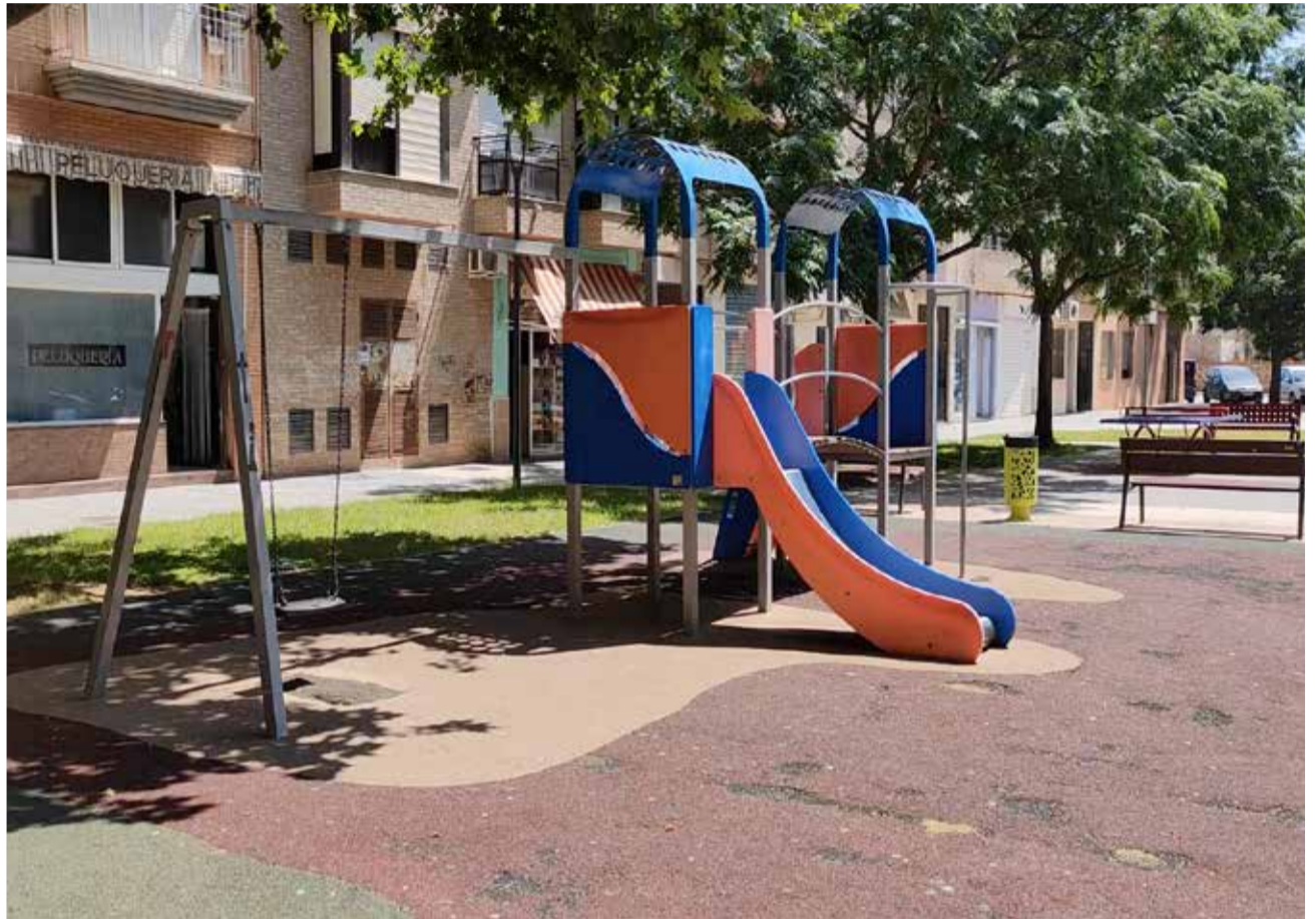
Arriba y abajo, diferentes zonas de parques infantiles en Alfatar.

De acuerdo con fuentes municipales, esta actuación que permitirá renovar todas las zonas infantiles del municipio demuestra la apuesta por la mejora continua y la calidad de los servicios e instalaciones municipales.