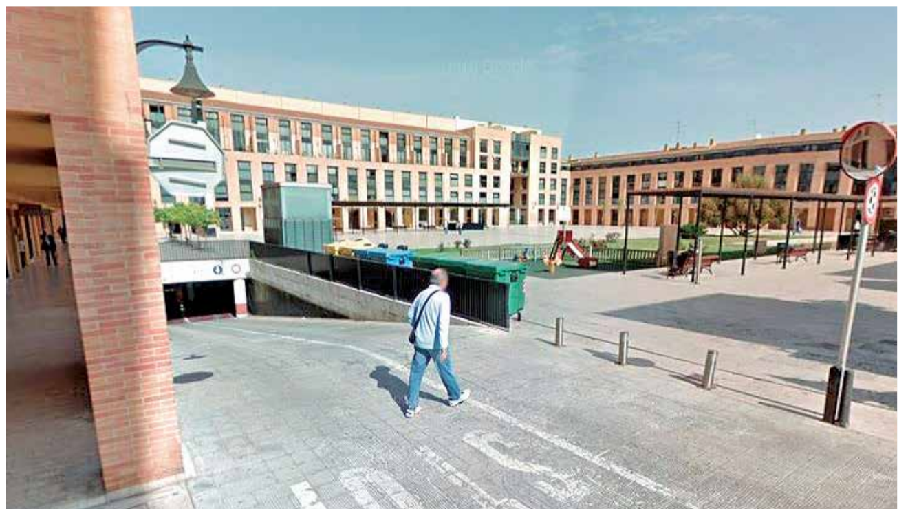
Aparcamiento Plaza Mayor de Catarroja.

En este línea desde la formación han censurado que "el Gobierno de Compromís y PSOE, cuya primera medida en esta legislatura fue subir los sueldos de Alcalde y Vicealcaldesa e incrementar las asignaciones a concejales y Grupos Municipales, no ha convocado una Asamblea en