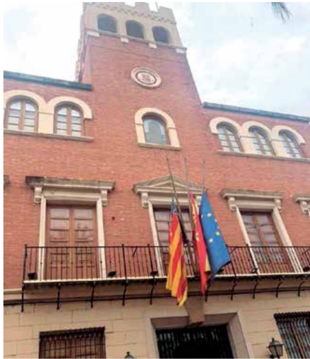
Actividades en Massanassa.

En este sentit, per a frenar el creixement dels contagis, des del Consistori es recorda la necessitat d'una freqüent rentada de mans, l'ús de la màscara i el manteniment de la distància social