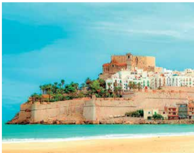
Uno de los castillos por excelencia, el de Peñíscola.

za una altura de 64 metros sobre el nivel del mar. Con una altura media de 20 metros y un perímetro que ronda los 230 metros, esta obra románica fu construida por los templarios sobre los restos de una antigua alcazaba árabe entre 1294 y 1307. Benedicto XIII de Aviñón, más conocido como