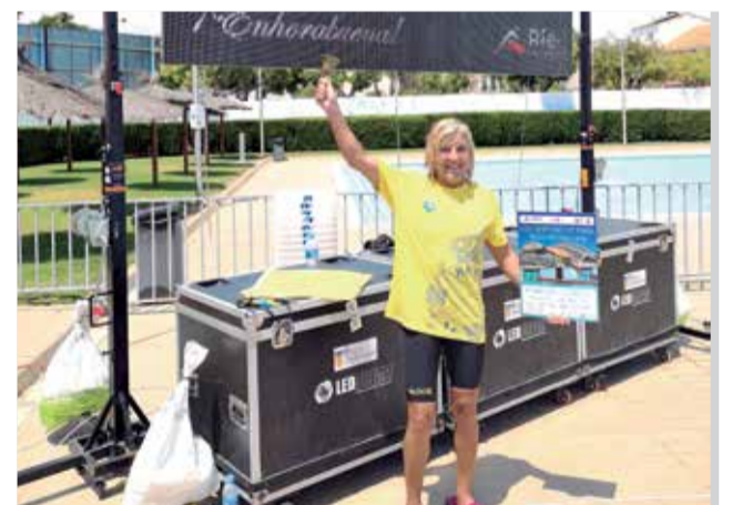
Presentación y diferentes instantes del campeonato celebrado en Sedaví.