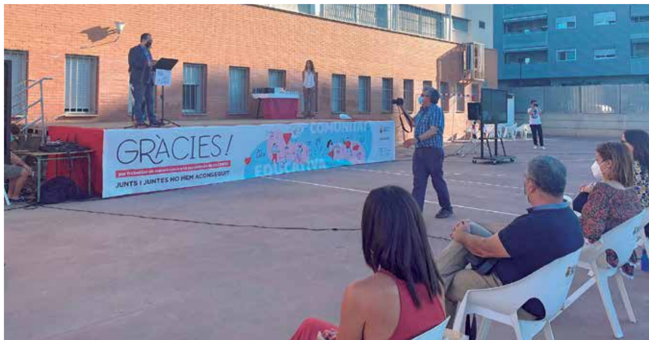
El alcalde interviene en el homenaje a la Comunidad Educativa de Aldaia.

Entre el público, gestos de resignación, aplausos y risas, a distancia y con mascarilla. Así termina un curso difícil en el que los centros educativos de Aldaia cierran con un sobresaliente.