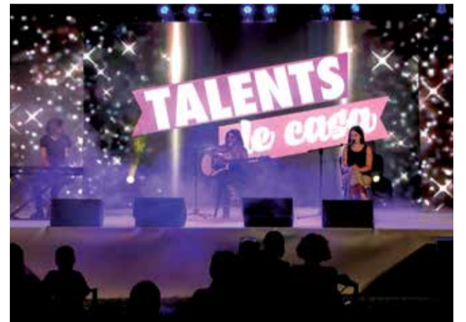
Diferentes instantes de la gala llevada a cabo en Torrent.