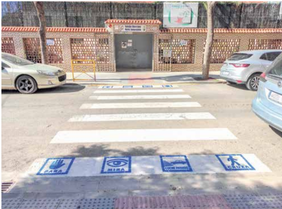
Pictogramas en Alfafar.

Aquells passos de peatons amb semàfor compten amb les indicacions "Para, mira, semàfor (verd) i creua", mentre que en el restu la seqüència indica "Para, mira, cotxe parat i creua".