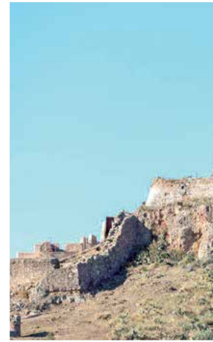
Castillo romano de Sagunt, uno de

El municipio de Chullilla es conocido por sus parajes naturales, punto de destino de diversos escaladores y excursionistas. No obstante, el consistorio tiene otros planes, y es que uno de los objetivos es diversificar el turismo hacia otros lugares conocidos, como puede ser el Castillo si-