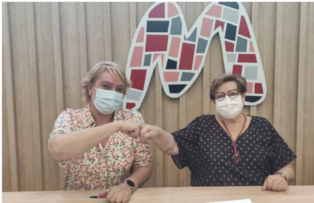
Acord de la Mancomunitat de l'Horta Sud y la Unió de Consumidors.

Els veïns de Llocnou de la Corona podran també utilitzar el servei en qualsevol de les ubicacions. L'objectiu de