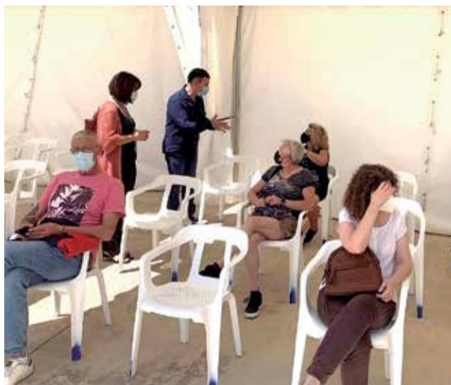
Centre de vacunació.

El trasllat es realitzarà durant el cap de setmana per a no perdre ni un sol dia en un procés tan important i històric com és la vacunació per a previndre el COVID19.