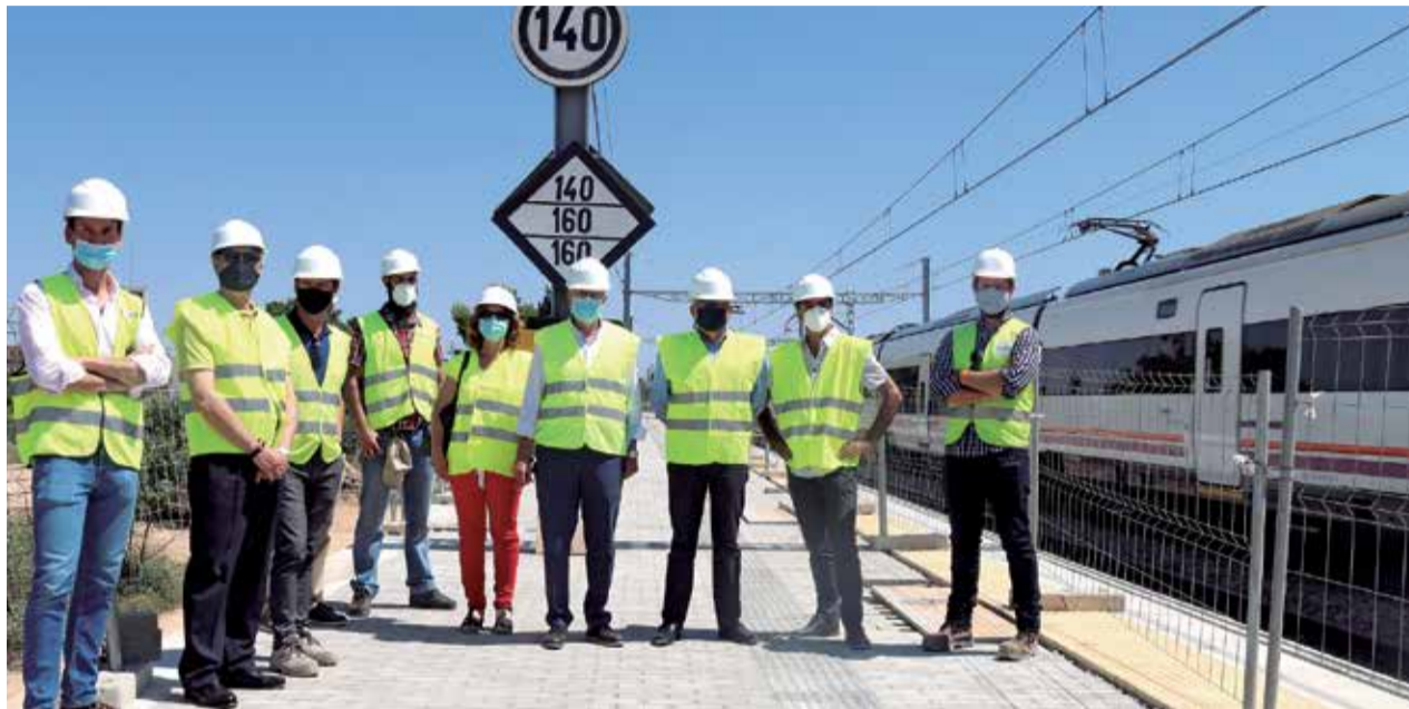
Estado del proyecto en Albal.