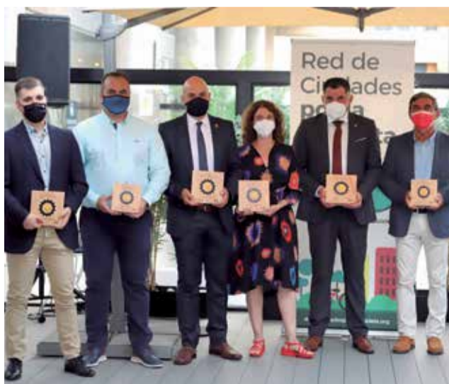
La entrega de los premios.

El proyecto se fundamenta en tres pilares: la solidaridad, la sostenibilidad y la movilidad sostenible con la bicicleta como herramienta. El concejal del área de Movilidad y