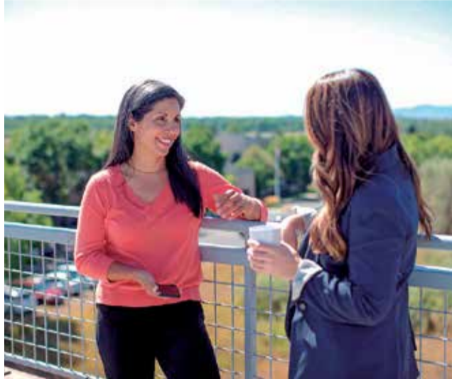
Servicio de atención en Quart.

La pandemia ha empeorado la salud mental de la población y ha hecho aflorar enfermedades que no habían sido diagnosticadas debido a que, hasta el momento, eran leves y pasaban desapercibidas. Tal es el caso de algunas esquizofrenias, trastornos bipolares o psicosis. Además, también se han incrementado los casos de depresión, angustia, tristeza y suicidios. Ante el avance de esta situación, el Ayuntamiento