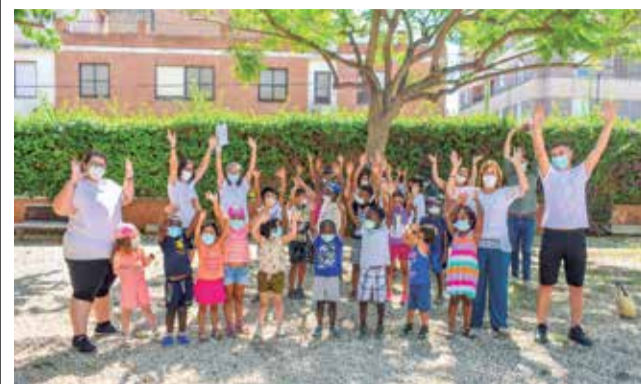
Actividades en Alfafar.