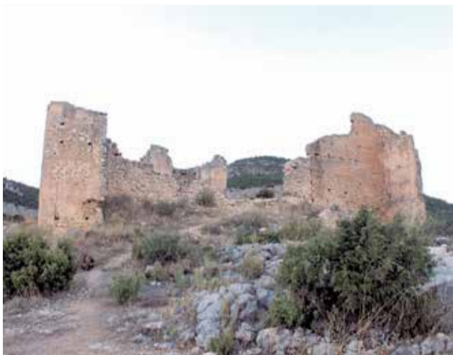
El castillo de Chera domina el desfiladero.

mejorar su estado de cara a los futuros visitantes.