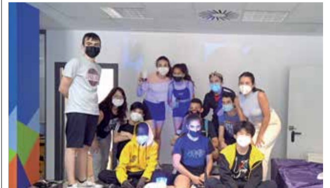
Actividades en Alfajar. / EPDA