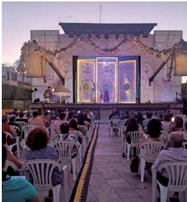
'El Tutor Burlat', en Alfajar.

El acto fue un éxito de asistencia y contó con todas las medidas sanitarias vigentes para garantizar la seguridad de todas las personas asistentes. Esta ópera buffa en tres actos es la comedia primera