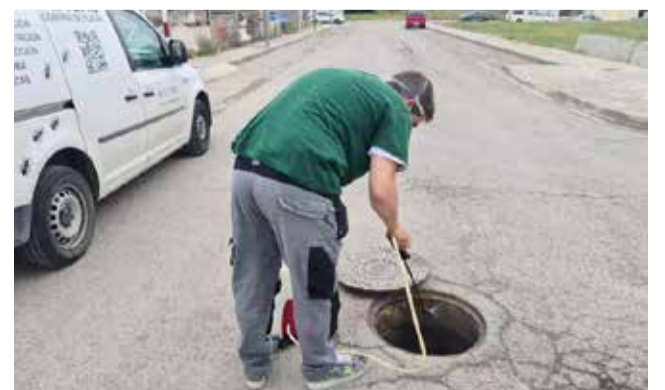
Un operario analiza el alcantarillado.

En total, la Diputación de Valencia hace anualmente una aportación para este capítulo que supera los 250.000 euros y de la que se benefician más de 200 municipios de todo tipo pero, principalmente, del interior de la provincia.