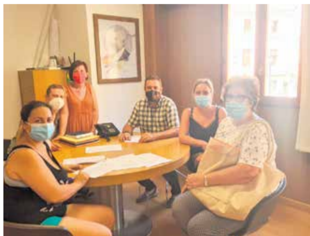
Gaticos chivanicas firman el convenio.

Desde la asociación han querido trasladar su agradecimiento a la ciudadanía por su respaldo: "Damos las gracias al pueblo de Chiva por