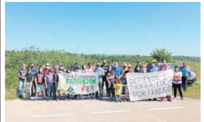
Vecinos movilizados contra la planta. / SALVEM FARRAJON