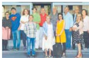
Micalet Teatre.