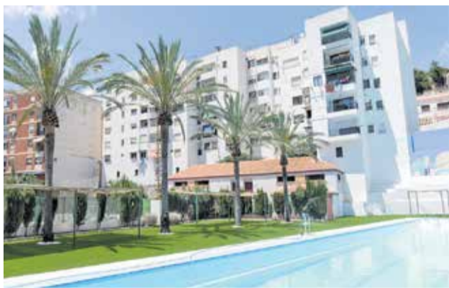
La remozada instalación.

"Durante la segunda fase de las obras, que han contado con un presupuesto de 148.000 euros y que ahora se han dado por finalizadas, además de realizar la repa-