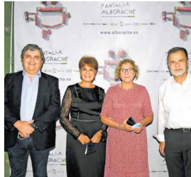
Jurado y autoridades en la entrega de premios.

Como muestra de este apoyo en la gala de clausura y entrega de premios estuvieron presentes algunas autorida-