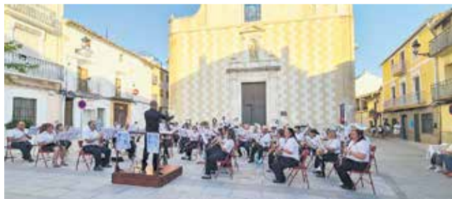
La Sinfónica en la plaza de la Constitución.