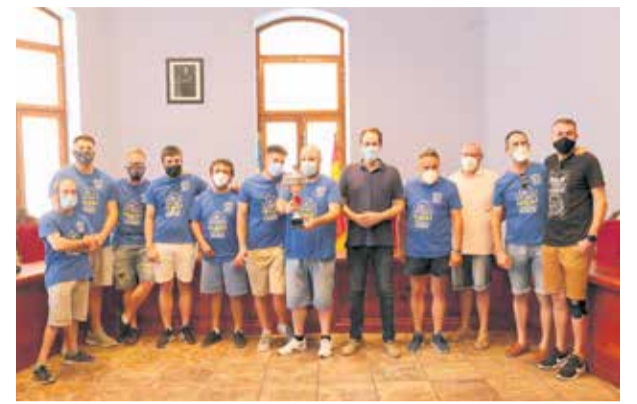
El Cheste BC en la recepción institucional.