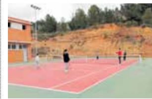
Pista de tenis.