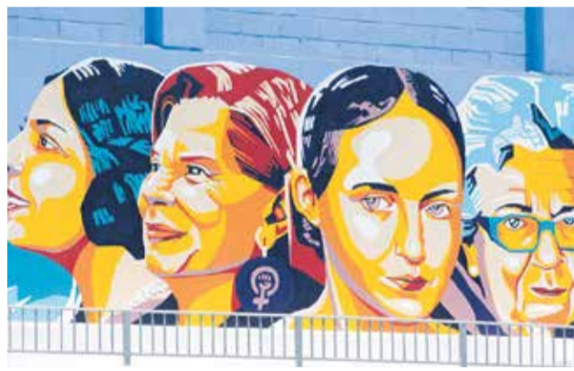
Mural 'la gran ola feminista' realizado en la piscina.