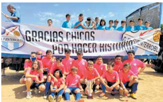
Foto de los héroes de Fuenterrobles.