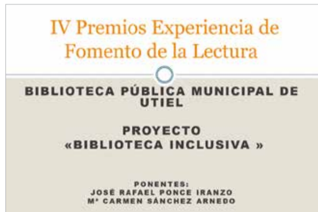
Cartel del galardón concedido a la Biblioteca de Utiel.

El proyecto presentado por Utiel obtuvo un premio dotado con 1.000 euros en bibliografía de lectura fácil para acometer el proyecto expuesto teniendo un rincón exclusivo en la Biblioteca Pública Municipal.