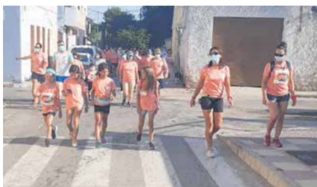
Un momento de la marcha.