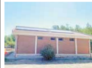
Aulario de Jaraguas. / EPDA