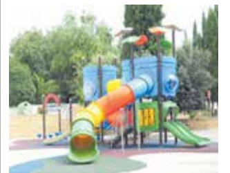
Parque Los realencos.