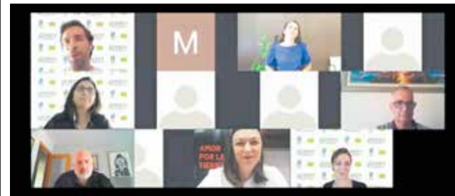
Captura del webinar organizado por CAECV y la DO.