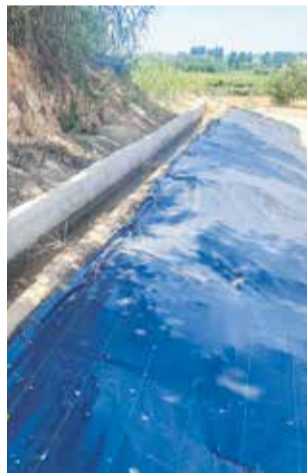
Geotextil instalado.

rado y abierto el camino de más de 350 m de longitud.