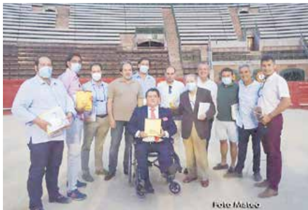
Foto familia tras el acto.