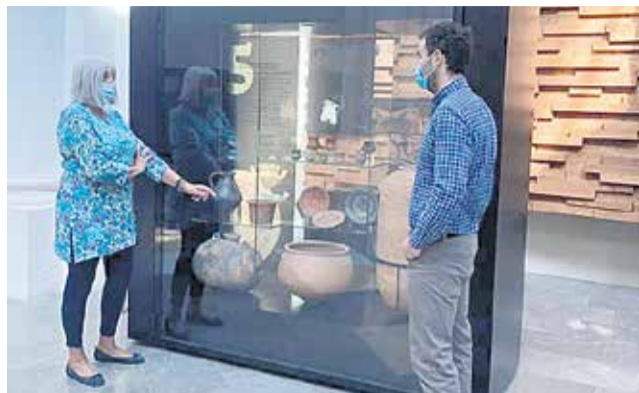
Visita institucional a la Iglesia de San Nicolás.