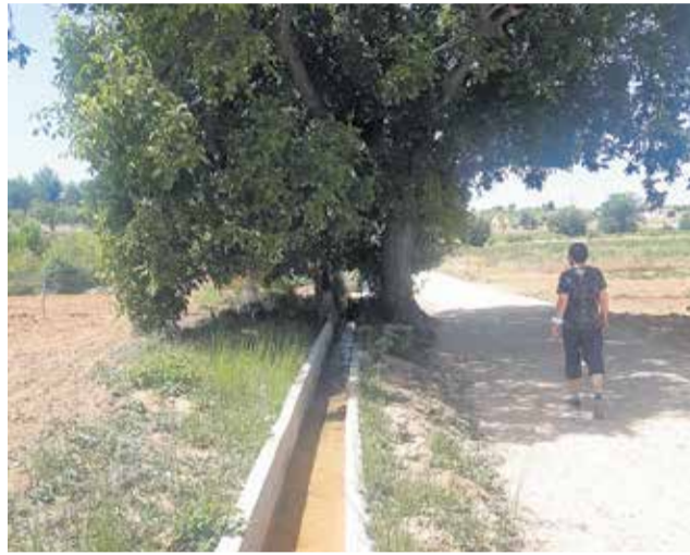
La acequia y el camino reparados.

Todo ello a través de las subvenciones de la Diputación de Valencia, que han permitido una inversión de 28.500 euros para que, en dos fases, se hayan reconstruido más de 300 m de acequia y se haya mejo-