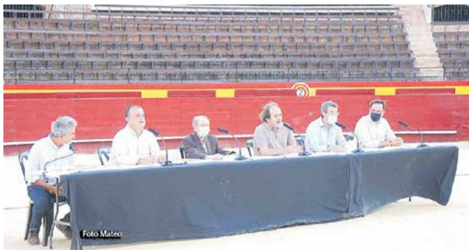
Autores y autoridades en la presentación de los libros.