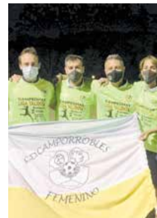
Diferentes momentos de una temporada histórica para el CD Camporrobles.

por un tercer puesto del grupo en esa Liga Oro.