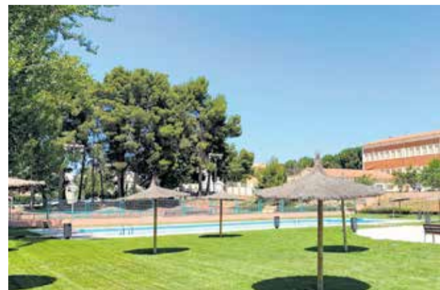
La apertura de la piscina se retrasa.

Los principales cambios promovidos con respecto a otros años y que han causado el malestar de los vecinos es el cierre a mediodía, así como lo que consideran falta de coordinación en cuanto al aforo (en algunas ocasiones, por la mañana, era de 120 personas y, por la tarde, se limitaba a 50).