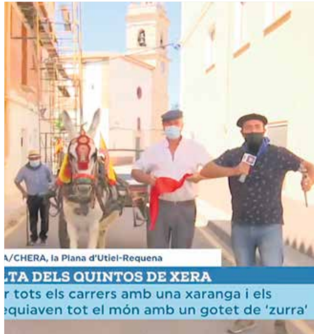
LA CHERA, la Plana d'Utiel-Requena TORTA DELS QUINTOS DE XERA Per tots els carrers amb una xaranga i els equiaven tot el món amb un gotet de 'zurra'

Aparte de ser el único pueblo de la comarca que cele-