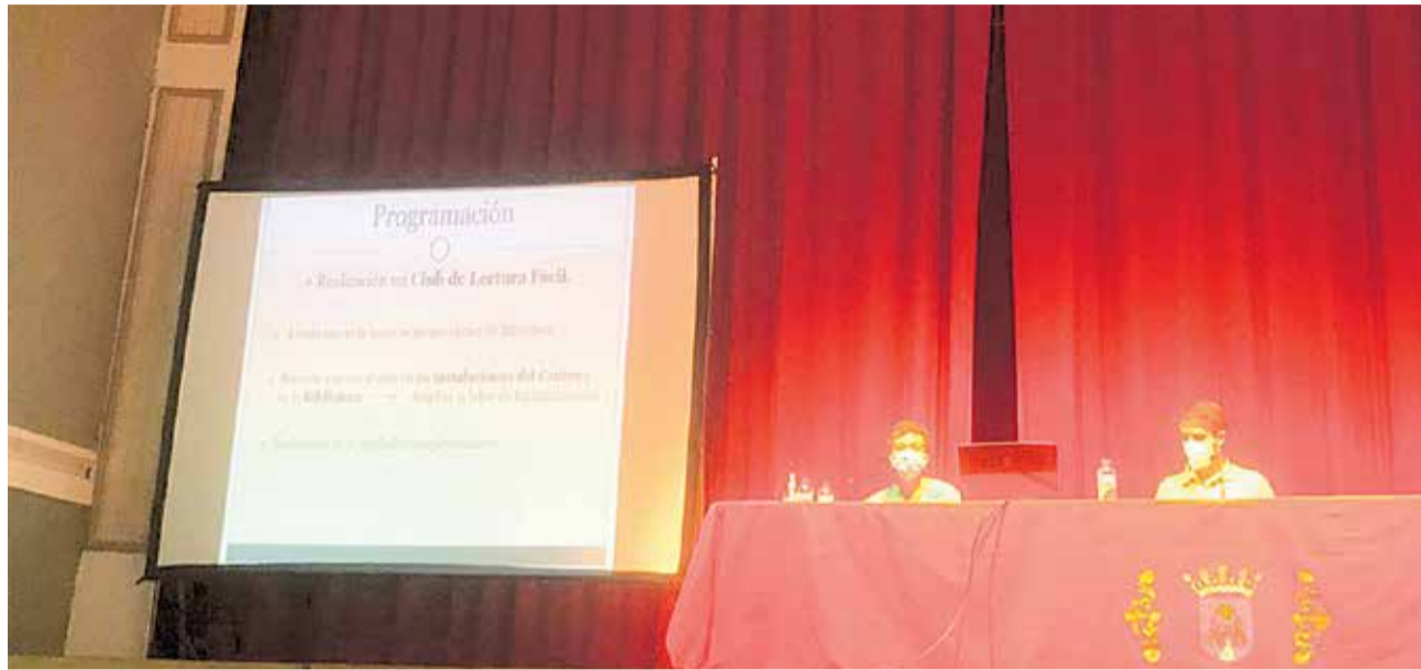
Acto de presentación del proyecto ‘Biblioteca inclusiva’ de Utiel en Bocairent.

Entre los temas a abordar el proyecto incluye acciones vinculadas a Objetivos de Desarrollo Sostenible (ODS), medio ambiente y alianzas entre entidades a través de charlas y talleres, así como la implantación de un Club de Lectura Fácil que les permitan desarrollar su creatividad y colaborar de forma activa en la preparación de actividades.