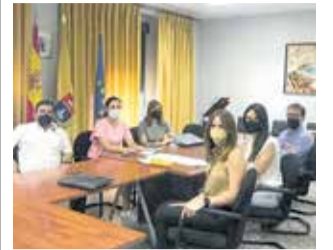
Reunión de trabajo.