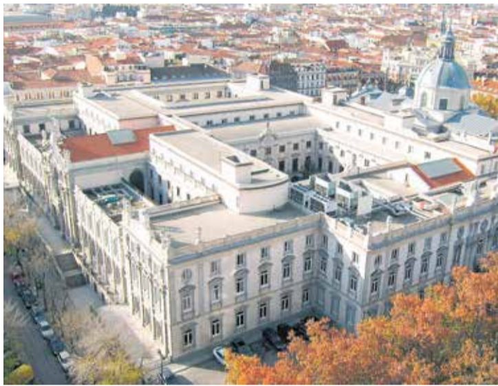
Vista aérea del Tribunal Supremo.

Pero, en el caso de la DO Valencia, la modificación de su demarcación geográfica operada en las Órdenes 13/2011 y 3/2011 no se ajustó a los requisitos exigidos en la normativa comunitaria, al no incluirse en el Pliego de Condiciones con el detalle requerido el 'vínculo' de la DO Valencia con los terrenos situados en los términos municipales incluidos en las Denominaciones de Origen Protegidas de Utiel-Requena y Ali-