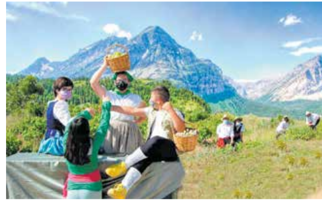
Recreación de 'La Vendimia', de Goya.