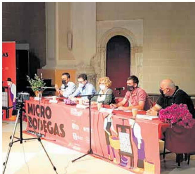
Jornada inaugural de la jornada de micro bodegas.

Los tres ejes sobre los que giraron los diferentes debates fueron el contexto actual de las micro bodegas y las políticas alternativas; cómo montar una micro bodega; y las