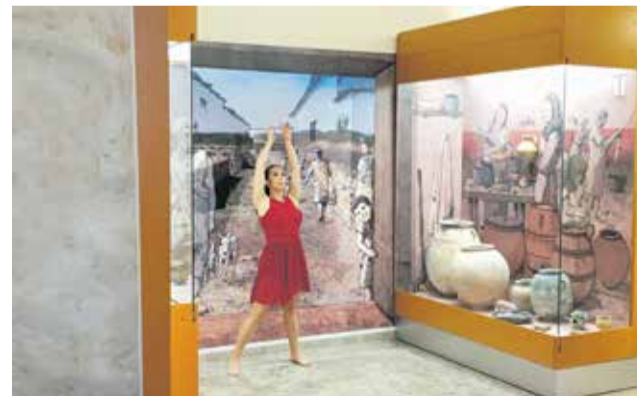
Exhibición artística en el museo.

La primera de ellas tendrá lugar los días 4, 5 y 6 de agosto y consistirá en una serie de talleres sobre el mundo de los iberos. El día 4, el horario del taller será de 18.00 a 20.00 horas mientras que los días 5 y 6 habrá sesiones tanto de mañana como de tarde: entre las 11