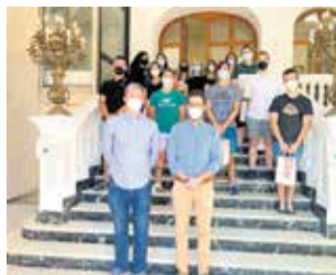
Estudiantes becados. / EPDA