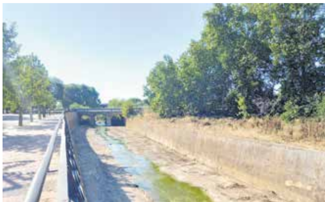
El tramo del río tras las labores de limpieza.