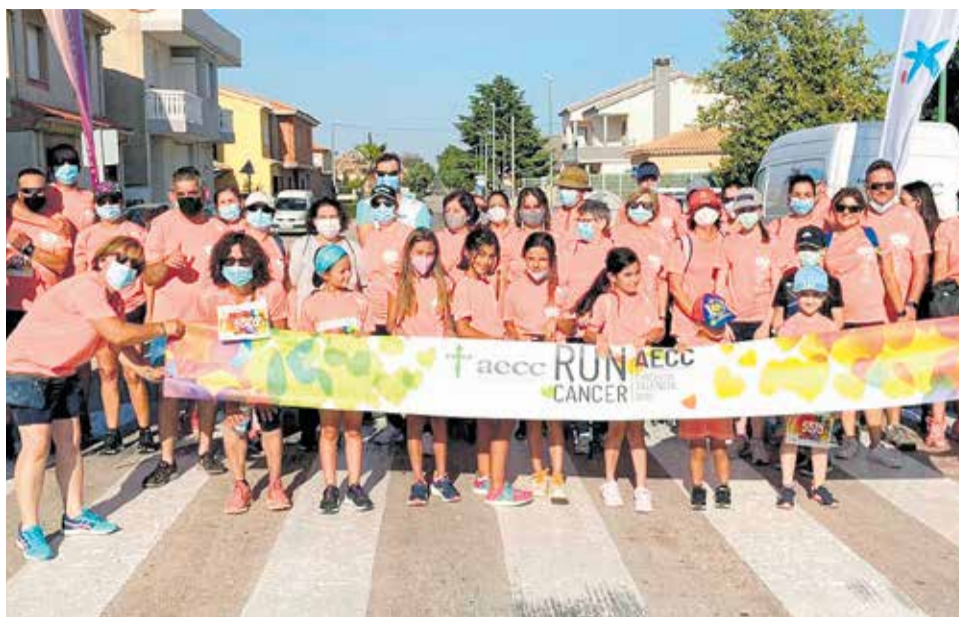
Inicio de la prueba solidaria de Villargordo del Cabriel.

gación en la lucha contra esta enfermedad que, en 2020 fue la tercera causa de muerte en España, con un 20,4% del total de fallecimientos, tan solo superada por las enfermedades cardiovasculares y las infecciosas (entre las que se incluye el Covid-19). Concluida la prueba, desde el Ayuntamiento agradecieron "a todo el mundo su ayuda,