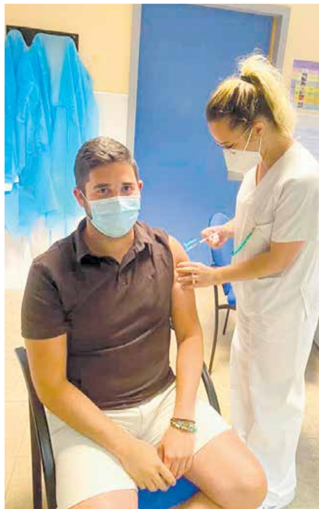
El primer edil fuenterrubleño vacunándose.

Izquierda Unida de Fuenterrubles ya mostró su "asombro y absoluto rechazo a las acusaciones tan graves realizadas por los concejales del PP y PSOE" hacia el alcalde del municipio y el teniente de alcalde del ayuntamiento a quienes, según la formación de izquierdas, "acusaban del último brote sufrido en Fuenterrubles" tal y como informó este medio el pasado 6 de mayo. ► P12