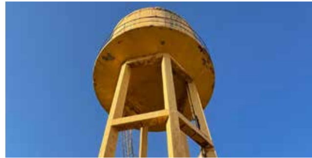
Depósito del barrio de Churruca.