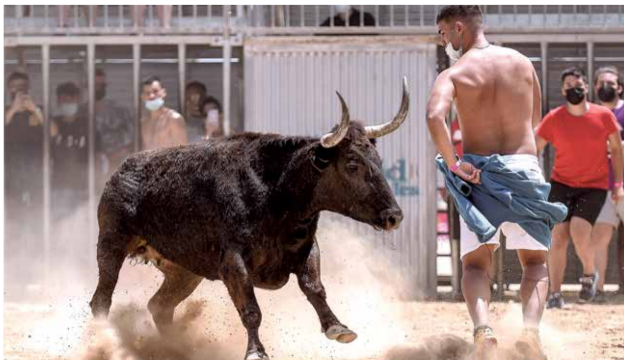
Festejos taurinos el sábado 17 de julio en Sagunt.

rítimo, playas y actividades deportivas. A mí me gustaría decir que estamos con un alto nivel de la población vacunada. Las vacunas están minorizando los síntomas y haciendo que la gente no esté siendo hospitalizada. Es evidente que el nivel de contagios está subiendo, pero a mí me gustaría que se analizaran verdaderamente los focos de los contagios y si éstos están relacionados con los festejos taurinos. No es que yo defienda directamente los toros. Pero como concejala de Fiestas tengo que defender los acontecimientos que se coordinen o bien por medio de asociaciones o por medio del Ayuntamiento y que se garanticen las medidas de seguridad. Yo entiendo la polémica con respecto a los espectáculos taurinos. Otra cosa es lo que pueda pasar con la gente que después de los espectáculos taurinos se va de botellón. En los festejos taurinos te puedo asegurar que no se bebe, no se come, no se fuma y la gente lleva mascarilla. Cuando a alguien le dices que se suba la mascarilla, se la suben porque saben que, de lo contrario, serán automáticamente expulsados. En los toros, hay que recordar que no hay alcohol como lo puede haber en otros lugares. El lunes to-