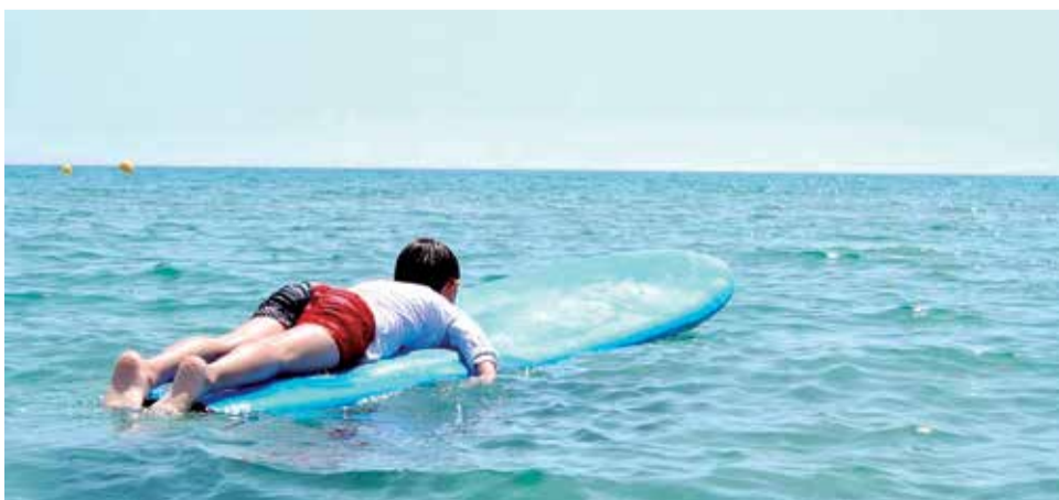
Algunos niños y niñas aprendiendo a surfear.

el surf ha conseguido que haya bajado la medicación hasta en un 80% en algunos casos por hacer este tipo de actividades. A ellos, personalmente, sí les beneficia. Hay que remarcar que no es una actividad con terapeutas en que están metidos en una sala, sino al aire libre. Estar en el mar ya es terapéutico por naturaleza. Sólo hay que ver sus sonrisas cuando ellos se ven encima de la tabla bajando por una ola o divirtiéndose como todos los demás para darse cuenta de cómo de importante son este tipo de actividades.