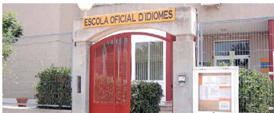
Escola Oficial d'Idiomes de Sagunt.

ció a distància del B1 i el B2 d'anglès. Consistirà en classes totalment virtuals mitjançant plataformes electròniques, tant d'aula virtual directament amb el tutor o tutora, tant amb la plataforma Moodle. El curs està enfocat per al públic en general