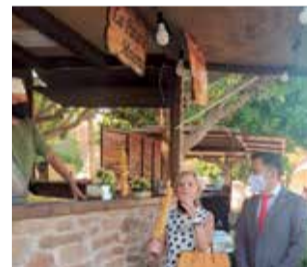
Visita de l'alcalde.