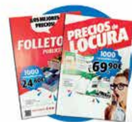
Folletos y flyers

¡Y mucho más! Nos adaptamos a sus necesidades sin ningún tipo de compromiso.