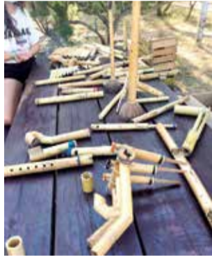
Instruments. / EPDA

i la seguretat són prioritàries". Amb esta quarta edició s'ha volgut apropar la ciutadania a un entorn privilegiat com és la Marjal d'Almardà. I, amb activitats per a adults i menuts, donar a conèixer els seus valors naturals, impulsant així un turisme respectuós amb el territori i consolidant encara més La Casa Penya com el punt de trobada de veïns i turistes amb la Marjal d'Almardà.