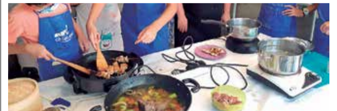
Campus de cocina.

■ HARRY POTTER, INTELIGENCIA ARTIFICIAL, MEDIO AMBIENTE Y CIRCO HAN SIDO ALGUNAS TEMÁTICAS