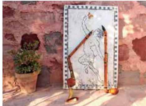
Clarinetts di bassetto.

Les activitats programades des de la regidoria de Cultura continuaran en agost amb el concert de la Societat Joventut Musical de Faura el 15 d'agost, i del 19 al 22 d'agost amb la setena edició de FaurArt, Festival de Teatre i Arts de carrer, que enguany porta el títol de "Bategant". Així com amb les diferents mostres del Projecte de Residències artístiques Hàbitat-Relacions Geològiques d'Amor de l'associació cultural Hort-Art, que compta amb el suport de l'Ajuntament de Faura.