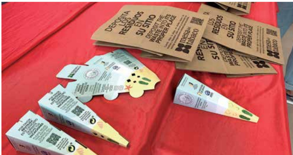
Bosses de paper i cendrers de cartó que es repartiran.

La iniciativa compta amb la participació de la corporació municipal, la Mesa del Tabac i l'associació Sanamares, a més d'amb la col·laboració de la Unió de Estanqueros, Hostaleria d'Espanya i l'Associació Ambient Europeu que al costat de Sanamares distribuiran