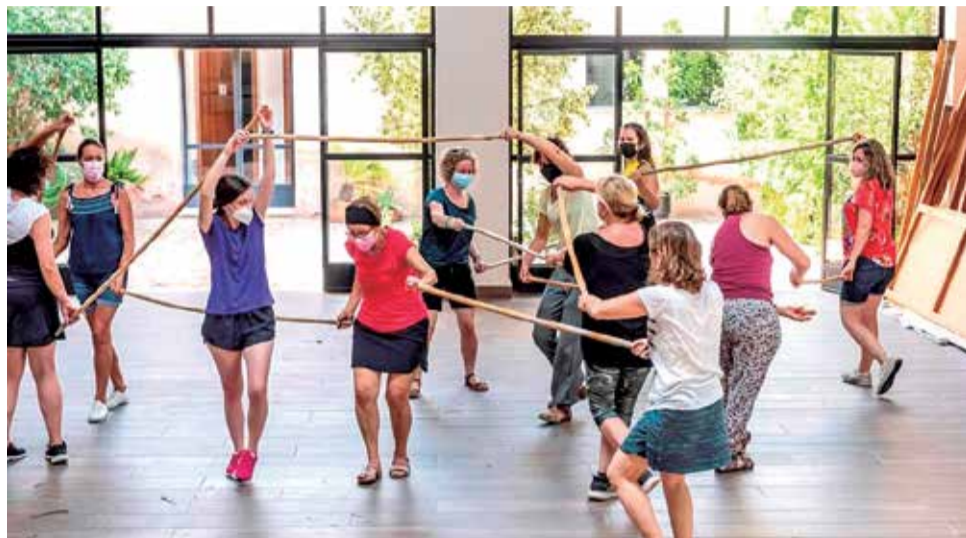
Los talleres se están llevando a cabo desde la semana del 19 de julio.

"Tomar conciencia del espacio que habitamos; despertar, sugerir, aportar e interactuar