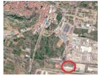
Situación del Aldi.