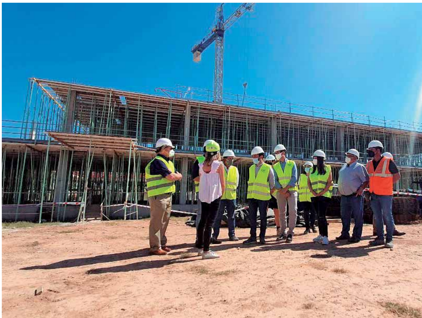
El conseller de Educación, Vicent Marzà, y algunas autoridades visitan las obras del IES N.5 de Port de Sagunt.

El centro se ha diseñado bajo los parámetros de sos-