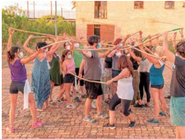
Una de les activitats organitzades. / EPDA

Des d'Acció Ecologista lamentem que, pel context actual de la COVID-19, no haver pogut ampliar l'oferta de places per activitat. Però, "la salut