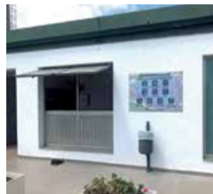
Nueva puerta.