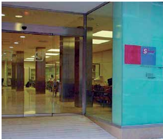
Oficina de empleo de Sagunt.

Por ello, el grupo municipal Esquerra Unida lleva a pleno esta moción para "instar al SEPE y al Ministerio de Trabajo y Economía Social a que subsanen en el menor tiempo posible esta falta de personal" y, además, "dar traslado del presente acuerdo al Ministerio de Trabajo y Economía Social, a la Dirección General del SEPE y a la Dirección Provincial de Valencia".