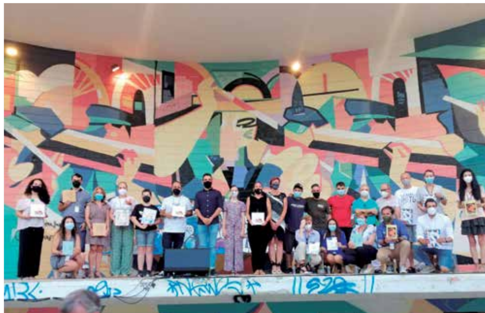
Acto de presentación conjunta de los llibrets.

Este evento comenzó con una exhibición a cargo de riders del Diverse Scooter Team que levantó los aplausos del público. Posteriormente, con la ayuda de los raperos locales Caesar, Sansa y