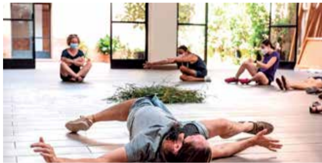
Una de las actividades de la propuesta cultural.

"Relacions geològiques d'amor constitueix una proposta amplia i diversa immersa en la Vall de Segó. La acció