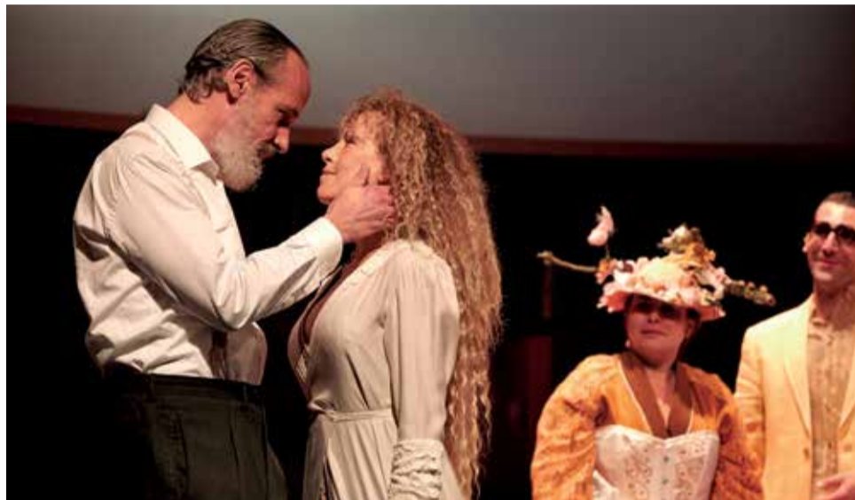
La Casa de los Espíritus en Sagunt a Escena, del 14 al 15 de agosto.

Debido a la emergencia sanitaria de la Covid-19 se ha tomado esta decisión con el fin de poder adaptar los espectáculos al toque de queda, desde el 26 de julio hasta el 16 de agosto de 1 a 6 de la mañana, decretado por el Consell de la Generalitat Valenciana en el que se encuentra incluido el municipio tras la última revisión de los datos de incidencia. Todo ello con la finalidad de facilitar y asegurar un acceso seguro del público a las