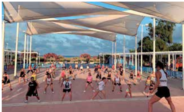
Un dels últims esdeveniments esportius.

Quant a les activitats esportives regulars, com són les classes de ioga, gimnàstica de manteniment, pilates, aerower, cubbà, gap..., que es realitzen de dilluns a divendres, seguiran avant amb normalitat.