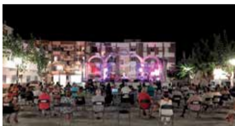
Imatges de l'edició anterior.