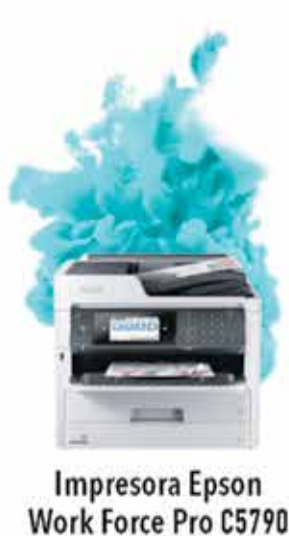
Impresora Epson Work Force Pro C5790

berolina AHORRA MÁS DEL 50% EN IMPRESIONES Y 90% DE ENERGÍA