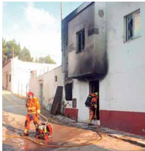
Vivienda donde ocurrió.

El hombre, de 46 años de edad, agredió a su pareja, la madre del joven. Los agentes de la policía se abalanzaron sobre él. Finalmente, fue detenido y se le imputan: delito por malos tratos, maltrato animal y por daños materiales. El hombre es de origen español y tiene numerosos antecedentes. Ya ha pasado a disposición judicial.