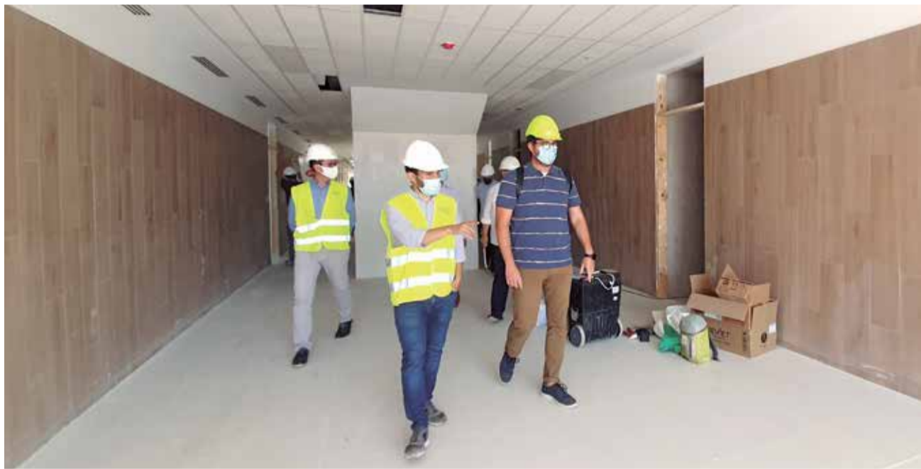
Visita del conseller Marzà al nuevo IES de Algímia d'Alfara.