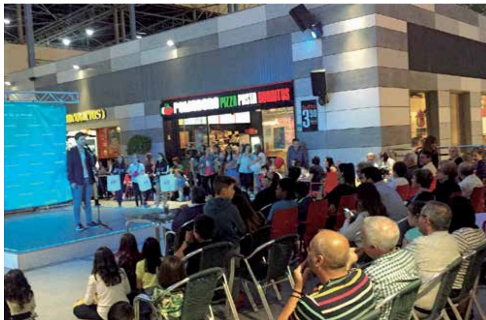
L'epicentre Talent de un año anterior.

El primer clasificado obtendrá un premio de 500 €, el segundo de 300 € y el tercero de 150 €, además se darán más de 20 menciones especiales con premio. Todos los detalles y las bases del con-