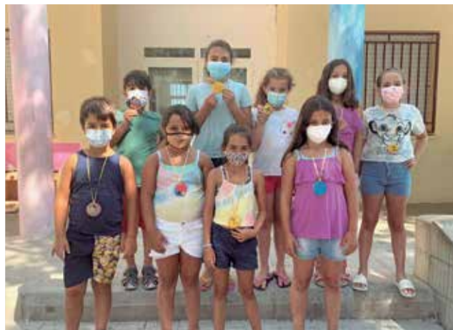
Alguns xiquets i xiquetes participants.

guany hem optat per tornar a prestar aquests dos serveis, que són molt necessaris tant per a les famílies com per als més joves del municipi, el comportament dels quals durant l'últim curs escolar ha sigut exemplar. Estem molt satisfets amb l'acollida que ha tingut l'Escola d'Estiu entre els veïns i veïnes del municipi. De fet, hem cobert la totalitat de les 50 places oferides i cap sol·licitant s'ha quedat sense plaça. Cal tindre en compte que l'Escola d'Estiu té la important finalitat d'ajudar