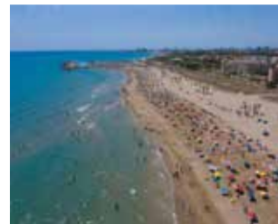
Platja de Canet.