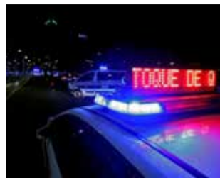
Toque de queda.