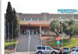
Hospital de Sagunt.