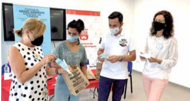
Presentació de la campanya.

els materials preventius -bosses i cendrers- a peu de platja, materials que estaran també disponibles en l'Oficina de Turisme de la localitat i en el Bar Barraqueta de Mar.