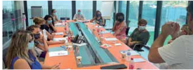
Reunión con algunas de las víctimas. / EPDA