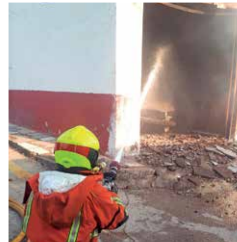
Momento de la extinción.