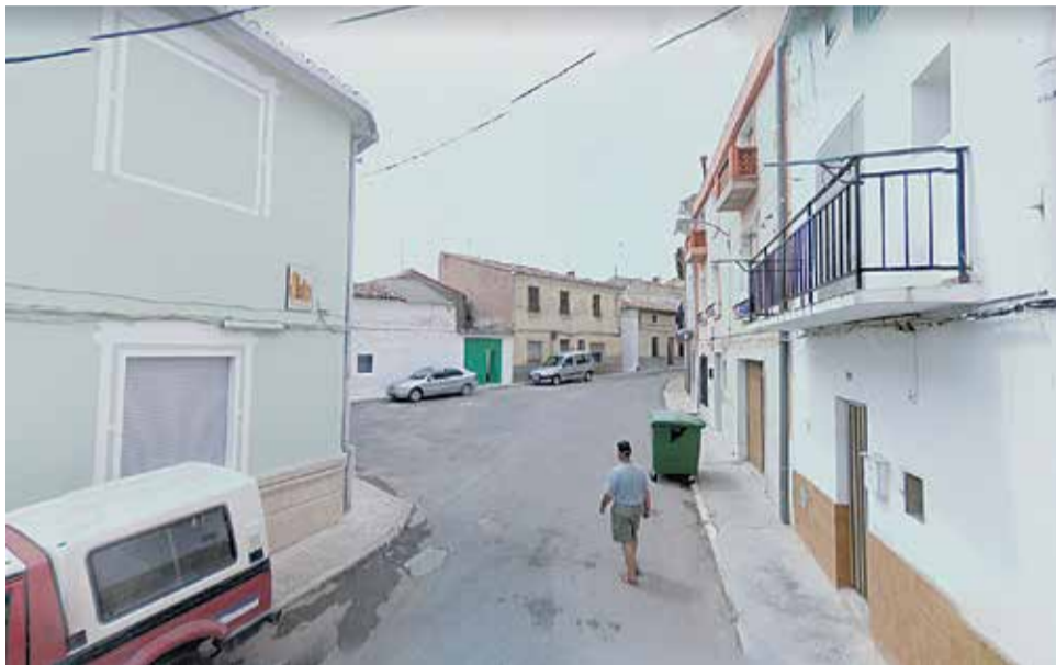
Uno de los contenedores de residuos en la calle Valencia de Camporrobles.

El Plan de Acción se ha diseñado para ser implementado en el periodo 2020-2022, coincidiendo con el horizonte temporal que establece el Plan Integral de Residuos de la Comunitat Valenciana (PIRCVA) para la consecución de los objetivos cuantitativos anuales de reducción de las diferentes fracciones. Estos objetivos fijan la reducción de los residuos domésticos en un 67 % (427.636,90 kg); la de biorresiduos, en un 50 (134.035,45 kg); la de los meta-