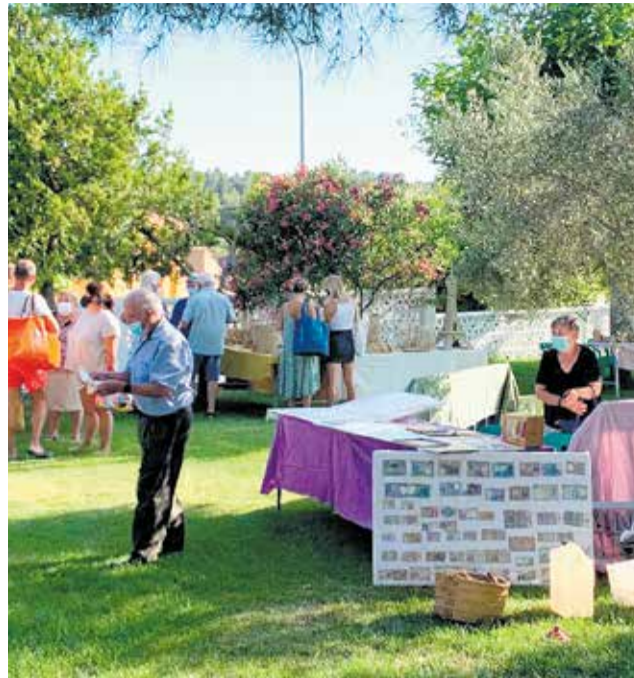
Encuentro de artesanos en la piscina de Venta del Moro y paseo senderista.