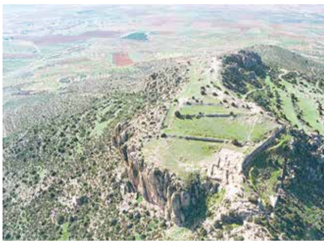
Yacimiento de El Molón de Camporrobles.

Por otro lado, el Ecomuseo ofrece los sábados, a las 10 ho-