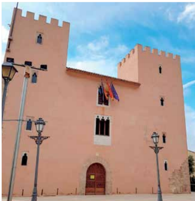
Palacio de Albalat, actual sede del Ayuntamiento.