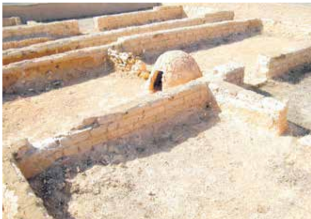
La ciudad íbera de Kelin, en Caudete.

ras, visitas guiadas al resto del patrimonio rupestre de la comarca (Cinto de las Letras de Dos Aguas, Abrigo de Vicent de Millares, Abrigo del Garrofero y de Voro de Navarrés y Quesa).