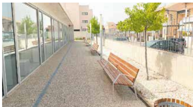
Pasillo exterior del Centro de Día.