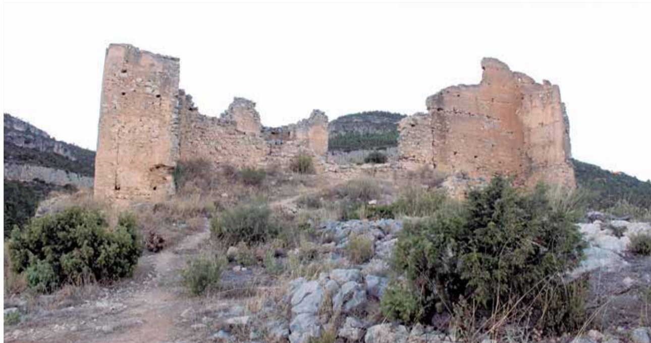
El castillo de Chera domina el desfiladero.

Es un modelo de casa señorial gótica valenciana. La planta es cuadrada con muros de tapial mixta que dejan un patio central y las bandas de una