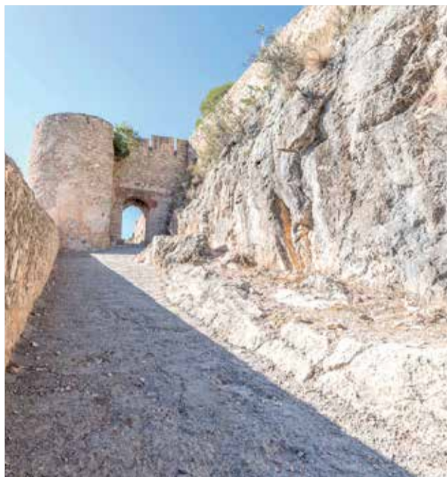
El Castillo de Chulilla, en la comarca de La Serranía.

► MANTENIMIENTO. el Ayuntamiento tiene pendiente una actuación para ir recuperándolo.