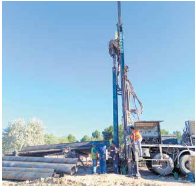
Trabajos previos de perforación y captación de agua en el nuevo pozo.

Actualmente el municipio de Utiel recibe el suministro de agua potable del nuevo pozo ejecutado en julio de 2019 tras los problemas técnicos generados en el sondeo de abastecimiento general que