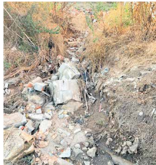
Restos del escombros en la acequia.

El agente informante explicó en el expediente que se podría considerar como una infracción por parte del titular o gestor del mantenimiento de la arqueta y/o acequia de recogida de aguas fluviales, recogida en el art. 19 del Capítulo III. Aguas del Reglamento para el Servicio de Caminos del término Municipal de Requena que dice: “Ningún vecino, arrendatario o propietario, dejará caer las aguas de riego o lluvia en los caminos de este término o pasar estas por encima de sendas,