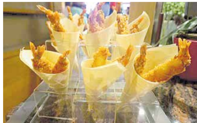
Una muestra de entradas de Casa Genaro.