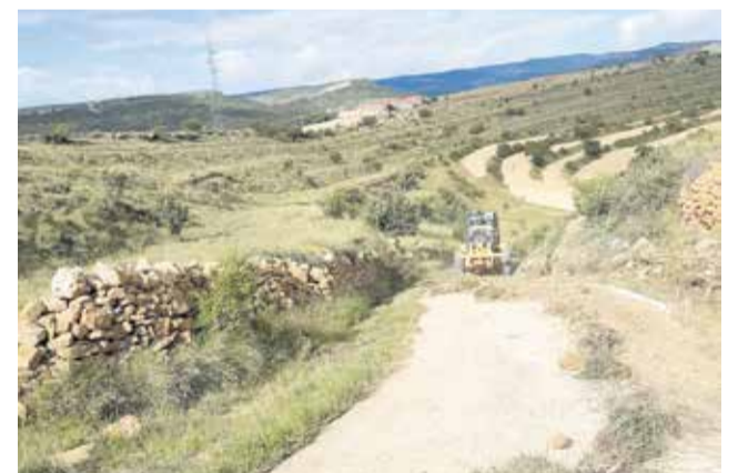
Trabajos de mejora de caminos.

Fuenterrobles, gracias a tener saneadas sus cuentas, pudo acometer con urgencia el arreglo de algunos caminos.