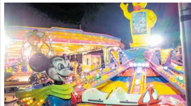
Feria de atracciones de Requena.