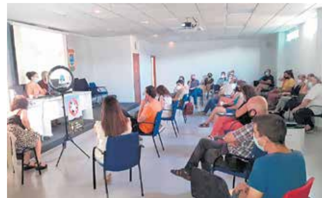
Acto de presentación de la plataforma.