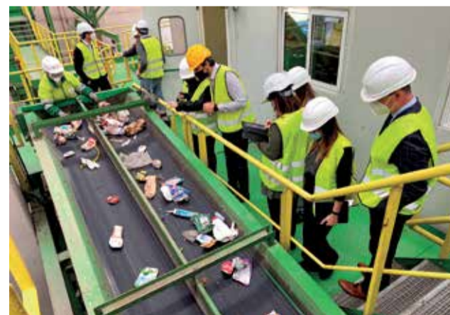
Visitas al Consorcio Valencia Interior / EPDA

Esta publicación dedica un capítulo al caso práctico del Consorcio Valencia Interior, en el que se pone en valor el sistema informático de registro y control de los residuos recibidos y materiales recuperados en las plantas de tratamiento del Consorcio. Este sistema coordina las entradas y salidas de materiales registrados en las básculas de las estaciones de transferencia, plantas de tratamiento e instalaciones de eliminación de la entidad, sirviendo de base para el control de calidad de los servicios de tratamiento (certificando las cantidades gestionadas a efectos de determinación y distribución de los costes de gestión y acreditando el cumplimiento de los objetivos ambientales).