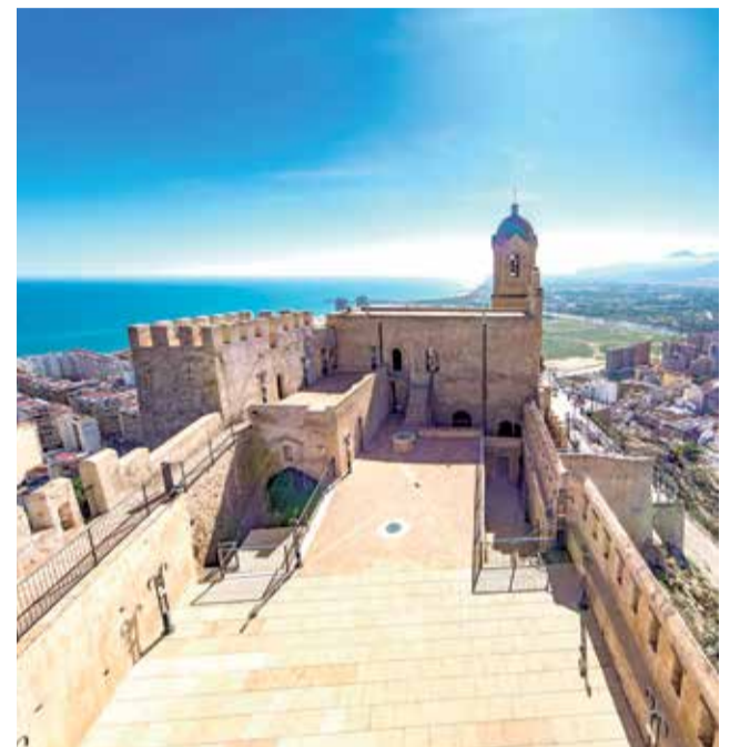
Castillo de Cullera, en La Ribera Baixa.

► ACCESO. Es completamente accesible a través del circuito del Chorrero y las cuevas de la Garita.