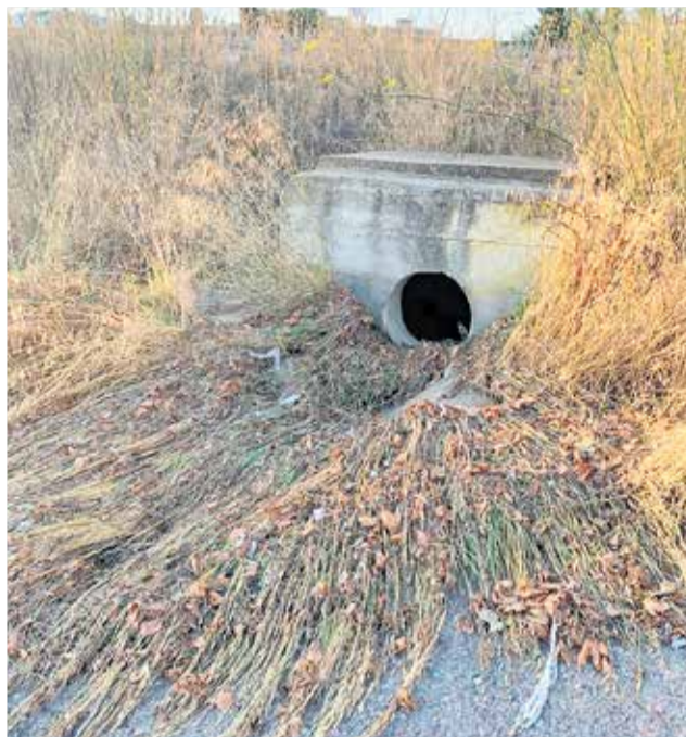
Desembocadura de aguas atascada.

Principalmente son dos los grandes problemas que están perjudicando a los regantes. Ambos relacionados con la inundación de las parcelas cultivadas que causan los primeros daños y bloquean posteriormente las salidas de las canalizaciones con restos de hierbas, piedras, etc arrastradas. Del primero de estos