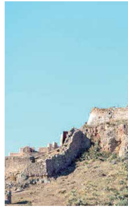
Castillo romano de Sagunt, uno de