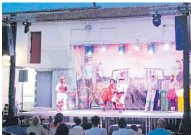
Espectáculo infantil 'Charlie y la fábrica de chocolate' y vencedores del torneo de petanca.