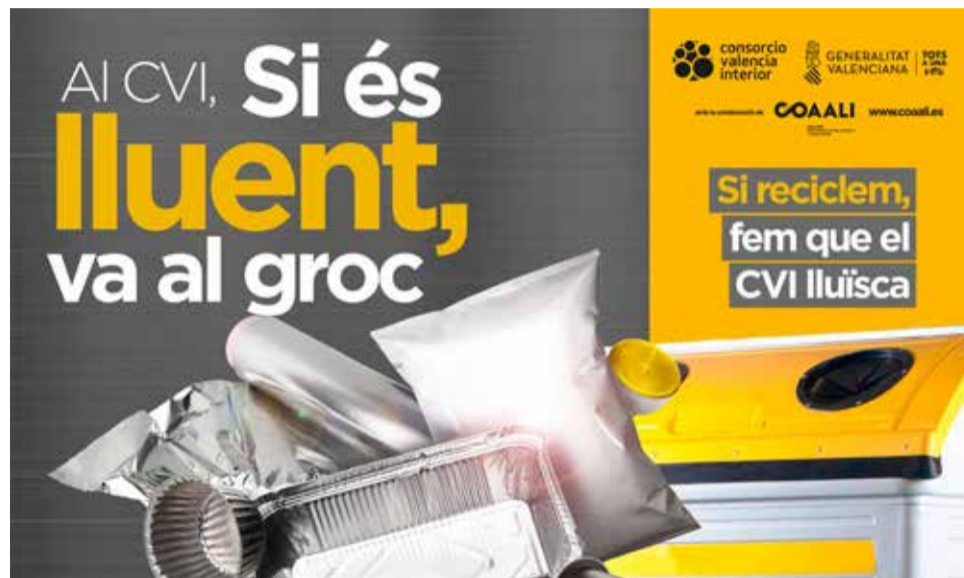
Cartel del Consorcio para la concienciación en el reciclaje

Aparte de las cápsulas de café de aluminio, los productos que podrán ser depositados en