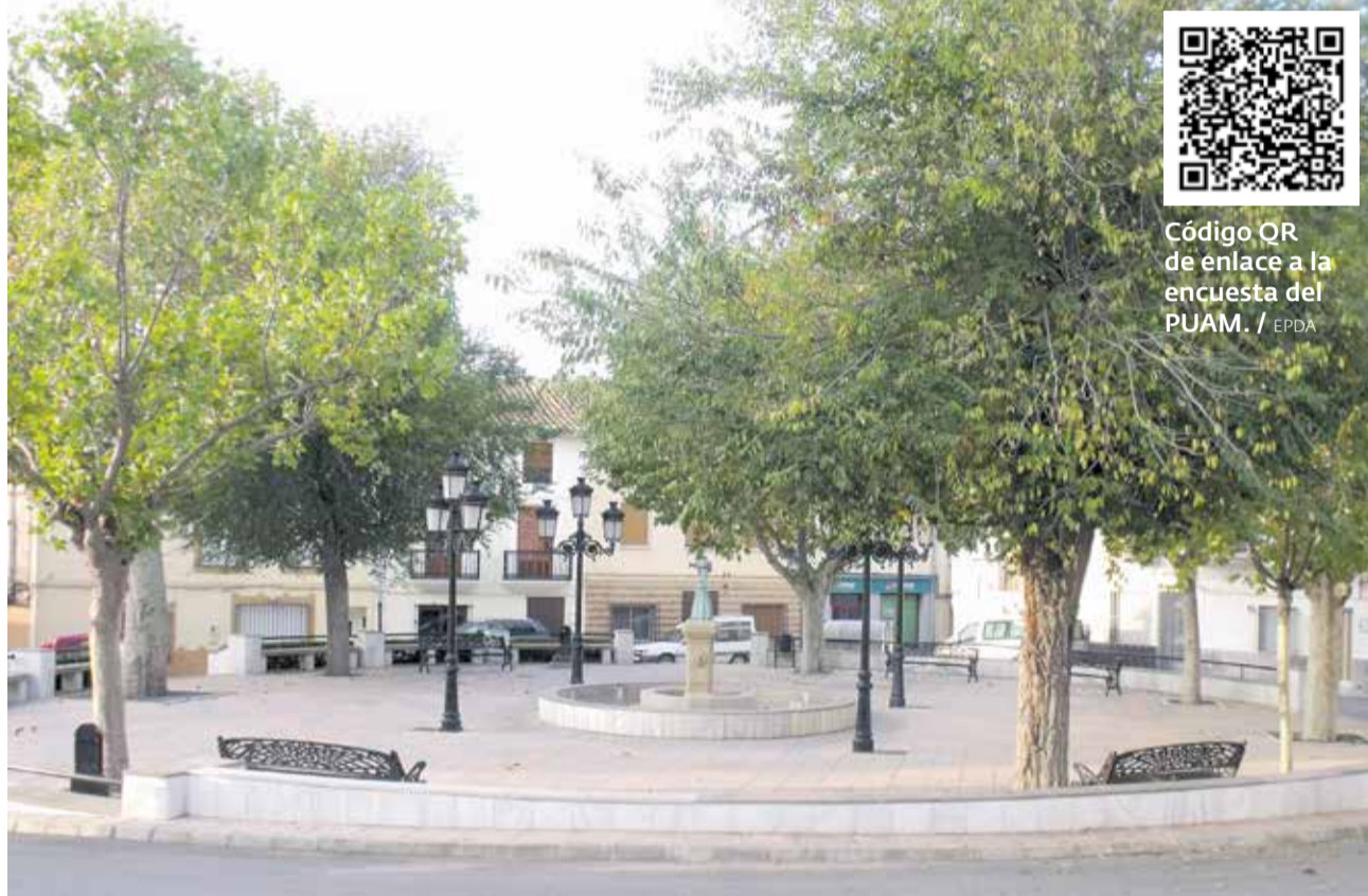
Plaza de la Fuente de Villargordo del Cabriel.

La elaboración del PUAM constituye un proceso de carácter estratégico local que establecerá y definirá las líneas de actuación del Municipio, con la finalidad de incorporar los objetivos establecidos por la Agenda 2030 en el marco del cumplimiento de los Objetivos de Desarrollo Sostenible (ODS) y las prioridades futuras respecto a obras y servicios en la agenda urbana municipal. Todo ello, servirá para avanzar en el diseño de un municipio que respete los grandes objetivos de la planificación es-