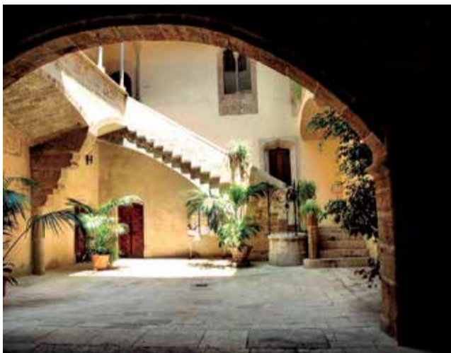
Patio del Palacio Condal de Albat dels Sorells.

de donde se batía la entrada. También dispone de aljibe al cual iban a parar las aguas de la planta de coronamiento de la torre.