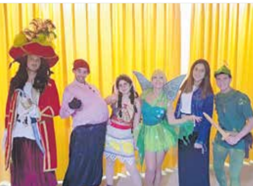
Musical Nunca Jamás y venta de camisetas para la carrera solidaria.