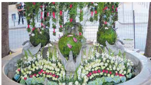
Fuente decorada con flores.