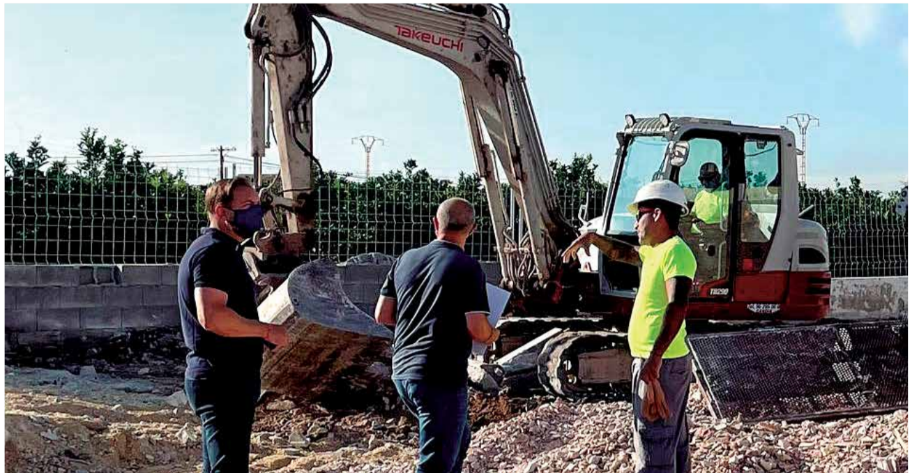
Obres a l'aparcament de Silla.

Una vegada acabades les obres els veïns i veïnes de Silla podran gaudir d'una