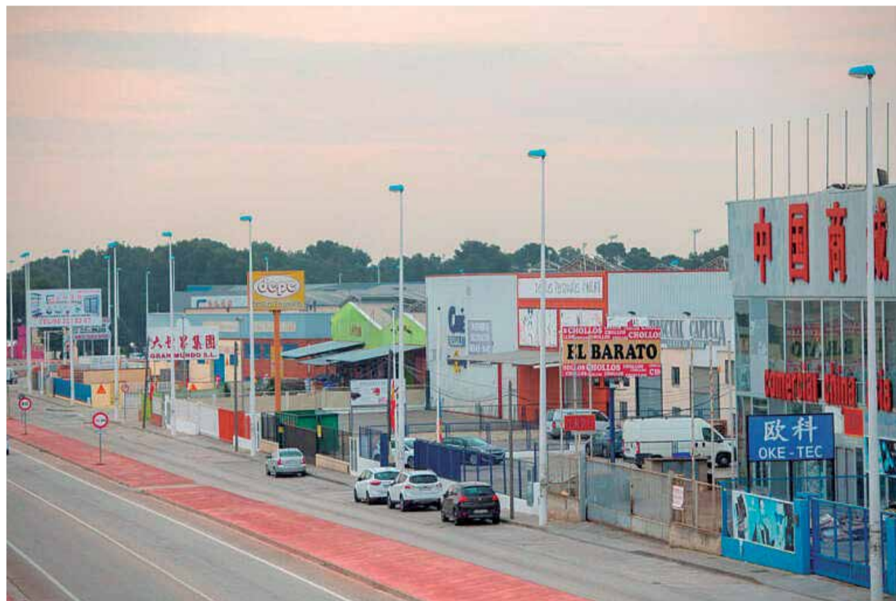
Polígono industrial en Manises.

En total serán 14 las localidades valencianas que se verán beneficiadas por esta línea de financiación que busca modernizar los parques industriales