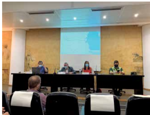
Vuelta ciclista en Alfafar.

En concreto, el paso por el municipio valenciano está previsto entre las 15.30 y las 16 horas del jueves 19 de agos-