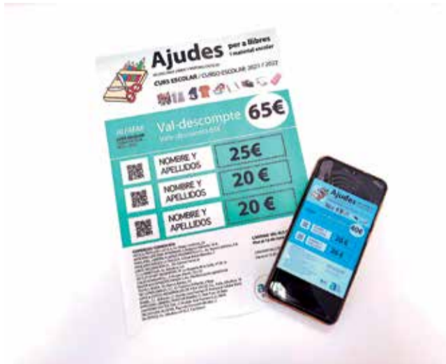
Ayudas al material escolar en Alfafar.

El bono generado se enviará a cada persona beneficiaria en PDF por correo electrónico, pudiendo imprimirse o utilizarse directamente desde el móvil. El importe de los bonos escolares varía en función del nivel escolar, siendo de 40 euros para estudian-