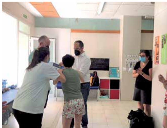
L'alcalde en una visita.

Enguany la Federació Valenciana d'Atenció a persones amb Discapacitat ha sol·licitat formalment ser també centre d'atenció primerenca i estimulació, per a xiquets de 0 a 6 anys. Per a aconseguir-ho calia realitzar prèviament unes reformes de mi-