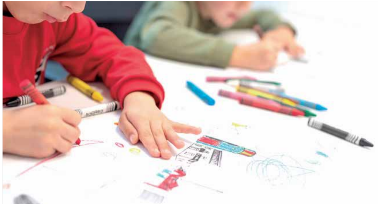
Dos niños dibujando y coloreando en Aldaia.

El Ayuntamiento de Aldaia ha abierto el plazo de presentación de solicitudes para pedir las ayudas de material escolar para el curso 2021/2022, que permanecerá abierto hasta el 15 de octubre. El trámite