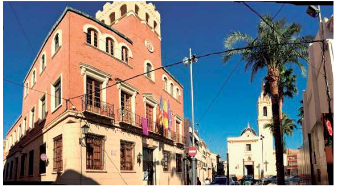
Ajuntament d'Alcàsser. / EPDA

En les propietàries i els propietaris dels xicotets comerços d'Alcàsser, el caràcter optimista ve de sèrie, però en aquestes dates comparades amb anys anteriors i amb la