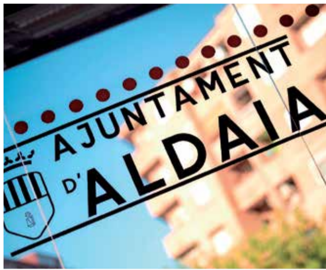
Logotipo del Ayuntamiento de Aldaia.

De moment, fonts del consistori indiquen que «en vista del bon resultat obtingut en la primera fase del Fons de Rescat Local 2021 (FRL)»,