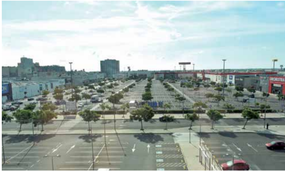
Zona comercial de Alfajar.