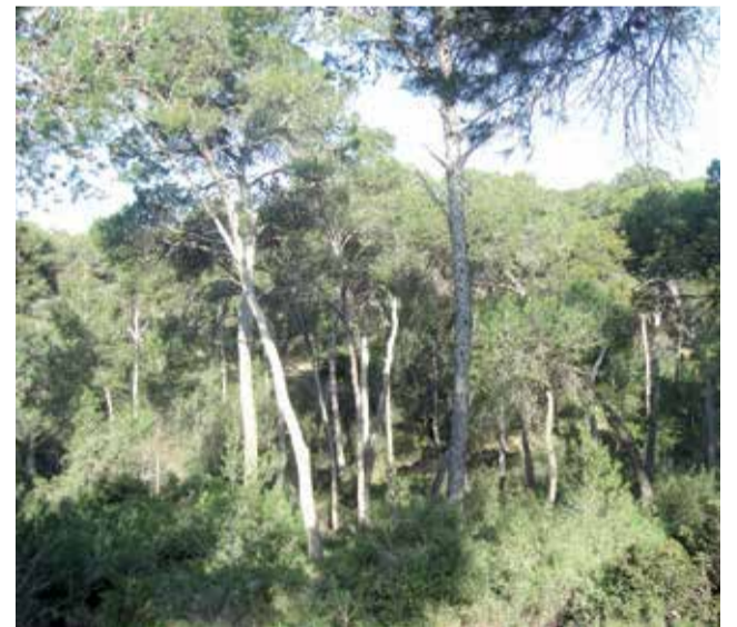
Zona forestal en Torrent / EPDA

El expediente, tramitado por procedimiento abierto,