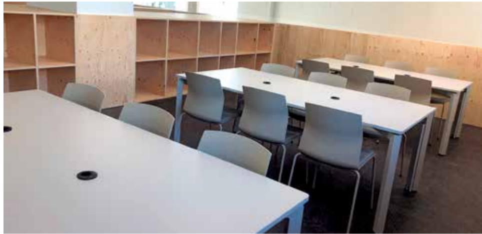
Instalaciones de la nueva biblioteca.

Cuenta con una primera planta de 382 m 2 , con una zona de lectura y otra de descanso, y un altillo con más espacio para la lectura y el estudio. Además, tiene una planta baja que funcionará como almacén de libros. "Con esta nueva biblioteca queremos ofrecer una amplia oferta