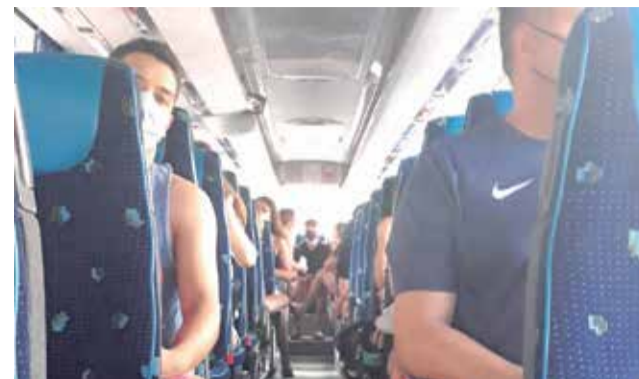
Cata-rosa a Catarroja. / EPDA