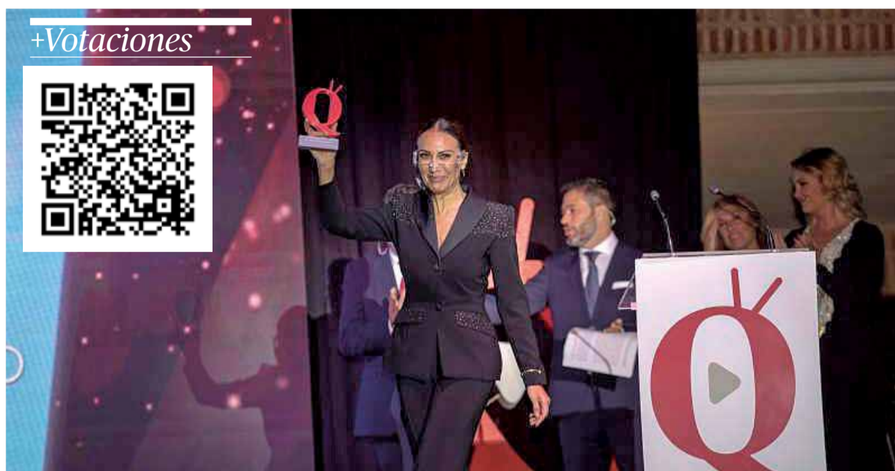
Un instante de la última edición de los premios en El Puig.

Los Premios Nacionales Aquí TV son una iniciativa del Grupo de Comunicación DE AQUÍ que iniciaron su andadura en 2017.