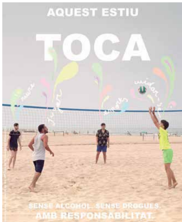
Cartell de la campanya. / EPDA

Amb la relaxació de les mesures contra la COVID-19, els i