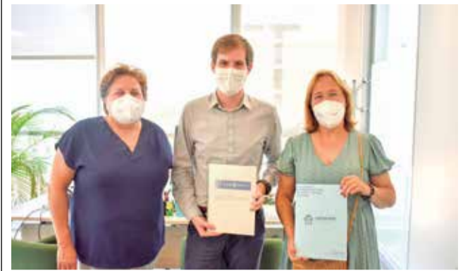
Reunión de presentación.