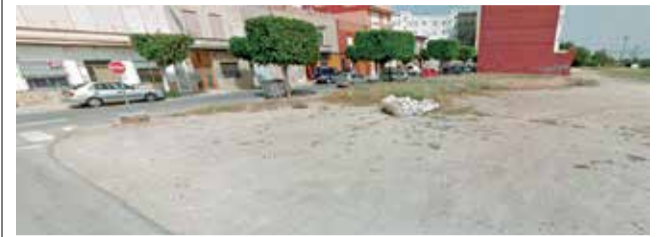
Uno de los solares de Massanassa.