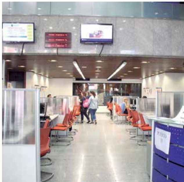
Sistema de padrón.

El padrón municipal es el encargado de expedir el certificado de empadronamiento, así como de realizar inscrip-