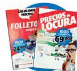
Folletos y flyers

¡Y mucho más! Nos adaptamos a sus necesidades sin ningún tipo de compromiso.