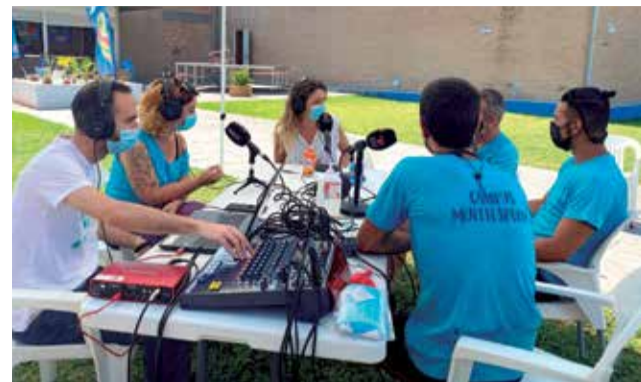
Aldaia Ràdio. / EPDA