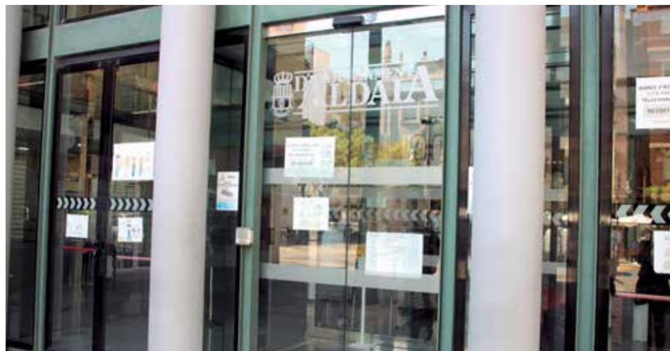
Ajuntament d'Aldaia. / EPDA