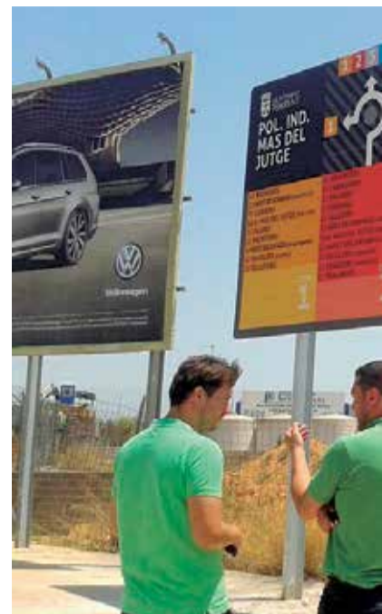
Polígono industrial de Mas del Jutge

De acuerdo con las bases de la convocatoria las actuaciones apoyables son muy variadas: