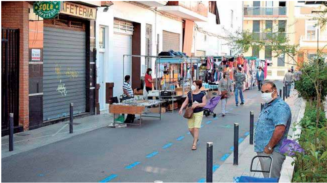
Un mercado ambulante en Benetússer.