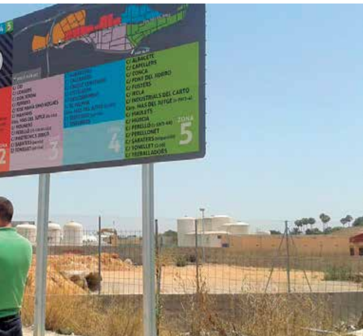
e en Torrent.

ción del polígono industrial accesible desde internet e independiente de la web del Ayuntamiento, aunque se pueda enlazar desde ésta.