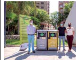
Nuevas papeleras.