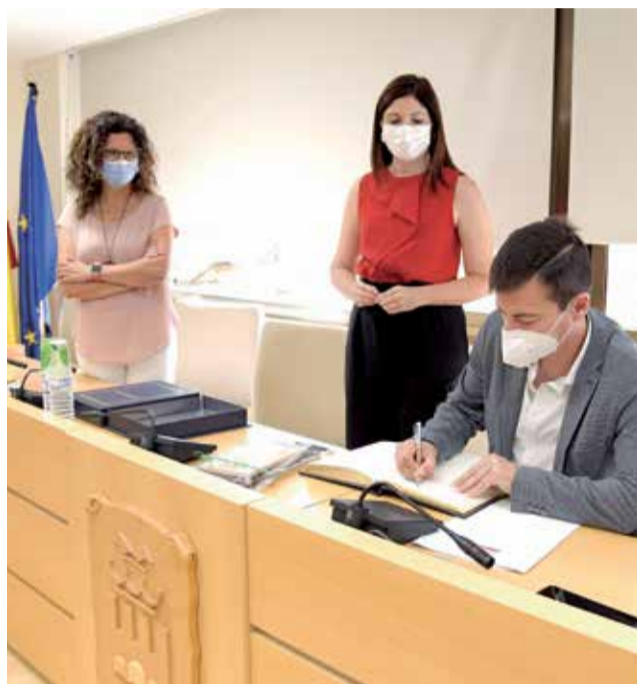
Presentació del projecte.

Com explicava García "està projectada per a ordenar la circulació en l'entorn urbà de Paiporta, en un punt concret en el qual existeix una inadequada intersecció en forma de T i en el qual és ha-