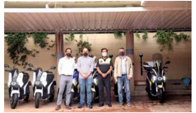
Presentación de los vehículos.