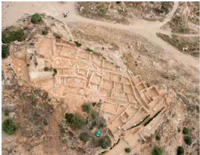
Poblado íbero del Puig de la Nau.