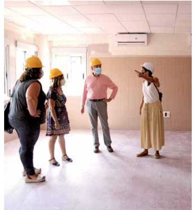
CEIP Les Comes.

De moment, el principi de curs ha sigut amb les mateixes condicions en què va acabar el curs passat, i només acabar l'obra, l'ajuntament ajudarà al centre a desplaçar tot el material a les aules noves en temps no lectiu, perquè tan prompte com es puga, s'instal·le l'alumnat i els serveis corresponents.