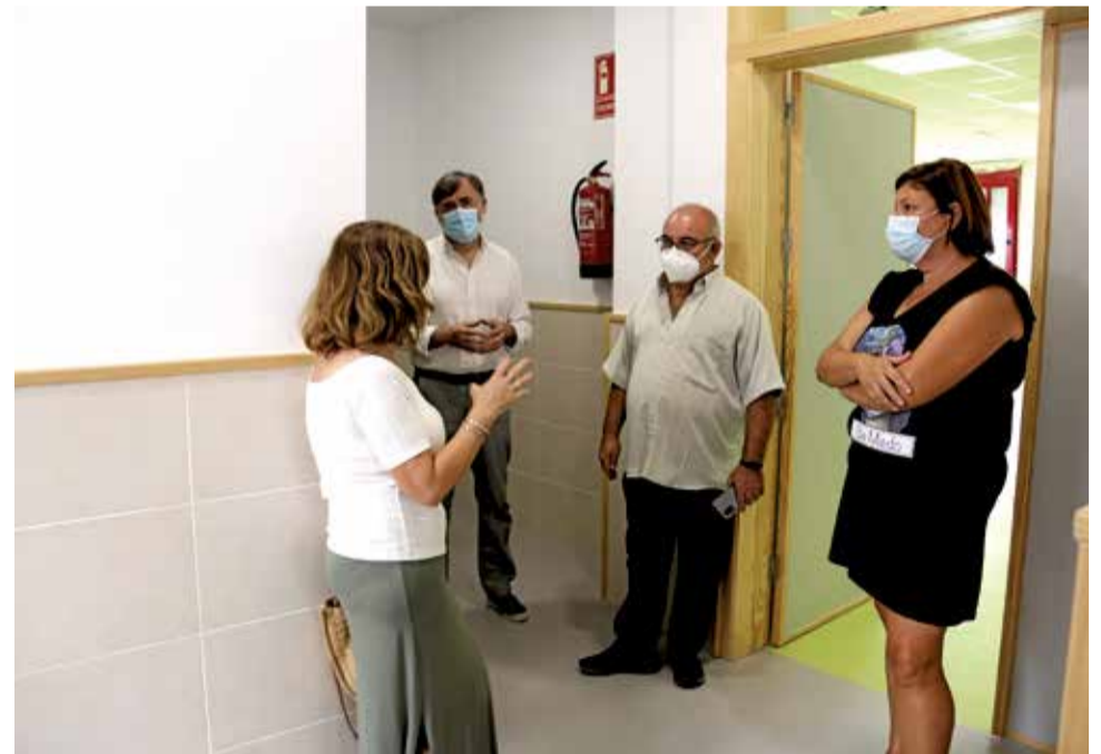
CEIP Heretats.

L'Alcúdia amb l'educació i la seguretat escolar