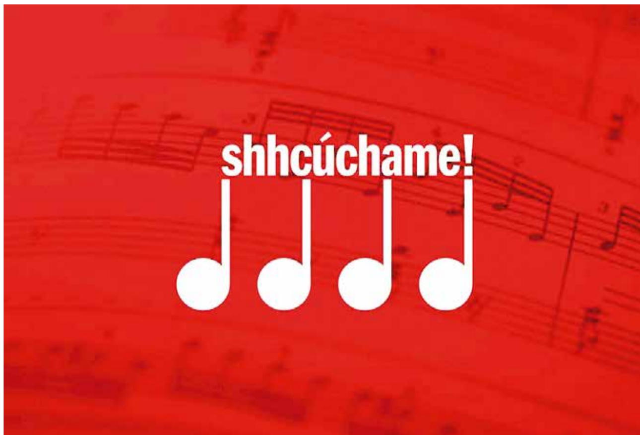
Projecte Montserrat "Shhcúchame!".