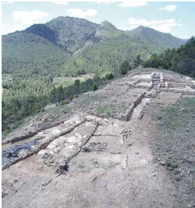
El poblado del Monte Calvario ubicado en Montán.

► PATRIMONIO HISTÓRICO. Está catalogada como Bien de Interés Cultural.