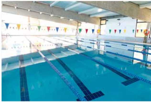
Piscina municipal d'Alberic.

Les instal·lacions s'obriran a l'ús el dijous 9 de setembre (amb horari de dilluns a divendres de 7 a 11 hores i de 17.30 a 21.30 ho-