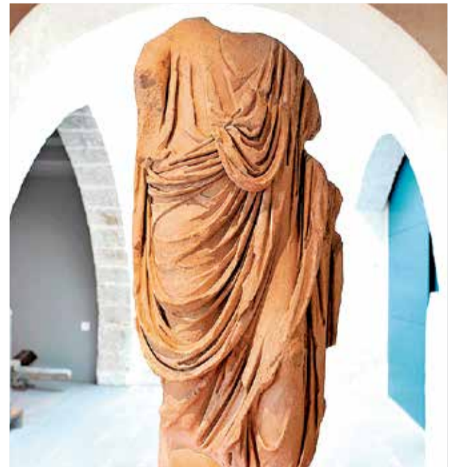
Pieza del Museo Arqueológico de Sagunt.

► ESTILO. Su estilo es almohade y su construcción detalla la mampostería de cal y canto.