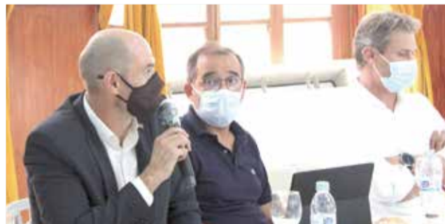
Debat dels diferents empresaris assistents.