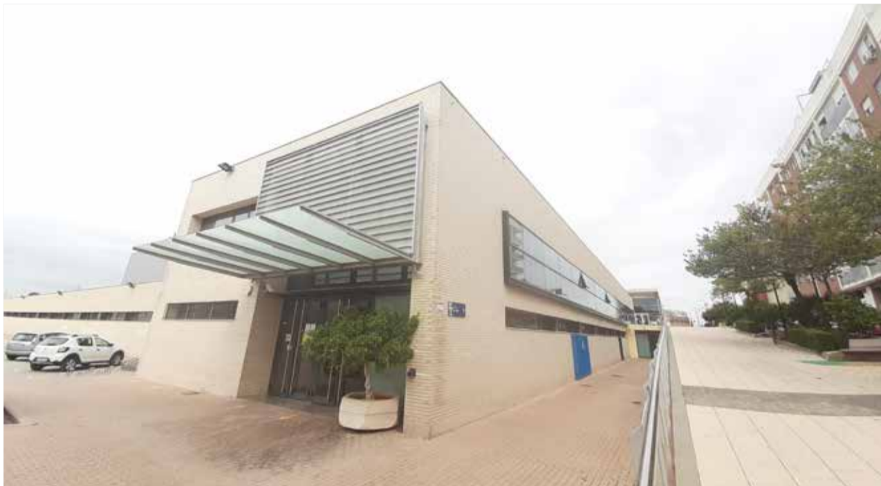
Pavelló poliesportiu d'Almussafes.

Les persones interessades a inscriure's a alguna de les activitats poden utilitzar el sistema de programació esportiva 'Com tu vulgues', que permet dissenyar els horaris, dies i serveis en funció de les necessitats concretes.