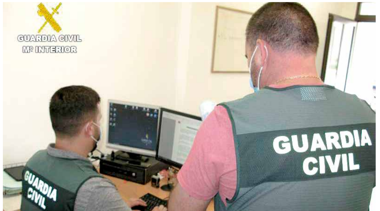
Operación policial a Sueca.

un delito contra la salud pública (suministrar sustancias nocivas o productos químicos).