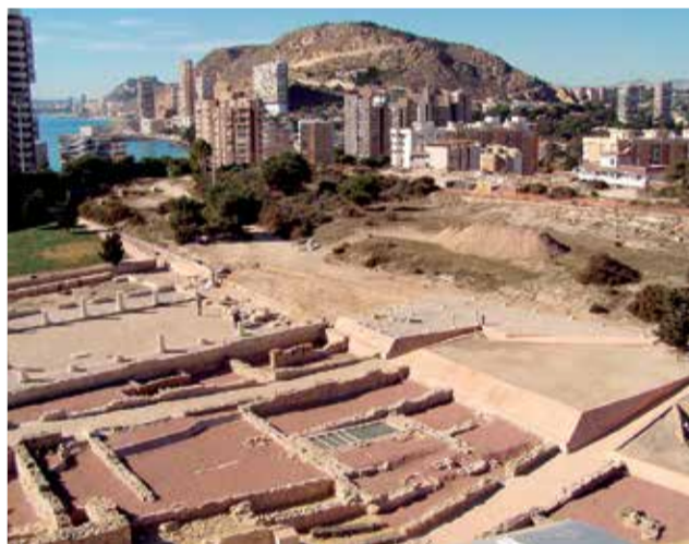
Yacimiento Lucentum en Alicante.

mente, la colección del Museo Arqueológico recoge algunos hallazgos del periodo íbero-romano cuyo valor es incalculable. Un toro íbero del siglo IV a.C., las cabezas de los dioses Diana, Hermes o Dionisos, la estatua de un personaje togado romano del siglo I tallada con la exquisita téc-