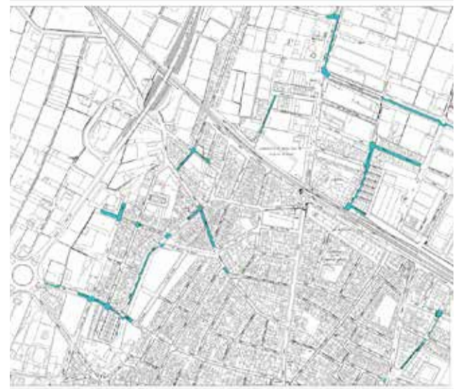
Mapa de les calçades a reparar.

La Regidoria d'Urbanisme de l'Ajuntament de Sueca procedirà a fer uns treballs de millora en les calçades de diversos carrers de la ciutat. Amb un pressupost de 250.000 euros, es milloraran en total uns 17.000 metres quadrats de paviment, “prioritzant les actuacions en aquells carrers que es troben en un estat més deteriorat per la seua falta de manteniment. Des del departament, molt implicat en les inquietuds de la ciutadania que veu dia a dia com el seu carrer es degrada i no s'actua, volem donar resposta a eixes queixes per falta de conservació que no s'havien d'haver produït. Queda molt per fer i esperem arribar a tots els carrers que ho precisen, sense oblidar tampoc la zona marítima”, ha assenyalat