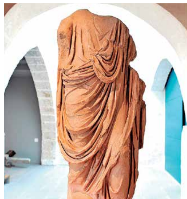
Pieza del Museo Arqueológico de Sagunt.

► ESTILO. Su estilo es almohade y su construcción detalla la mampostería de cal y canto.