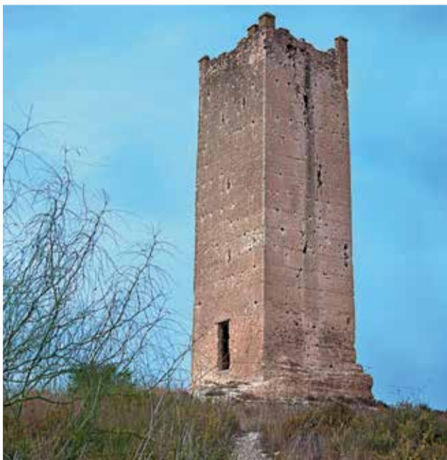
La Torre Espioca está ubicada en Picassent.