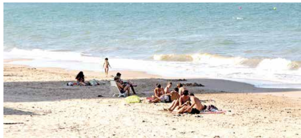
Platja de El Mareny de Barraquetes.

En la costa abunda la recollida de tellines i a pocs metres les clòxines, percebes, polps i congriós principalment. D'altra banda, la població que visite estes zones de costa poden gaudir de jocs aquàtics, els quals són ideals per les seues condicions que presenta. Respecte a la Q, de