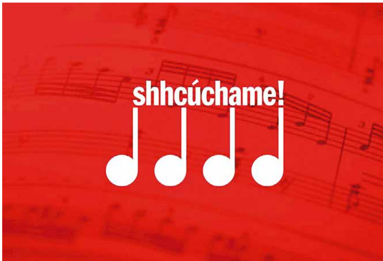
Projecte Montserrat "Shhcúchame!".