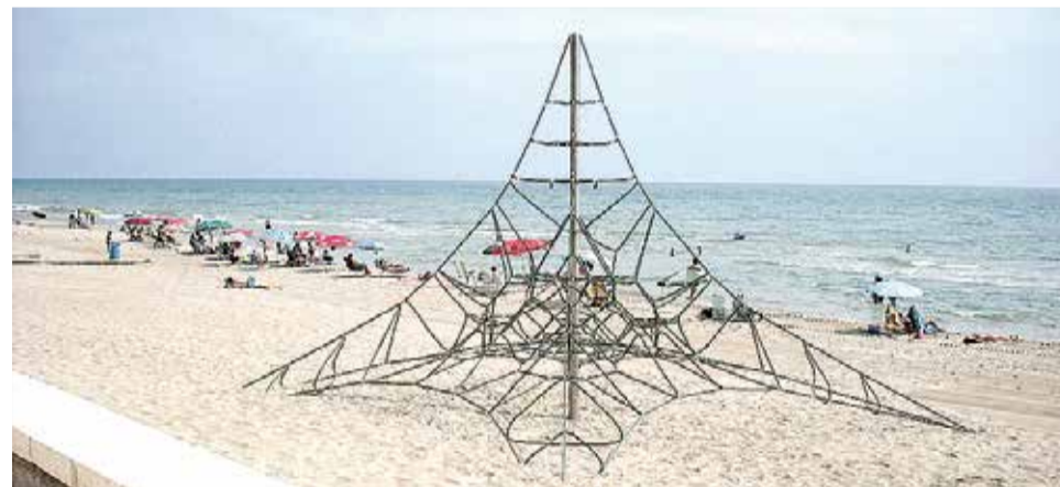
Activitats per als més menuts a la platja.