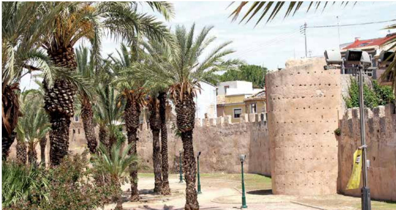
Uno de los yacimientos más destacados de la comarca de la Ribera es la Muralla de Alzira.

La ciudad ibérica de El Tòs Pelat de Moncada fue edificada sobre un cerro con forma de meseta. Se encuentra estratégicamente situada en 9,5 km de la costa, a 17,5 km de la antigua Edeta (Tossal de Sant Miquel de Lliria) y a la misma distancia de Arse-Sagun-