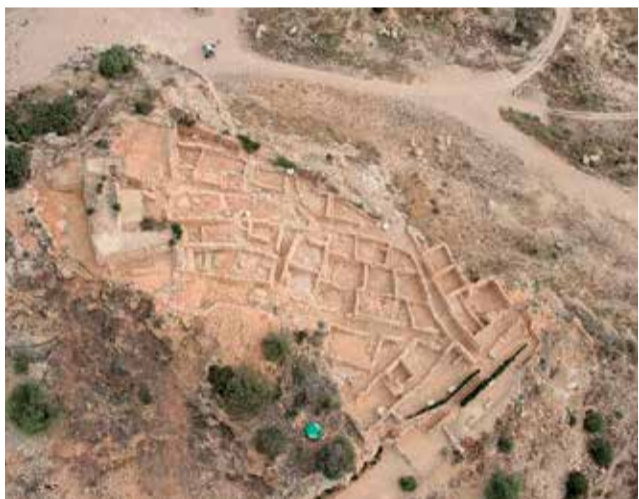
Poblado íbero del Puig de la Nau.