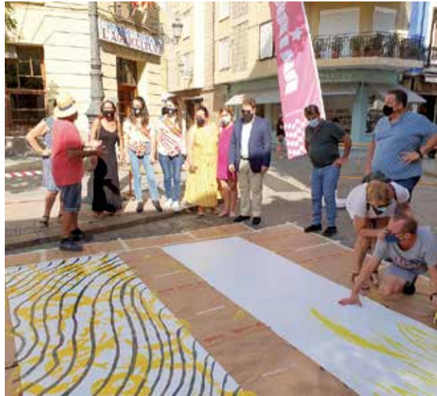
Panells del Dia del Color a Sueca.

“En esta ocasió, el Dia del Color ha volgut col·laborar també amb la Mostra Internacional de Mim, que s'inaugurà el 15, i ha consistit a crear una instal·lació plàstica de 15 panells, que es col·locaran després al carrer Sant Cristòfol, que representen els colors de l'arc de Sant Martí com a suport al col·lectiu LGTBI per tot el que està ocorrent en