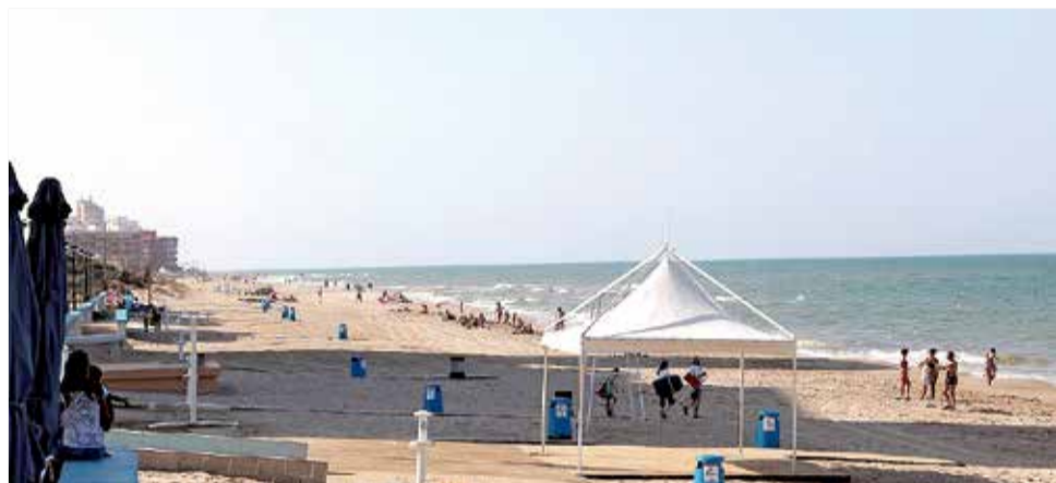
Platja del Rei.

LA PLATJA DE LA LOCALITAT DE LA RIBERA BAIXA COMPTA AMB UNS 900 METRES DE COSTA, A MÉS DE LA BANDERA Q DE QUALITAT TURÍSTICA