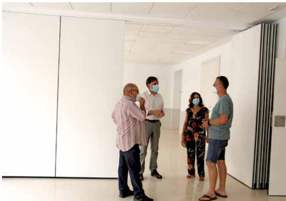
CEIP Batallar. / EPDA