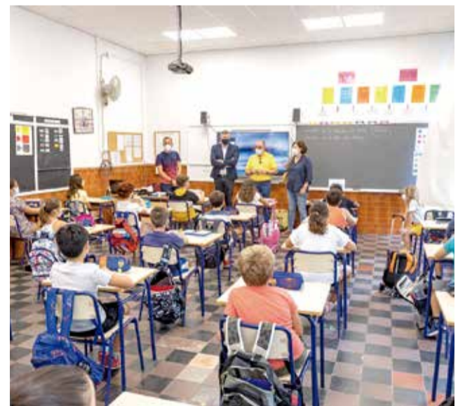
CEIP Sant Antoni de Cullera.

Per a este curs es mantenen algunes de les mesures implantades l'any passat per a evitar la propagació del Covid-19. És el cas de l'ús obligatori de màscara des de primer de primària, els grups bambolla en infantil i primària, i la distància inter-