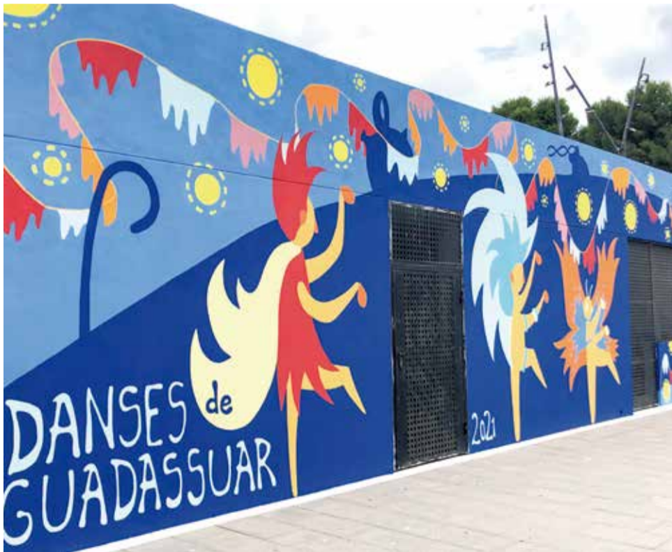
Danses de Guadassuar. / EPDA