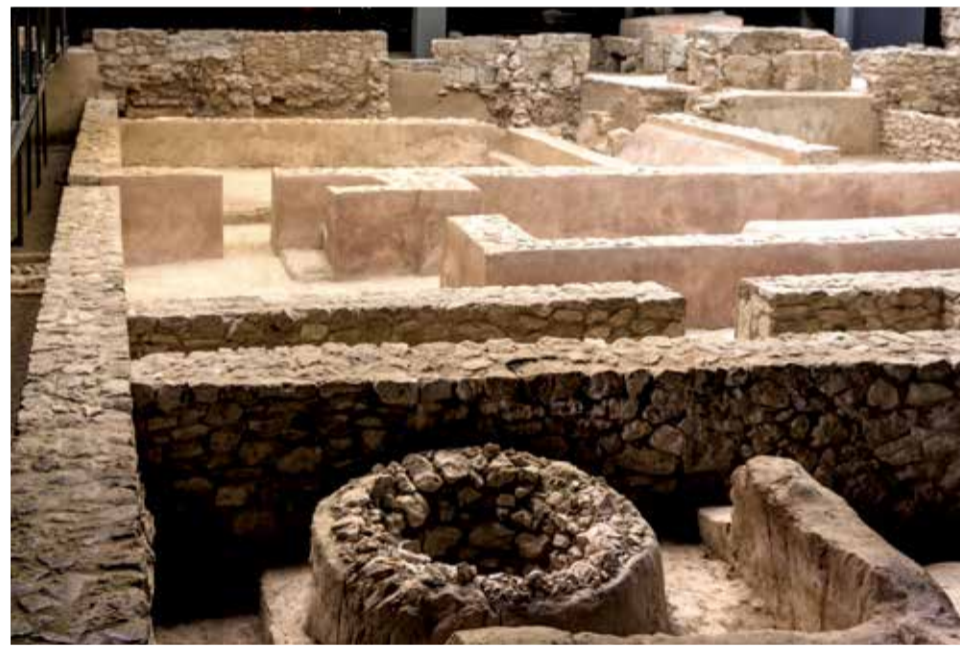
El solar de L'Almoína constituye uno de los más importantes de Valencia.

tum. El Tòs Pelat estuvo ocupado desde el s. VI al s. IV aC. La ciudad u oppidum tuvo una extensión de 3 hectáreas y en ella pudieron llegar a vivir unas 600 personas.