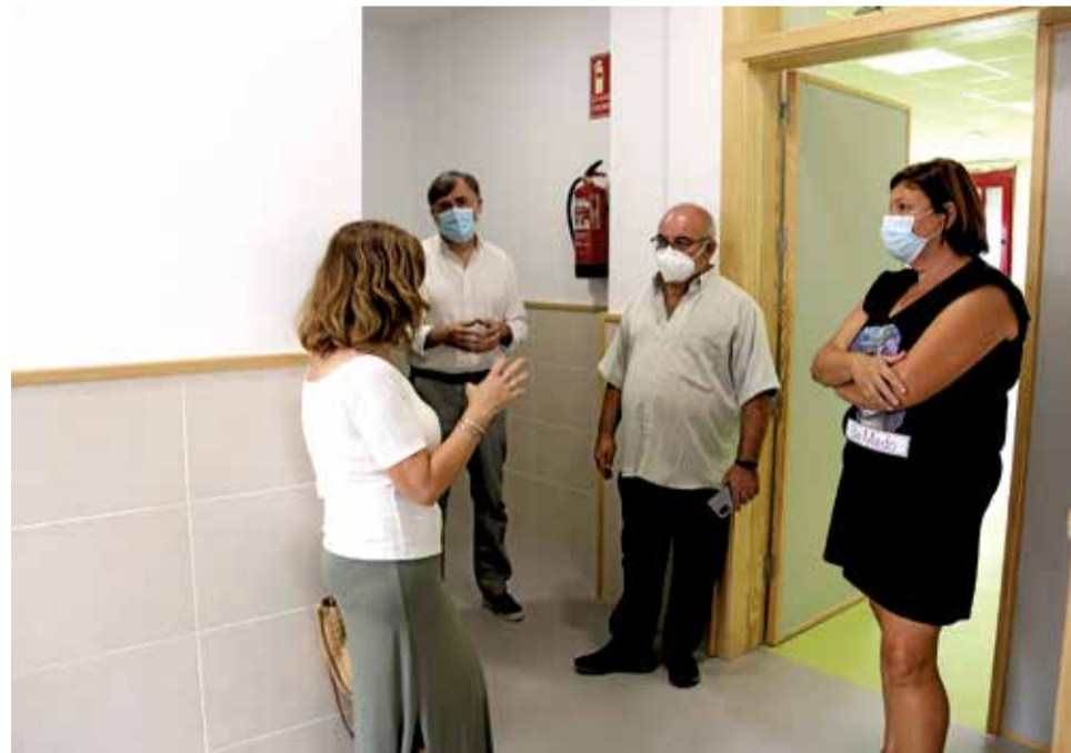
CEIP Heretats. / EPDA

L'Alcúdia amb l'educació i la seguretat escolar