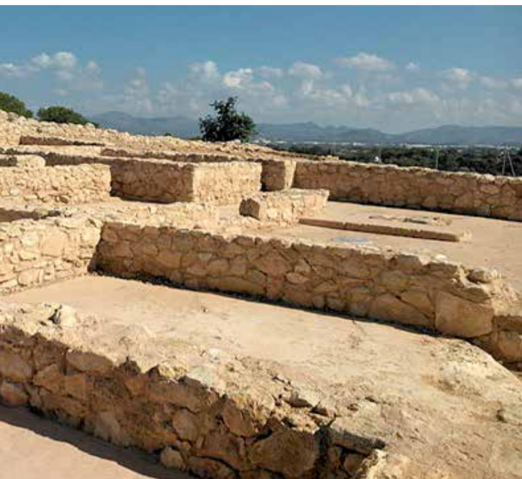
de las más importantes de la Comunitat Valenciana.

► MURALLA DE ALZIRA. Uno de los yacimientos más destacados de la comarca de la Ribera.