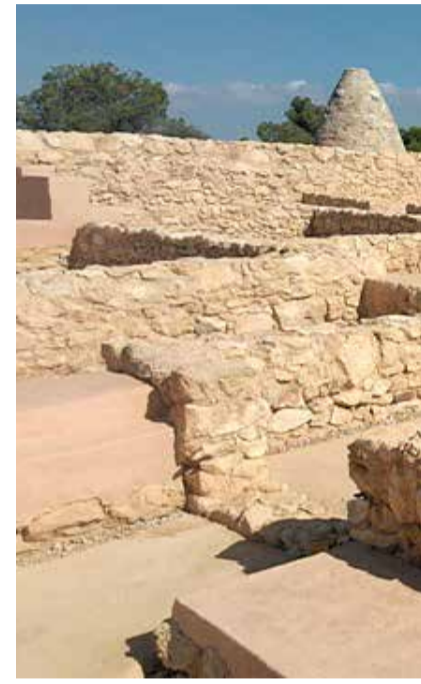
La ciudad de El Tòs Pelat es una de