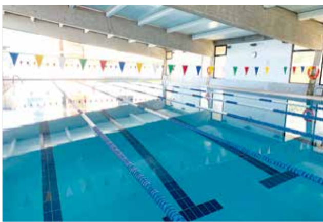
Piscina municipal d'Alberic.

Les instal·lacions s'obriran a l'ús el dijous 9 de setembre (amb horari de dilluns a divendres de 7 a 11 hores i de 17.30 a 21.30 ho-