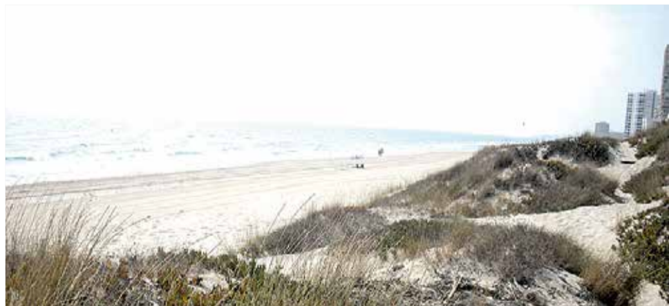
Platja de El Mareny de Barraquetes.

Sens dubte una destinació turística que engloba totes les condicions per a gaudir de la platja del Mareny de Barraquetes amb un peu en la mar mediterrània.