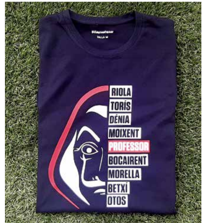
Samarreta de la "La Casa de Papel".

La seua última iniciativa, que a penes porta uns dies a la venda, són les samarretes amb els noms de la sèrie espanyola de Netflix "La Casa de Papel" convertits a pobles valencians i la idea dels quals li va germinar després de veure una escena d'un dels capítols que s'acaben d'estrenar de la primera part de l'última temporada i li va donar forma després de veure un fil de Twitter. "En la imatge es veu a dos personatges, un policia i un membre de la banda. Quan el policia el veu li pregunta: "Tu qui eres? Logronyo", i em va fer gràcia perquè un pensa sempre que els seus noms seran de ciutats importants", relata.