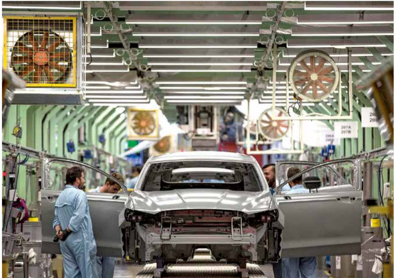
Varios trabajadores de la planta de pintura de Ford en Almusafes.

Según las mismas fuentes, se ha dado traslado de las medidas, que han sido aceptadas por la comisión de seguimiento, tanto a las autoridades laborales como a la Inspección de Trabajo y Seguridad Social.