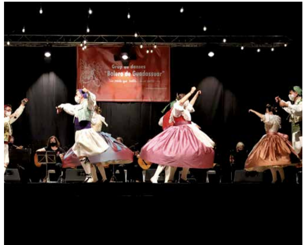
Danses de Guadassuar.