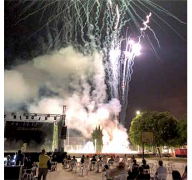
Festes Guadassuar.

El veïnat per aconseguir la motxilla Dansera havia de respondre amb una frase a la pregunta "Què són les Danses per a tu?". Més de 400 persones de la població van participar en esta iniciativa, i totes elles s'han emportat la motxilla.