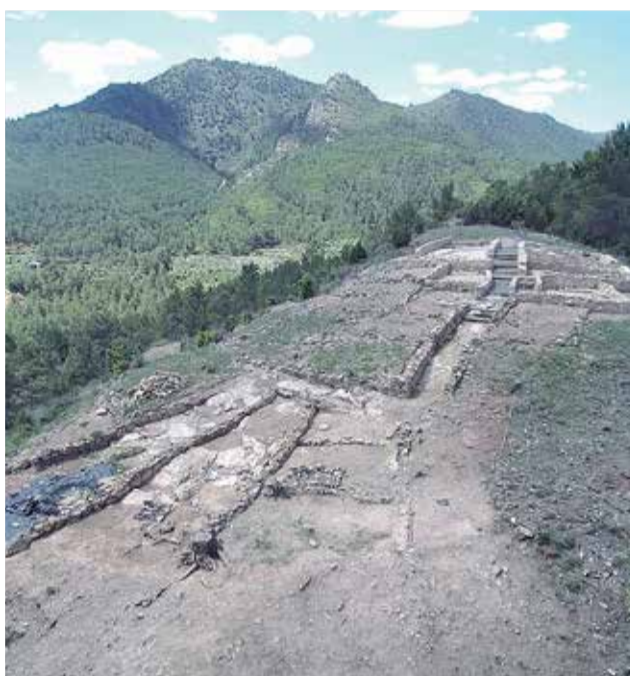
El poblado del Monte Calvario ubicado en Montán.

► PATRIMONIO HISTÓRICO. Está catalogada como Bien de Interés Cultural.