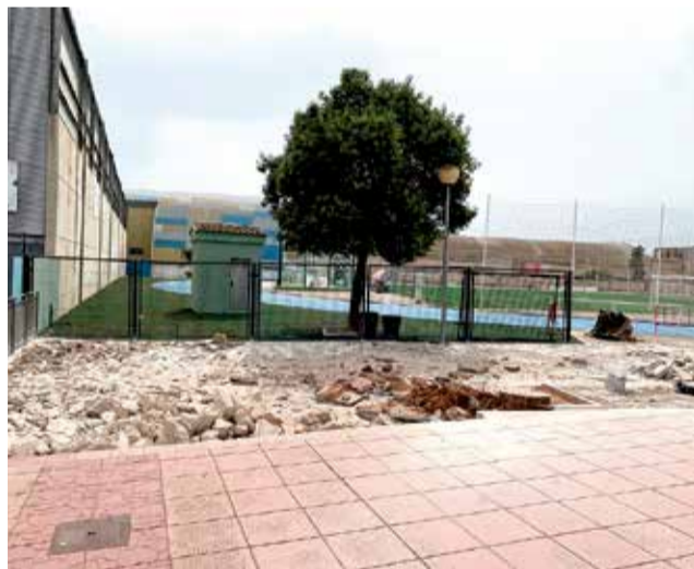
Pabellón municipal de Benifaió.