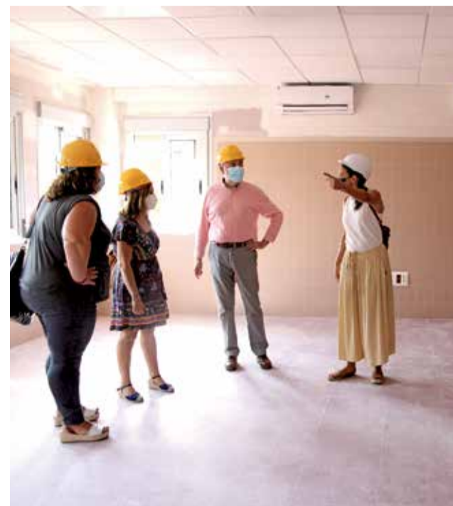
CEIP Les Comes. / EPDA

De moment, el principi de curs ha sigut amb les mateixes condicions en què va acabar el curs passat, i només acabar l'obra, l'ajuntament ajudarà al centre a desplaçar tot el material a les aules noves en temps no lectiu, perquè tan prompte com es puga, s'instal·le l'alumnat i els serveis corresponents.