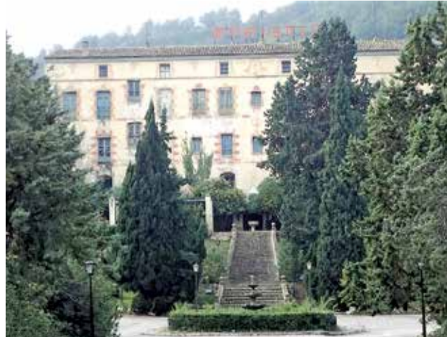
Monestir d'Aigües Vives de Carcaixent.

Esta fase conclourà amb la publicació de resultats que es donaran a conèixer el proper 28 d'octubre amb les propostes que s'inclouran en els comptes de la Generalitat per 2022.