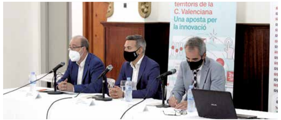
Jornada organitzada per REDIT.