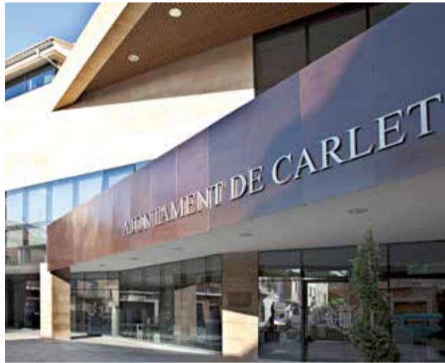
Ajuntament de Carlet. / EPDA

En paraules del regidor de Comerç Bernat Nogués: “La iniciativa planteja l'estudi tant dels reptes i dificultats que afronten les botigues i establiments com de les necessitats de consum de la població.” La iniciativa pretén facilitar que el comerç local de caràcter més tradicional siga capaç d'adaptar-se als