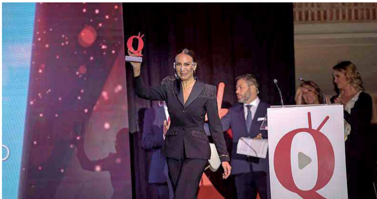
Un instante de la última edición de los premios en El Puig.

Los Premios Nacionales Aquí TV son una iniciativa del Grupo de Comunicación DE AQUÍ que iniciaron su andadura en 2017.