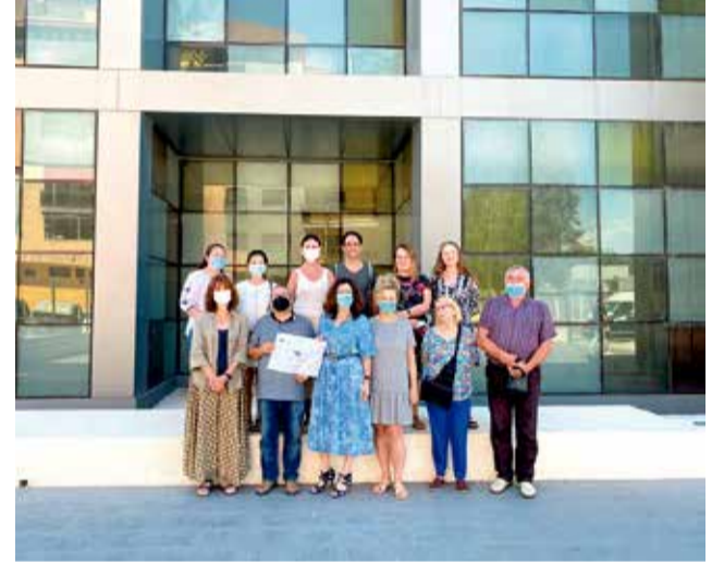
Trobada a la seu del Consorci.

En esta trobada també va participar l'empresa social Eco Inventame Coop. V., que ha mostrat els diferents projectes en els quals treballa per a fomentar una economia sostenible i circular, i també ha comptat amb la participació de l'Associació Valenciana pel Foment de l'Economia del Bé Comú, que ha exposat els projectes que s'impulsen des de l'associació i ha explicat com les empreses cada vegada estan més a favor de posar en marxa esta filosofia, com