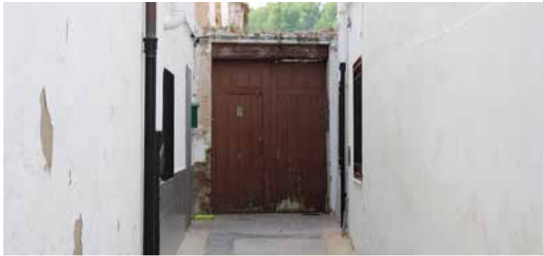
Carreró de l'edifici del nou centre de dia. / EPDA