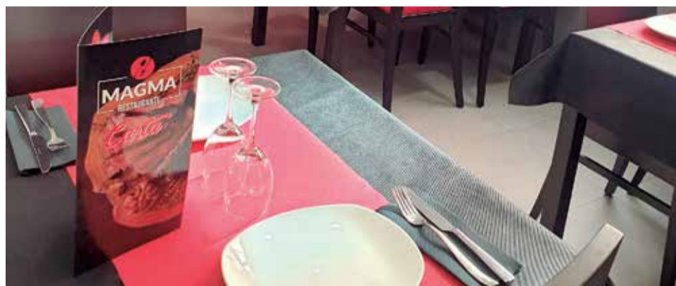
Interior de Magma Restaurante.

y un maestro de la cocina. Tiene una pasión culinaria innata que le llevó a comenzar con los fogones cuando tenía, tan sólo, 14 años. Al principio lo hacía ayudando a su madre cuando llegaba de entrenar de fútbol. Poco a poco, acabó cocinando casi mejor que ella. Años después, cocinó en la base aérea de Grando, en las Islas Canarias. Ese fue, precisamente, el detonante que convirtió su pasión en su forma de vida. Una pasión que, ahora, traslada a sus platos en Magma Restaurante.