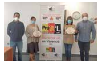
Pie de foto