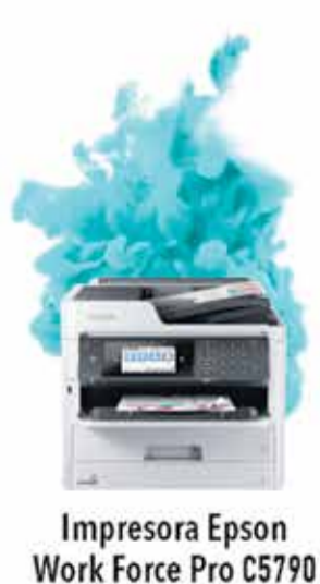
Impresora Epson Work Force Pro C5790

berolina AHORRA MÁS DEL 50% EN IMPRESIONES Y 90% DE ENERGÍA