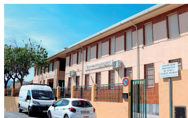
Conservatorio Profesional de Sagunt.