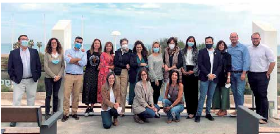
Participants en el I Encuentro de tècnics de la administració local.

En aquesta trobada, promoguda pel departament d'Innovació de l'Ajuntament de Canet, es donava cita tècnica de diferents administracions locals de les tres províncies, València, Castelló i Alacant, principalment interventors, secretaris i tècnics de contractació, que van analitzar qüestions de control intern i de fiscalització.