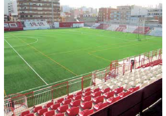
Campo de Fútbol del Acero.

La Real Federación Española de Fútbol ha sido parte en este proceso como acusación particular.