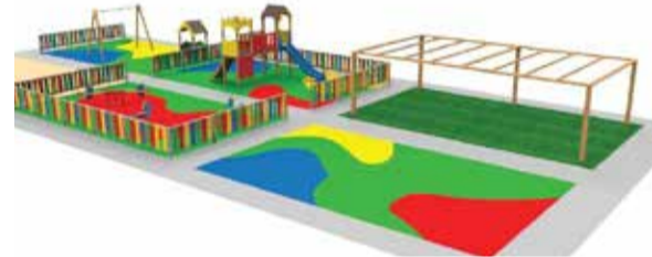
La renovació del parc de 'El Llavaner'.

La intervenció ha tingut l'objectiu de renovar al complet la zona del parc infantil per condicionar les zones a tots els xiquets i xiquetes. En primer lloc, van a canviar els paviments de cautxú amortidors de caigudes, amb els quals es garanteix una major