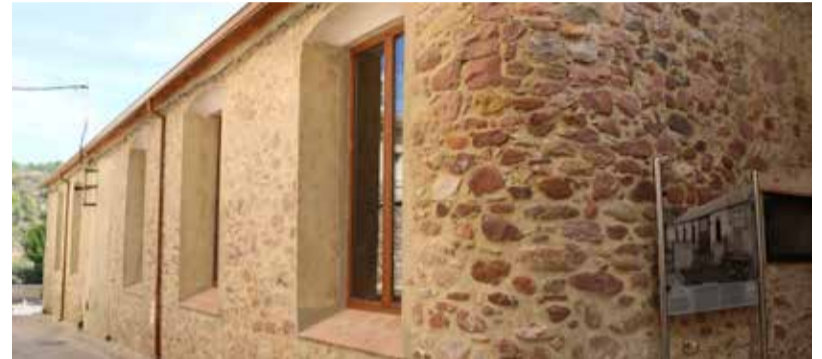
Reacondicionament de la cooperativa.

poble tan menut com Algar no estan gens malament", deia Lostado.