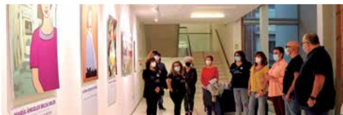
Inauguración de la exposición.

18 ilustraciones de mujeres valencianas pioneras en educación, las letras, las artes, la ciencia y la política. Mujeres que han sufrido la criptogenia de una sociedad y cultura que los ha intentado borrar tanto a ellas como a sus logros. De esto va la exposición 'Mujeres con mucha Historia' que Sagunto tiene el honor de acoger de la mano de la asociación Amigas Supervivientes y con la colaboración del área de Igualdad del Ayuntamiento de la ciudad.