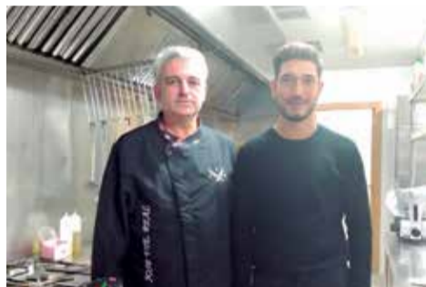
Chef y propietario de Magma.