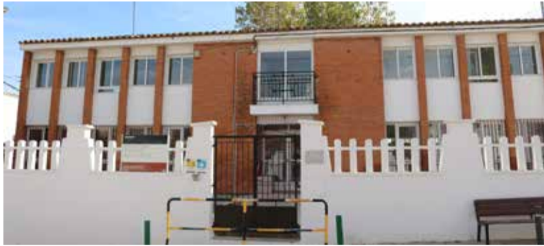
Façana actual del col·legi d'Algar.