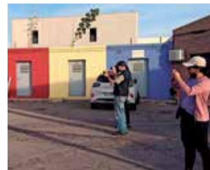
La visita.