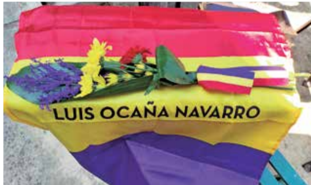
Restes exhumades de Lluís Ocaña.

Així, el passat dissabte, 23 d'octubre, Lluís Ocaña va tornar al seu poble per descansar on li pertoca, rebent el digne soterrament que no havia pogut tindre.