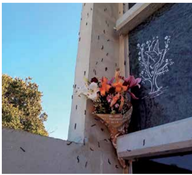
Gusanos junto a las tumbas del cementerio.

Según IP, a la plaga de los milpiés se le suma "el estado de abandono del cementerio y la maleza en la zona de las tumbas", algo que, según González, "ya se denunciaba en el mes de junio". "A pesar de que hubo muchísimas más quejas por esta situación, el equipo de gobierno ha puesto solución cinco meses después, cuando estamos a punto de llegar al día de todos los santos. Aún así, queremos mos-