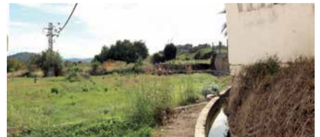
Terreny comprat de darrere del col·legi on s'ampliaran les instal·lacions actuals.

"La cultura sempre m'ha agradat molt, i com a alcalde d'Algar, estic molt orgullós de com este bé s'aprecia i està present a esta localitat", afirma Lostado. I