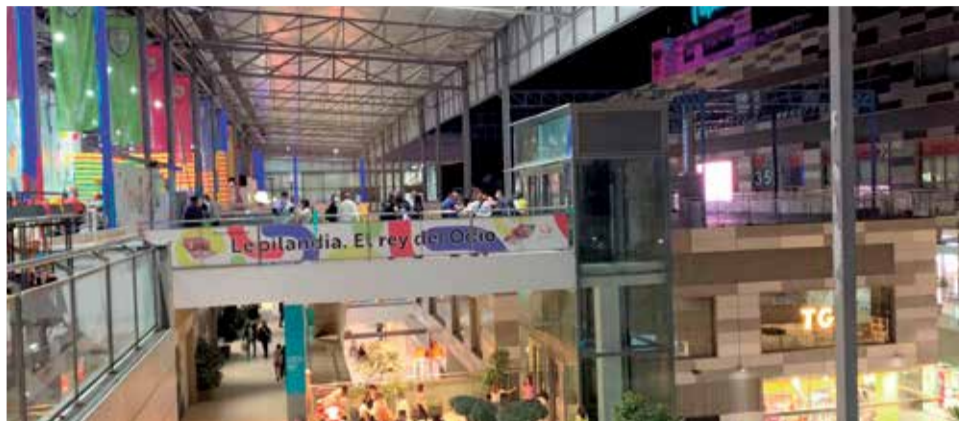
Interior de las instalaciones del Centro Comercial de L'Epicentre.

Una de las aperturas más próximas y deseadas es la del supermercado Economy Cash , que se situará en la planta -1 del Centro Comercial, y que ha sido destacada por la OCU como uno de los mejores supermercados calidad/precio, gracias a sus productos de calidad, para todos los públicos y con los mejores precios del mercado. La cadena valencia-