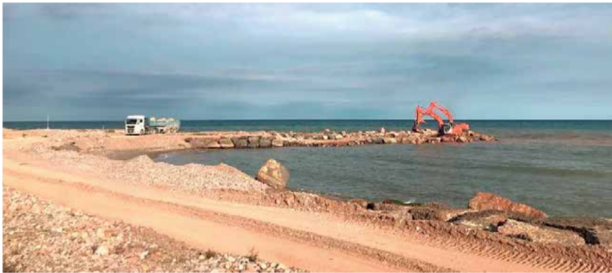
Un camión descarga piedras de la cantera en las obras de los espigones de Almenara.

Desde EUPV aseguran haber llevado a cabo un seguimiento de los vehículos que están saliendo de la cantera de Salt del Llop, como ya lo hizo a principios de mes Compromís, "evidenciado que su destino es la playa de Casablanca en Almenara, lugar donde está siendo depositado el material para la construcción de los espigones", como así lo explican en un comunicado. Por ello, EUPV aportará las pruebas oportunas al Ayuntamiento por si fueran útiles para los técnicos municipales.