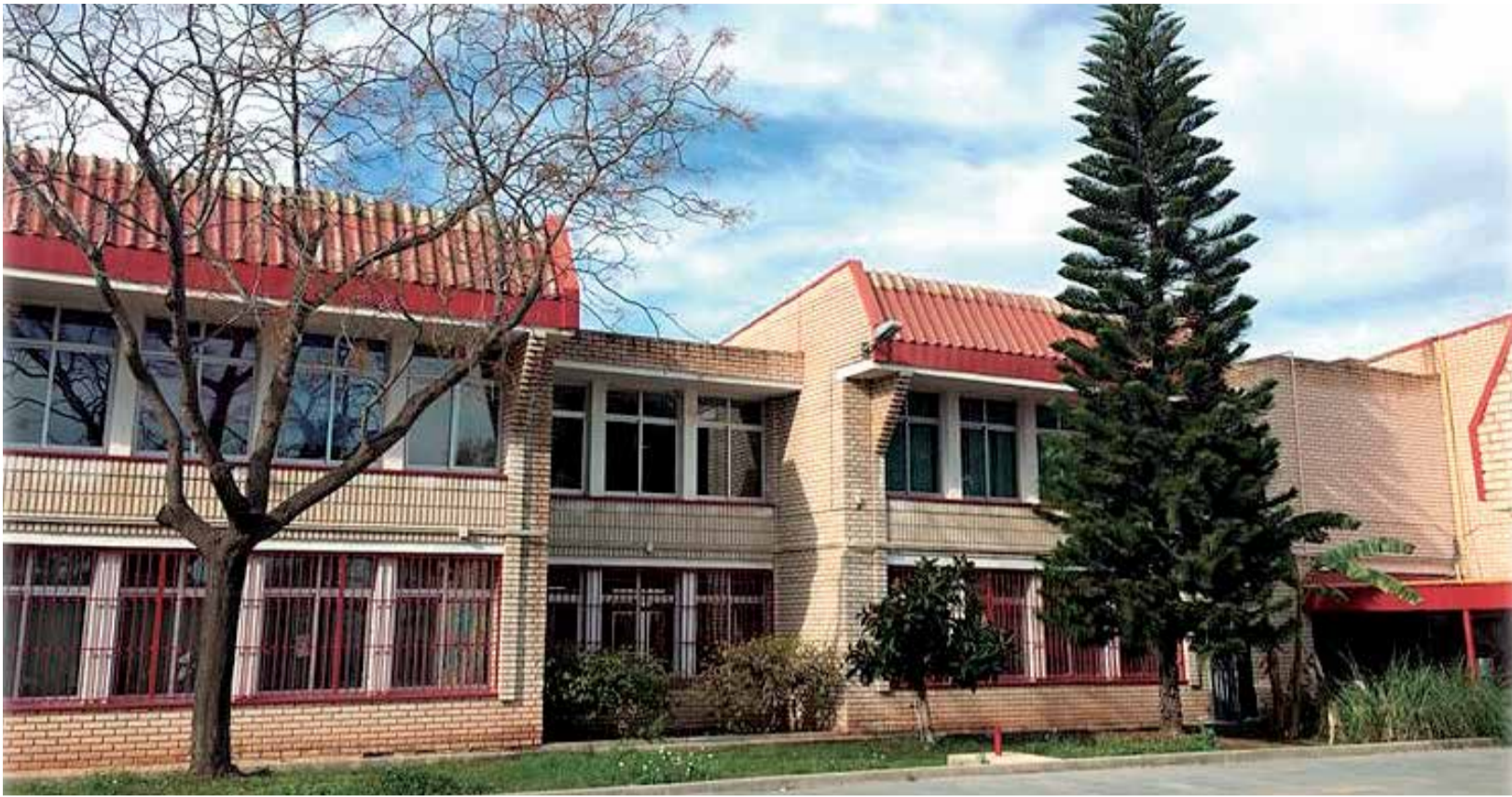
Fachada de las instalaciones del CEIP Maestro Tarrazona, en Port de Sagunt.

LOS PADRES DEL ALUMNADO ESCRIBEN UNA CARTA DE QUEJA ANTE UN ESPECIALISTA DE BAJA QUE NO HA SIDO SUSTITUIDO