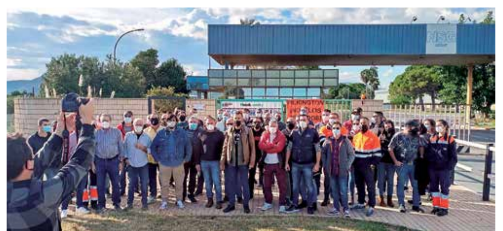
Trabajadores y sindicatos protestan en la tarde del 4 de noviembre.

Los sindicatos informan, además, de que mantendrán una reunión con el presidente de la Generalitat, Ximo Puig, para la próxima semana, que fue comprometida con el apoyo de la delegada del Gobierno, Gloria Calero, la delegada del Gobierno.