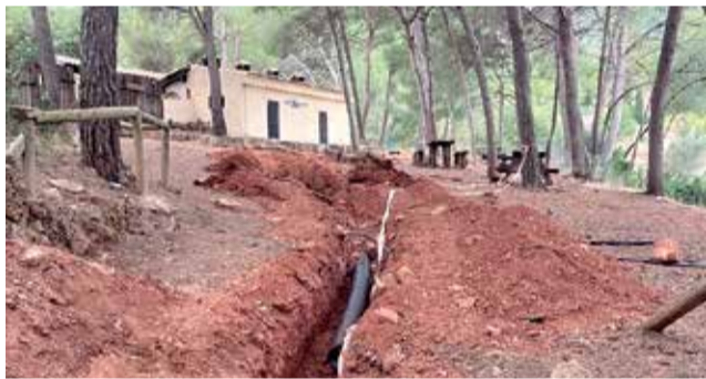
L'inici de les obres a la zona de Sant Esperit.