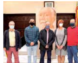
Presentación. / EPDA