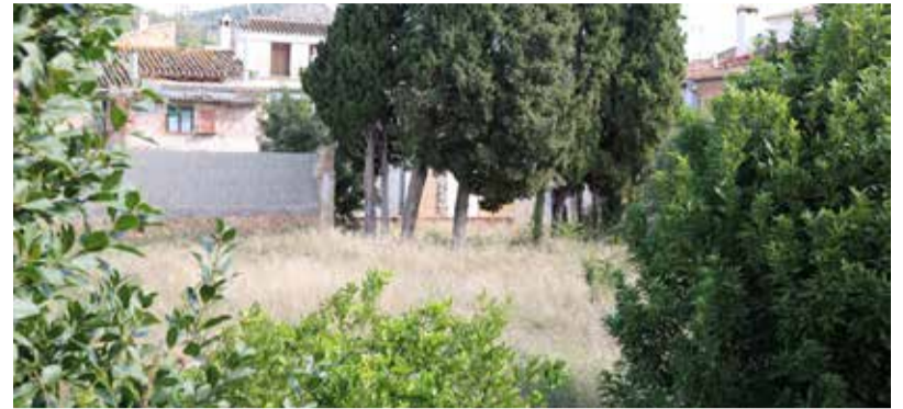
Terreny adquirit per als jardins del centre de dia.