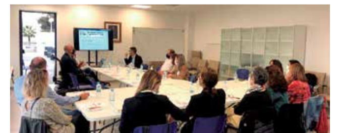
Instantànea de la jornada.

Un altre dels temes que s'abordava en la trobada era la valoració de l'acompliment del càrrec o del lloc de treball dels funcionaris o el personal labo-